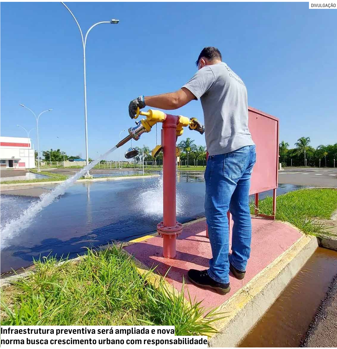
Infraestrutura preventiva será ampliada e nova norma busca crescimento urbano com responsabilidade

De acordo com o texto aprovado, novas construções, ampliações, reformas ou mudanças de uso só receberão autorização após a apresentação de um projeto técnico de prevenção a incêndios, aprovado pelo Corpo de Bombeiros. A emissão do Habite-se e do Alvará de Utilização também ficará condicionada ao Auto de Vistoria do Corpo de Bombeiros (AVCB), garantindo conformidade com normas de segurança vigentes. O projeto determina que proprietários de edificações nessa metragem deverão cumprir uma das seguintes exigências: fornecer um hidrante de coluna com conexões padrão ABNT; doar equipamentos e materiais ao Corpo de Bombeiros ou à Defesa Civil Municipal; contratar serviços que auxiliem essas instituições; ou depositar o equivalente a 150 UFESPs, cerca de R$ 5,5 mil, no Fundo Municipal de Proteção e Defesa Civil.