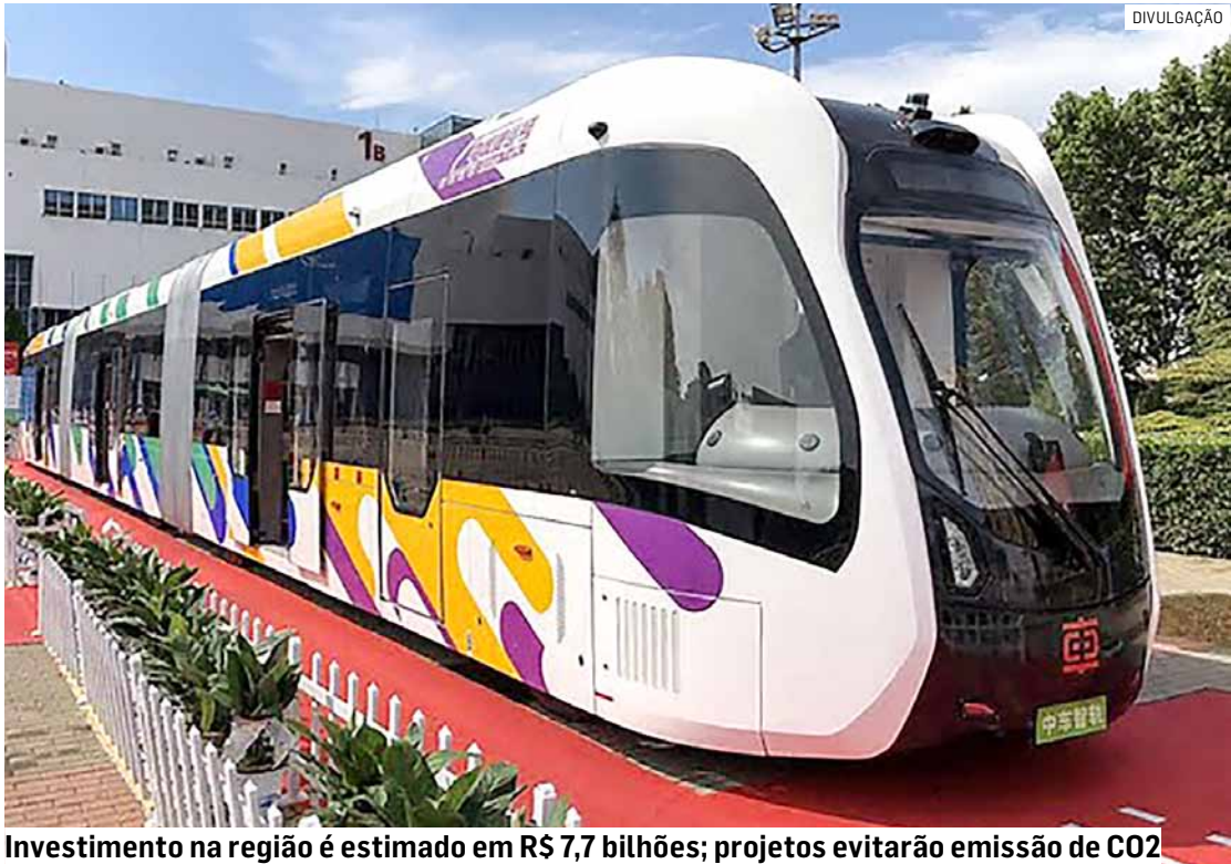
Investimento na região é estimado em R$ 7,7 bilhões; projetos evitarão emissão de CO2

Em Campinas, a implementação dos projetos resultará na redução estimada de cerca de 180 óbitos em acidentes de trânsito até 2054. E, também, evitará a emissão de 51 mil de toneladas de CO2 por ano. Outro benefício é a redução do custo operacional por viagem, decorrente da maior utilização dos sistemas de média e alta ca-