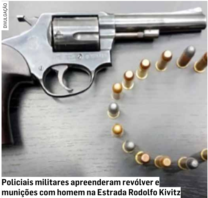
Policiais militares apreenderam revólver e munições com homem na Estrada Rodolfo Kivitz

Um homem foi preso por posse ilegal de arma de fogo, na noite desta quarta-feira (29), na Estrada Municipal Rodolfo Kivitz, em Nova Odessa. A prisão ocorreu após a Polícia Militar receber informações de que um indivíduo estaria armado em uma residência na região. Durante o patrulhamento, os policiais avistaram um homem que, ao perceber a aproximação da viatura, entrou rapidamente em uma casa. Diante da atitude suspeita, a equipe desembarcou e chamou o morador, que prontamente atendeu aos policiais. O homem permaneceu preso.