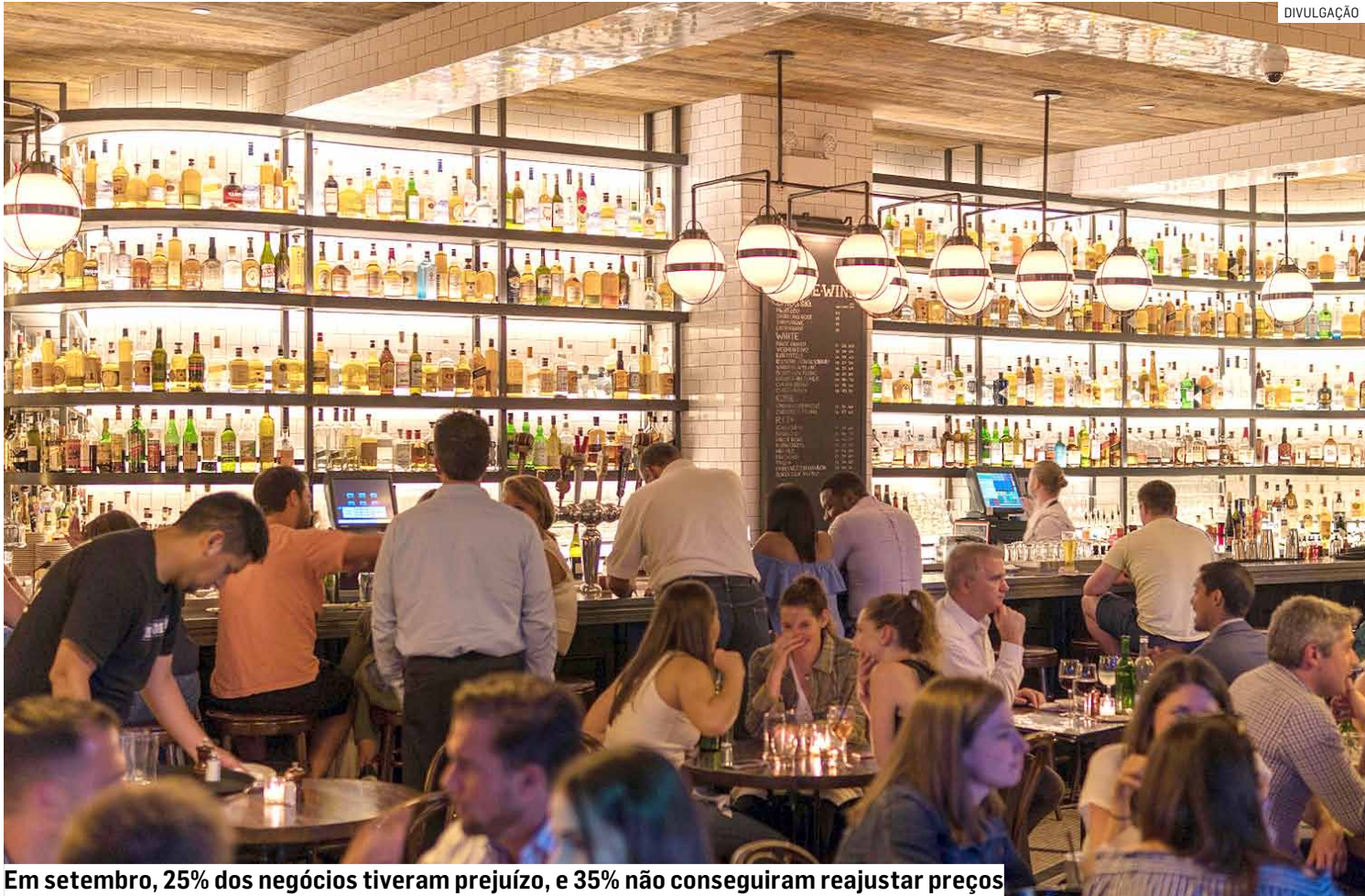
Em setembro, 25% dos negócios tiveram prejuízo, e 35% não conseguiram reajustar preços

A pesquisa da Abrasel, realizada com empresários do setor na Região Metropolitana de Campinas (RMC), entre os dias 13 e 21 de outubro, aponta também que na comparação com o mesmo período do ano passado, 11% esperam estabilidade e 15% projetam queda – 4% dos empresários que respon-