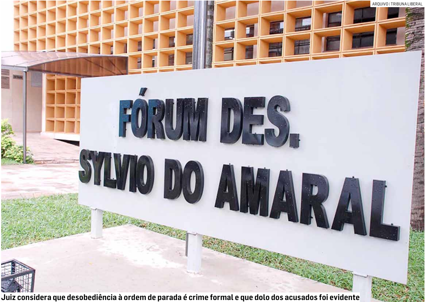
Juiz considera que desobediência à ordem de parada é crime formal e que dolo dos acusados foi evidente

De acordo com o processo, os acusados foram reconhecidos como autores do roubo de uma motocicleta sem placa identificadora. Dias após o crime, durante patrulhamento da Polícia Militar, ambos desobedeceram ordem legal de parada, iniciando fuga em alta velocidade pelas ruas de Americana e Nova Odessa, trafegando pela contramão, subindo canteiros e colocando em risco pedestres e policiais.