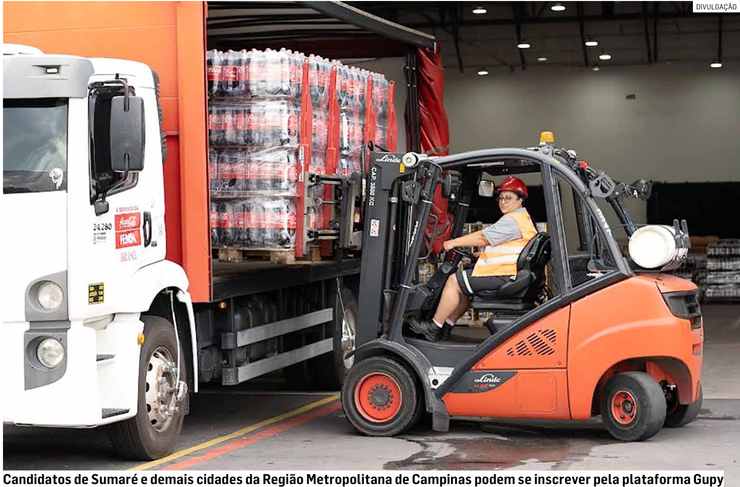
Candidatos de Sumaré e demais cidades da Região Metropolitana de Campinas podem se inscrever pela plataforma Gupy

O Plano Verão é uma das principais estratégias da companhia para garantir a qualidade e a eficiência