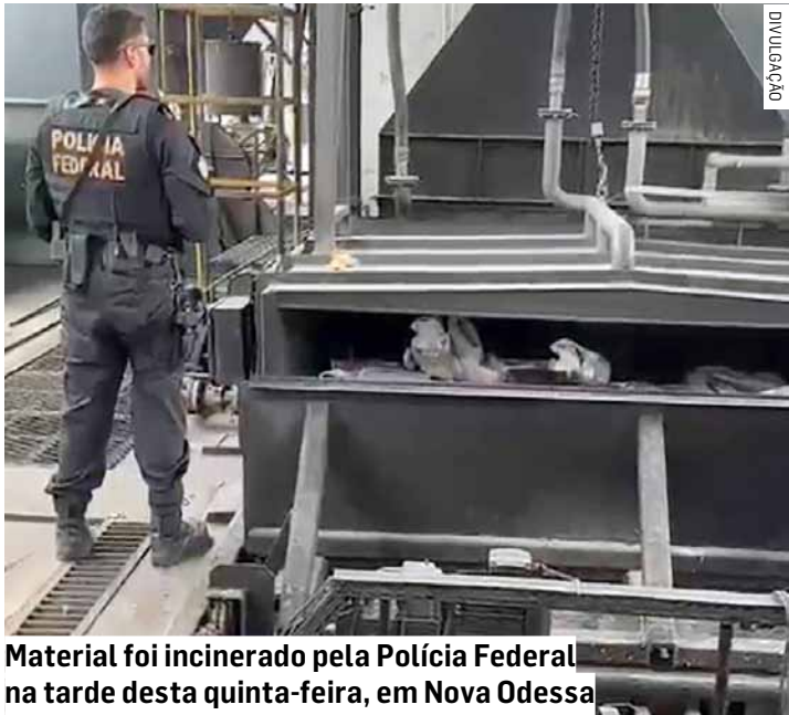
Material foi incinerado pela Polícia Federal na tarde desta quinta-feira, em Nova Odessa

A Polícia Federal incinerou, na tarde desta quinta-feira (30), 4.558 quilos de drogas e substâncias ilícitas em Nova Odessa. Entre o material destruído estavam cocaína, maconha, haxixe, MDMA, anabolizantes e medicamentos apreendidos ao longo de investigações contra o tráfico. A ação integra o plano estratégico nacional de repressão ao crime organizado. Segundo a PF, o volume destruído representa prejuízo financeiro milionário às organizações criminosas.