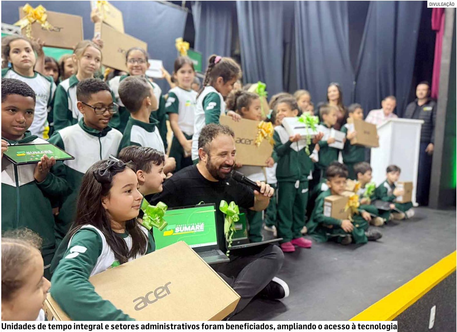
Unidades de tempo integral e setores administrativos foram beneficiados, ampliando o acesso à tecnologia

A entrega representa o maior investimento em tecnologia educacional da história de Sumaré, beneficiando todas as escolas de tempo integral, além dos departamentos internos da Secretaria de Educação. Os novos equipamentos vão fortalecer o trabalho pedagógico, otimizar a gestão escolar e oferecer melhores condições de ensino e aprendizagem aos alunos. O prefeito Henrique do Paraíso (Republicanos)