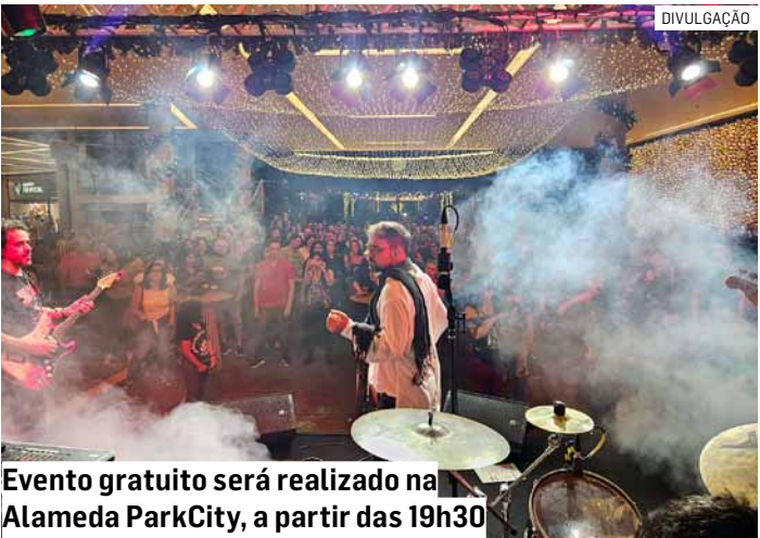
Evento gratuito será realizado na Alameda ParkCity, a partir das 19h30