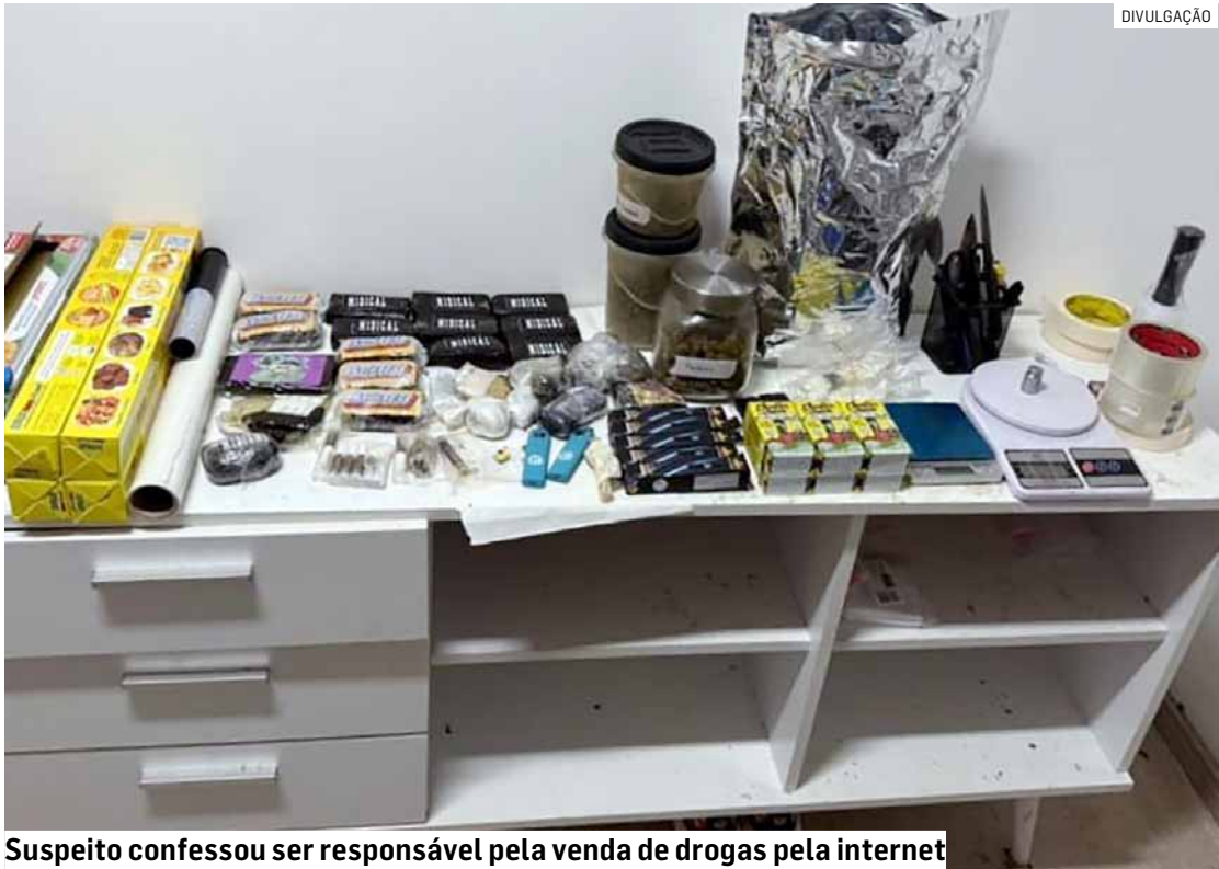
Suspeito confessou ser responsável pela venda de drogas pela internet

De acordo com a corporação, a equipe recebeu informações sobre uma quadrilha que comercializava entorpecentes de forma online, realizando pagamentos em espécie e via Pix, e