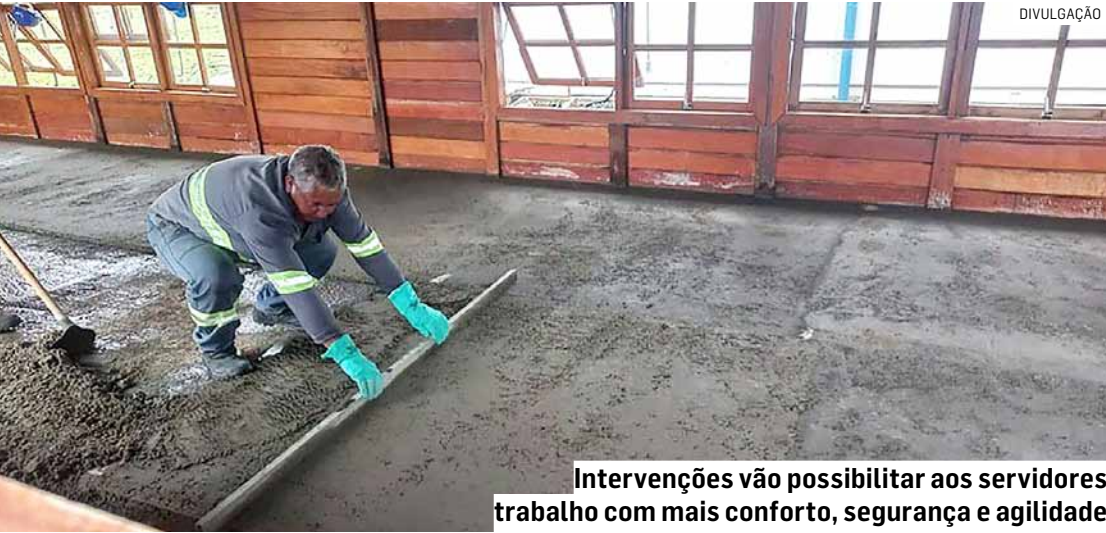
Intervenções vão possibilitar aos servidores trabalho com mais conforto, segurança e agilidade

Caberá às instituições de segurança avaliar qual alternativa é mais adequada, considerando as necessidades específicas de cada região da cidade. A Coden Ambiental será responsável por receber, instalar e manter os hidrantes após vistoria do Corpo de Bombeiros, garantindo funcionamento adequado. Somente a Coden, a Defesa Civil Municipal e o Corpo de Bombeiros poderão autorizar o uso dos hidrantes instalados, assegurando fiscalização e controle. O texto prevê sanções para quem descumprir as determinações, como advertência, suspensão temporária das atividades e até interdição do imóvel.