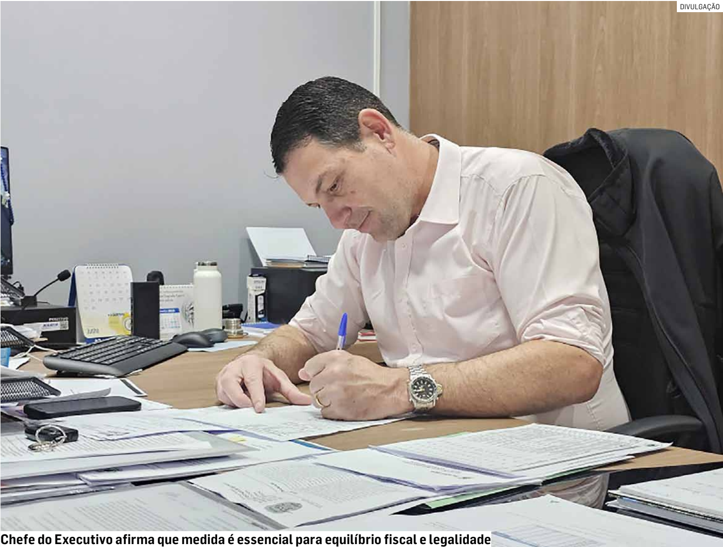
Chefe do Executivo afirma que medida é essencial para equilíbrio fiscal e legalidade

Os acordos deverão ser firmados até 31 de agosto de 2026, condicionados à adesão ao Programa de Regularidade Previdenciária e à adequação do RPPS às regras federais, incluindo o regime de previdência complementar. O pagamento das parcelas será garantido pela retenção automática de valores do Fundo de Participação dos Municípios (FPM).