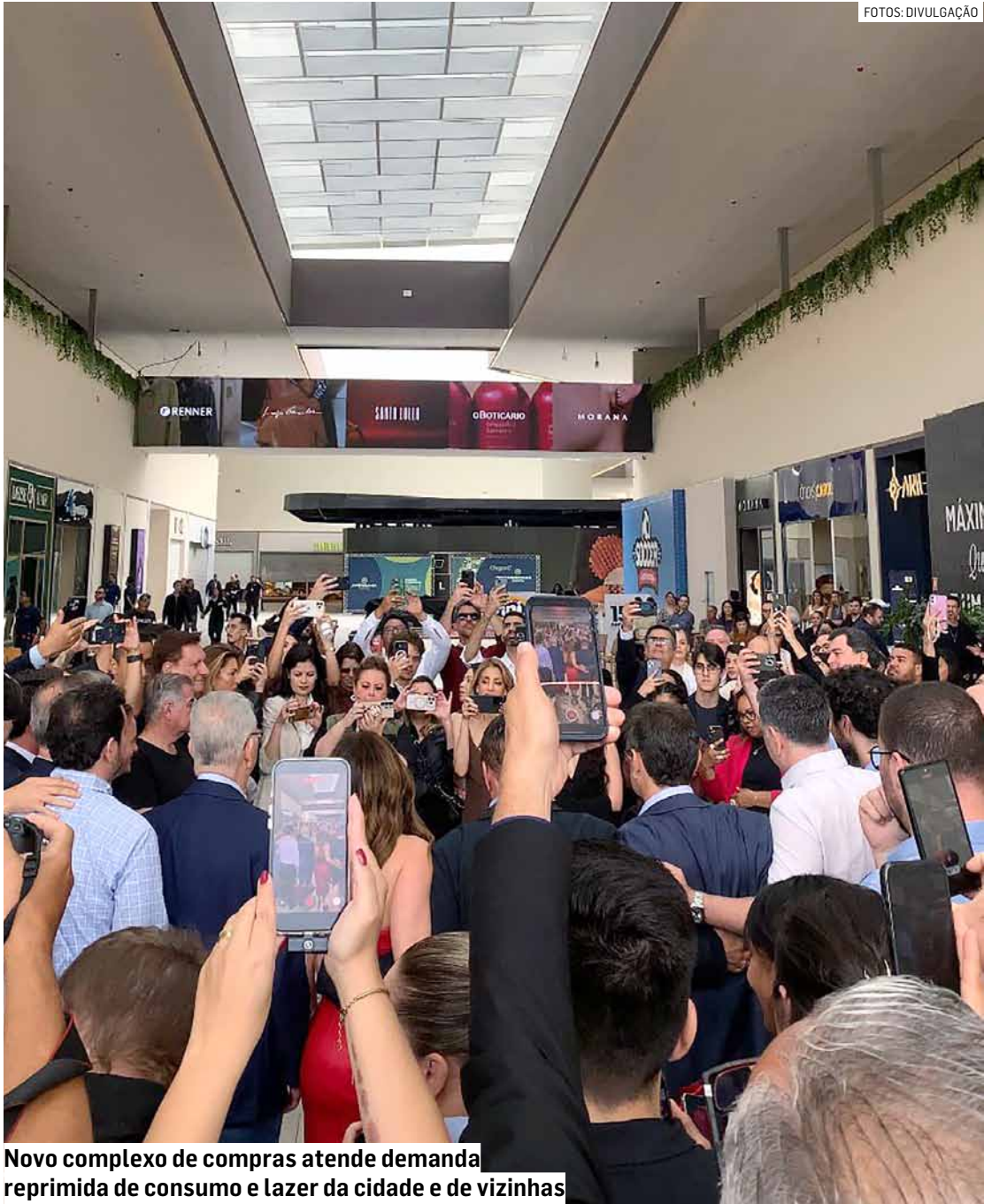
Novo complexo de compras atende demanda reprimida de consumo e lazer da cidade e de vizinhas

Ele explicou que a estratégia do shopping é se tornar ponto turístico e de lazer regional. “Só de sentir o projeto, que é amplo, diferente, o projeto tem open mall, e é parecido com shoppings americanos, é só vendo, aqui vai proporcionar muitos encontros de famílias, amigos, e é o que Americana precisava, um local onde se pode usufruir de uma boa praça de alimentação. A maioria dos restaurantes na cidade fecha às 14h30, aqui vai ter restaurantes abertos o dia inteiro, de segunda-feira, o que Americana não tinha, estamos proporcionando muita coisa que vem da capital pra cá, aqui é uma cidade grande, tem que cheirar grande e ser um marco no interior”, disse.