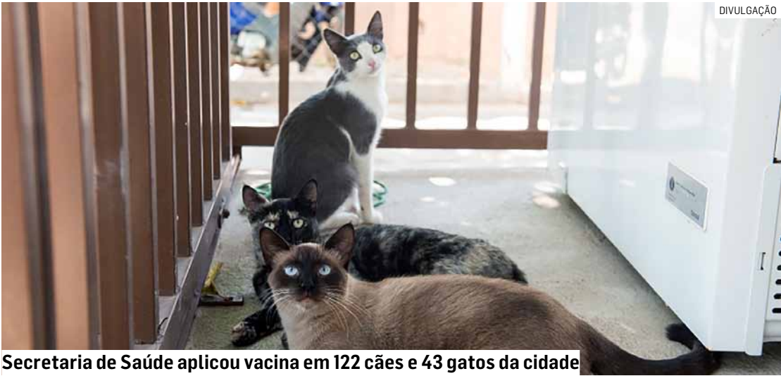
Secretaria de Saúde aplicou vacina em 122 cães e 43 gatos da cidade

A prefeitura destaca que a imunização é essencial para a prevenção da raiva, que é uma doença grave e pode afetar tanto os animais quanto os seres humanos.