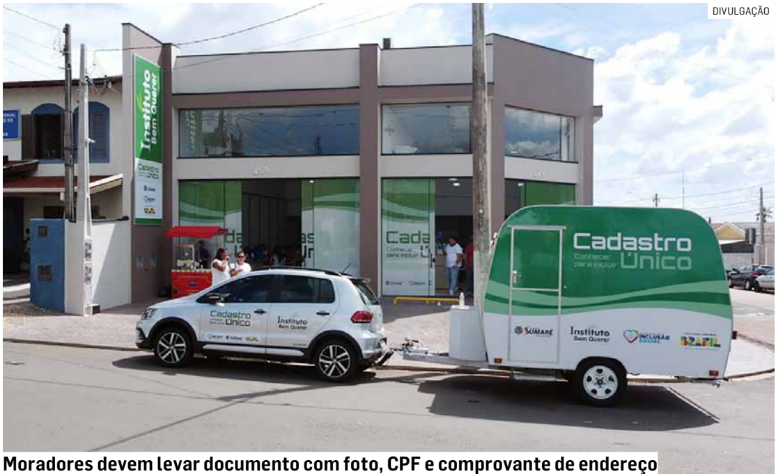
Moradores devem levar documento com foto, CPF e comprovante de endereço

Os moradores devem levar documento com foto, CPF, comprovante de endereço e documentos de todos os integrantes da família no dia do atendimento.