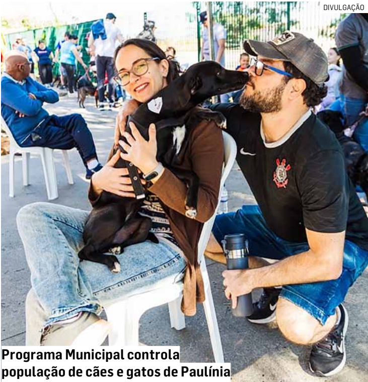
Programa Municipal controla população de cães e gatos de Paulínia

DOCUMENTOS NECESSÁRIOS ✓ Cópia do comprovante de endereço ✓ Documento de identidade (RG e CPF) ✓ Pré-requisitos ✓ Ter 18 anos ou mais ✓ Residir em Paulínia ✓ Ter disponibilidade para permanecer no local durante todo o período do procedimento ✓ Para cães da raça pitbull é obrigatório o uso de focinheira