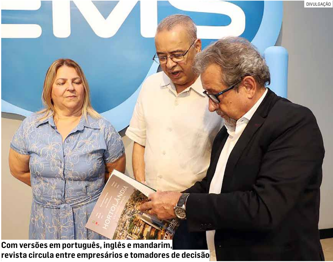
Com versões em português, inglês e mandarim, revista circula entre empresários e tomadores de decisão

A City’s Book Hortolândia é escrita em português e traduzida para o inglês e mandarim. A distribuição é direcionada às áreas governamentais, econômicas e culturais, para empresá-