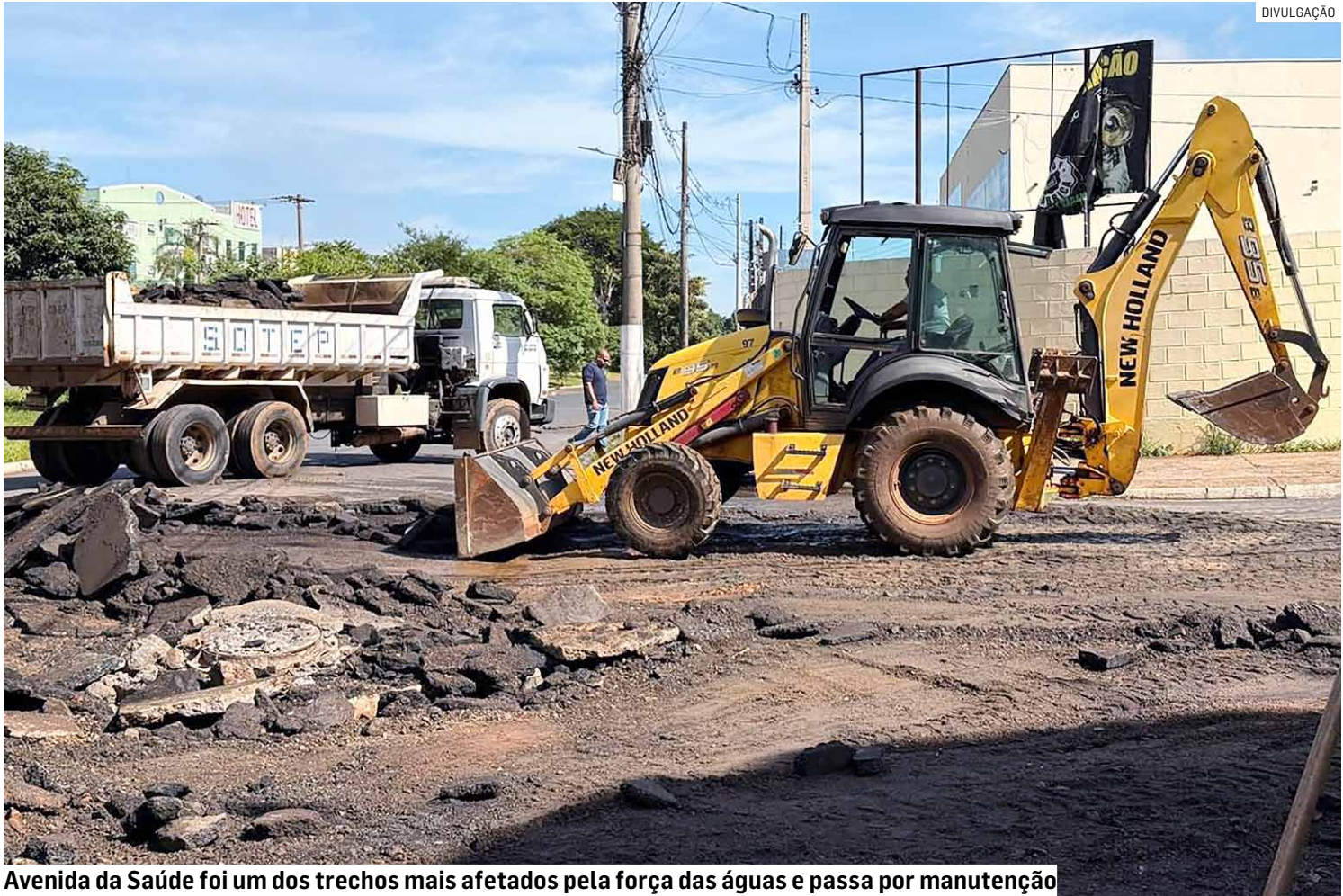
Avenida da Saúde foi um dos trechos mais afetados pela força das águas e passa por manutenção

Segundo a Defesa Civil de Americana, a cidade registrou 62 milímetros de chuva em aproximadamente 1 hora e 20 minutos,