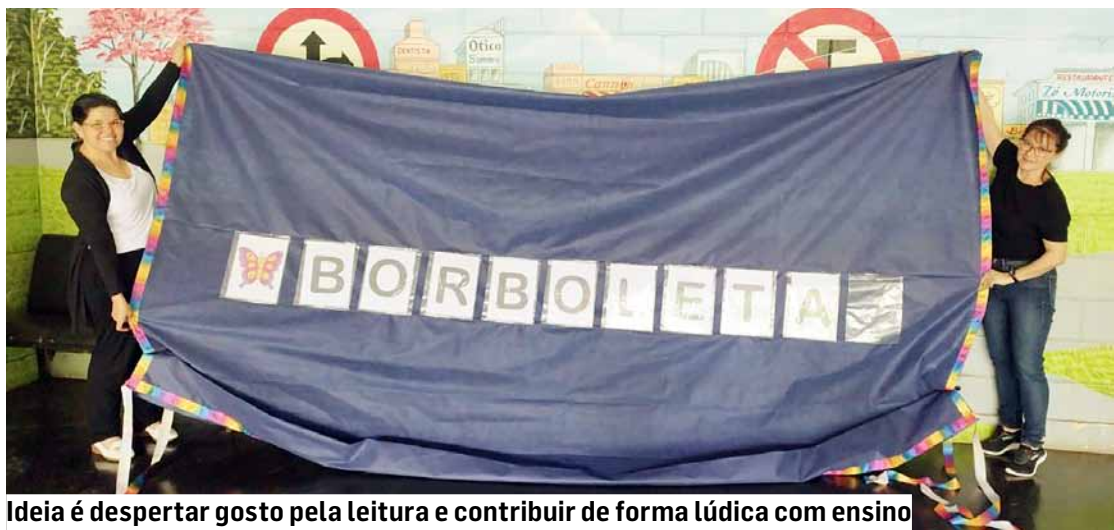
Ideia é despertar gosto pela leitura e contribuir de forma lúdica com ensino

Voltado a estudantes do 1º ao 5º ano do Ensino Fundamental, o projeto de Leitura, Escrita e Alfabetização tem como principal objetivo despertar o gosto