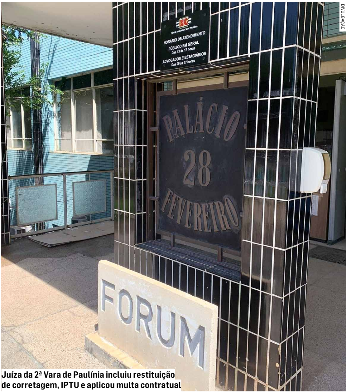
Juíza da 2ª Vara de Paulínia incluiu restituição de corretagem, IPTU e aplicou multa contratual

Juíza reconhece atraso de mais de um ano na finalização de loteamento, aponta descumprimento contratual e falhas na liberação; loteadora deverá ressarcir integralmente dinheiro pago pelos compradores, que supera casa dos R$ 139 mil