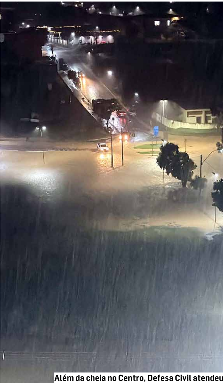
Além da cheia no Centro, Defesa Civil atendeu quedas de árvores e de muro; não houve vítimas

De acordo com a prefeitura, somente em cerca de 40 minutos choveu quase o equivalente ao esperado para vários dias, com registro de 78,8 mm nesse período inicial, além de rajadas de vento e intensa atividade elétrica. Antes do pico da chuva, a Defesa Civil municipal emitiu alerta preventivo às 19h18, se-