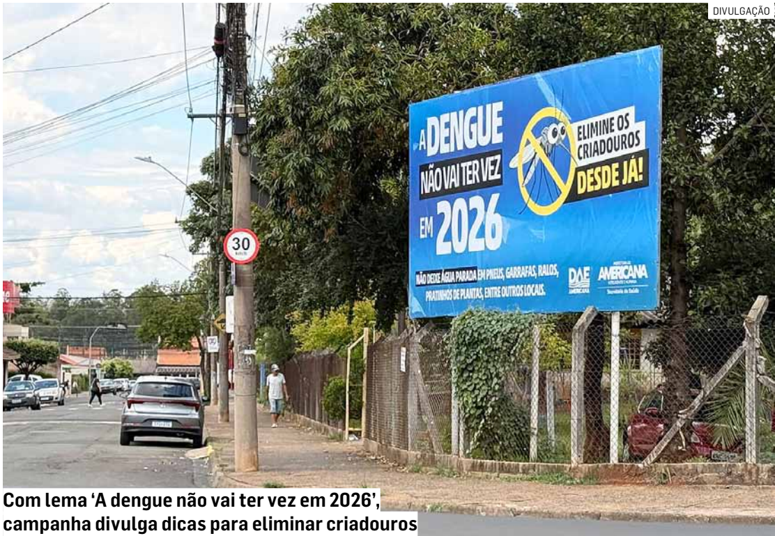
Com lema ‘A dengue não vai ter vez em 2026’, campanha divulga dicas para eliminar criadouros

Com o lema “A dengue não vai ter vez em 2026”, a campanha busca disseminar as dicas práticas para eliminação de possíveis criadouros do mosquito, bem como os sintomas da dengue e como proceder em caso de suspeita da doença. As informações estão sendo disseminadas por meio de outdoors, displays e totens de LED espalhados pelas ruas da cidade, além da distribuição de panfletos educativos, conteúdos nas redes sociais e divulgação em rádios, TVs, portais e mídias impressas. “Mesmo com a redução expressiva dos casos neste início de ano, a dengue continua exigindo atenção máxima. Nosso foco é agir antes do pico da doença, reforçando a prevenção e