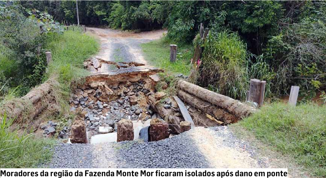
Moradores da região da Fazenda Monte Mor ficaram isolados após dano em ponte