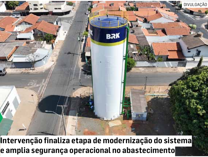
Intervenção finaliza etapa de modernização do sistema e amplia segurança operacional no abastecimento