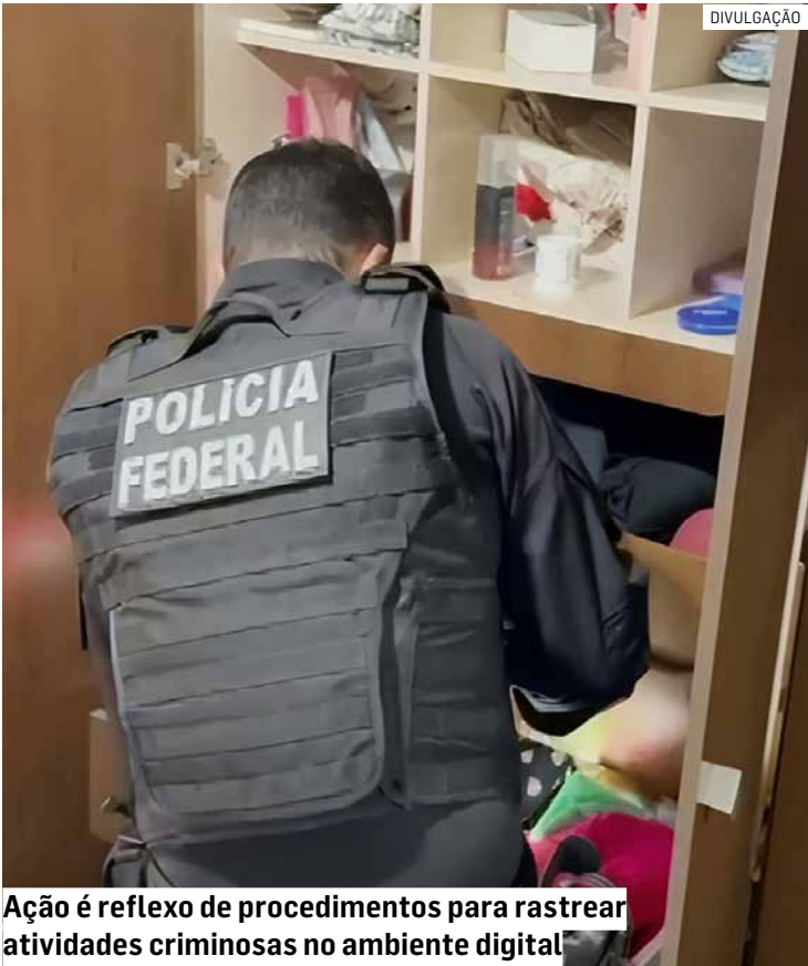
Ação é reflexo de procedimentos para rastrear atividades criminosas no ambiente digital

A Polícia Federal também reforçou a importância da atenção de pais e responsáveis em relação ao uso da internet por crianças e adolescentes. Segundo a orientação, o diálogo constante, o acompanhamento e o monitoramento das atividades online são medidas fundamentais para reduzir riscos e prevenir abusos no meio digital.