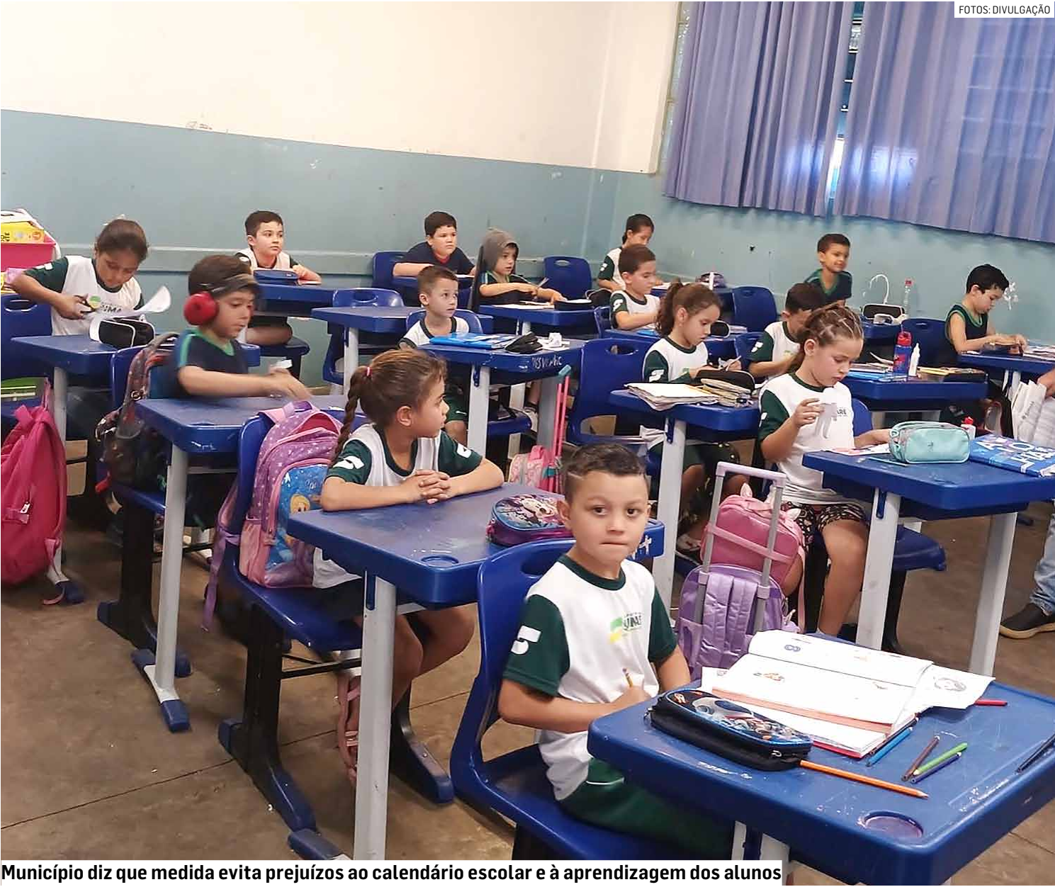
Município diz que medida evita prejuízos ao calendário escolar e à aprendizagem dos alunos

Convocação de temporários publicada no Diário Oficial visa reforçar quadro docente da rede municipal e contempla cinco áreas do conhecimento; todas as contratações garantem cobertura de licenças e afastamentos nas escolas