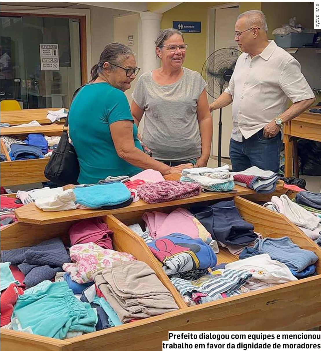
Prefeito dialogou com equipes e mencionou trabalho em favor da dignidade de moradores