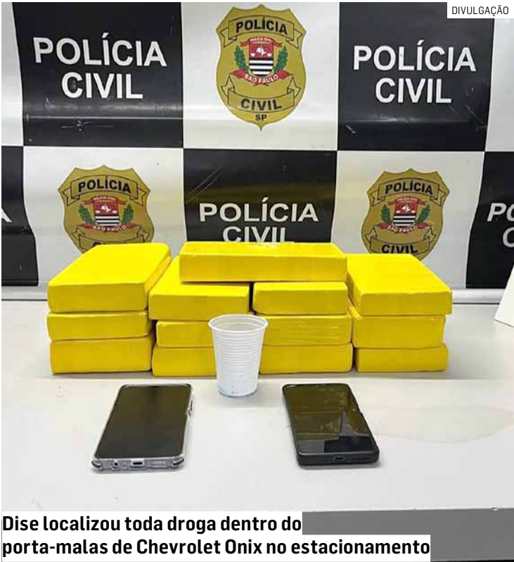
Dise localizou toda droga dentro do porta-malas de Chevrolet Onix no estacionamento

Após a conclusão dos procedimentos legais, o indiciado foi encaminhado à Cadeia Pública de Sumaré, onde permanece à disposição da Justiça.