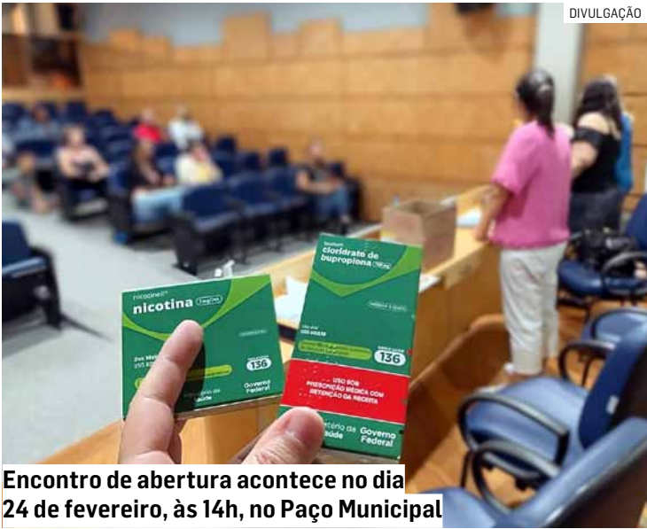
Encontro de abertura acontece no dia 24 de fevereiro, às 14h, no Paço Municipal

Os interessados devem deixar nome e telefone para contato na recepção de qualquer uma das Unida-