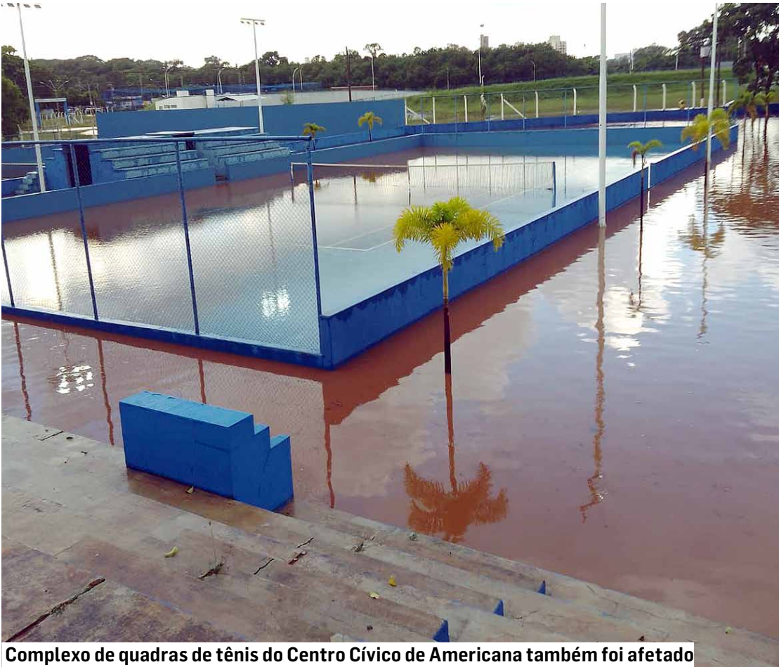
Complexo de quadras de tênis do Centro Cívico de Americana também foi afetado

A Defesa Civil informou que o alto volume de chuva em curto intervalo de tempo provocou alagamentos em diversos pontos da cidade e mobilizou equipes da prefeitura para atendimento às famílias atingidas.