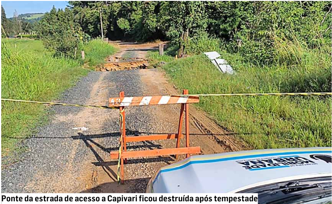
Ponte da estrada de acesso a Capivari ficou destruída após tempestade

A prefeitura informou que o Rio Capivari segue sob monitoramento e orientou que ocorrências sejam comunicadas exclusivamente pelos canais oficiais — Defesa Civil (199) e GCM (153) — para garantir rapidez no atendimento.