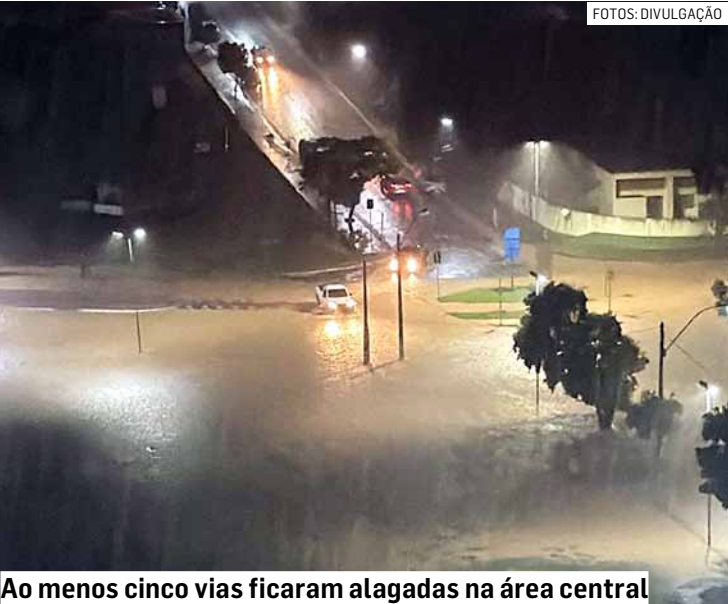
Ao menos cinco vias ficaram alagadas na área central

Tempestade totalizou 86 mm em menos de uma hora e colocou cidade em estado de atenção; área central e bairros residenciais tiveram ruas alagadas; ponte de acesso à região rural foi comprometida, diz governo