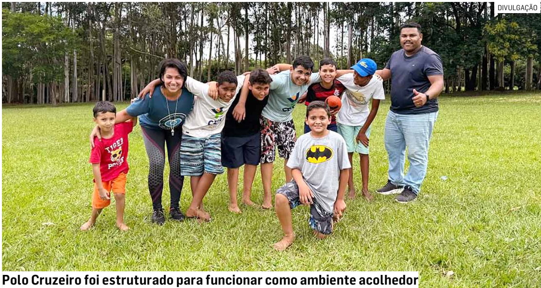
Polo Cruzeiro foi estruturado para funcionar como ambiente acolhedor

A implantação do polo, segundo a pasta, repre-