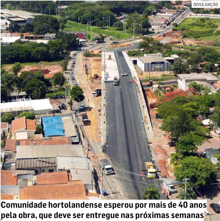
Comunidade hortolandense esperou por mais de 40 anos pela obra, que deve ser entregue nas próximas semanas

As obras do viaduto da Vila Real, em Hortolândia, avançam para sua fase definitiva. Nesta semana, a pavimentação começou a tomar forma sobre a nova estrutura que, em breve, colocará fim à antiga e arriscada passagem sobre os trilhos da ferrovia. A ligação entre as avenidas São Francisco de Assis e Santana, sonhada por gerações, está prestes a deixar de ser apenas reivindicação para se tornar realidade concreta — um novo horizonte erguido em aço, concreto e perseverança popular. Para o prefeito Zezé Gomes (Republicanos), a proximidade da entrega tem um significado que ultrapassa o caráter técnico da obra. “Essa conquista é da comunidade hortolandense, que lutou, cobrou e esperou por mais de 40 anos. É um presente histórico para a Vila Real e para toda a cidade”, afirmou o prefeito. O viaduto, segundo a Rumo Logística, empresa responsável pela construção, deve ser entregue nas próximas semanas. Para Zezé, o novo dispositivo viário não é apenas uma obra. É um capítulo que se fecha — e outro, maior, que se abre. “É a ponte entre o passado e o futuro. Entre o que fo-