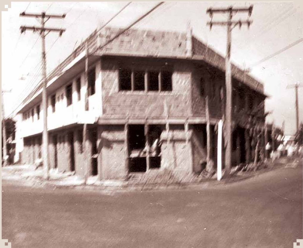
Foto um pouco distorcida da Escola SUMTEC, criada e dirigida pela professora Hedy Madalena Bocchi Mazer. Era uma escola particular, de nível médio com cursos técnicos, localizada na Vila Menuzzo, confluência da Avenida 7 de Setembro com Rua Tranquillo Menuzzo.