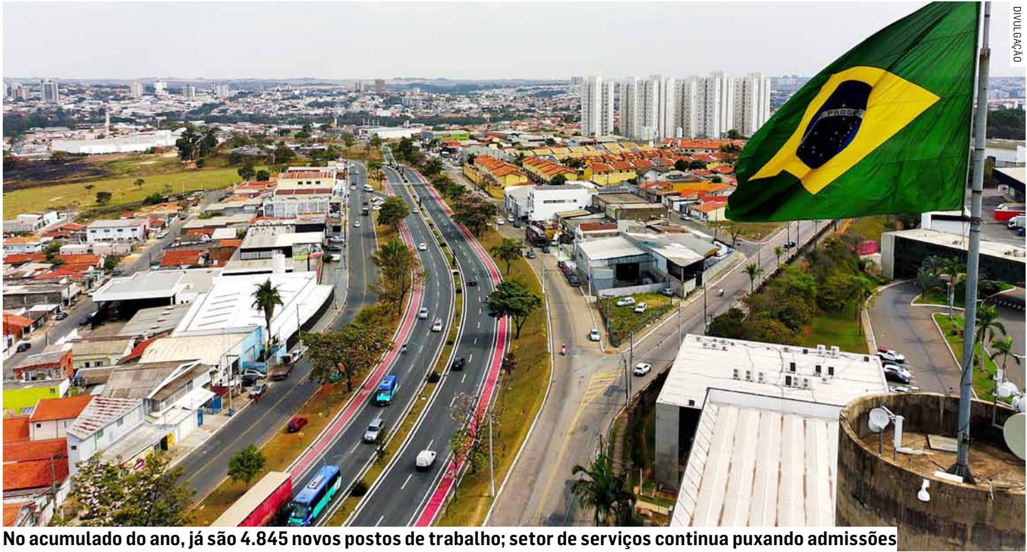
No acumulado do ano, já são 4.845 novos postos de trabalho; setor de serviços continua puxando admissões

A análise por setores indica que o segmento de serviços concentrou a maior parte das admissões no período, com 3.403 vagas, representando 70,24% do total.