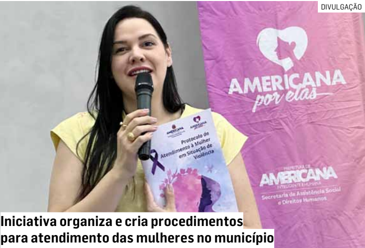
Iniciativa organiza e cria procedimentos para atendimento das mulheres no município

A Prefeitura de Americana lançou o Protocolo de Atendimento para Mulheres em Situação de Violência nesta sexta-feira (28), no Jardim São Roque. A iniciativa organiza e cria procedimentos para aprimorar e qualificar o atendimento das mulheres no município. “Desde o início da nossa gestão, Americana tem voltado os olhos para este trabalho, atuando com firmeza e prevenção no enfrentamento da violência contra a mulher, por meio do programa Americana