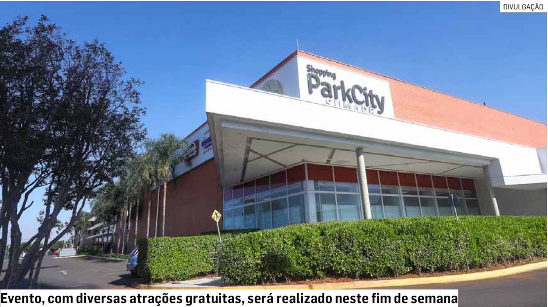
Evento, com diversas atrações gratuitas, será realizado neste fim de semana

Da Redação • SUMARÉ tribunaliberal@tribunaliberal.com.br