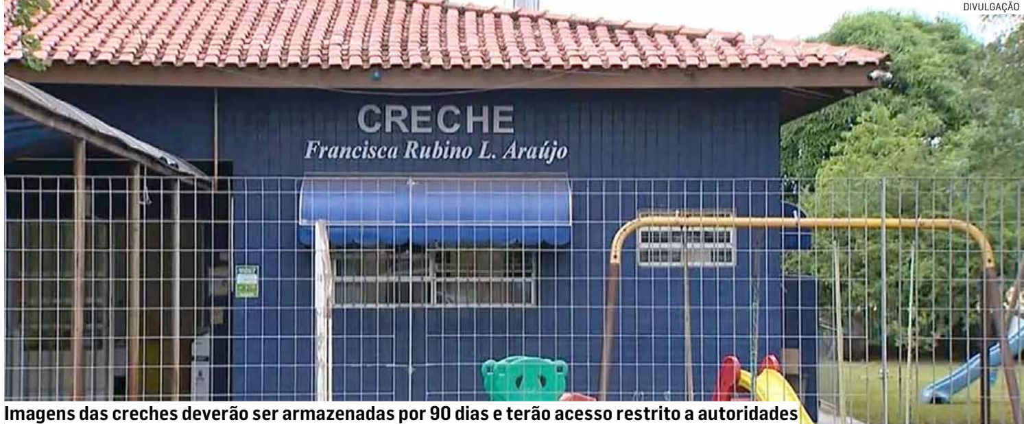
Imagens das creches deverão ser armazenadas por 90 dias e terão acesso restrito a autoridades

A nova lei estabelece que todas as dependências internas e externas utilizadas por crianças, servidores e demais frequentado-