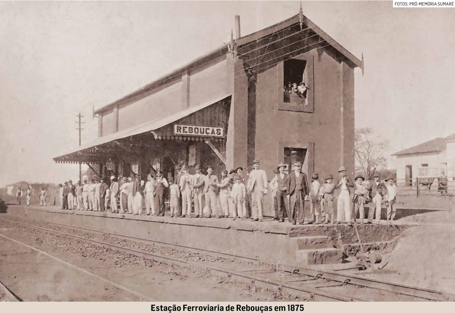
Estação Ferroviária de Rebouças em 1875

No século dezoito Campinas era o município mais rico do Brasil. A maior riqueza nacional era o café, produzido inicialmente no Vale do Paraíba e depois em solo campineiro. Milhões de pés de café cobriam as férteis terras de Campinas e avançavam pelos municípios vizinhos. O escoamento da produção visava o mercado externo, através do porto de Santos. Carroças, carroções e principalmente centenas de muares carregavam o café até ser embarcado com rumo à Europa e aos Estados Unidos. O custo do transporte era alto. Para barateá-lo apareceu o trem de ferro. A euforia era grande, e em breve os trilhos ligaram Santos a Jundiaí, chegaram logo em Campinas, depois em Santa Bárbara e Rio Claro.