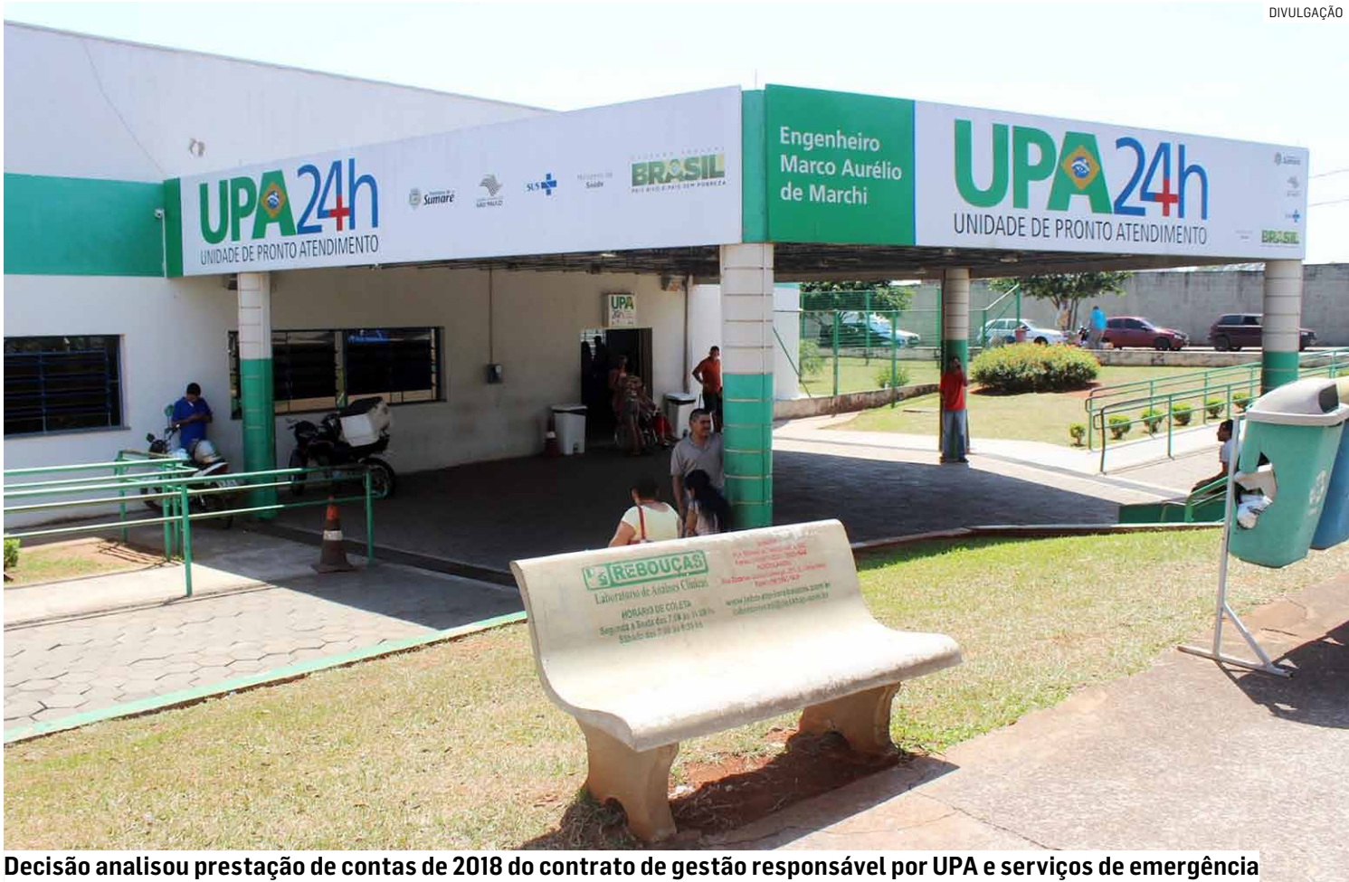
Decisão analisou prestação de contas de 2018 do contrato de gestão responsável por UPA e serviços de emergência