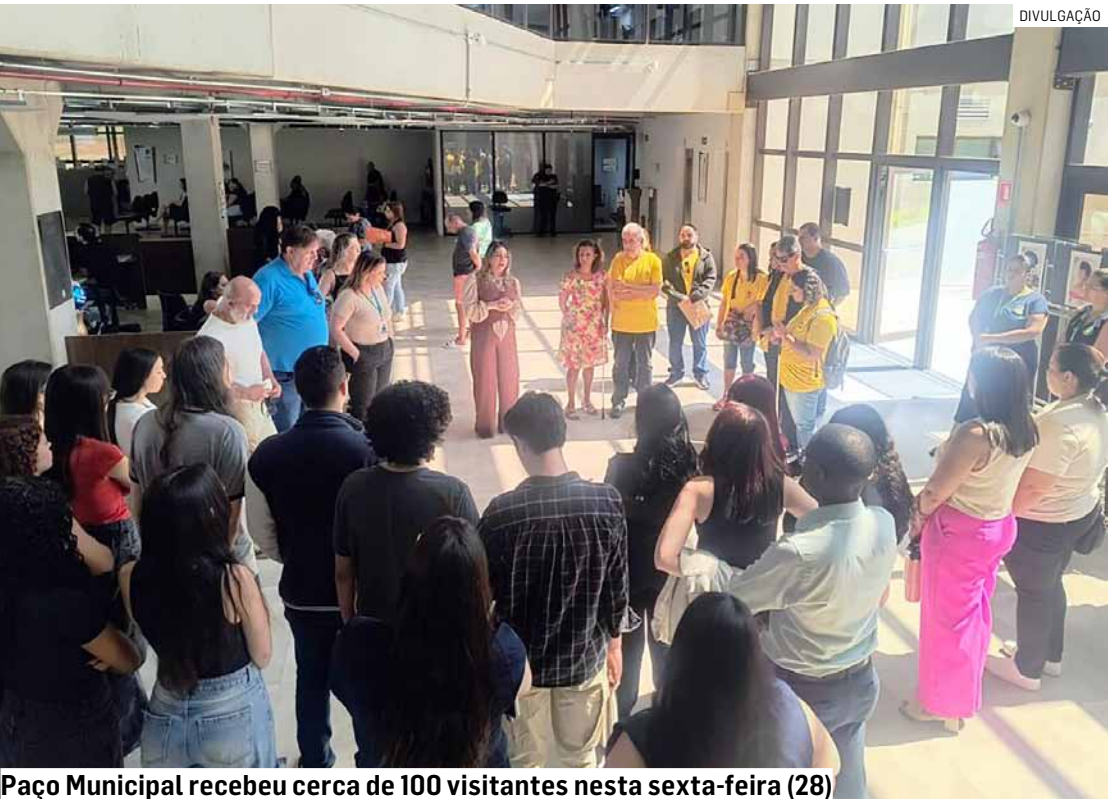
Paço Municipal recebeu cerca de 100 visitantes nesta sexta-feira (28)

“Nosso projeto Bastidores do Progresso é uma iniciativa que abre as portas do Paço Municipal e das nossas empresas para a população. Ver mais de 100 visitantes — estudantes, jovens patrulheiros, pessoas com deficiência visual e representantes da nossa comunidade — caminhando pelos corredores onde as decisões da cidade acontecem, me enche de orgulho. Esse projeto mostra, na prática, que governar é estar perto das pessoas. É permitir que cada cidadão conheça os serviços, a história e o trabalho diário que