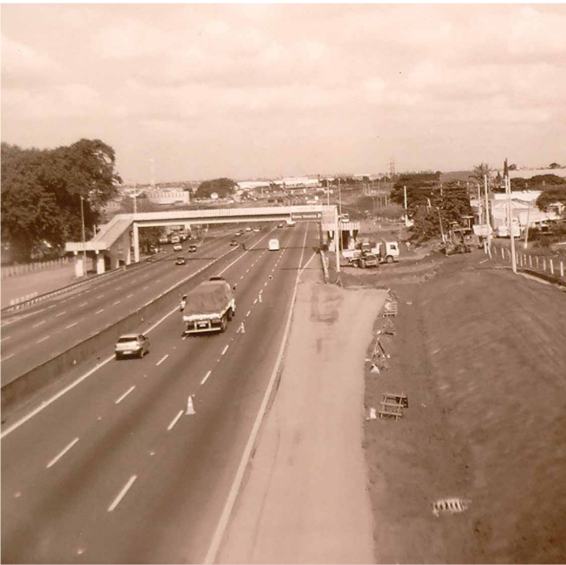
Rodovia Anhangüera na década de 1970

Ao passar pelas fazendas do vale do Ribeirão Quilombo, a ferrovia fundou Sumaré: primeiro uma estação, depois um povoado. No começo, o povoado se chamou Estação do Rebouças, depois bairro de Rebouças, e, em 1945, Sumaré.