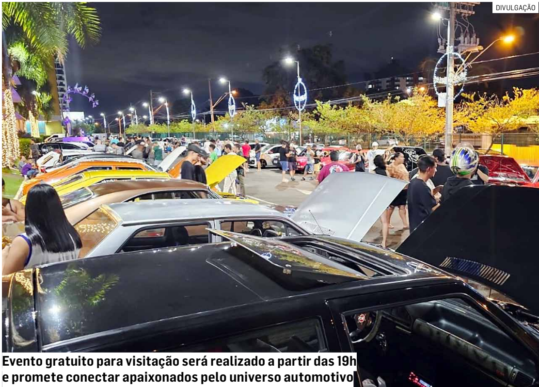
Evento gratuito para visitação será realizado a partir das 19h e promete conectar apaixonados pelo universo automotivo