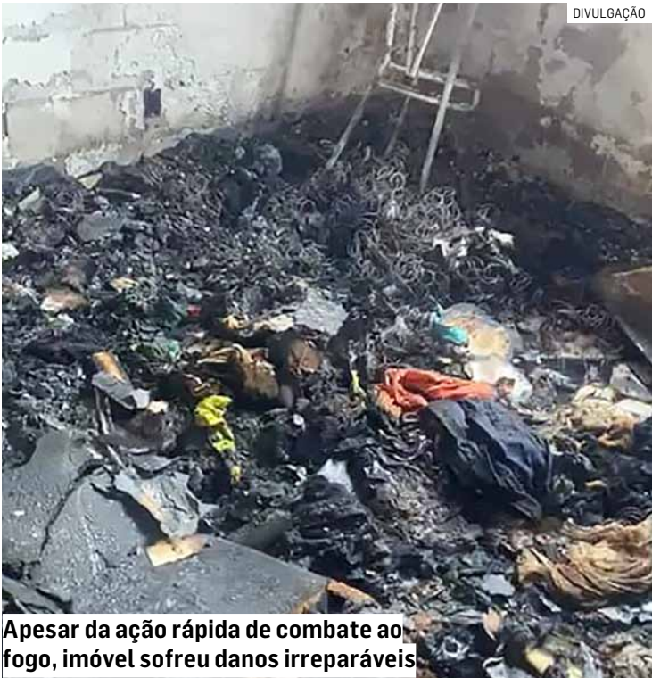
Apesar da ação rápida de combate ao fogo, imóvel sofreu danos irreparáveis

As causas exatas do incêndio e as circunstâncias da discussão que resultou no fogo serão investigadas pelas autoridades competentes. A Polícia Civil deve conduzir os levantamentos necessários para apurar responsabilidades.