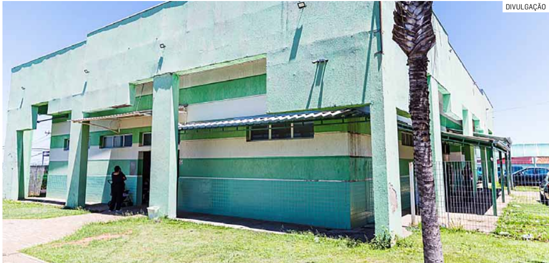
Pacientes devem procurar unidade do Planalto nesta semana enquanto reforma acontece

1.598, na região do Jardim Planalto. A previsão é de que na segunda-feira (3), o atendimento retorne normalmente na UBS Amélia a partir das 7h.