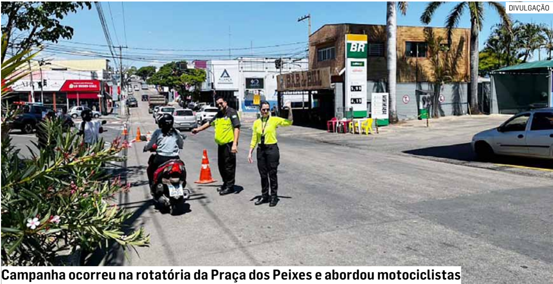
Campanha ocorreu na rotatória da Praça dos Peixes e abordou motociclistas

Esta foi a 13ª campanha educativa realizada este ano pela Secretaria e pelo Detran em Monte Mor. O objetivo é orientar os motoristas e motociclistas e garantir o trânsito seguro.