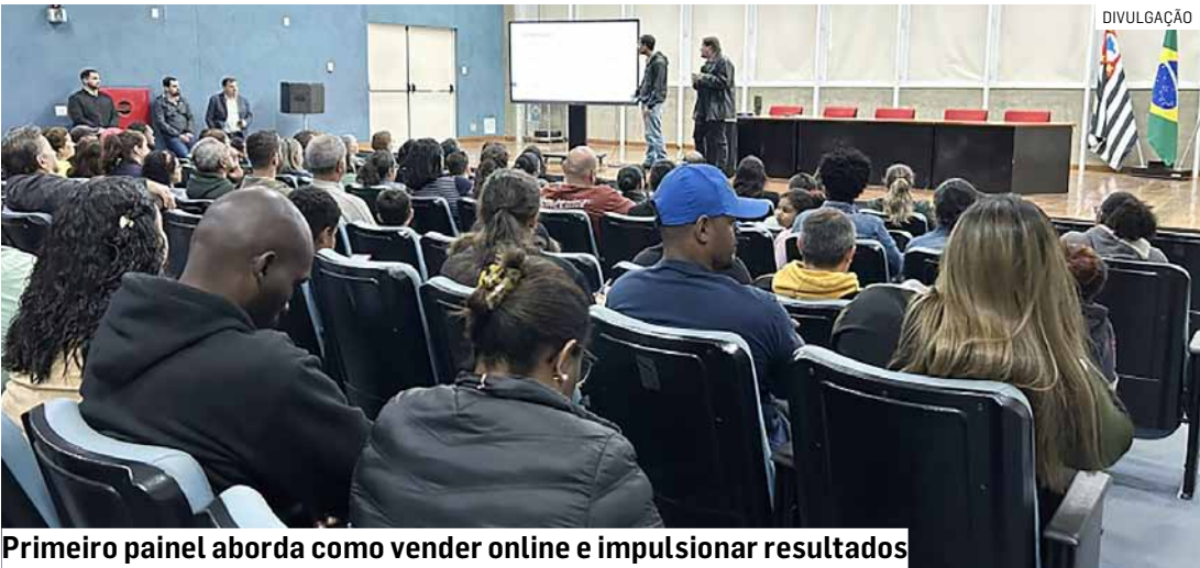
Primeiro painel aborda como vender online e impulsionar resultados

Paulo Medina • PAULÍNIA tribunaliberal@tribunaliberal.com.br