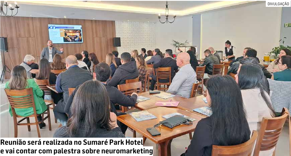
Reunião será realizada no Sumaré Park Hotel e vai contar com palestra sobre neuromarketing

Durante os eventos presenciais, os empresários têm a oportunidade de participar de rodadas de negócios, divulgar sua empresa, produtos e serviços, e trocar contatos com outros empresários.