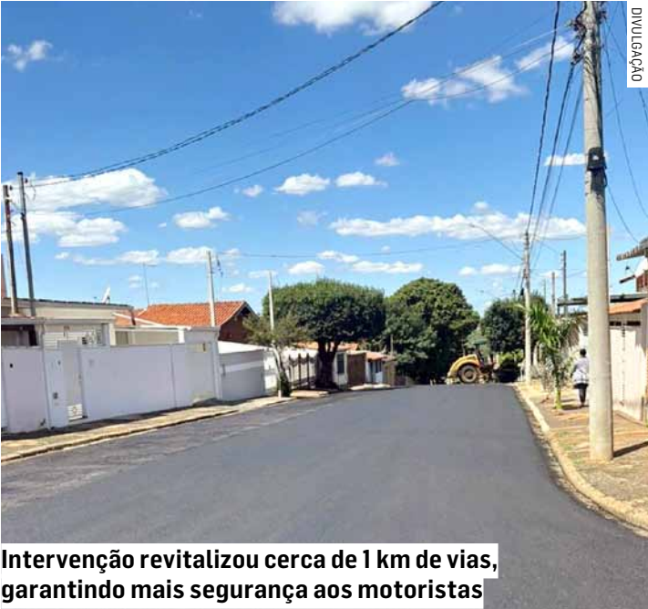
Intervenção revitalizou cerca de 1 km de vias, garantindo mais segurança aos motoristas

Com investimento de R$ 336 mil, provenientes de recursos do Ministério das Cidades, a obra faz parte do plano municipal de melhoria da infraestrutura urbana e mobilidade viária, proporcionando mais segurança aos motoristas