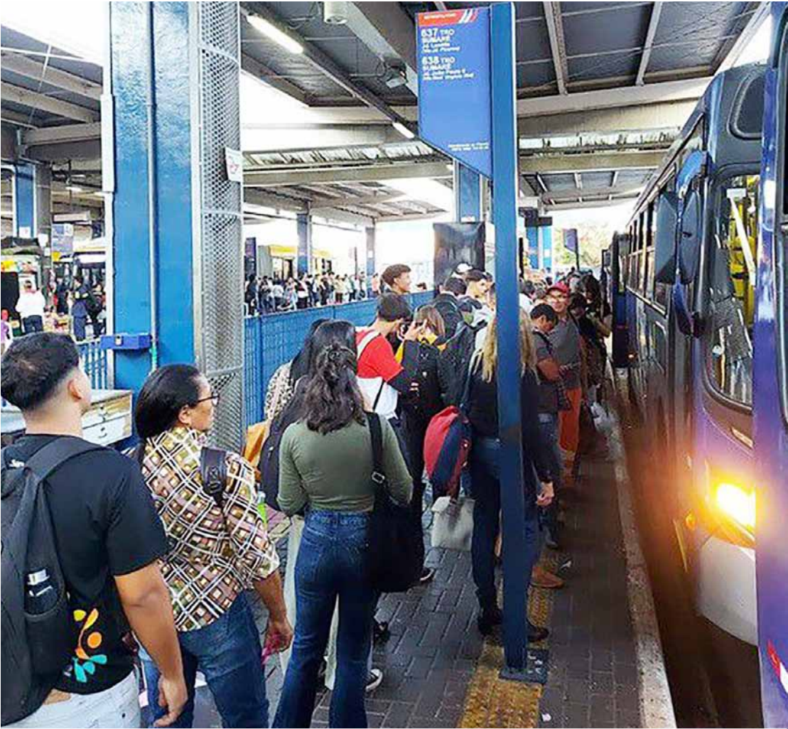
Reclamações se repetem em linhas da região entre Sumaré e a metrópole, como a 636 e a 638