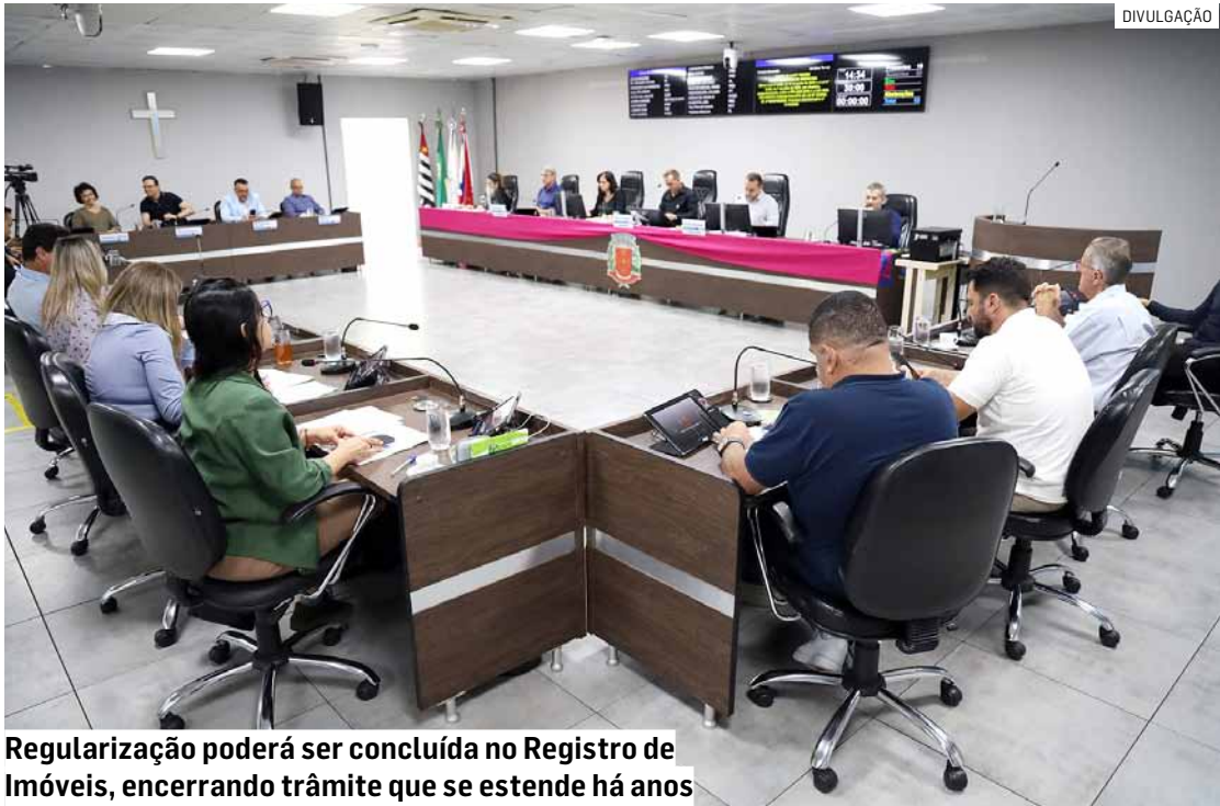
Regularização poderá ser concluída no Registro de Imóveis, encerrando trâmite que se estende há anos

O imóvel foi declarado de utilidade pública em 1986, com o objetivo de implantar melhorias viárias e um centro cultural no local. Após o trânsito em julgado do processo judicial, a área passou a integrar o patrimônio do município em 2004. Porém, como o projeto previsto não foi executado, a prefeitura obteve autorização legislativa, em 2012, para alienar o imóvel à iniciativa privada, o que se concretizou mediante escritura de compra e venda.