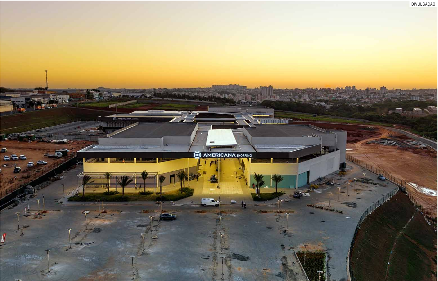
Centro de compras atenderá mais de 500 mil consumidores da região; projeto multiuso reúne cinemas e mais de 110 lojas

A pesquisa também revela que o município possui renda média familiar acima de R$ 6 mil e um público com alta demanda reprimida por lazer, gastronomia e experiências de compra — fatores