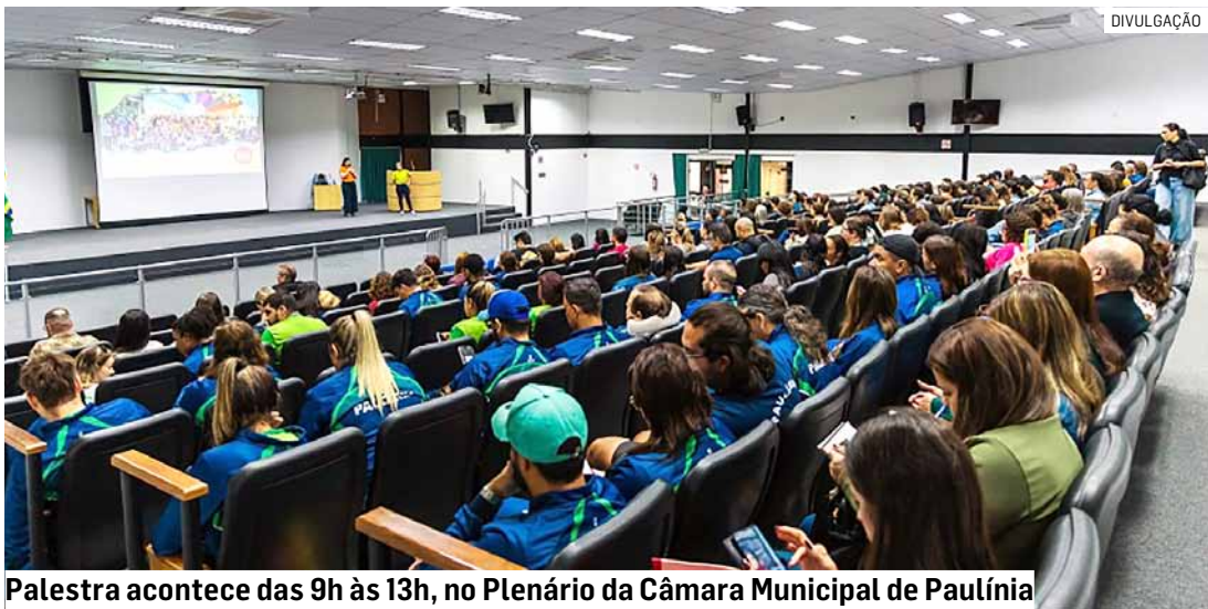
Palestra acontece das 9h às 13h, no Plenário da Câmara Municipal de Paulínia