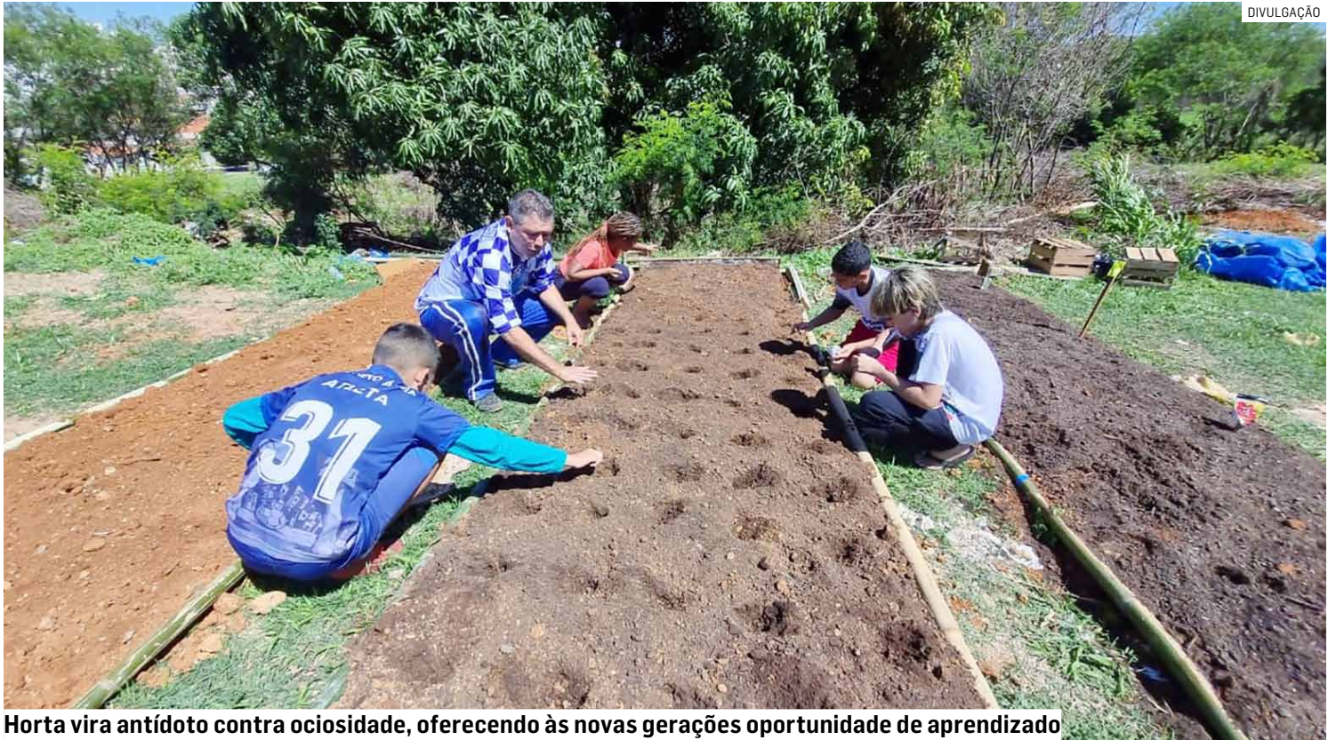
Horta vira antídoto contra ociosidade, oferecendo às novas gerações oportunidade de aprendizado

O espaço, onde abrigou a antiga favela da Vila São Pedro e que estava tomado por entulhos, agora se torna símbolo de renascimento. O solo, que já foi depósito de lixo, volta a ser morada de vida. A ideia é simples, mas profunda: reunir crianças e adolescentes em torno do cultivo da terra, ensinando valores que não cabem em cartilhas — solidariedade, paciência, respeito e pertencimento.