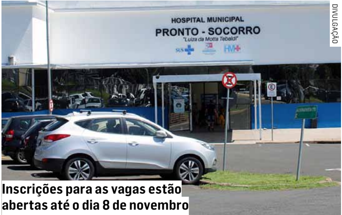
Inscrições para as vagas estão abertas até o dia 8 de novembro

zar o projeto “HMA, UNACON, UPA - Americana/SP - Contrato de Gestão nº 001-23”. Em seguida, é necessário clicar em “Processo Seletivo para Colaboradores”, fazer o download do edital correspondente e cadastrar o currículo no link indicado no documento. O Hospital Municipal Dr. Waldemar Tebaldi é administrado pelo Grupo Chavantes, por meio de gestão compartilhada com a Secretaria Municipal de Saúde de Americana.