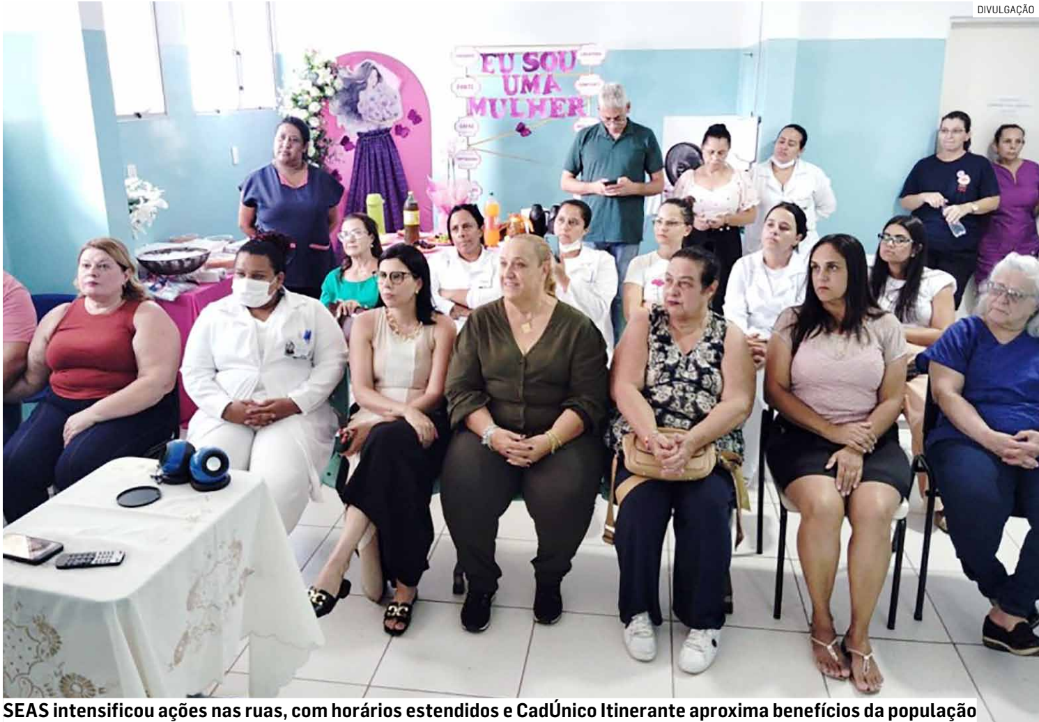
SEAS intensificou ações nas ruas, com horários estendidos e CadÚnico Itinerante aproxima benefícios da população

O serviço ampliou a presença nas ruas, com horários estendidos de atendimento, das 8h às 22h em dias úteis, e também nos finais de semana e feriados, das 9h às 13h. A equipe passou a atuar de forma constante em diferentes regiões do município, consolidando a presença do poder público nos espaços mais vulneráveis.