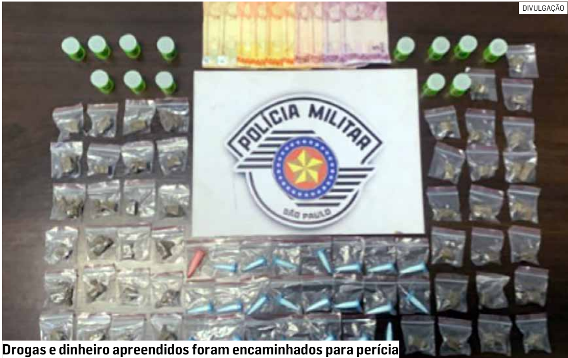
Drogas e dinheiro apreendidos foram encaminhados para perícia

De acordo com a corporação, os policiais avistaram quatro indivíduos em atitude suspeita em uma pequena praça. Dois deles estavam sentados em um banco, enquanto os outros dois permaneciam a cerca de cinco metros de distância, observando o movimento no local.