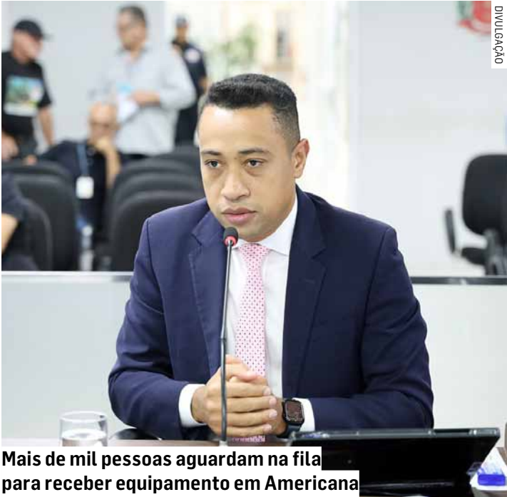
Mais de mil pessoas aguardam na fila para receber equipamento em Americana

No documento o parlamentar explica que, de acordo com informações da secretaria municipal de Saúde, atualmente 1.060 pessoas aguardam na fila de espera para receber o equipamento em Americana. A solicitação mais antiga tem data de fevereiro de 2013. “É inaceitável que cidadãos aguardem há mais de uma década por