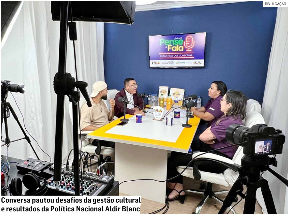
Conversa pautou desafios da gestão cultural e resultados da Política Nacional Aldir Blanc

“No início foi como trocar o pneu do carro andan-