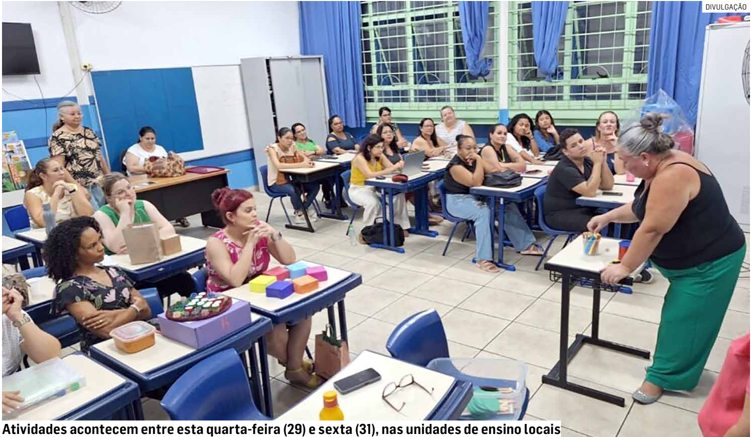
Atividades acontecem entre esta quarta-feira (29) e sexta (31), nas unidades de ensino locais

Com debates sobre o uso consciente da internet, observação planetária, aula interativa de astronomia, projetos de robótica e palestras, a III Semana Municipal de Ciência e Tecnologia da prefeitura pretende movimentar a rede municipal de educação de Hortolândia, neste final de mês. O objetivo da Secretaria de Educação, Ciência e Tecnologia, organizadora do evento, é fomentar a cultura investigativa, o pensamento computacional e a cultura “maker” (do “aprenda, fazendo”) junto a estudantes, educadores e toda a comunidade escolar, integrando teoria e prática por meio de formações, desafios e vivências lúdicas. Inteiramente gratuita, a Semana começa nesta quarta-feira (29), a partir das 8h, indo até sexta-feira (31), com atividades no Paço Municipal, no Jd. Metro-