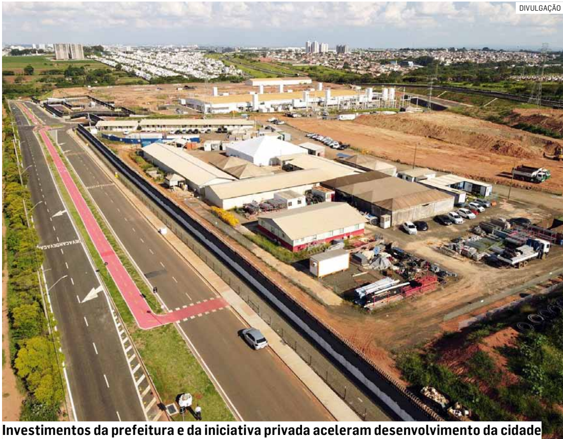
Investimentos da prefeitura e da iniciativa privada aceleram desenvolvimento da cidade

A Prefeitura de Hortolândia tem acompanhado de perto os investimentos da Microsoft na cidade. Recentemente, o pre-