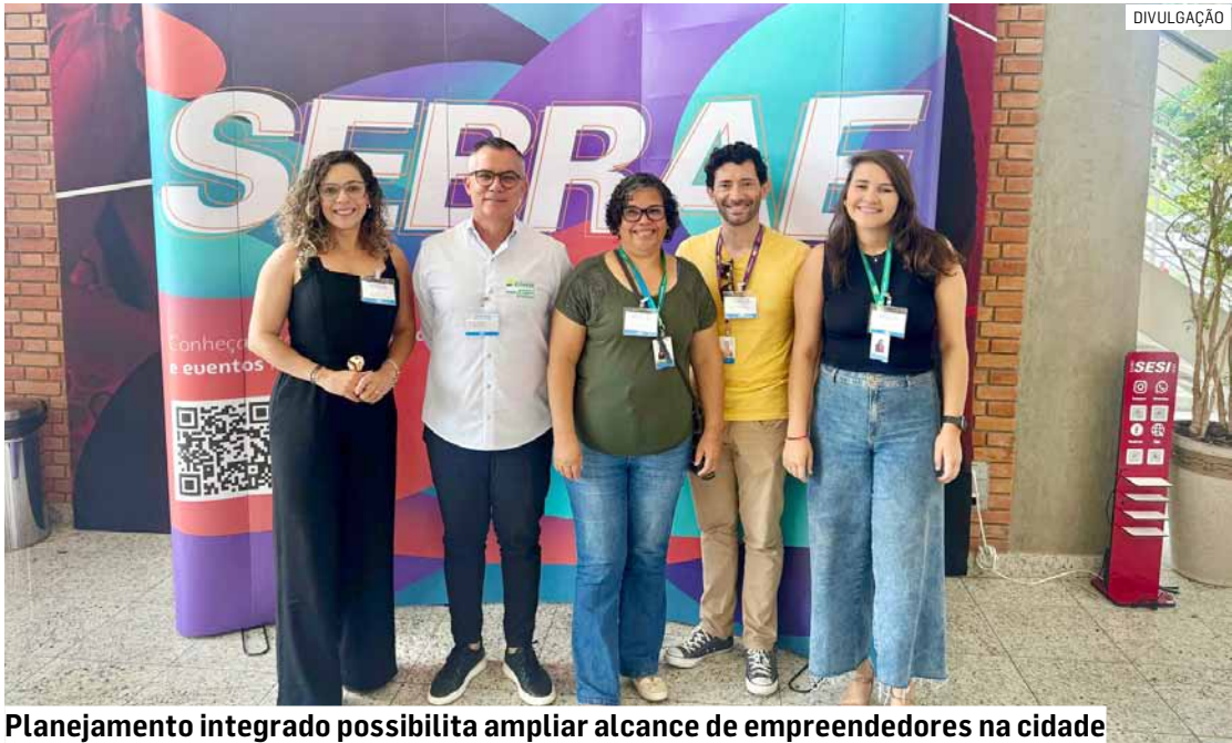
Planejamento integrado possibilita ampliar alcance de empreendedores na cidade

Com o tema “Unir Forças, Multiplicar Resultados”, o evento reuniu representantes das 22 cidades atendidas pelo escritório regional, além de lideranças municipais, entidades de classe e universidades. O objetivo foi apresentar os resultados alcançados em 2025 e alinhar estratégias e ações para o ano de 2026.