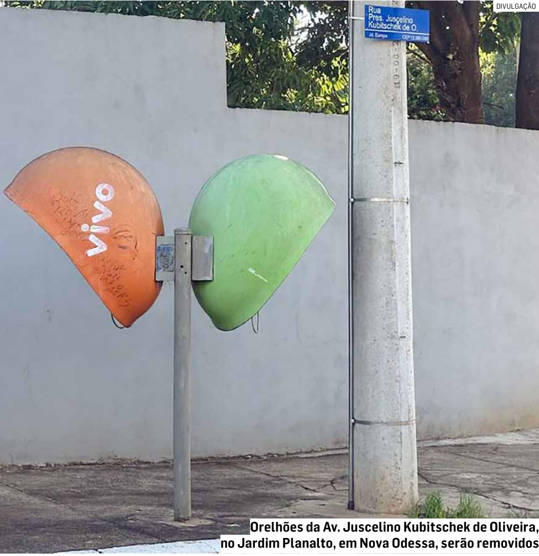
Orelhões da Av. Juscelino Kubitschek de Oliveira, no Jardim Planalto, em Nova Odessa, serão removidos

Agora, diante de uma nova realidade tecnológica, os orelhões se despedem das ruas e passam a integrar a memória afetiva das cidades — um marco silencioso da transformação digital que mudou a forma de comunicação no país.