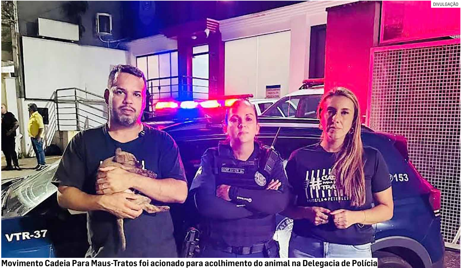
Movimento Cadeia Para Maus-Tratos foi acionado para acolhimento do animal na Delegacia de Polícia

Ao perceber a aproximação da viatura, o homem tentou fugir em direção a um mercado da região, segurando o cachorro em uma das mãos e a barra de ferro na outra. Diante da tentativa de fuga e do risco iminente ao