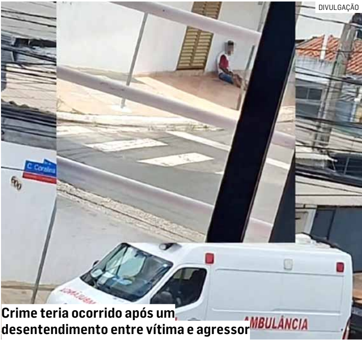
Crime teria ocorrido após um desentendimento entre vítima e agressor

O caso será investigado pela Polícia Civil para esclarecer a autoria e a motivação da agressão. A polícia deve ouvir testemunhas e analisar possíveis imagens de câmeras de segurança.