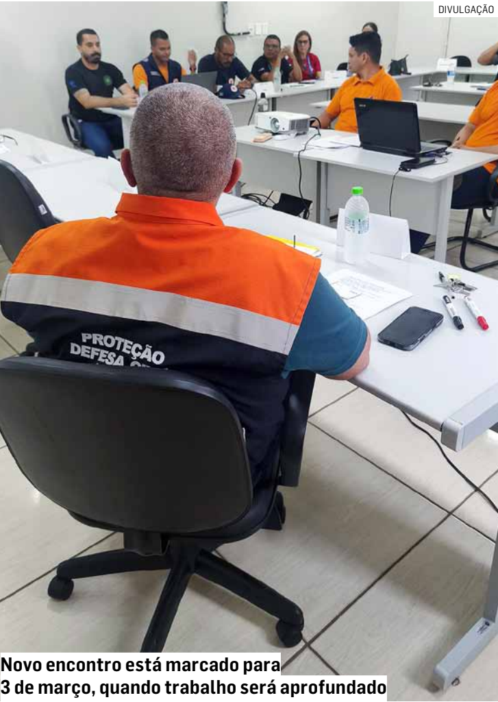
Novo encontro está marcado para 3 de março, quando trabalho será aprofundado