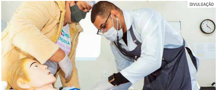
Interessados devem comparecer ao Fundo Social até 30 de janeiro; iniciativa capacita moradores

Podem participar moradores do município com idade mínima de 18 anos. As pré-inscrições devem