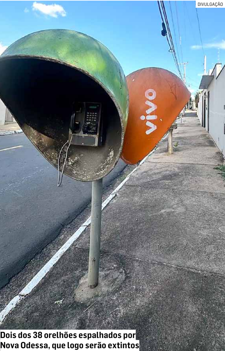
Dois dos 38 orelhões espalhados por Nova Odessa, que logo serão extintos

rão desativados nos seis municípios de cobertura do Tribuna Liberal . A medida marca o encerramento de um modelo de comunicação substituído quase integralmente pelo uso do celular. PÁGINA 04