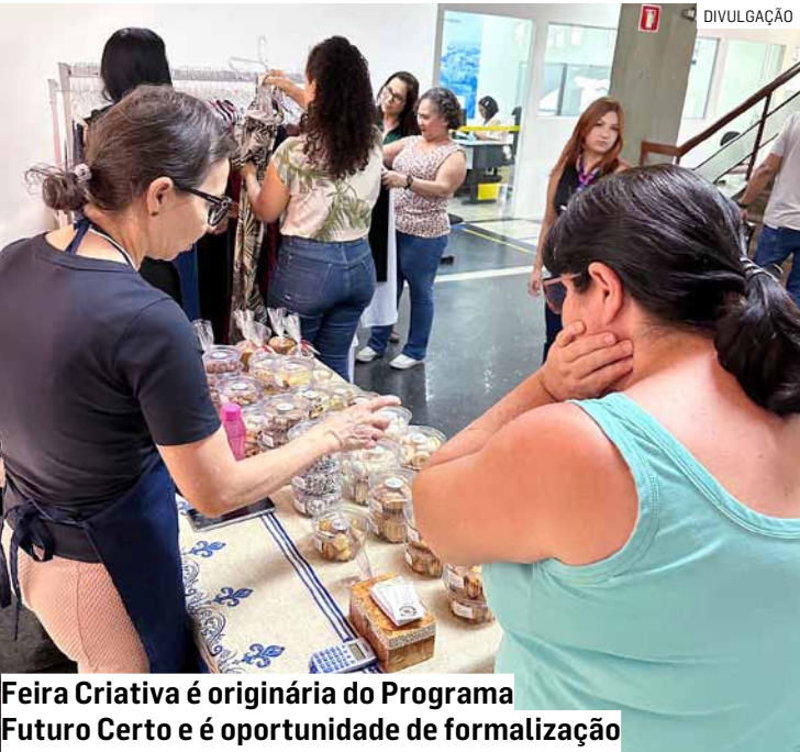
Feira Criativa é originária do Programa Futuro Certo e é oportunidade de formalização

A realização do evento no Paço Municipal conta com apoio da Secretaria de Administração e terá nova edição no dia 5 de dezembro.