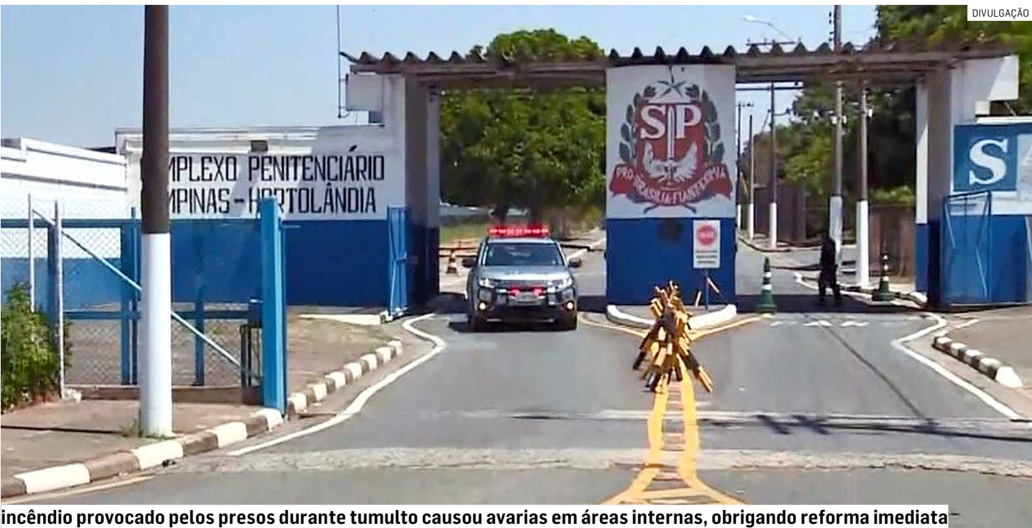
incêndio provocado pelos presos durante tumulto causou avarias em áreas internas, obrigando reforma imediata

Secretaria de Administração Penitenciária bloqueia acesso de familiares e cancela envio de alimentos e itens de higiene após avarias provocadas por detentos durante tumulto e incêndio; obras emergenciais estão em andamento