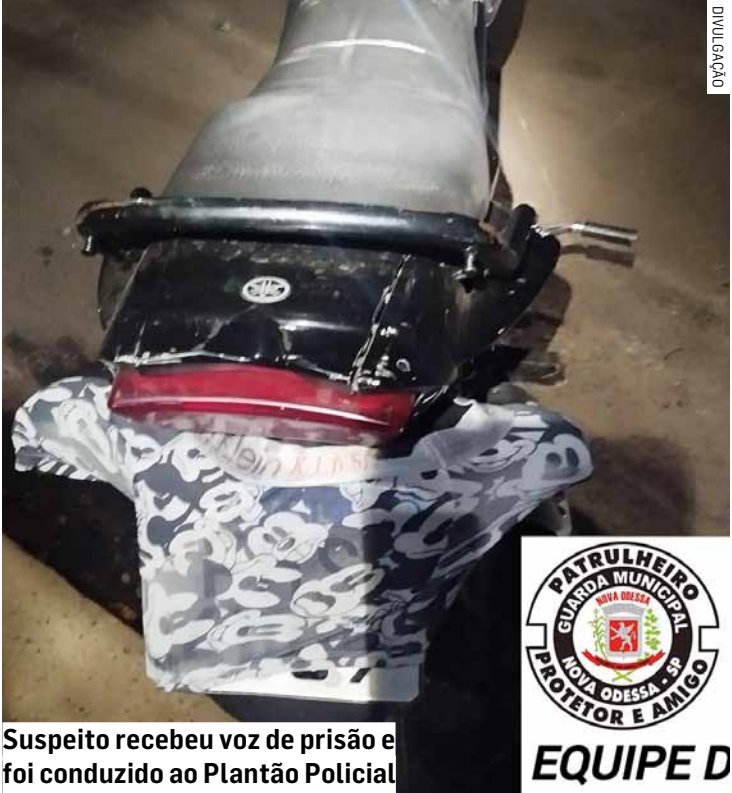
Suspeito recebeu voz de prisão e foi conduzido ao Plantão Policial

Após a formalização do registro, o homem foi encaminhado à Cadeia Pública, onde permanece à disposição da Justiça. A motocicleta foi apreendida e será encaminhada para perícia.