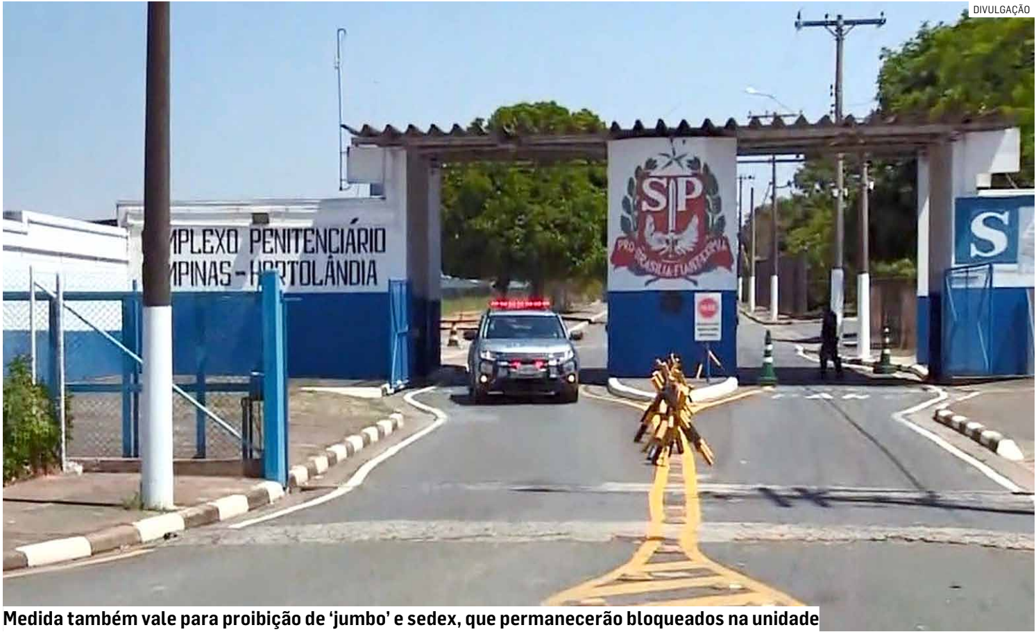
Medida também vale para proibição de 'jumbo' e sedex, que permanecerão bloqueados na unidade

O órgão afirmou que as obras estão em andamento e que a Polícia Penal co-