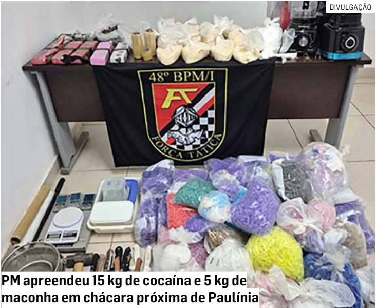
PM apreendeu 15 kg de cocaína e 5 kg de maconha em chácara próxima de Paulínia

Com a nova informação, a equipe se deslocou até o endereço indicado, onde foi encontrada uma grande quantidade de drogas e materiais usados para preparo e fracionamento das substâncias. O local funcionava como base de armazenamento e possível refinamento.