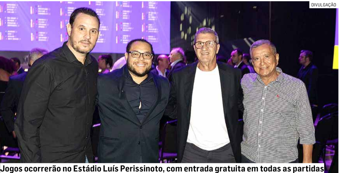
Jogos ocorrerão no Estádio Luís Perissinoto, com entrada gratuita em todas as partidas

coloca Paulínia novamente em destaque no futebol nacional. Já colhemos frutos de outras Copas e agora, com a volta da competição, estamos motivados e empenhados em representar Paulínia com garra e determinação”, destacou. A edição de 2025 da Copinha contará com 128 equipes divididas em 32 grupos, com os dois melhores de cada chave avançando para a segunda fase. A partir daí, a competição será no formato mata-mata até a grande final, marcada para 25 de janeiro, na Mercado Livre Arena Pacaembu, em São Paulo. A Copinha é reconhecida por revelar grandes talentos do futebol brasileiro e internacional, e a expectativa é que a cidade viva dias de intensa movimentação esportiva, cultural e econômica.