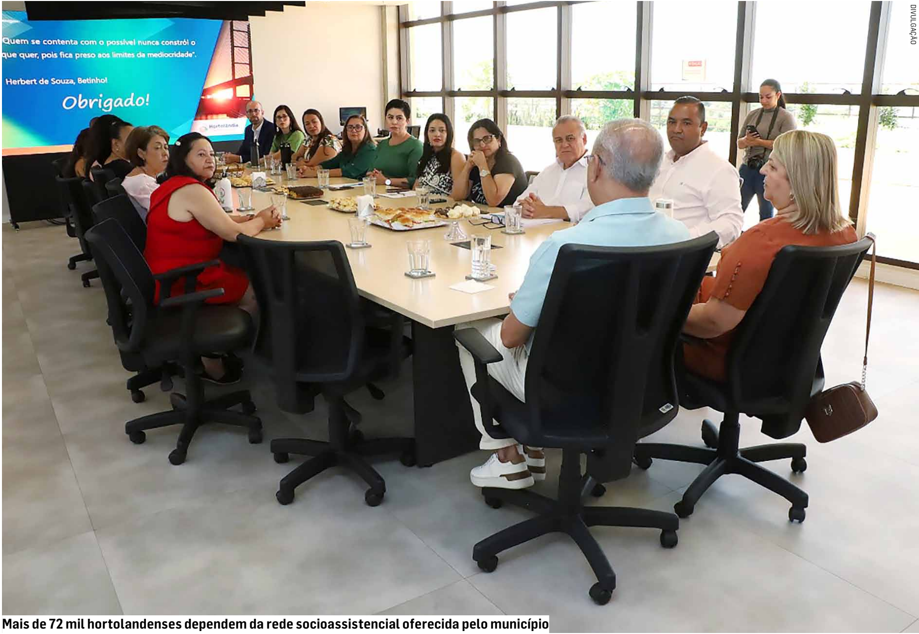
Mais de 72 mil hortolandenses dependem da rede socioassistencial oferecida pelo município

Uma das prioridades é a ampliação do Serviço de Convivência e Fortalecimento de Vínculos, com a meta de aumentar em 10% o número de atendimentos — atualmente, 1.239 pessoas participam das ações