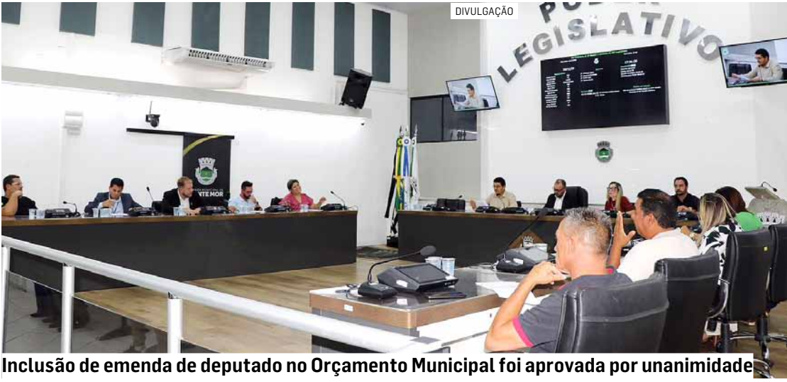
Inclusão de emenda de deputado no Orçamento Municipal foi aprovada por unanimidade