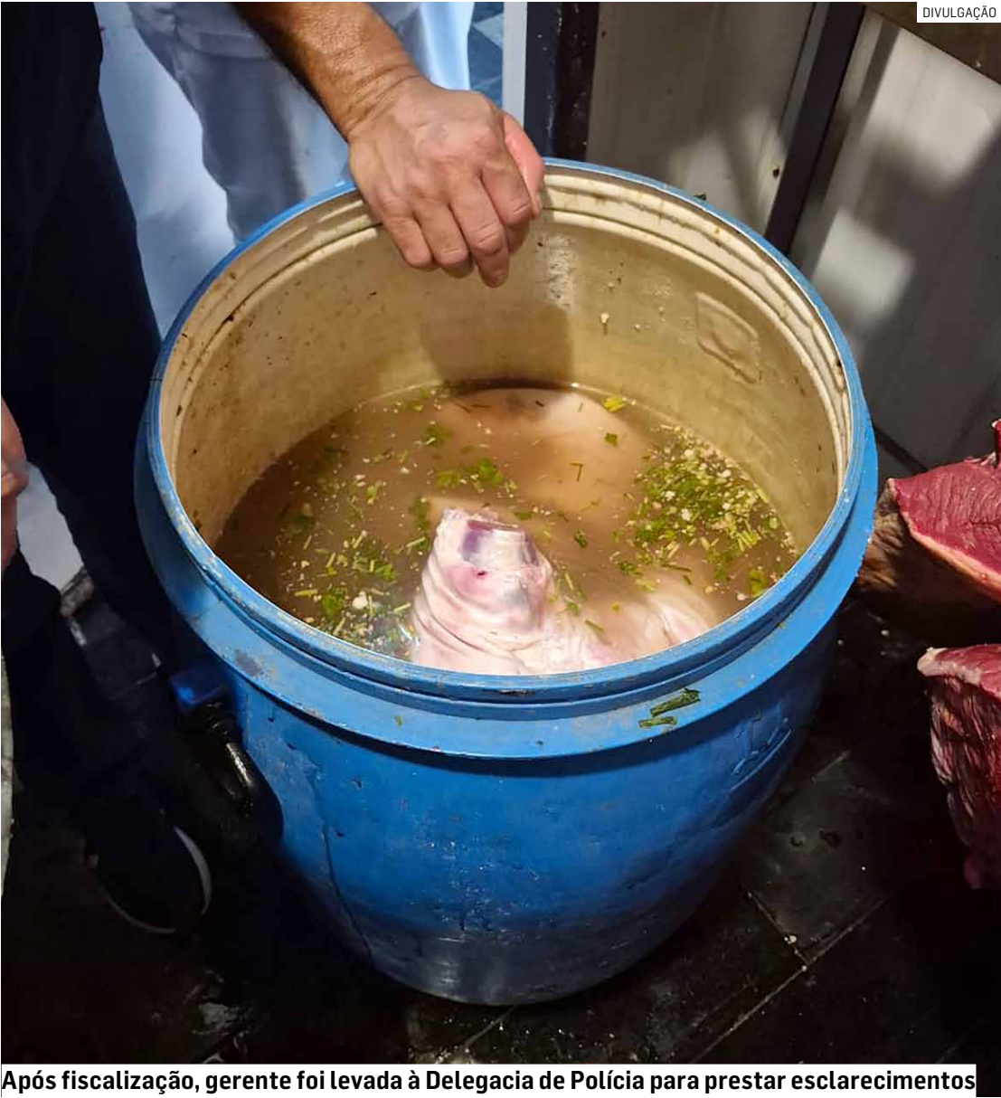
Após fiscalização, gerente foi levada à Delegacia de Polícia para prestar esclarecimentos

Operação conjunta com a Polícia Civil encontra falhas na manipulação de alimentos, apreende produtos vencidos e sem registro, identifica risco de contaminação no setor de carnes do estabelecimento e encaminha gerente à delegacia