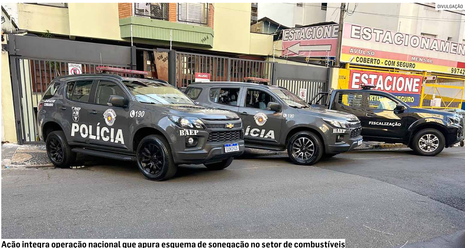
Ação integra operação nacional que apura esquema de sonegação no setor de combustíveis

O Gaeco e a Polícia Militar cumpriram mandados de busca em Paulínia e Campinas nesta quinta (27) como parte da Operação Poço de Lobato, que investiga um esquema bilionário de fraude fiscal no setor de combustíveis. A organização criminosa, segundo as apurações, teria causado prejuízo superior a R$ 9 bilhões ao Estado de São Paulo entre 2007 e 2024 por meio do não recolhimento de ICMS. Cinco mandados foram executados na região, com foco na apreensão de documentos e mídias. A ação envolve Receita Federal, Secretaria da Fazenda e Procuradoria da Fazenda Nacional. O grupo é apontado como o maior devedor do país, com dívidas acima de R$ 26 bilhões. As suspeitas incluem uso de empresas de fachada e movimentação de R$ 70 bilhões em um ano para ocultar valores. O Grupo de Atuação Especial de Combate ao Crime Organizado (Gaeco) e a Polícia Militar cumpriram nesta quinta-feira (27) mandados de busca em Paulínia e Campinas como parte de uma investigação