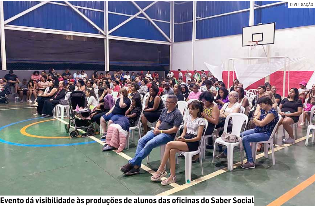
Evento dá visibilidade às produções de alunos das oficinas do Saber Social

O Saber Social convida a comunidade a acompanhar as atividades.