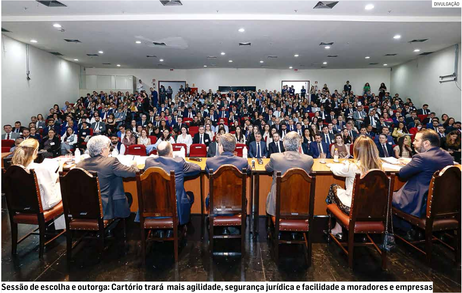
Sessão de escolha e outorga: Cartório trará mais agilidade, segurança jurídica e facilidade a moradores e empresas

Atualmente, todos os registros são realizados em Sumaré, o que gera deslocamentos constantes, so-