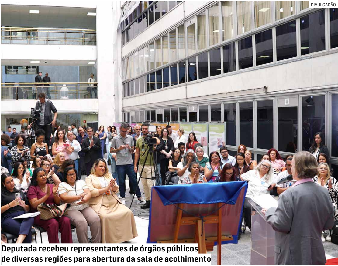
Deputada recebeu representantes de órgãos públicos de diversas regiões para abertura da sala de acolhimento

Procuradora especial das mulheres da Alesp, a deputada classificou a abertura da sala dentro do Parla-