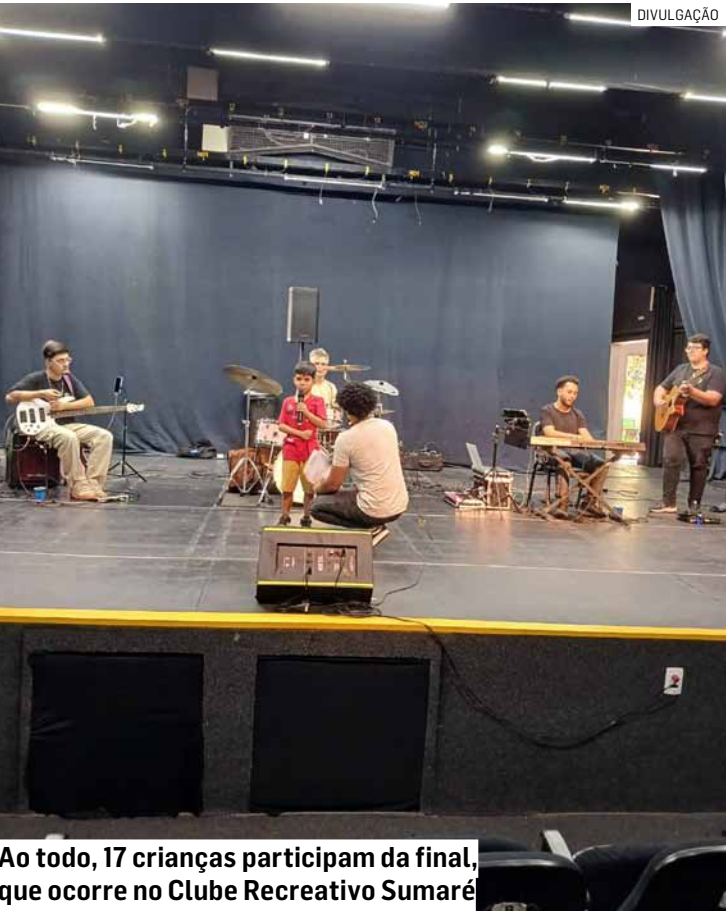
Ao todo, 17 crianças participam da final, que ocorre no Clube Recreativo Sumaré

Os estudantes mais votados em cada categoria avançaram para a final. De acordo com a Administração, o Canta Sumaré foi desenvolvido com o objetivo de democratizar o acesso à música, incentivar a expressão artística e integrar a comunidade escolar por meio da cultura. A proposta busca ampliar oportunidades de participação e fortalecer o vínculo dos alunos com a rede de ensino. Os alunos e professores que obtiverem melhor desempenho receberão prêmios como tablets, chromebooks e notebooks.