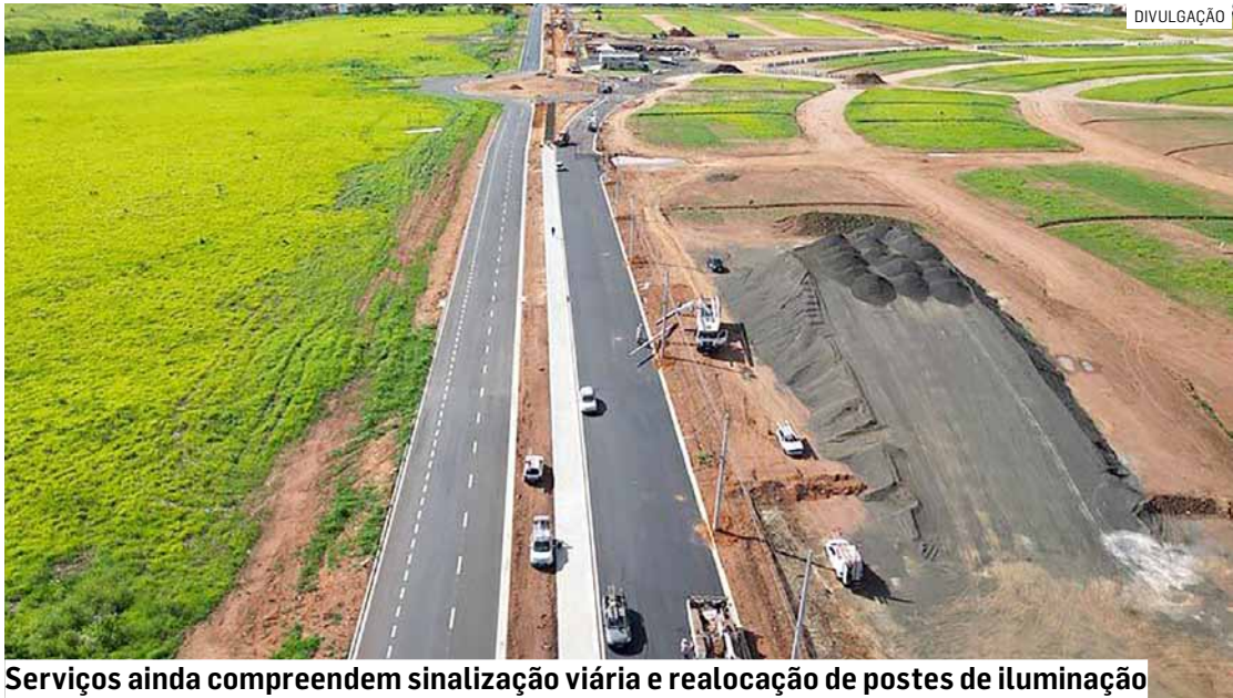
Serviços ainda compreendem sinalização viária e realocação de postes de iluminação

Neste momento, as equipes atuam no recapeamento asfáltico da pista antiga. O serviço já foi realizado na primeira metade da via, enquanto a metade seguinte ainda recebe a execução da base do pavimen-