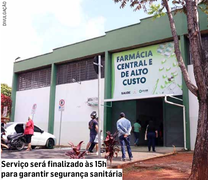
Serviço será finalizado às 15h para garantir segurança sanitária

O procedimento integra as ações de manutenção e melhoria contínua dos serviços públicos de saúde, garantindo que o ambiente permaneça limpo, seguro e adequado para o armazenamento e a distribuição de medicamentos. Na segunda-feira (1), o funcionamento da unidade retornará ao horário normal, das 8h às 16h.