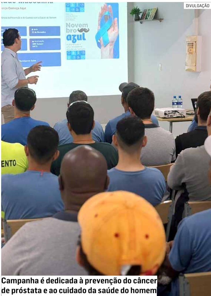
Campanha é dedicada à prevenção do câncer de próstata e ao cuidado da saúde do homem