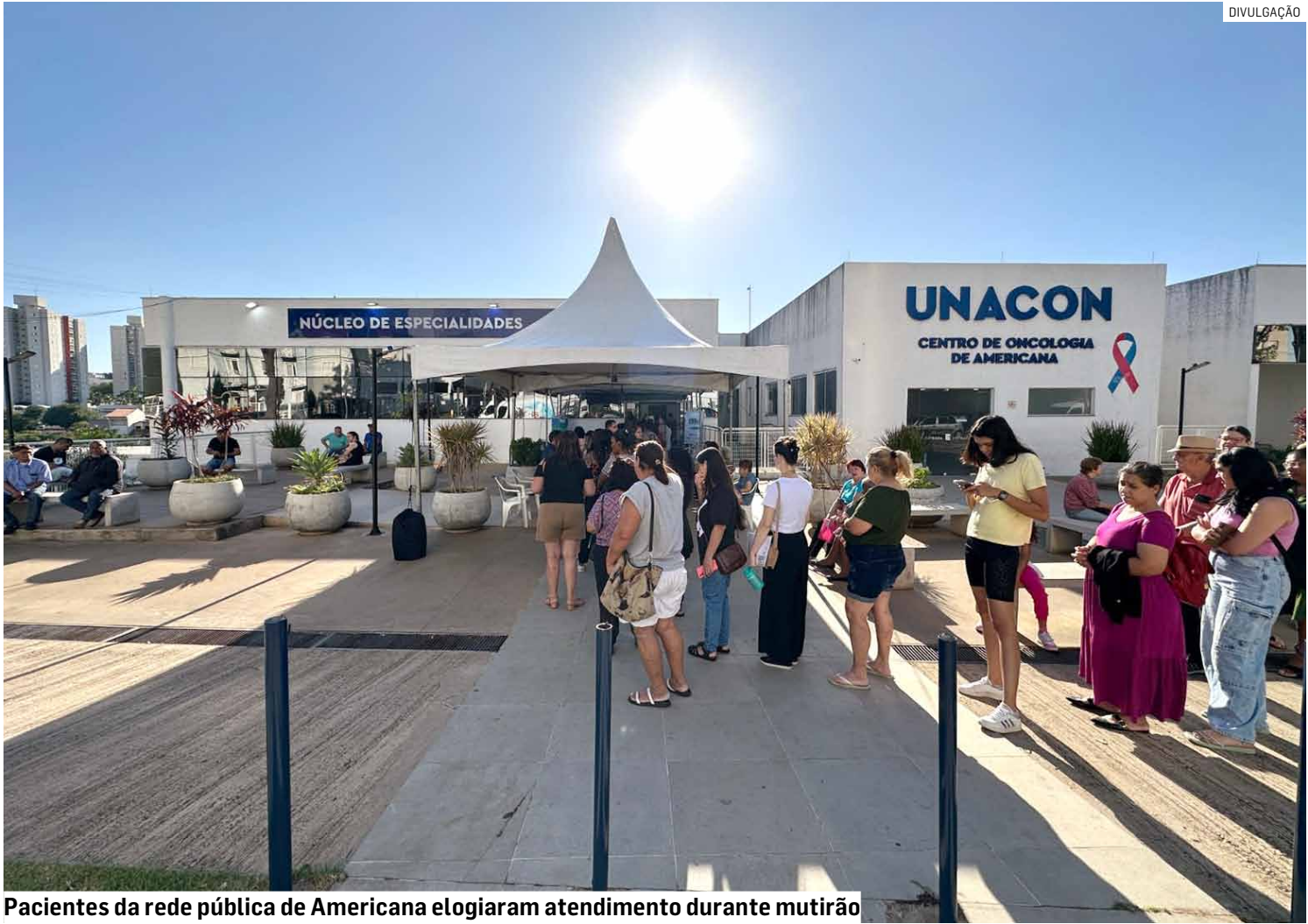
Pacientes da rede pública de Americana elogiaram atendimento durante mutirão

O prefeito de Americana, Chico Sardelli (PL), acompanhou o mutirão no Núcleo de Especialidades. “O mutirão ‘Mil Cuidados Em Um Dia’ mostra o compromisso da prefeitura com a saúde da população, especialmente das mulheres. Conseguimos reunir uma grande equipe de profis-