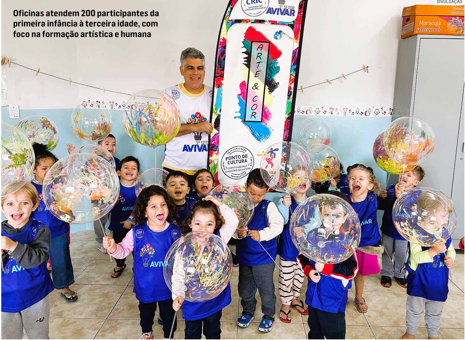
Oficinas atendem 200 participantes da primeira infância à terceira idade, com foco na formação artística e humana

“A inclusão da primeira infância como público prioritário merece destaque, pois cada vez mais, o desenvolvimento e a educação infantil ganham holofotes visando a formação dos profissionais do futuro, e contemplar esse público nesses projetos é um diferencial não só em Sumaré como no país todo, pois ainda é raro ver iniciativas com esse foco sendo realizadas através dos