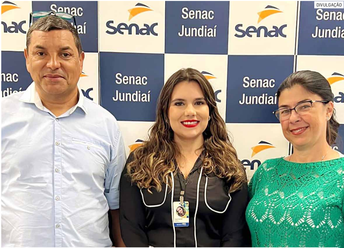
Educação e turismo são chave para valorização do patrimônio local e novas oportunidades

O principal objetivo do 3º Fórum foi abordar a oportunidade em capacitar professores e educadores das redes pública e privada de ensino fundamen-