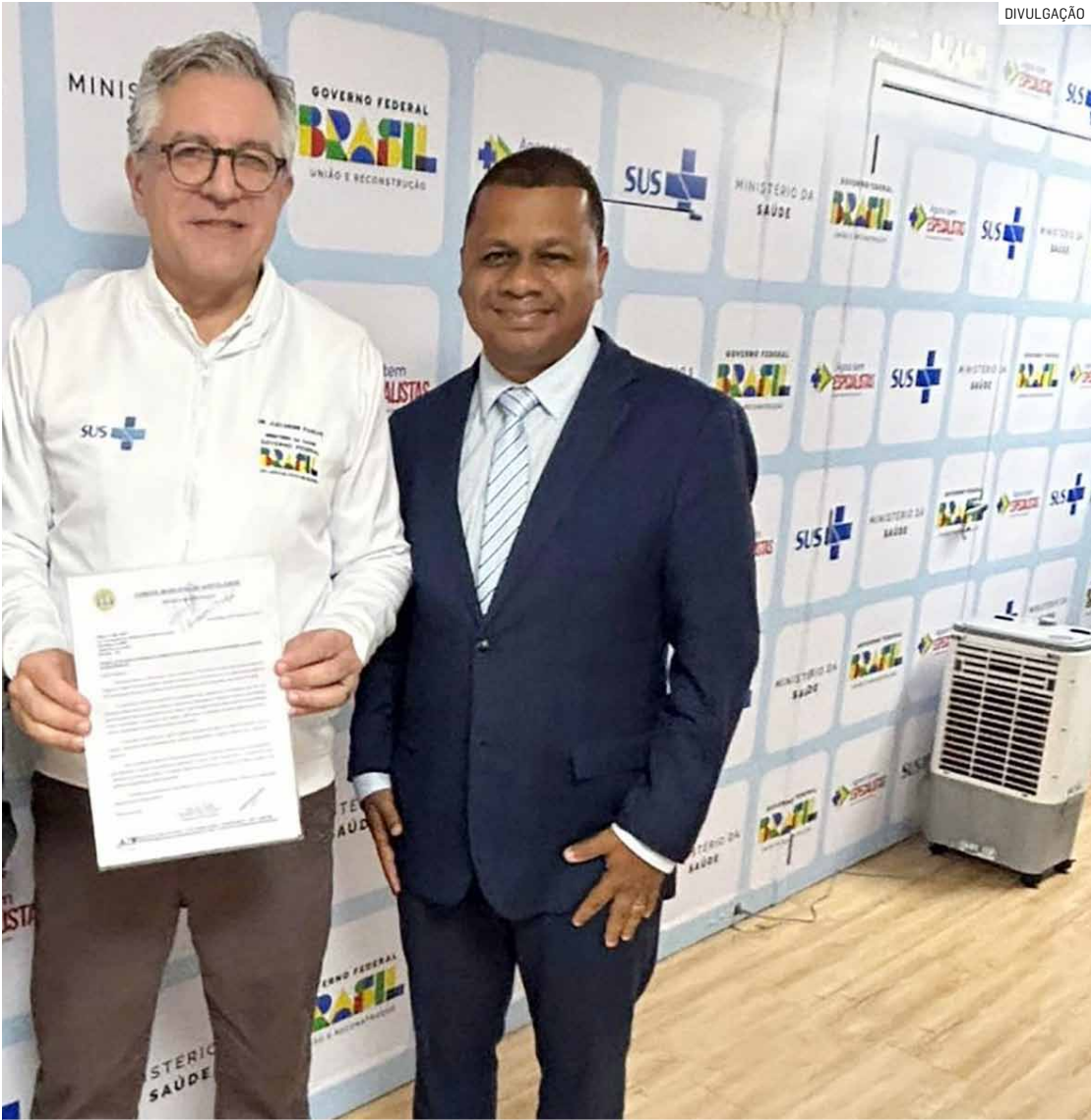
Ministro Alexandre Padilha demonstrou atenção à solicitação do vereador Clodoaldo Santos

O Ministro Alexandre Padilha demonstrou atenção à solicitação e reforçou o compromisso do Governo Federal em expandir o programa para outros municípios, contribuindo para reduzir filas e ampliar o acesso da população aos atendimentos especializados.