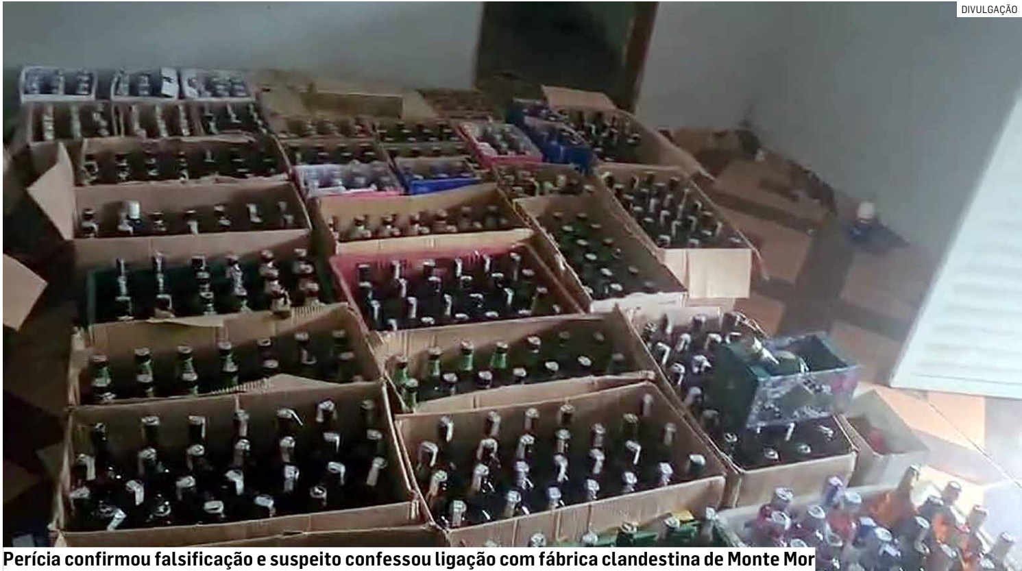
Perícia confirmou falsificação e suspeito confessou ligação com fábrica clandestina de Monte Mor

Segundo informações da PM, as falsificações apresentavam alto grau de semelhança com os produtos originais. No interior da residência, os policiais também encontraram cerca de 230 garrafas verdadeiras vazias, que seriam reutilizadas para enganar os consumidores. A corporação apurou que o material