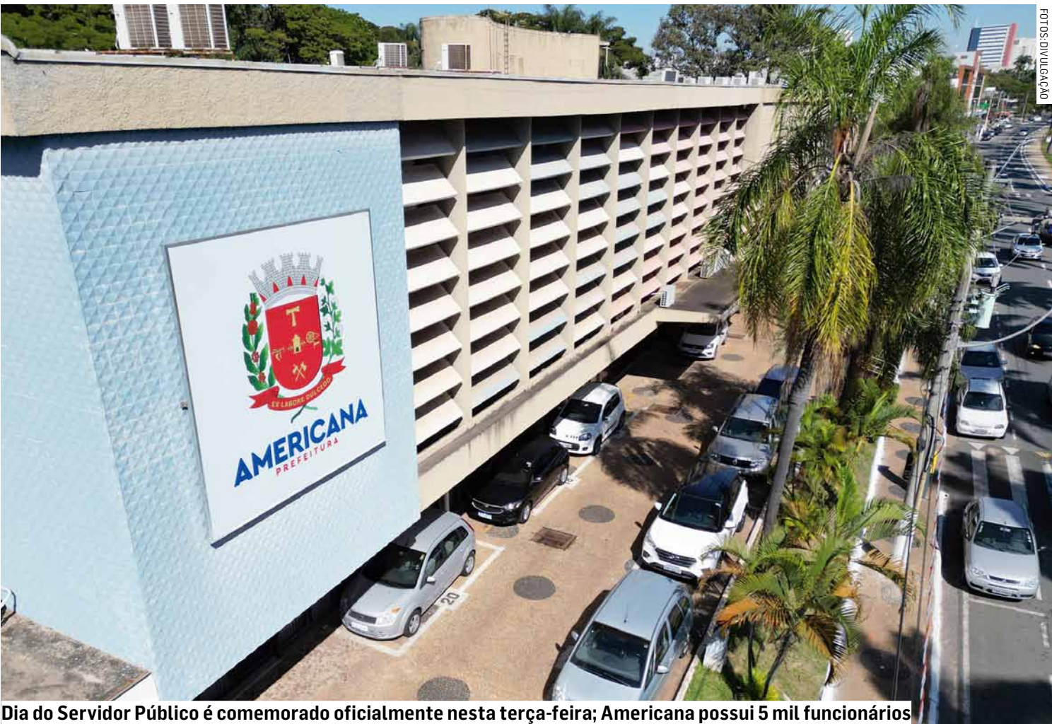
Dia do Servidor Público é comemorado oficialmente nesta terça-feira; Americana possui 5 mil funcionários

Somando os números de todas as seis cidades, a região contabiliza 24.129 servidores públicos municipais — profissionais que sustentam o funcionamento dos serviços essenciais e o atendimento à população em todas as áreas.