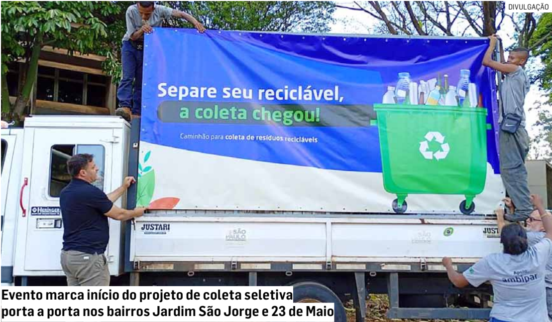
Evento marca início do projeto de coleta seletiva porta a porta nos bairros Jardim São Jorge e 23 de Maio

Na semana seguinte ao Drive Thru, a Secretaria de Meio Ambiente iniciará o projeto experimental de coleta seletiva porta a porta no bairro Jardim São Jorge e no Conjunto Habitacional