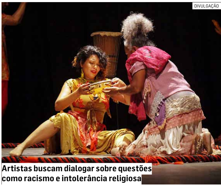
Artistas buscam dialogar sobre questões como racismo e intolerância religiosa

A entrada é gratuita e as apresentações ocorrem no Teatro do Seminário de Nova Veneza, na Avenida Brasil, 1111. No dia 1, o espetáculo começa às 20h, e no dia 2, às 19h.