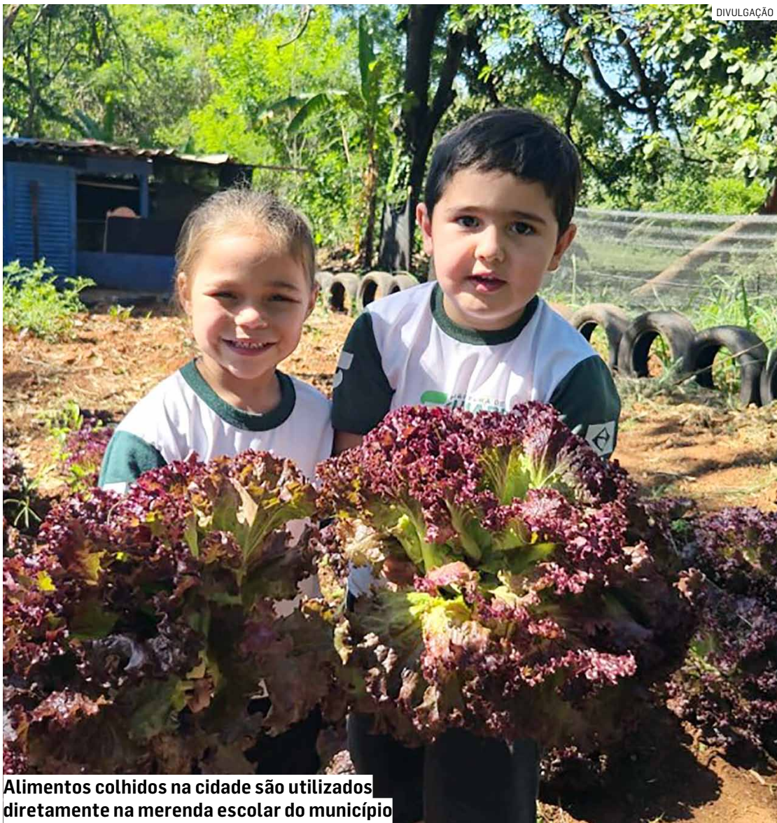
Alimentos colhidos na cidade são utilizados diretamente na merenda escolar do município

Escola Municipal Maria Aparecida de Jesus Segura colheu primeiros tomates e alfaces roxas cultivados na horta, em um projeto que une educação ambiental, sustentabilidade e alimentação saudável; 140 alunos participam do plantio