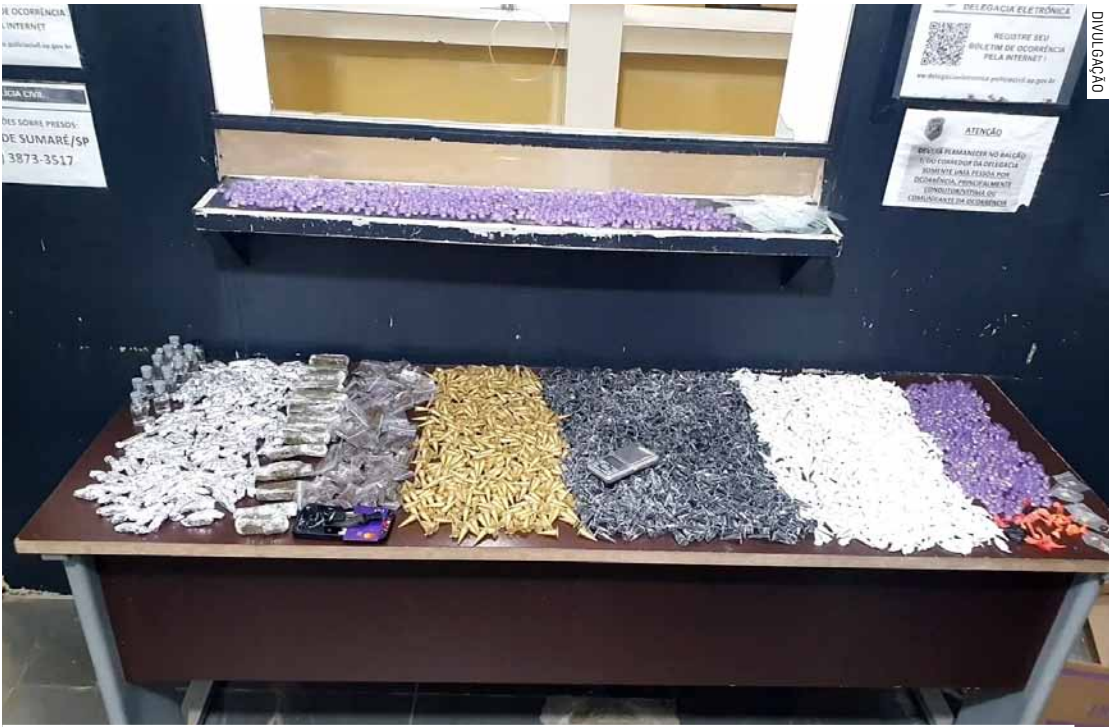
Policiais militares apreenderam 2.511 porções de cocaína, 222 de maconha e 829 de crack

O casal foi encaminhado ao Plantão Policial de Hortolândia, onde o delegado de plantão ratificou a prisão em flagrante por tráfico de drogas. Ambos permanecem à disposição da Justiça.