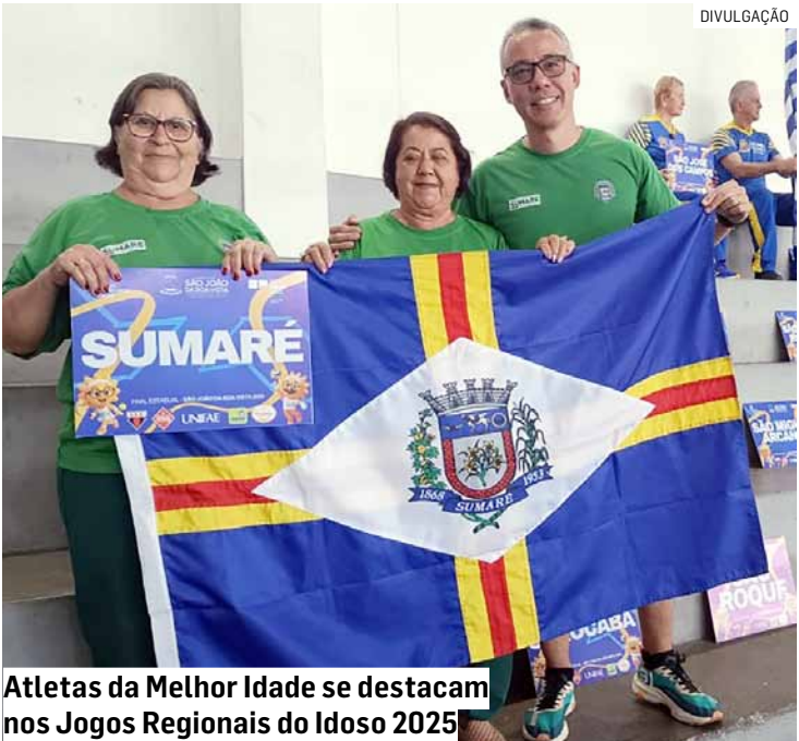
Atletas da Melhor Idade se destacam nos Jogos Regionais do Idoso 2025

Com o tema “idade é apenas um número”, a delegação sumareense segue confiante para a próxima etapa, levando na bagagem histórias de superação e companheirismo.