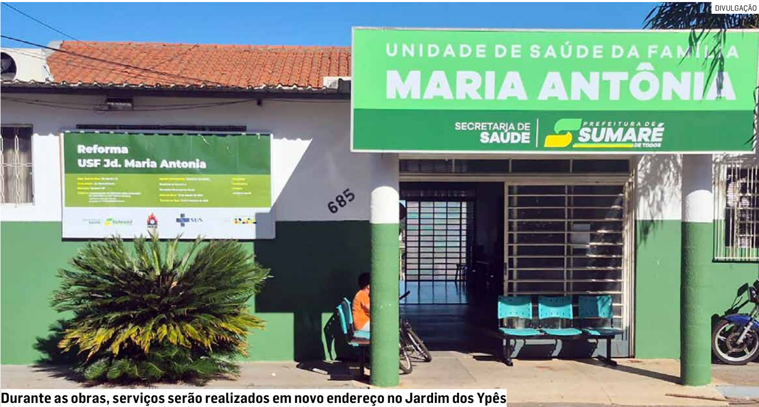
Durante as obras, serviços serão realizados em novo endereço no Jardim dos Ypês

Da Redação • SUMARÉ tribunaliberal@tribunaliberal.com.br