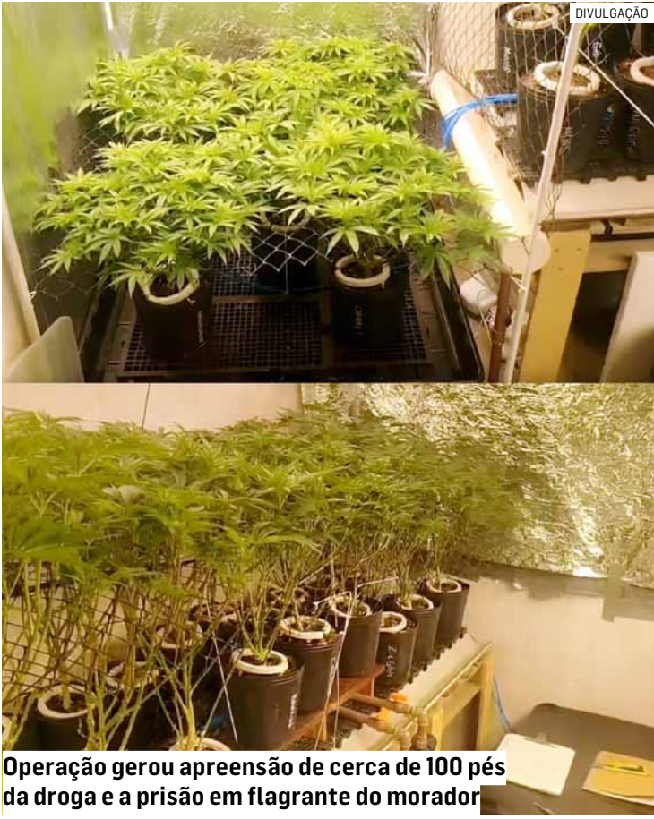
Operação gerou apreensão de cerca de 100 pés da droga e a prisão em flagrante do morador

Após a perícia, o suspeito e o material apreendido foram encaminhados ao Plantão Policial de Hortolândia. O homem permaneceu à disposição da Justiça e responderá pelo crime de tráfico e cultivo ilegal de entorpecentes.