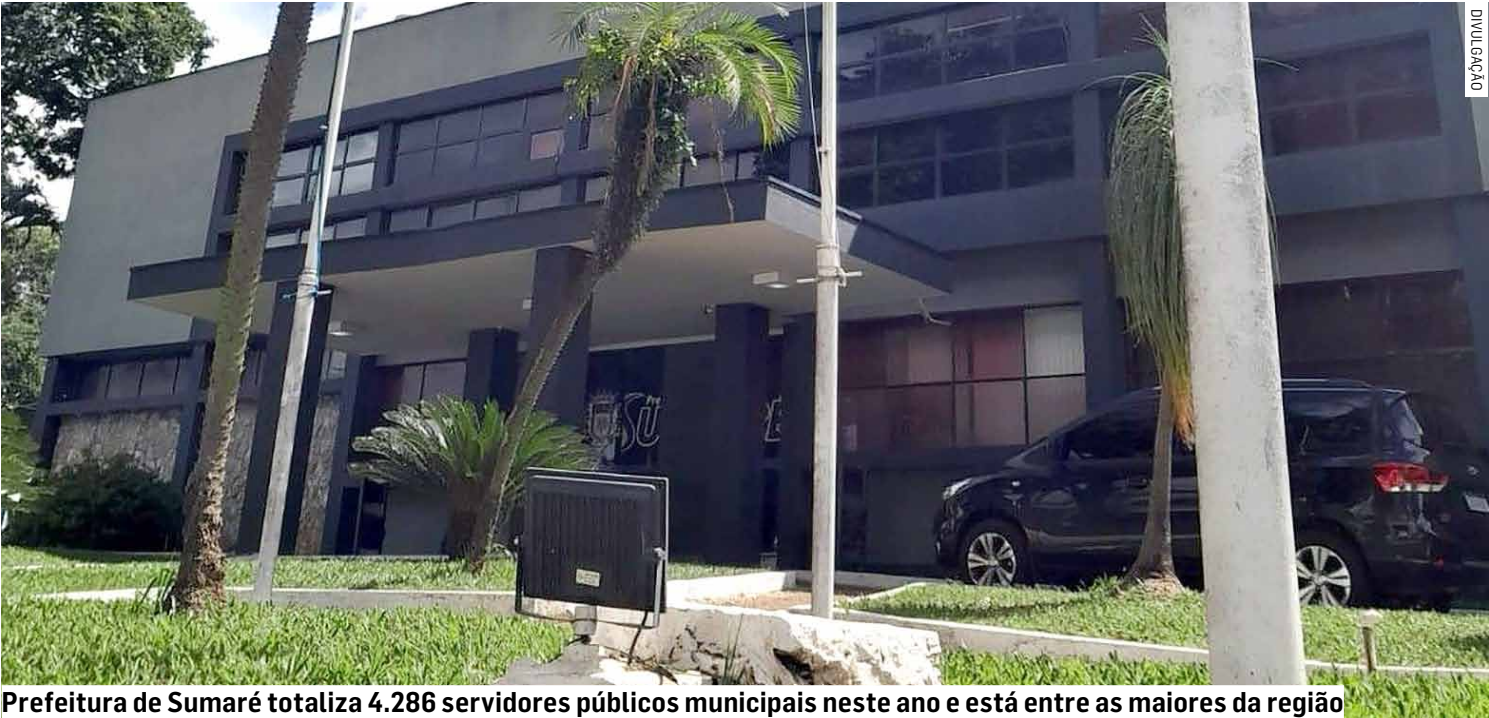
Prefeitura de Sumaré totaliza 4.286 servidores públicos municipais neste ano e está entre as maiores da região

Executivos de Sumaré, Paulínia, Nova Odessa, Americana, Hortolândia e Monte Mor celebram Dia do Servidor Público; região totaliza 24.129 funcionários ativos, responsáveis por garantir atendimento aos moradores; sindicato faz balanço positivo