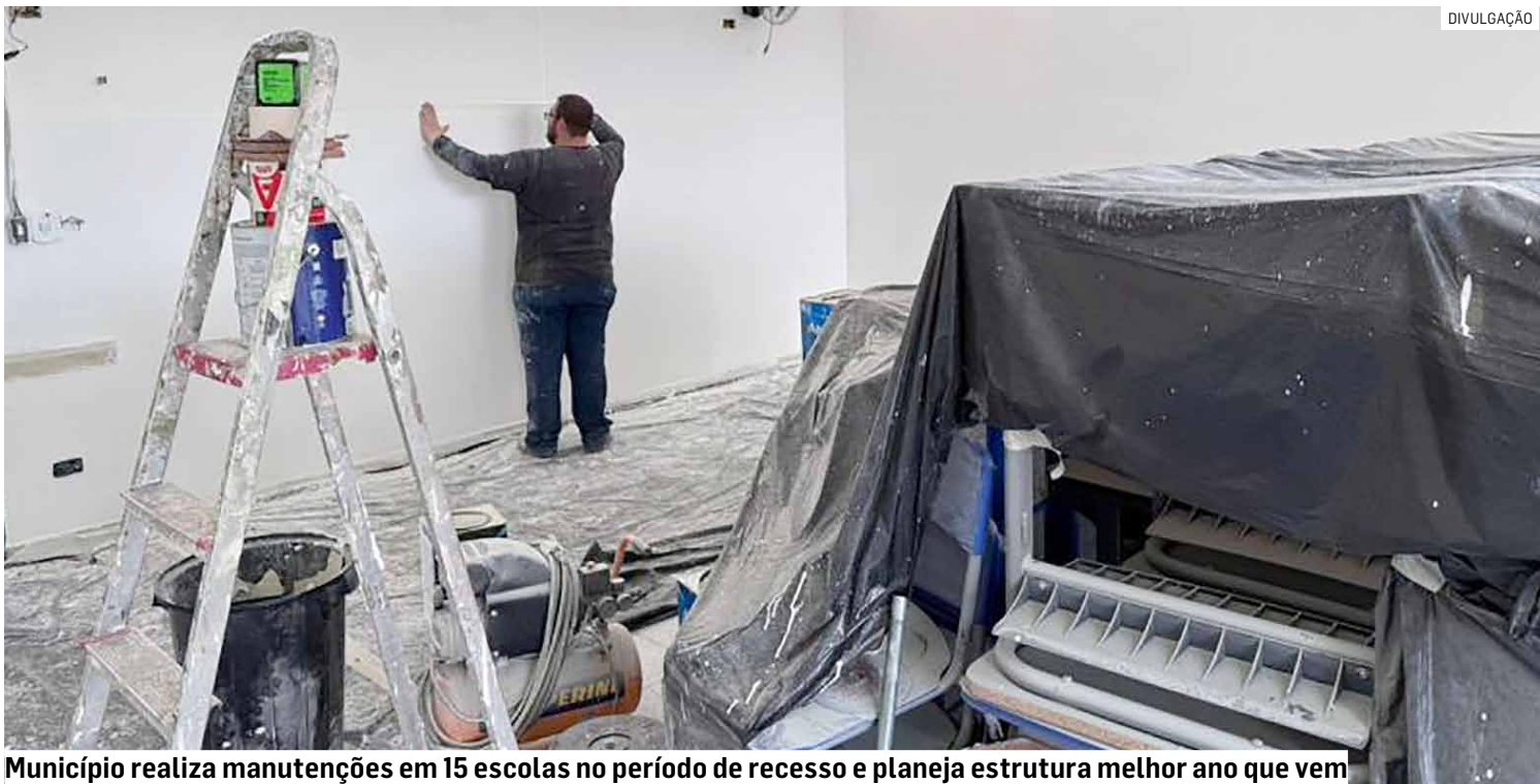
Município realiza manutenções em 15 escolas no período de recesso e planeja estrutura melhor ano que vem