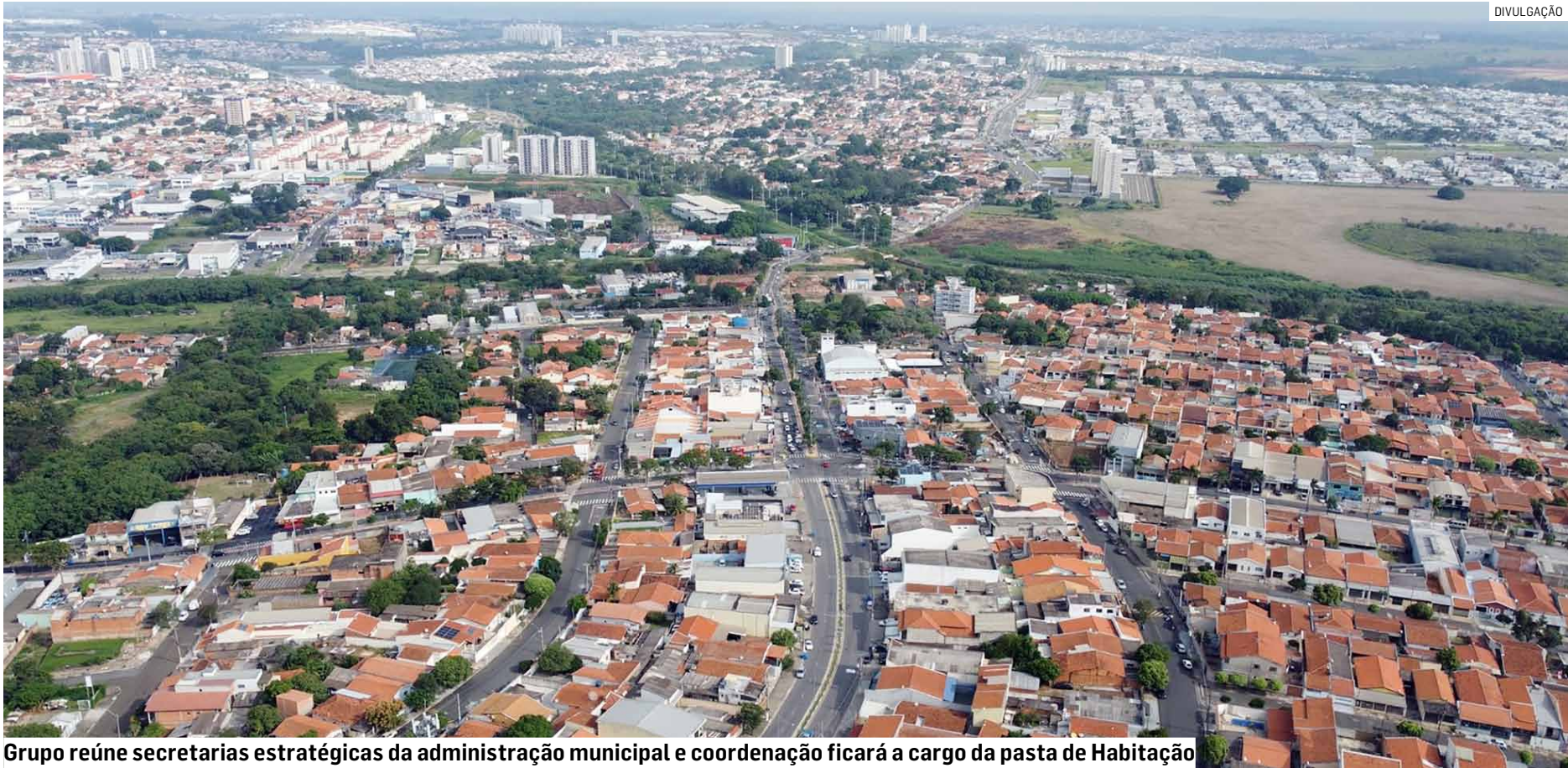
Grupo reúne secretarias estratégicas da administração municipal e coordenação ficará a cargo da pasta de Habitação

O colegiado será composto por representantes