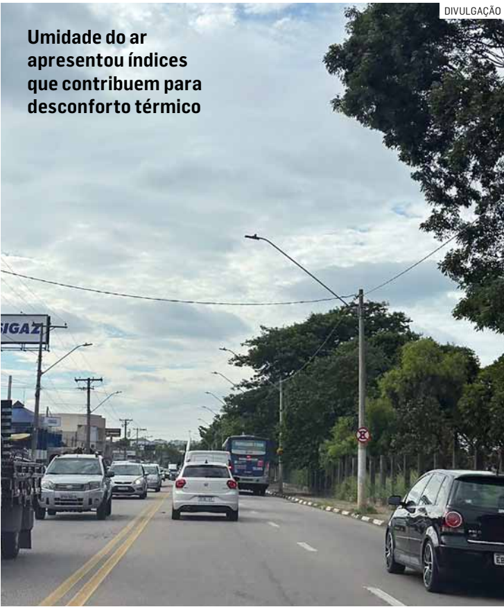
Umidade do ar apresentou índices que contribuem para desconforto térmico

Paulo Medina • SUMARÉ tribunaliberal@tribunaliberal.com.br