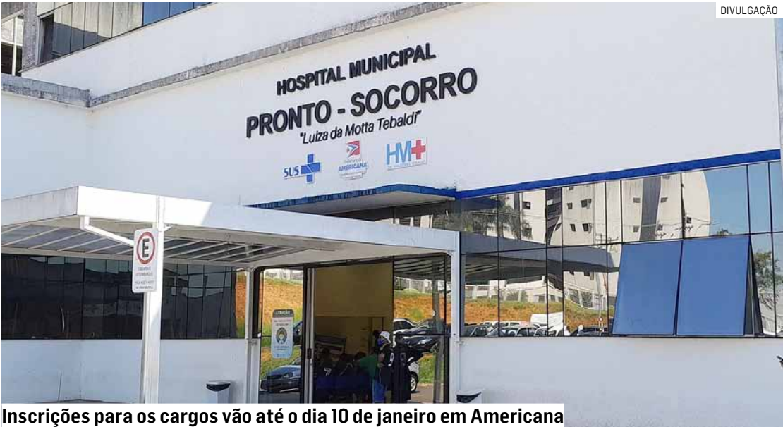
Inscrições para os cargos vão até o dia 10 de janeiro em Americana

janeiro. O Hospital Municipal e a Unacon são administrados pelo Grupo Chavantes, por meio de gestão compartilhada com a Secretaria Municipal de Saúde da Prefeitura de Americana.