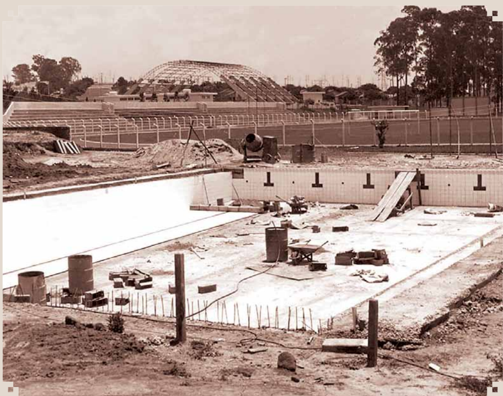
Foto da construção da piscina do Centro Esportivo "Vereador José Pereira", que acabou inaugurado no dia 26 de julho de 1974, no segundo governo de João Smânio Franceschini. O início da construção do Centro foi no dia 8 de novembro de 1973.