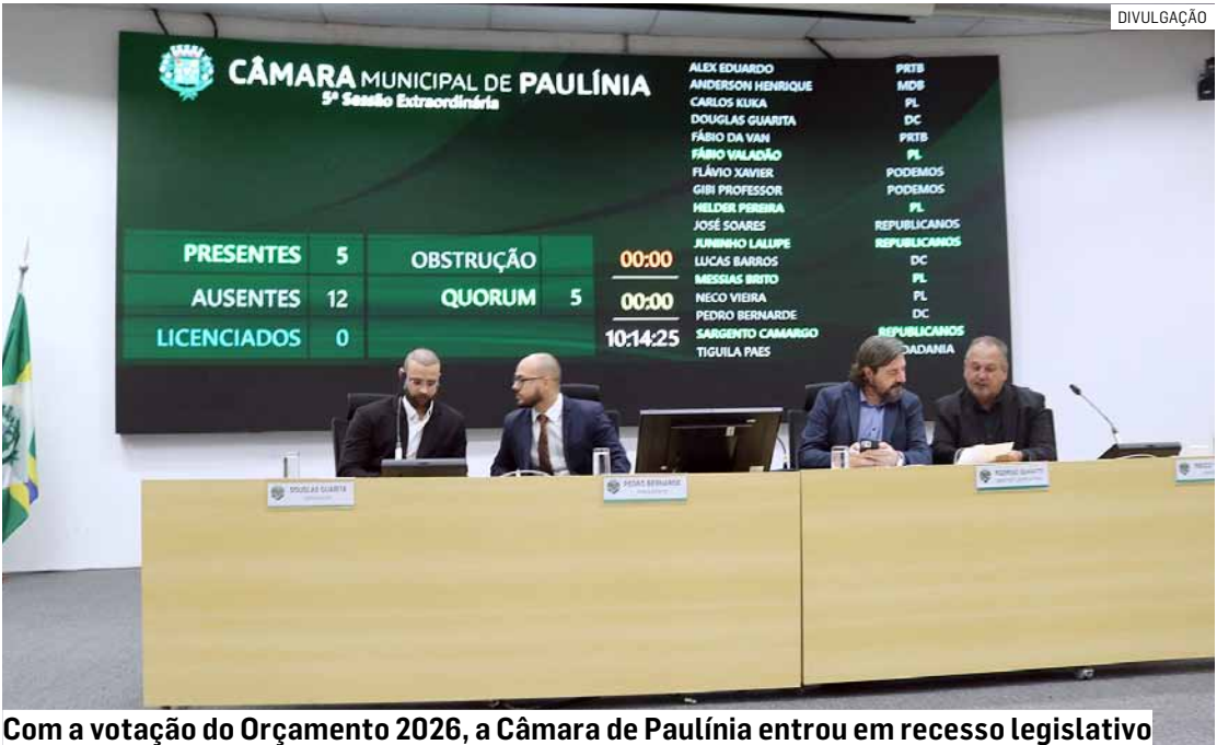
Com a votação do Orçamento 2026, a Câmara de Paulínia entrou em recesso legislativo

Da Redação • PAULÍNIA tribunaliberal@tribunaliberal.com.br