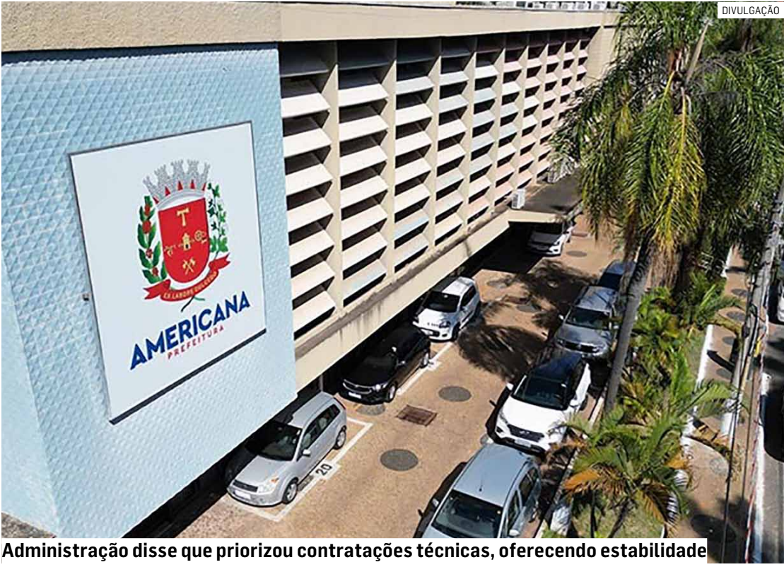
Administração disse que priorizou contratações técnicas, oferecendo estabilidade