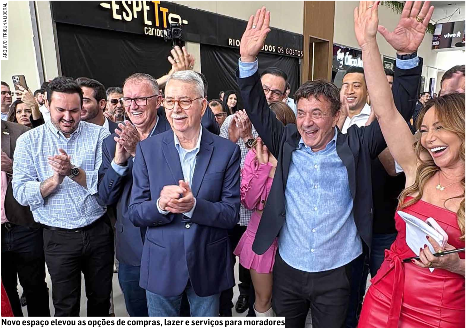
Novo espaço elevou as opções de compras, lazer e serviços para moradores

“A inauguração do Americana Shopping confirma que nossa cidade está preparada para receber grandes investimentos. É um empreendimento que gera empregos, movimentação a economia e amplia as opções de lazer e serviços para a população. Estamos criando um ambiente cada vez mais favorável ao desenvolvimento e ao cresci-