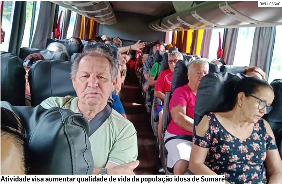
Atividade visa aumentar qualidade de vida da população idosa de Sumaré

Da Redação • SUMARÉ tribunaliberal@tribunaliberal.com.br