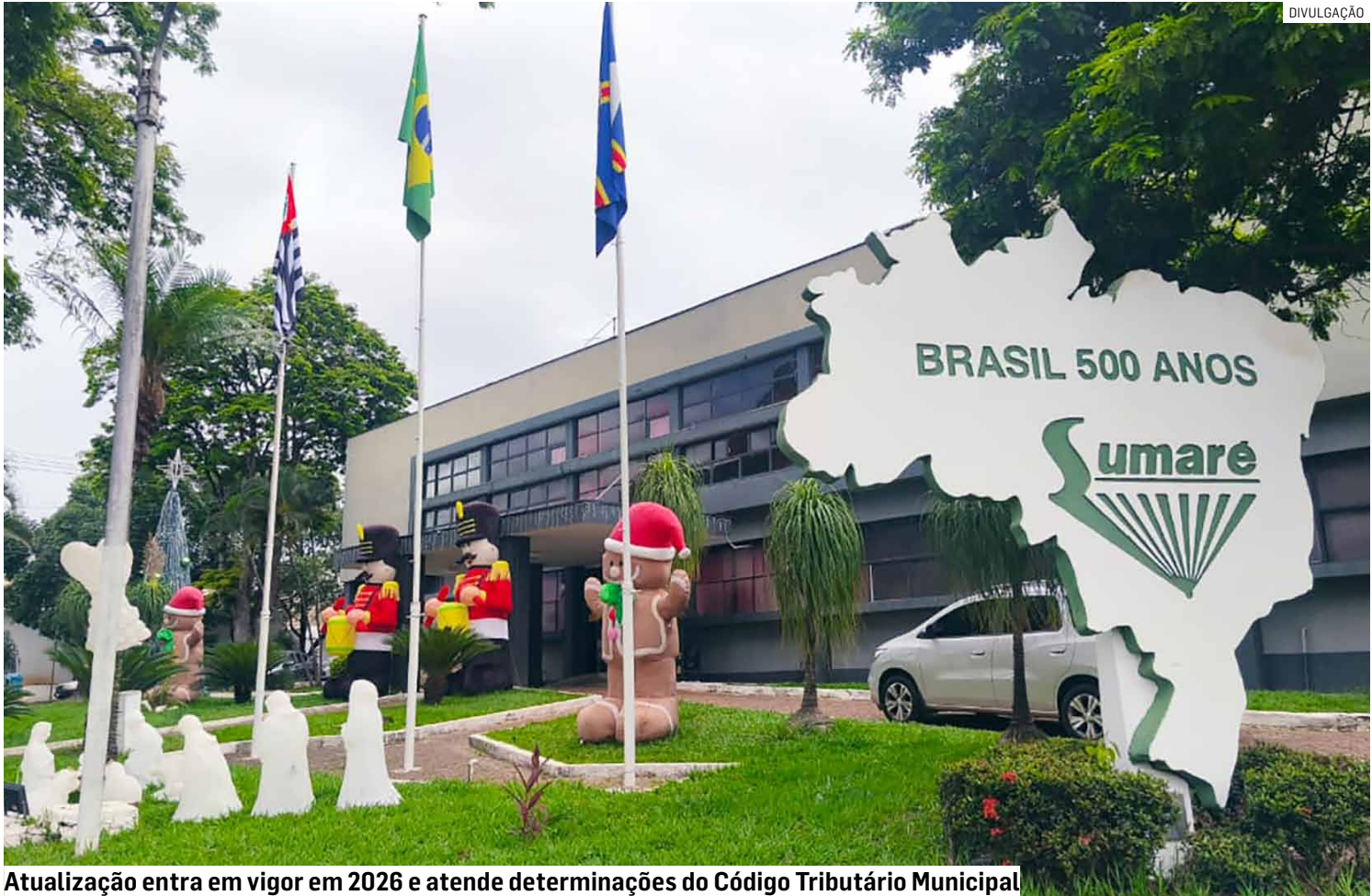
Atualização entra em vigor em 2026 e atende determinações do Código Tributário Municipal

De acordo com o decreto, a UFMS será corrigida em 4,86%, percentual correspondente à variação do índice adotado, passando a ter o valor fixado em R$ 6,45