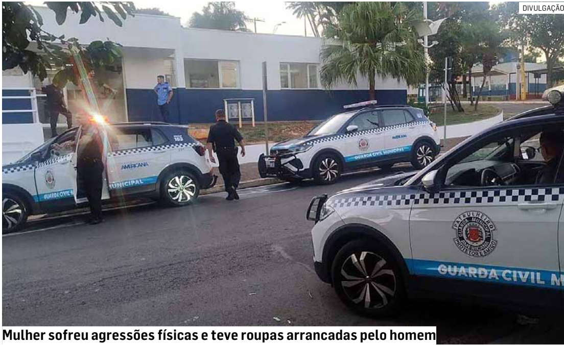
Mulher sofreu agressões físicas e teve roupas arrancadas pelo homem

Segundo a corporação, a equipe foi acionada após a entrada da vítima na unidade de saúde com sinais evidentes de agressão. No local, os agentes fizeram contato com a mulher, que relatou ter sido atacada pelo companheiro durante a madrugada.