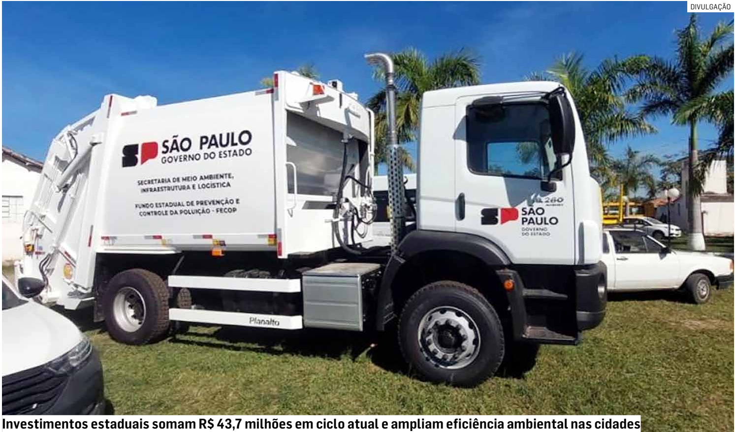
Investimentos estaduais somam R$ 43,7 milhões em ciclo atual e ampliam eficiência ambiental nas cidades

“Além de assegurar a entrega de equipamentos essenciais aos municípios, a iniciativa consolida políticas públicas estruturadas, priorizando cidades já en-