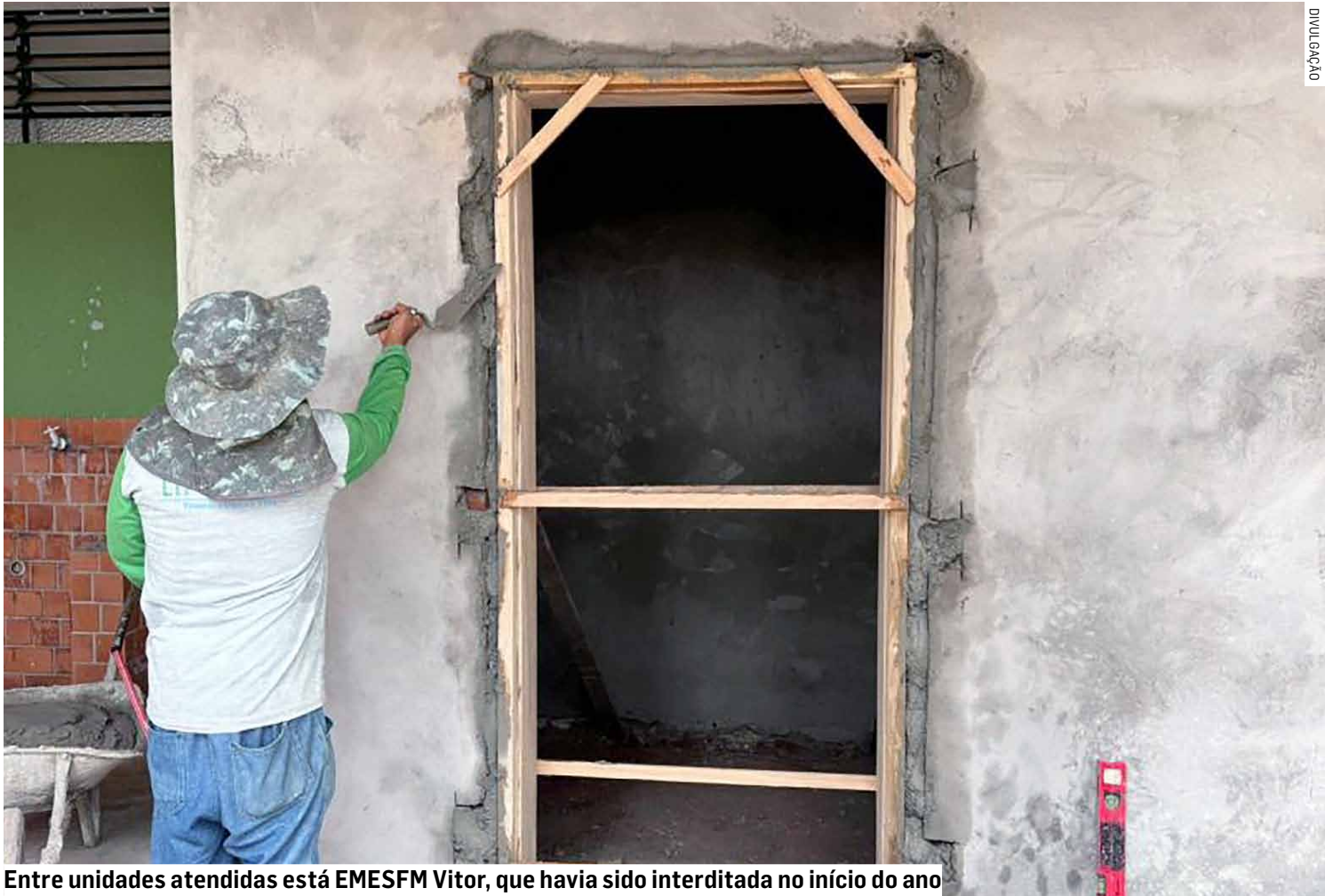
Entre unidades atendidas está EMESFM Vitor, que havia sido interditada no início do ano

Entre as unidades contempladas está a EMESFM Vitor Szczepanski e Souza e Silva, que passará por adequações para que os alunos possam retornar ao prédio