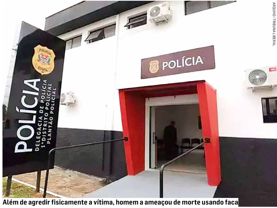
Além de agredir fisicamente a vítima, homem a ameaçou de morte usando faca

A vítima foi socorrida e encaminhada para atendimento médico. De acordo com a Secretaria de Segurança Pública de São Paulo (SSP-SP), ela permaneceu em observação, sem informações detalhadas sobre o estado de saúde. O agressor foi levado à Delegacia de Polícia, onde permaneceu à disposição da Justiça. O caso segue sob investigação da Polícia Civil, que apura as circunstâncias do crime.