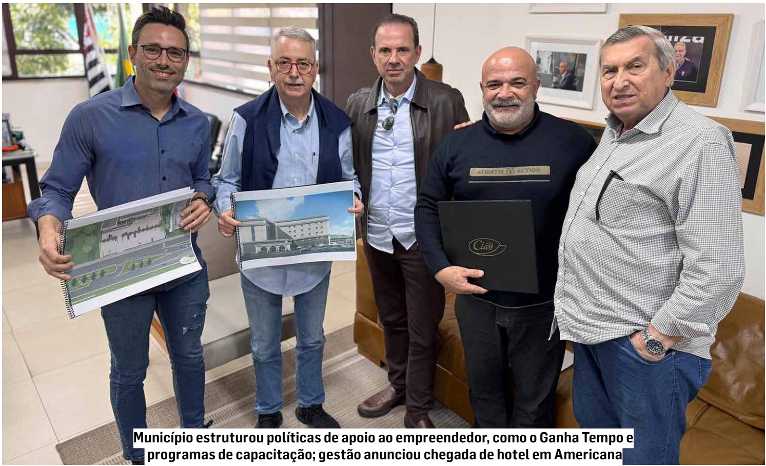
Município estruturou políticas de apoio ao empreendedor, como o Ganha Tempo e programas de capacitação; gestão anunciou chegada de hotel em Americana

A Secretaria de Desenvolvimento Econômico tem desempenhado papel essencial nesse avanço. Programas como o SEBRAE