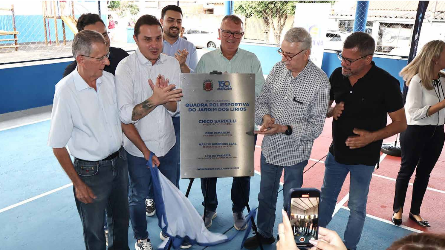
Investimentos ampliaram prática esportiva e convivência familiar nos espaços públicos; município quer atender todas regiões

Mais de 20 praças receberam melhorias estruturais, paisagísticas e funcionais e foram implantados equipamentos de esporte, academias ao ar livre e Espaços Pet Legal; quadras, campos, pistas e ginásios também passaram por reformas