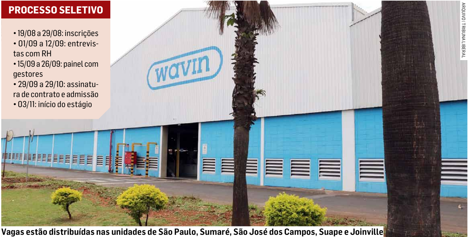
Vagas estão distribuídas nas unidades de São Paulo, Sumaré, São José dos Campos, Suape e Joinville

O estágio tem duração máxima de dois anos e contempla atuação em diferentes áreas da companhia, como Administração Pessoal, Business Partner, Comunicação, Comercial, Engenharia, Financeiro, Qualidade, Recrutamento e Seleção, Treinamento e Desenvolvimento e Jurídico.