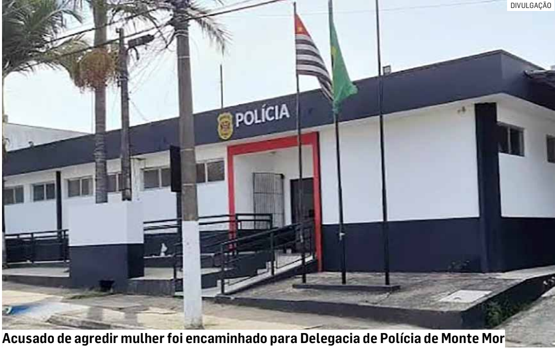
Acusado de agredir mulher foi encaminhado para Delegacia de Polícia de Monte Mor

De acordo com a irmã da vítima, o agressor desferiu socos e tapas contra a mulher e a ameaçou com uma faca. Em seguida, tentou derramar álcool e ga-