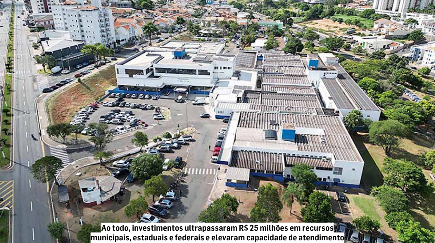
Ao todo, investimentos ultrapassaram R$ 25 milhões em recursos municipais, estaduais e federais e elevaram capacidade de atendimento