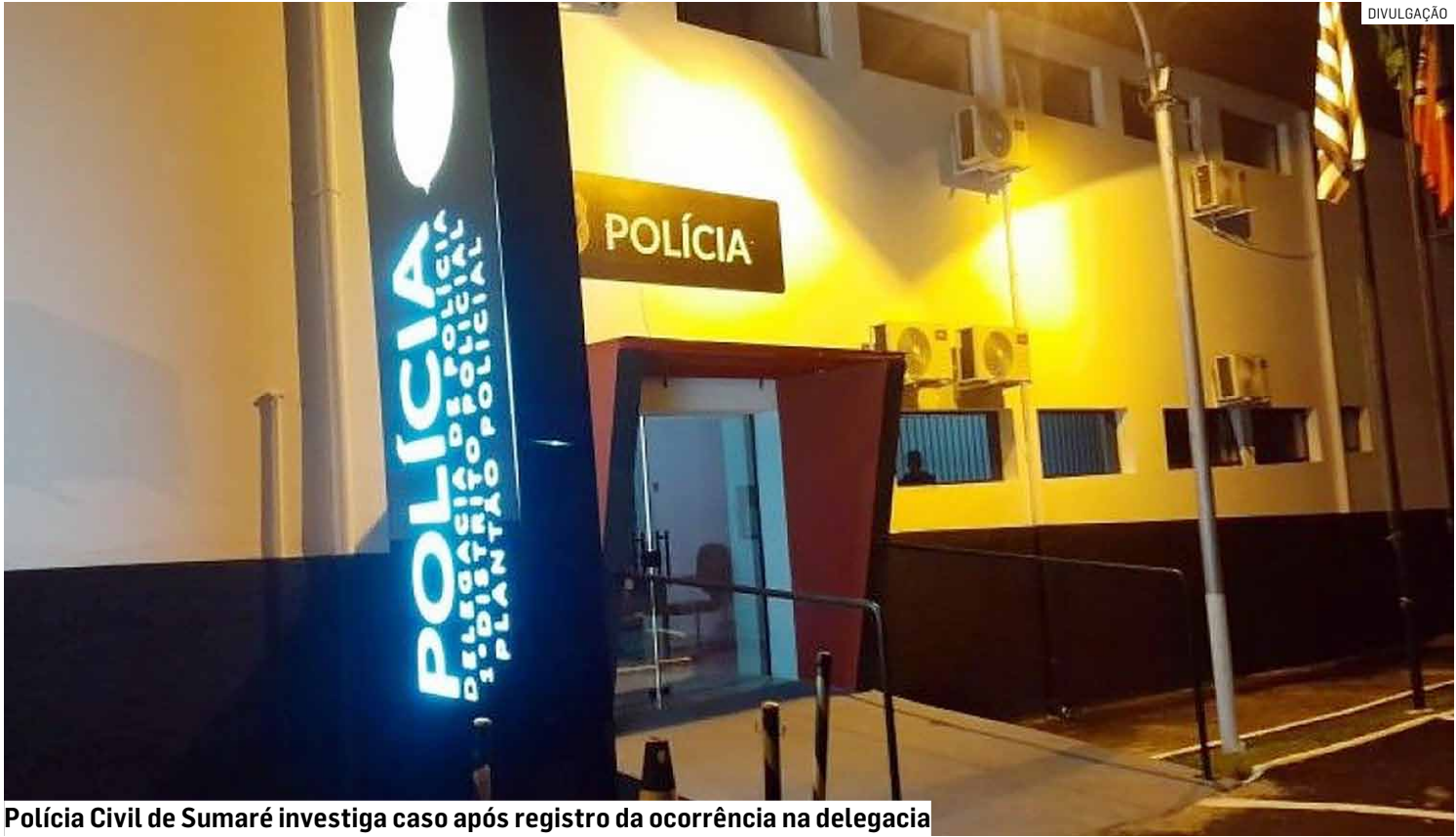
Polícia Civil de Sumaré investiga caso após registro da ocorrência na delegacia

Outro participante, identificado como policial militar aposentado, interveio rapidamente e conseguiu conter o policial penal até a chegada da Polícia Militar, evitando que a