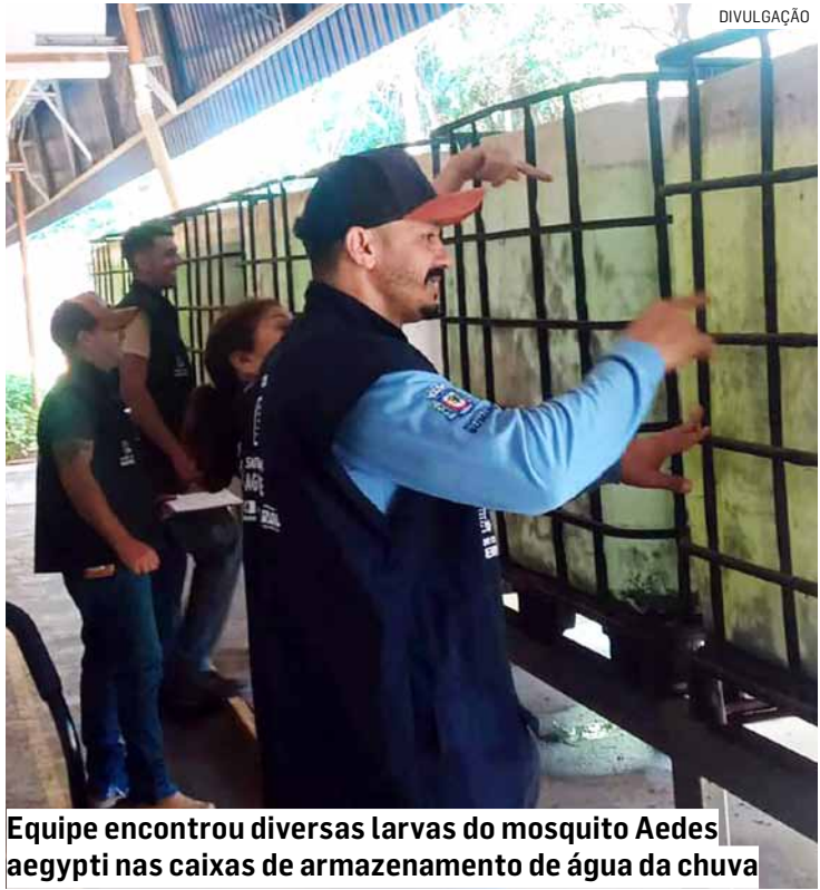
Equipe encontrou diversas larvas do mosquito Aedes aegypti nas caixas de armazenamento de água da chuva

Até o momento, foram registradas 8.531 notificações de dengue, das quais 5.665 foram confirmadas como casos positivos. Quinze casos evoluíram para óbito em decorrência da doença.