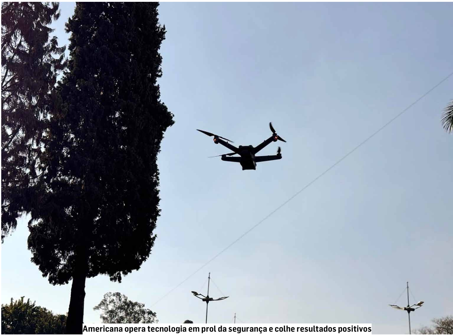
Americana opera tecnologia em prol da segurança e colhe resultados positivos

Todos esses recursos estão conectados ao CSI (Centro de Segurança e Inteligência), que reúne e