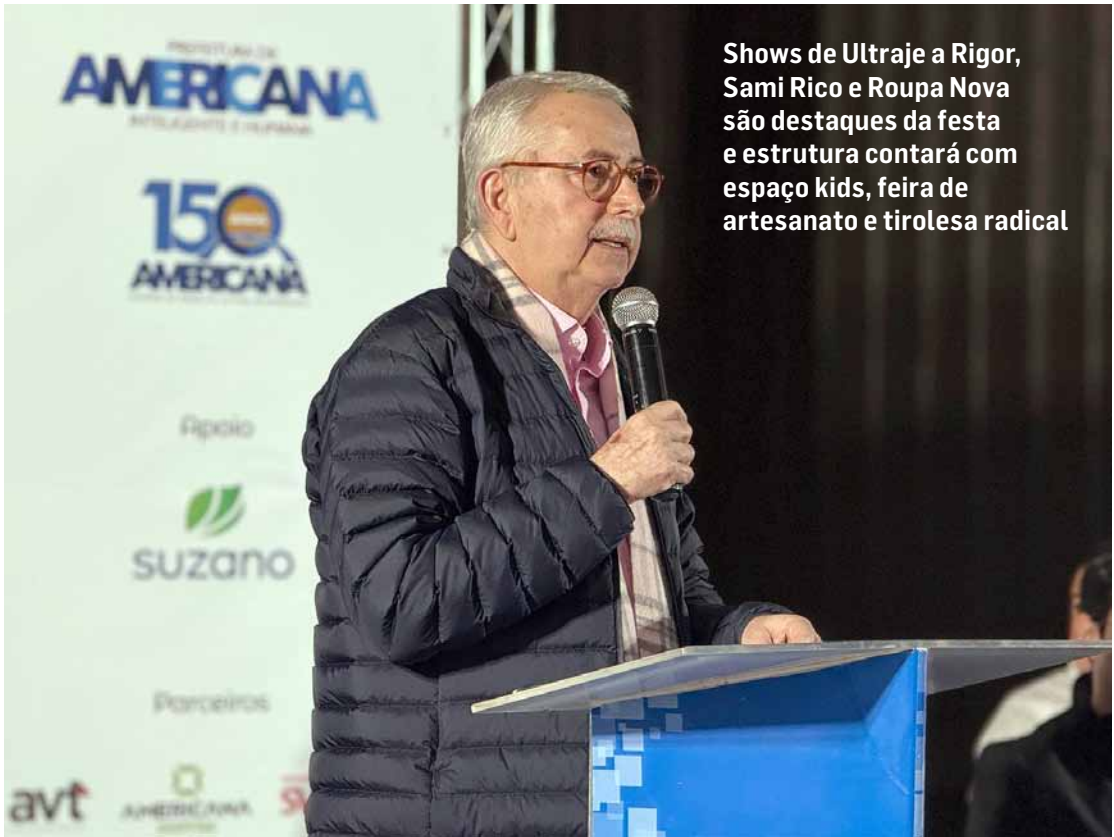
Shows de Ultraje a Rigor, Sami Rico e Roupas Nova são destaques da festa e estrutura contará com espaço kids, feira de artesanato e tirolesa radical