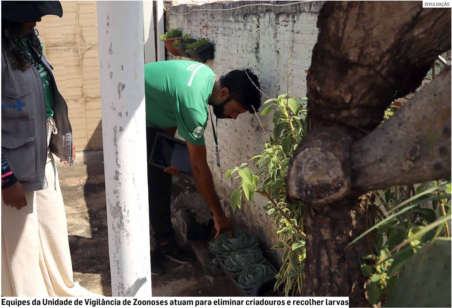
Equipes da Unidade de Vigilância de Zoonoses atuam para eliminar criadouros e recolher larvas

Para conter a proliferação do Aedes aegypti, a prefeitura disse que realiza nesta semana busca ativa em três regiões: Jardim Nova Hortolândia, Vila América e o condomínio Jardim Jatobá. Durante as visitas, as equipes inspecionam imóveis, eliminam criadouros e recolhem amos- tras de larvas para análise em laboratório. O objetivo é interromper o ciclo de reprodução ainda na fase lar- val, evitando que o mosqui- to atinja a fase adulta.