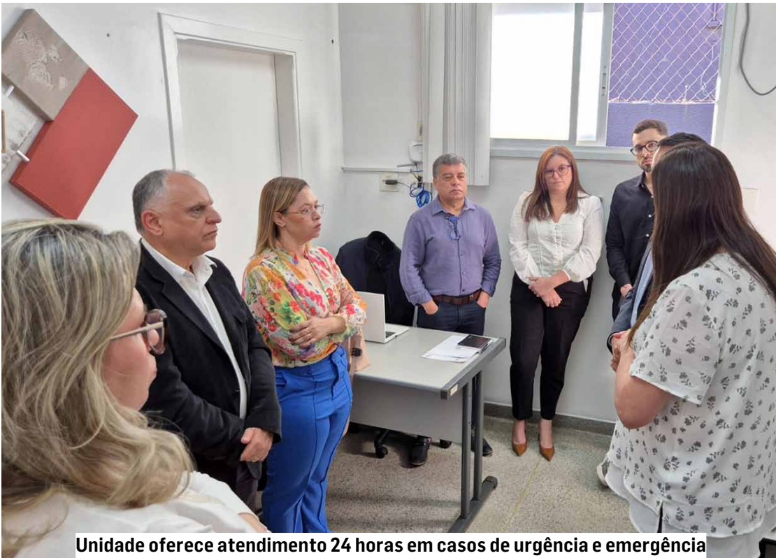
Unidade oferece atendimento 24 horas em casos de urgência e emergência

O valor total do contrato com o INDSH é de R$ 17.076.129,63, incluindo o custeio mensal da unidade, a aquisição de equipamentos e materiais permanentes e a execução das obras. Assinado no dia 25 de julho, o contrato tem validade inicial de um ano, com possibilidade de renovação por até cinco anos.