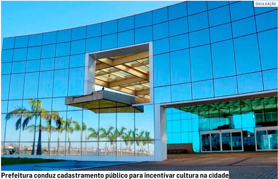
Prefeitura conduz cadastramento público para incentivar cultura na cidade