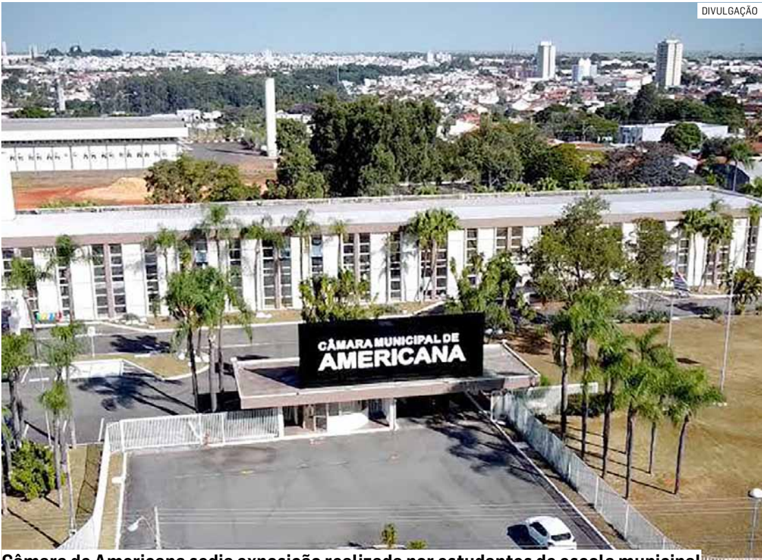
Câmara de Americana sedia exposição realizada por estudantes de escola municipal