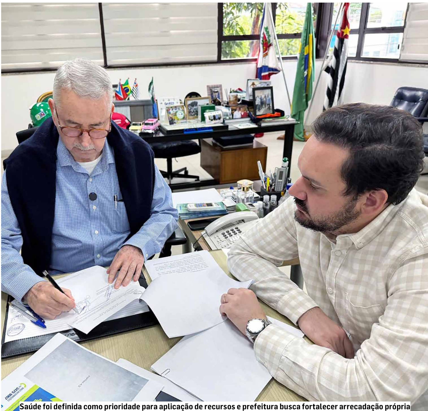
Saúde foi definida como prioridade para aplicação de recursos e prefeitura busca fortalecer arrecadação própria

A pasta ressalta que a saúde pública foi escolhida como área prioritária para investimentos. O planejamento incluiu a definição de projetos estratégicos, a busca por convênios e emendas parlamentares e a aplicação de recursos próprios. Esse conjunto de medidas permitiu manter e ampliar serviços de atendimento à população.