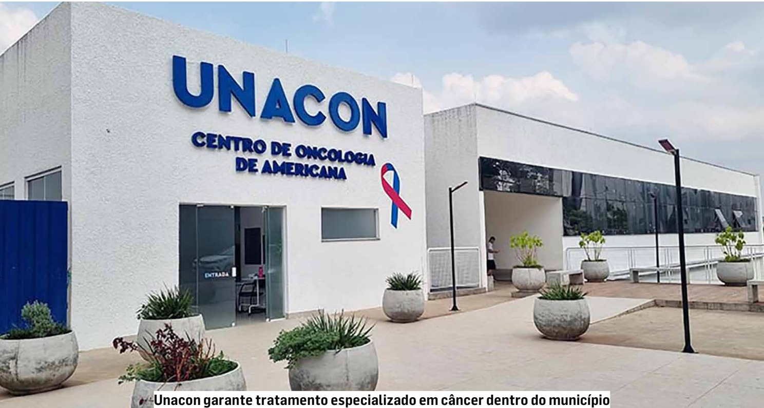
Unacon garante tratamento especializado em câncer dentro do município