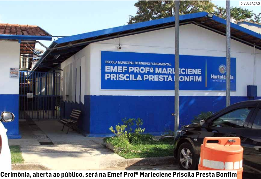
Cerimônia, aberta ao público, será na Emef Profª Marleciene Priscila Presta Bonfim

Além dos casos de den- gue, a UVZ informou que o município registrou, em 2025, 25 notificações de chikungunya, com dois casos confirmados e ne- nhum óbito. Em relação ao vírus zika, não há ca- sos ou mortes confirma- das neste ano.