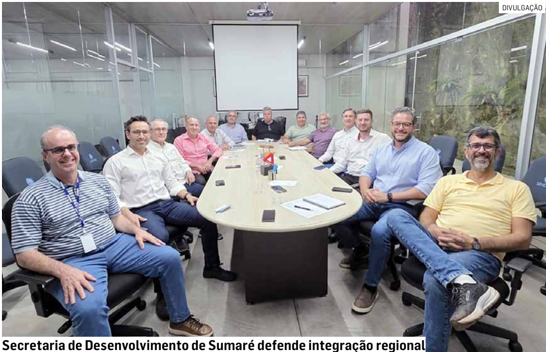
Secretaria de Desenvolvimento de Sumaré defende integração regional

A Secretaria de Trabalho, Emprego, Geração de Renda e Desenvolvimento Econômico de Sumaré participou recentemente de uma reunião no Sinditec (Sindicato das Indústrias Têxteis de Americana e Região). O encontro teve como foco o alinhamento da governança e a definição das próximas ações da Cadeia Produtiva Local Consolidada (CPL) Têxtil e Confecção, reconhecida pelo Governo do Estado dentro do programa SP Produz.