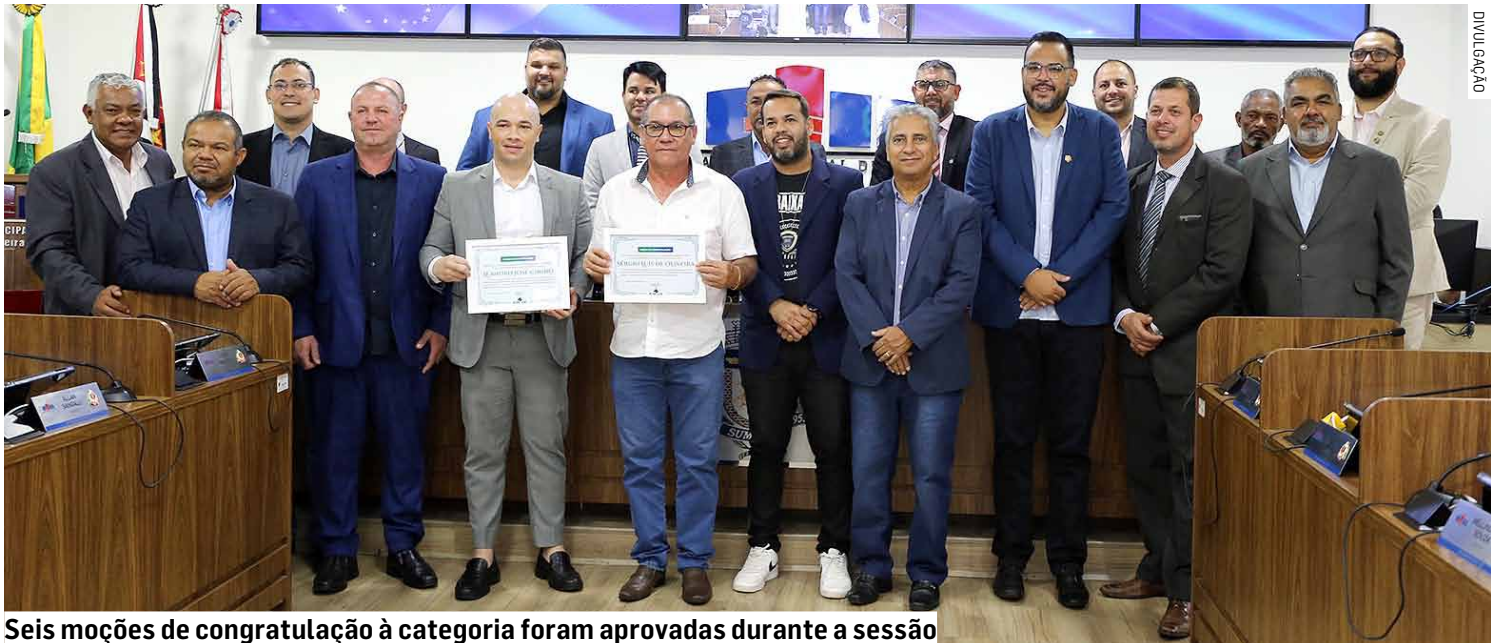
Seis moções de congratulação à categoria foram aprovadas durante a sessão