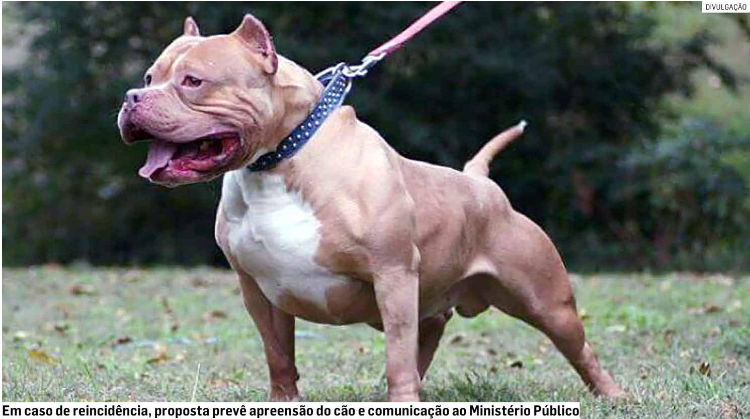
Em caso de reincidência, proposta prevê apreensão do cão e comunicação ao Ministério Público

De acordo com o texto, a circulação desses animais em ruas, praças, parques, jardins e áreas de lazer só será permitida com o uso simultâneo de guia curta, enforcador e focinheira, conduzidos por maiores de 18 anos, com condições físicas e mentais para controlar o cão. Além disso, os tutores