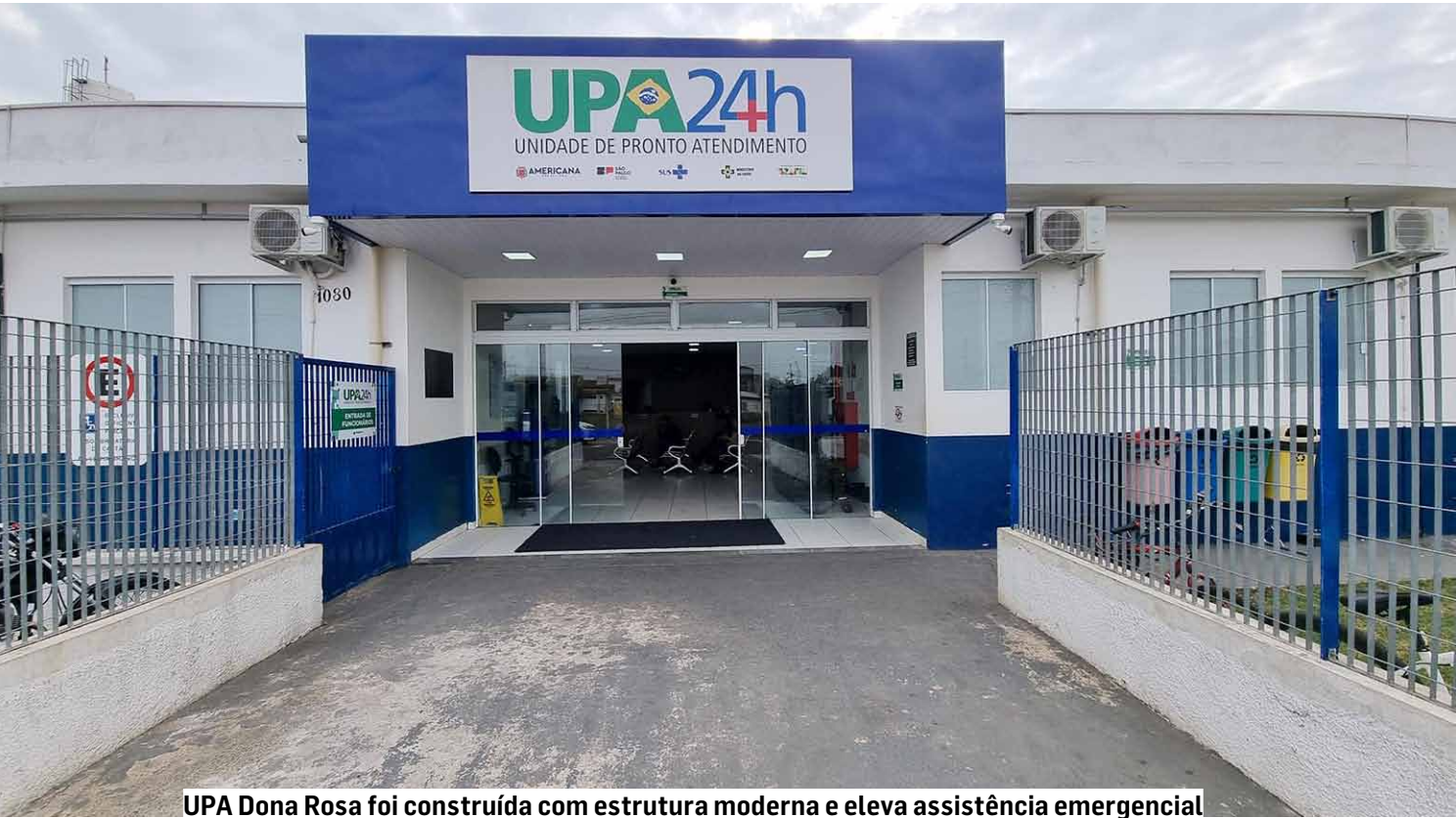
UPA Dona Rosa foi construída com estrutura moderna e eleva assistência emergencial

Revitalização da UPA São José e a inauguração da UPA Dona Rosa modernizaram a rede de urgência; Hospital Municipal Dr. Waldemar Tebaldi recebeu reformas estruturais e melhorias internas; foram entregues também novas UBSs nos bairros