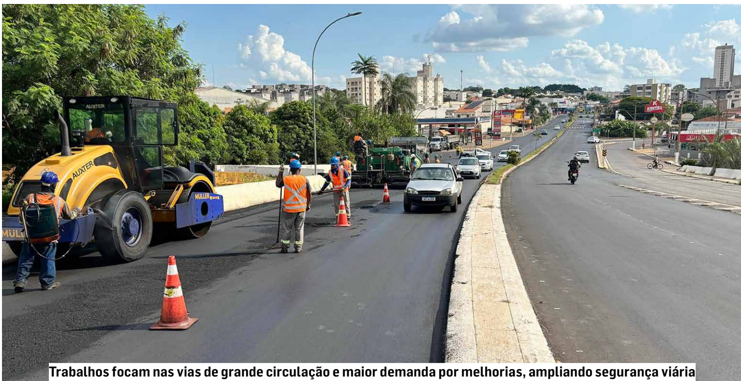
Trabalhos focam nas vias de grande circulação e maior demanda por melhorias, ampliando segurança viária

Ao todo, mais de 190 ruas e avenidas foram recapeadas e mais de 40 receberam pavimentação, além do serviço constante de tapa-buracos em todos os bairros. Entre as principais vias que passaram por melhorias estão a Avenida Carmine Feola, Avenida Florindo Cibin, Avenida Nove de Julho, Avenida