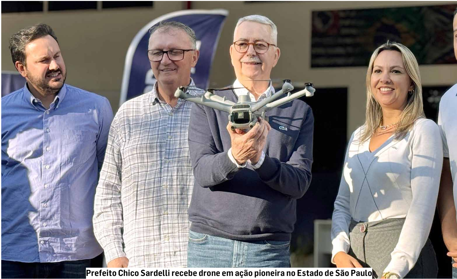
Prefeito Chico Sardelli recebe drone em ação pioneira no Estado de São Paulo

O prefeito Chico Sardelli (PL) apresentou dia 11 de agosto o mais novo reforço da Guarda Municipal no combate à criminalidade: o drone DJI Matrice 3TD, aparelho de última geração utilizado no Patrulhamento Aéreo, para mapeamentos, inspeções e monitoramento de segurança no município. Americana é a segunda cidade do Brasil e a primeira do Estado de São Paulo a adotar essa tecnologia na área da segurança pública.