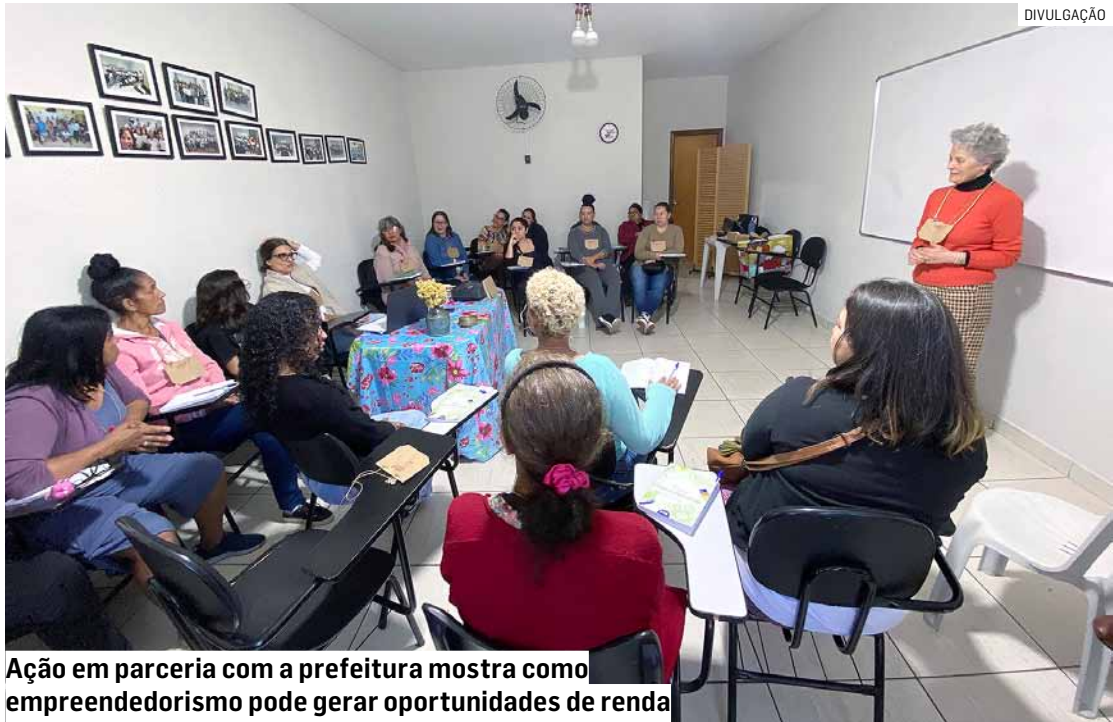
Ação em parceria com a prefeitura mostra como empreendedorismo pode gerar oportunidades de renda

“Mais do que ensinar a produzir cosméticos naturais, o projeto ajuda cada participante a compreender que aquilo que cria tem valor, que é resultado de sua história, de seus