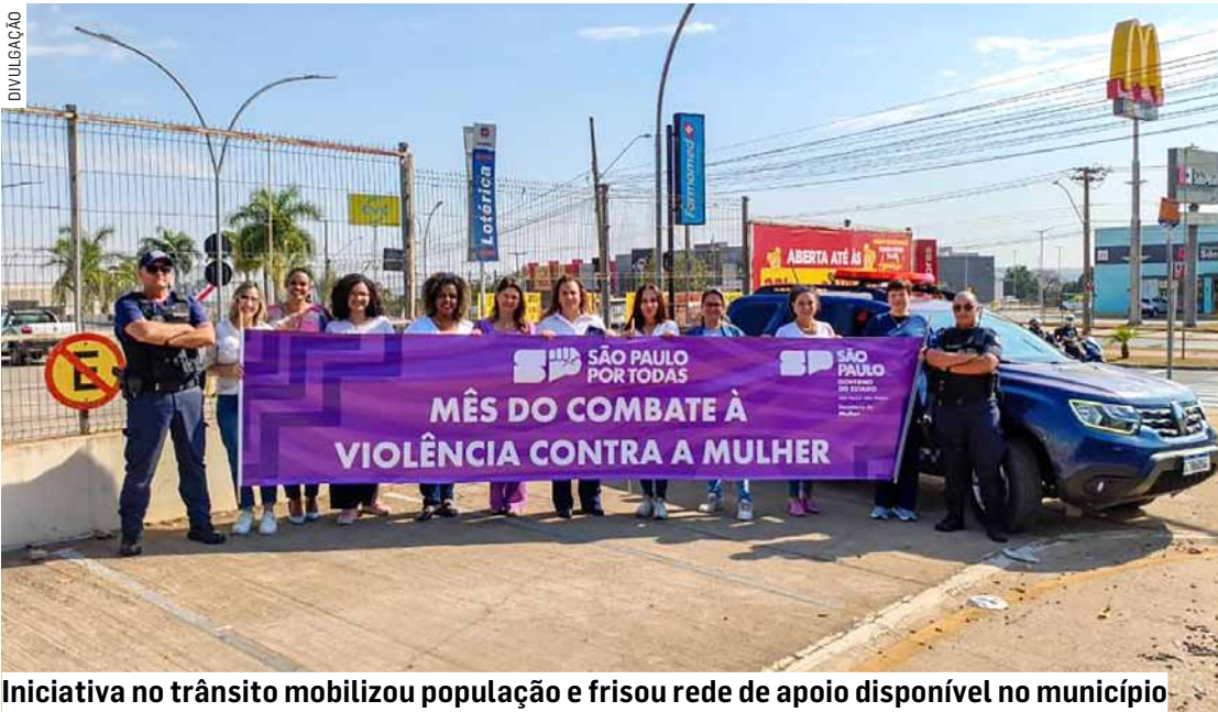
Iniciativa no trânsito mobilizou população e frisou rede de apoio disponível no município

Da Redação • NOVA ODESSA tribunaliberal@tribunaliberal.com.br