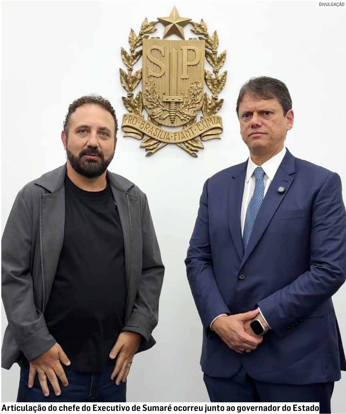
Articulação do chefe do Executivo de Sumaré ocorreu junto ao governador do Estado

Após articulação do prefeito junto ao governador Tarcísio de Freitas, unidade policial da Avenida Rebouças terá estrutura mantida na cidade; medida assegura maior presença de policiais nas ruas, diz governo municipal