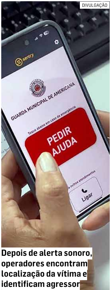
Depois de alerta sonoro, operadores encontram localização da vítima e identificam agressor

O dispositivo está inserido no trabalho desenvolvido pelo IDMAS (Inspe-