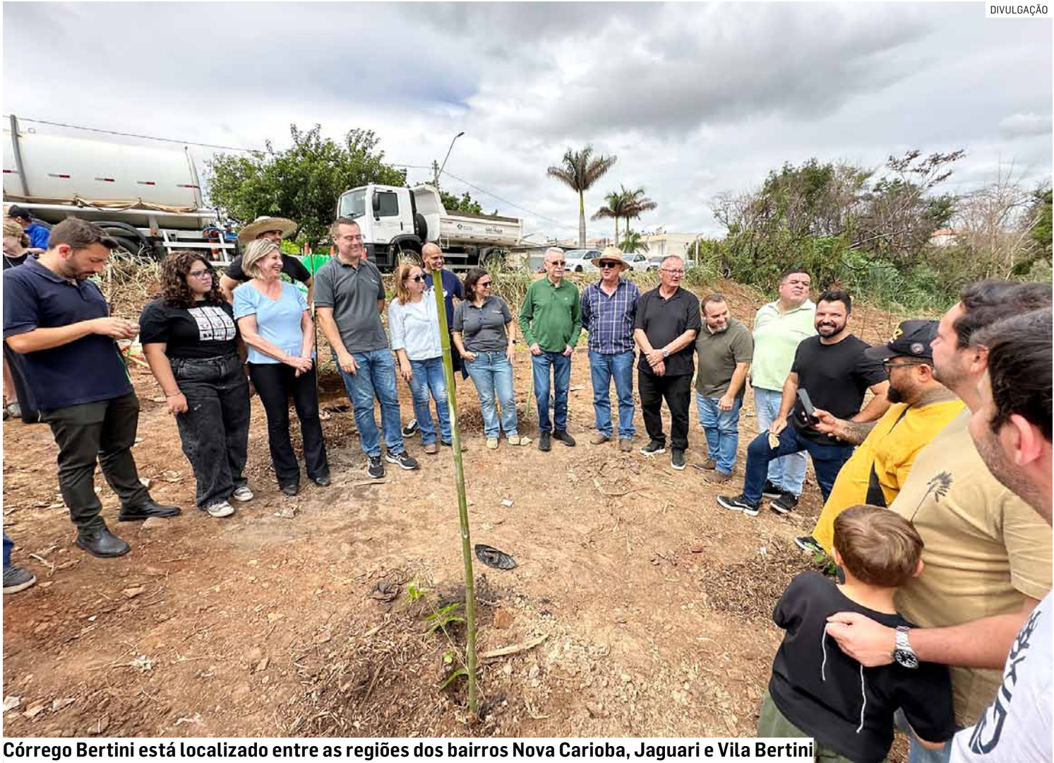
Córrego Bertini está localizado entre as regiões dos bairros Nova Carioba, Jaguarí e Vila Bertini