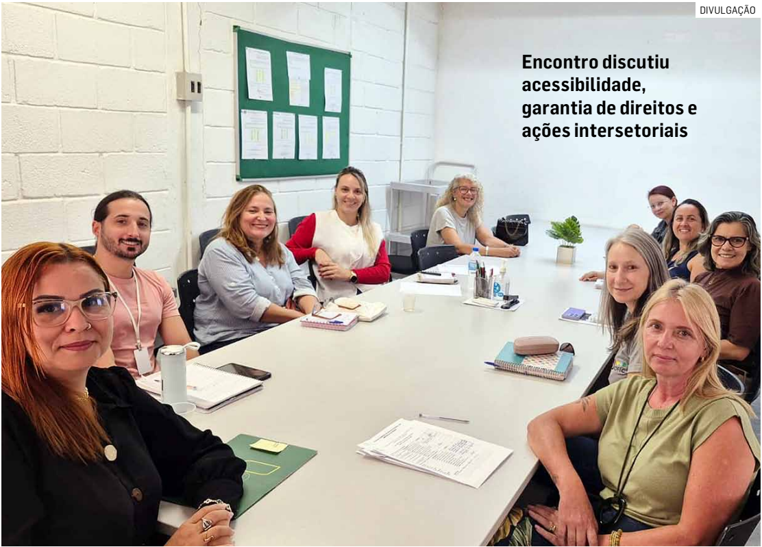
Encontro discutiu acessibilidade, garantia de direitos e ações intersetoriais

Segundo a pasta, a reunião foi marcada ainda pela troca de experiências entre os conselheiros, pela escuta qualificada das demandas apresentadas e pelo alinhamento de propostas que buscam ampliar a participação social e fortalecer o controle social das ações governamentais.