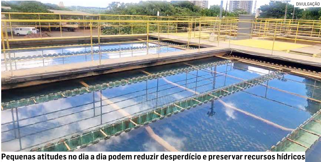
Pequenas atitudes no dia a dia podem reduzir desperdício e preservar recursos hídricos