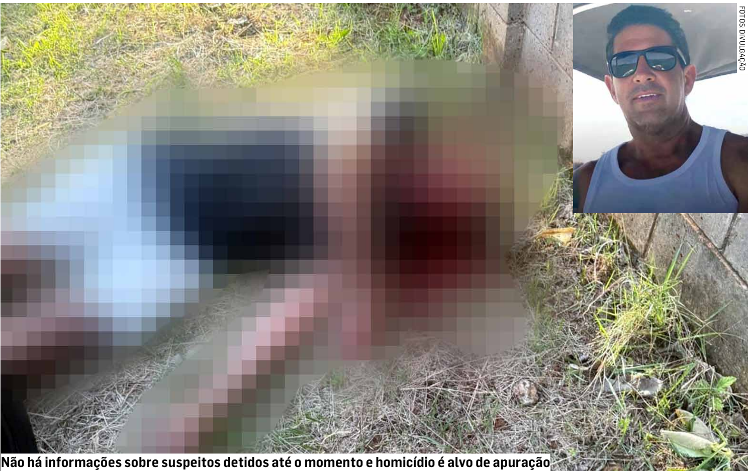
Não há informações sobre suspeitos detidos até o momento e homicídio é alvo de apuração

A Polícia Militar isolou a área para preservar o local até a chegada dos demais órgãos responsáveis pelos procedimentos de investigação.