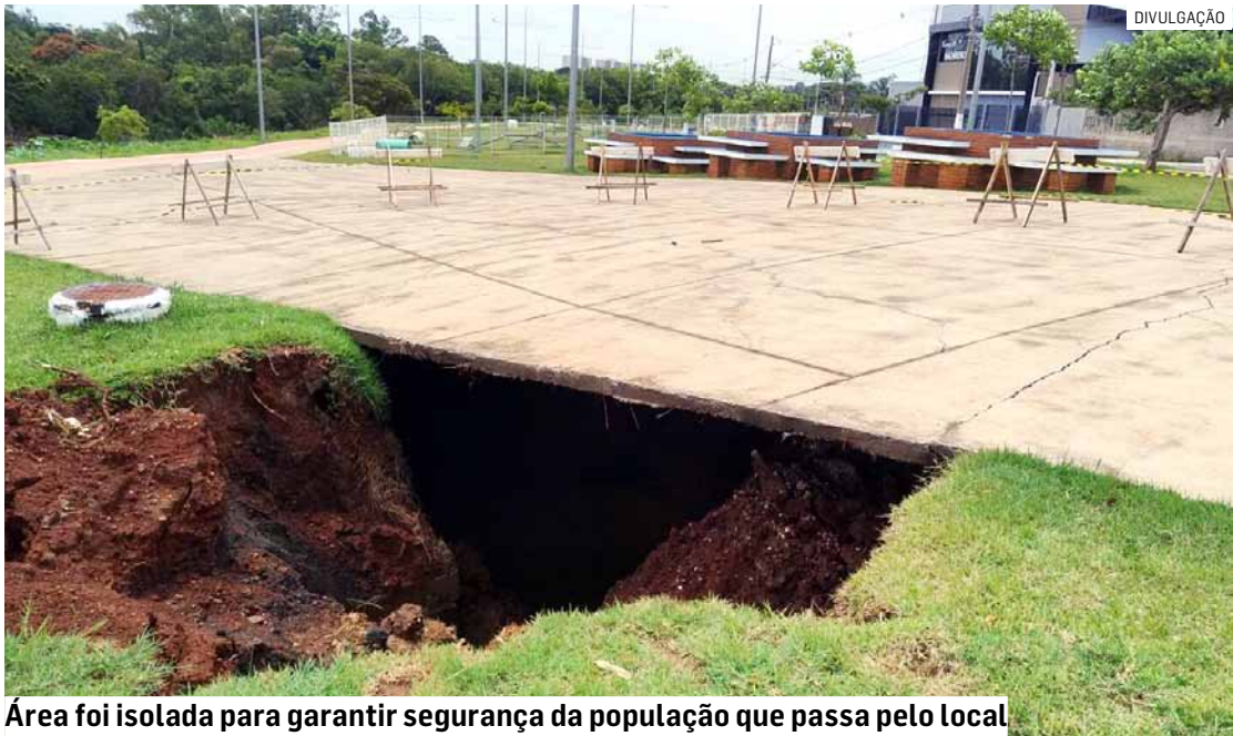
Área foi isolada para garantir segurança da população que passa pelo local

Além do serviço no Parque Lago da Fé, outros espaços receberam o trabalho que garante o bom funcionamento dos sistemas subterrâneos de esgoto e