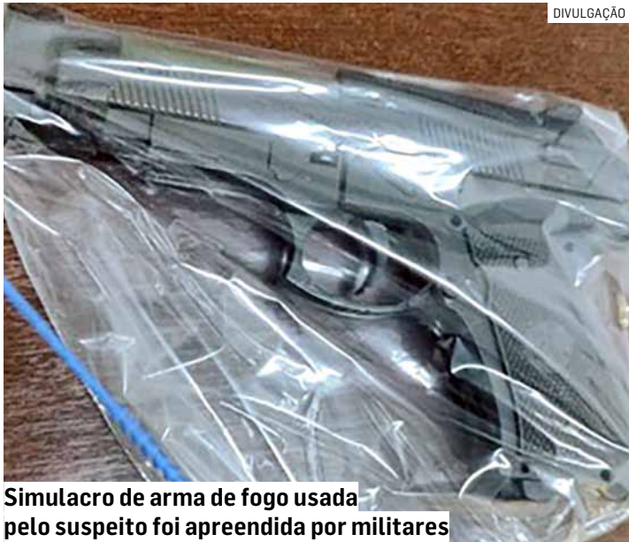
Simulacro de arma de fogo usada pelo suspeito foi apreendida por militares

Ainda no interior do local, o indivíduo realizou um