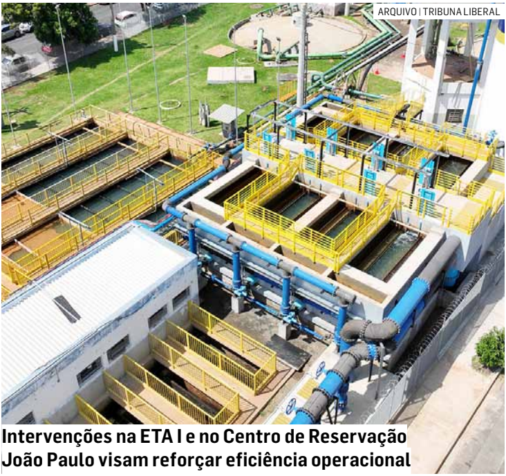
Intervenções na ETA I e no Centro de Reservação João Paulo visam reforçar eficiência operacional

ros: Centro, Horto Florestal, Jardim Eldorado, Jardim Marchissolo, Jardim Paulista, Jardim Residencial Ravagnani, Jardim Residencial Veccon, Jardim São Carlos, Jardim São José, Jardim São Rocchi, Parque Emília, Parque Franceschini, Parque Ongaro, Parque Residencial Casarão, Parque Residencial Florença, Parque Versailles, Planalto do Sol, Residencial Amália Luiza, Vila Juliana, Vila Macarenko, Vila Menuzoz, Vila Miranda, Jardim das Palmeiras, Jardim Primavera, Jardim Puche, Jar-