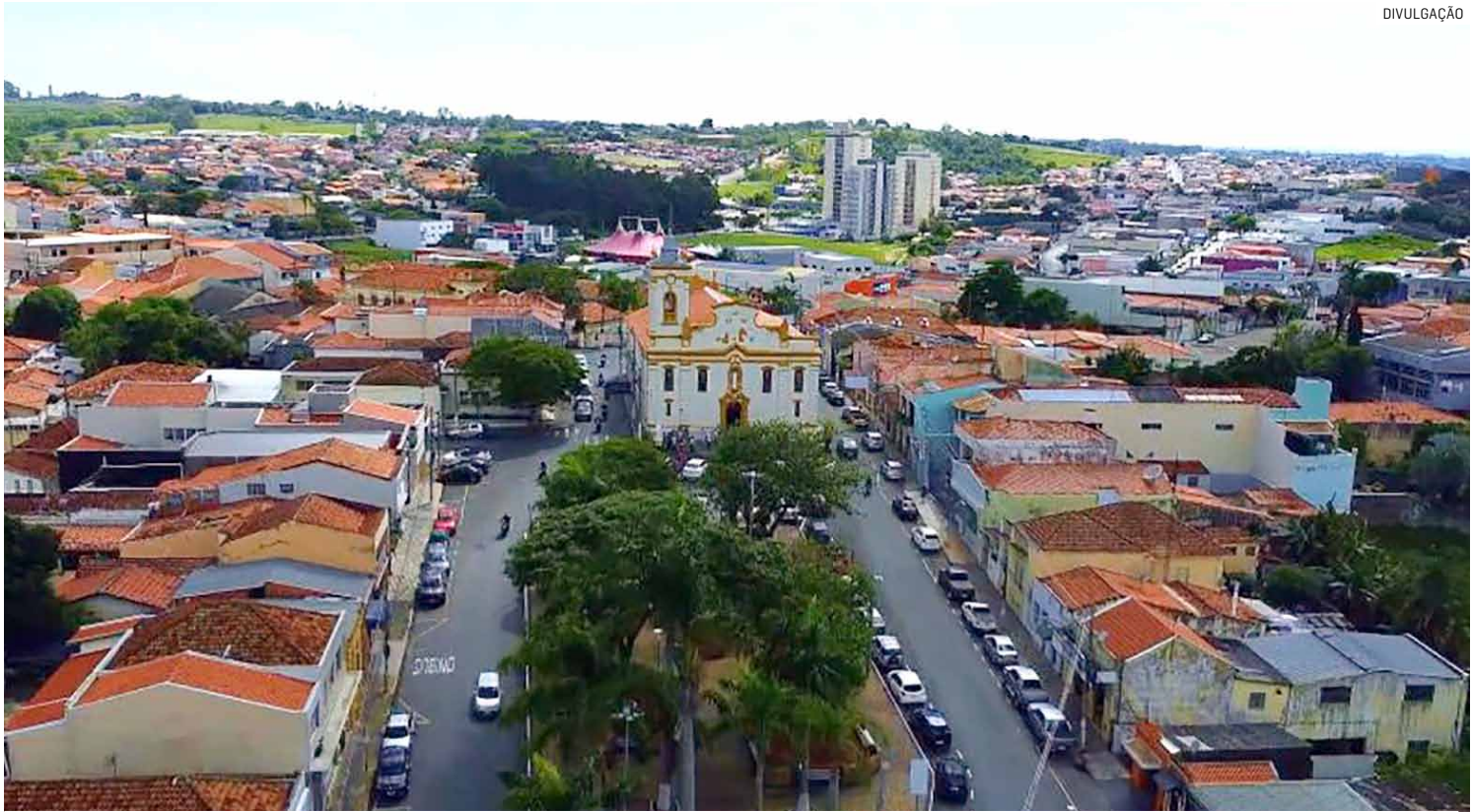
Município busca evitar interrupção dos pagamentos em andamento e ordem cronológica definida em 2025 deverá ser preservada

A legislação federal autoriza a retomada da contagem do tempo de serviço suspenso durante a pandemia, entre 28 de maio de 2020 e 31 de dezembro de 2021, para fins de direitos funcionais. No entanto, apesar da autorização imediata para a contagem do tempo, a efetivação de pagamentos depen-