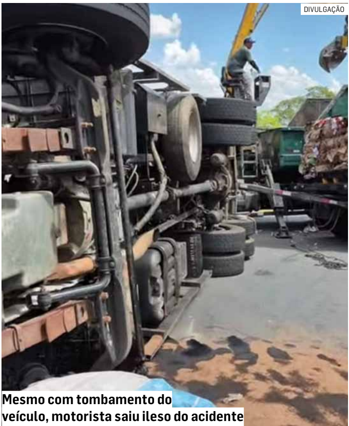
Mesmo com tombamento do veículo, motorista saiu ileso do acidente

Por volta das 15h, profissionais da empresa responsável pelo caminhão atuavam na retirada dos materiais e na preparação para a remoção do veículo.