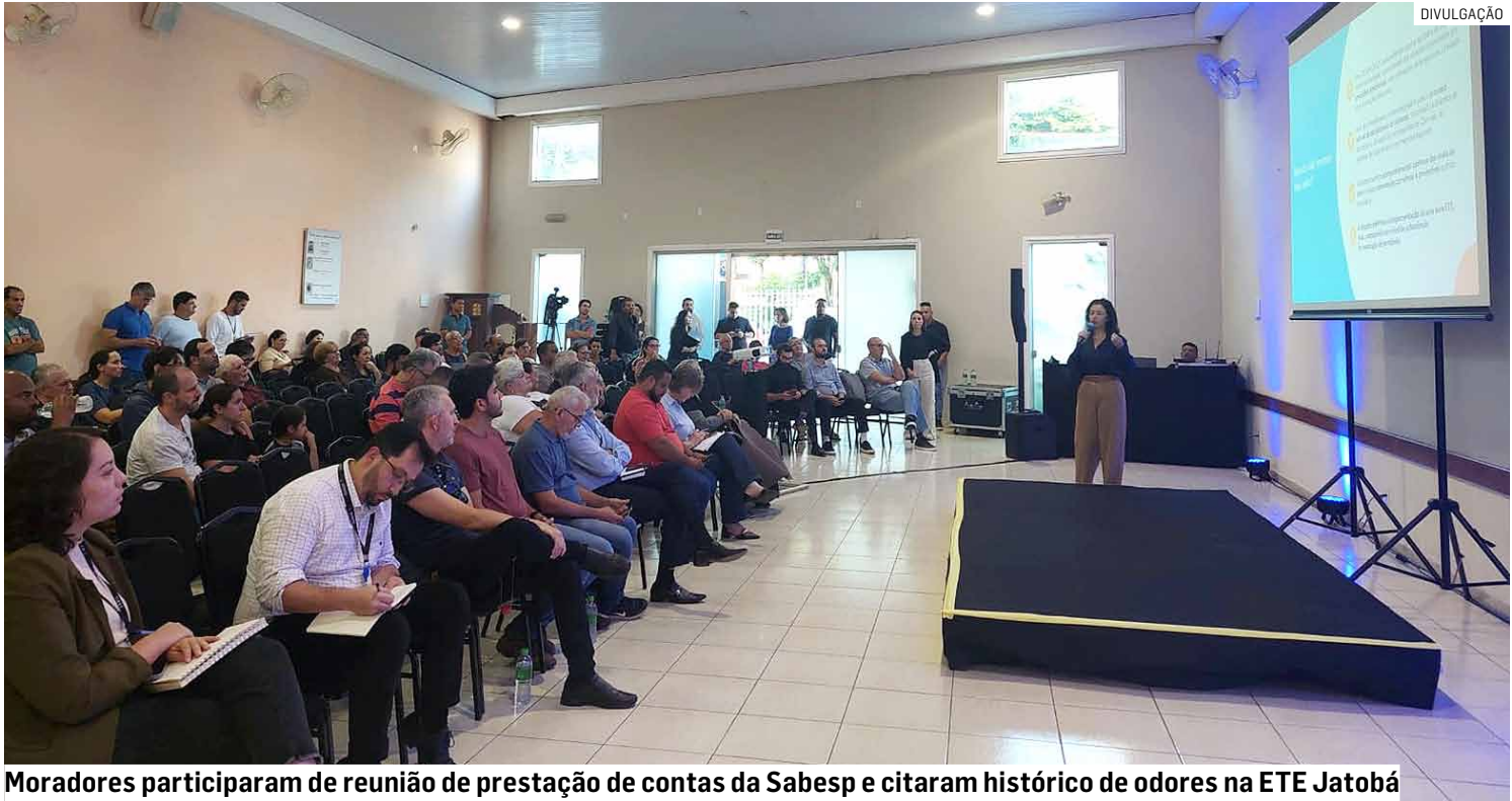
Moradores participaram de reunião de prestação de contas da Sabesp e citaram histórico de odores na ETE Jatobá

A URAE 1 informou que acompanha continuamente todas as etapas do processo e tem cobrado agilidade na adoção de medidas eficazes. Entre as ações executadas pela Sabesp es-