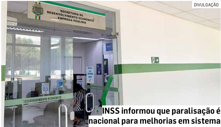
INSS informou que paralisação é nacional para melhorias em sistema

A Secretaria de Desenvolvimento Econômico de Paulínia informou que o atendimento do posto do INSS (Instituto Nacional do Seguro Social), localizado dentro da pasta, estará suspenso nos dias 28, 29 e 30 de janeiro. A medida é nacional e de iniciativa do próprio órgão que informa que fará a paralisação para poder realizar melhorias em seu sistema.