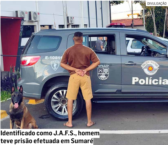
Identificado como J.A.F.S., homem teve prisão efetuada em Sumaré

Identificado como J.A.F.S., o homem foi submetido à busca pessoal, não sendo encontrado ne-