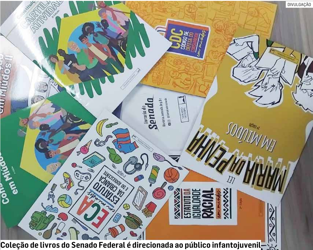
Coleção de livros do Senado Federal é direcionada ao público infantojuvenil

Exemplares dos livros, em pdf, estão disponíveis de graça no site da Livraria do Senado.