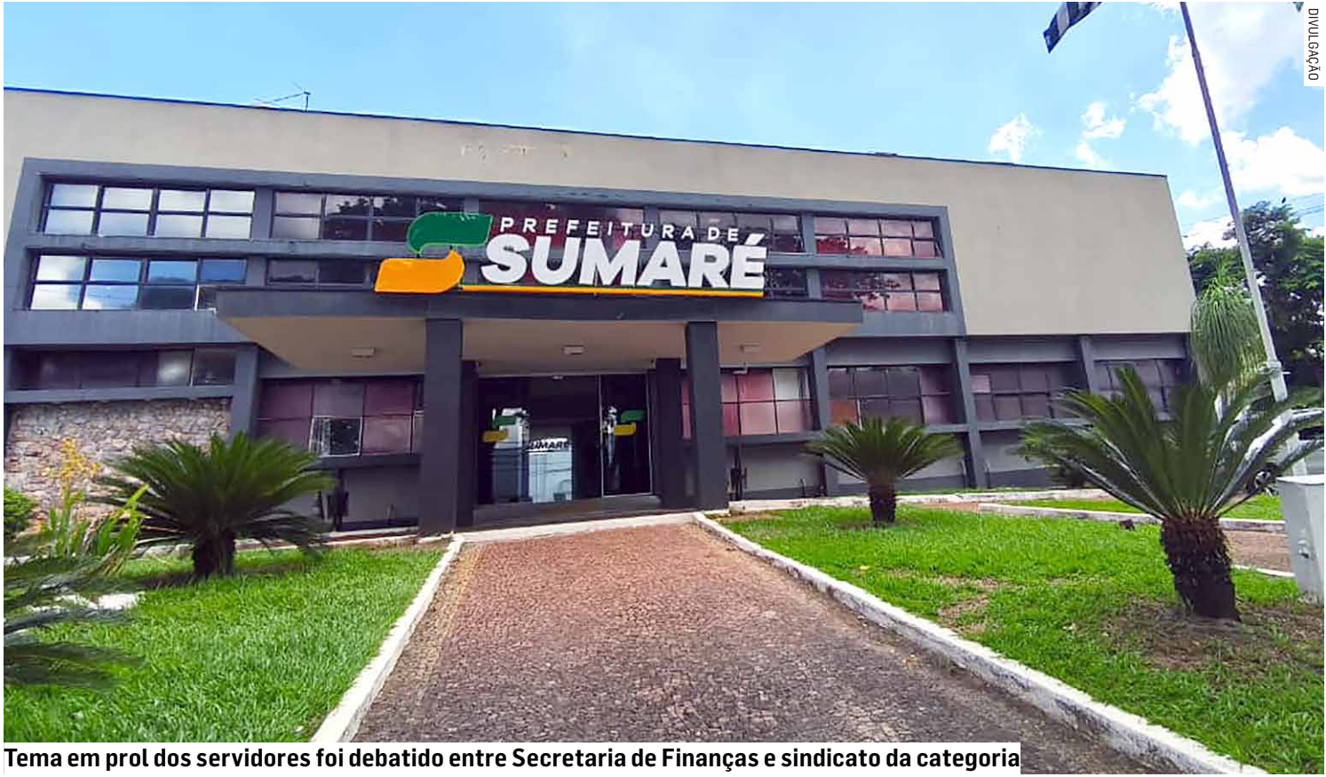
Tema em prol dos servidores foi debatido entre Secretaria de Finanças e sindicato da categoria

A Lei 173/20 foi sancionada em maio de 2020 como contrapartida ao auxílio financeiro concedido pela União aos entes federativos para enfrentamento da crise sanitária e econômica causada pela pandemia. Entre suas principais determinações, a legislação congelou benefícios e progressões funcionais, proibiu reajustes salariais, cria-