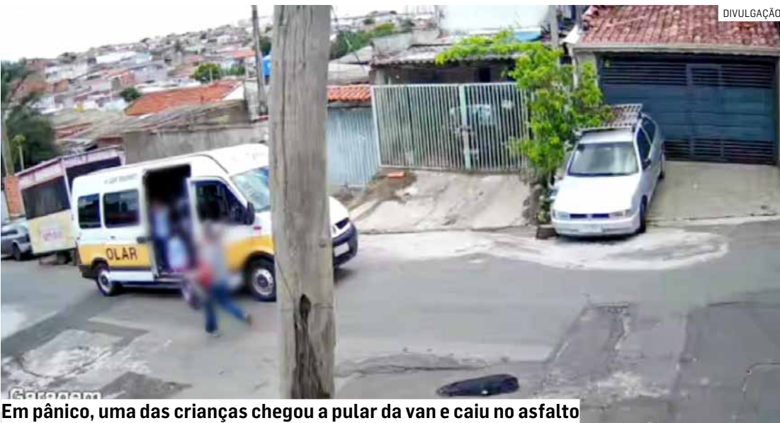
Em pânico, uma das crianças chegou a pular da van e caiu no asfalto

Durante a descida, um morador percebeu a situação e conseguiu entrar no veículo para ten-