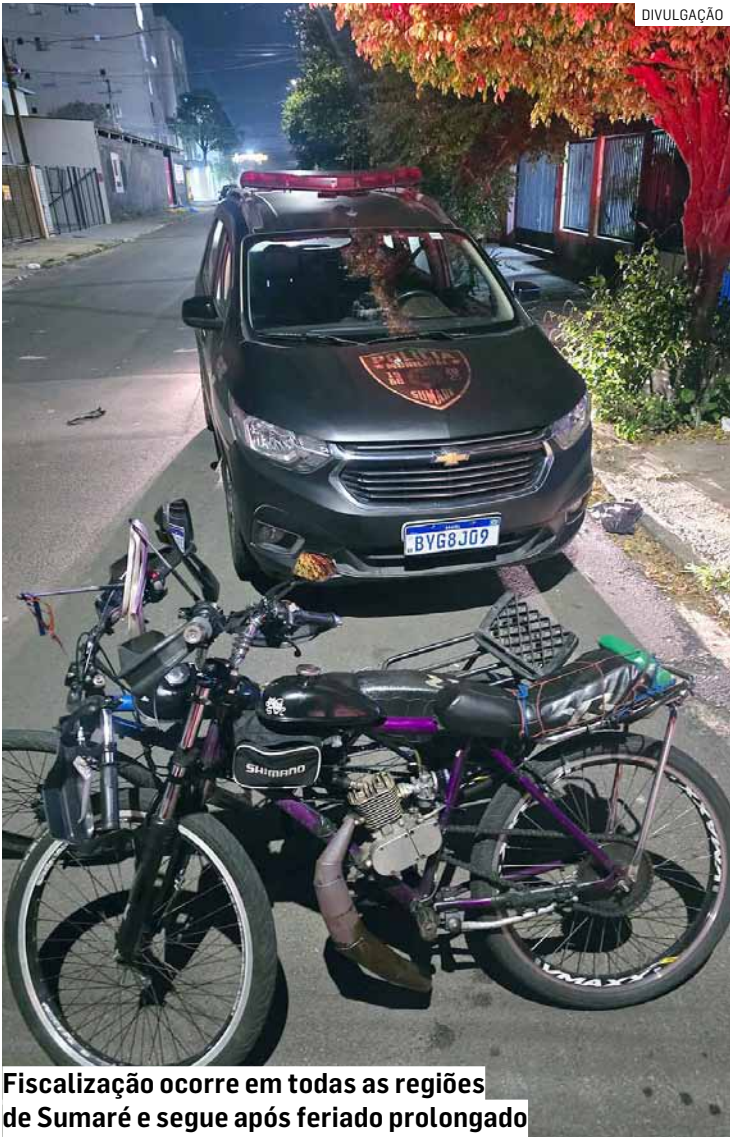
Fiscalização ocorre em todas as regiões de Sumaré e segue após feriado prolongado