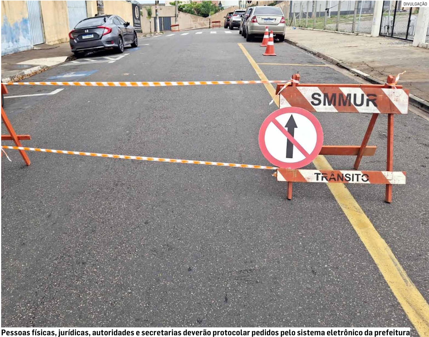
Pessoas físicas, jurídicas, autoridades e secretarias deverão protocolar pedidos pelo sistema eletrônico da prefeitura

De acordo com o ato, considera-se evento público qualquer atividade que envolva interdição total ou parcial de ruas e avenidas de forma temporária e em local determinado, abrangendo eventos comemorativos, recreativos, sociais, culturais, religiosos, esportivos, institucionais, promocionais ou ainda execuções de obras.