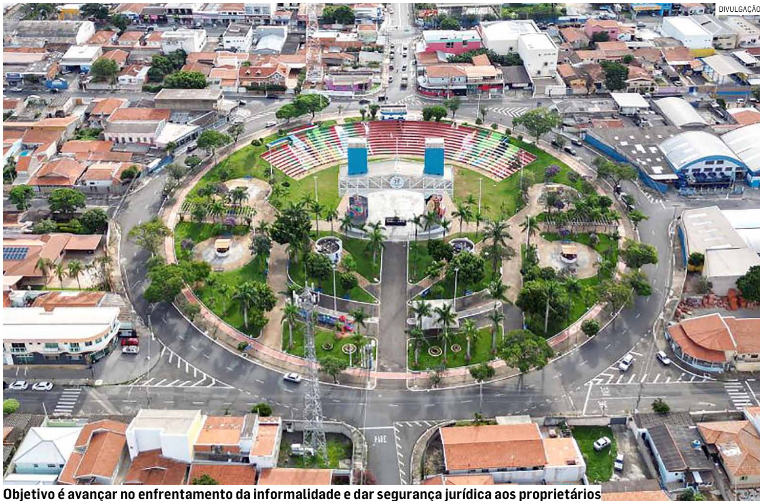
Objetivo é avançar no enfrentamento da informalidade e dar segurança jurídica aos proprietários

Pela nova lei, poderão ser regularizados lotes com área mínima de 125 m 2 e testada mínima de 5 metros. Para comprovar que a subdivisão ocorreu antes de 2021, os proprietários deverão apresentar documentos como escrituras, contratos de compra e venda com firma reconhecida ou assinaturas eletrônicas certificadas pela ICP-Brasil, além de evidências físicas como muros divisó-