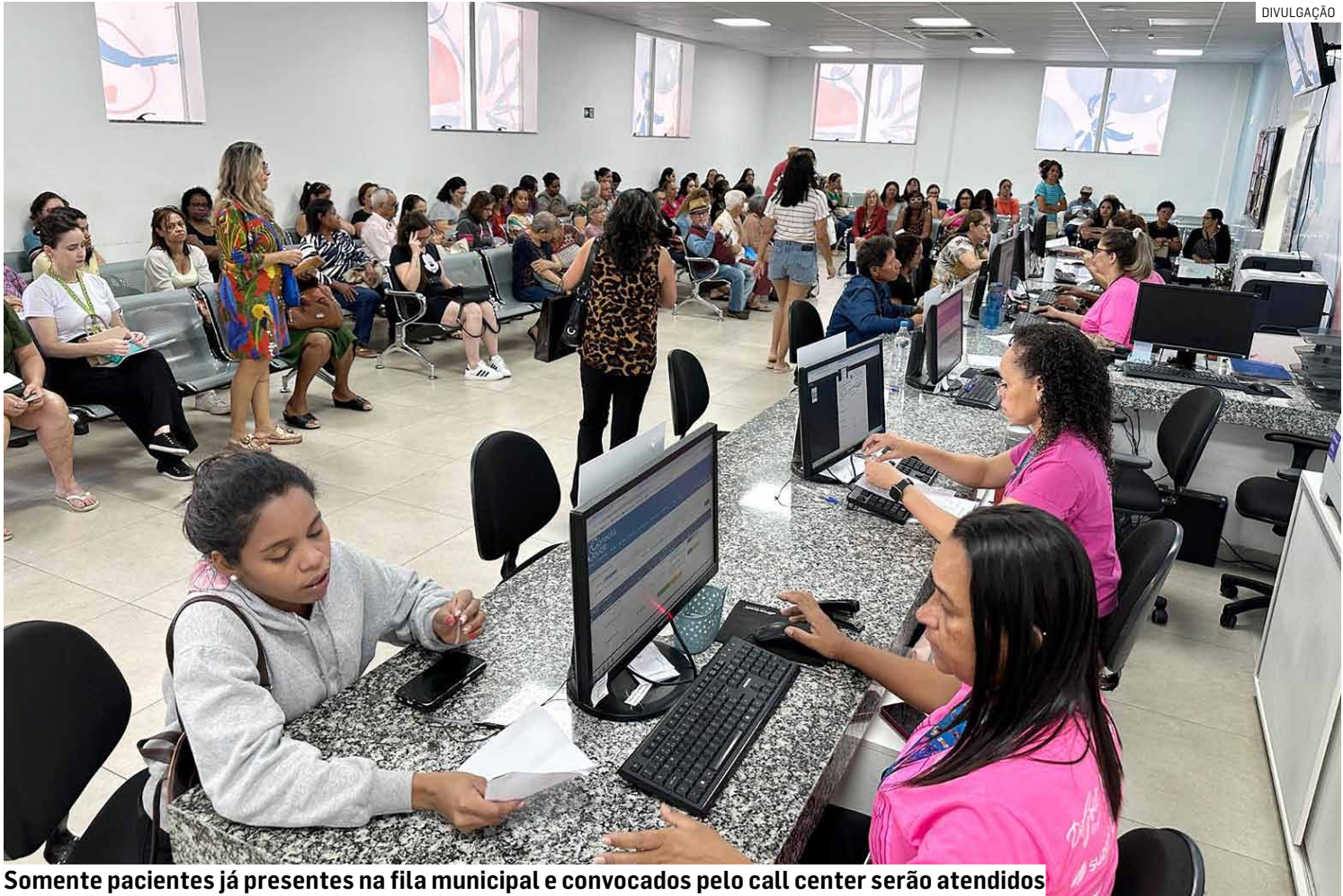
Somente pacientes já presentes na fila municipal e convocados pelo call center serão atendidos

Na primeira edição do mutirão, realizada em 25 de outubro, foram feitos 2,2 mil procedimentos para 800 pacientes, incluindo