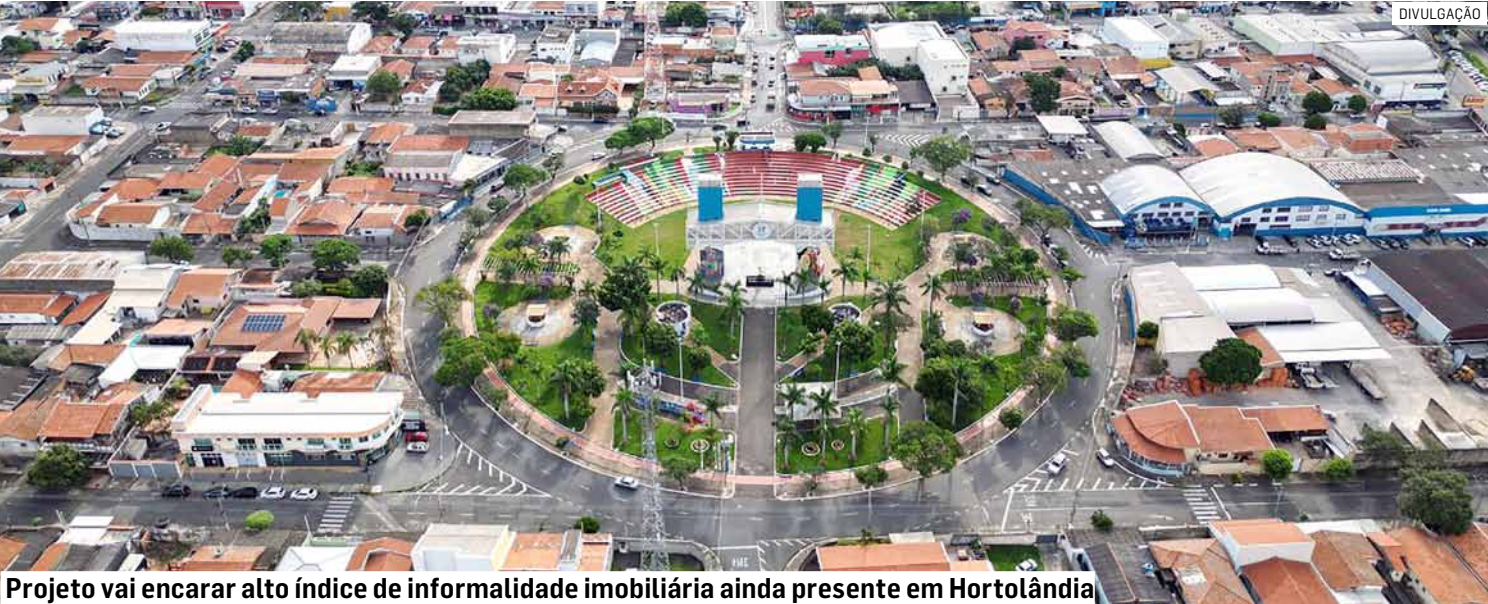
Projeto vai encerrar alto índice de informalidade imobiliária ainda presente em Hortolândia

Legislativo aprova projeto que valida desdobros informais, mesmo quando não atendem normas urbanísticas; medida só não alcança áreas de risco, de preservação ou imóveis já contemplados; governo local vai combater inércia para regularizações