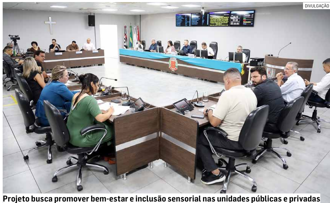
Projeto busca promover bem-estar e inclusão sensorial nas unidades públicas e privadas

Paulo Medina • AMERICANA tribunaliberal@tribunaliberal.com.br