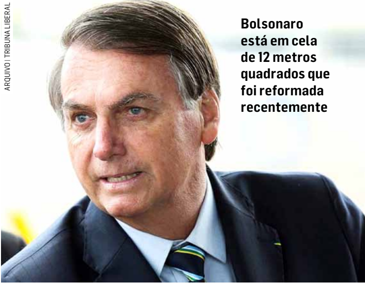
Bolsonaro está em cela de 12 metros quadrados que foi reformada recentemente

quadrados que foi reformada recentemente. O espaço tem paredes brancas, uma cama de solteiro, armários, mesa de apoio, televisão, frigobar, ar-condicionado e uma janela, além de banheiro privativo.