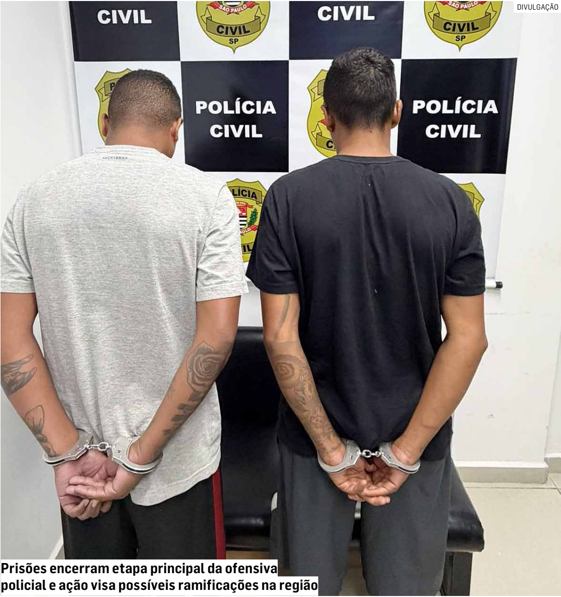
Prisões encerram etapa principal da ofensiva policial e ação visa possíveis ramificações na região

Ação policial realizada no município cumpriu todos os mandados contra quadrilha suspeita de venda de drogas, lavagem de dinheiro e organização criminosa; dupla foi localizada no Jardim Colina após monitoramento sigiloso