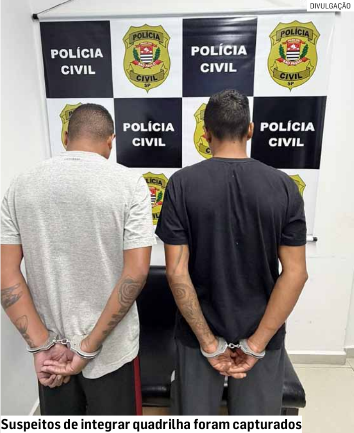
Suspeitos de integrar quadrilha foram capturados