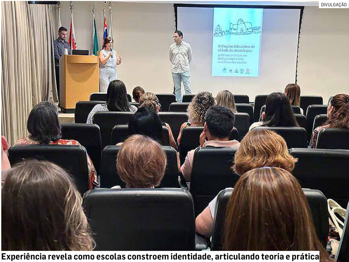
Experiência revela como escolas constroem identidade, articulando teoria e prática

A publicação é fruto de uma experiência formativa construída entre o NEPP e a Educação de Americana, orientada pelos valores que fundamentam o projeto da Educação Infantil: a escuta das infâncias, a prá-