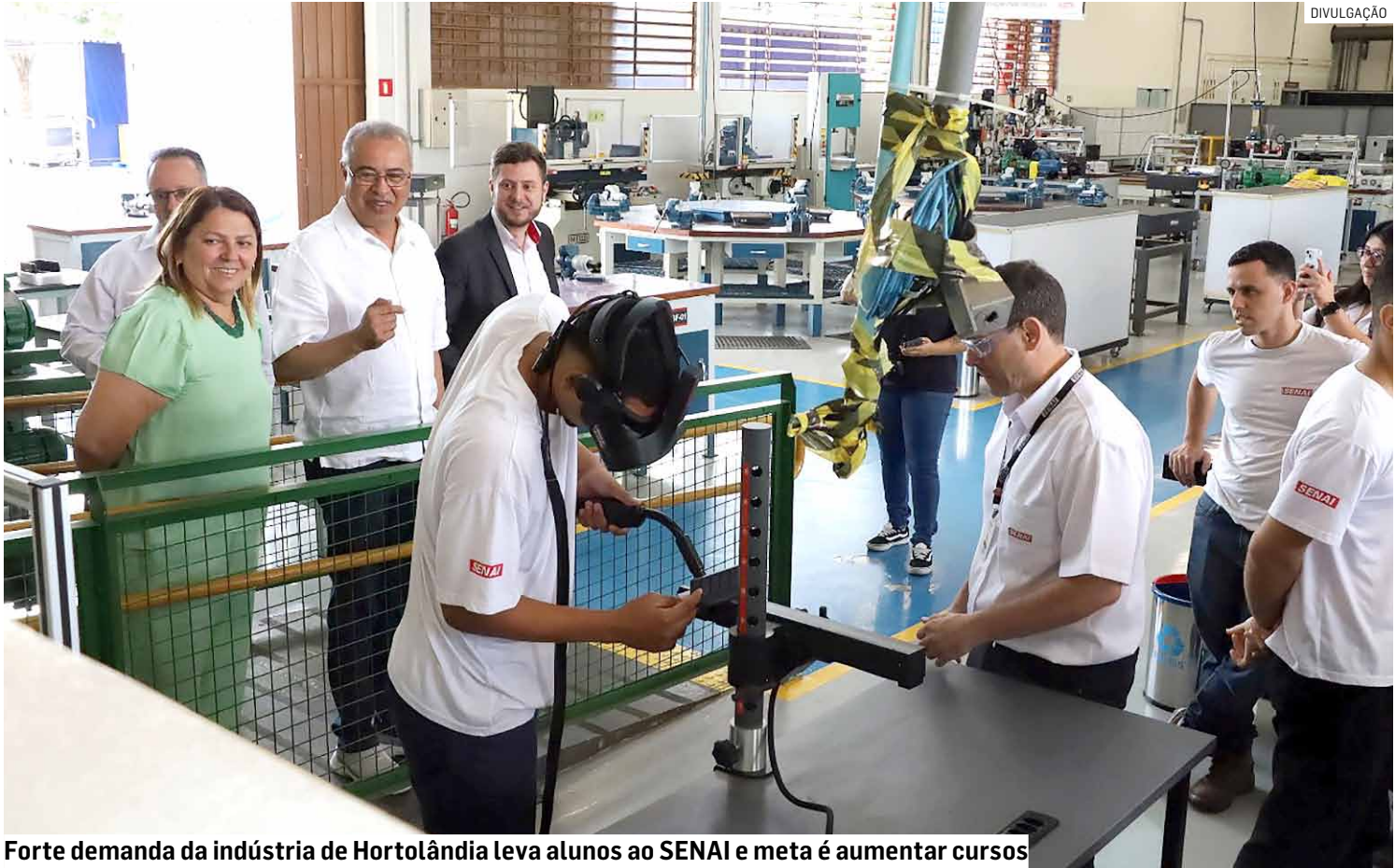
Forte demanda da indústria de Hortolândia leva alunos ao SENAI e meta é aumentar cursos