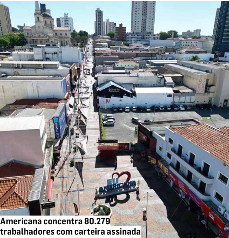
Americana concentra 80.279 trabalhadores com carteira assinada

Estimativas do Observatório Econômico da Prefeitura de Americana indicam que a primeira parcela do 13º salário, que deve ser paga até o próximo domingo (30), pode injetar mais de R$ 150 milhões na economia da cidade. O levantamento aponta também que o pagamento completo do 13º salário, que deve ser feito até 20 de dezembro, tem uma projeção de injetar mais de R$ 300 milhões na economia local, o que deve refletir positivamente nas lojas do comércio, nos supermercados e nas compras gerais de fim de ano.