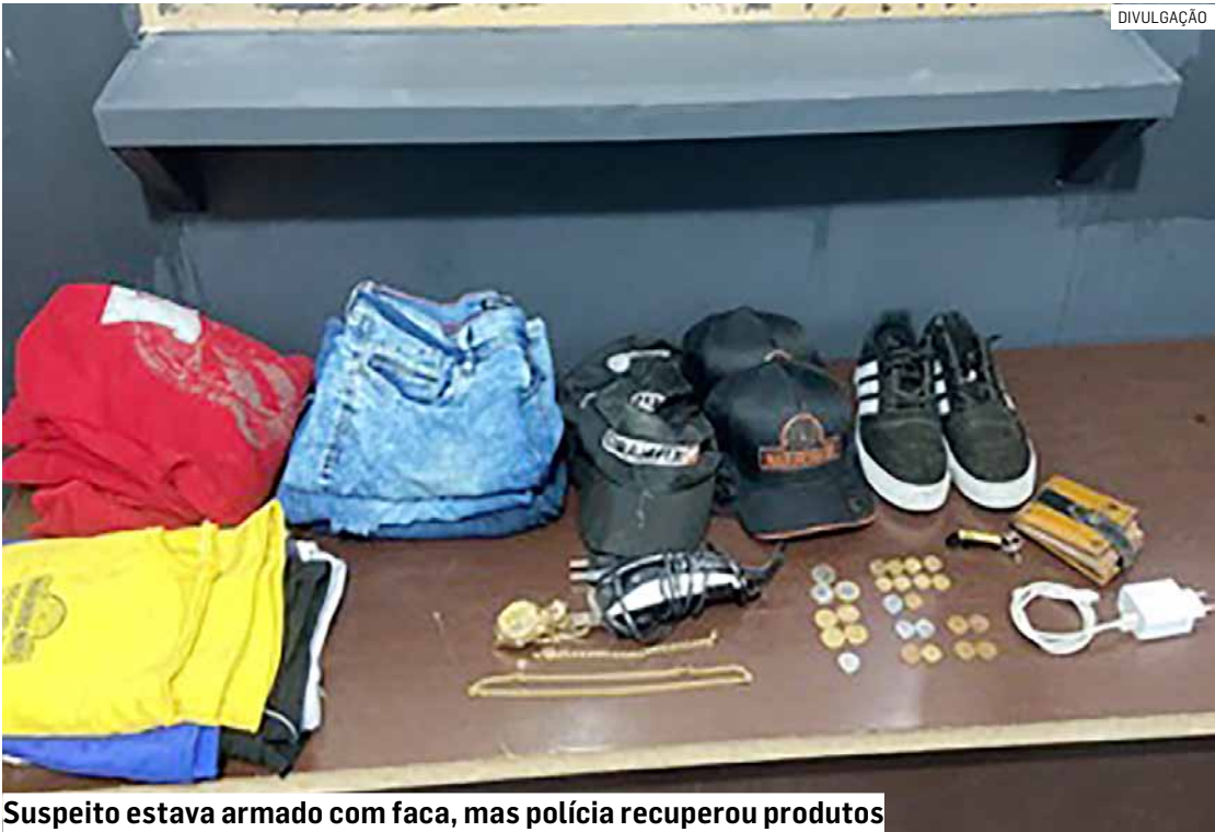
Suspeito estava armado com faca, mas polícia recuperou produtos

que a situação evoluísse para um confronto. Durante a revista pessoal, foram encontrados com o suspeito diversas peças de roupas e objetos pertencentes ao estabelecimento. Todo o material foi apreendido e apresentado posteriormente na Delegacia de Polícia. O homem foi conduzido ao Plantão Policial de Hortolândia, onde a autoridade de plantão determinou a elaboração do boletim de ocorrência. Após análise dos fatos, a prisão em flagrante foi ratificada. O indivíduo permaneceu detido e agora está à disposição da Justiça.