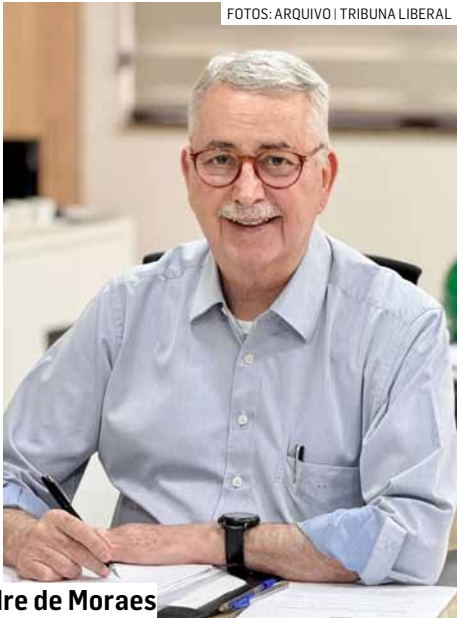
Lideranças regionais comentam a prisão de Bolsonaro e maioria alfineta decisão de Alexandre de Moraes