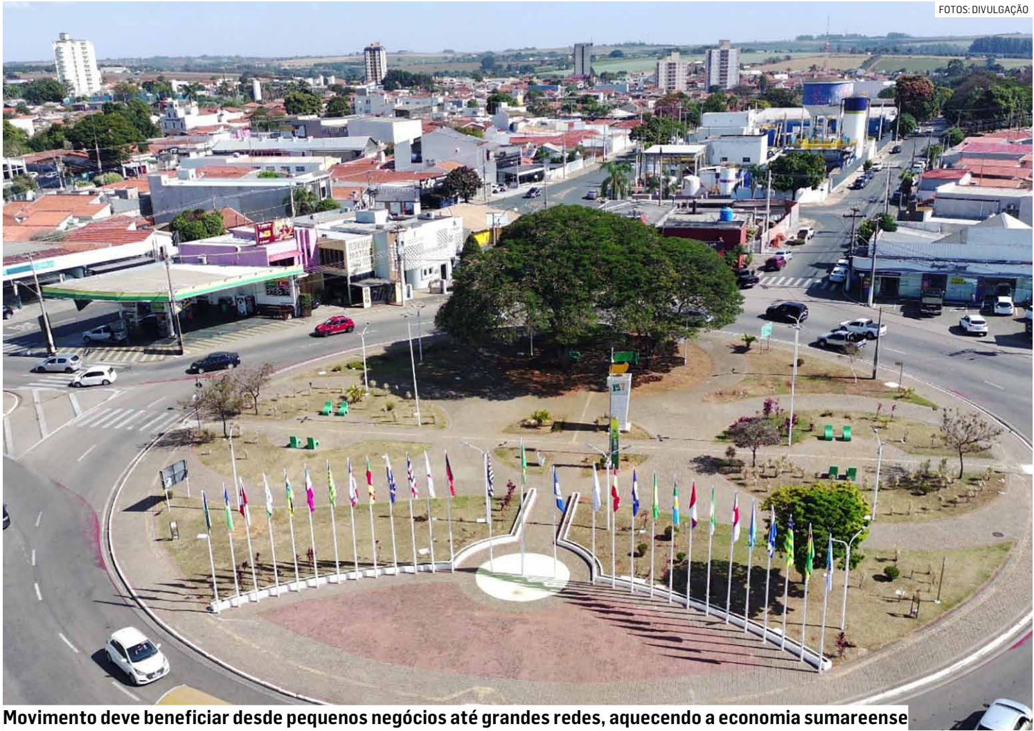
Movimento deve beneficiar desde pequenos negócios até grandes redes, aquecendo a economia sumareense

A legislação permite que o 13º seja pago de duas formas: em parcela única até 20 de dezembro, ou dividi-