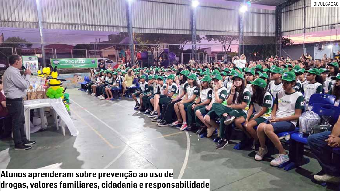
Alunos aprenderam sobre prevenção ao uso de drogas, valores familiares, cidadania e responsabilidade

Durante semanas, os alunos participaram de atividades educativas, rodas de conversa e dinâmicas conduzidas pela Polícia Municipal, aprendendo sobre prevenção ao uso de drogas, valores familiares, cidadania e responsabilidade. A formatura celebrou esse processo de aprendizado e reforçou a importância de trabalhar o tema desde cedo.