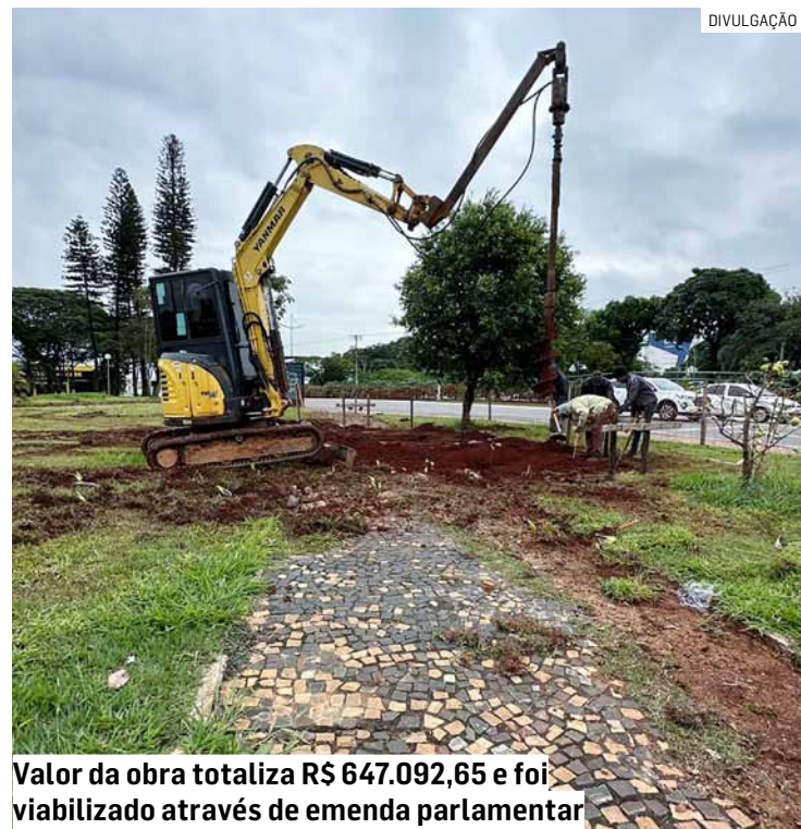
Valor da obra totaliza R$ 647.092,65 e foi viabilizado através de emenda parlamentar

Da Redação • AMERICANA tribunaliberal@tribunaliberal.com.br