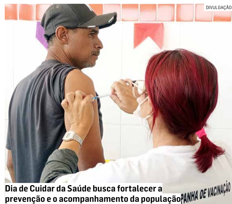
Dia de Cuidar da Saúde busca fortalecer a prevenção e o acompanhamento da população

radores a aproveitarem essa oportunidade para cuidar da saúde e da família. Nossa equipe estará preparada para oferecer atendimento, orientação e serviços importantes de prevenção. Manter os exames em dia, atualizar a vacinação e acompanhar a pressão arterial são atitudes que contribuem para uma melhor qualidade de vida”, destacou o secretário.