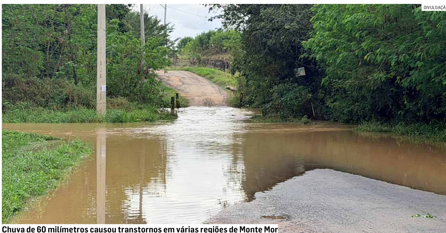
Chuva de 60 milímetros causou transtornos em várias regiões de Monte Mor

Fortes chuvas registradas causaram transtornos em diferentes bairros e elevaram o nível do Rio Capivari; condição climática fez prefeitura suspender transmissão pública do jogo da Seleção Brasileira na quarta