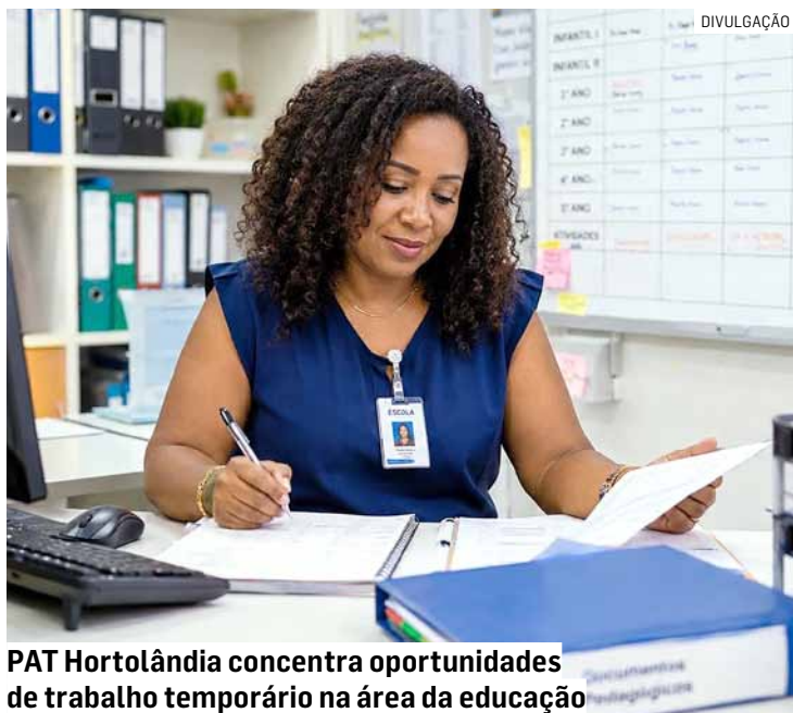
PAT Hortolândia concentra oportunidades de trabalho temporário na área da educação

Além das vagas na educação, o PAT também disponibiliza dez oportunidades para ajudante de pintor. Para essa função, tam-