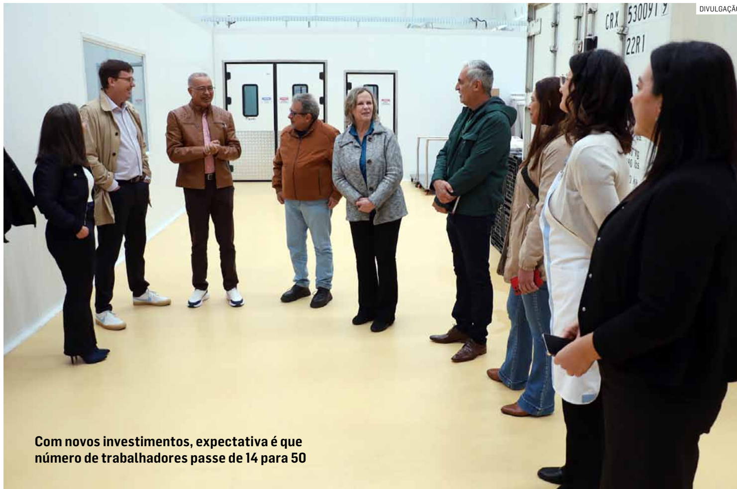
Com novos investimentos, expectativa é que número de trabalhadores passe de 14 para 50