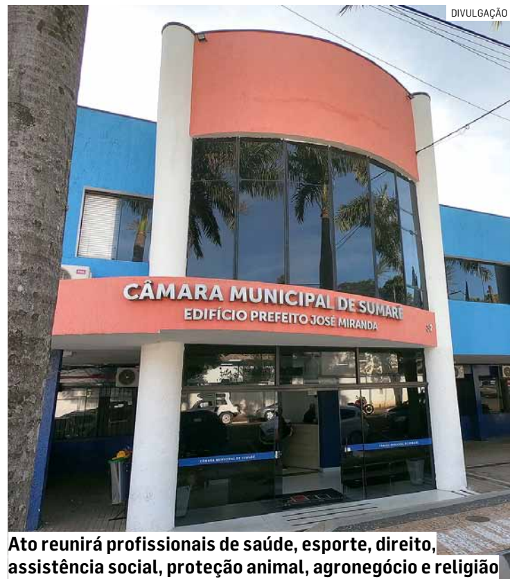
Ato reunirá profissionais de saúde, esporte, direito, assistência social, proteção animal, agronegócio e religião