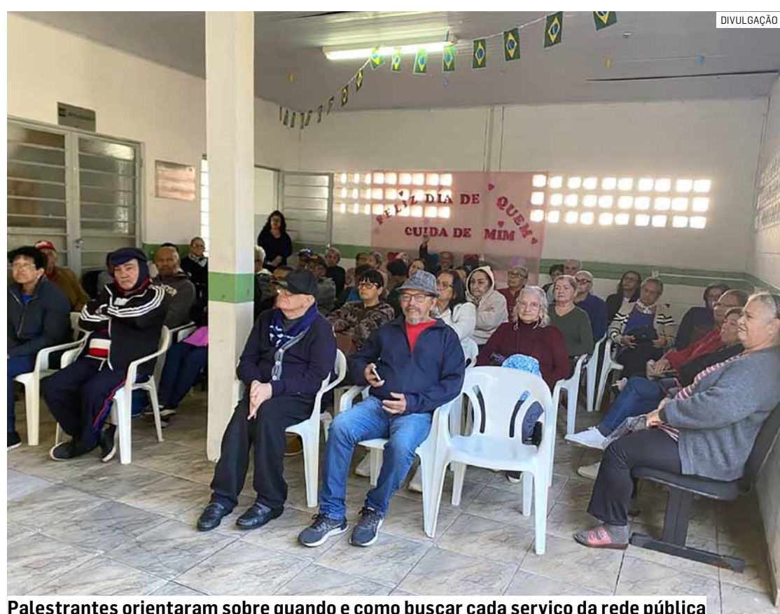
Palestrantes orientaram sobre quando e como buscar cada serviço da rede pública

Nos encontros, que também foram abertos à comunidade, os palestrantes orientaram sobre quando e como buscar cada serviço, além dos procedimentos para exames e cirurgias, incluindo os de média e alta complexidade que não dependem do município.