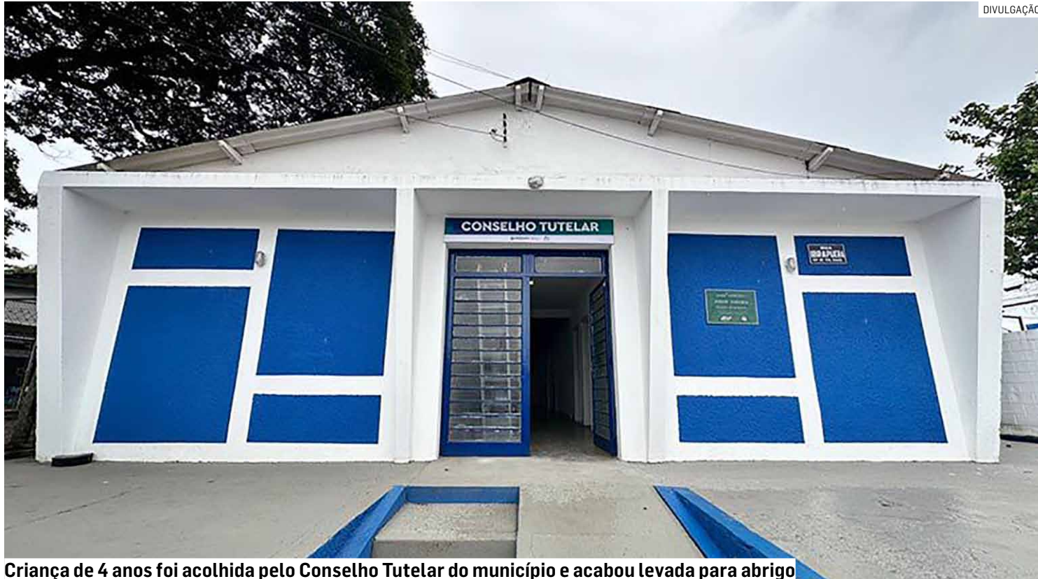
Criança de 4 anos foi acolhida pelo Conselho Tutelar do município e acabou levada para abrigo

A mulher afirmou ter sido agredida pelo companheiro durante uma discussão. Segundo seu relato, ela recebeu socos e so-