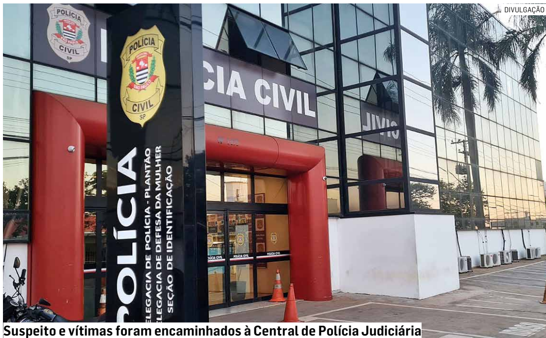
Suspeito e vítimas foram encaminhados à Central de Polícia Judiciária

Cézar Oliveira • AMERICANA tribunaliberal@tribunaliberal.com.br