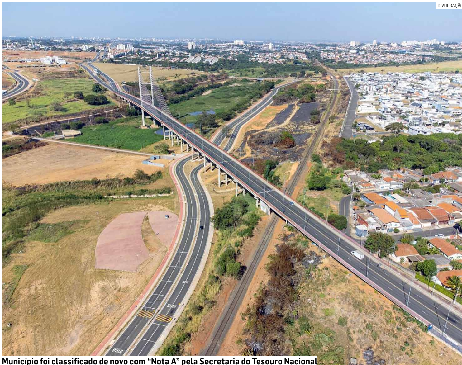
Município foi classificado de novo com “Nota A” pela Secretaria do Tesouro Nacional

O ICF (Indicador da Qualidade Contábil e Fiscal) do Siconfi (Sistema de Informações Contábeis e Fiscais do Setor Público Brasileiro) leva em conta a qualidade das informações fiscais, assim como a consistência dos relatórios e demonstrativos contábeis, compartilhadas pelos municípios no exercício 2025. Conforme explica o Tesouro Nacional, por meio deste índice “é possível verificar o desempenho das cidades brasileiras na aplicação dos conceitos contábeis e fiscais