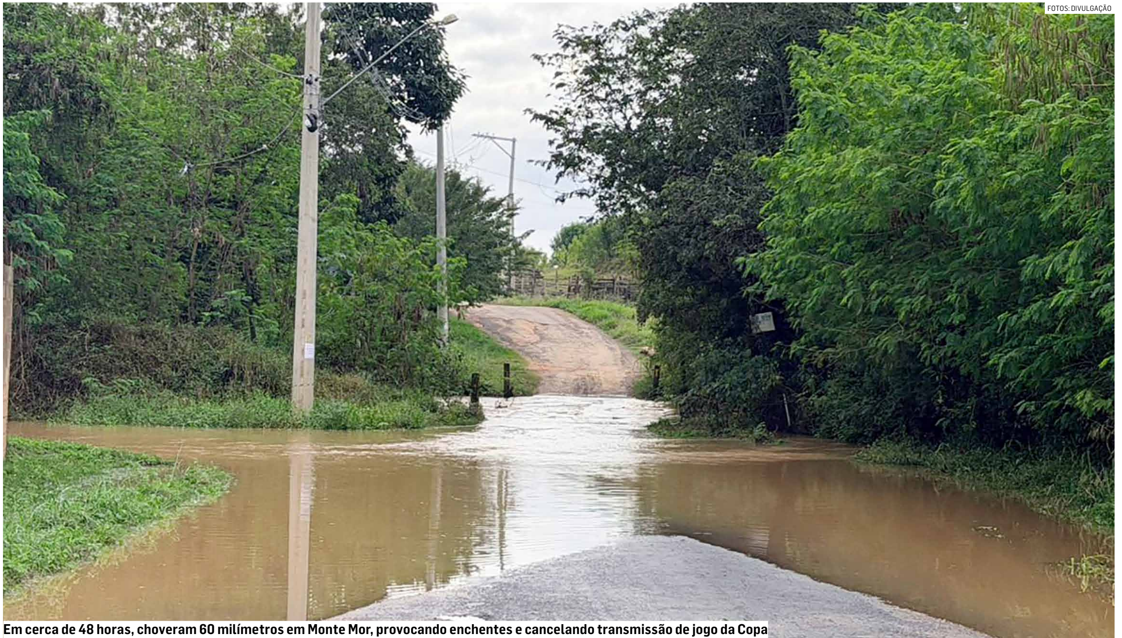
Em cerca de 48 horas, choveram 60 milímetros em Monte Mor, provocando enchentes e cancelando transmissão de jogo da Copa