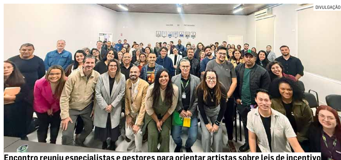
Encontro reuniu especialistas e gestores para orientar artistas sobre leis de incentivo