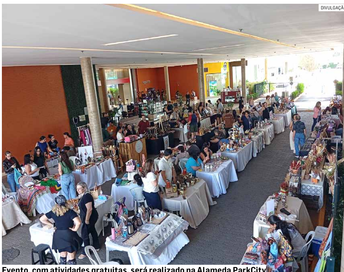
Evento, com atividades gratuitas, será realizado na Alameda ParkCity