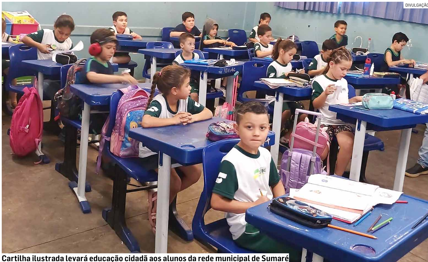
Cartilha ilustrada levará educação cidadã aos alunos da rede municipal de Sumaré

verão compor o conteúdo estão orientações sobre boas práticas no trânsito, combate ao descarte irregular de lixo em vias públicas, descarte correto de resíduos e entulho, preser-