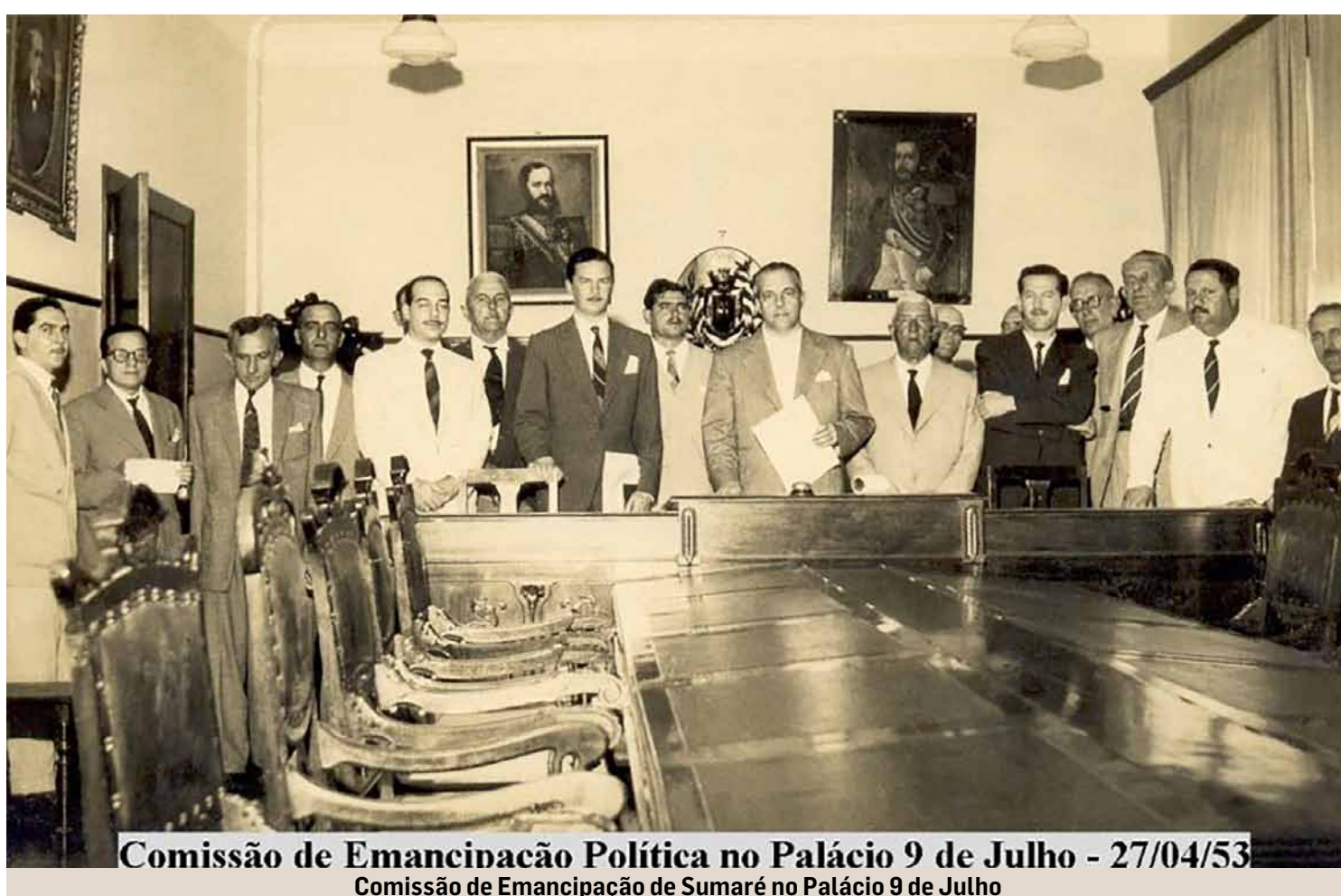
Comissão de Emancipação Política no Palácio 9 de Julho - 27/04/53 Comissão de Emancipação de Sumaré no Palácio 9 de Julho

Quero iniciar minha fala lembrando a frase de um dos maiores historiadores da atualidade Eric Hobsbawm, que escreveu obras famosas como a Era dos Extremos, a Era dos Impérios, a Era das Revoluções, a Era do Capital e outros livros importantes. Pois bem, é dele a frase famosa: