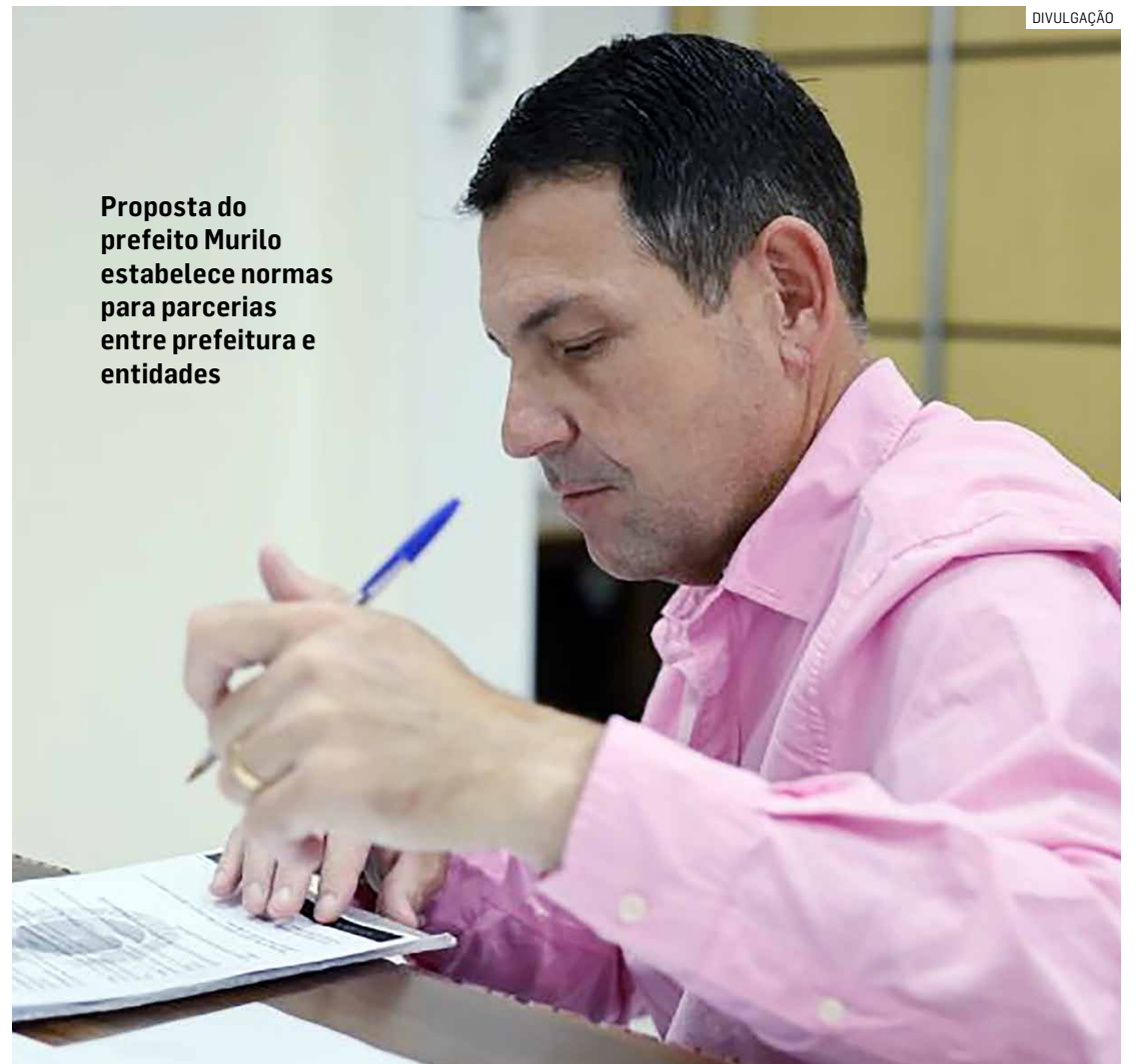
Proposta do prefeito Murilo estabelece normas para parcerias entre prefeitura e entidades

Entre os pontos destacados no projeto estão a exigência de critérios técnicos para qualificação das entidades, a necessidade de chamamento público para escolha das organizações, salvo exceções justificadas, e a obrigatoriedade de metas, indicadores de desempenho, prazos e mecanismos de monitoramento nos contratos de gestão. A proposta ainda prevê fiscalização por comissão de monitoramento, controle interno,