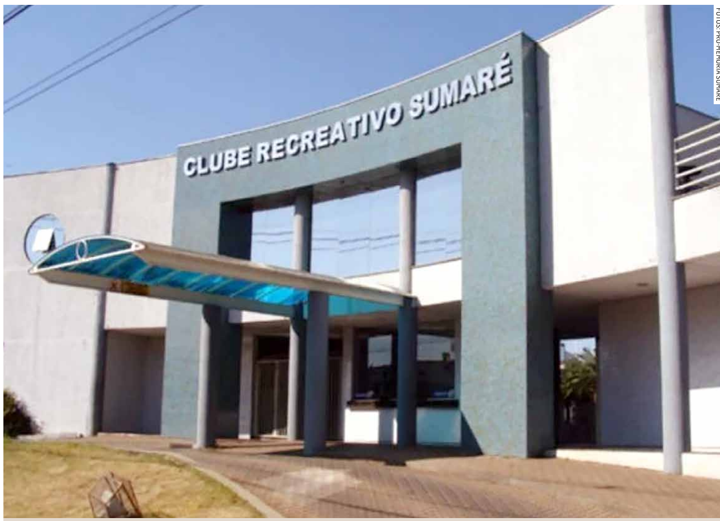
Sede atual do Clube Sumaré na Avenida Rebouças

Praça da República, nº 102, Centro, Sumaré/SP F: (19) 3803-3016 promemoriasumare@gmail.com