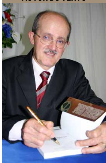
Francisco Antônio de Toledo