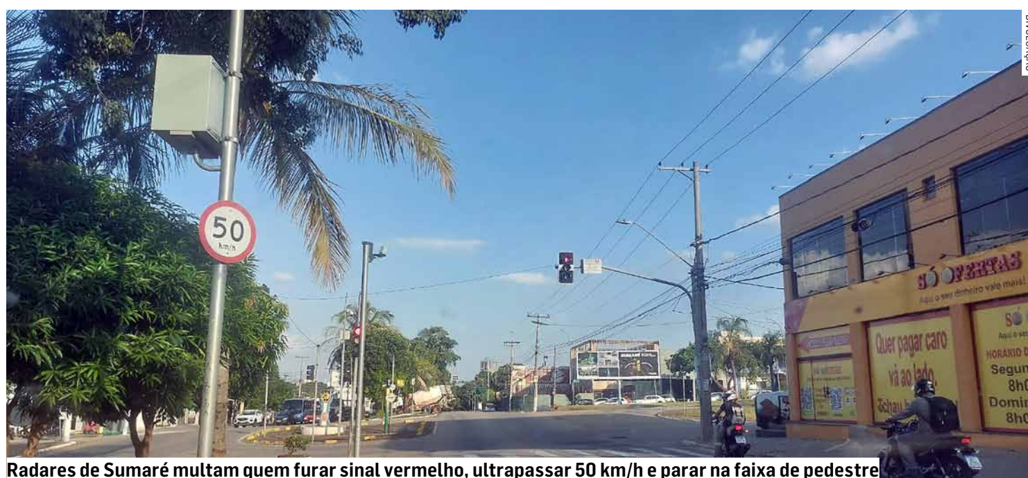
Radares de Sumaré multam quem furar sinal vermelho, ultrapassar 50 km/h e parar na faixa de pedestre

Conductor que avançar sinal vermelho em dispositivos de Sumaré corre o risco de receber duas autuações em único endereço: uma de desrespeito a semáforo e outra por ultrapassar limite de velocidade já fixado em 50 km/h