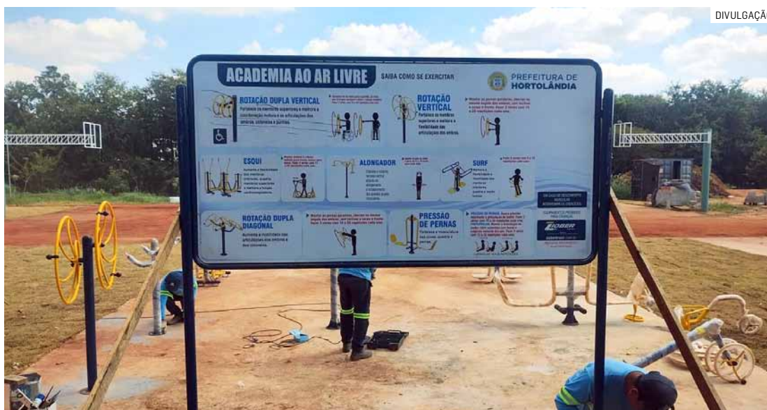
Serviço faz parte da estruturação do novo complexo público esportivo no parque socioambiental

As obras avançam no entorno do Campo da Mina, no Jardim Amanda, com a implantação de uma academia ao ar livre realizada pela Prefeitura de Hortolândia. Além disso, acontece o plantio de grama e ações de zeladoria no espaço que será uma área de convivência e faz parte do novo complexo público esportivo do bairro dentro do parque socioambiental. Além do campo de grama natu-