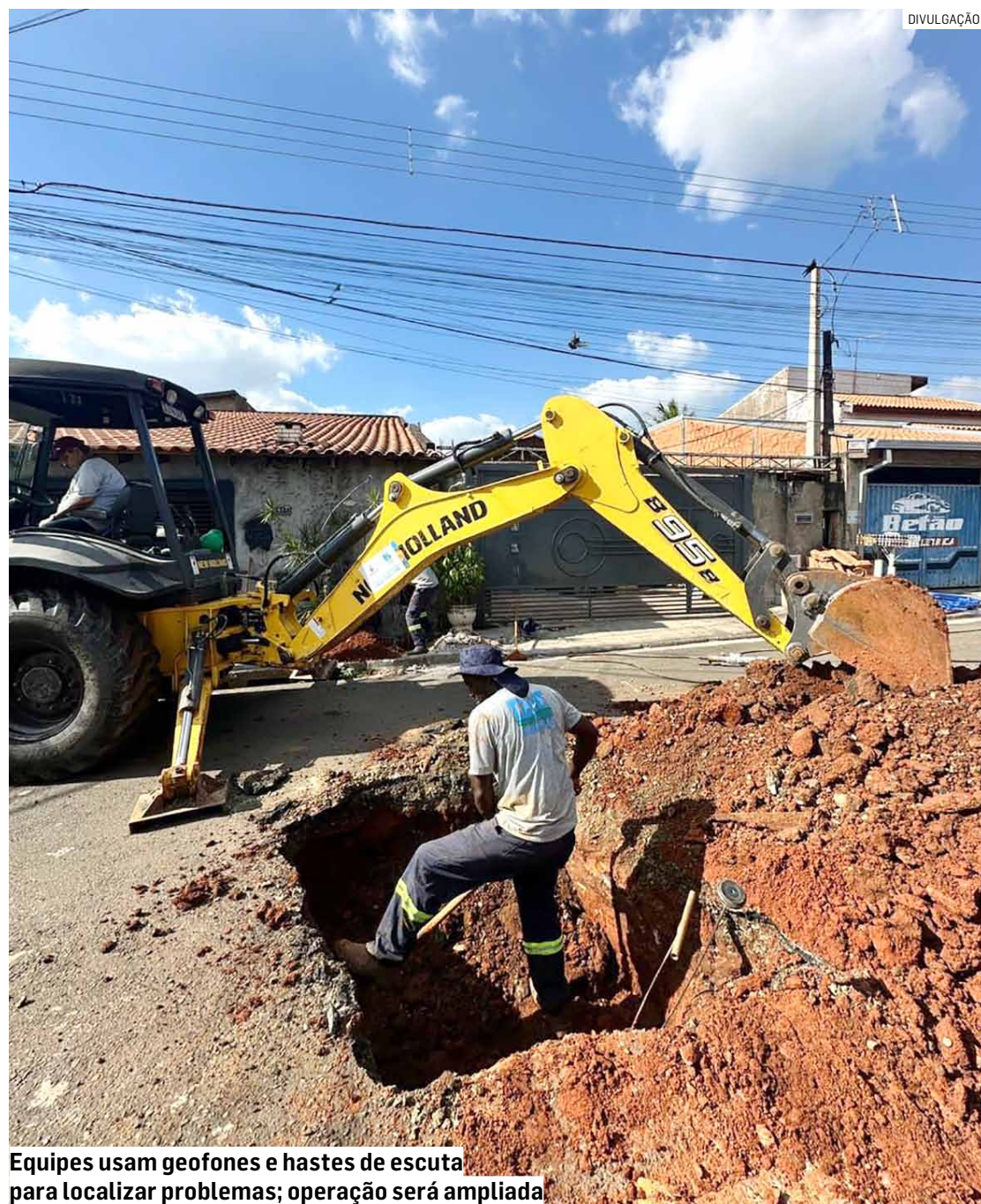
Equipes usam geofones e hastes de escuta para localizar problemas; operação será ampliada

As ações intensivas serão realizadas em todo o sistema de distribuição de Americana, que conta com cerca de 1.180 quilômetros de redes de água, reforçando o compromisso do município com a redução de perdas, modernização do sistema e segurança hídrica.