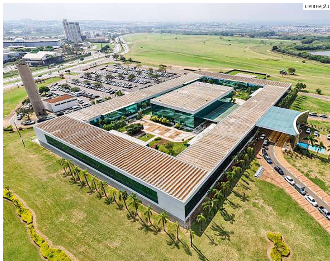
Pagamento terá prazo máximo de dois anos e não poderá ser prorrogado, segundo sanção

Nova legislação municipal estabelece regras para concessão do abono de permanência aos funcionários da prefeitura; benefício será destinado para quem já pode se aposentar, mas decide seguir carreira e as atividades no poder público