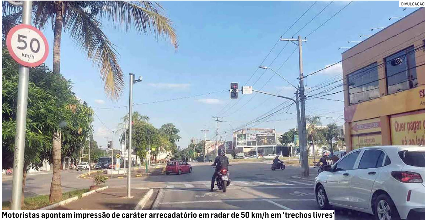
Motoristas apontam impressão de caráter arrecadatório em radar de 50 km/h em 'trechos livres'

Outro condutor, Vinícius de Holanda, também questiona a medida. “A gente entende que precisa de fiscalização, mas parece que colocaram os radares mais