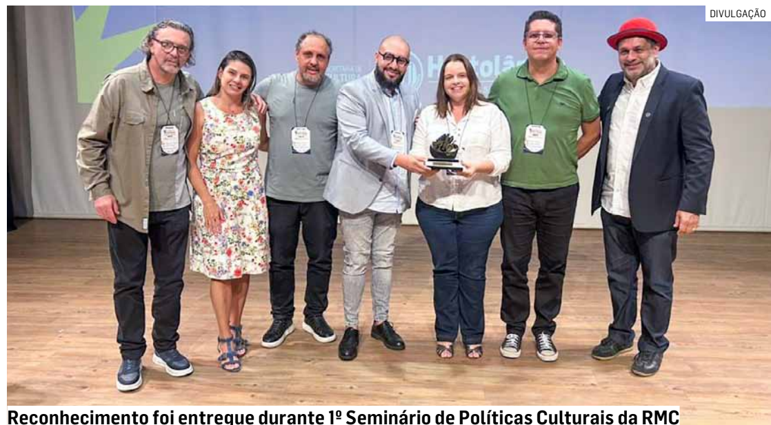
Reconhecimento foi entregue durante 1º Seminário de Políticas Culturais da RMC

Da Redação • NOVA ODESSA tribunaliberal@tribunaliberal.com.br