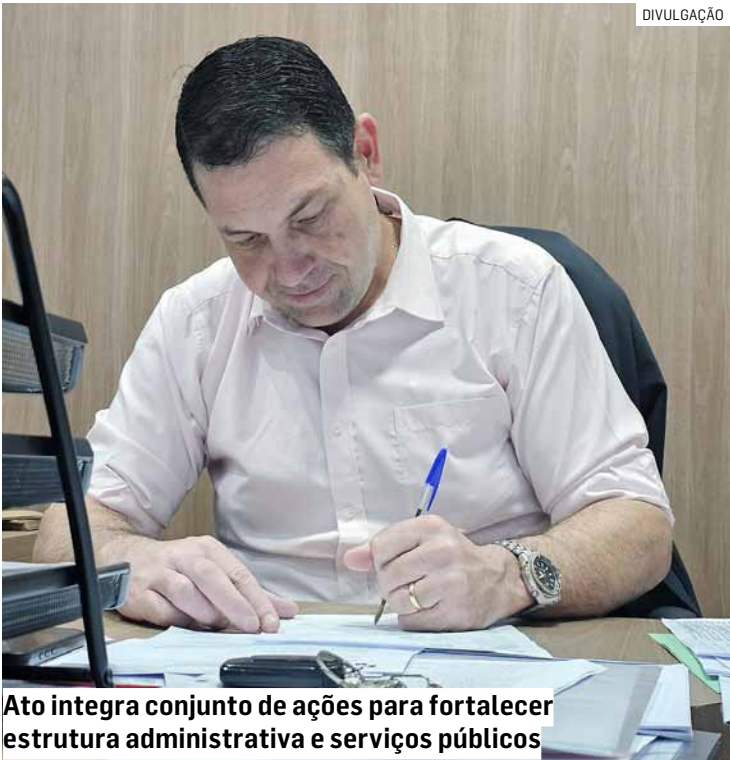
Ato integra conjunto de ações para fortalecer estrutura administrativa e serviços públicos

sistas do Programa Especial de Auxílio ao Desempregado, com foco no curso de Costura Industrial e suporte à gestão. A medida segue as normas de lei federal. As propostas já podem ser enviadas até dia 9 de janeiro de 2026, às 8h. A sessão pública ocorrerá no mesmo dia, às 9h, na sede da Prefeitura Municipal, localizada na Rua Francisco Glicério nº 399, no Centro.