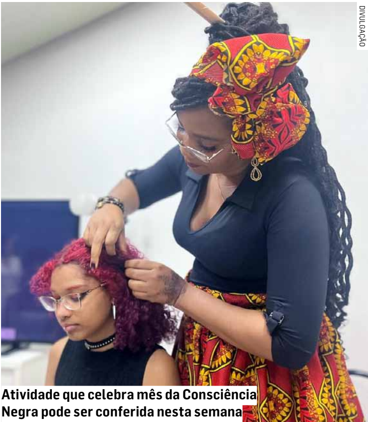
Atividade que celebra mês da Consciência Negra pode ser conferida nesta semana

tos, foram realizados quatro eventos com média de 20 participantes em cada. O Espaço Afroempresarial é colaborativo e fomenta o empreendedorismo em Hortolândia e cidades da região com o objetivo de fortalecer as orientações aos interessados e contribuir na abertura de empresas somado ao crescimento econômico da cidade. O espaço disponibiliza ainda infraestrutura, ferramentas e acesso à internet para que os afroempreendedores realizem eventos online. Além disso, o órgão realiza regularmente programações de palestras e atividades de capacitação e formação. O Espaço Afroempresarial integra o programa “Afroempreendedor”, instituído pela Prefeitura de Hortolândia por meio da lei municipal 3.702, de 19 de novembro de 2019.