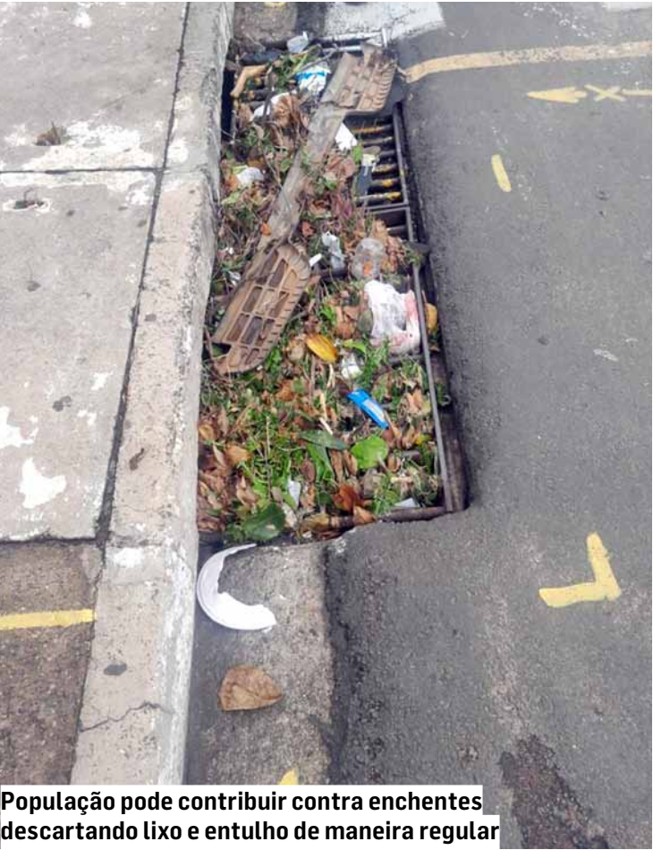
População pode contribuir contra enchentes descartando lixo e entulho de maneira regular

corda durante o episódio. A jovem relatou que não sabia nadar. Moradores relataram que o ponto onde o acidente aconteceu costuma alagar com frequência sempre que chove forte, tornando o trânsito arriscado e, em alguns momentos, inviável. A cidade registrou 26 milímetros de chuva, e equipes da Defesa Civil, Guarda Municipal, Samu, Corpo de Bombeiros e das secretarias de Meio Ambiente, Mobilidade e Serviços Urbanos, trabalharam no atendimento de outras ocorrências no município. A Polícia Civil foi acionada e deve conduzir a investigação do caso. A perícia técnica esteve no local para coletar informações e auxiliar na apuração das circunstâncias da morte. O corpo foi encaminhado ao Instituto Médico Legal (IML) de Americana.