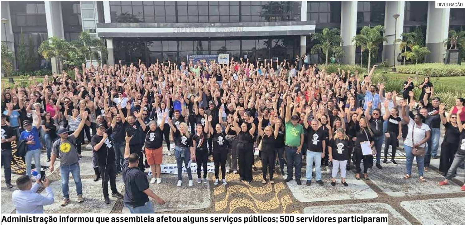
Administração informou que assembleia afetou alguns serviços públicos; 500 servidores participaram

Paulo Medina • NOVA ODESSA tribunaliberal@tribunaliberal.com.br