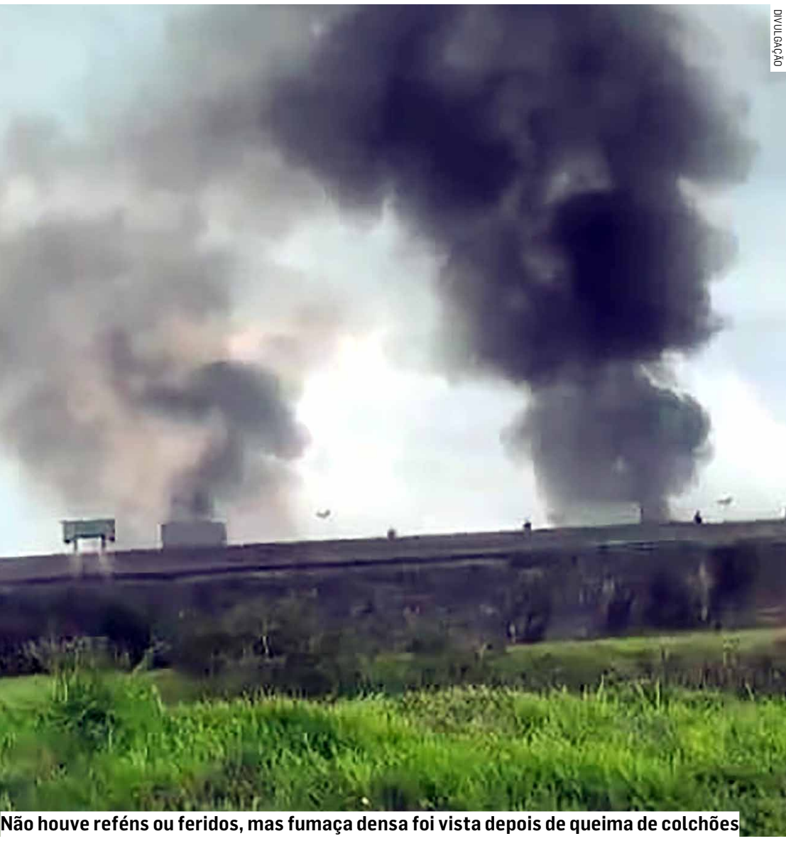
Não houve reféns ou feridos, mas fumaça densa foi vista depois de queima de colchões

Moradores próximos à penitenciária registraram imagens que mostram uma coluna de fumaça preta saindo da unidade. Por volta das 13h, a fumaça já havia cessado. Segundo o governo paulista, a P3 abriga mais de 1,2 mil presos na semana passada, embora sua capacidade total seja para 700 pessoas.