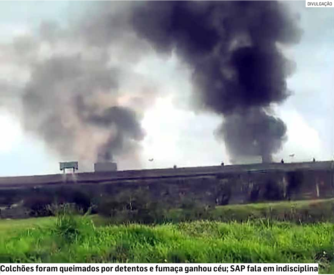
Colchões foram queimados por detentos e fumaça ganhou céu; SAP fala em indisciplina