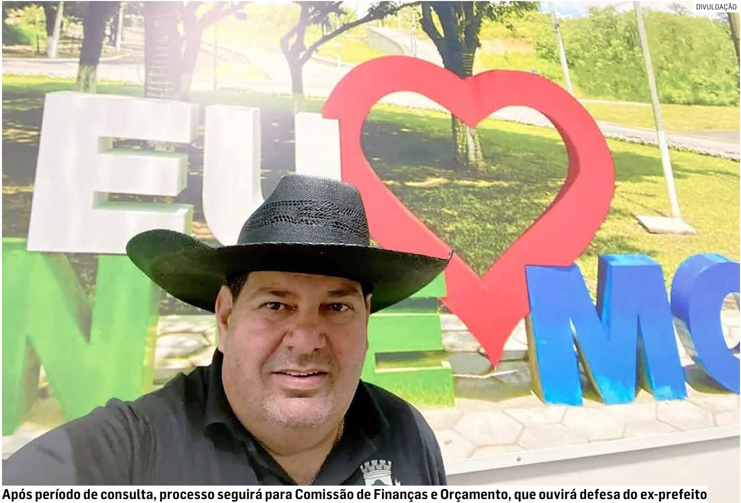
Após período de consulta, processo seguirá para Comissão de Finanças e Orçamento, que ouvirá defesa do ex-prefeito