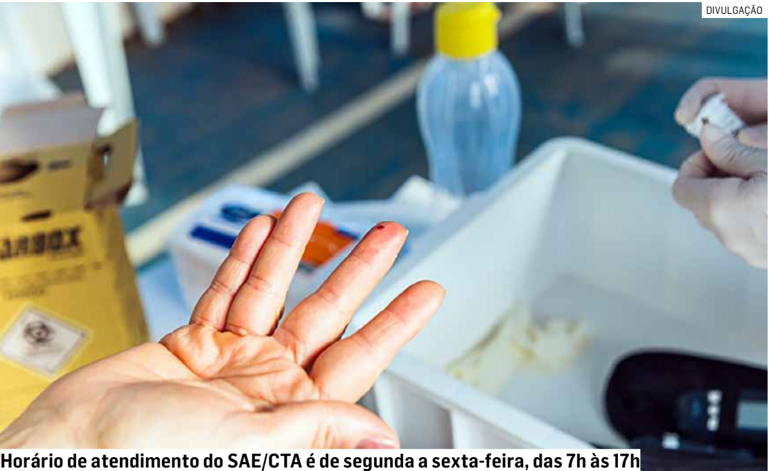
Horário de atendimento do SAE/CTA é de segunda a sexta-feira, das 7h às 17h

Em caso de dúvidas, o morador deve procurar o SAE/CTA, na Rua Maria das Dores Leal de Queiroz, 777, no Jardim Vista Alegre. O horário de atendimento é de segunda a sexta-feira, das 7h às 17h. A realização de testes rápidos é de segunda a sexta-feira, das 7h às 16h.