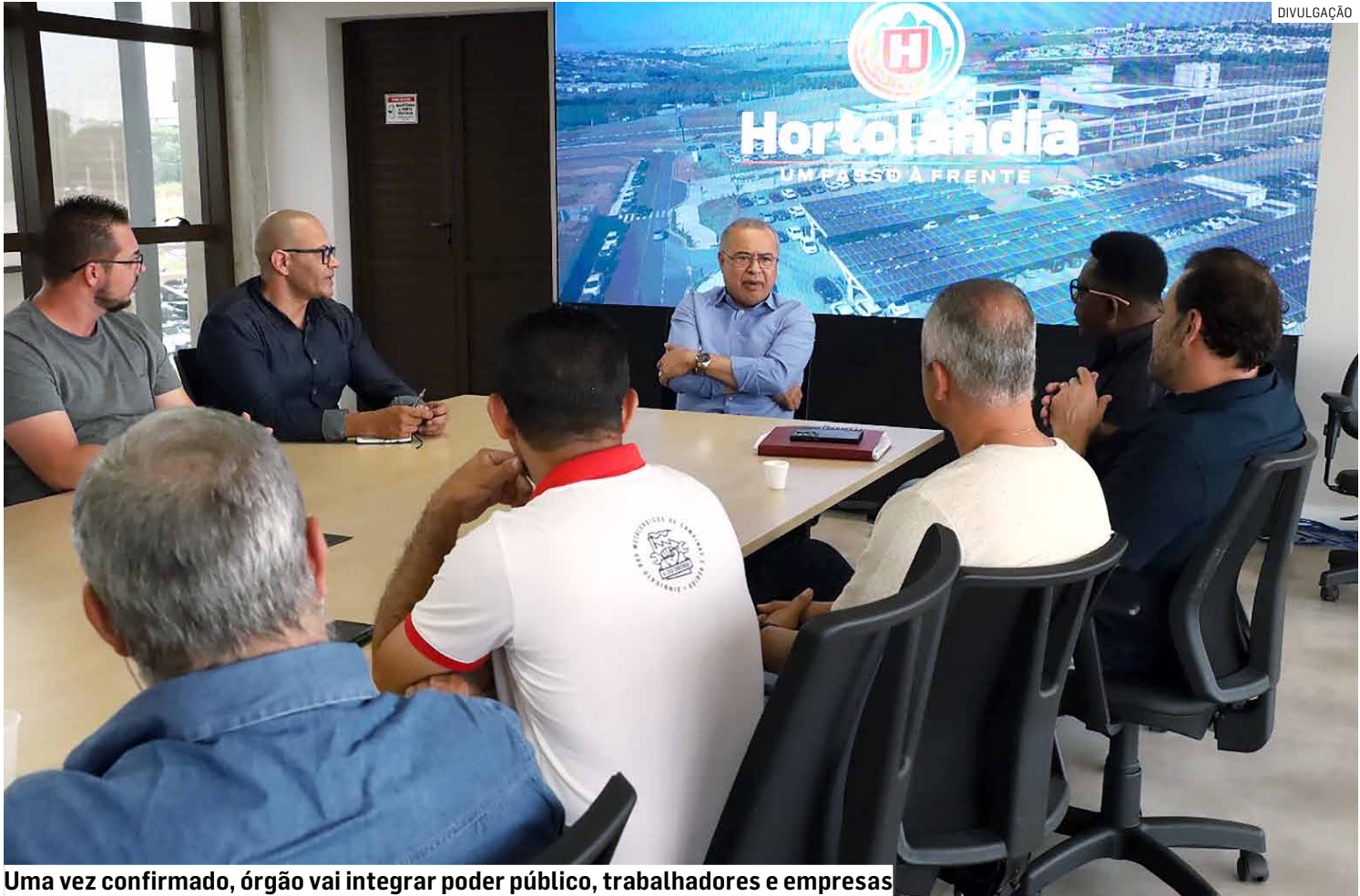
Uma vez confirmado, órgão vai integrar poder público, trabalhadores e empresas

O Cerest tem atuação especializada no atendimento de trabalhadores acometidos por doenças ou agravos relacionados ao ambiente laboral. Além da assistência direta, o órgão realiza ações de vigilância e investigação das condições de trabalho, utilizando dados epidemiológicos em parceria com a Vigilância Sanitária. Também atua como instância orientativa,