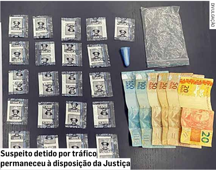
Suspeito detido por tráfico permaneceu à disposição da Justiça