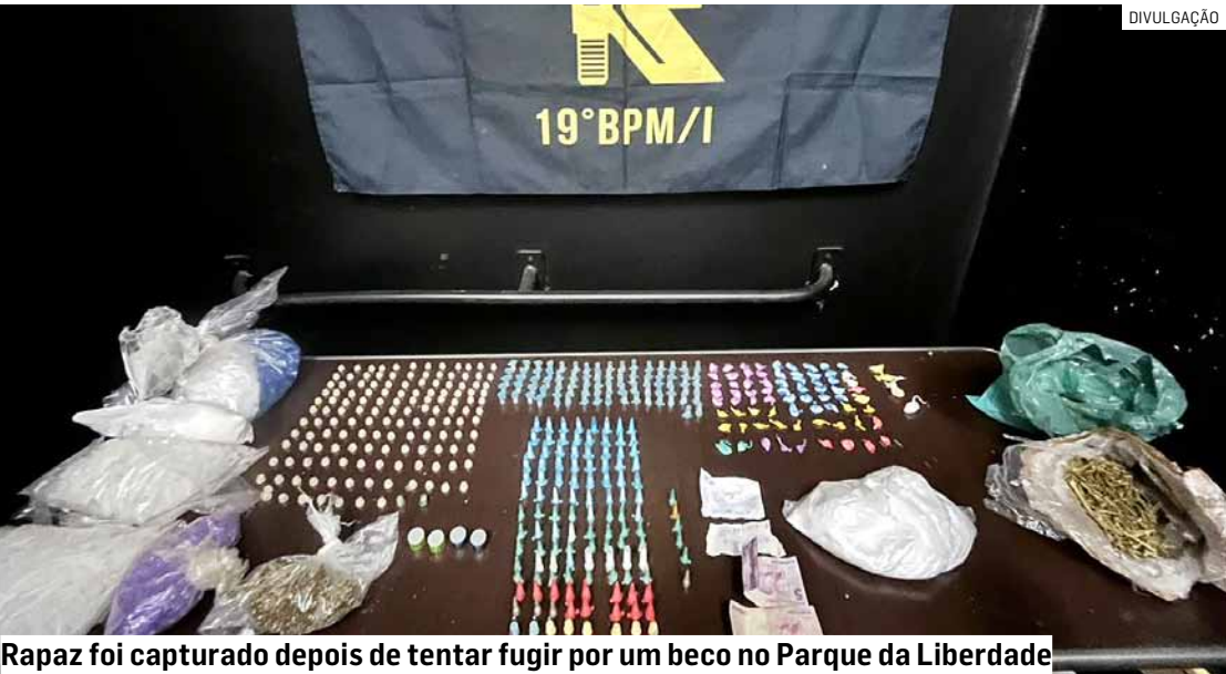
Rapaz foi capturado depois de tentar fugir por um beco no Parque da Liberdade