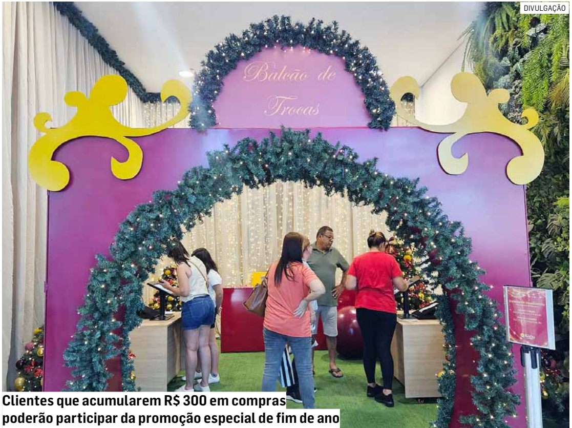
Clientes que acumularem R$ 300 em compras poderão participar da promoção especial de fim de ano