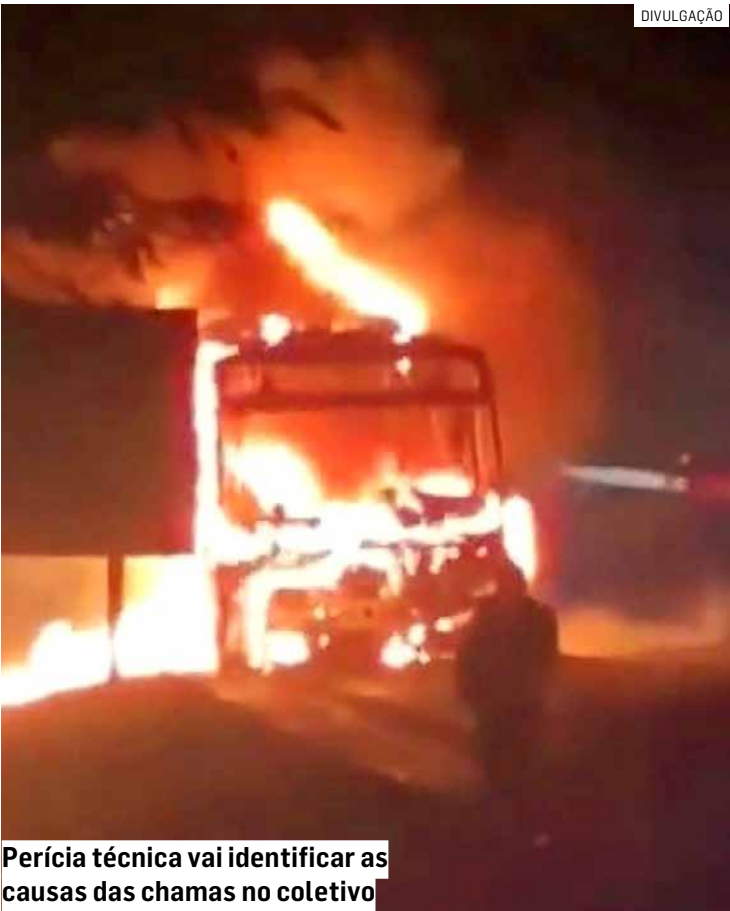
Perícia técnica vai identificar as causas das chamas no coletivo

bém enviou equipes de apoio para atuar na ocorrência e auxiliar na segurança da via. A rodovia precisou ser parcialmente interditada durante o atendimento, o que provocou lentidão no trecho. Motoristas que passavam pela região relataram grande quantidade de fumaça e a presença de veículos de emergência. Após o controle do incêndio, a perícia técnica esteve no local para analisar o veículo e identificar as causas do fogo. O laudo deve apontar se houve falha mecânica, curto-circuito ou outra possível origem do incidente. O ônibus foi removido da via após a conclusão dos trabalhos, e o trânsito foi liberado gradualmente.