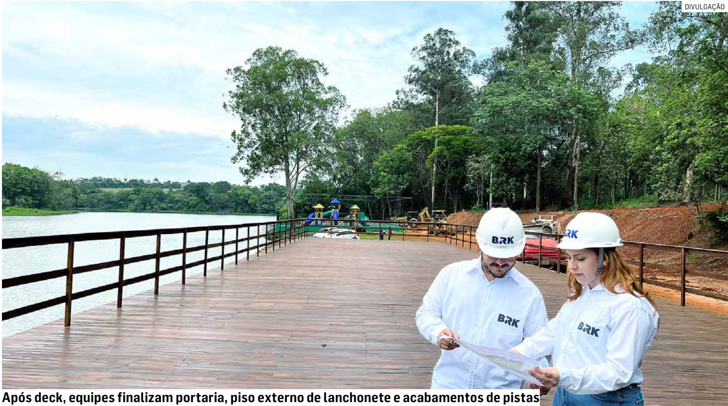
Após deck, equipes finalizam portaria, piso externo de lanchonete e acabamentos de pistas

Nas últimas semanas, a obra registrou marcos importantes: os banheiros masculino e feminino foram completamente finalizados, o playground está concluído e o deck de 490 metros quadrados (m²) foi totalmente executado, reforçando a nova proposta de uso do local e ampliando a infraestrutura para fu-