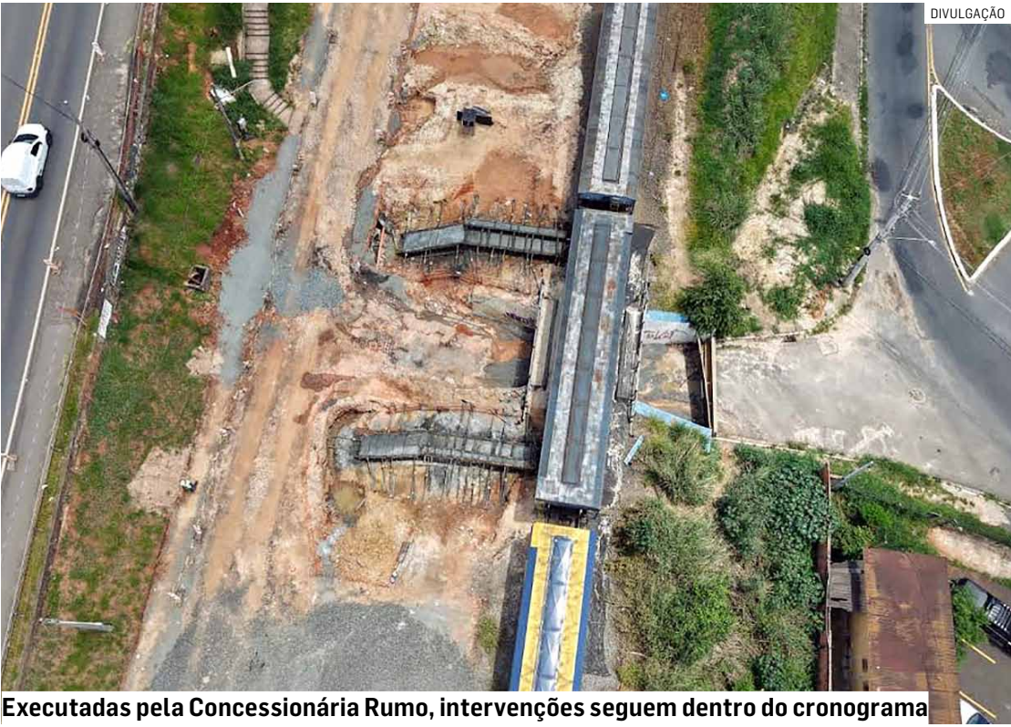
Executadas pela Concessionária Rumo, intervenções seguem dentro do cronograma

Outra obra de grande impacto e que também segue o ritmo previsto no cronograma é a duplicação da passagem inferior localizada entre as ruas Azil Martins e Goiânia, popularmente conhecida como “Viaduto do Pezão”. Situada entre o Jardim São Jorge e o Jardim Santa Rosa, a estrutura está sendo ampliada para eliminar desvios obrigatórios, melhorar o fluxo de veículos e garantir mais segurança no trânsito. Até o final do ano, será concluída a fase de concretagem da estrutura. A previsão é que os serviços sejam entregues até março de 2026.