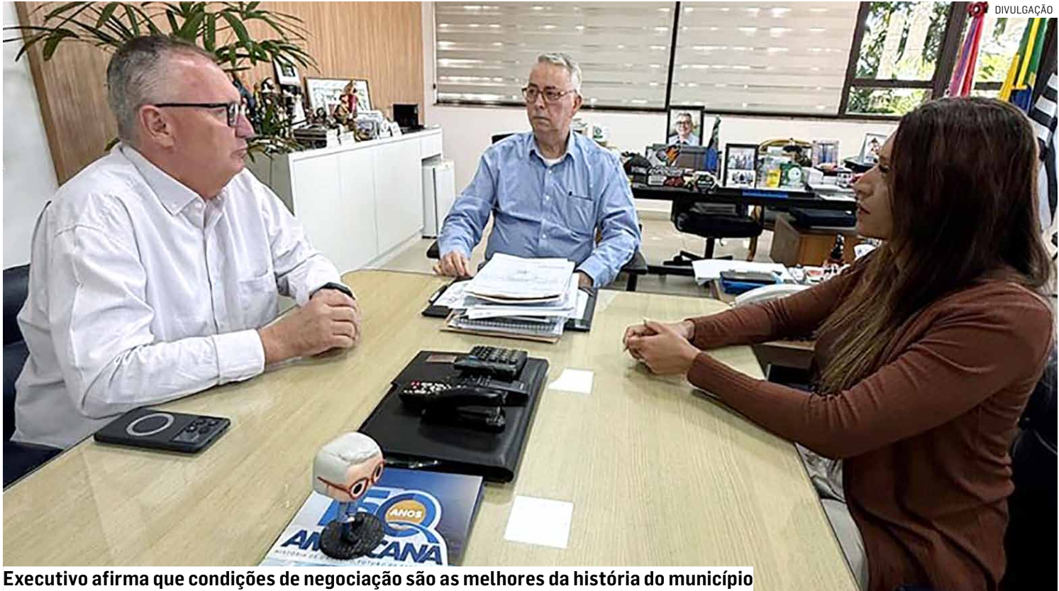
Executivo afirma que condições de negociação são as melhores da história do município

“As condições de negociação em 2025 são as melhores já estabelecidas na história do município e, atentos aos muitos apelos da população, estendemos o prazo para a negociação, ampliando-o até o final do ano. Por isso, é imprescindível que o contribuinte que esteja em débito com Americana