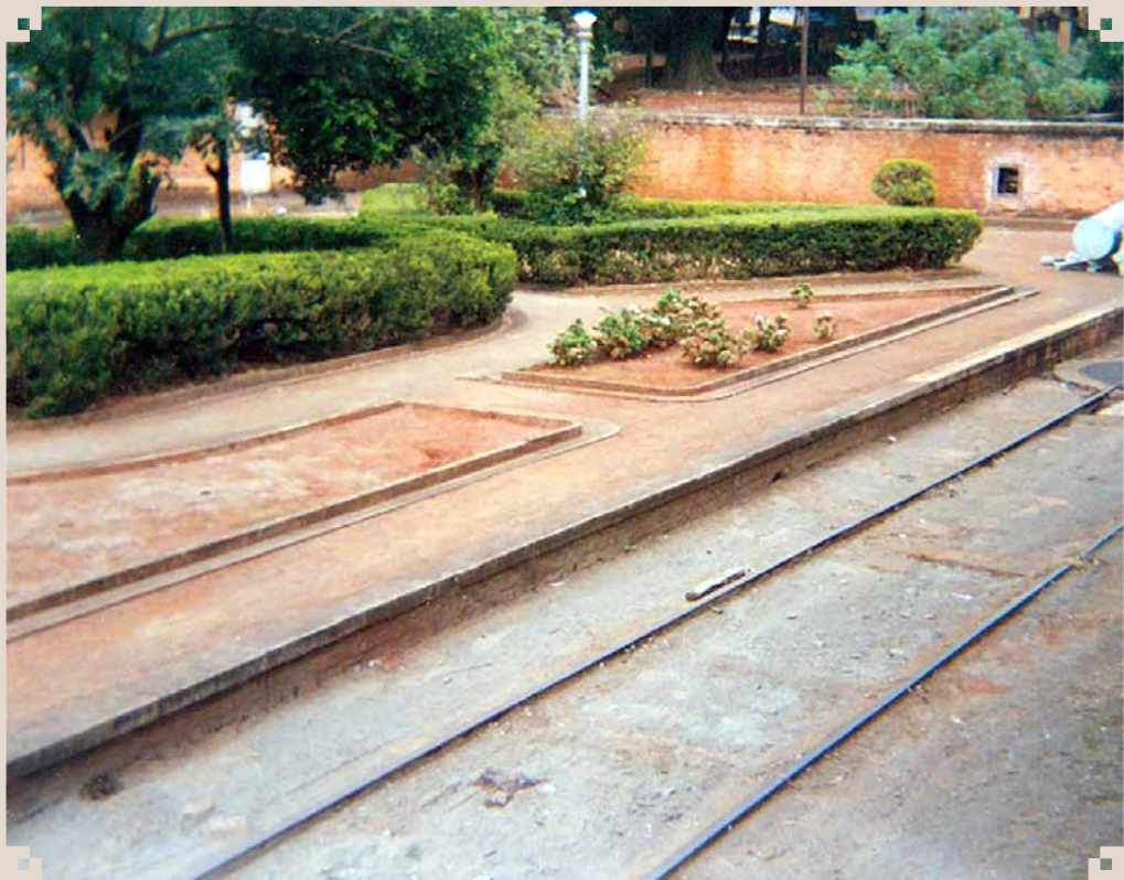
Foto do interior da Subestação de Energia Elétrica da Cia. Paulista de Estradas de Ferro. O trilho que vemos servia para transportar material elétrico do ramal ferroviário até o interior da subestação. Era o chamado “trolinho” de transporte de peças. O registro é da década de 2000.