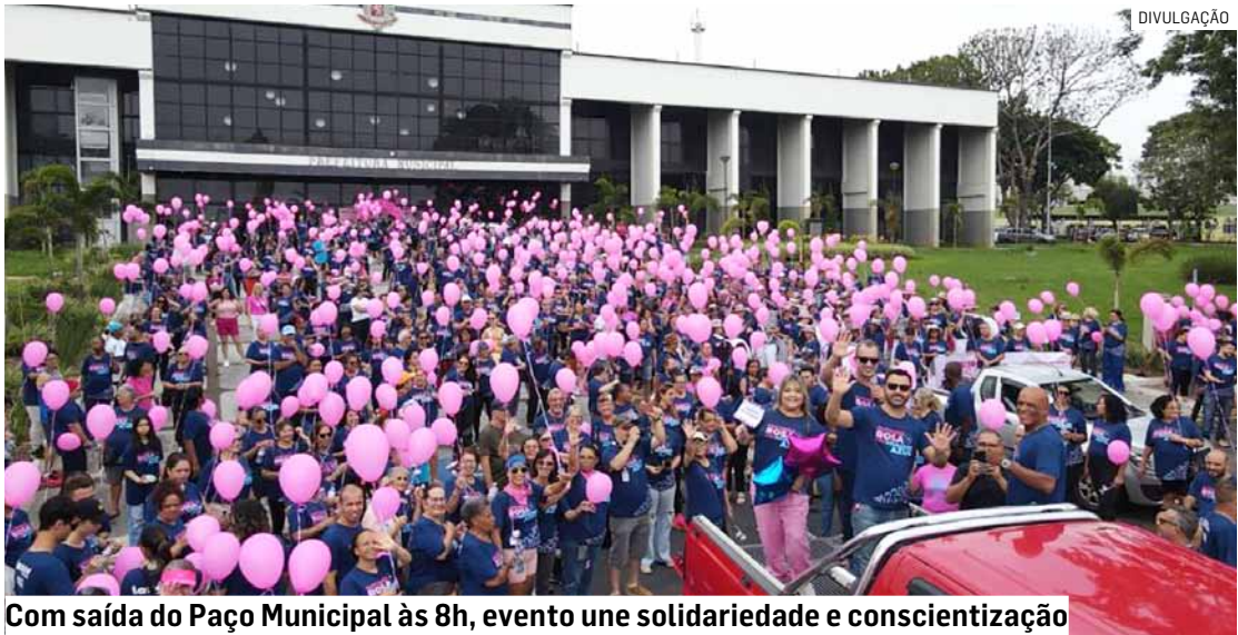
Com saída do Paço Municipal às 8h, evento une solidariedade e conscientização

com uma série de atividades programadas ao longo do mês, voltadas à valorização da mulher. A programação incluiu palestras sobre conscientização, diagnóstico precoce e prevenção ao câncer de mama no Fundo Social, Paço Municipal, CRESAM (Centro de Referência de Saúde da Mulher) e na Coden Ambiental. Simultaneamente à caminhada, haverá atendimentos do ônibus “SP Por Todas”, um projeto do Governo do Estado que acontece em diversos municípios oferecendo suporte jurídicos e psicossociais à mulher.