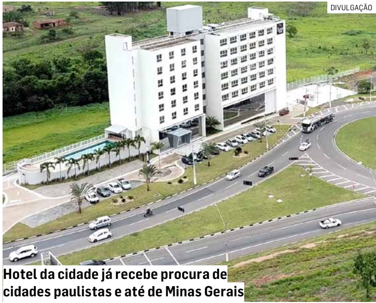
Hotel da cidade já recebe procura de cidades paulistas e até de Minas Gerais

Anitta vai apresentar em seu show a edição “Cosmos” dos “Ensaios da Anitta”. A proposta mergulha no universo da astrologia: cenários, luzes e figurinos seguem a estética interestelar, com referências a signos e elementos do zodíaco que devem pautar tanto o repertório quanto as trocas de looks ao longo do espetáculo.