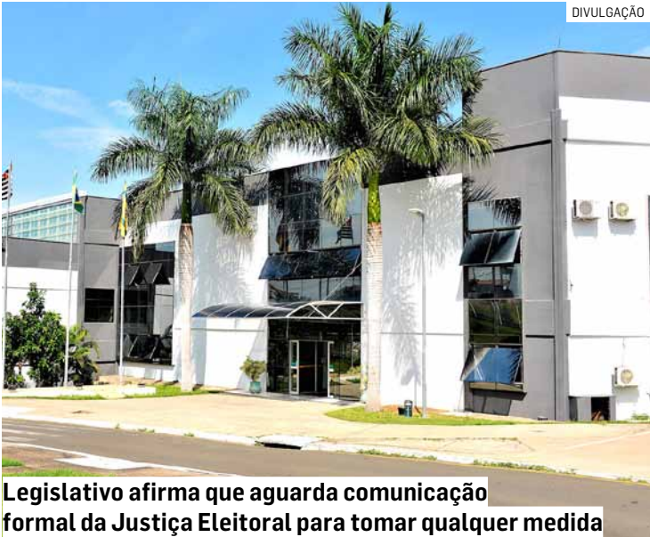
Legislativo afirma que aguarda comunicação formal da Justiça Eleitoral para tomar qualquer medida