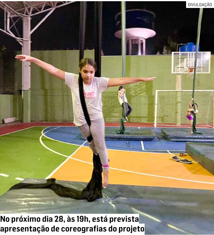
No próximo dia 28, às 19h, está prevista apresentação de coreografias do projeto

As aulas, realizadas às terças e quintas-feiras, das 19h às 20h30, foram planejadas para se adequar à rotina dos participantes, garantindo acesso, segurança e inclusão. Sob a condução de um profissional especializado, os alunos mergulharam em um aprendizado que uniu técnica, teoria e sensibilidade artística. As oficinas abordaram desde fundamentos da acrobacia aérea em tecido, segurança e preparo físico, até expressão corporal e história da arte circense. Essa metodologia integrada permitiu o desenvolvimen-