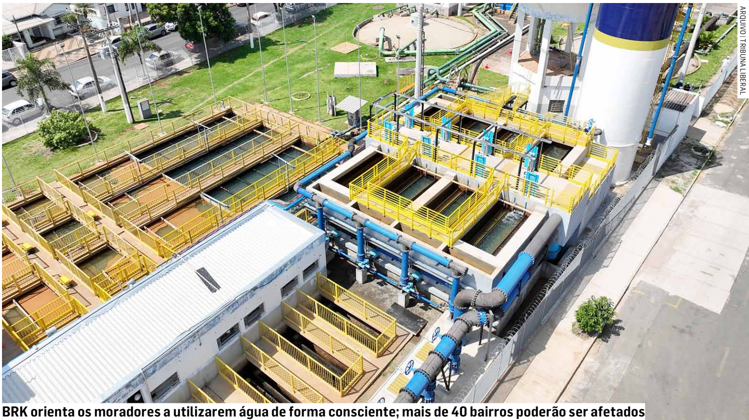
BRK orienta os moradores a utilizarem água de forma consciente; mais de 40 bairros poderão ser afetados

“Realizar essas manutenções de forma programada é fundamental para garantir a eficiência do sistema de abastecimento. Ao realizarmos esse tipo de intervenção de forma preventiva, conseguimos evitar paradas não programadas, re-