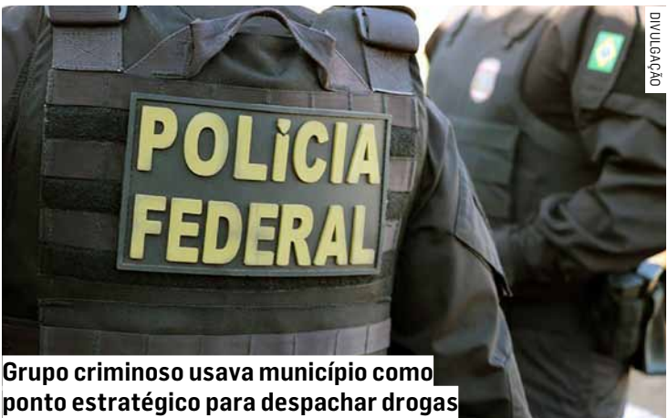
Grupo criminoso usava município como ponto estratégico para despachar drogas

De acordo com a PF, foram cumpridos dois mandados de prisão preventiva e um mandado de busca e apreensão. As investigações começaram após a apreensão de duas remessas encaminhadas à Aus-