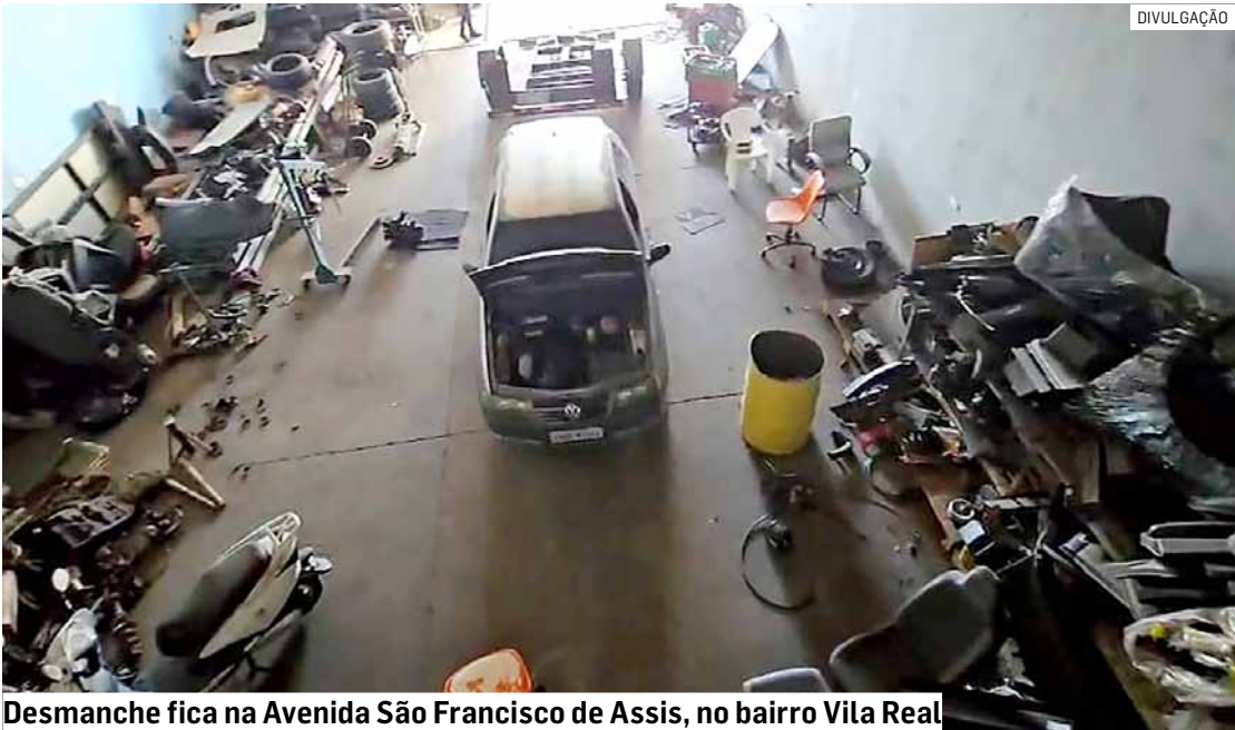
Desmanche fica na Avenida São Francisco de Assis, no bairro Vila Real

Durante a fiscalização, os investigadores encontraram diversas peças de veículos sem as etiquetas obrigatórias de comercialização emitidas pelo Departamento Estadual de Trânsito (Detran-SP). Além disso, foi localizada uma placa de automóvel sem registro junto ao órgão competente, o que levantou suspeitas de