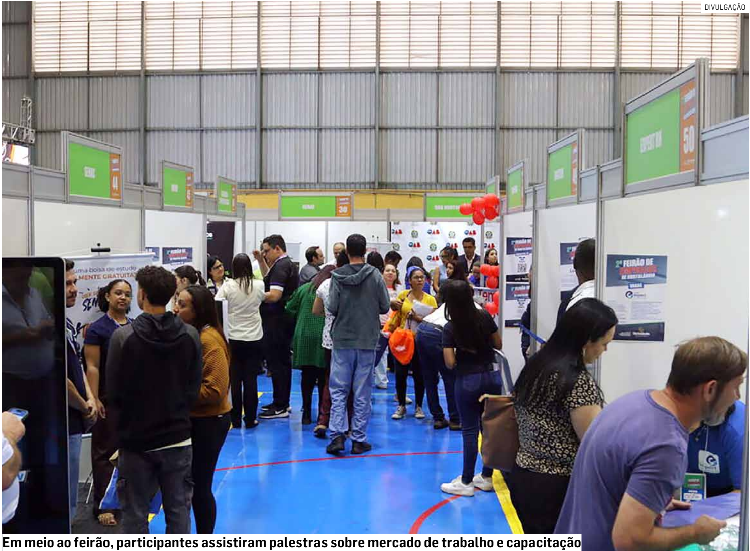
Em meio ao feirão, participantes assistiram palestras sobre mercado de trabalho e capacitação

“Todo mundo tem direito a emprego. Vejo aqui que tem muita juventude querendo arrumar trabalho. Também tem bastante gente da Melhor Idade. E isso é importante, o idoso ainda se sentir útil para trabalhar. A cidade está em franco crescimento, e por isso está empregando muito. Estamos fazendo a nossa parte. A gente vai continuar a batalhar por vocês no mercado de trabalho. Para que vocês tenham acesso às melhores