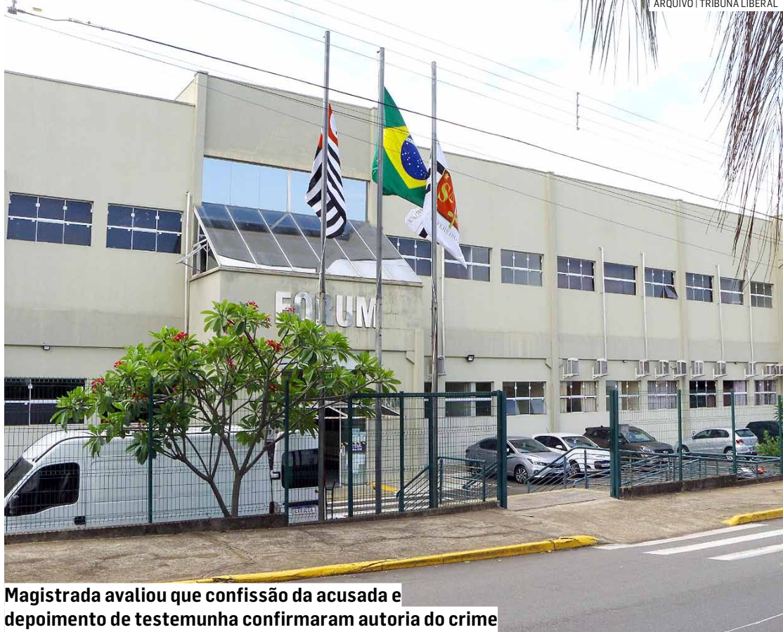
Magistrada avaliou que confissão da acusada e depoimento de testemunha confirmaram autoria do crime

Durante o processo, ficou comprovado que a ré enviou áudios e mensagens de WhatsApp cha-