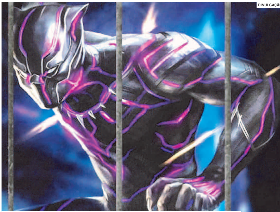
Evento acontece no Shopping Hortolândia a partir de segunda-feira, dia 25

As instalações da mostra permitem conhecer ainda um continente culturalmente alargado pe-