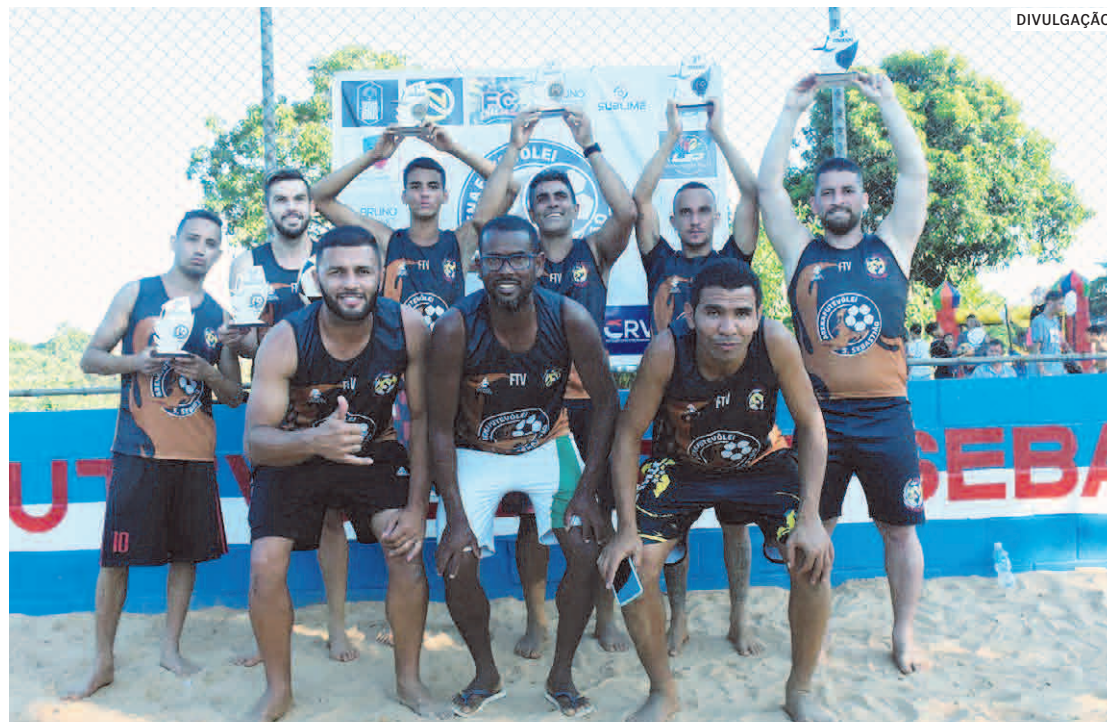
Com diversas jogadas de habilidade, duplas fizeram o público aplaudir em pé