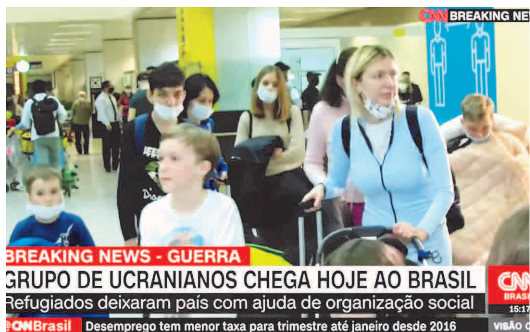
BREAKING NEWS - GUERRA GRUPO DE UCRANIANOS CHEGA HOJE AO BRASIL Refugiados deixaram país com ajuda de organização social

Como será o acolhimento/julgamento dos imigrantes ucranianos de 2022 na Europa e no Brasil?