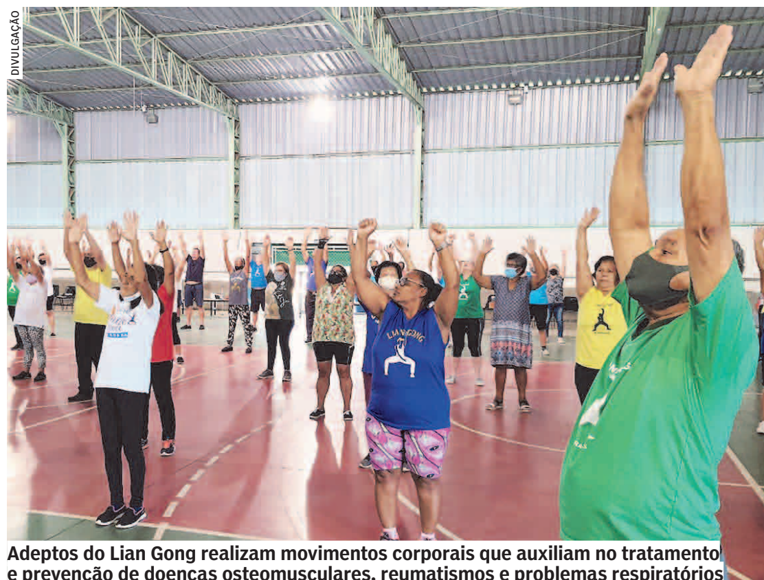
Adeptos do Lian Gong realizam movimentos corporais que auxiliam no tratamento e prevenção de doenças osteomusculares, reumatismos e problemas respiratórios