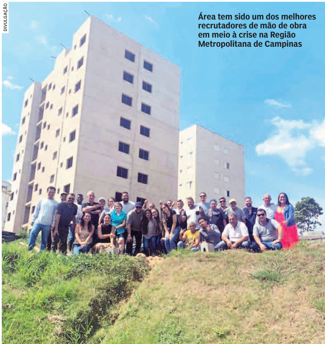
Área tem sido um dos melhores recrutadores de mão de obra em meio à crise na Região Metropolitana de Campinas

Diante desse cenário positivo, muita gente que havia perdido o emprego em outros setores, como de comércio ou serviços, passou a procurar um novo trabalho justamente nos canteiros de obras. Isso inclui trabalhadores como carpinteiros, pedreiros, auxiliares de pedreiros, eletricitistas,