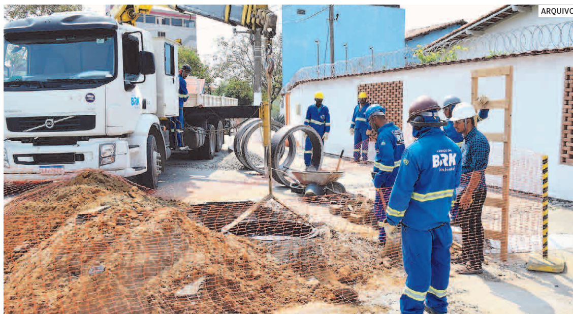
Suporte emocional: BRK implantou o Programa de Apoio Pessoal Viva Bem que inclui cuidados com a saúde mental dos trabalhadores e seus familiares

De acordo com a assessoria de imprensa da BRK, o Viva Bem também oferece acompanhamento psicológico aos funcionários que perderam familiares nos últimos anos, seja por Covid-19 ou