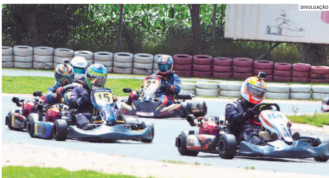
Pilotos se aproximam do kartismo para sentir a emoção de pilotar em uma pista

“Sim, com certeza todos ali são amantes do automobilismo. É quase que uma religião. Acredito que a divulgação do esporte, seja fórmula ou turismo, desperta a curiosidade das pessoas, que então procuram o kart para tirar a dúvida. Ai vira paixão à primeira vista”, salienta. Monteiro lembra que tanto o kart quanto car-