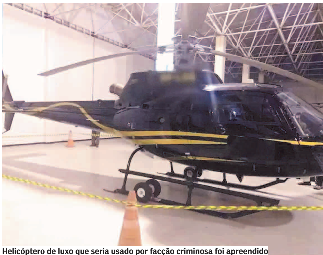
Helicóptero de luxo que seria usado por facção criminosa foi apreendido

Em outubro de 2019, a Polícia Civil promoveu duas ações de combate ao tráfico que representaram um grande avanço no enfrentamento ao crime organizado no interior do Estado. As ações de campo, resultado de longos serviços de investigação, ocorreram nas cidades de Sumaré, Americana, Jundiá, Sorocaba e Birigui e foram coordenadas pela 2ª Delegacia Seccional de Campinas e pela Dise de Americana.