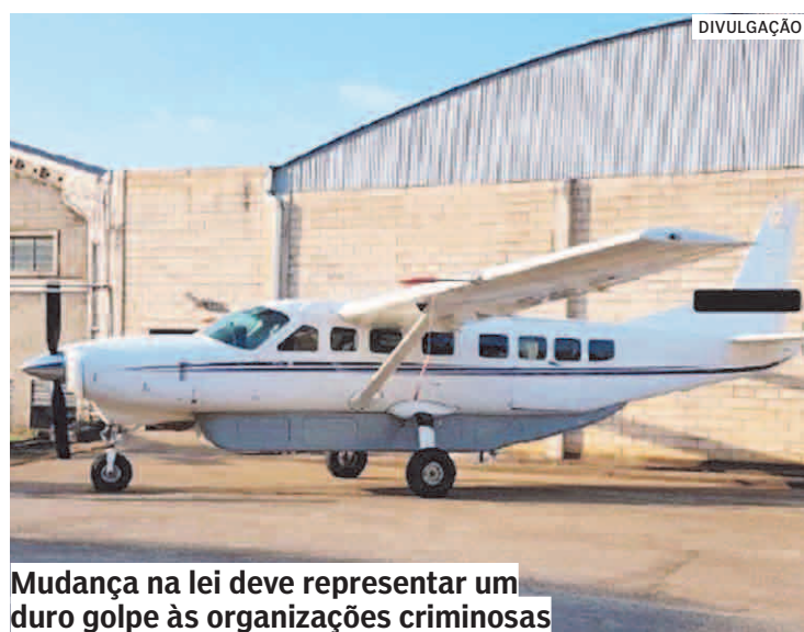
Mudança na lei deve representar um duro golpe às organizações criminosas