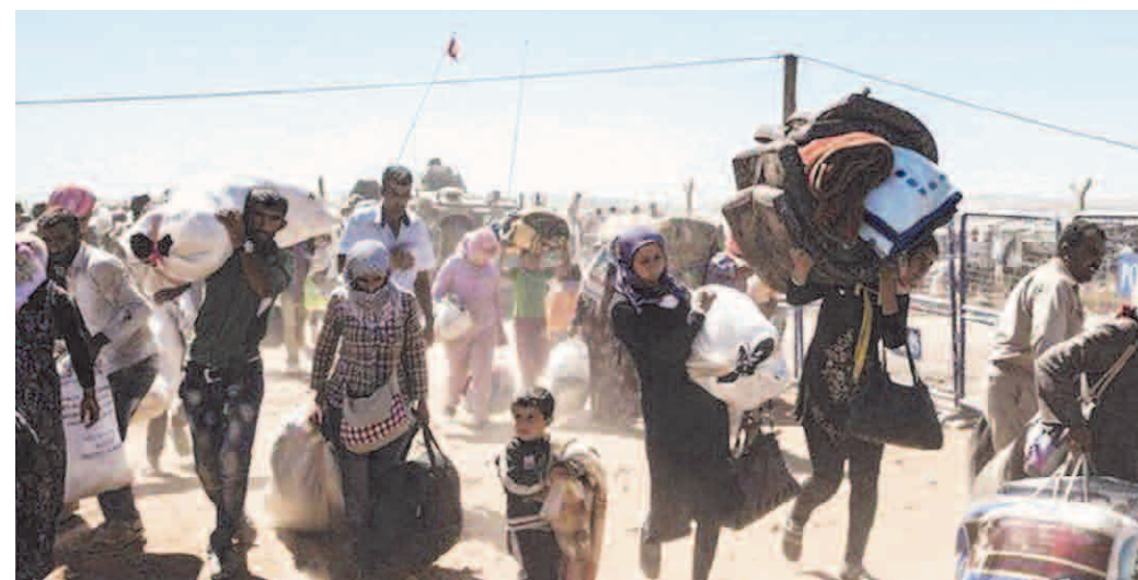
Milhares de pessoas deixam a Síria e se refugiam na Turquia

da África a partir de 18 de dezembro de 2010. A Guerra na Síria foi deflagrada quando um grupo de cidadãos se indignou com as denúncias de corrupção reveladas pelo WikiLeaks. Então, tivemos o êxodo dos cidadãos sírios buscando abrigo em outros países.