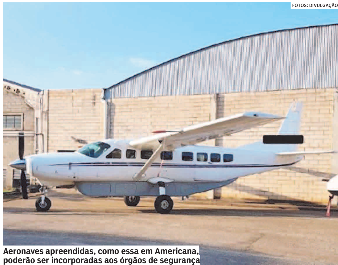
Aeronaves apreendidas, como essa em Americana, poderão ser incorporadas aos órgãos de segurança

Os policiais geralmente ficam vários meses apurando e tentando levantar as provas que justifiquem um mandado de