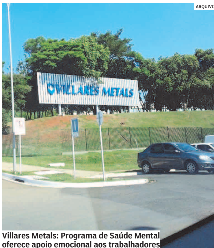
Villares Metals: Programa de Saúde Mental oferece apoio emocional aos trabalhadores

Desde 2015, a Villares Metals trabalha na construção do programa de qualidade de vida, que oferece atendimentos multiprofissionais, focado em prevenção e diagnóstico precoce de patologias. O Programa de saúde Mental,