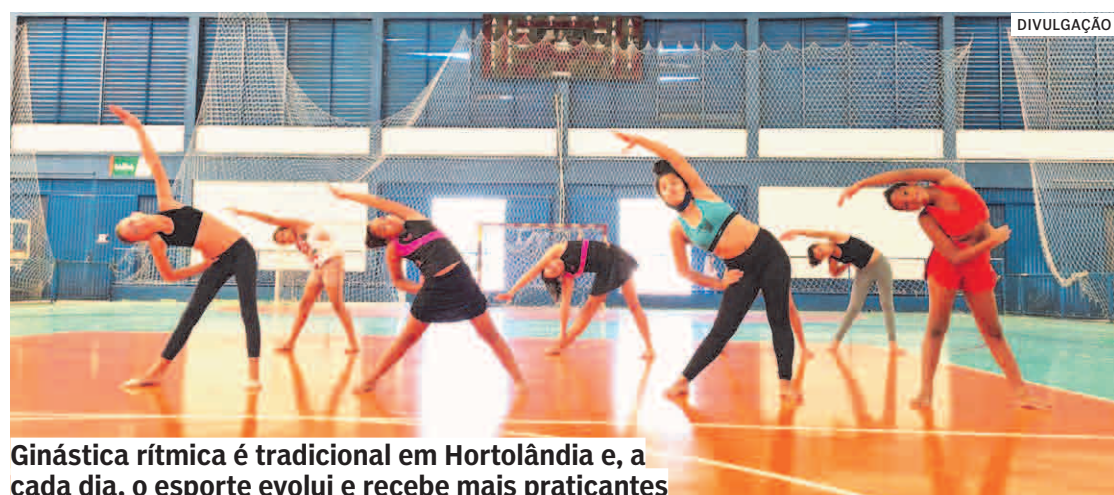
Ginástica rítmica é tradicional em Hortolândia e, a cada dia, o esporte evolui e recebe mais praticantes

As competições são realizadas sempre sobre um tablado e seu tempo de realização varia entre 75 segundos, para as provas individuais, e 150 segundos para as provas de conjunto.