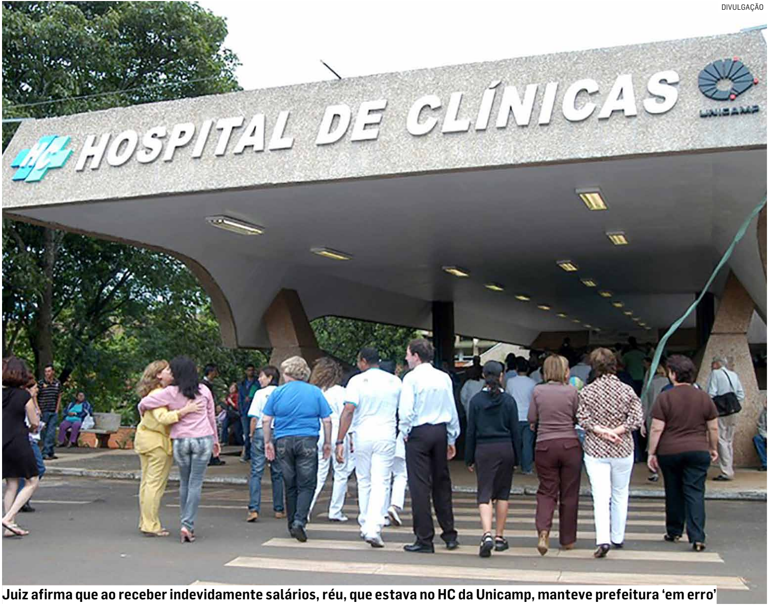
Juiz afirma que ao receber indevidamente salários, réu, que estava no HC da Unicamp, manteve prefeitura 'em erro'

A defesa do ex-servidor alegou que não hou-