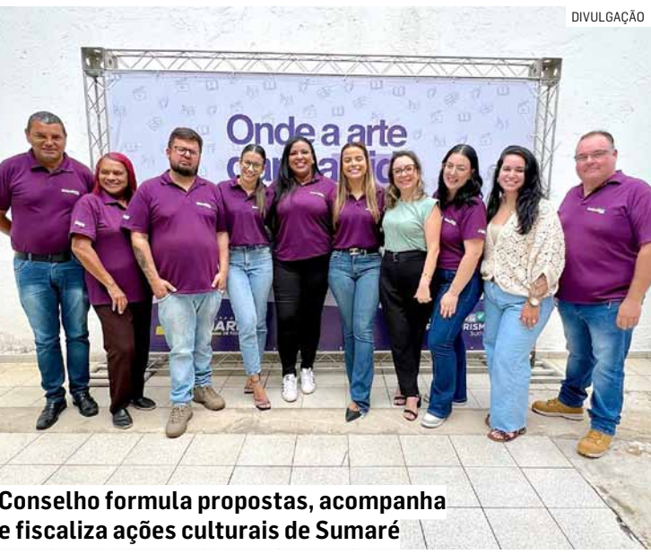
Conselho formula propostas, acompanha e fiscaliza ações culturais de Sumaré

Ainda segundo a secretária, a atuação conjunta entre governo e sociedade fortalece a transparência e contribui para que os investimentos e projetos culturais atendam às reais necessidades da população. Com a posse, o Conselho Municipal de Cultura passa a atuar de forma efetiva, contribuindo para o planejamento, a execução e a consolidação de iniciativas que promovam a cultura como instrumento de identidade, inclusão social e desenvolvimento em Sumaré.