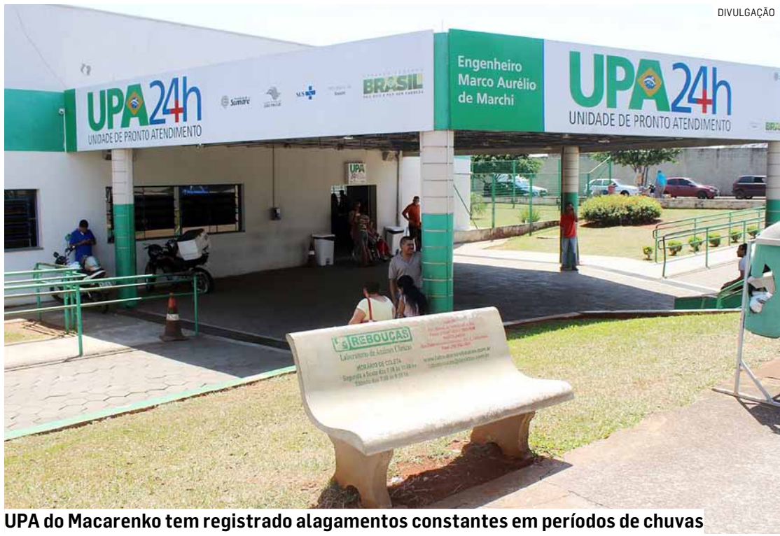
UPA do Macarenko tem registrado alagamentos constantes em períodos de chuvas

Com processo licitatório já em andamento, obra visa resolver problema histórico enfrentado pela unidade de saúde da região central da cidade; planejamento técnico prevê solução definitiva