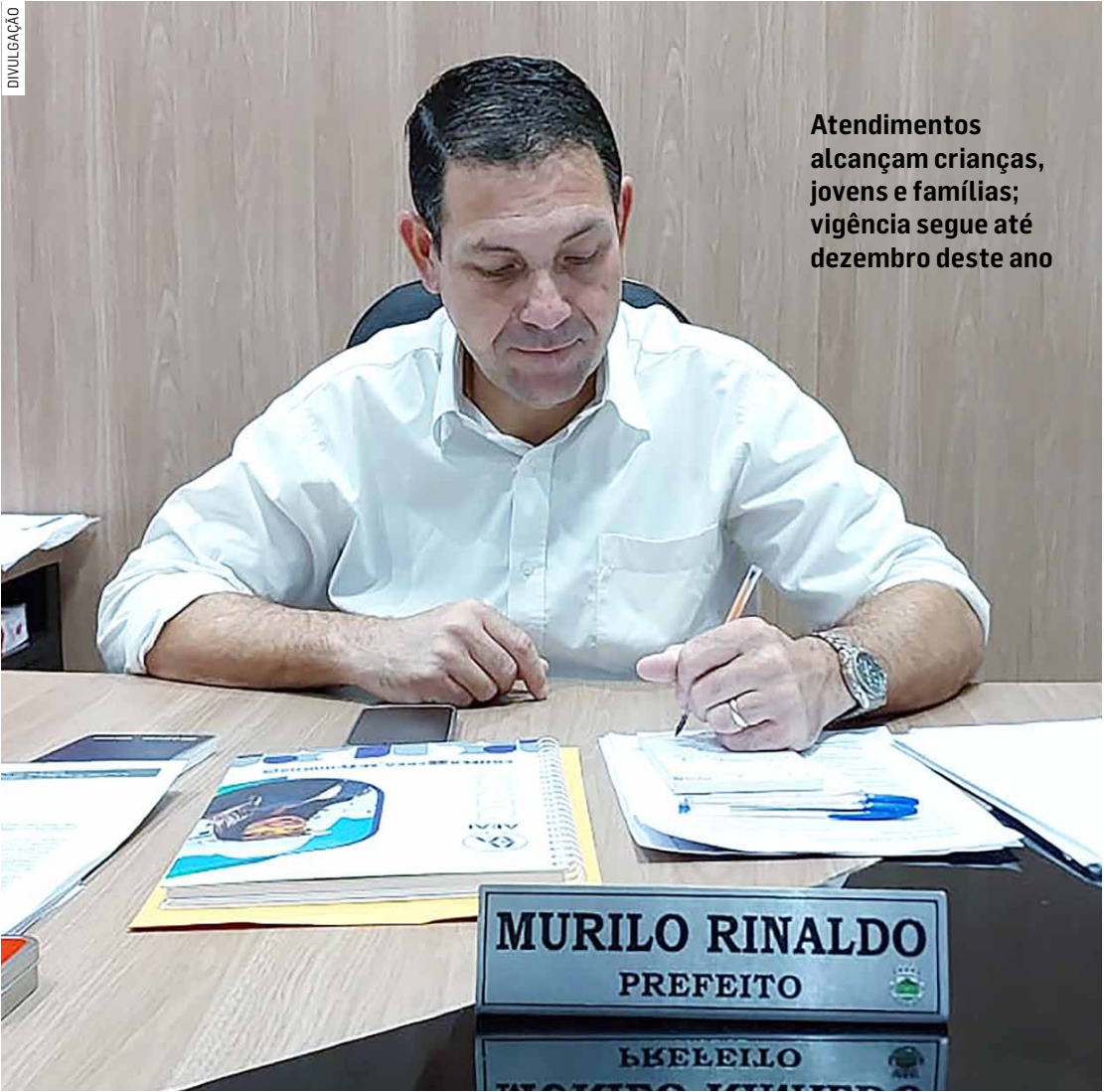
Atendimentos alcançam crianças, jovens e famílias; vigência segue até dezembro deste ano