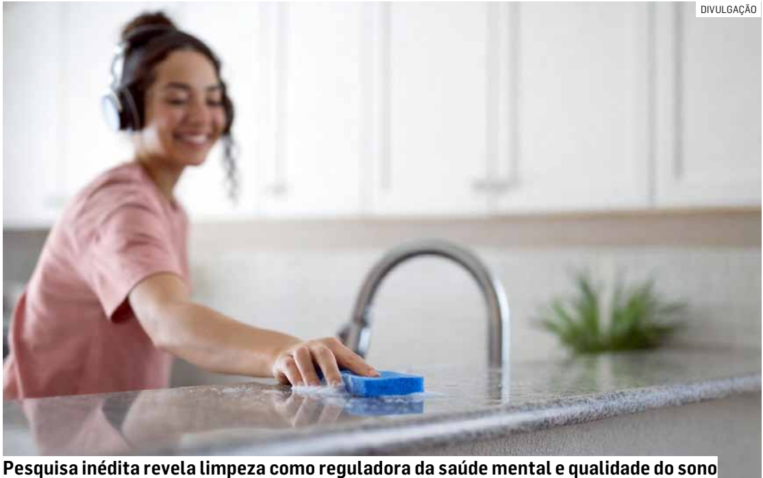
Pesquisa inédita revela limpeza como reguladora da saúde mental e qualidade do sono

Os resultados posicionam a limpeza doméstica não apenas como uma obrigação funcional, mas como uma forma de cuidado mental e emocional. Para 63% dos entrevistados, limpar a casa funciona como uma verdadeira terapia doméstica. Este sentimento é reforçado pela percepção de que a atividade ajuda a organizar o pensamento e a retomar o controle sobre a própria vida.