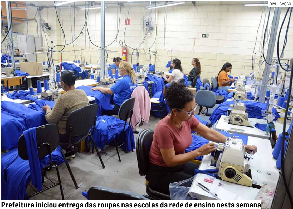
Prefeitura iniciou entrega das roupas nas escolas da rede de ensino nesta semana

As crianças ainda desfrutam das férias com brincadeiras e diversão. Enquanto isso, Hortolândia segue em ritmo intenso de trabalho para deixar tudo preparado para a volta às aulas na rede municipal de ensino. Esta semana, a prefeitura iniciou o envio dos uniformes dos alunos para as escolas municipais. De acordo com a Secretaria de Educação, Ciência e Tecnologia, a entrega dos uniformes escolares deste ano para famílias, pais e responsáveis será feita em fevereiro. Foram confeccionados