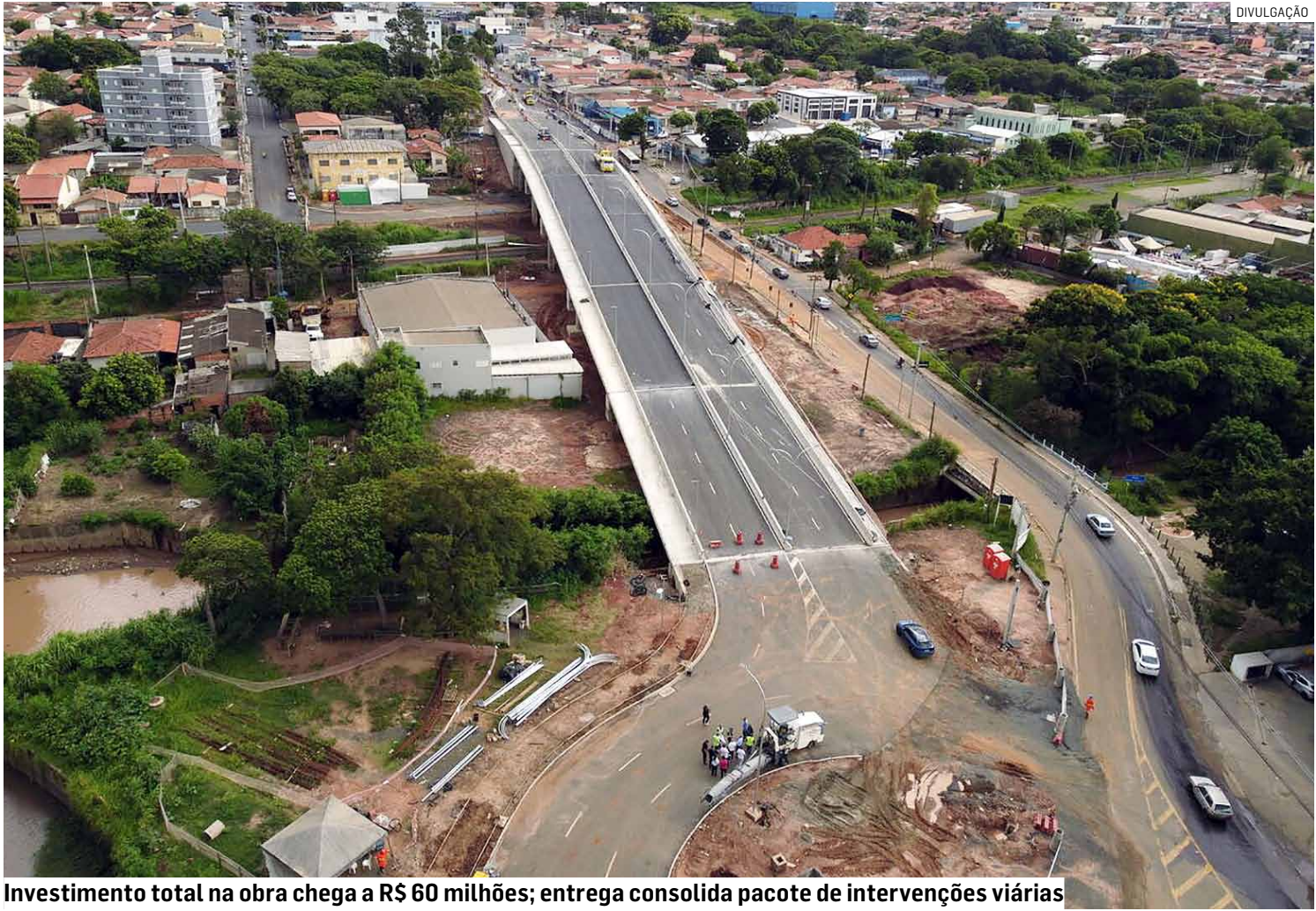
Investimento total na obra chega a R$ 60 milhões; entrega consolida pacote de intervenções viárias

“Este viaduto é a principal obra da nossa cidade. A população espera isso por mais de 40 anos e estamos concretizando este sonho. Por aqui, vamos realizar esta importante integração da SP-101, da região central