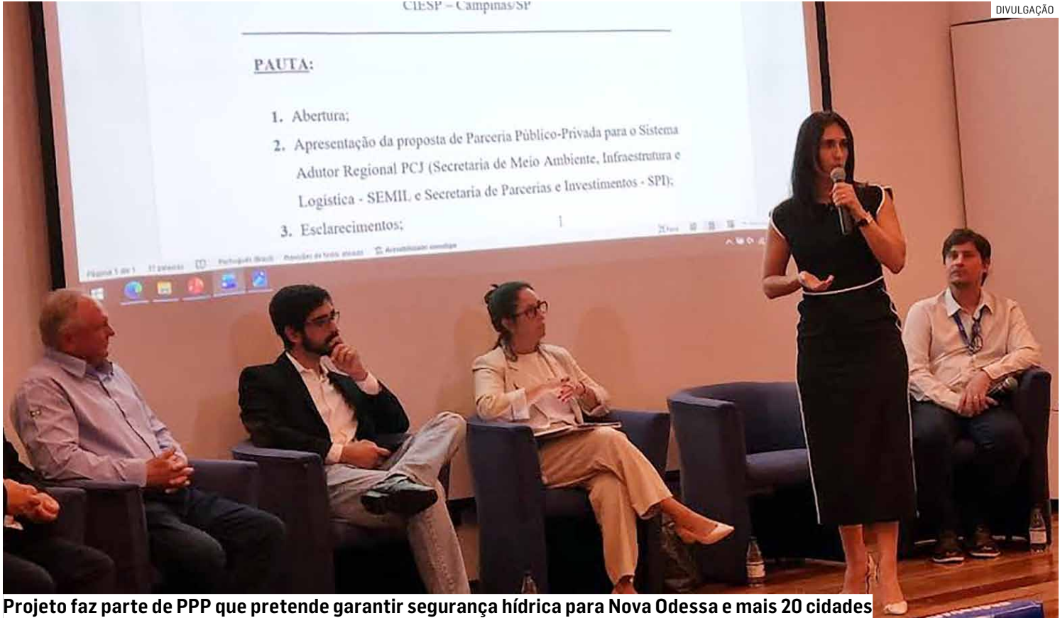
Projeto faz parte de PPP que pretende garantir segurança hídrica para Nova Odessa e mais 20 cidades