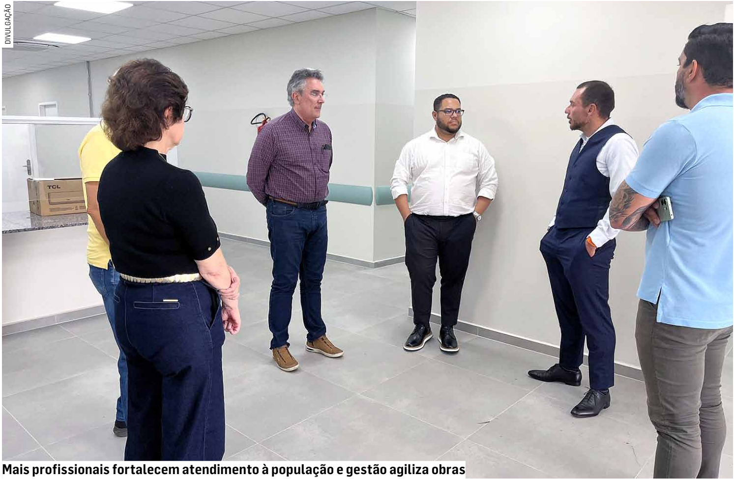
Mais profissionais fortalecem atendimento à população e gestão agiliza obras

A nova unidade reforça a estratégia da administração municipal de descentralizar o atendimento e garantir mais agilidade aos pacientes. Com o funcionamento do PA Monte Alegre, Paulínia passará a contar com três principais pontos de Pronto Atendi-