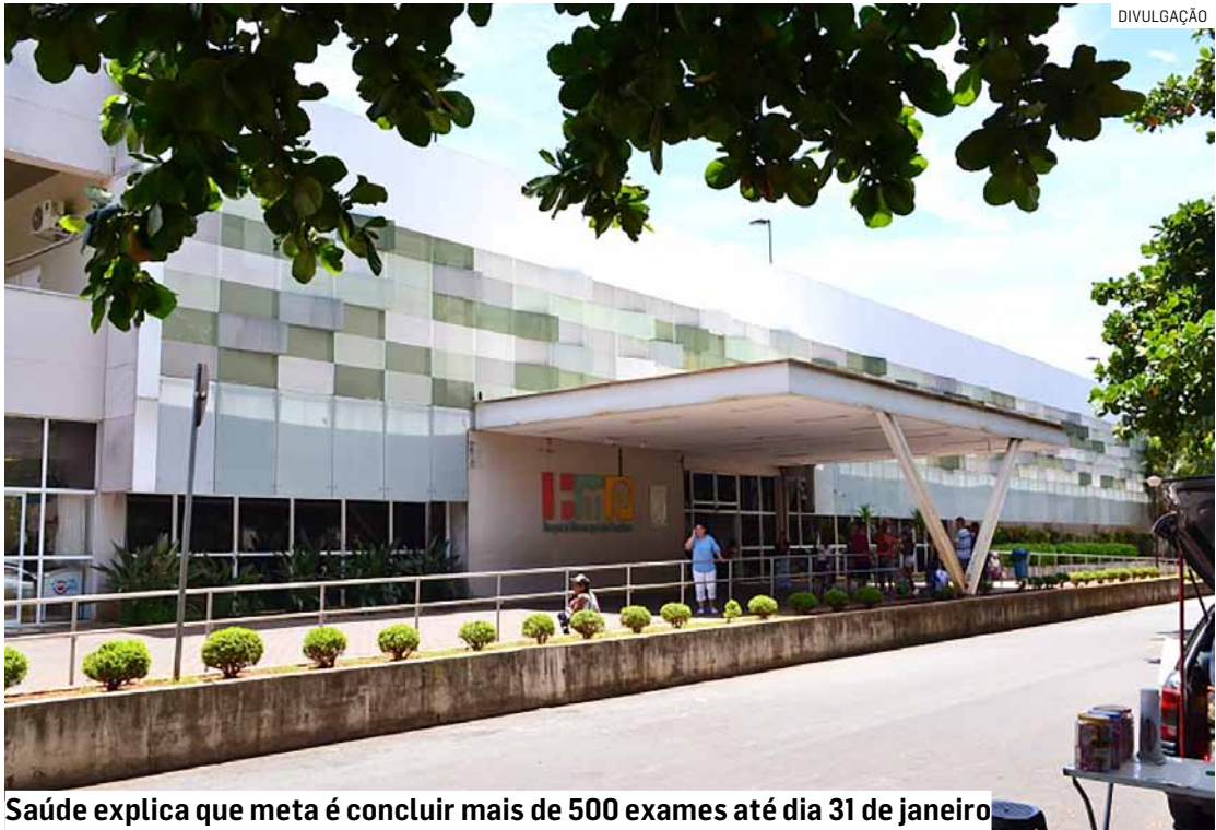
Saúde explica que meta é concluir mais de 500 exames até dia 31 de janeiro

O PA do Monte Alegre integra um investimento de aproximadamente R$ 3 milhões e tem como objetivo principal atender a demanda crescente da região, fortalecendo a rede de urgência e emergência e reduzindo a sobrecarga do Hospital Municipal.