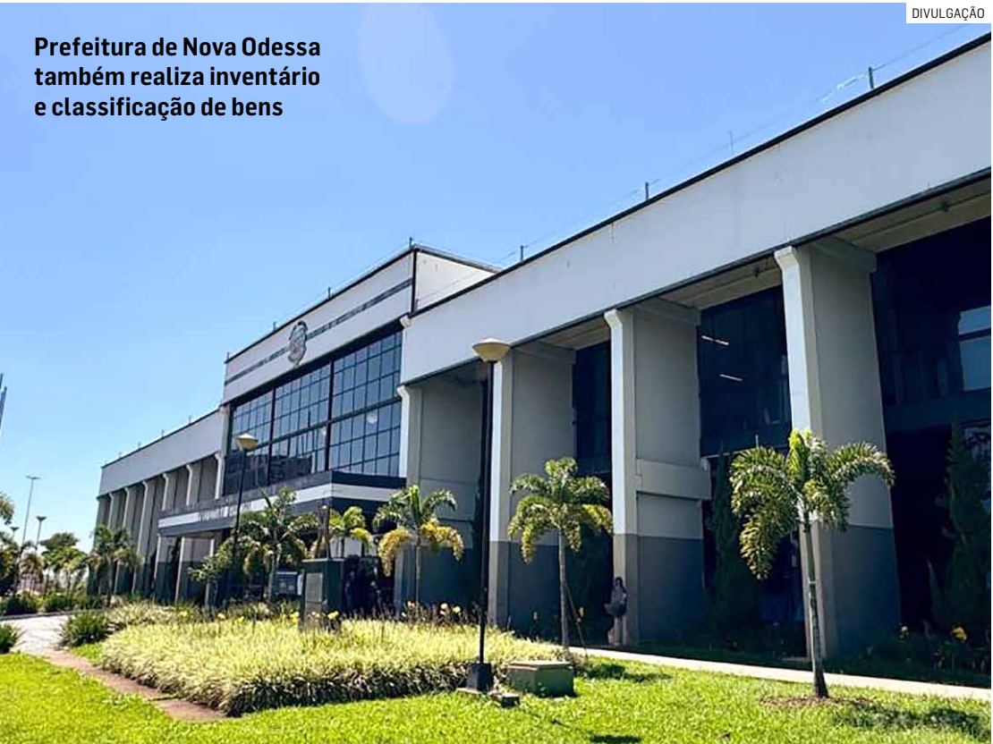
Prefeitura de Nova Odessa também realiza inventário e classificação de bens

Nesse contexto, foi publicada nesta semana portaria que institui a Comissão de Inventário e Avaliação para Desfazimento de Bens Móveis do Município de Nova Odessa. A comissão será responsável por realizar o inventário, a avaliação, a classificação e a destinação de bens considerados inservíveis, em conjunto com o Setor de Patrimônio. A portaria estabelece ainda que, nos casos de desfazimento por meio de leilão, a condução do processo caberá à Secretaria Municipal de Administração, além de prever a elaboração de relatório analítico final para registro no Balanço Patrimonial.