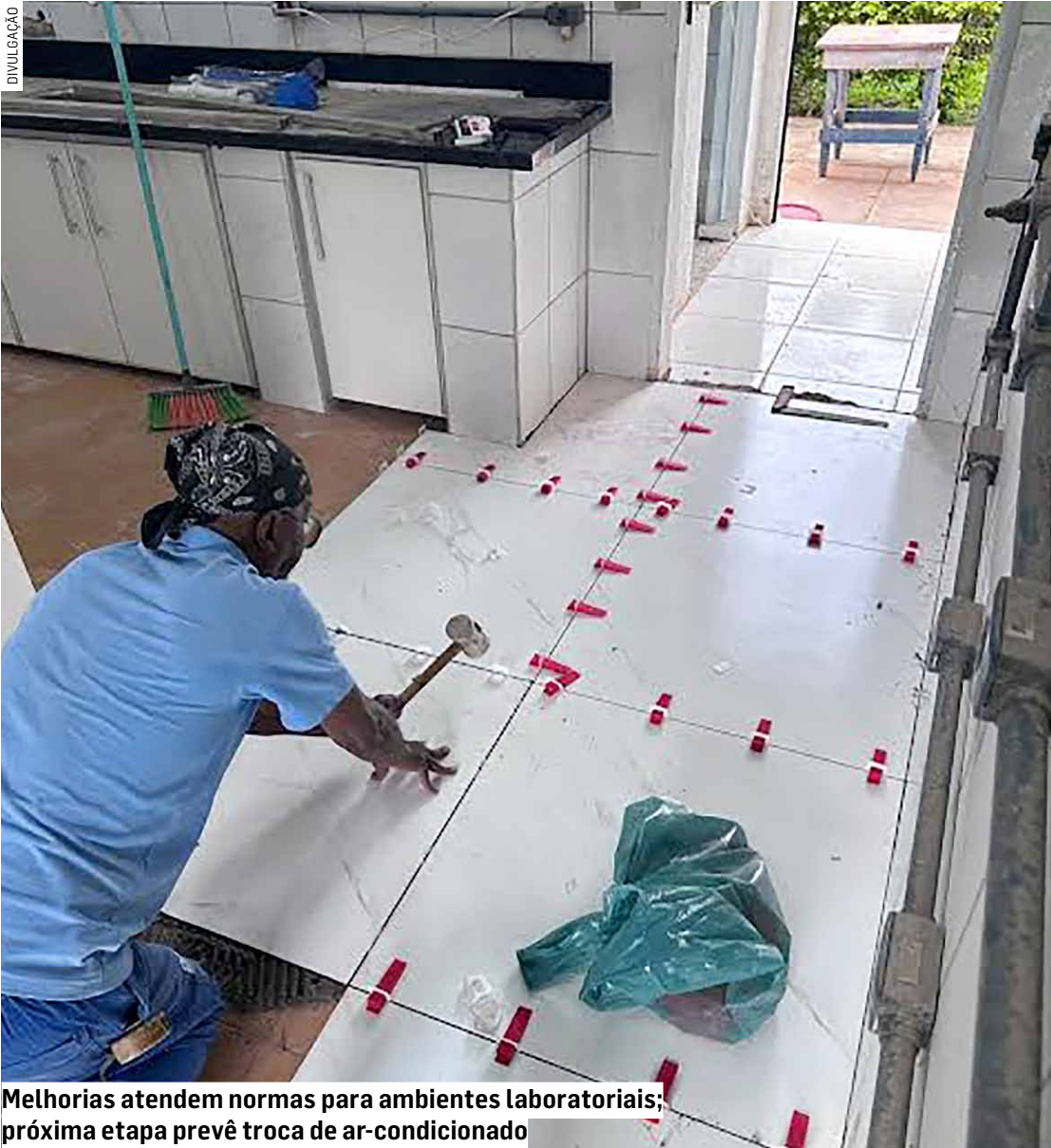
Melhorias atendem normas para ambientes laboratoriais; próxima etapa prevê troca de ar-condicionado

Instalação de piso marca avanço da modernização da obra, parte do programa DAE em Ação pela Água; espaço recebe adequações técnicas e de segurança; objetivo é elevar controle e qualidade do esgoto tratado nas estações