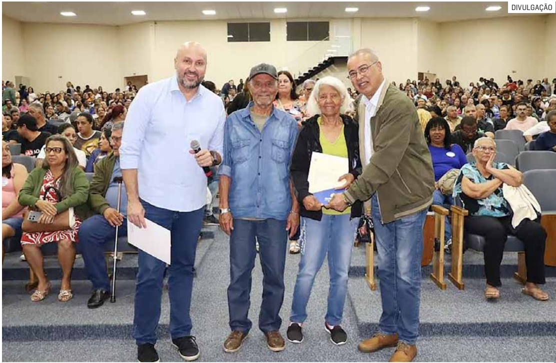
Maior programa de regularização fundiária da história da cidade beneficiará 1.400 moradias

“Esta luta começou há muito tempo atrás com o saudoso prefeito Angelo Perugini e, hoje, estamos aqui para concretizar este sonho que também é um sonho destas famílias que aqui estão. Moradia digna é cuidar das pessoas e, agora, todos vão poder falar com orgulho de suas propriedades. A escritura é a dignidade da família. É muito gratificante ver todos aqui felizes neste momento. Este Governo já contemplou mais de 5 mil famílias com a regularização de suas casas e vai ter muito mais. Seguimos o desenvolvimento moderno, inteligente e sustentável, olhando para as pessoas”, comentou o prefeito Zezé Gomes (Republicanos).