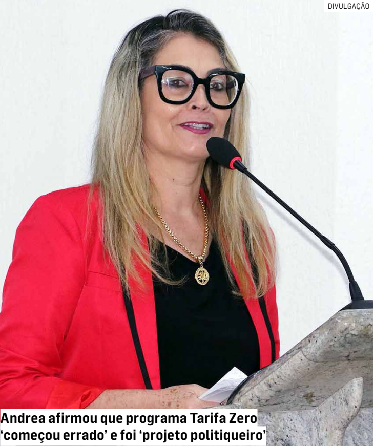
Andrea afirmou que programa Tarifa Zero 'começou errado' e foi 'projeto politiqueiro'