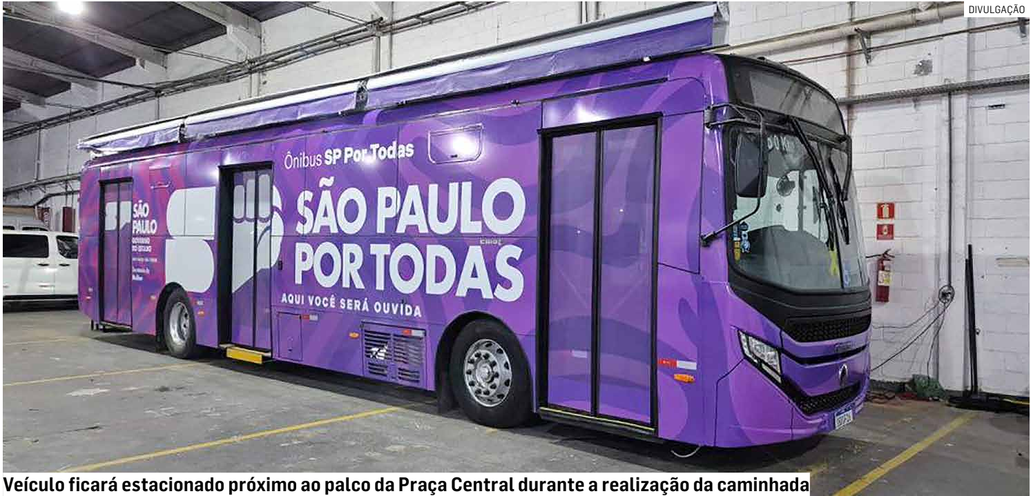
Veículo ficará estacionado próximo ao palco da Praça Central durante a realização da caminhada

Em uma iniciativa que reforça o compromisso com a causa feminina, o Fundo Social de Solidariedade de Nova Odessa abriu espaço estrategicamente para que o Conselho Municipal dos Direitos da Mulher leve à população informações sobre o combate à violência doméstica e familiar durante a Caminhada do Outubro Rosa, integrando saúde e proteção social. A ação conta com a parceria da Secretaria de Políticas para as Mulheres do Estado de São Paulo, que viabilizou a vinda do ônibus “SP Por Todas” ao município, oferecendo atendimento integrado às mulheres. O veículo ficará estacionado neste sábado (25), das 8h às 12h, próximo ao palco da Praça Central José Gazetta, durante a realização da caminhada.