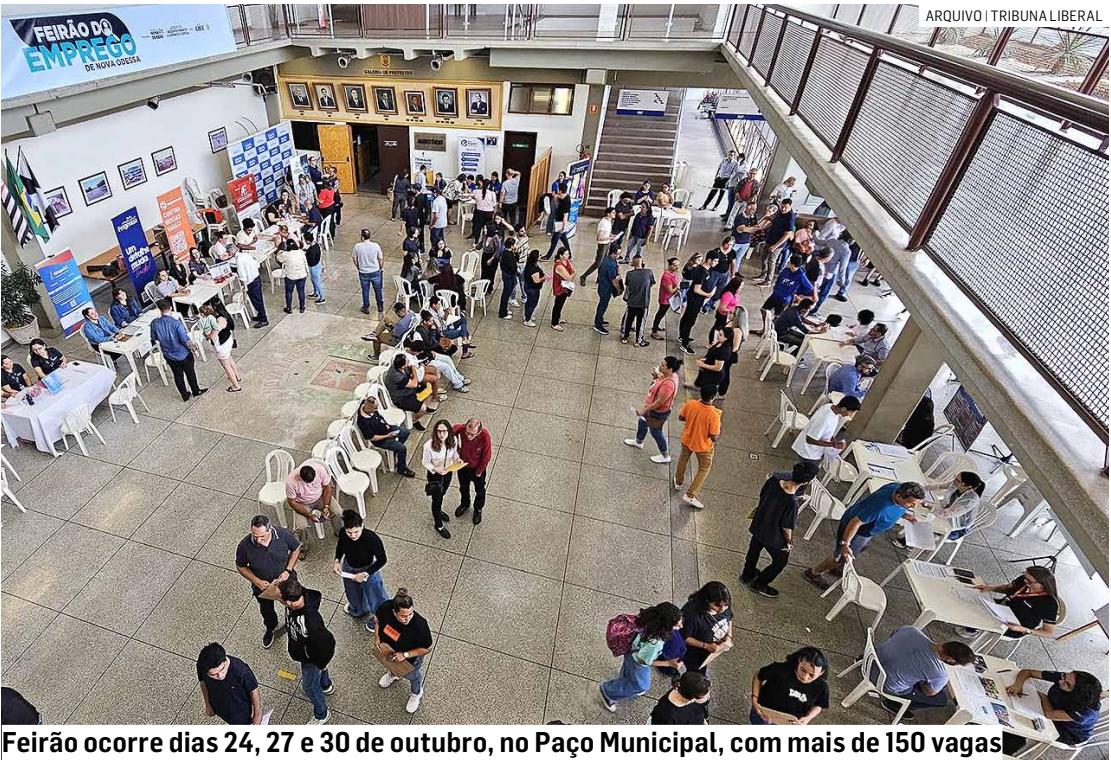
Feirão ocorre dias 24, 27 e 30 de outubro, no Paço Municipal, com mais de 150 vagas

Estão disponíveis vagas para diversos setores, incluindo balconista de padaria, frios, rotisseria e hortifrúti; açougueiro e atendente de açougue; ajudante de cozinha e de confeitaria; repositor, estoquista e conferente; auxiliar de limpeza, expedição e embalador; empilhadeiraista; encarregados e subencarregados de setores.