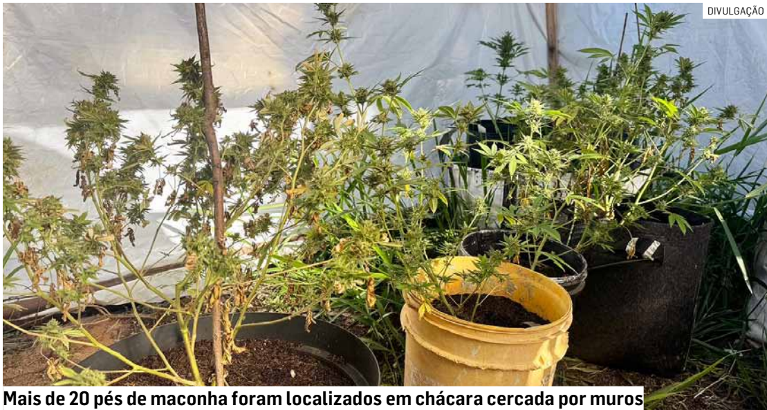
Mais de 20 pés de maconha foram localizados em chácara cercada por muros

As investigações começaram após o recebimento de informações encaminhadas pelo Sistema Disque Denúncia do Governo do Estado de São Paulo, que