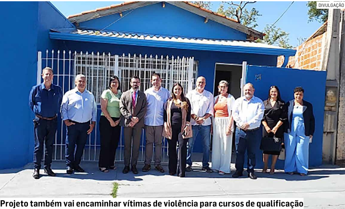
Projeto também vai encaminhar vítimas de violência para cursos de qualificação

Da Redação • MONTE MOR tribunaliberal@tribunaliberal.com.br