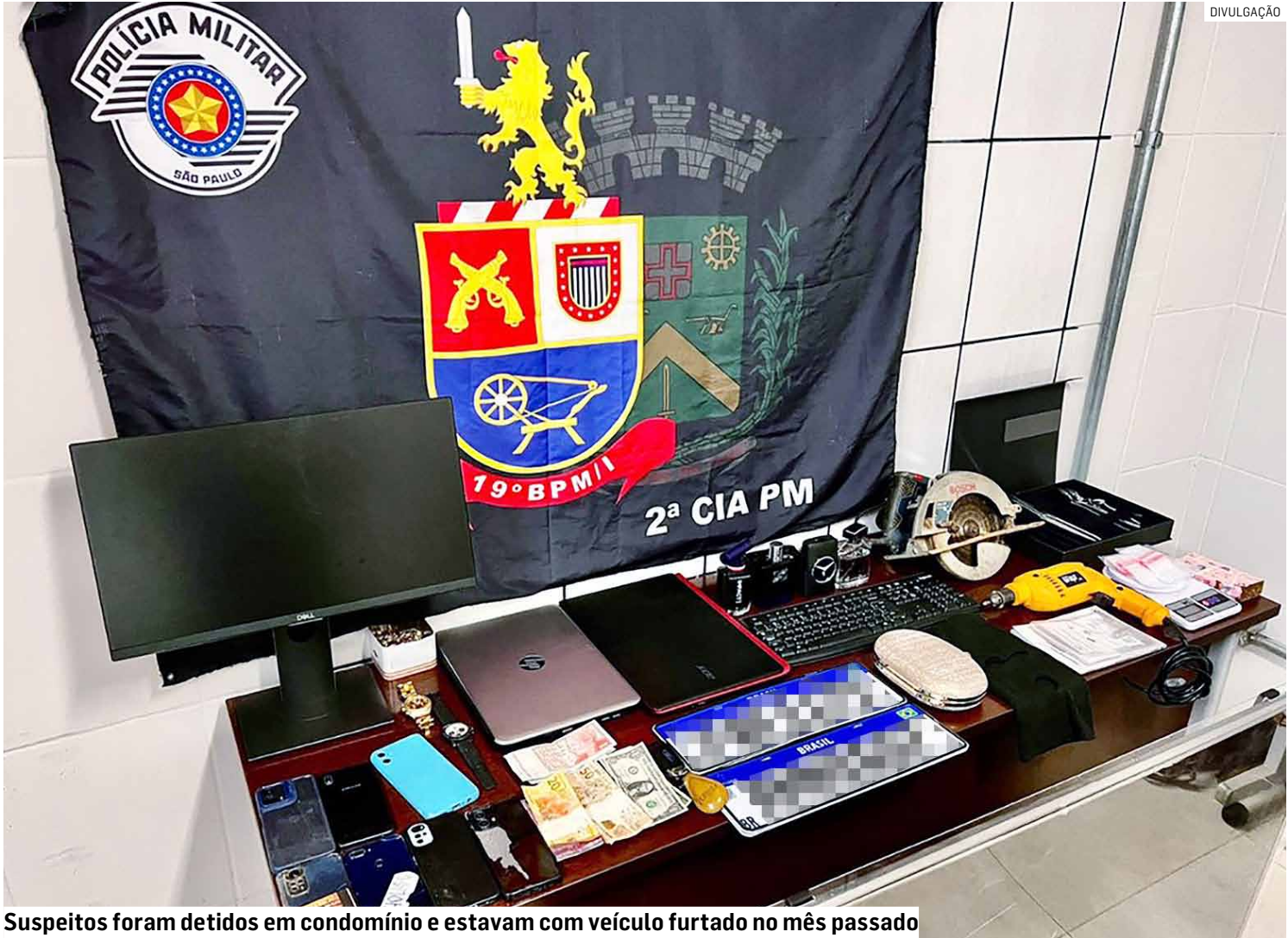
Suspeitos foram detidos em condomínio e estavam com veículo furtado no mês passado

Durante as diligências, os policiais localizaram um