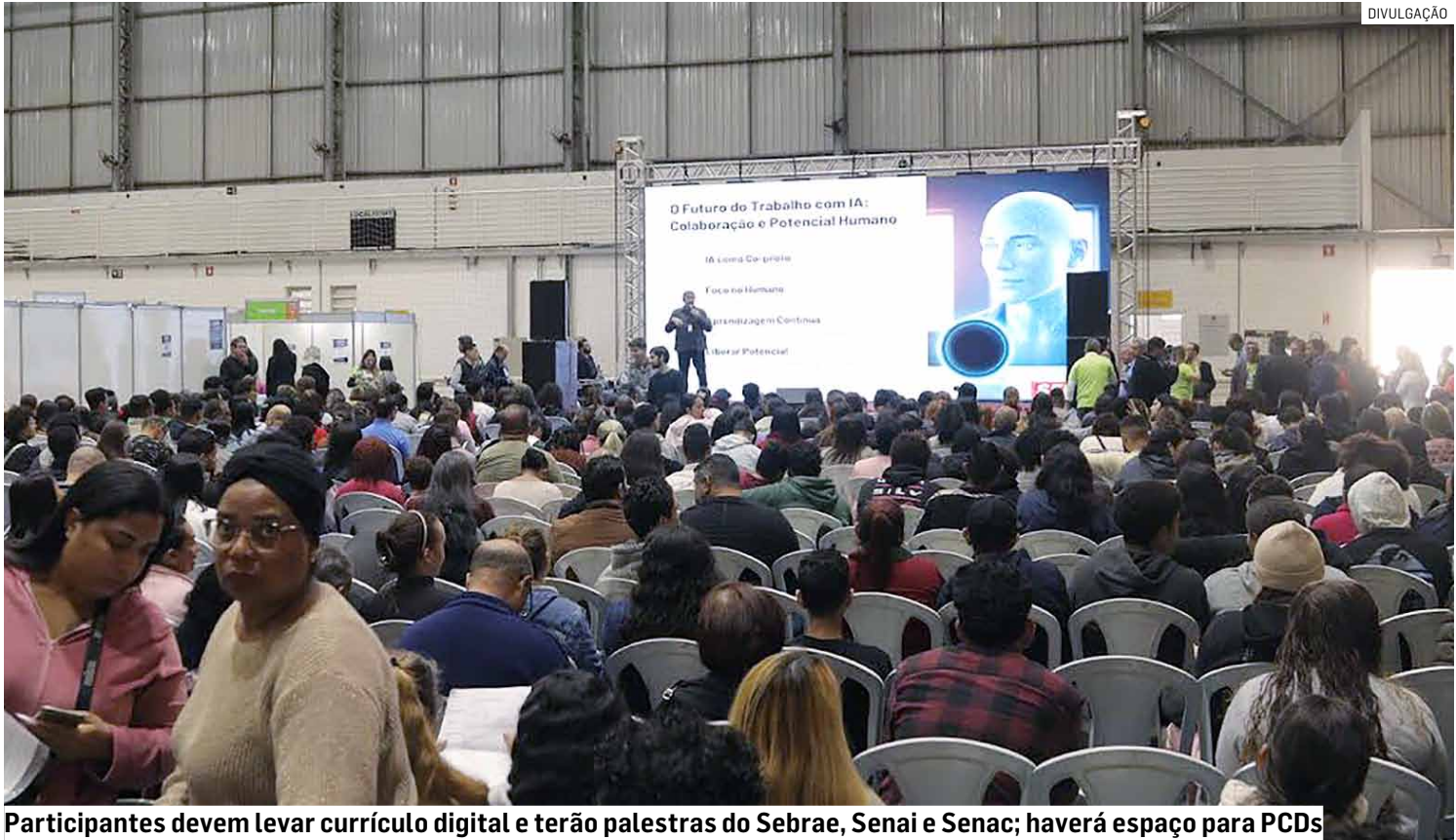
Participantes devem levar currículo digital e terão palestras do Sebrae, Senai e Senac; haverá espaço para PCDs

As vagas oferecidas são nas modalidades de estágio, efetivo, temporário,