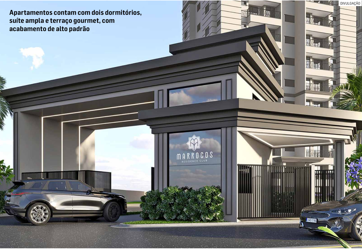
Apartamentos contam com dois dormitórios, suíte ampla e terraço gourmet, com acabamento de alto padrão

Município se prepara para receber novo projeto da Midas Incorporadora, que com mais de 40 anos de tradição, lança residencial que une sofisticação, conforto e localização privilegiada; condomínio oferece mais de 20 opções de lazer