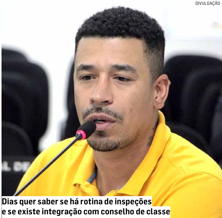
Dias quer saber se há rotina de inspeções e se existe integração com conselho de classe

O requerimento será discutido e votado pelos vereadores em plenário durante a sessão ordinária de terça-feira (28). Se aprovado, será encaminhado ao Poder Executivo para resposta.