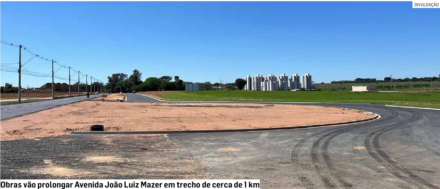
Obras vão prolongar Avenida João Luiz Mazer em trecho de cerca de 1 km

Da Redação • AMERICANA tribunaliberal@tribunaliberal.com.br