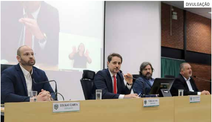
Serão até 500 bolsas anuais para moradores com no mínimo dez anos na cidade e para instituições até 70 km de Paulínia

O programa prevê até 500 bolsas anuais, entre integrais e parciais, e reforça a exigência de residência mínima de dez anos no município. CONTAS DA PREVIDÊNCIA Os vereadores aprovaram ainda o Projeto de Lei Complementar 11/2025, enviado pela prefeitura, que reorganiza o regime previdenciário municipal e promove a segregação da massa de segurados do Pauliprev. O texto cria dois grupos distintos para o gerenciamento de recursos. O pri-