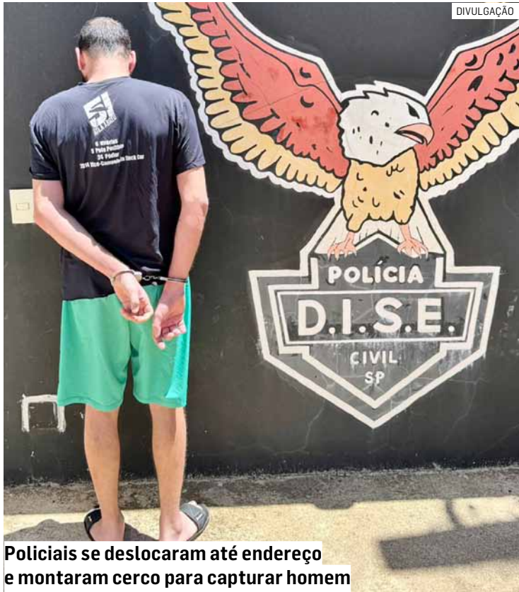
Policiais se deslocaram até endereço e montaram cerco para capturar homem

Em seguida, o condenado foi escoltado pelos policiais até a Cadeia Pública de Sumaré, onde permanecerá à disposição da Justiça.