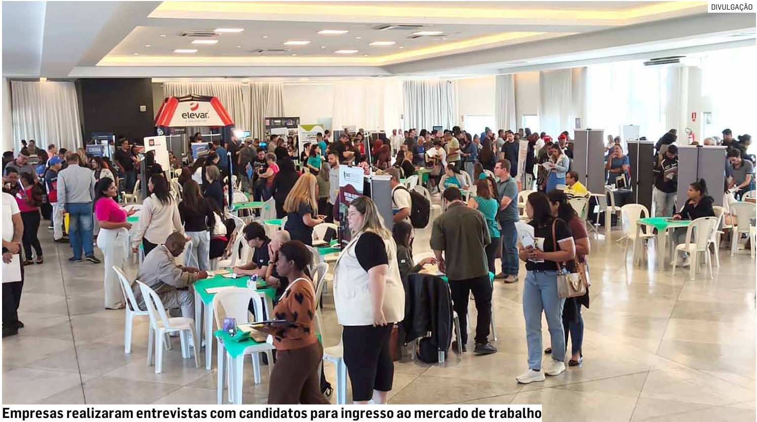
Empresas realizaram entrevistas com candidatos para ingresso ao mercado de trabalho

O 2º Feirão do Emprego de Sumaré movimentou o Clube Recreativo nesta quinta-feira (23), reunindo milhares de candidatos em busca de uma oportunidade no mercado de trabalho. Desde as primeiras horas da manhã, uma grande fila se formava na entrada do evento, que contou com a participação de cerca de 60 empresas oferecendo 2 mil vagas em diversos setores, como comércio, serviços, indústria e logística. A ação foi promovida pela Prefeitura de Sumaré, por meio da Secretaria Municipal de Desenvolvimento Econômico, e teve como objetivo aproximar empresas e trabalhadores, facilitando o acesso às vagas de emprego disponíveis na cidade e na região. O prefeito Henrique do Paraíso (Republicanos) destacou o impacto social da iniciativa e o compromisso da administração