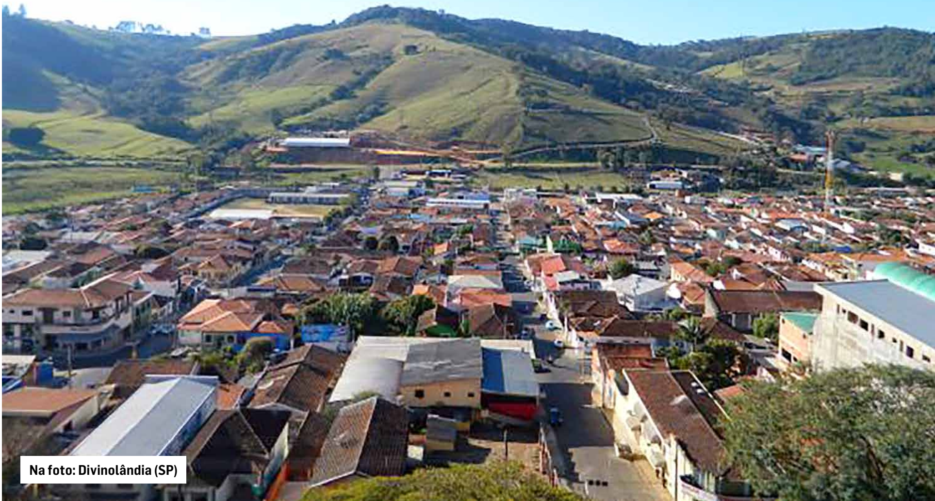
Na foto: Divinolândia (SP)