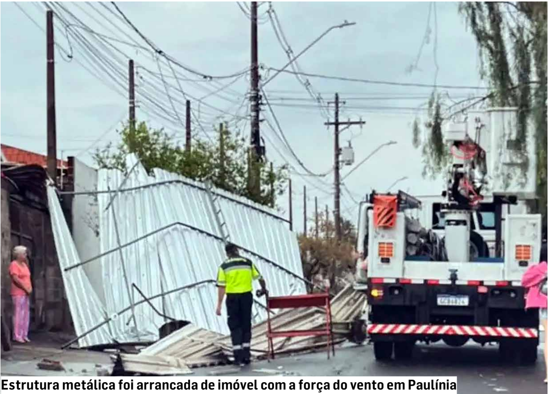
Estrutura metálica foi arrancada de imóvel com a força do vento em Paulínia

sil, um poste de energia elétrica foi partido ao meio e placas metálicas acabaram arremessadas para dentro de casas, ampliando o clima de apreensão. Em Hortolândia, o Paço Municipal teve uma ala alagada, com pessoas dentro do prédio no momento do incidente. A correnteza formada em trecho próximo ao Parque Socioambiental Irmã Dorothy Stang chegou a arrastar um carro. Em Paulínia, a ventania deixou o Paço Municipal e boa parte da cidade sem energia elétrica, comprometendo também o abastecimento de água. Árvores e postes tombaram em diferentes pontos. Em Monte Mor, a Defesa Civil contabilizou pelo menos 23 quedas de árvores em várias regiões, entre elas a Rua Roberto Gonçalves Teixeira, no Centro, onde um tronco de grande porte atingiu