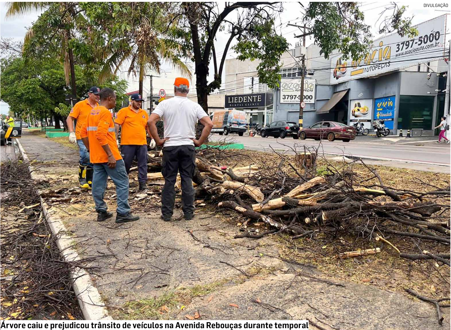
Árvore caiu e prejudicou trânsito de veículos na Avenida Rebouças durante temporal