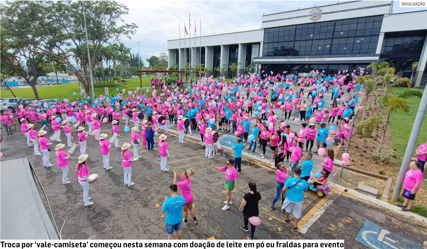
Troca por 'vale-camiseta' começou nesta semana com doação de leite em pó ou fraldas para evento

As doações podem ser entregues até 10 de outubro, de segunda a sexta-feira, das 9h às 16h, na sede do Fundo Social, que fica na Rua Heitor Penteado, nº 199, no Centro. No dia do evento, os participantes apresentam o vale para retirar a camiseta no Paço Municipal, das 7h às 8h, antes da largada da caminhada, que se inicia às 8h.