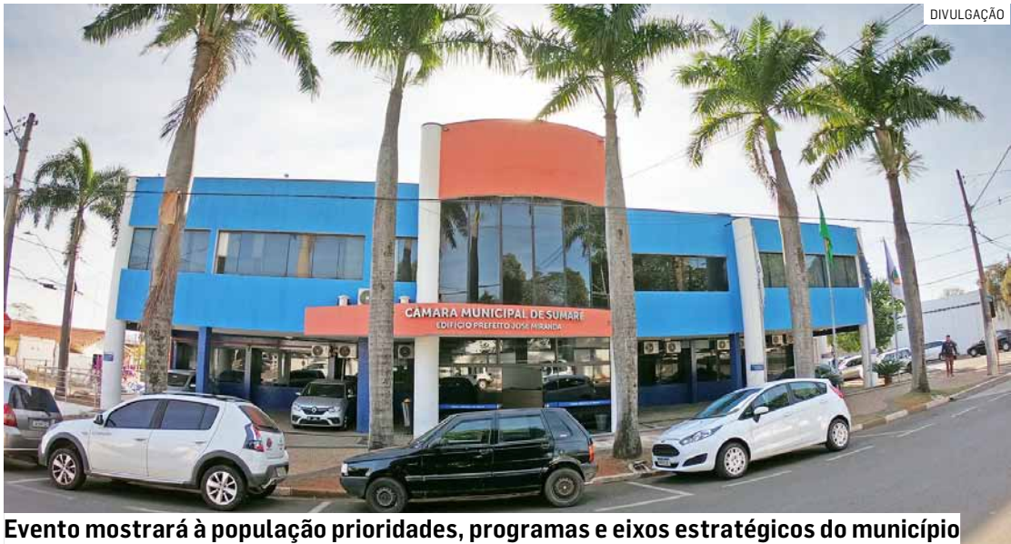
Evento mostrará à população prioridades, programas e eixos estratégicos do município

A Câmara Municipal de Sumaré realiza audiência pública para apresentar o Plano Plurianual (PPA) para o quadriênio 2026 a 2029. A reunião acontece nesta quarta-feira (24), a partir das 18h, no plenário da Câmara (Travessa Primeiro Centenário, 32 Centro). A audiência pública é aberta a toda a população e será transmitida em tempo real pelo canal do Legislativo no YouTube (youtube.com/camarasumare). O Plano Plurianual é o principal instrumento de planejamento de médio prazo da administração pública. Previsto na Constituição Federal e regulamentado pela Lei de Responsabilidade Fiscal e em consonância com a Lei Orgânica de Sumaré, o PPA organiza as ações do governo do município para um período de quatro anos, sempre do segundo ano de mandato de um prefeito até o primeiro ano da gestão seguinte. Seu objetivo é estabelecer as diretrizes, os objetivos e as metas da ges-