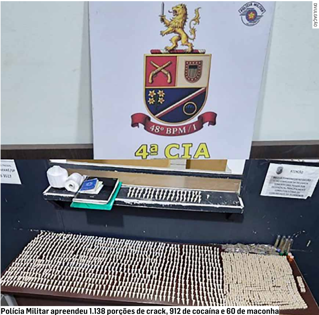
Polícia Militar apreendeu 1.138 porções de crack, 912 de cocaína e 60 de maconha

Todo o material apreendido foi encaminhado ao Plantão Policial de Hortolândia, onde a ocorrência foi registrada. Os entorpecentes e documentos permaneceram à disposição da Justiça, para a continuidade das apurações.