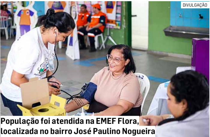
População foi atendida na EMEF Flora, localizada no bairro José Paulino Nogueira

lidade social, o Fundo Social estava presente com a distribuição de roupas. Também não faltou diversão para as crianças que foram ao local acompanhar os pais, com brincadeiras, jogos de tabuleiros e outras modalidades na quadra de esportes da escola. As crianças ainda curtiram a distribuição gratuita de pipoca e algodão doce. “Essa edição foi o nosso projeto-piloto para circularmos com esse modelo de atendimento em diversas regiões da cidade. Acredito que dessa forma vamos conseguir chegar mais perto da população e nos conectar com o que de fato é importante para o nosso povo”, afirma o prefeito Danilo Barros (PL). A próxima edição está prevista para ser realizada no dia 18 de outubro, das 8h às 12h.