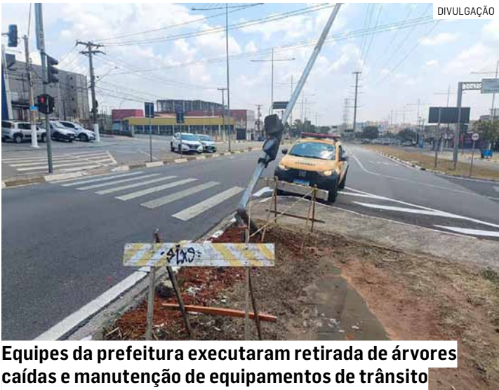
Equipes da prefeitura executaram retirada de árvores caídas e manutenção de equipamentos de trânsito

O vendaval também causou o deslocamento de 16 braços projetados de semáforos. Braços projetados são estruturas metálicas que servem para dar suporte e posicionar os semáforos.