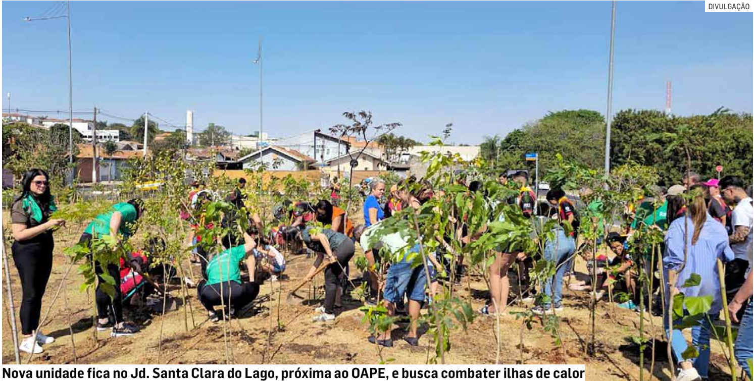
Nova unidade fica no Jd. Santa Clara do Lago, próxima ao OAPE, e busca combater ilhas de calor

“Foi emocionante ver famílias inteiras, crianças, jovens e idosos colocando a mão na terra e ajudando a construir um legado verde que ficará para as próximas gerações. Cada muda plantada é uma semente