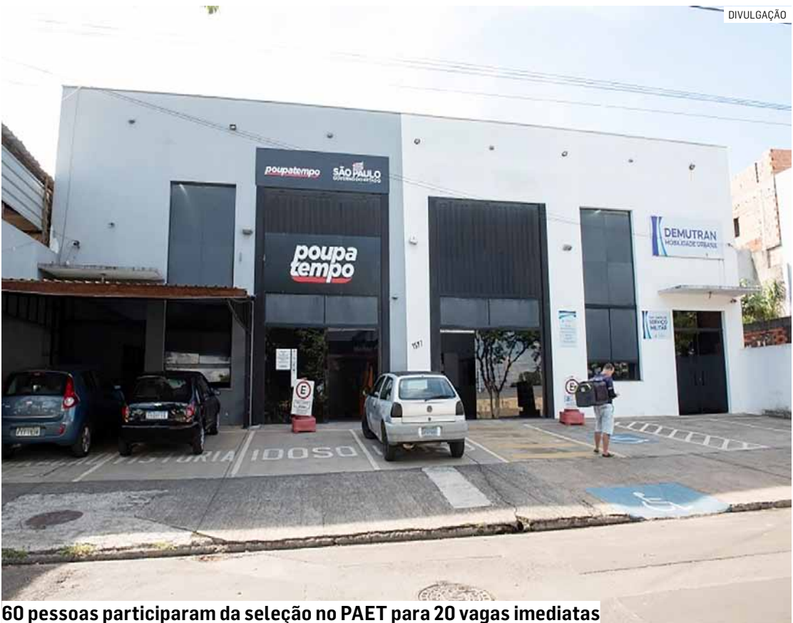
60 pessoas participaram da seleção no PAET para 20 vagas imediatas

Mais informações podem ser obtidas pelo telefone (19) 3879-4013.