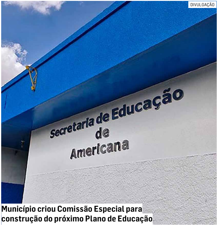
Município criou Comissão Especial para construção do próximo Plano de Educação

Da Redação • AMERICANA tribunaliberal@tribunaliberal.com.br