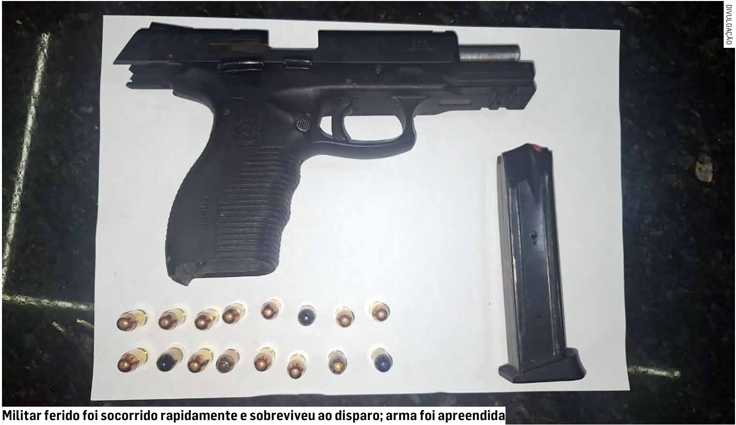
Militar ferido foi socorrido rapidamente e sobreviveu ao disparo; arma foi apreendida

Durante a ação, uma mulher e uma adolescente foram retiradas em segurança. Na sequência, o suspeito teria saído de um dos quartos armado e atirado contra os agentes,