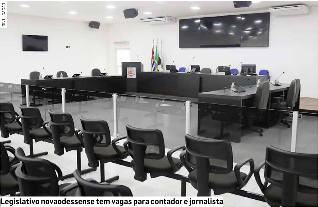
Legislativo novaodessense tem vagas para contador e jornalista

Da Redação • NOVA ODESSA tribunaliberal@tribunaliberal.com.br