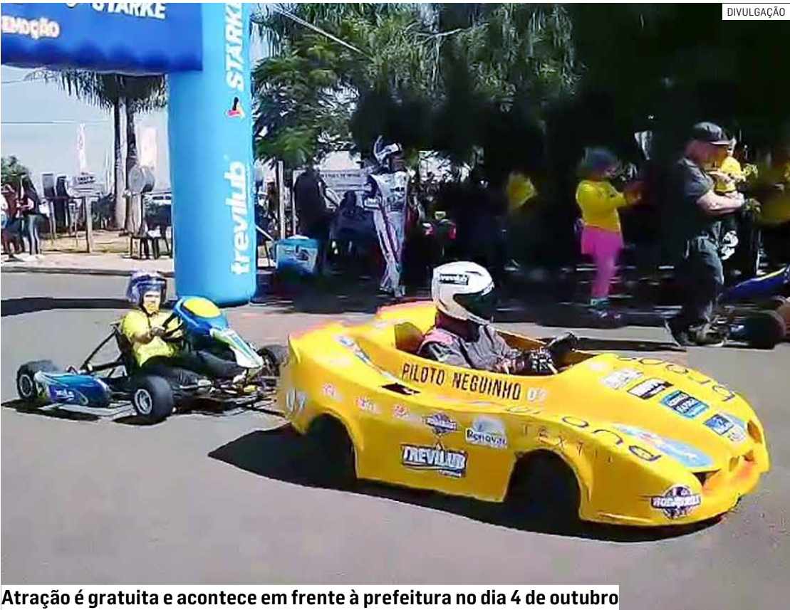
Atração é gratuita e acontece em frente à prefeitura no dia 4 de outubro

O evento será custeado com recursos parciais da contrapartida recebida pela Secretaria de Esportes e Lazer pela utilização da estrutura esportiva do município durante os jogos universitários da Interodonto, que aconteceram dias 4, 5, 6 e 7 de setembro. O restante dessa contrapartida possibilitou, ainda, a instalação de iluminação de LED nos ginásios do São Jorge e