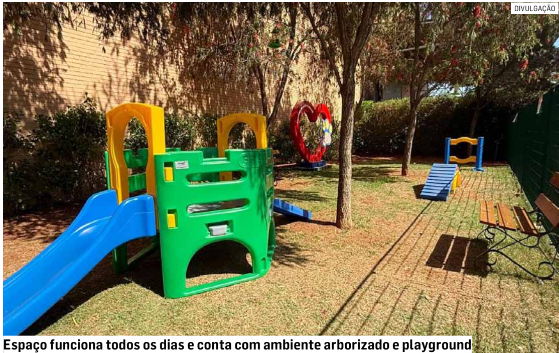
Espaço funciona todos os dias e conta com ambiente arborizado e playground