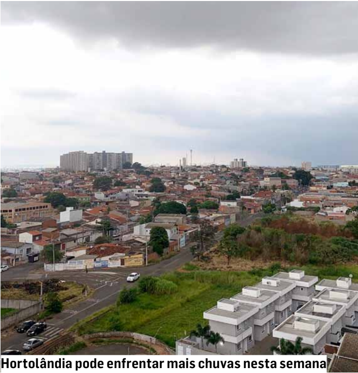
Hortolândia pode enfrentar mais chuvas nesta semana

A região deve enfrentar tempo instável e sensação de frio ao longo dos próximos dias, segundo a previsão do Centro de Pesquisas Meteorológicas e Climáticas Aplicadas à Agricultura (Cepagri), da Unicamp. O cenário é marcado por céu nublado, pancadas de chuva e ventos intensos, consequência da frente fria que avançou no início da semana e que continua influenciando o clima local. Para esta quarta-feira (24), a previsão é de céu parcialmente nublado a nublado, com maior concentração de nuvens devido à convergência de umidade em baixos níveis da