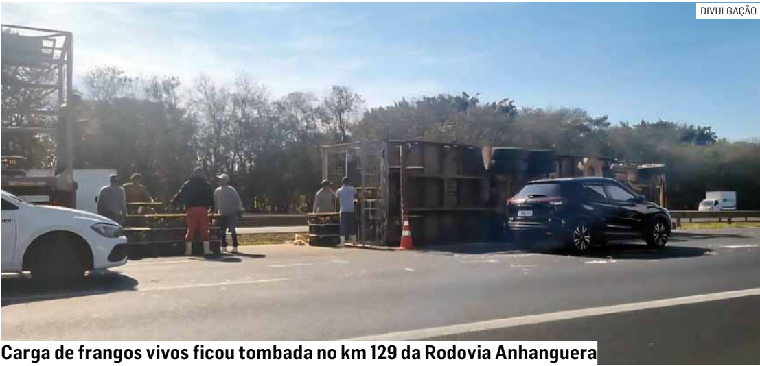
Carga de frangos vivos ficou tombada no km 129 da Rodovia Anhanguera

Paulo Medina • AMERICANA tribunaliberal@tribunaliberal.com.br