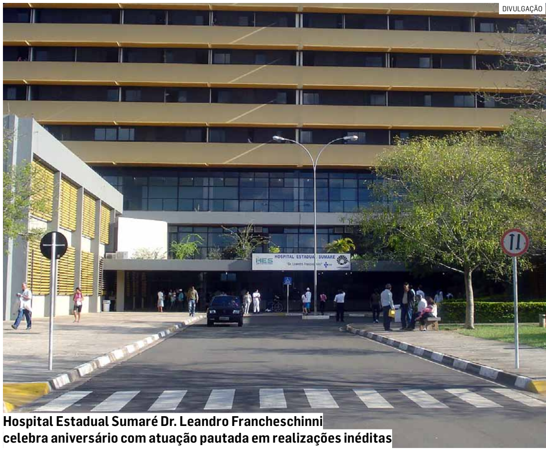
Hospital Estadual Sumaré Dr. Leandro Francheschini celebra aniversário com atuação pautada em realizações inéditas

A mais recente conquista dessa duradoura parceria com o Governo do Estado de São Paulo foi a manutenção do vínculo com a Fun-