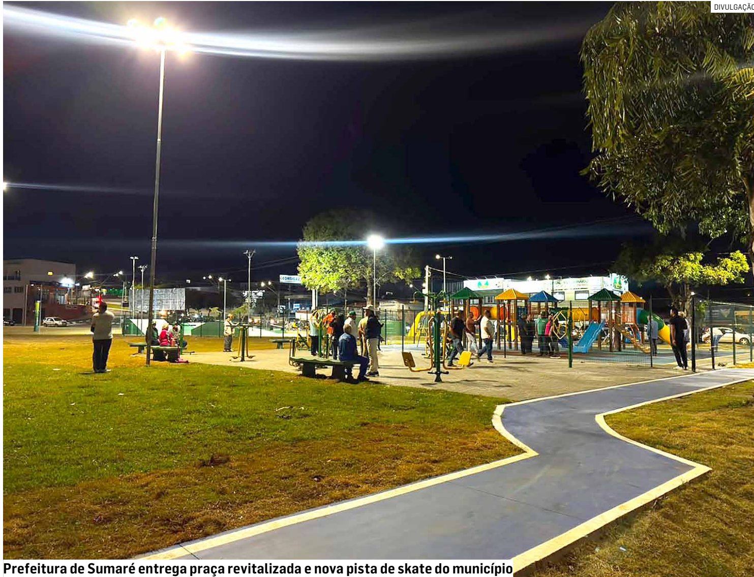
Prefeitura de Sumaré entrega praça revitalizada e nova pista de skate do município

Outro destaque da entrega foi a reforma completa da pista de skate, reali-