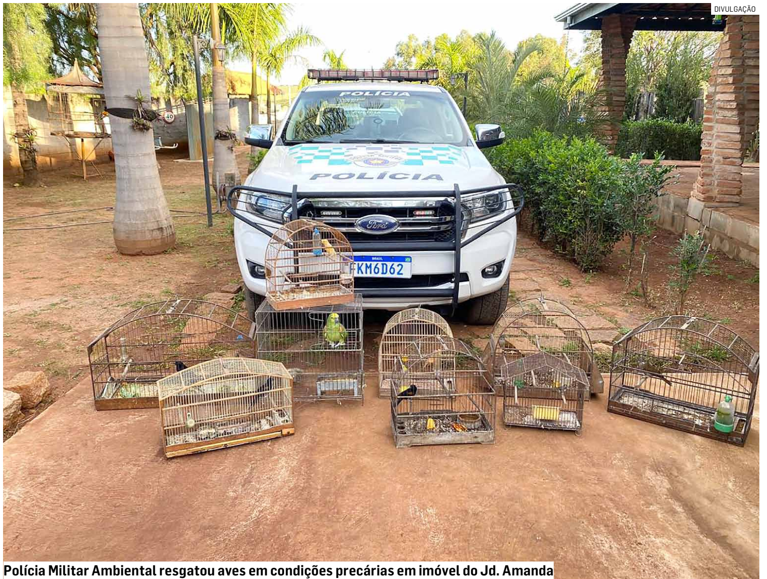
Polícia Militar Ambiental resgatou aves em condições precárias em imóvel do Jd. Amanda

Diante das irregularidades, os policiais elaboraram dois Autos de Infração Ambiental. Um deles foi aplicado pela prática de maus-tratos a espécies da fauna silvestre nativa. O segundo foi lavrado pela manutenção de ani-