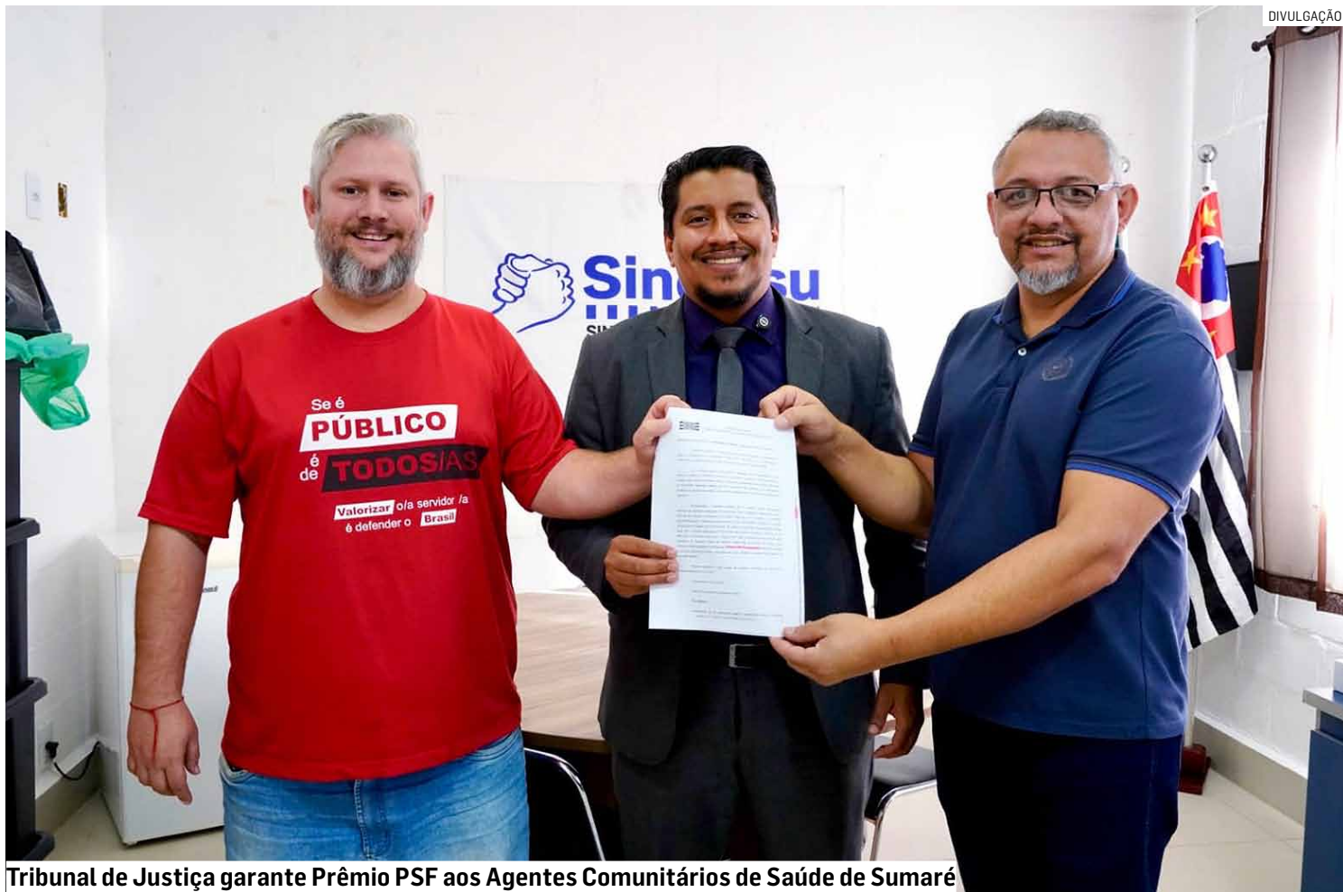
Tribunal de Justiça garante Prêmio PSF aos Agentes Comunitários de Saúde de Sumaré

Os servidores podem tirar dúvidas sobre o assunto diretamente na sede do Sindissu, localizada na Avenida da Saudade, 1100, no Planalto do Sol, em Sumaré.