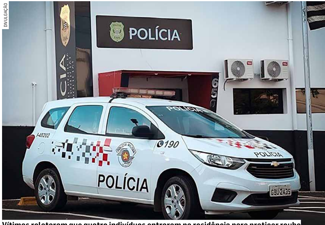
Vítimas relataram que quatro indivíduos entraram na residência para praticar roubo

Com as informações repassadas pelas vítimas e o auxílio do rastreamento de