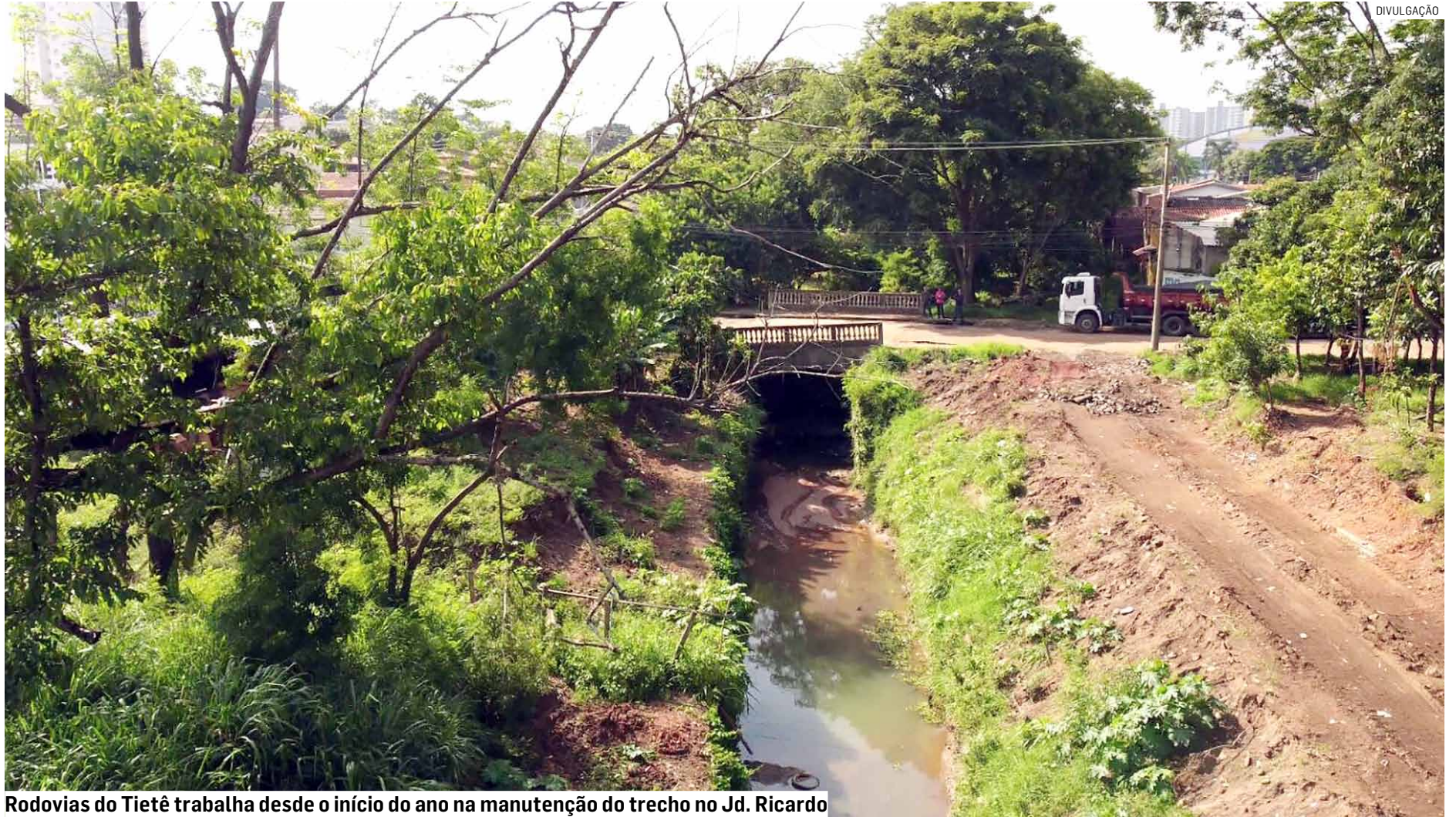
Rodovias do Tietê trabalha desde o início do ano na manutenção do trecho no Jd. Ricardo

O desnível da ponte foi identificado em janeiro, durante a ocorrência de fortes chuvas na cidade. De acordo com a Secretaria de