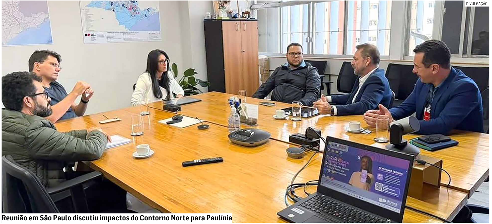
Reunião em São Paulo discutiu impactos do Contorno Norte para Paulínia