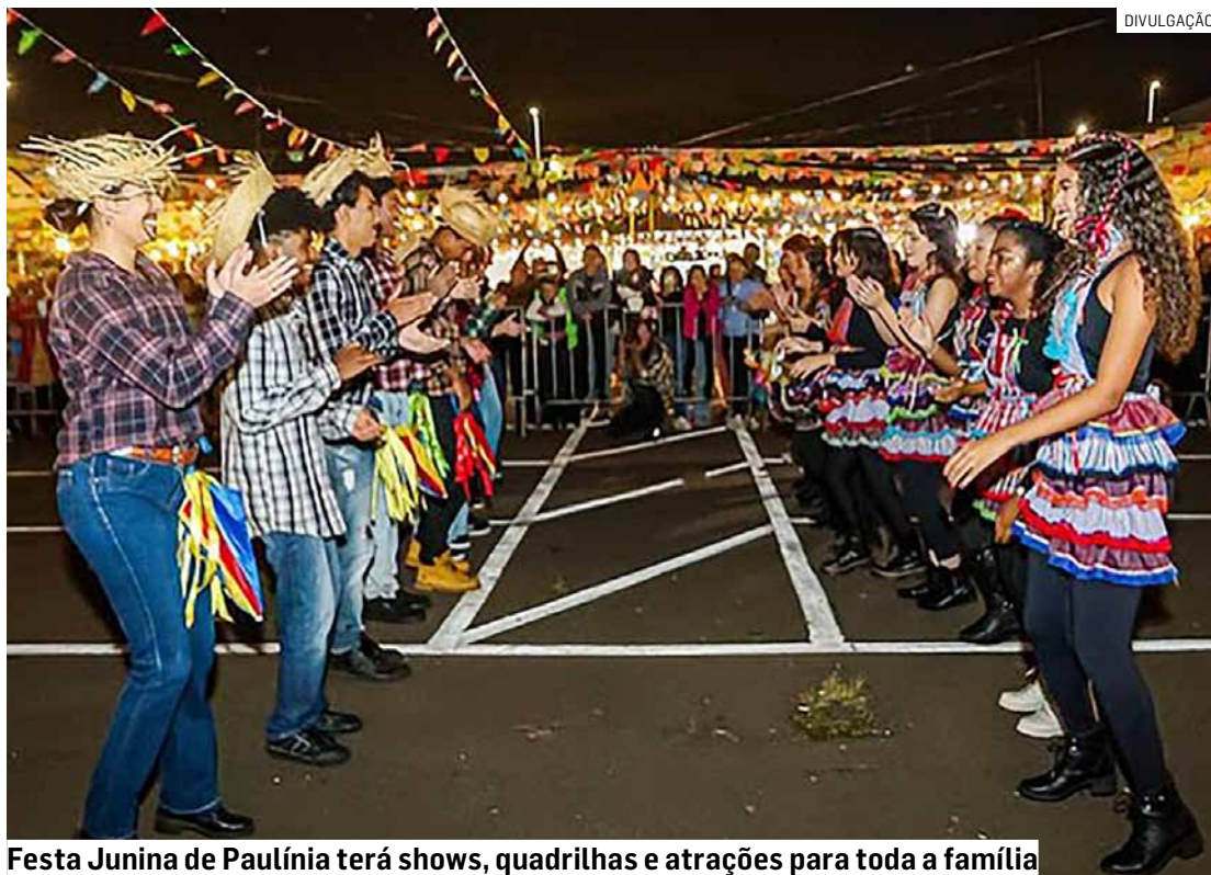
Festa Junina de Paulínia terá shows, quadrilhas e atrações para toda a família

Organizada pela Secretaria de Cultura, Turismo e Eventos em parceria com a Elo Produções, a festa traz novidades nesta edição e uma programação distri-