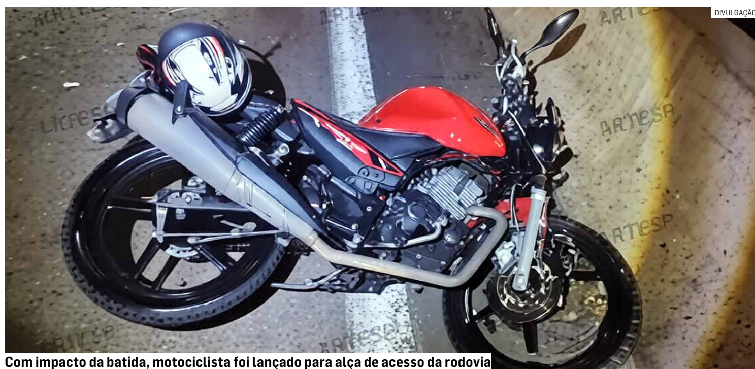
Com impacto da batida, motociclista foi lançado para alça de acesso da rodovia

O caso será investigado para esclarecer as causas da colisão e eventual responsabilidade dos envolvidos.