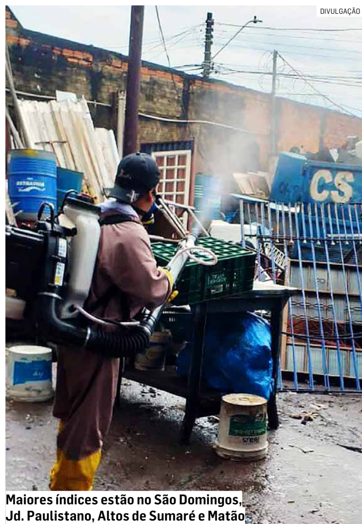
Maiores índices estão no São Domingos, Jd. Paulistano, Altos de Sumaré e Matão