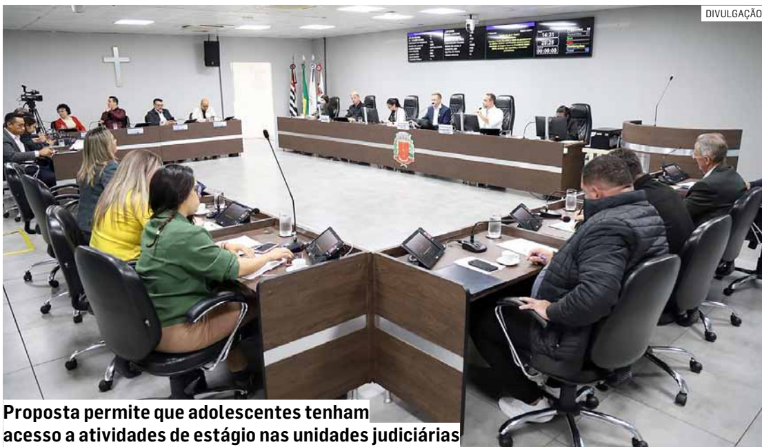
Proposta permite que adolescentes tenham acesso a atividades de estágio nas unidades judiciárias

Paulo Medina • AMERICANA tribunaliberal@tribunaliberal.com.br