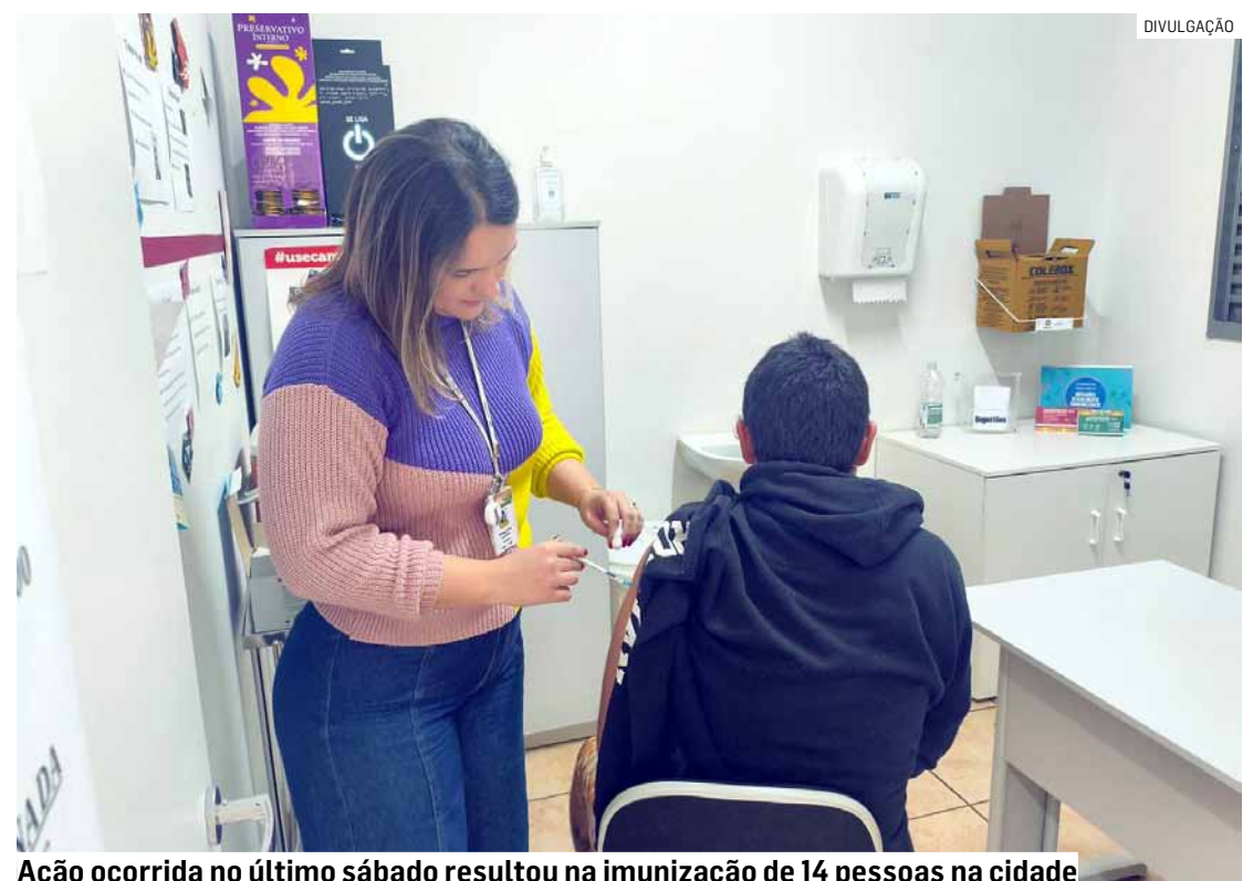
Ação ocorrida no último sábado resultou na imunização de 14 pessoas na cidade

O CRI está localizado na Rua Primeiro de Janeiro, 280, no Centro. Funciona de segunda a sexta, das 7h às 16h, e conta com especialistas em pneumologia e infectologia e dispensação de medicamentos de referência.