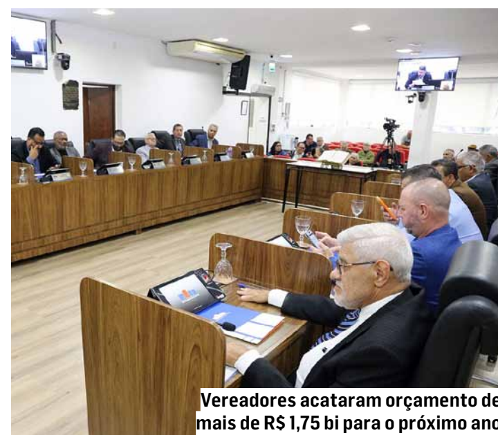
Vereadores acataram orçamento de mais de R$ 1,75 bi para o próximo ano

Como instrumento essencial de planejamento tático, a LDO desempenha um papel fundamental na orientação da peça orçamentária pública ao fixar as metas e prioridades para o ano subsequente. A legislação atua como um elo estratégico entre o Plano Plurianual (PPA) — responsável por estabelecer as diretrizes e os objetivos macro para um período de quatro anos — e a Lei Orçamentária Anual (LOA), que se caracteriza pelo caráter operacional ao detalhar a aplicação prática e executável dos recursos públicos no