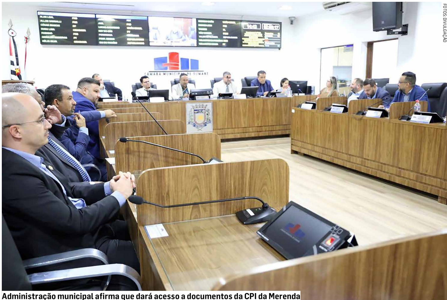
Administração municipal afirma que dará acesso a documentos da CPI da Merenda

Segundo a administração municipal, o trabalho de fiscalização exercido pelo Legislativo é uma prerrogativa constitucional e faz parte dos mecanismos de transparência e controle dos atos públicos. A prefeitura afirmou ainda que a correta aplicação dos recursos públicos é um dos pilares da atual gestão. “A prefeitura colocará à disposição da Comissão Parlamentar de Inquérito todas as informações, documentos e esclarecimentos que forem formalmente solicitados, colaborando de forma ampla, trans-