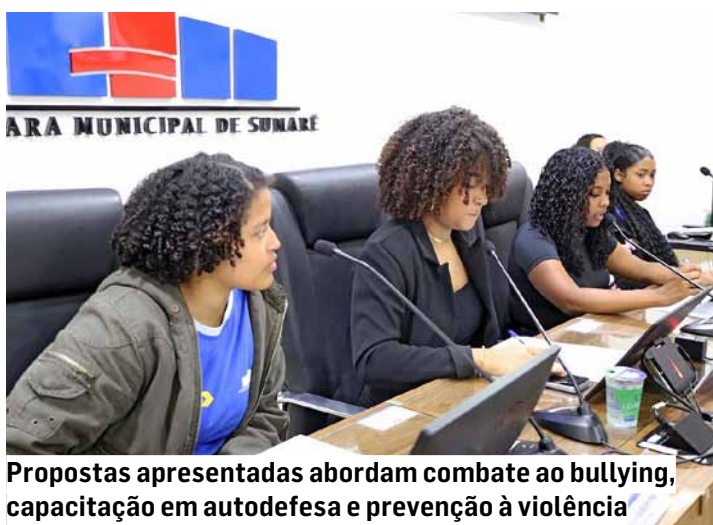
Propostas apresentadas abordam combate ao bullying, capacitação em autodefesa e prevenção à violência

O Projeto de Lei nº 1/2026, batizado de Lei Escudo – Estratégia de Segurança, Convivência e União no Desenvolvimento Escolar, cria a Política Municipal de Prevenção e Combate ao Bullying e ao Cy-