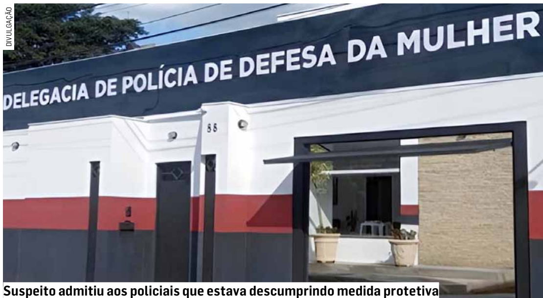
Suspeito admitiu aos policiais que estava descumprindo medida protetiva

Cézar Oliveira • HORTOLÂNDIA tribunaliberal@tribunaliberal.com.br