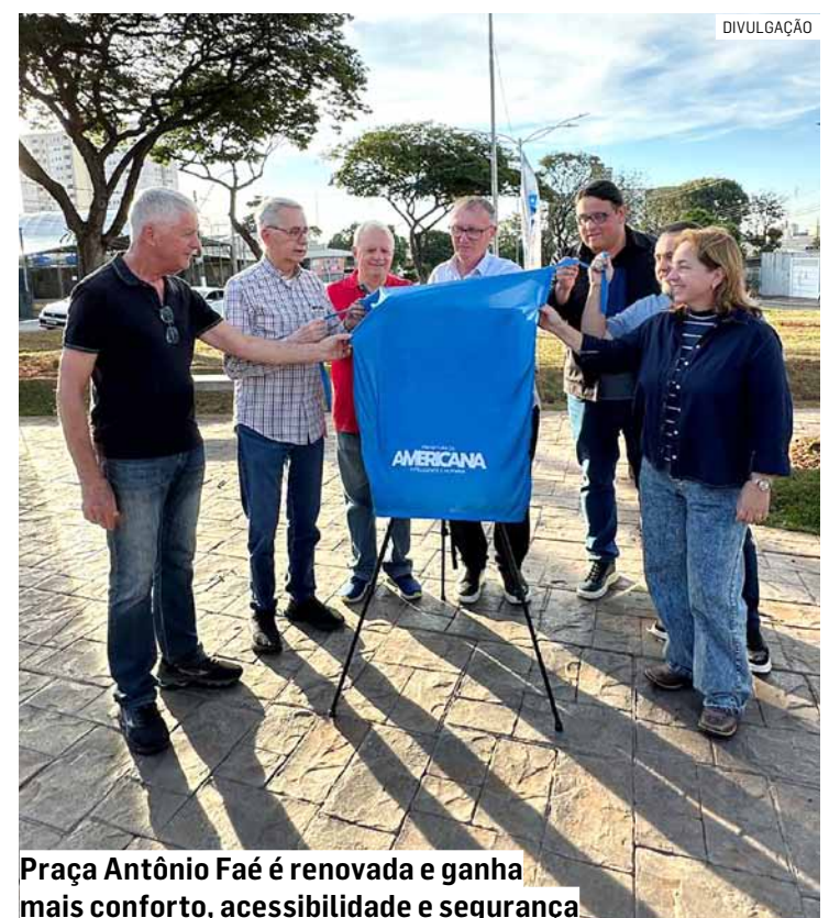
Praça Antônio Faé é renovada e ganha mais conforto, acessibilidade e segurança

A revitalização do espaço proporciona benefícios diretos à população, aliando infraestrutura urbana e segurança pública. A substituição da iluminação melhora a visibilidade e contribui para a segurança na região, enquanto o novo calçamento garante acessibilidade adequada para pedestres. Com essas intervenções, o município otimiza o uso do espaço público para o lazer e convivência das famílias.