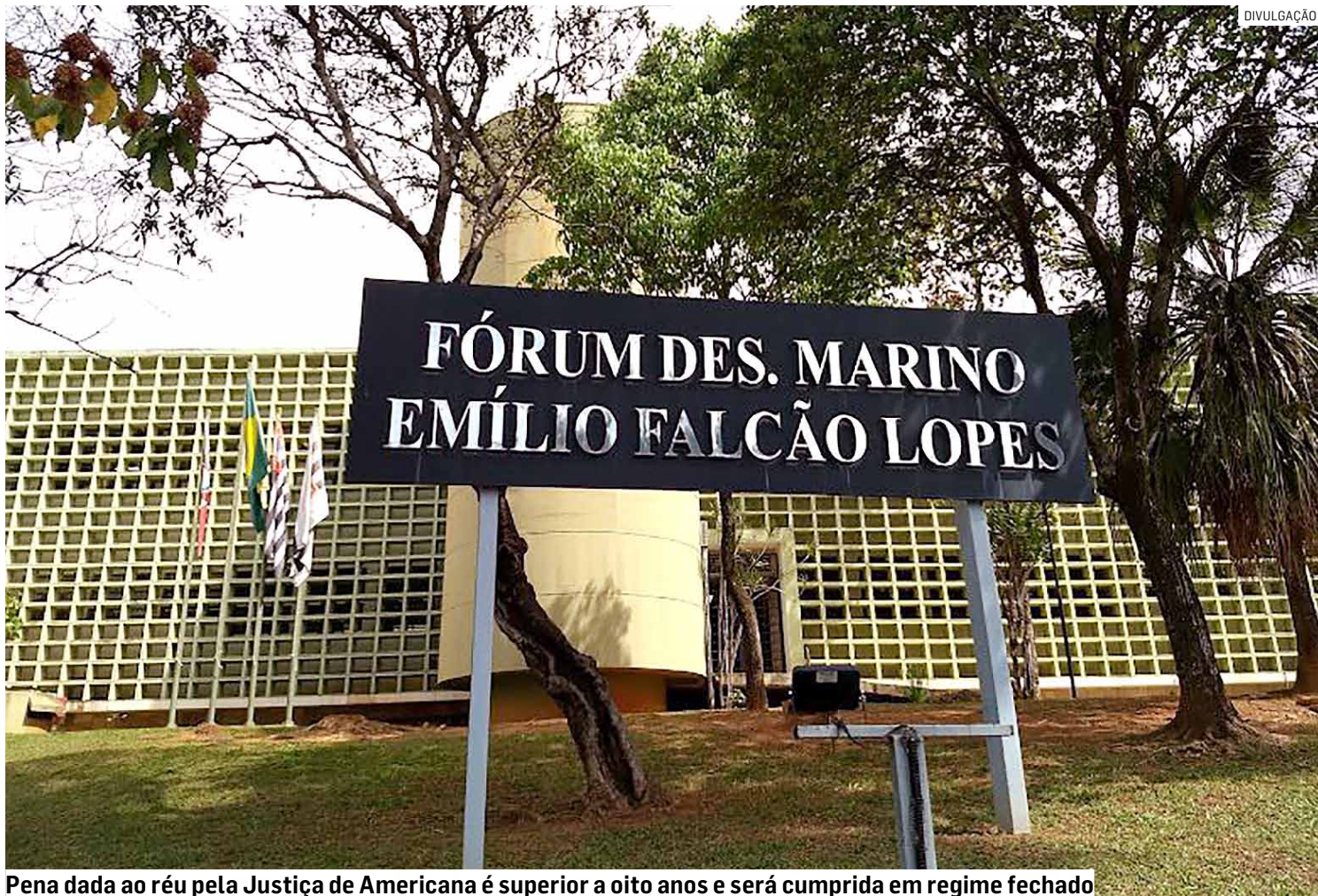
Pena dada ao réu pela Justiça de Americana é superior a oito anos e será cumprida em regime fechado

Ainda conforme a sentença, os criminosos amarraram as mãos e os pés das vítimas, utilizando arames