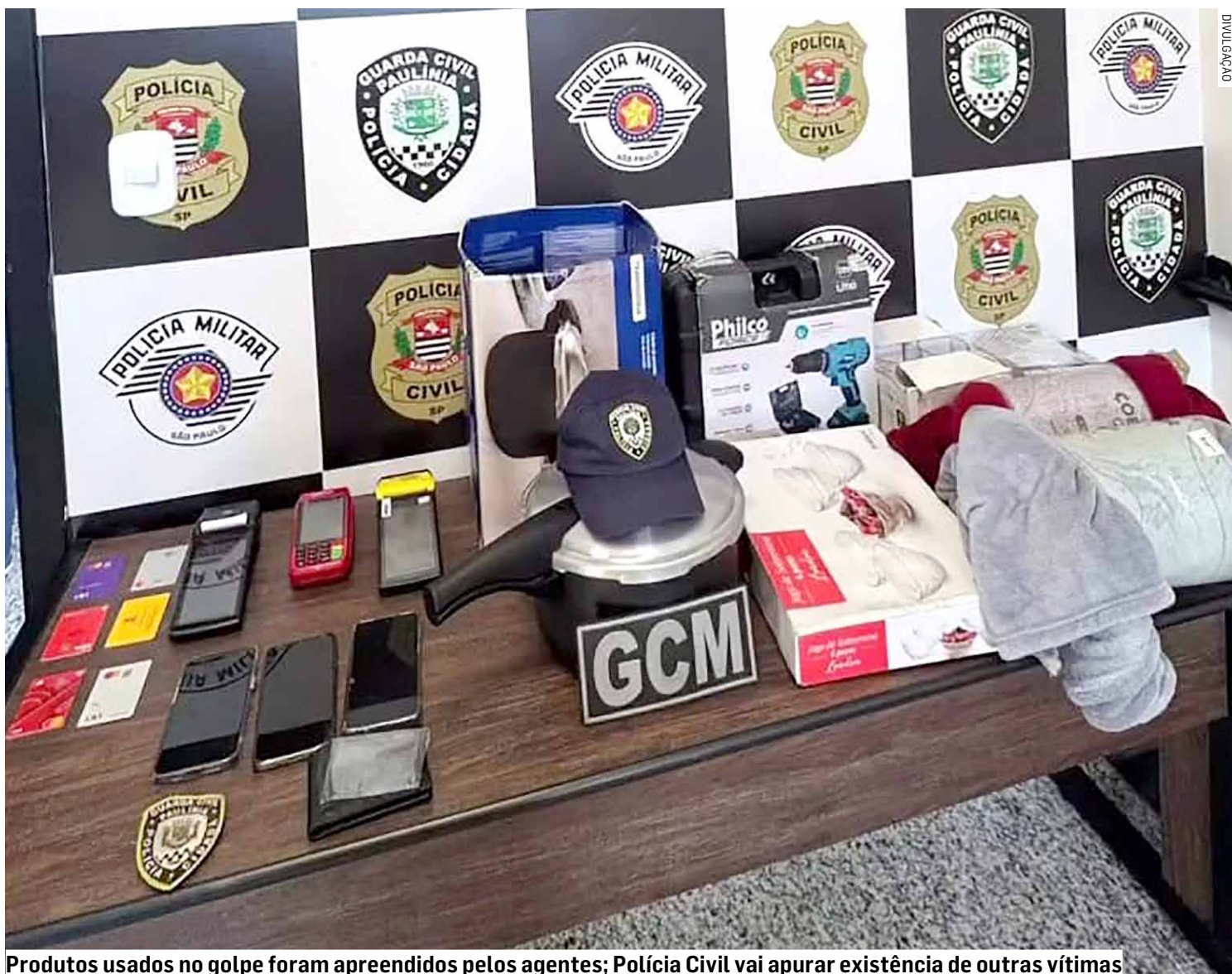
Produtos usados no golpe foram apreendidos pelos agentes; Polícia Civil vai apurar existência de outras vítimas

O caso foi encaminhado à Polícia Civil, que dará continuidade às investigações. Além da responsabilização criminal dos envolvidos, a apuração também busca identificar possíveis outras vítimas e, em parceria com instituições financeiras, tentar recuperar os valores perdidos pela idosa.