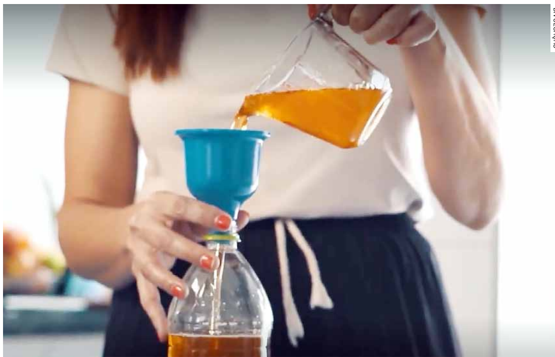
Descarte irregular de óleo de cozinha é um dos principais vilões do sistema de saneamento

Além de impactos estruturais, as consequências ambientais são preocupantes. Quando descartado no solo, o óleo pode se infiltrar e alcançar os lençóis freáti-