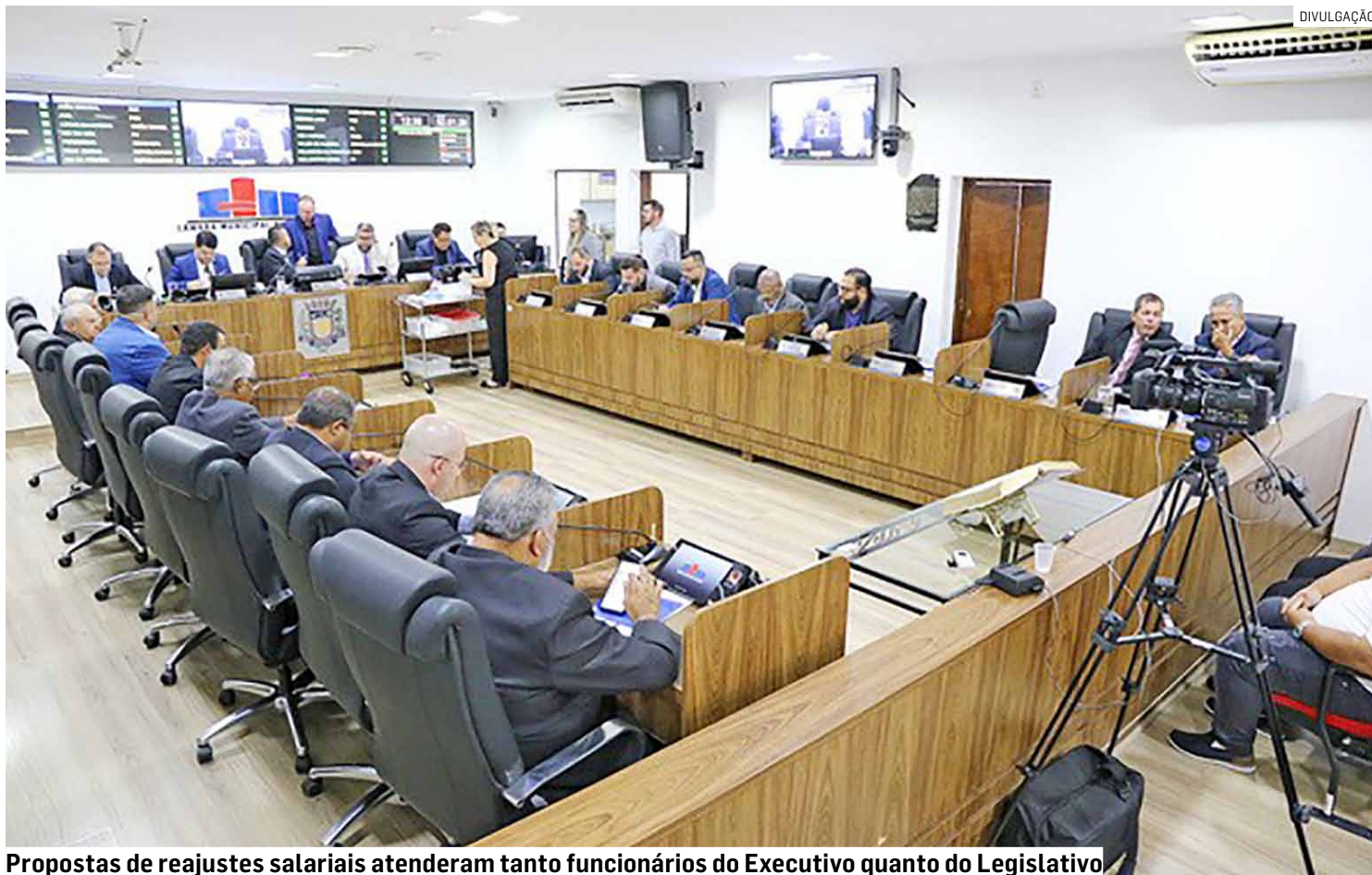
Propostas de reajustes salariais atenderam tanto funcionários do Executivo quanto do Legislativo

Outro ponto previsto é o pagamento de valores retroativos relacionados ao período em que houve suspensão da contagem de tempo de serviço durante