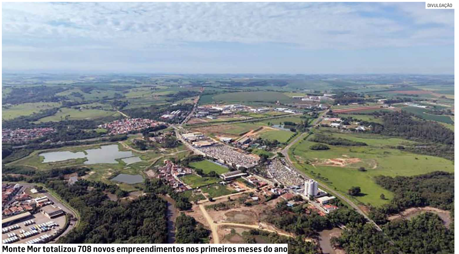
Monte Mor totalizou 708 novos empreendimentos nos primeiros meses do ano

Outro ponto de destaque é o perfil dos empreendedores. As microempresas correspondem a 96,6% das aberturas, com forte presença dos Microempreendedores Individuais (MEIs), que representam 78,5% do total. Entre as atividades mais comuns estão transporte de cargas, serviços administrativos, beleza e cuidados pessoais, além de serviços ligados à construção civil.