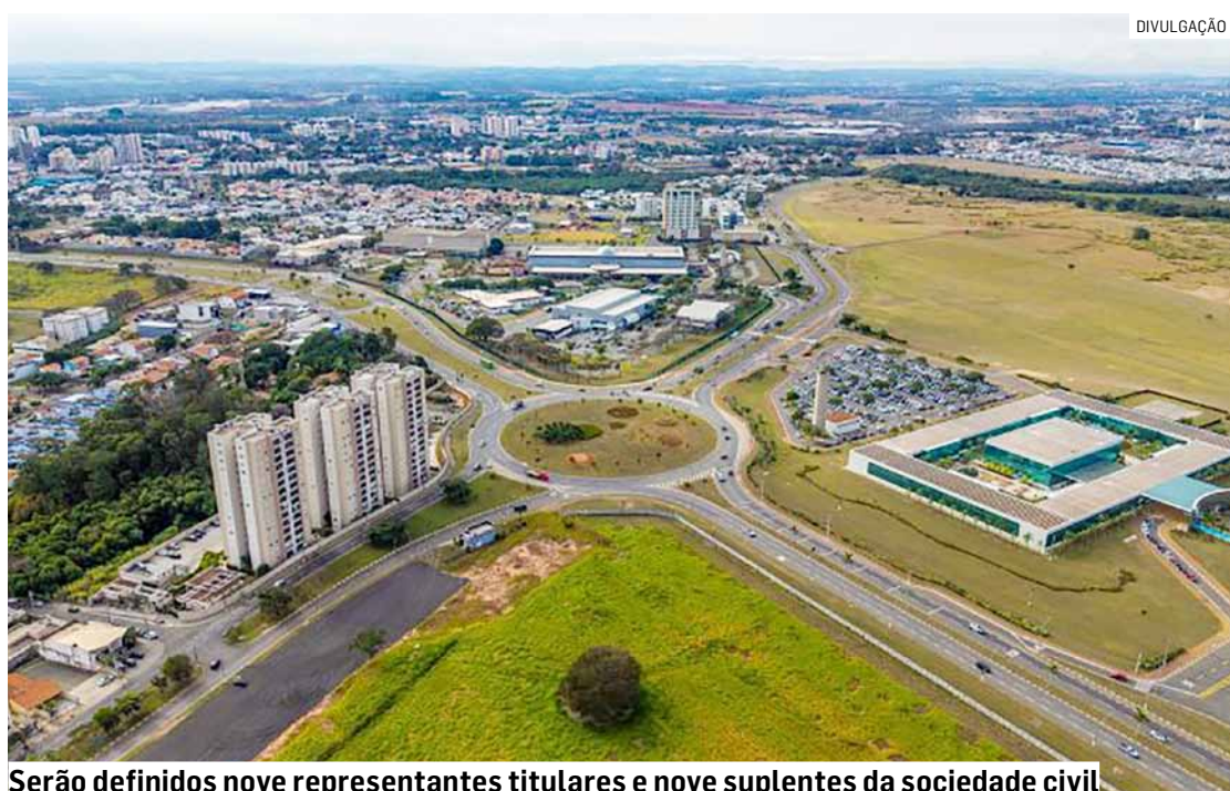
Serão definidos nove representantes titulares e nove suplentes da sociedade civil

Ao todo, serão definidos nove representantes titulares e nove suplentes da sociedade civil, contemplando diferentes segmentos, como organizações que atuam na defesa da população negra, entidades religiosas de matriz africana, grupos ligados à educação,