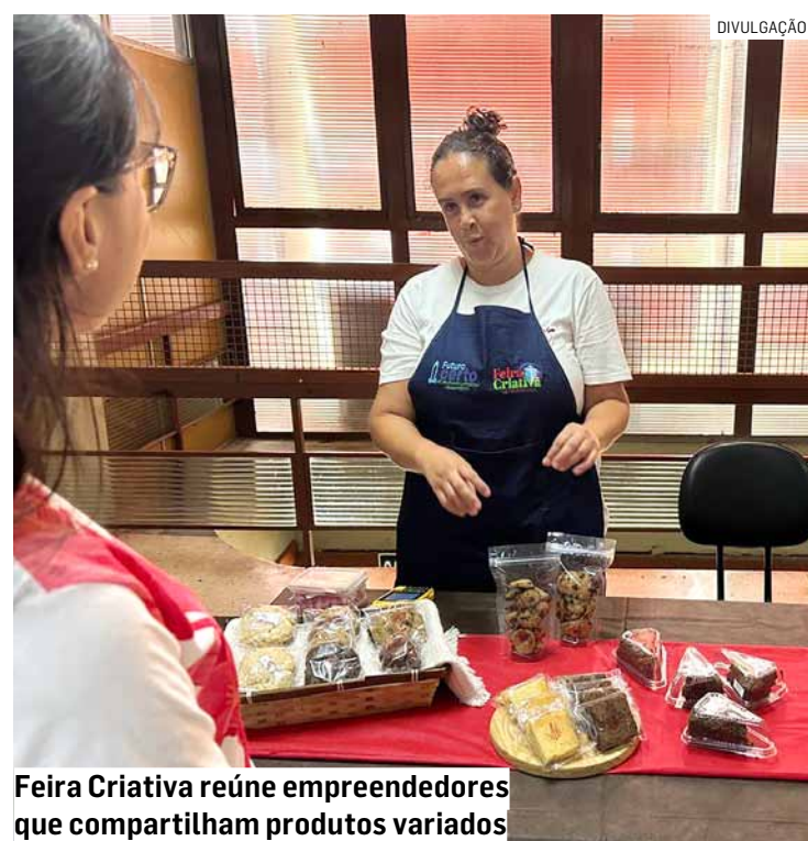
Feira Criativa reúne empreendedores que compartilham produtos variados

A Feira Criativa também ocorre às terças e sextas-feiras, das 8h às 11h, no Centro de Integração e Valorização do Idoso (CIVI) "João Batista Inocentini", na Rua Major Rehder, 650, na Vila Jones.