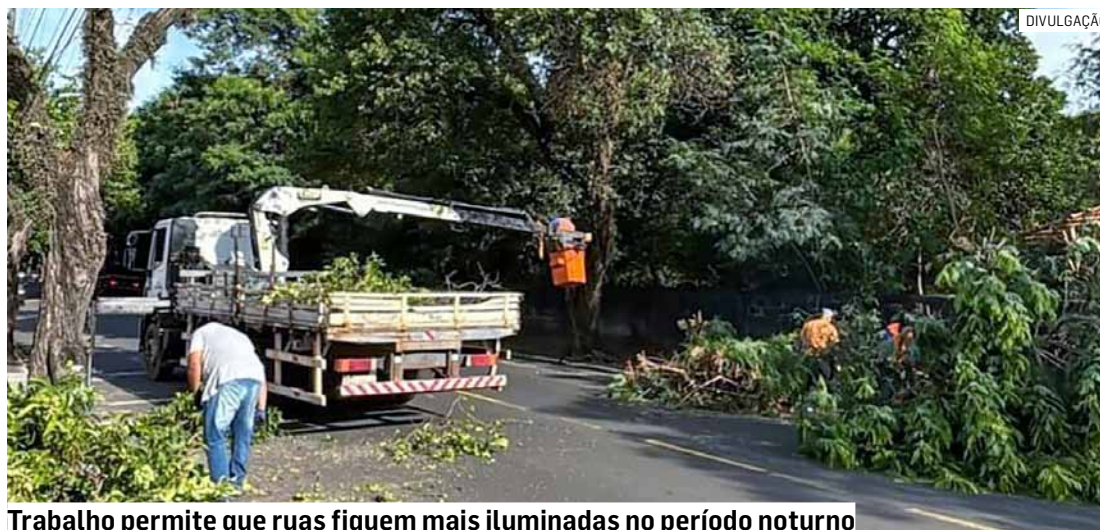
Trabalho permite que ruas fiquem mais iluminadas no período noturno

Até o momento, as podas já aconteceram no Centro, Altos do Klavin, Jardim dos Ipês, Jardim Capuava, entre outros bairros. O trabalho consiste em elevar a copa das árvores, reduzindo seu