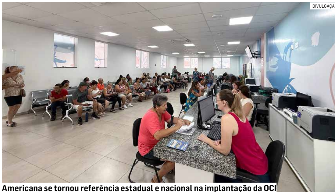
Americana se tornou referência estadual e nacional na implantação da OCI

A ação acontece no Núcleo de Especialidades Vice-Prefeito Doutor Seme Calil Canfour e em clínicas credenciadas da cidade, com atendimentos voltados a pacientes que aguardam na fila do sistema de regulação municipal, previamente convocados pelo call center da Saúde.