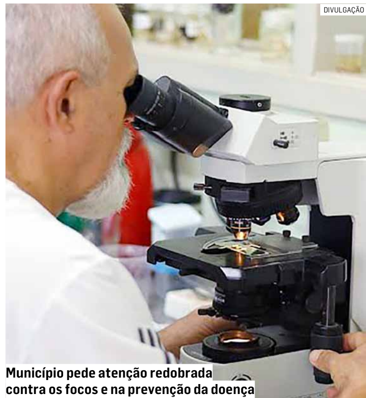
Município pede atenção redobrada contra os focos e na prevenção da doença