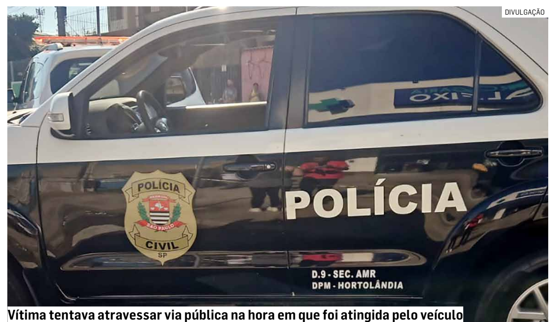
Vítima tentava atravessar via pública na hora em que foi atingida pelo veículo

O caso será registrado no 1º Distrito Policial de Hortolândia, onde a Polícia Civil ficará responsável pela investigação e deverá esclarecer as circunstâncias do acidente.