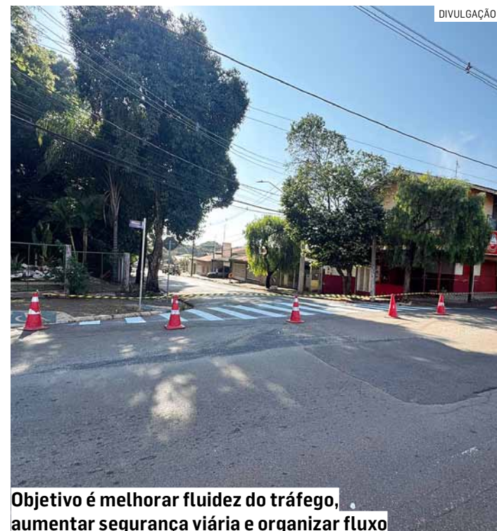
Objetivo é melhorar fluidez do tráfego, aumentar segurança viária e organizar fluxo

A pasta orienta motoristas e pedestres a redobram a atenção à nova sinalização implantada no local, respeitando o novo sentido da via e as demais regras de trânsito. Nos primeiros dias de alteração, equipes da secretaria estarão presentes na região para orientar os condutores e garantir uma adaptação segura e eficiente à nova configuração. A iniciativa, segundo a pasta, faz parte das ações contínuas do município voltadas à melhoria da mobilidade urbana e à promoção de um trânsito mais seguro.