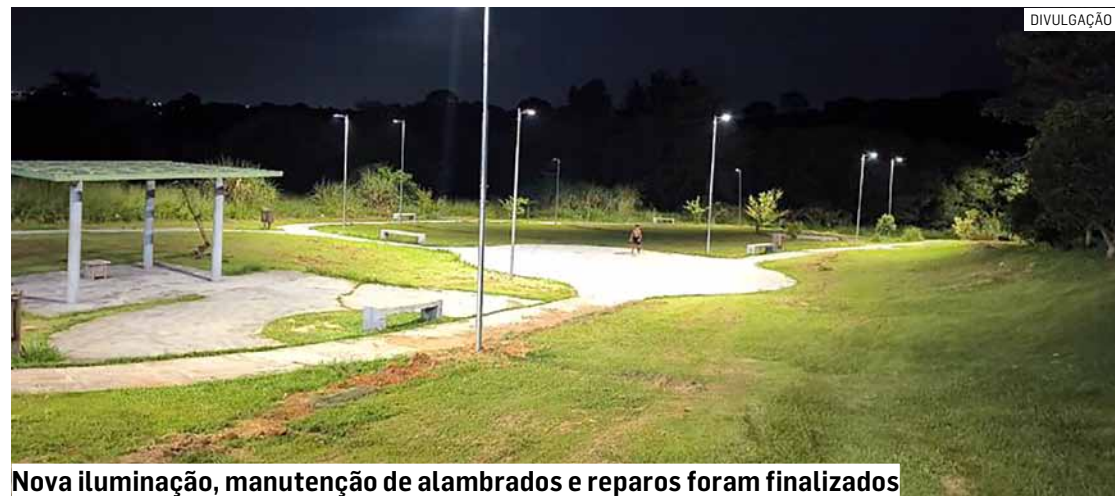
Nova iluminação, manutenção de alambrados e reparos foram finalizados

Da Redação • PAULÍNIA tribunaliberal@tribunaliberal.com.br