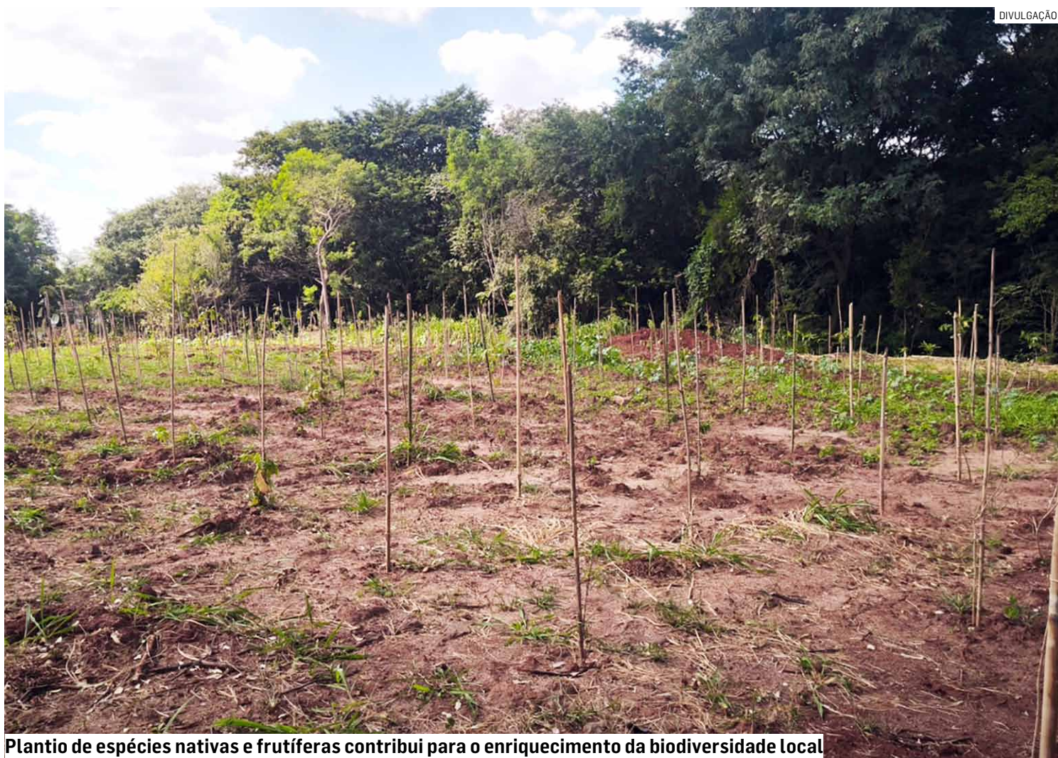
Plantio de espécies nativas e frutíferas contribui para o enriquecimento da biodiversidade local

Realizada em parceria com a BRK Ambiental, a obra contou com investimento superior a R$ 1,3 milhão. O projeto incluiu a implantação de banheiros masculino e feminino, portaria, guarita, estacionamento e espaços de convivência, além de infraestrutura moderna com pista de caminhada, ciclovia, playground, espaço kids,