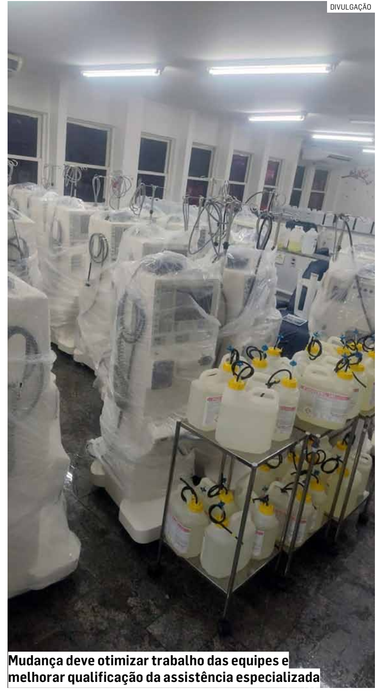
Mudança deve otimizar trabalho das equipes e melhorar qualificação da assistência especializada

O Hospital Municipal Dr. Waldemar Tebaldi é administrado pelo Grupo Chavantes, por meio de gestão compartilhada com a Secretaria Municipal de Saúde.