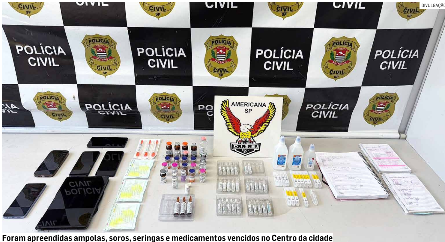
Foram apreendidas ampolas, soros, seringas e medicamentos vencidos no Centro da cidade

A ação foi autorizada pela Vara de Garantias da 4ª Região Administrativa Judiciária (RAJ) de Piracicaba e faz parte de uma investigação que apura a prá-