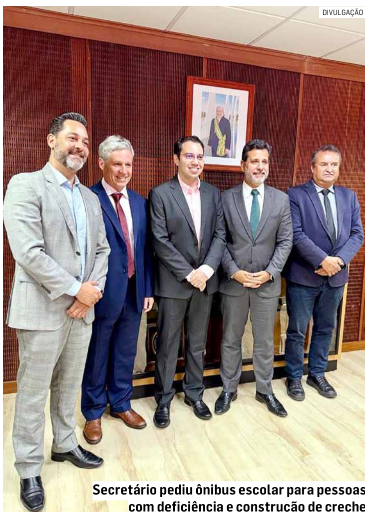
Secretário pediu ônibus escolar para pessoas com deficiência e construção de creche