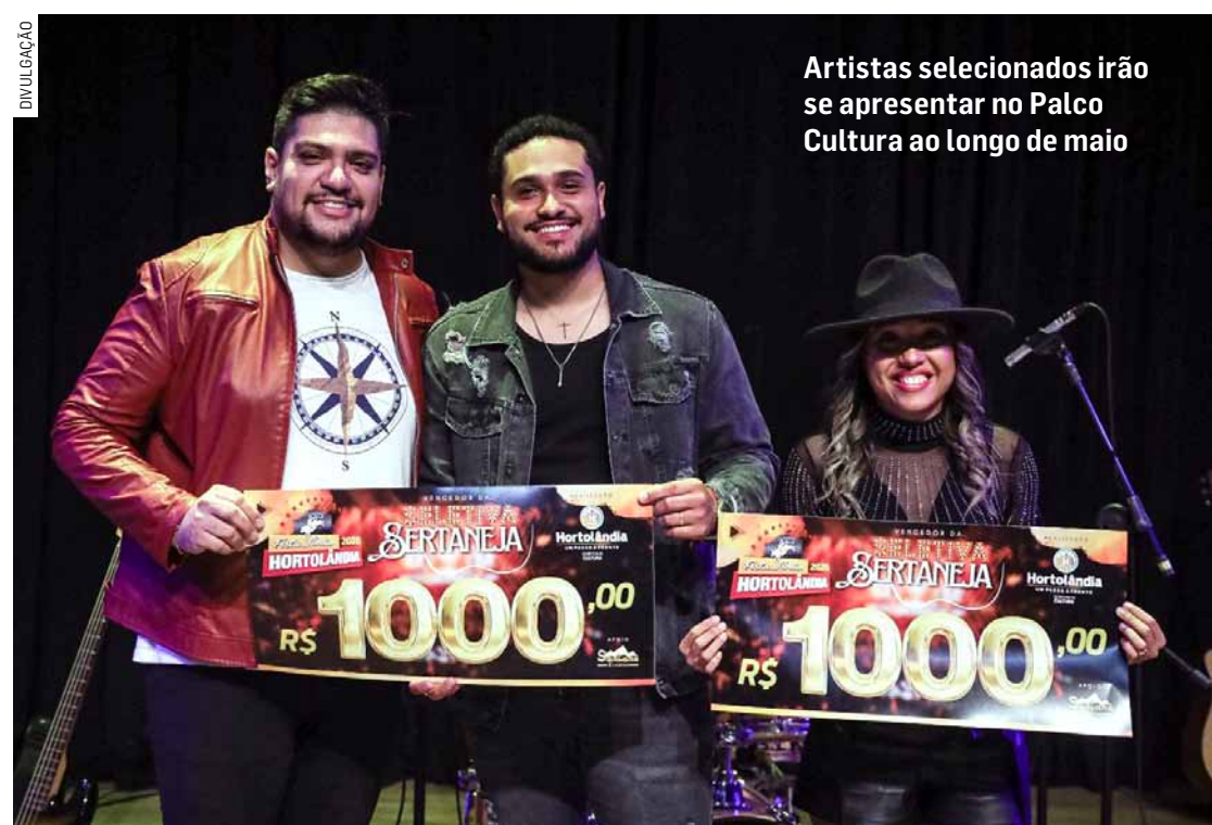
Artistas selecionados irão se apresentar no Palco Cultura ao longo de maio

A Festa do Peão de Hortolândia será realizada entre os dias 8 e 17 de maio, no recinto localizado na Avenida da Emancipação, em frente à farmacêutica EMS, com apoio da prefeitura. O evento também contará com shows de artistas consagrados, como Hugo & Guilherme, Thiaguinho, Edson & Hudson, Diego & Victor Hugo, Zé Neto & Cristiano e Os Menotti, reforçando a programação diversificada e valorizando tanto nomes nacionais quanto talentos locais.