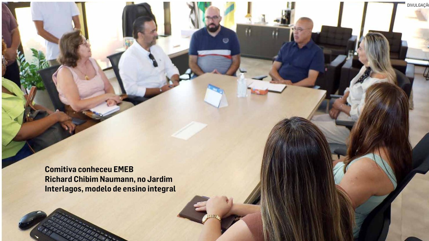
Comitiva conheceu EMEB Richard Chibim Naumann, no Jardim Interlagos, modelo de ensino integral

Mais do que uma visita institucional, o encontro simboliza um movimento crescente: Hortolândia