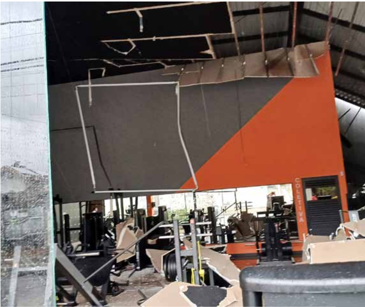
Academia localizada na Avenida Ampelio Gazzetta teve teto danificado e caso foi um dos mais graves da região

A Defesa Civil, o Setor de Trânsito da Prefeitura e a Polícia Militar foram mobilizados imediatamente para isolar a área e avaliar os riscos. Moradores lamentaram o episódio.