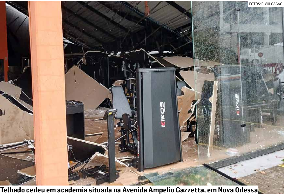
Telhado cedeu em academia situada na Avenida Ampelio Gazzetta, em Nova Odessa