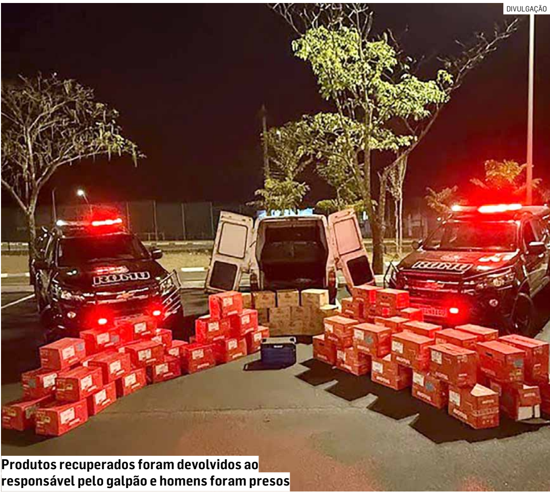
Produtos recuperados foram devolvidos ao responsável pelo galpão e homens foram presos

tiu um alerta sobre o veículo suspeito. O Grupamento de Operações com Cães foi acionado e localizou o automóvel. Após a verificação, os agentes confirmaram que o veículo havia sido furtado em Campinas, em março de 2024, e que circulava com placas falsas. O condutor foi identificado como integrante de uma facção criminosa e possuía diversas passagens pela polícia por roubo e outros crimes. Ele foi preso em flagrante pelos delitos de receptação e adulteração de sinal identificador de veículo. Durante a abordagem, o suspeito ainda tentou destruir o próprio aparelho celular. Segundo a GCM, ele cumpria regime aberto por uma condenação anterior de roubo, também na cidade de Campinas.