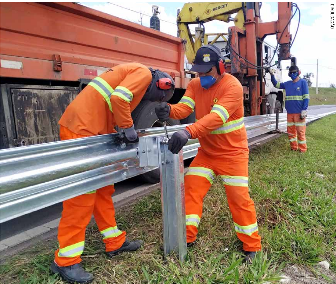
Locais foram definidos após estudo técnico baseado em histórico de acidentes, afirma DER-SP

cretaria de Meio Ambiente, Infraestrutura e Logística, que inclui a ativação de 50 novos radares em todo o Estado de São Paulo a partir desta terça. Com a nova fase de operação, o total de radares em rodovias estaduais não concedidas chega a 241 equipamentos ativos. Segundo o DER, a instalação busca reforçar a segurança viária, reduzir o número de acidentes e “salvar vidas”. Todos os pontos contam com sinalização visível, indicando o limite de velocidade. O presidente do DER-SP, Sergio Codelo, comentou a operação dos novos rada-