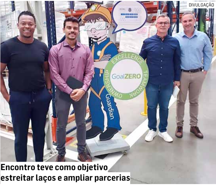
Encontro teve como objetivo estreitar laços e ampliar parcerias

Durante a reunião, a secretaria apresentou iniciativas voltadas à atração de novos investimentos e ao fortalecimento das empresas que já atuam na cidade. Também foram debatidos projetos relacionados à geração de empregos, capacitação da mão de obra local e novas oportunidades de cooperação estratégica que beneficiem tanto o município quanto a região.