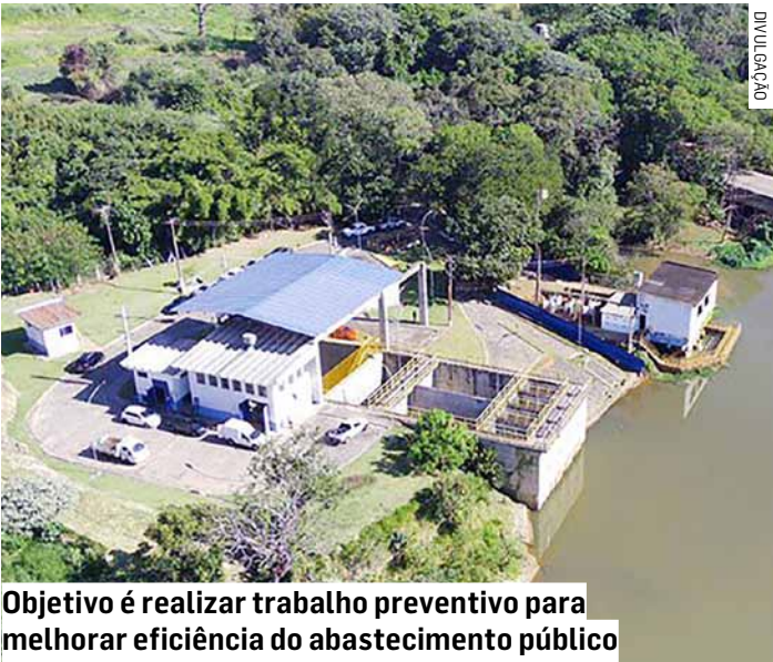
Objetivo é realizar trabalho preventivo para melhorar eficiência do abastecimento público

De acordo com o DAE, o serviço não vai afetar a captação de água e está previsto para ser concluído até o final da tarde de quarta-feira.