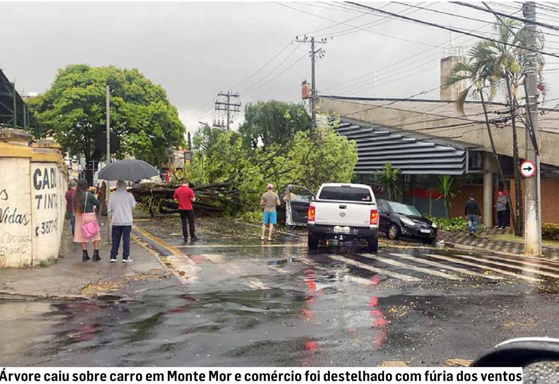
Árvore caiu sobre carro em Monte Mor e comércio foi destelhado com fúria dos ventos

A tarde desta segunda-feira (22) foi marcada por destruição em várias cidades da região. Ventos superiores a 70 km/h destelharam casas, derrubaram árvores e causaram interrupções de energia. Em Americana, Sumaré, Nova Odessa, Hortolândia, Paulínia e Monte Mor, moradores passaram por momentos de pânico. Estruturas metálicas foram arrancadas, ruas alagaram e serviços públicos foram suspensos. PÁGINAS 06 e 07