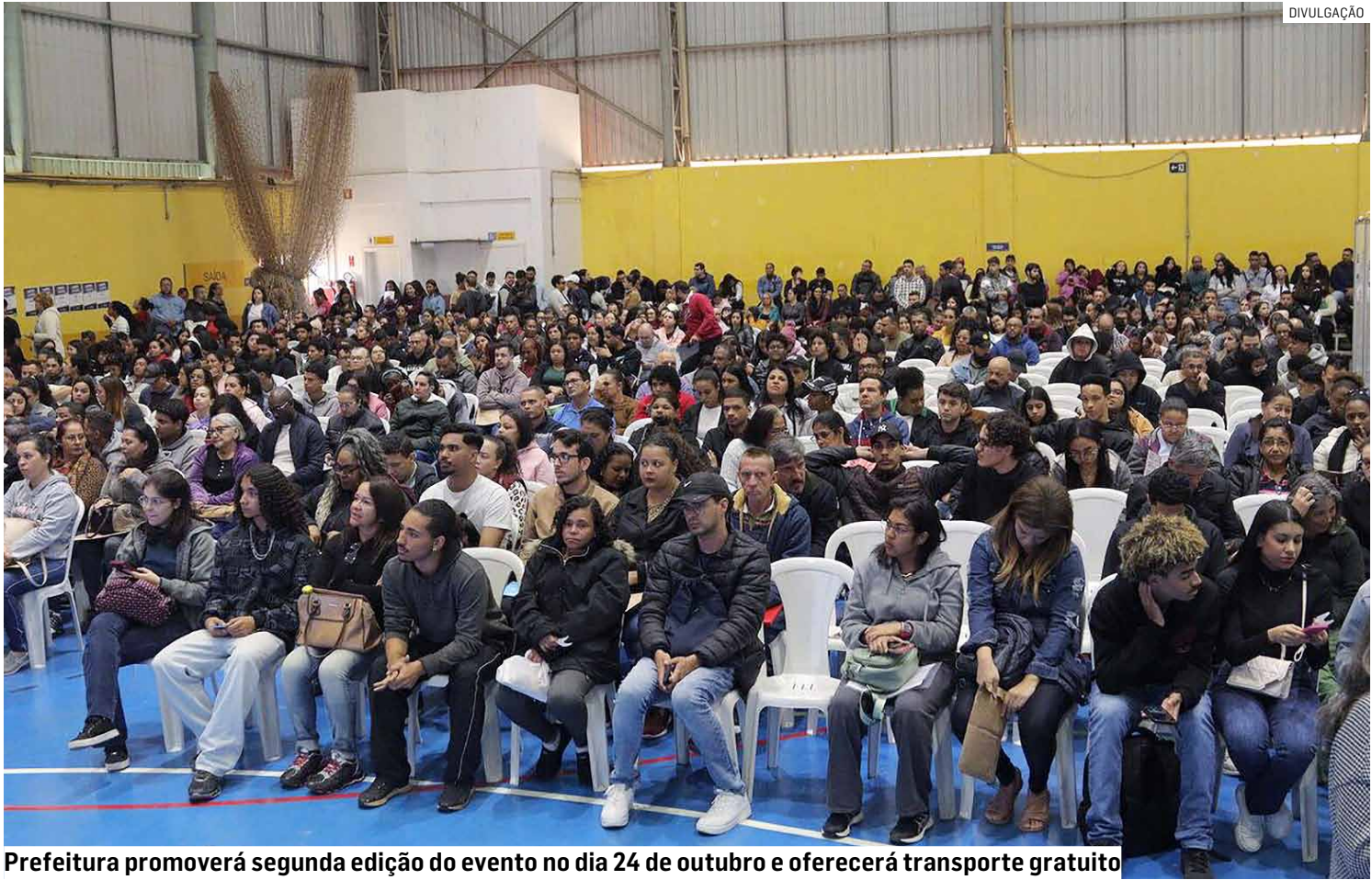
Prefeitura promoverá segunda edição do evento no dia 24 de outubro e oferecerá transporte gratuito

De acordo com a Secretaria de Desenvolvimento Econômico, Trabalho, Turismo e Inovação, a expectativa é disponibilizar de 3.000 a 3.500 vagas de emprego em diferentes modalidades, como efetivo, estágio, temporário, Jovem Aprendiz, Primeiro Emprego e PCDs (Pessoas Com Deficiência).