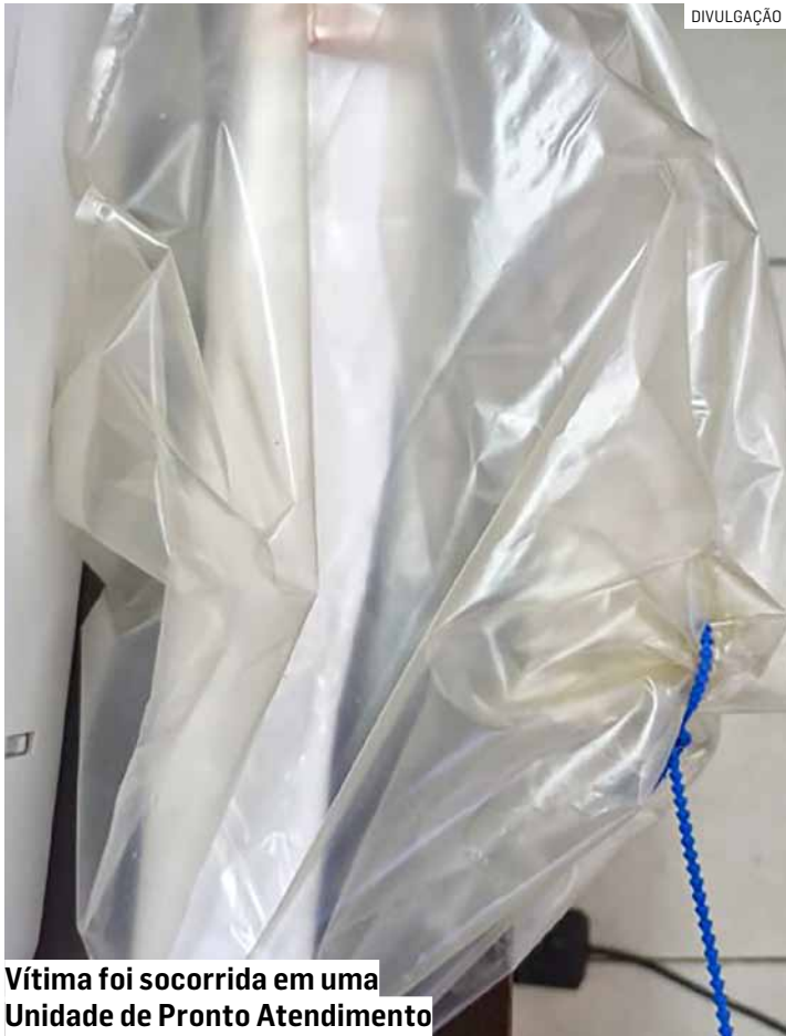
Vítima foi socorrida em uma Unidade de Pronto Atendimento

Uma mulher foi vítima de agressão pelo seu amásio, neste sábado (20), na Rua Manoel Cardoso, no bairro Parque Yolanda, em Sumaré. Segundo informações da Polícia Militar, a vítima sofreu cortes superficiais no rosto, sobrelance e perna, provocados por uma faca. O caso foi registrado como tentativa de feminicídio. A equipe policial foi acionada e, ao chegar ao local, iniciou as buscas pelo agressor, que tentou fugir em um veículo. Após breve acompanhamento, ele foi abordado em sua residência. A faca utilizada na agressão foi localizada, mas nenhum outro objeto ilícito foi encontrado. Com o apoio de outra equipe, a vítima foi levada à uma UPA (Unidade de Pronto Atendimento), onde recebeu atendimento médico e foi liberada. O agressor foi conduzi-