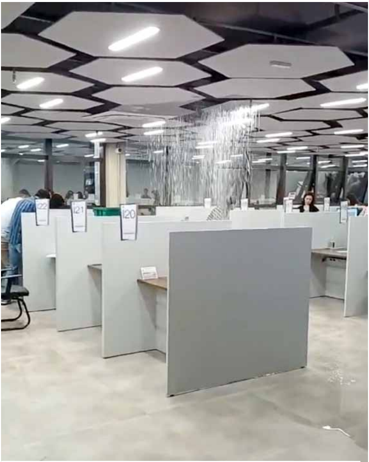
Até mesmo Novo Paço Municipal teve ponto de alagamento

Não há registro de vítimas, nem de desabrigados ou desalojados, nem de destelhamento de casas, até o momento. | Paulo Medina