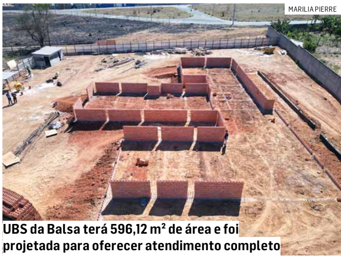
UBS da Balsa terá 596,12 m² de área e foi projetada para oferecer atendimento completo

O investimento total na obra é de R$ 2.551.108,33, sendo R$ 2.435.976,00 provenientes do Novo PAC (Programa de Aceleração do Crescimento) e R$ 115.132,33 de contrapartida da prefeitura.