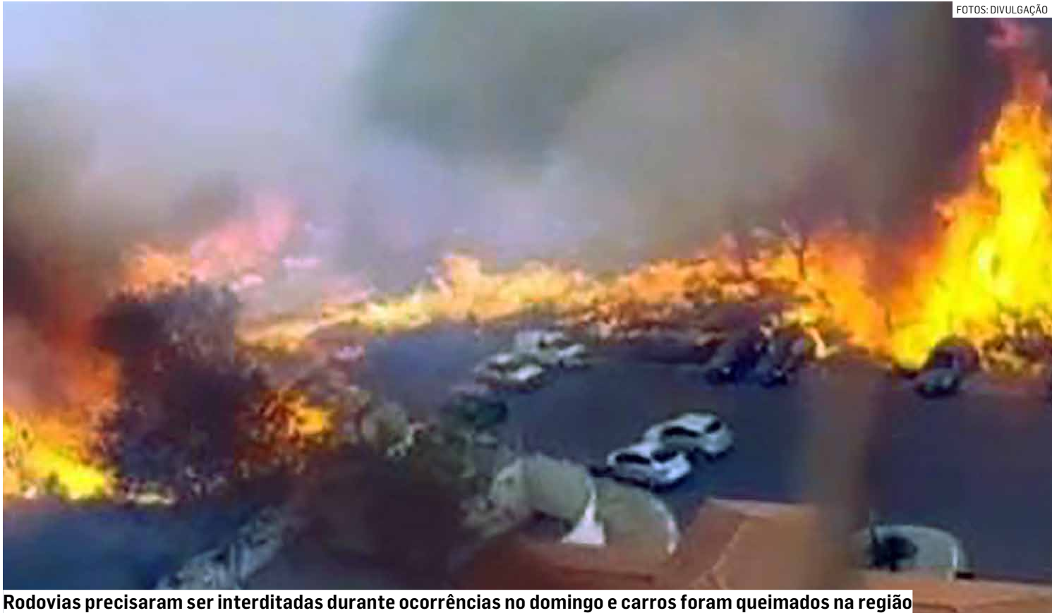
Rodovias precisaram ser interditadas durante ocorrências no domingo e carros foram queimados na região

Em Americana, o primeiro grande foco surgiu às margens da Rodovia Anhanguera, logo após o pedágio no sentido interior. O fogo avançou por mais de 500 mil metros quadrados