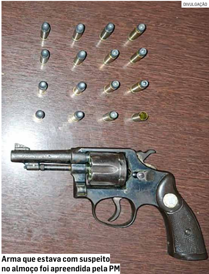
Arma que estava com suspeito no almoço foi apreendida pela PM

Na tarde de sábado (20), um homem foi preso em flagrante em Sumaré por porte ilegal de arma de fogo, ameaça, violência doméstica e descumprimento de medida protetiva. Segundo a Polícia Militar, a ocorrência teve início em Campinas, quando a vítima — ex-companheira do suspeito — acionou o CO-POM relatando que havia sido ameaçada com uma arma de fogo. Ela também informou que o agressor se deslocaria para uma residência em Sumaré. Durante as buscas, os policiais localizaram um veículo Ford/Ka cinza estacionado na Rua José Alves Nobre, no Jardim Bom Retiro. Pela fresta do portão, os agentes visualizaram o homem dentro da casa, almoçando com um revólver visível na cintura. O suspeito portava um revólver calibre .32, com cinco munições intactas e uma deflagrada.