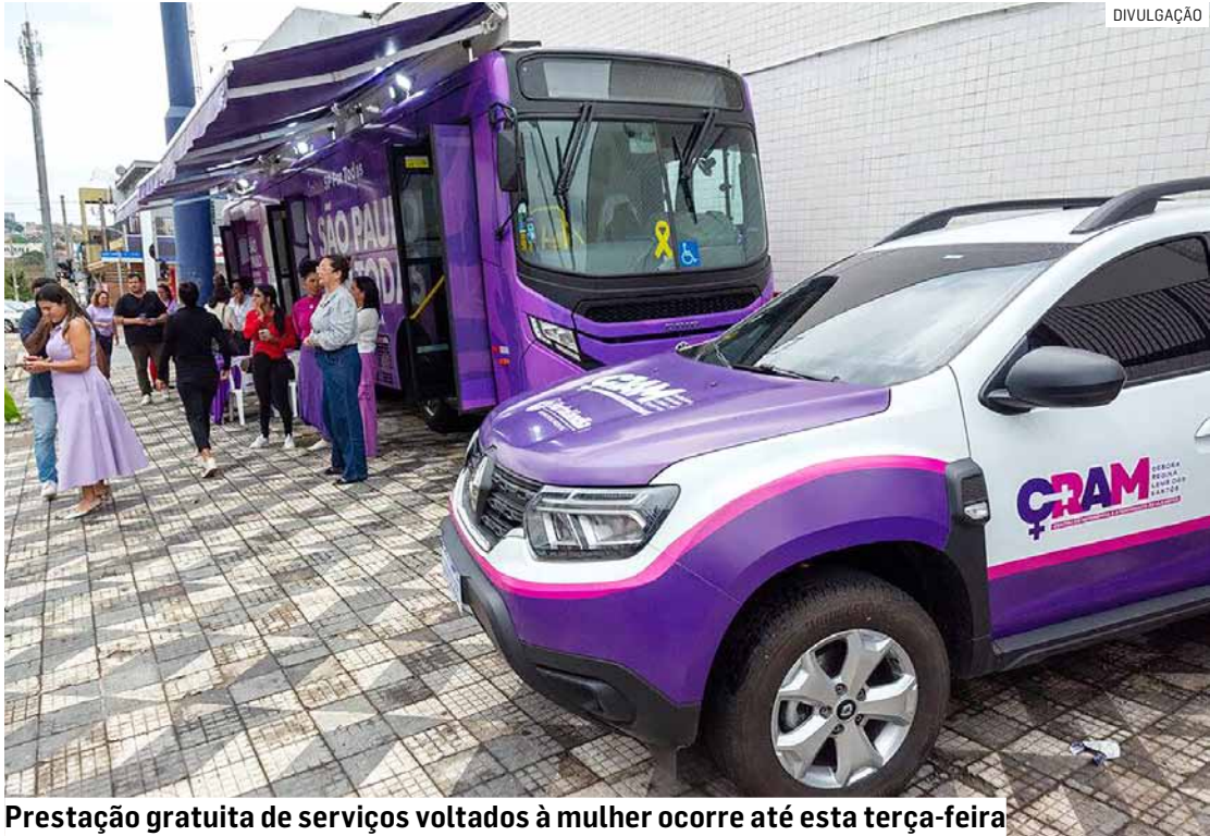
Prestação gratuita de serviços voltados à mulher ocorre até esta terça-feira