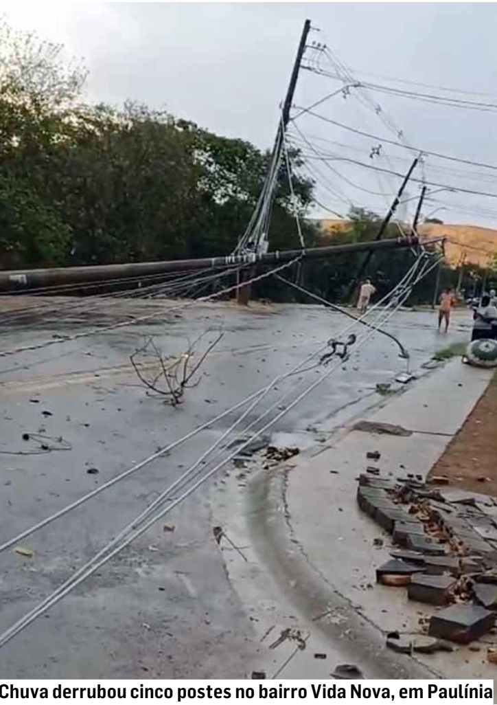
Chuva derrubou cinco postes no bairro Vida Nova, em Paulínia