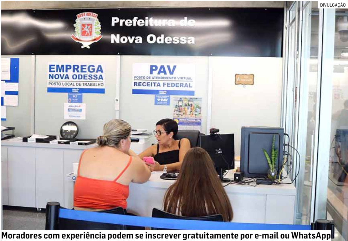
Moradores com experiência podem se inscrever gratuitamente por e-mail ou WhatsApp

AJUDANTE DE COZINHA – Acima de 18 anos. Ambos os sexos. Escala 6X1. Carga horária 7h20 diária. Salário R$ 1.990,00 + Vale-transporte + Seguro