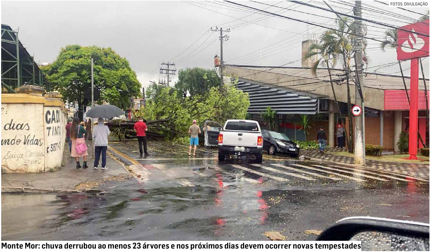
Monte Mor: chuva derrubou ao menos 23 árvores e nos próximos dias devem ocorrer novas tempestades

Em Nova Odessa, a Rua dos Ipês, na região do Jardim Alvorada, foi bloqueada pela queda de árvores, enquanto uma residência teve o telhado parcialmente arrancado pela força do vento. “Nunca vi casas aqui serem destelhadas assim”, lamentou uma moradora. Já na Rua Pau-Brasil, a intensidade da tempestade partiu um poste de energia elétrica