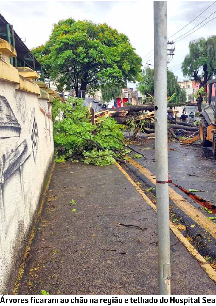
Árvores ficaram ao chão na região e telhado do Hospital Seara foi arrancado em Americana; unidade foi evacuada