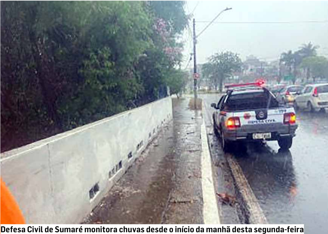
Defesa Civil de Sumaré monitora chuvas desde o início da manhã desta segunda-feira

A Defesa Civil de São Paulo emitiu alerta a respeito de uma mudança brusca na previsão do tempo em todo o Estado. Após o domingo de calor intenso com ven-