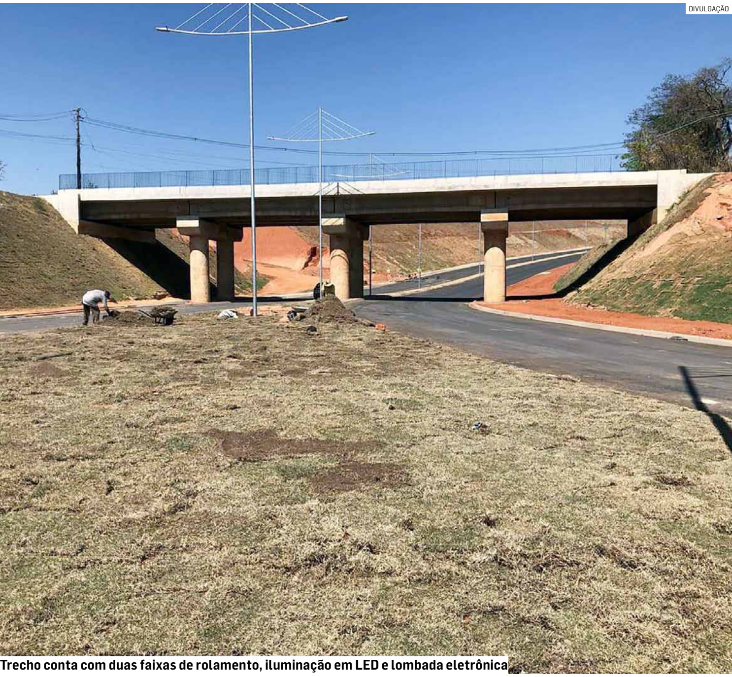
Trecho conta com duas faixas de rolamento, iluminação em LED e lombada eletrônica

Esse outro trecho cuja obra está em andamento começa na rotatória na Estrada Sabina Baptista de Camargo, passa ao lado da empresa Tecnoperfil, e irá até o Jardim Nova Europa, onde se ligará com uma via já existente, próxima à empresa CAF.