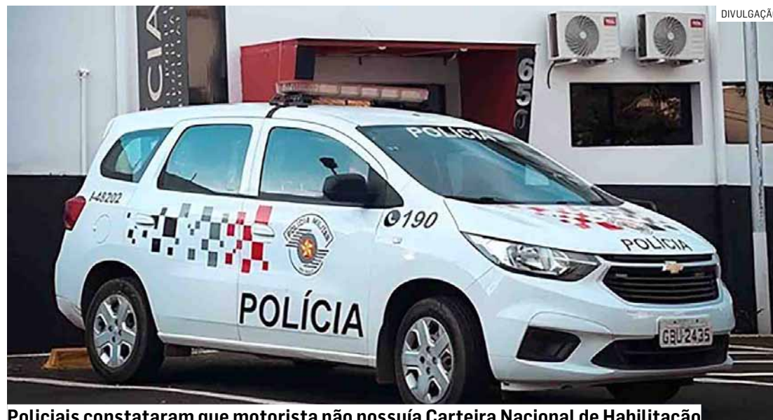
Policiais constataram que motorista não possuía Carteira Nacional de Habilitação

Após um breve acompanhamento, o veículo foi localizado e abordado na Rua Jacarandá Brasiliana, no bairro Real Parque. Durante a fiscalização, os po-