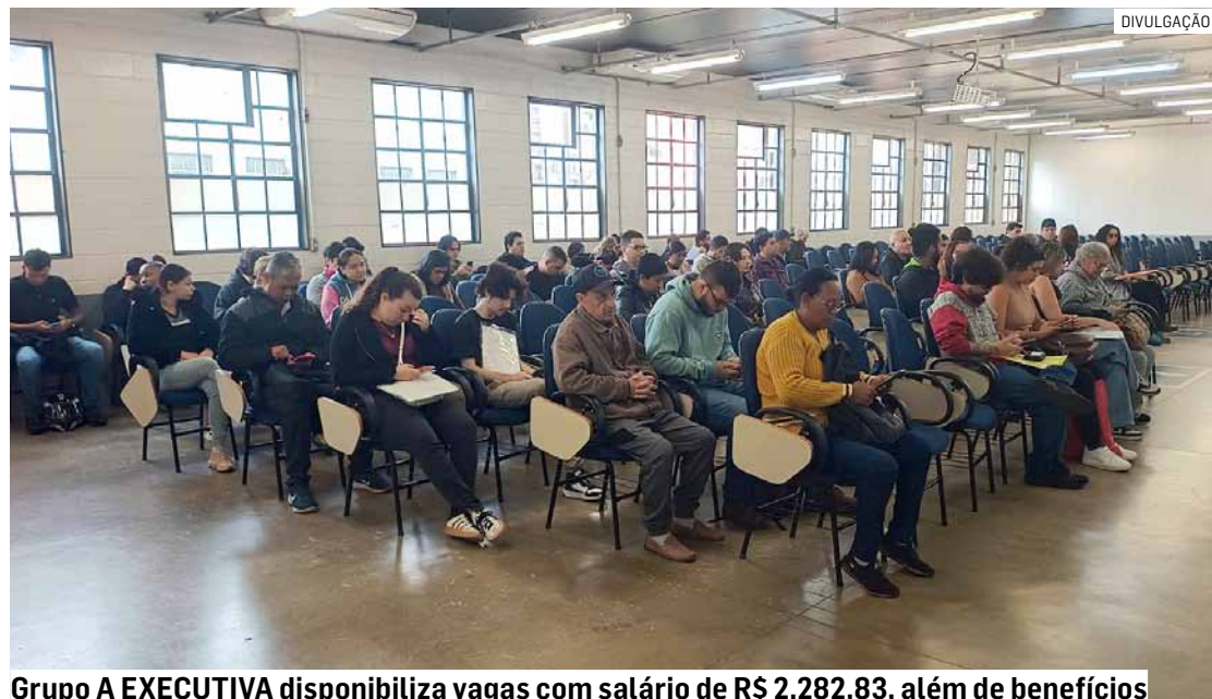
Grupo A EXECUTIVA disponibiliza vagas com salário de R$ 2.282,83, além de benefícios

As oportunidades são destinadas a candidatos com ensino fundamental completo, sem exigência