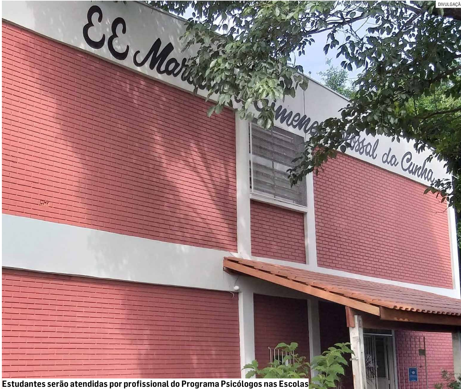
Estudantes serão atendidas por profissional do Programa Psicólogos nas Escolas

Briga entre duas estudantes nas proximidades da Escola Cívico-Militar Marinalva Gimenes, no Pq. Jatobá, terminou com tenente agredida; Estado repudiou a violência e informou acompanhamento psicológico para alunas denunciadas