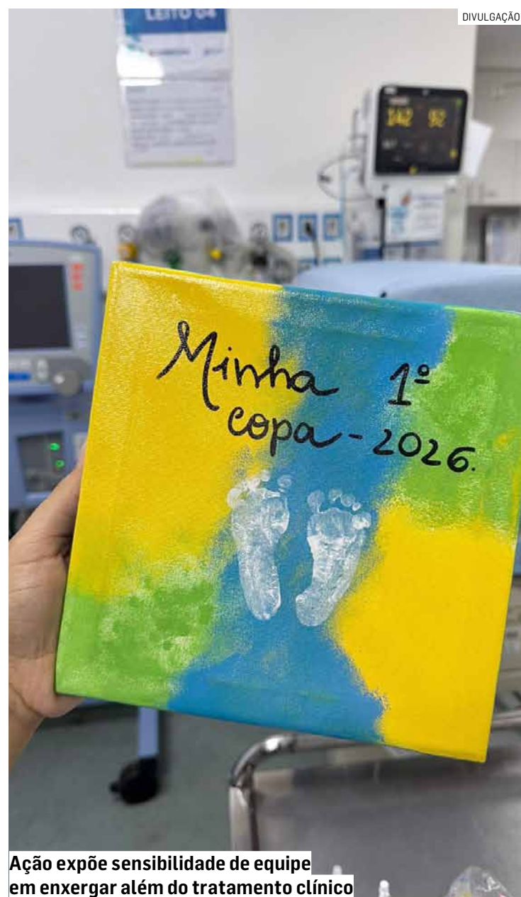
Ação expõe sensibilidade de equipe em enxergar além do tratamento clínico