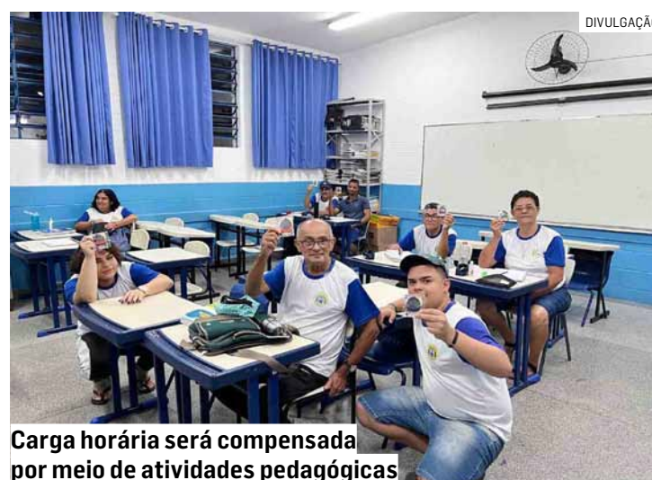
Carga horária será compensada por meio de atividades pedagógicas

A medida, que “dispõe sobre a organização das atividades da Educação de Jovens e Adultos - EJA durante a realização dos jogos da Seleção Brasileira de Futebol na Copa do Mundo FIFA 2026 e dá outras providências”, estabelece ainda que as aulas sejam compensadas por meio de atividades pedagógicas, tais como pesquisas orientadas; estudos dirigidos; produções textuais; atividades de leitura e interpretação; resolução de exercícios; projetos interdisciplinares; elaboração de relatórios; port-