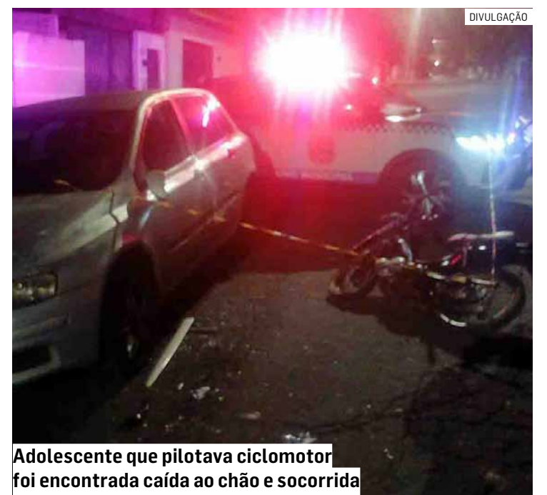
Adolescente que pilotava ciclomotor foi encontrada caída ao chão e socorrida

A Polícia Civil requisiu perícia técnica no local, que permaneceu preservado pela Guarda Municipal até a conclusão dos trabalhos. Após os procedimentos de investigação, a mobilete foi apreendida e encaminhada ao Centro de Polícia Judiciária (CPJ).