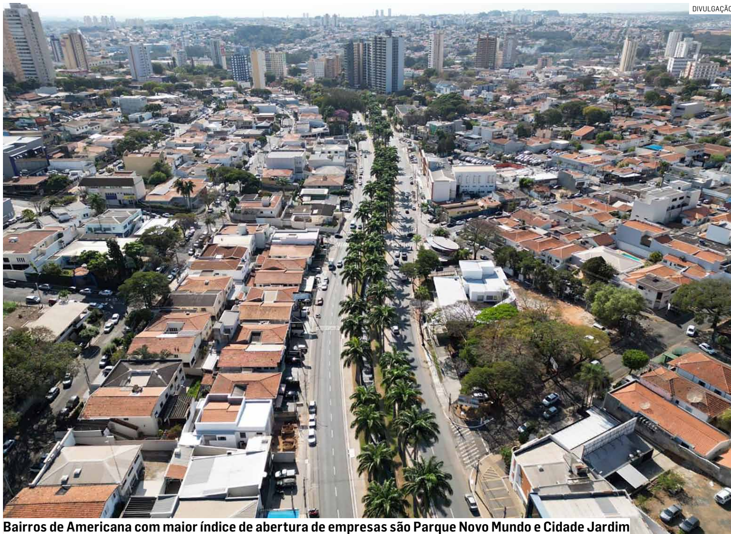
Bairros de Americana com maior índice de abertura de empresas são Parque Novo Mundo e Cidade Jardim

Na sequência aparecem os segmentos do comércio, com 634 empreendimentos (15,9%), indústria, com 397 empresas (9,9%), cons-