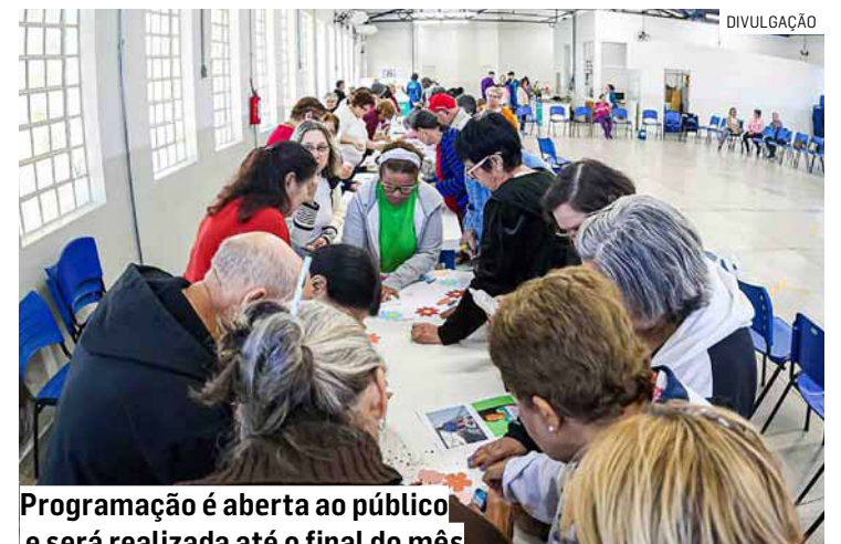
Programação é aberta ao público e será realizada até o final do mês

"A programação foi pensada para tratar diversas frentes que envolvem a pessoa idosa e quem convive e cuida, desde atividades sobre memórias afetivas, exer-