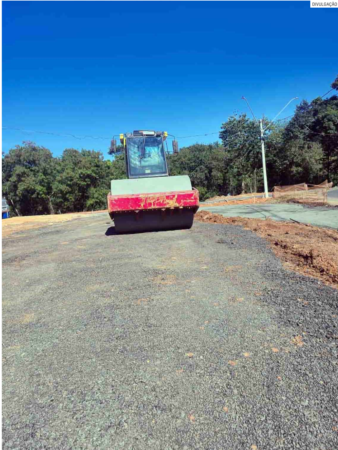
Obra do Viaduto da Mancini avança e está em período de preparação para asfaltamento

Construção que ligará as regiões central e de Nova Veneza entrou em outra etapa com a preparação de estrutura para receber pavimentação; intervenção pretende criar mais fluidez, maior segurança e integração ao trânsito de Sumaré