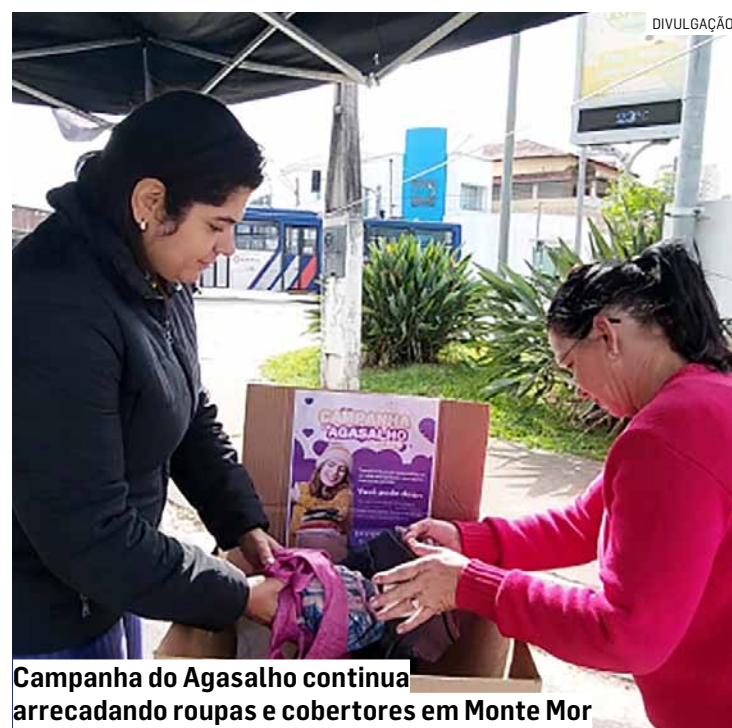
Campanha do Agasalho continua arrecadando roupas e cobertores em Monte Mor

A campanha incentiva a doação de peças em bom estado de conservação.