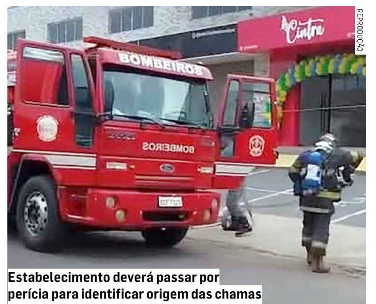
Estabelecimento deverá passar por perícia para identificar origem das chamas

Após a extinção das chamas, o local deverá passar por perícia para identificar a origem do fogo. Os danos materiais serão contabilizados pelos responsáveis pelo estabelecimento.