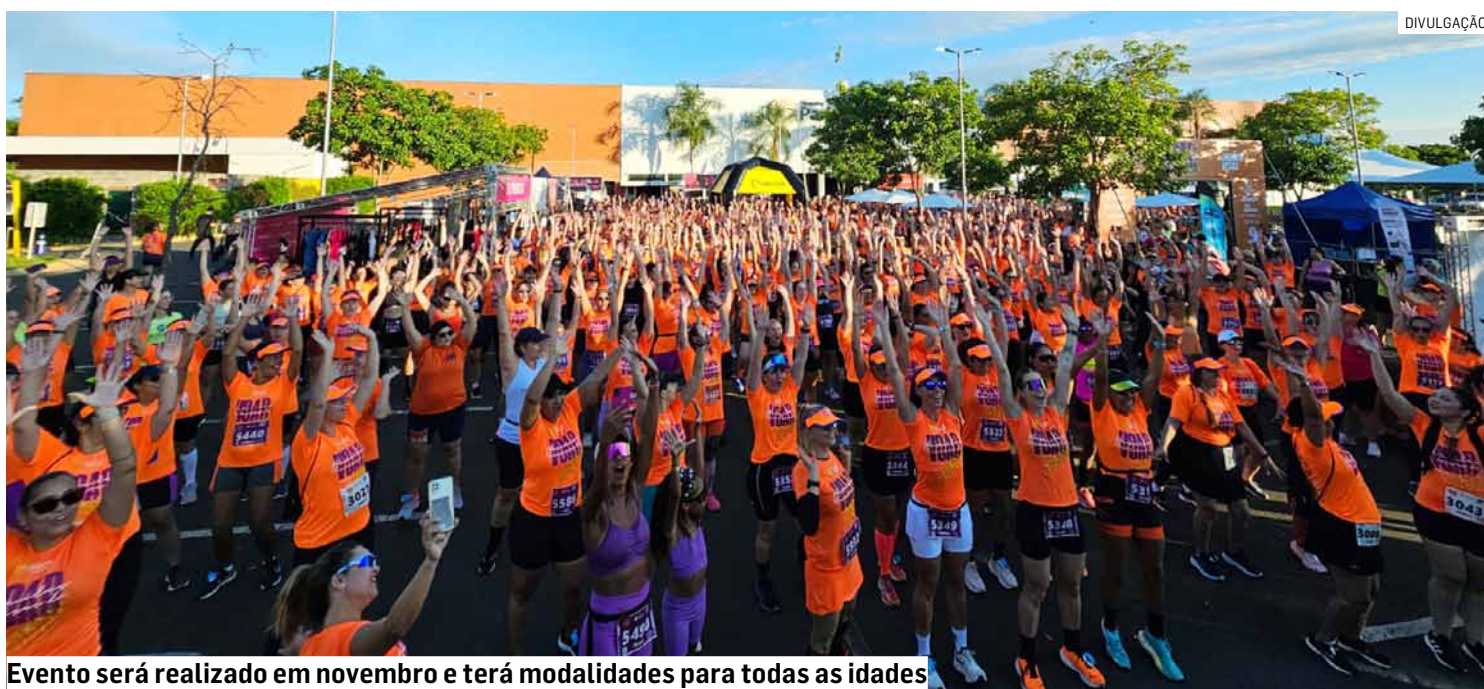
Evento será realizado em novembro e terá modalidades para todas as idades

Da Redação • SUMARÉ tribunaliberal@tribunaliberal.com.br