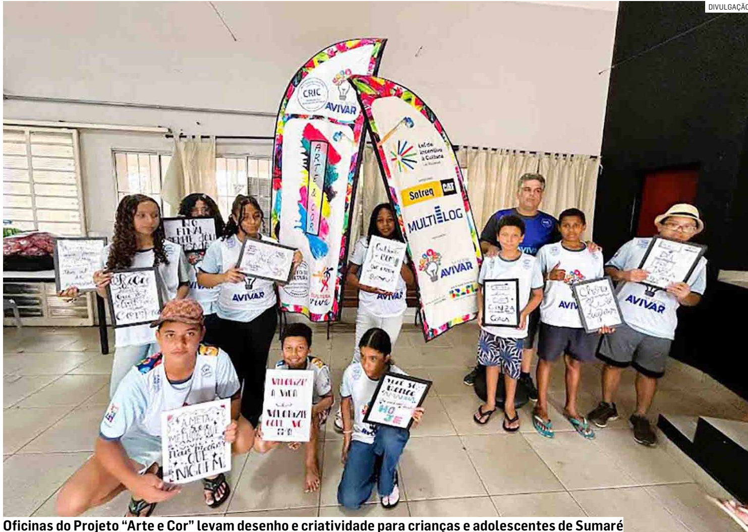
Oficinas do Projeto “Arte e Cor” levam desenho e criatividade para crianças e adolescentes de Sumaré

O acesso ao projeto e suas oficinas é totalmen-