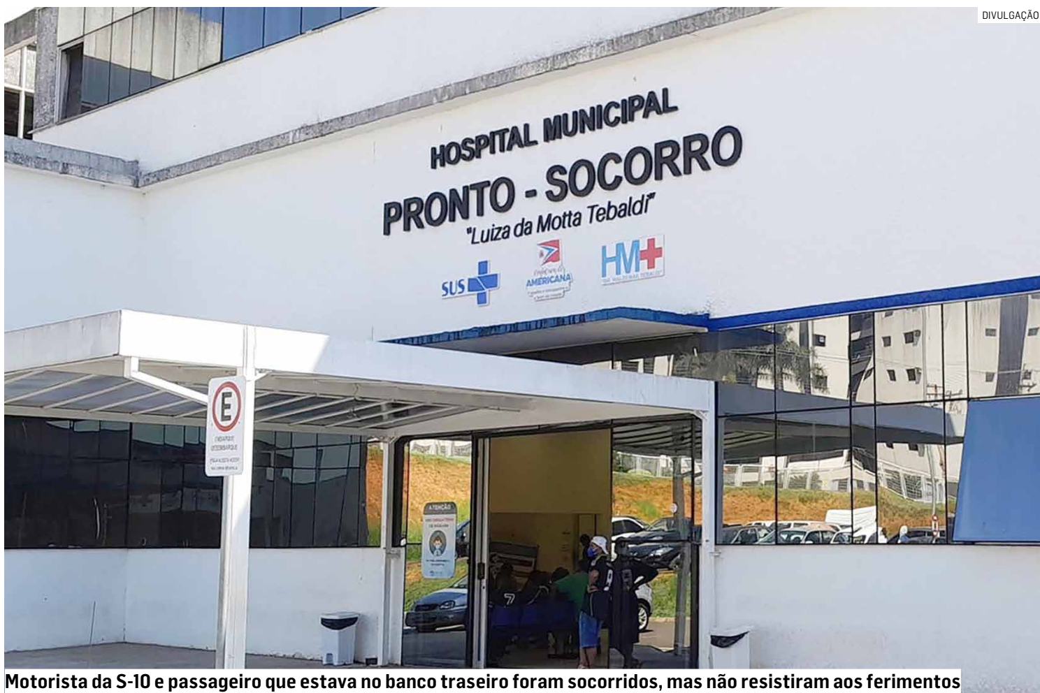
Motorista da S-10 e passageiro que estava no banco traseiro foram socorridos, mas não resistiram aos ferimentos

A Polícia Civil irá investigar as circunstâncias e as causas da colisão.