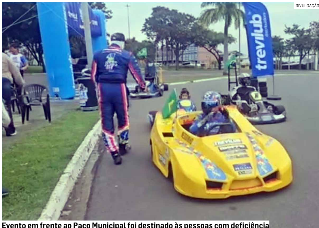
Evento em frente ao Paço Municipal foi destinado às pessoas com deficiência

Um grande sucesso. Essa foi a avaliação da Secretaria de Esportes e Lazer da Prefeitura de Nova Odessa sobre o Kart Terapia, evento realizado no último sábado (20), em frente ao Paço Municipal, que contou com 64 participantes em sua segunda edição. A iniciativa, que utiliza a prática esportiva como ferramenta de inclusão, desenvolvimento e lazer, foi promovida em parceria com o GRUMAA (Grupo de Mães Acolhedoras do Autismo) e o apoio do piloto Gene Fireball, tendo como foco as pessoas com deficiência (PCDs).