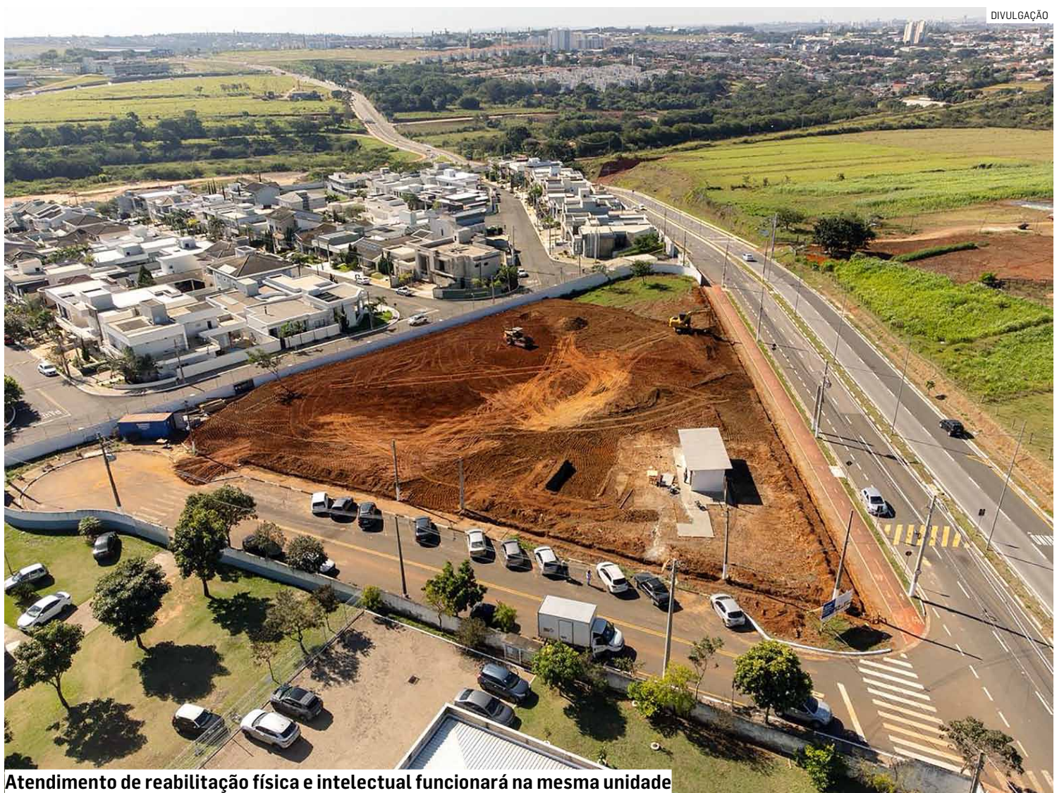
Atendimento de reabilitação física e intelectual funcionará na mesma unidade

Com a construção do CER na região do Green Park, a prefeitura consolidará a Vila da Saúde, oferecendo numa mesma área diversos serviços especializados em saúde. Ali já funcionam o CEM (Centro de Especialidades Médicas), o Caism (Centro de Aten-