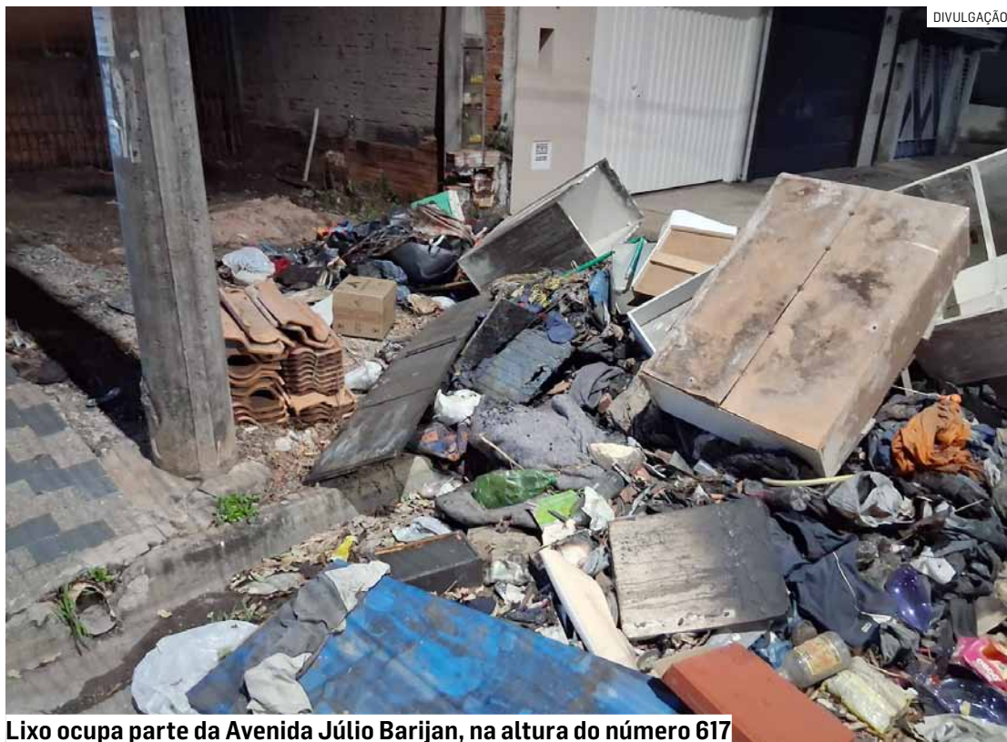
Lixo ocupa parte da Avenida Júlio Barijan, na altura do número 617

O ponto onde o lixo está concentrado fica em frente a um imóvel que teria sido