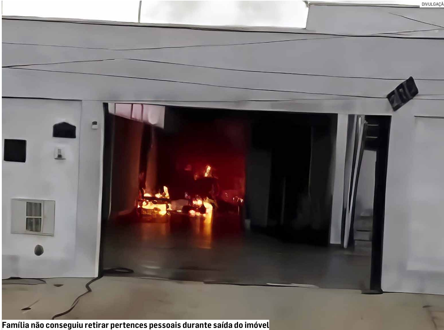
Família não conseguiu retirar pertences pessoais durante saída do imóvel

Fogo de grandes proporções atingiu imóvel no bairro São José e chamas se espalharam rapidamente, provocando momentos de pânico entre moradores; casal e dois filhos precisaram deixar a casa para não sofrerem queimaduras