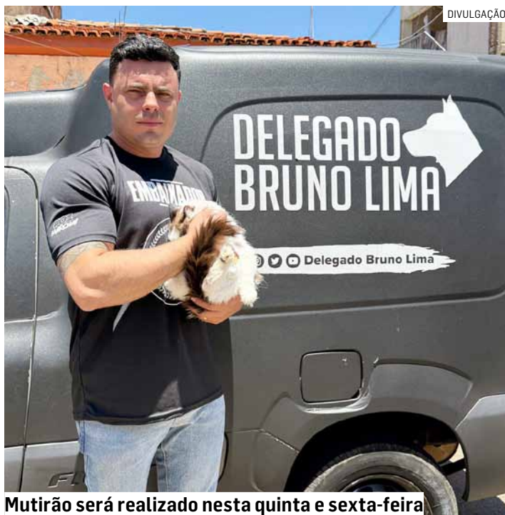
Mutirão será realizado nesta quinta e sexta-feira

Hortolândia recebe nesta quinta e sexta-feira (dias 23 e 24) um mutirão de castração animal que deve beneficiar 360 pets, sendo 180 atendimentos por dia. A ação é promovida pela prefeitura, por meio da Secretaria Municipal de Meio Ambiente, em parceria com o Governo do Estado de São Paulo, dentro do Programa Castra Mais São Paulo. Os animais contemplados foram previamente convocados pelo Departamento de Bem-Estar Animal de Hortolândia. PÁGINA 07