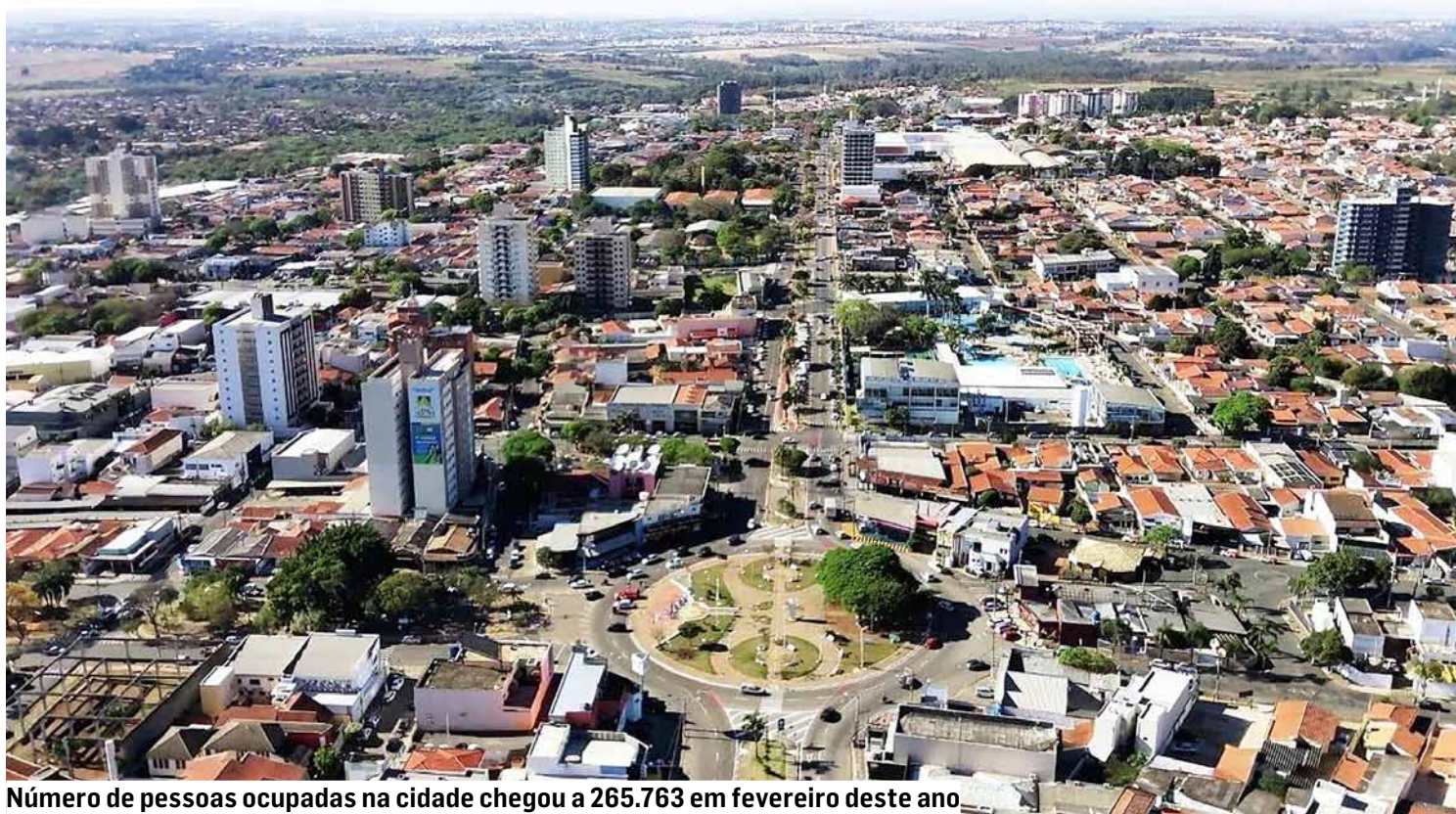
Número de pessoas ocupadas na cidade chegou a 265.763 em fevereiro deste ano.

No ranking da Região Metropolitana de Campinas (RMC), o município ocupa