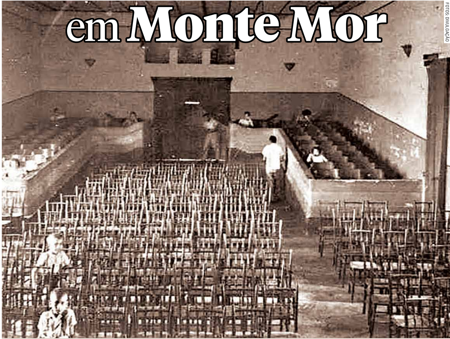
Interior do Cine Rex