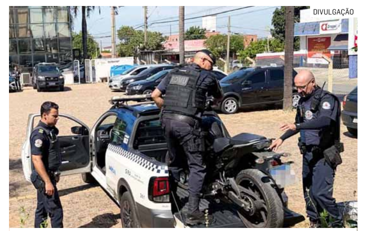
Menores foram encaminhados à Central de Polícia Judiciária

Durante a ação, dois adolescentes, de 16 e 17 anos, foram apreendidos. Com eles, os agentes encontraram uma réplica de arma de fogo. A motocicleta e o objeto foram apreendidos.