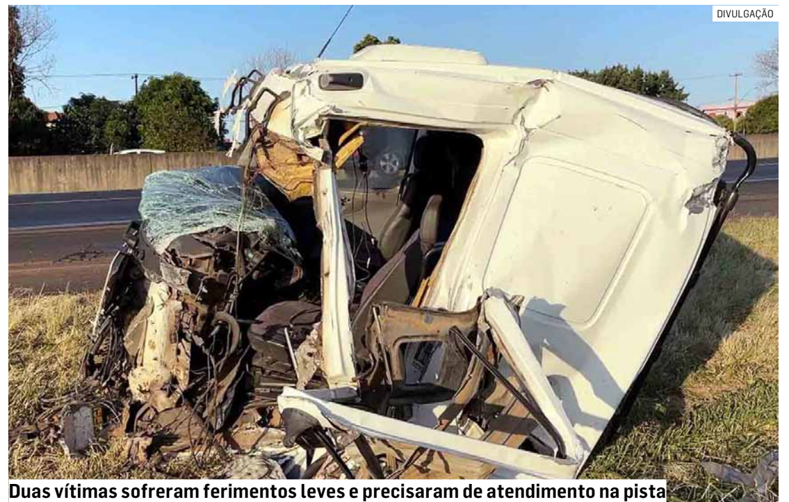
Dois vítimas sofreram ferimentos leves e precisaram de atendimento na pista

Após o trabalho das equipes de atendimento e a remoção dos veículos e da carga, todas as faixas foram liberadas. As circunstâncias do acidente serão apuradas.