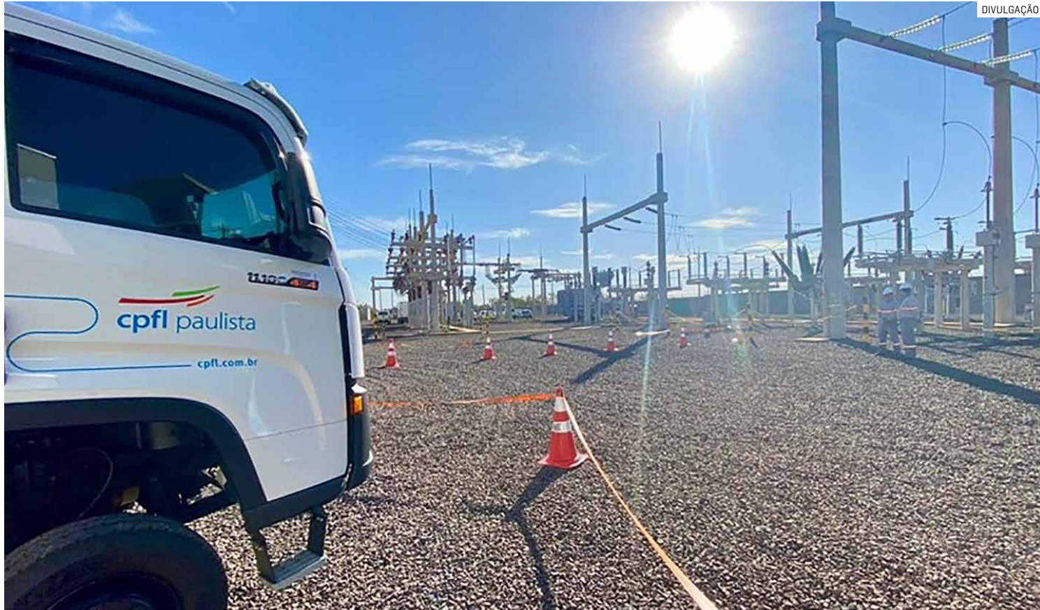
Novo valor alcança todos os tipos de consumidores atendidos pela concessionária, desde residências até grandes indústrias;

A agência reguladora explica que a diferença ocorre por conta dos custos distintos de fornecimento em cada nível de consumo. Além disso, parte do aumento foi suavizada por um mecanis-