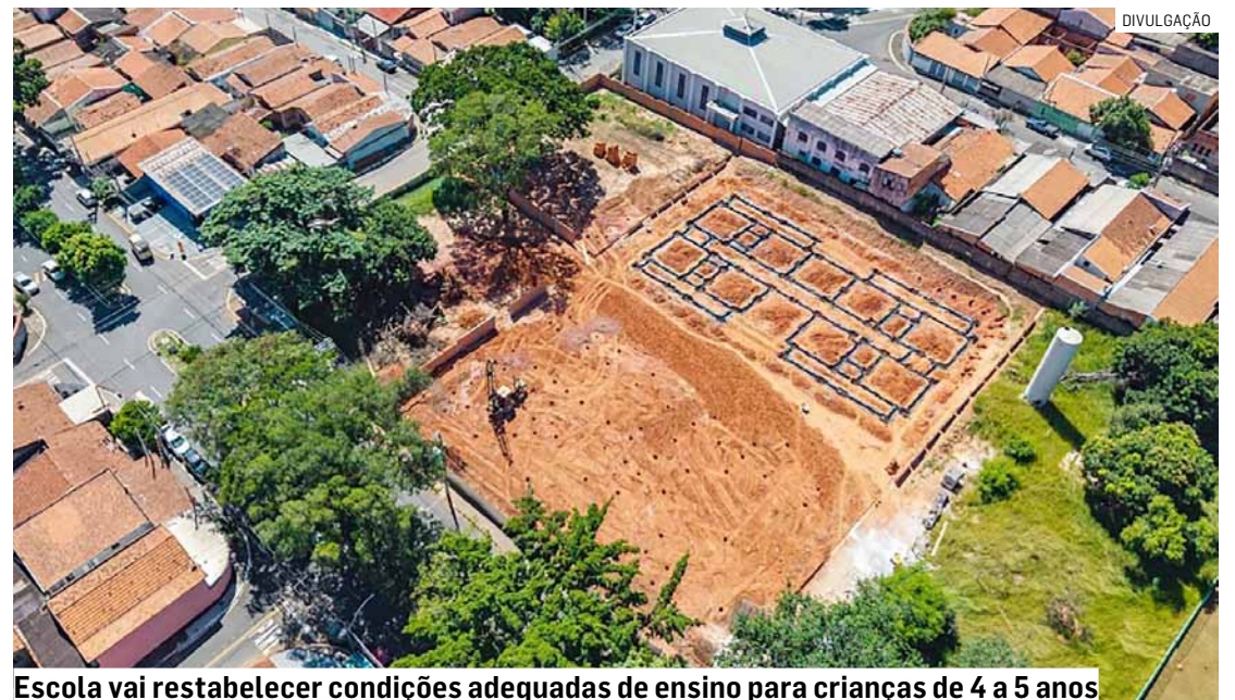
Escola vai restabelecer condições adequadas de ensino para crianças de 4 a 5 anos

Em paralelo a construção da nova escola, a prefeitura disse que segue realizando melhorias de infraestrutura em todas as unidades que compõem a rede municipal de ensino. As ações são feitas seguindo o cronograma determinado pela Secretaria de Obras.