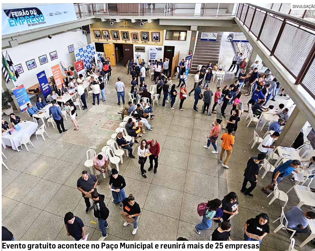
Evento gratuito acontece no Paço Municipal e reunirá mais de 25 empresas

Os interessados devem comparecer ao local munidos de documentos pessoais (RG, CPF e carteira de trabalho, se possível) e currículo atualizado. A entrada é gratuita e não há necessidade de inscrição prévia. Recomenda-se chegar cedo para garantir