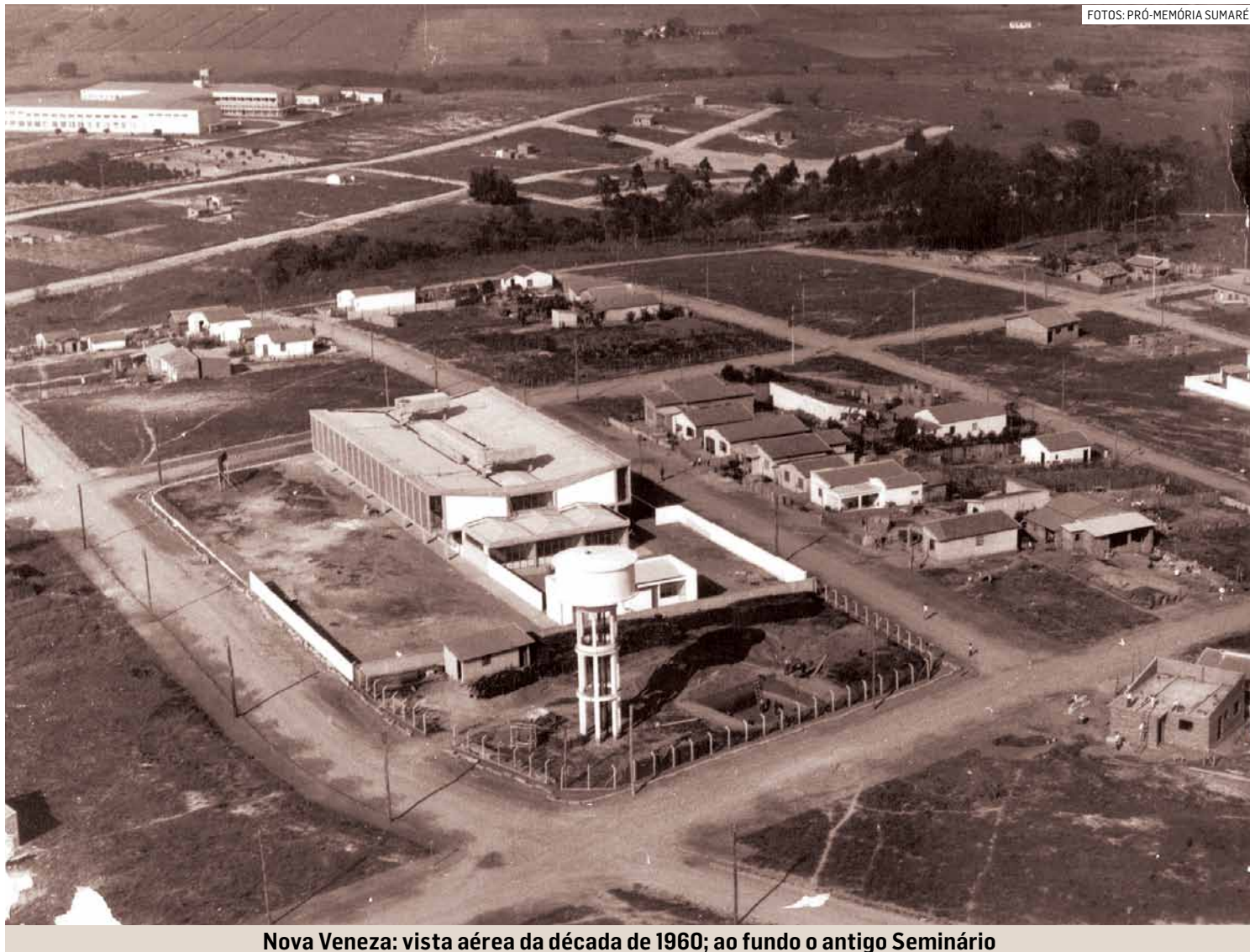
Nova Veneza: vista aérea da década de 1960; ao fundo o antigo Seminário