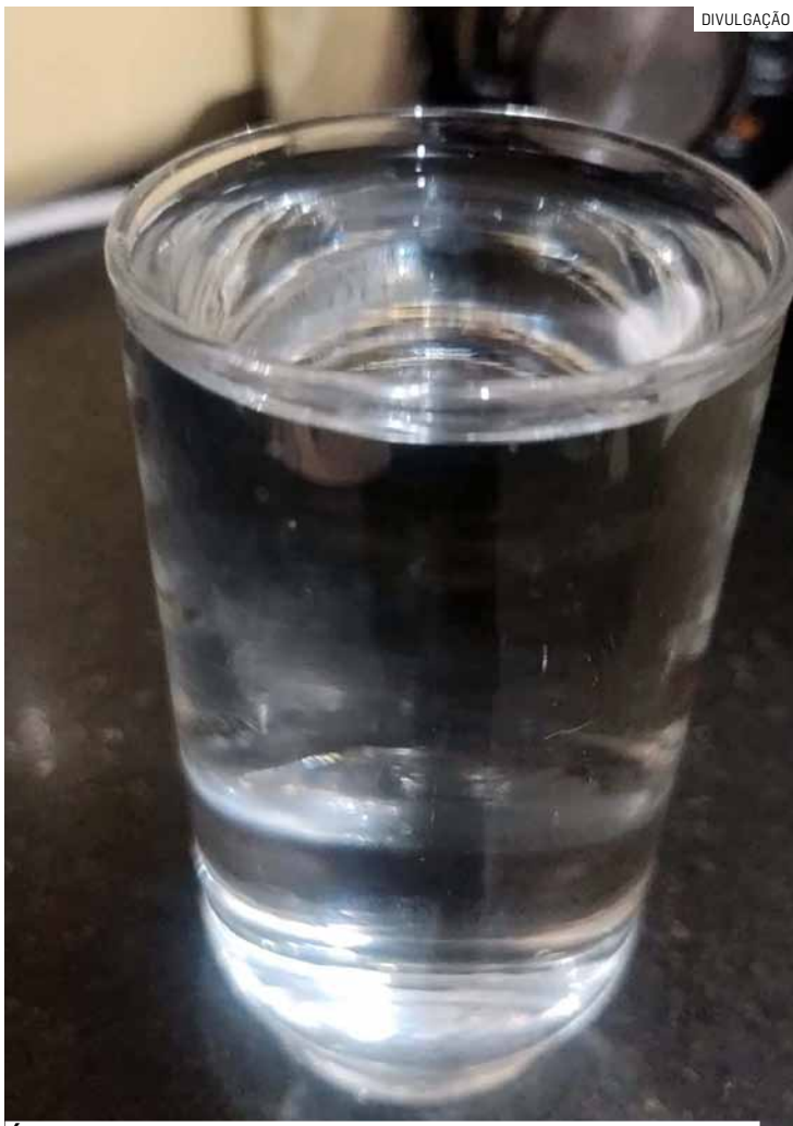
Água sai das torneiras com cheiro ruim, dizem moradores

◆ SUMARÉ [CENTRO | NOVA VENEZA | PICERNO | MARIA ANTONIA | ÁREA CURA | MATÃO] ◆ HORTOLÂNDIA ◆ NOVA ODESSA ◆ MONTE MOR ◆ ELIAS FAUSTO ◆ PAULÍNIA ◆ CAMPINAS ◆ AMERICANA