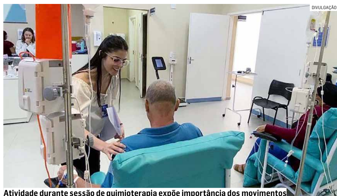
Atividade durante sessão de quimioterapia expõe importância dos movimentos

Durante a atividade, os pacientes participaram de uma dinâmica com exercícios simples, que podem ser realizados tanto durante a sessão de quimioterapia quanto em casa, incluindo técnicas de respiração e movimentos leves.