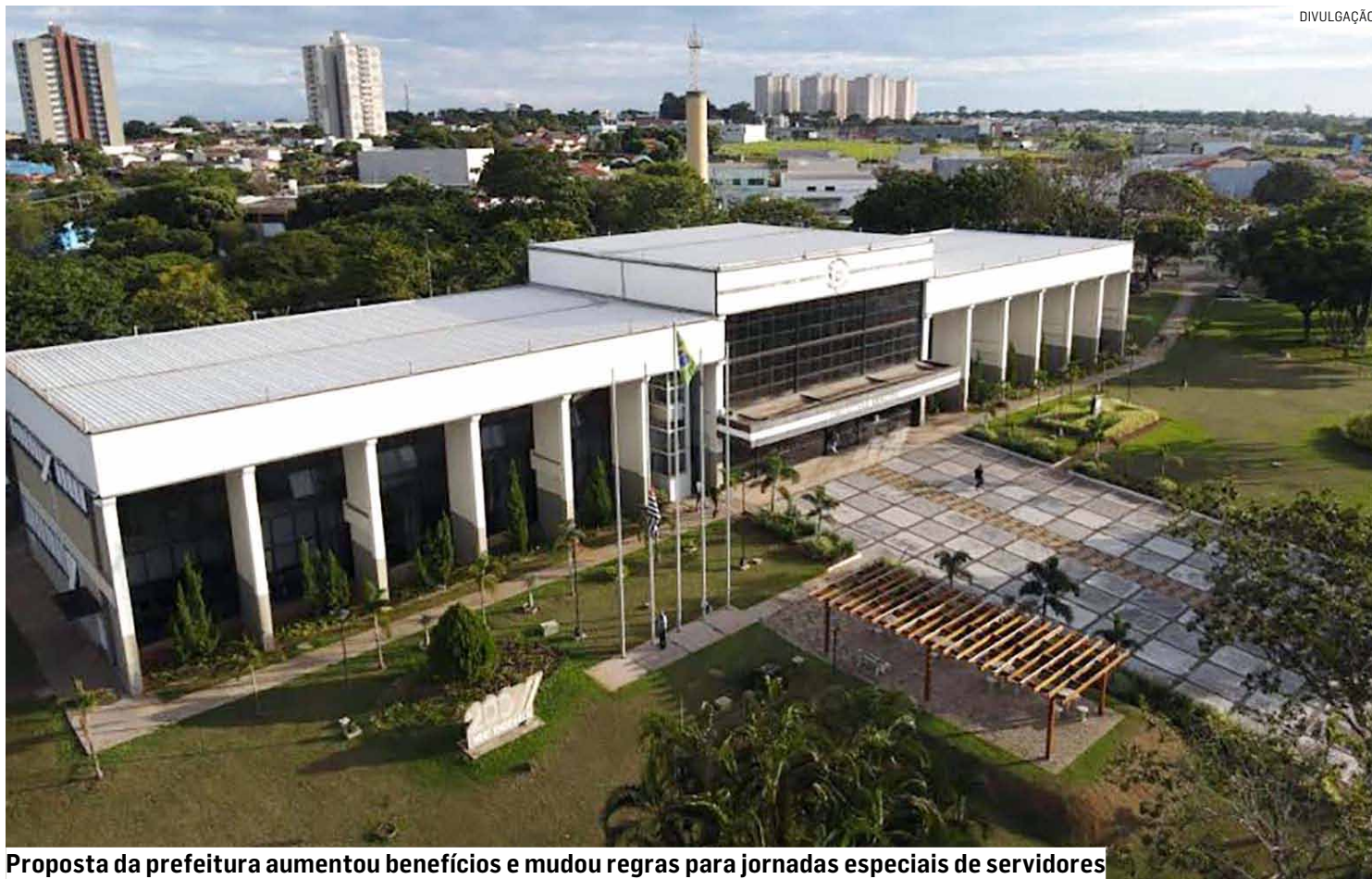
Proposta da prefeitura aumentou benefícios e mudou regras para jornadas especiais de servidores

A cesta básica mensal (cartão de débito para ali-