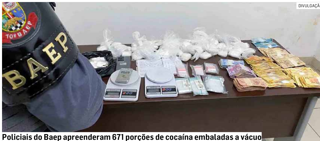
Policiais do Baep apreenderam 671 porções de cocaína embaladas a vácuo

Diante da denúncia, o comando do Baep, com apoio de outras equipes, se deslocou até o endere-