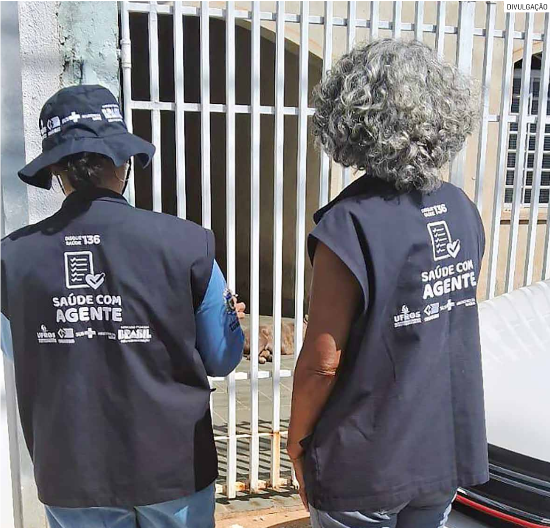
Equipes inspecionam Pontos Estratégicos, locais com maior potencial de acúmulo de água

Cidade registrou nível satisfatório, mas alerta contra doença permanece; regiões como Maria Antonia e Matão tiveram maiores taxas, segundo a prefeitura; ao todo, 6.484 imóveis foram vistoriados e 36 apresentaram larvas do mosquito