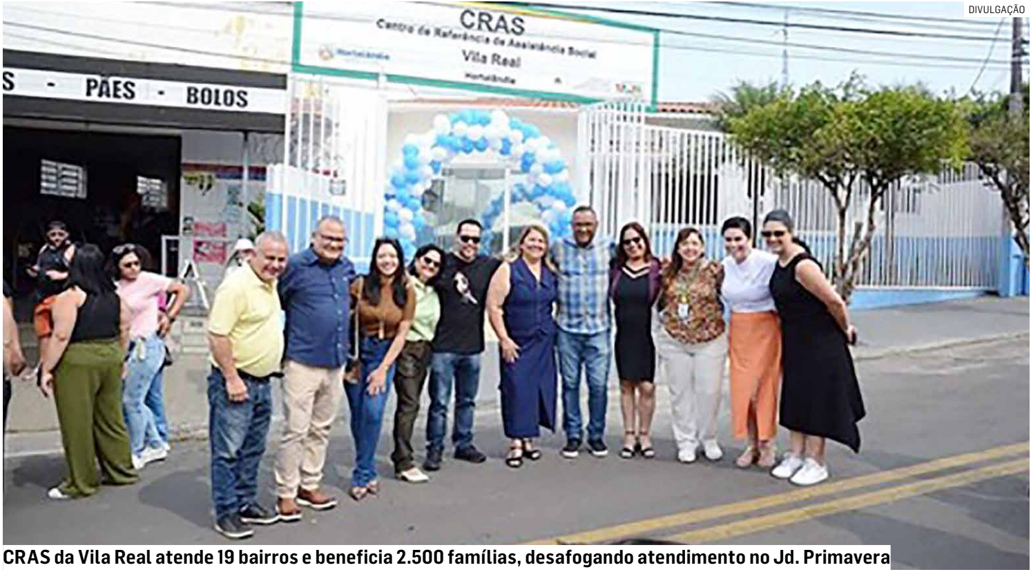
CRAS da Vila Real atende 19 bairros e beneficia 2.500 famílias, desafogando atendimento no Jd. Primavera

Segundo Zezé explicou à Câmara, a criação formal do CRAS Vila Real atende ao crescimento populacional da região e às deman-