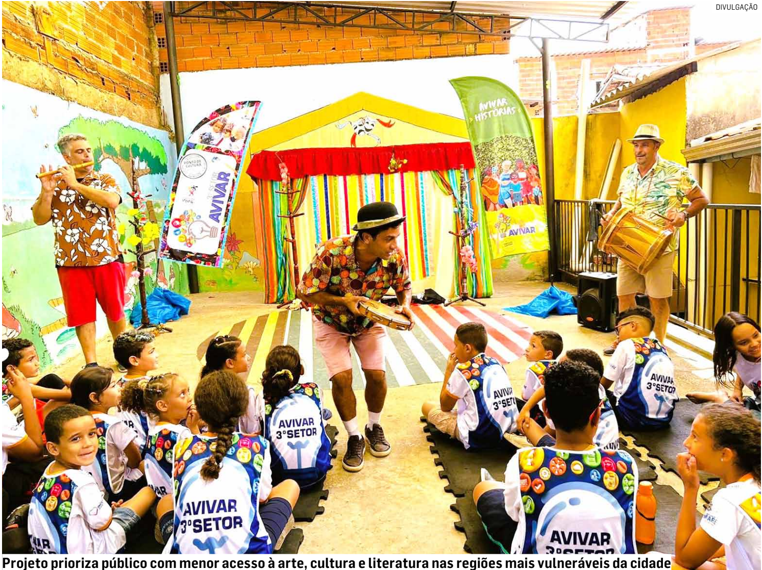
Projeto prioriza público com menor acesso à arte, cultura e literatura nas regiões mais vulneráveis da cidade

A contação de história é baseada na HQ que será distribuída, Pindorama Modernista, cuja autoria é do escritor e dramaturgo paulista Leonar-