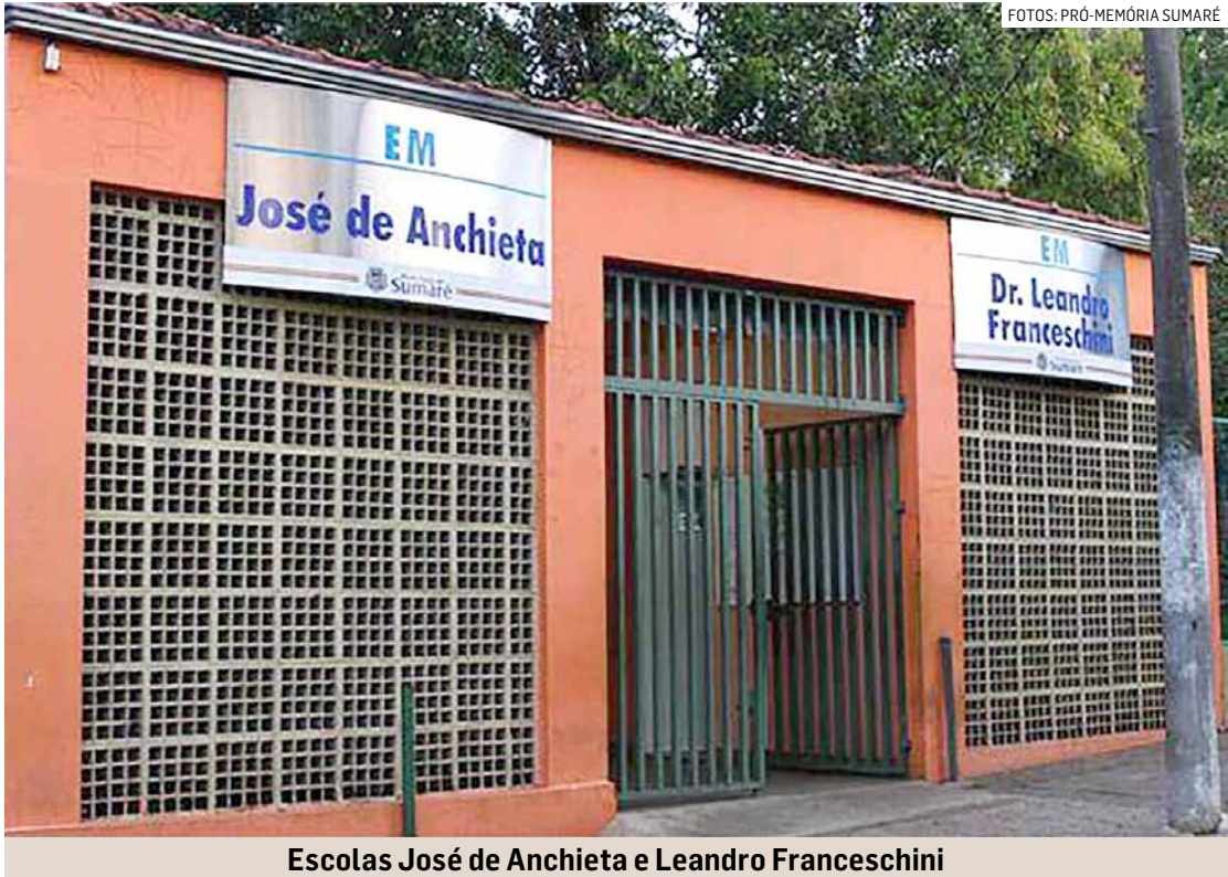
Escolas José de Anchieta e Leandro Franceschini