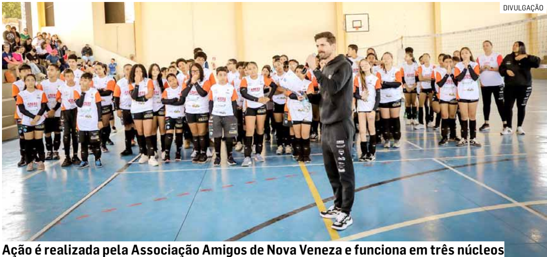
Ação é realizada pela Associação Amigos de Nova Veneza e funciona em três núcleos

As atividades combinavam ensino técnico de voleibol e formação sócio-emocional, com foco em competências como organização, foco e persistência. As rodas de conversa também tiveram papel essencial na rotina, incentivando o diálogo e a convivência saudável entre os jovens.