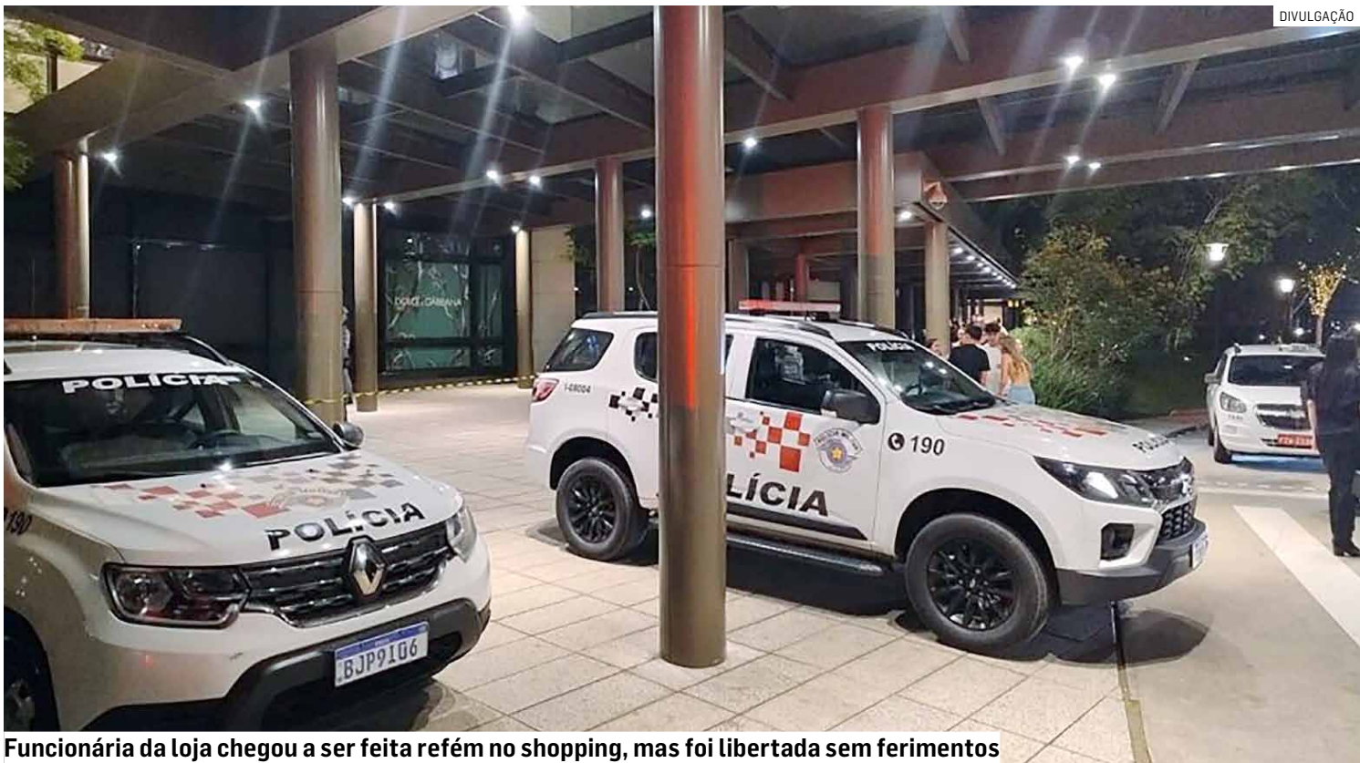
Funcionária da loja chegou a ser feita refém no shopping, mas foi libertada sem ferimentos

Segundo a polícia, o conjunto de peças recuperadas — de marcas como Rolex e Cartier — é estimado em cerca de R$ 1,2 milhão. Grande parte do material, 30 relógios, foi encontrada no estacionamento do próprio shopping logo após o crime. Outros sete estavam dentro de um carro roubado