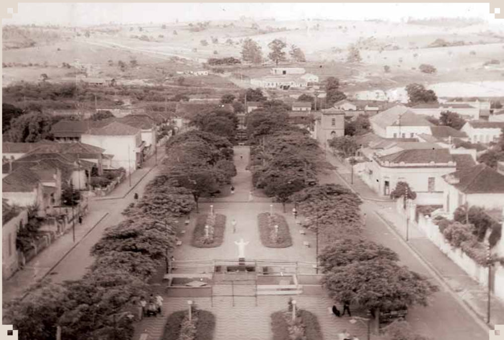
Foto do final da década de 1950 da Praça da República. O registro foi feito do alto da Igreja Matriz de Santana, que ainda não tinha o relógio. O prédio mais alto do lado direito é a antiga sede da Cia. Paulista de Força e Luz. No lado esquerdo, os maiores prédios são do Hotel Máximo Biondo e da Prefeitura Municipal de Sumaré (hoje Centro de Memória). No fundo, no alto, o prédio do antigo Matadouro de Geraldo Moacir Bordon. A estrada de ligação com a Via Anhanguera ainda não era pavimentada.