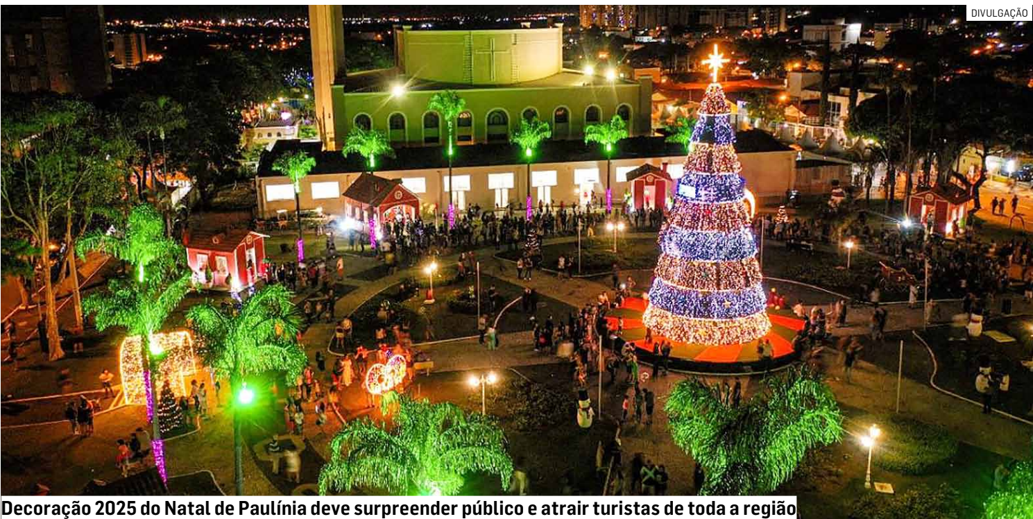
Decoração 2025 do Natal de Paulínia deve surpreender público e atrair turistas de toda a região

Contrato foi firmado pela gestão para implantação de estrutura natalina na cidade, com montagem, manutenção e segurança; cidade tem como meta virar polo regional de eventos; medida movimenta a economia e ajuda empreendedores