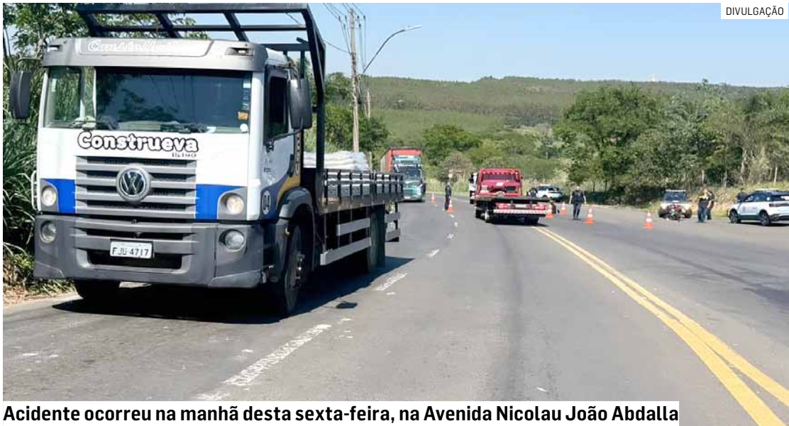
Acidente ocorreu na manhã desta sexta-feira, na Avenida Nicolau João Abdalla

A Guarda Municipal de Americana (Gama) aten-