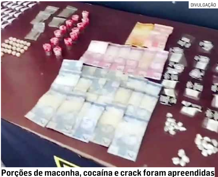
Porções de maconha, cocaína e crack foram apreendidas

Na tarde desta quinta-feira (20), uma equipe do 10º Batalhão de Ações Especiais de Polícia (Baep), com apoio do canil K-9, apreendeu um adolescente de 16 anos por tráfico de drogas. A ação ocorreu por volta das 13h15, na Rua Alecrim, no bairro São Sebastião, em Hortolândia. Durante patrulhamento especializado, os policiais abordaram o menor, que carregava uma sacola plástica contendo diversas porções de entorpecentes. No local, foram encontrados 54 pinos de cocaína, 39 porções de maconha, 15 papелotes de “dry”, 24 pedras de crack e R$ 100 em dinheiro.