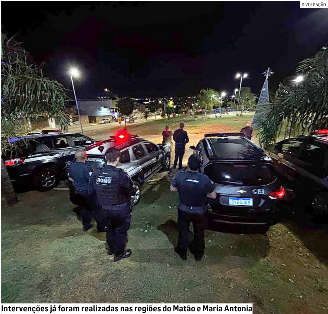
Intervenções já foram realizadas nas regiões do Matão e Maria Antonia