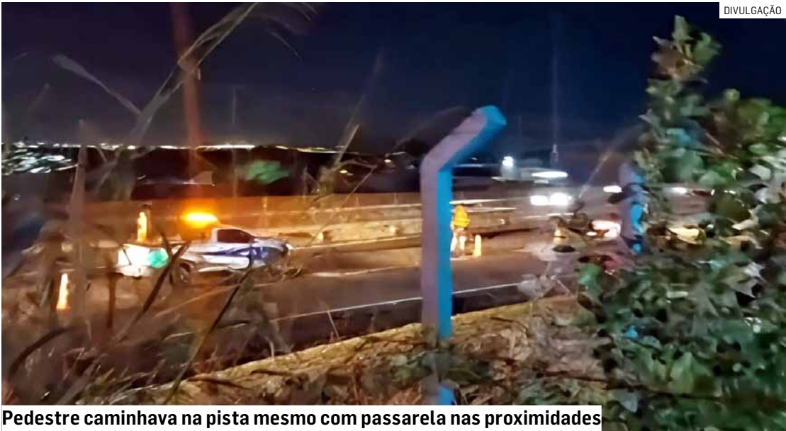
Pedestre caminhava na pista mesmo com passarela nas proximidades

O sentido Oeste da SP-101 permaneceu totalmente interditado até 1h30 para os trabalhos de investigação e limpeza da pista. A identidade da vítima não foi divulgada.