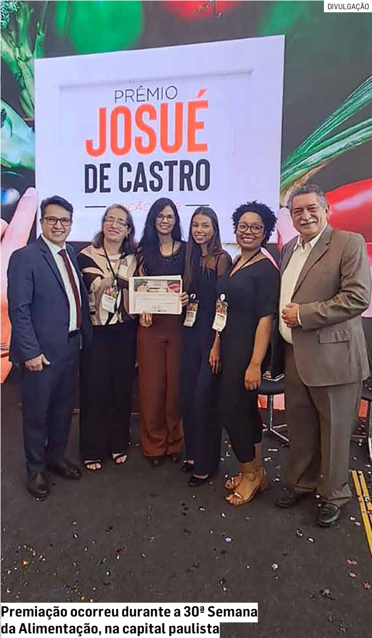
Premiação ocorreu durante a 30ª Semana da Alimentação, na capital paulista

Município foi classificado na edição 2025 do ‘Concurso Prêmio Josué de Castro’ de combate à fome e a desnutrição com projeto ‘CREAN – Política de Alimentação e Nutrição em Hortolândia’; é a melhor colocação do município