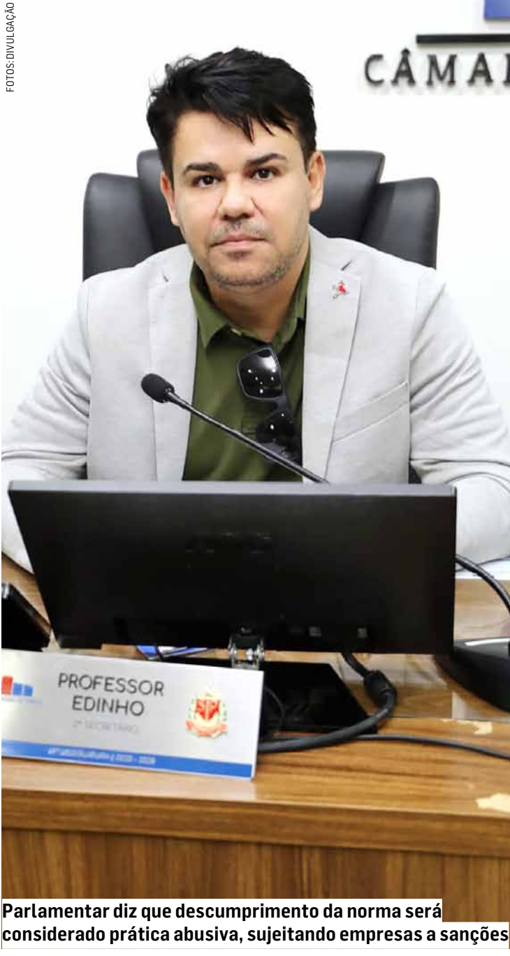
Parlamentar diz que descumprimento da norma será considerado prática abusiva, sujeitando empresas a sanções