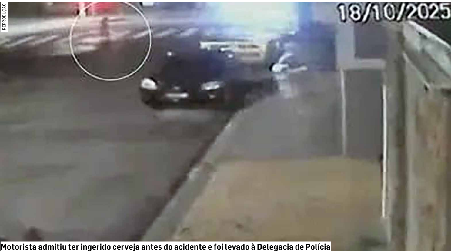
Motorista admitiu ter ingerido cerveja antes do acidente e foi levado à Delegacia de Polícia

Uma neta da idosa contou que estava a cerca de