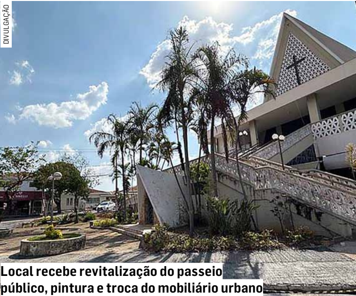
Local recebe revitalização do passeio público, pintura e troca do mobiliário urbano