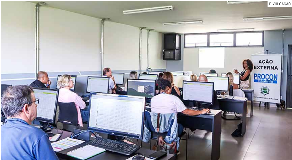
Unidade local de defesa do consumidor implantou sistema criado pela Fundação São Paulo