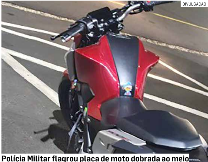
Polícia Militar flagrou placa de moto dobrada ao meio

Diante da irregularidade, os policiais deram sinal de parada ao condutor, que desobedeceu a ordem e tentou fugir. A equipe iniciou o acompanhamento e conse-