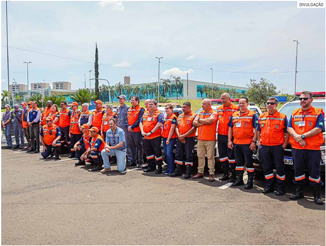
Técnicos das Defesas Cíveis discutiram boas práticas no combate aos 'Riscos Tecnológicos'

Encerrando a programação, os participantes realizaram uma demonstração da Força-Tarefa da Defesa Civil, o que na prática são os processos compreendidos entre a gestão de risco e o gerenciamento de desastre.