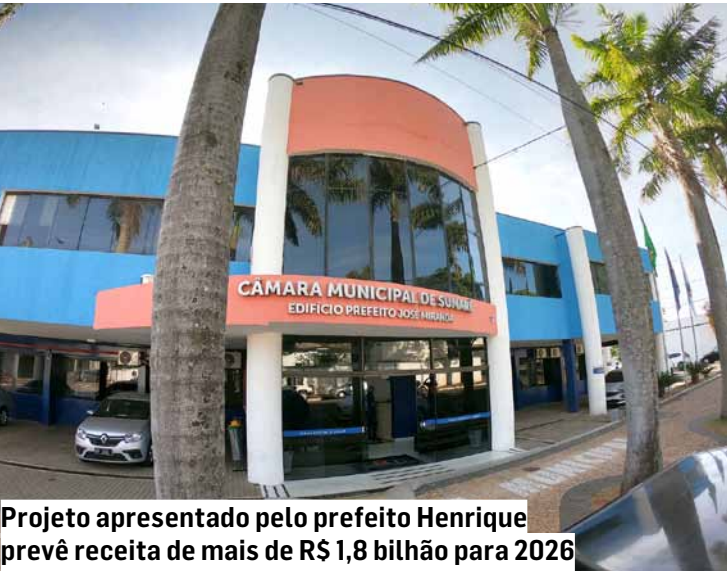
Projeto apresentado pelo prefeito Henrique prevê receita de mais de R$ 1,8 bilhão para 2026