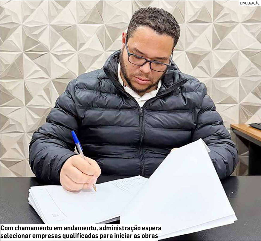
Com chamamento em andamento, administração espera selecionar empresas qualificadas para iniciar as obras

As moradias deverão ter aproximadamente 42 metros quadrados, com padrões mínimos de conforto, acessibilidade e funcionalidade, contemplando sala, cozinha, banheiro, dois dormitórios e vaga de garagem. A previsão é de que as obras tenham início no primeiro semestre de 2026, logo após a conclusão das etapas de seleção e habilitação das empresas concorrentes.