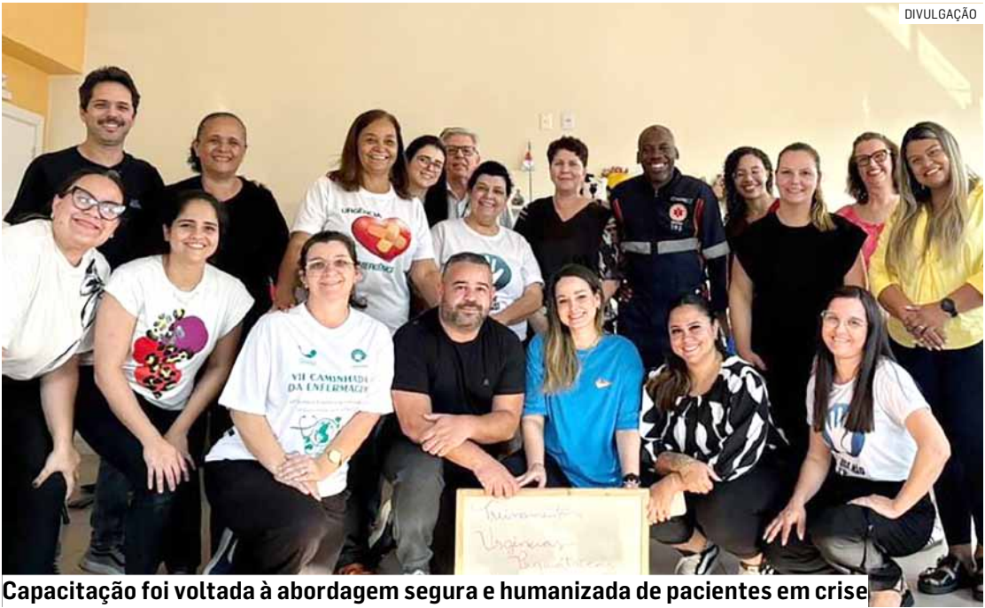
Capacitação foi voltada à abordagem segura e humanizada de pacientes em crise

Desde o início do ano, o Samu tem promovido uma série de ações conjuntas para integrar cada vez mais a rede de atenção à saúde, transformando os treinamentos em uma prática contínua. “O compromisso do Samu Sumaré é qualificar constantemente suas equipes e promover uma assistência cada vez mais humanizada no atendimento da população”, disse a administração.