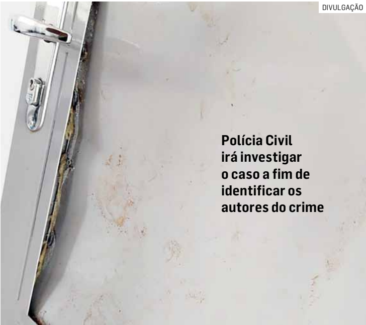
Polícia Civil irá investigar o caso a fim de identificar os autores do crime