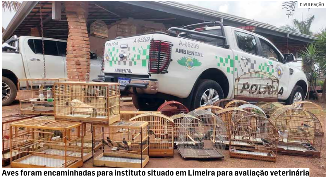
Aves foram encaminhadas para instituto situado em Limeira para avaliação veterinária

De acordo com a corporação, o detentor das aves não possuía cadastro ativo como criador amadorista, o que caracteriza infração