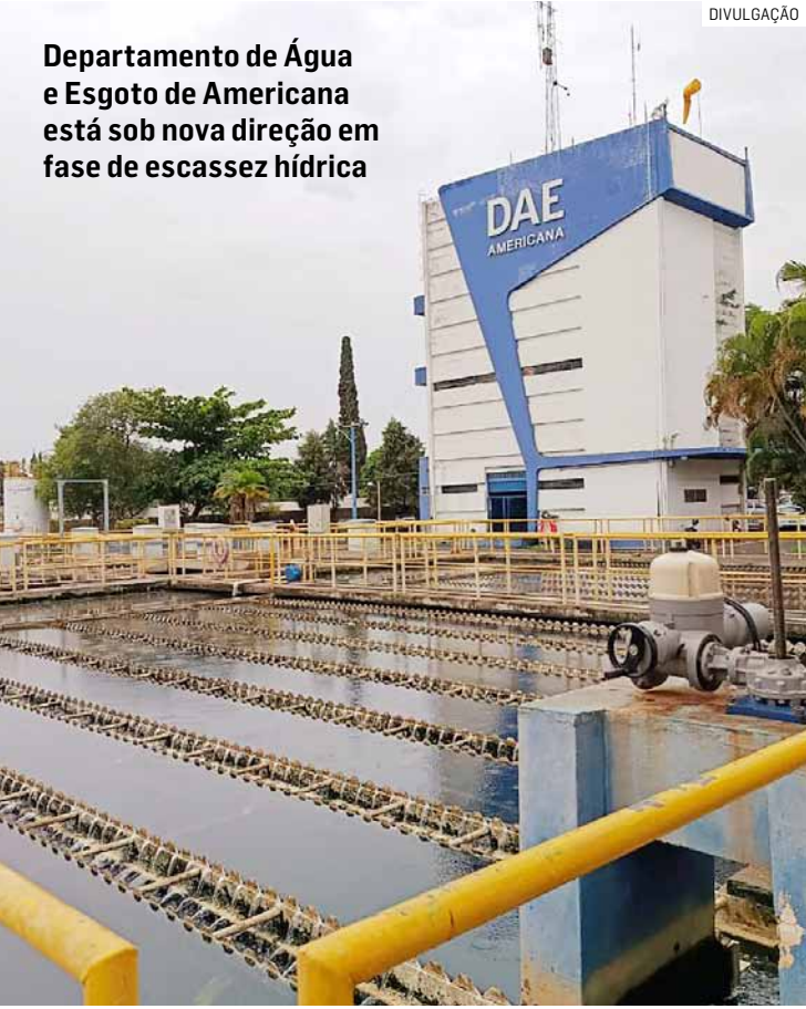
Departamento de Água e Esgoto de Americana está sob nova direção em fase de escassez hídrica