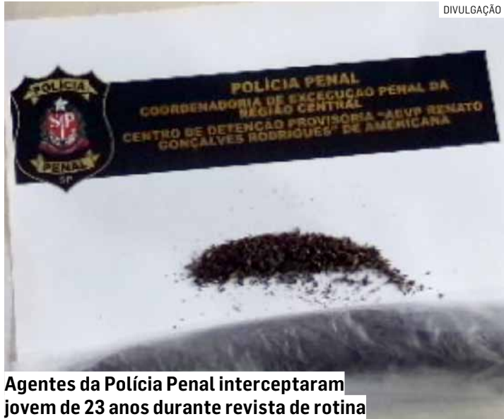
Agentes da Polícia Penal interceptaram jovem de 23 anos durante revista de rotina

A suspeita apresentava comportamento nervoso durante a entrada para a visita social e acabou sendo submetida a uma revista mais detalhada pelos policiais penais. Durante a inspeção, foram encontradas 16 gramas de maconha escondidas nas roupas da visitante.