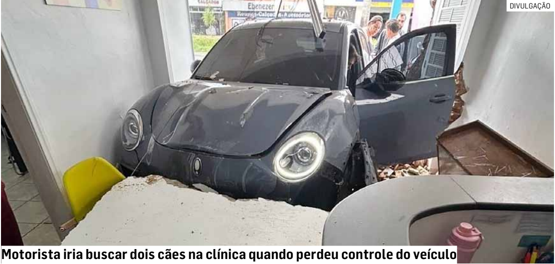
Motorista iria buscar dois cães na clínica quando perdeu controle do veículo

Após o ocorrido, a clínica informou que a unidade atingida sofreu danos estruturais, mas que os atendimentos seguem normalmente nas outras duas unidades da rede em Americana.