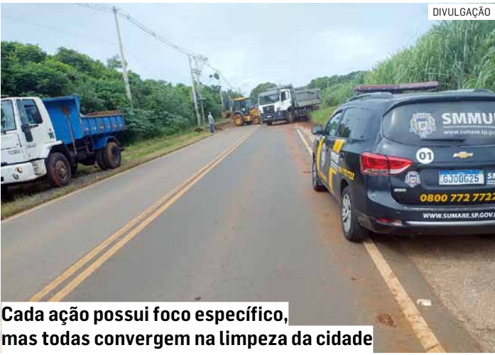
Cada ação possui foco específico, mas todas convergem na limpeza da cidade

O programa atua ainda no combate a pontos viados de lixo, retirada de entulho e descarte irregular, limpeza das regionais, realização do cata-treco, manutenção dos ecopontos e na organização urbana como um todo.