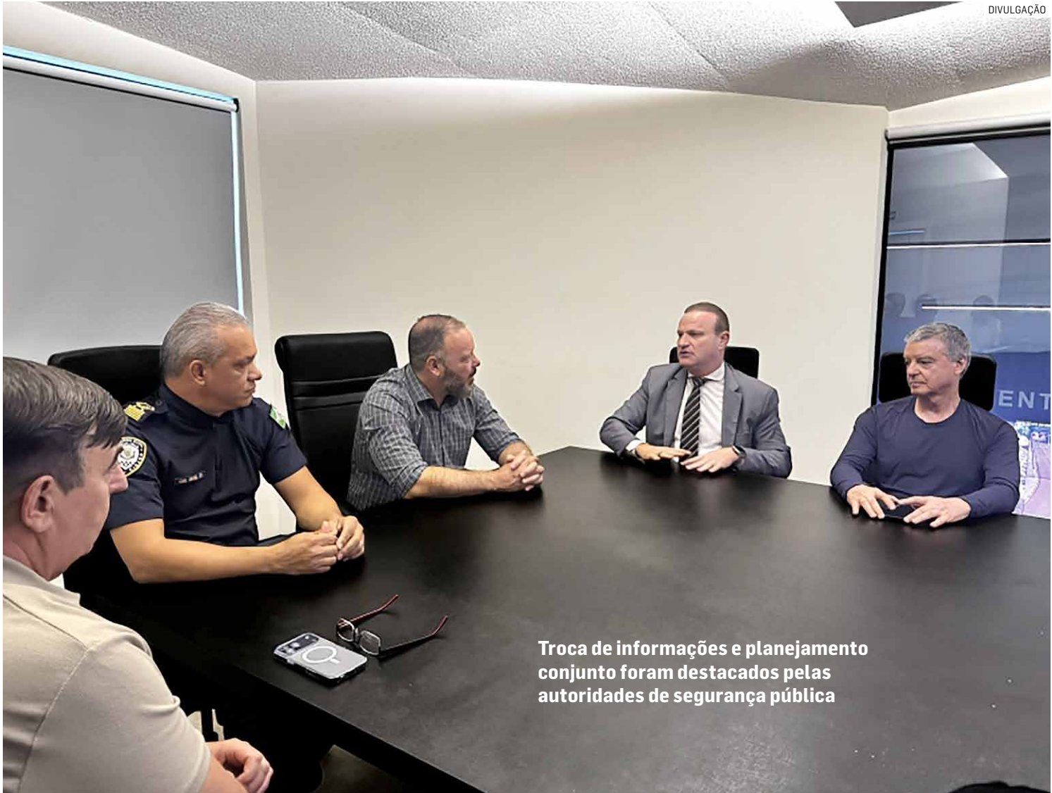
Troca de informações e planejamento conjunto foram destacados pelas autoridades de segurança pública

Como integrante do programa, Paulínia disponibiliza às forças policiais da região seu sistema inteligente de monitoramento, que inclui câmeras com reconhecimento facial. A tecnologia amplia a capacidade de atuação da gestão pública, permitindo ações mais precisas, rápidas e efi-