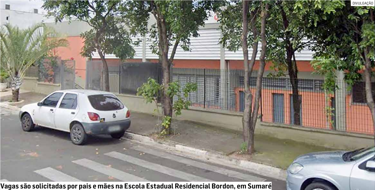
Vagas são solicitadas por pais e mães na Escola Estadual Residencial Bordon, em Sumaré

Pais realizaram manifestação nesta terça-feira (20), em frente à Diretoria de Ensino, rechaçando envio de alunos para escolas fora do bairro; moradores relatam dificuldade de transporte escolar e querem solução imediata da Secretaria de Estado, que fala em ‘geolocalização’ Pais e responsáveis por alunos do Portal Bordon, região do Picerno, em Sumaré, realizaram nesta terça-feira (20) um protesto na Diretoria de Ensino. O ato questiona a transferência de crianças para escolas consideradas distantes da residência das famílias. Segundo os manifestantes, alunos foram encaminhados às escolas Jardim das Orquídeas e Professora Bélgica Alleoni Borges, mesmo havendo a EE Residencial Bordon no bairro. As famílias pedem a revisão das matrículas e a garantia de vagas na escola mais próxima de casa. PÁGINA 03