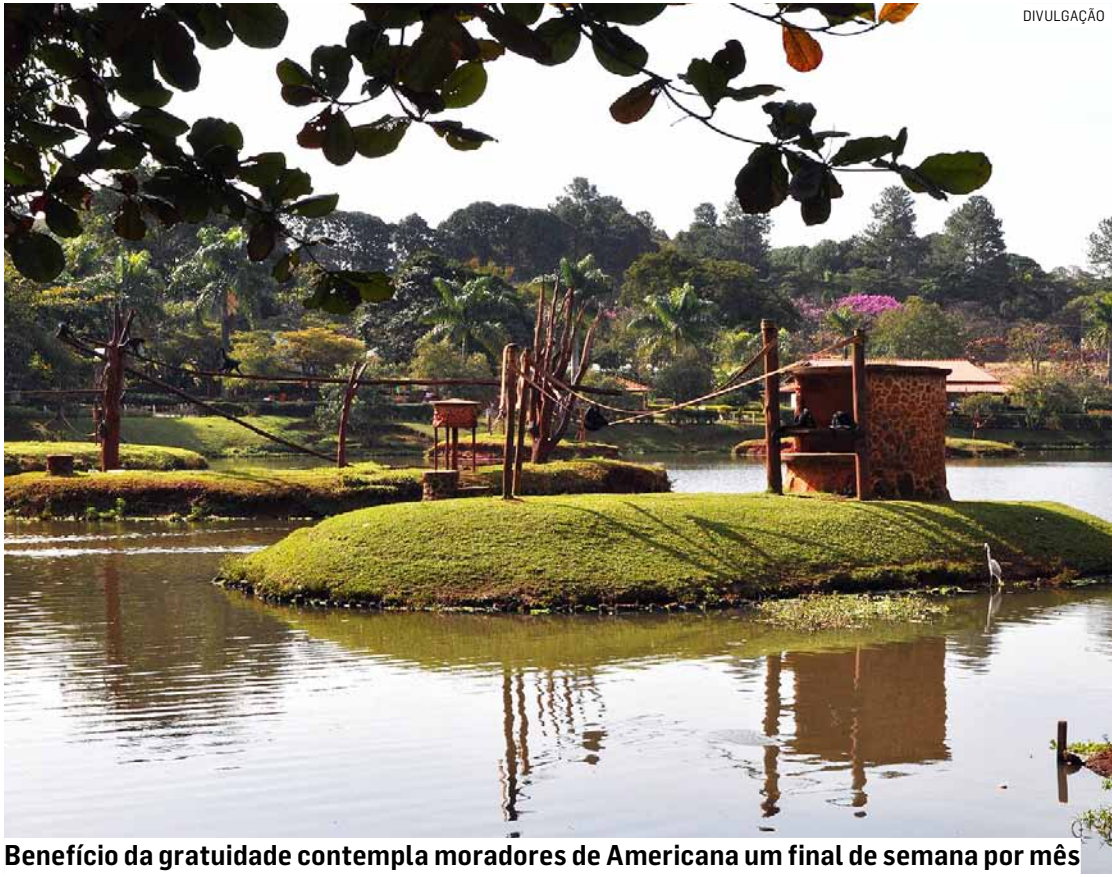
Benefício da gratuidade contempla moradores de Americana um final de semana por mês

Alunos, professores e monitores das redes municipais e estaduais de ensino público, com sede em Americana, também são