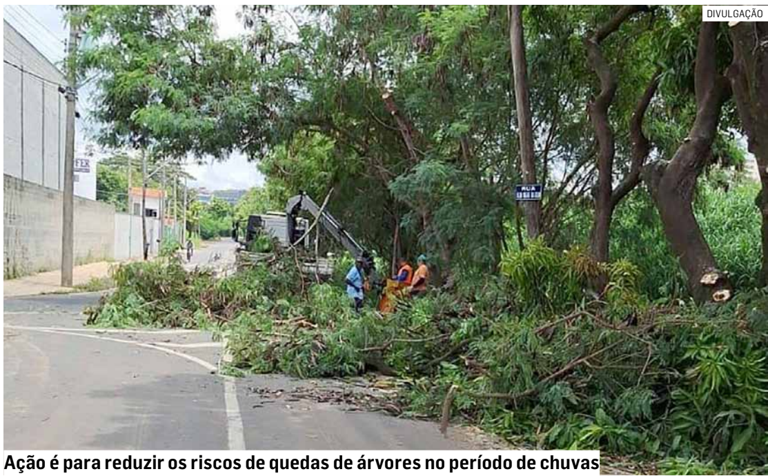
Ação é para reduzir os riscos de quedas de árvores no período de chuvas

O programa de poda preventiva continuará avançando em outras ruas do Jardim São Jorge e em diferentes regiões da cidade, como parte das ações permanentes de cuidado ambiental, segurança e manutenção urbana.