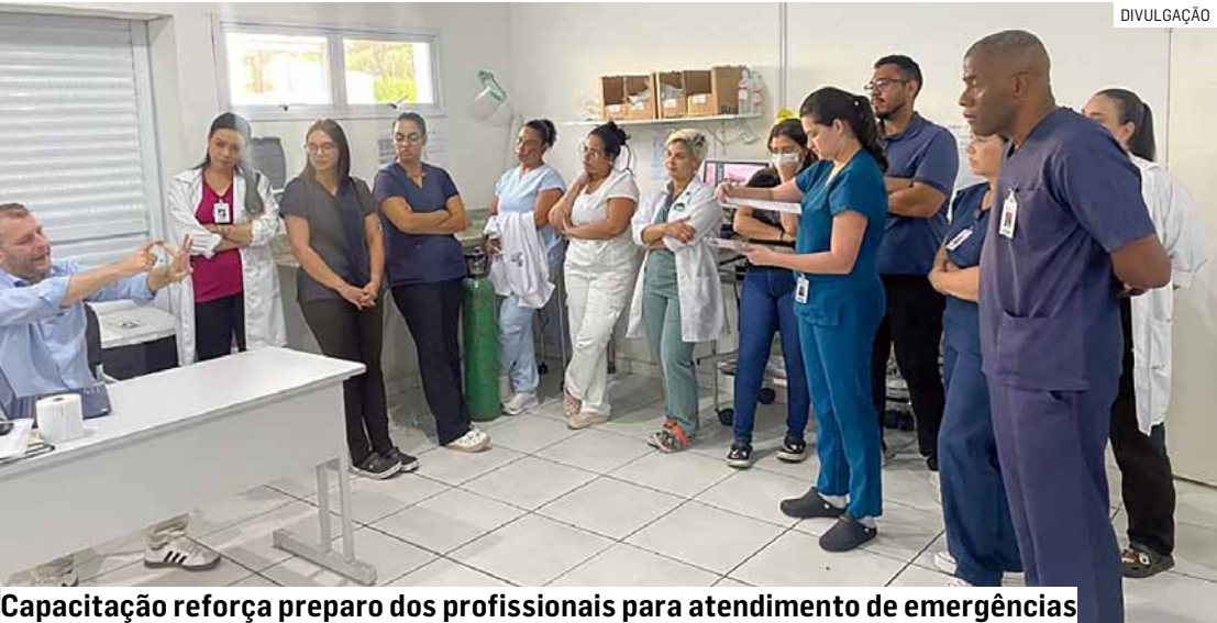
Capacitação reforça preparo dos profissionais para atendimento de emergências

qualificação contínua dos profissionais dos serviços de saúde no município, garantindo mais segurança, agilidade e eficiência no atendimento à população. Com o treinamento, os profissionais da UPA reforçam a preparação técnica para atuação rápida e adequada em casos críticos.