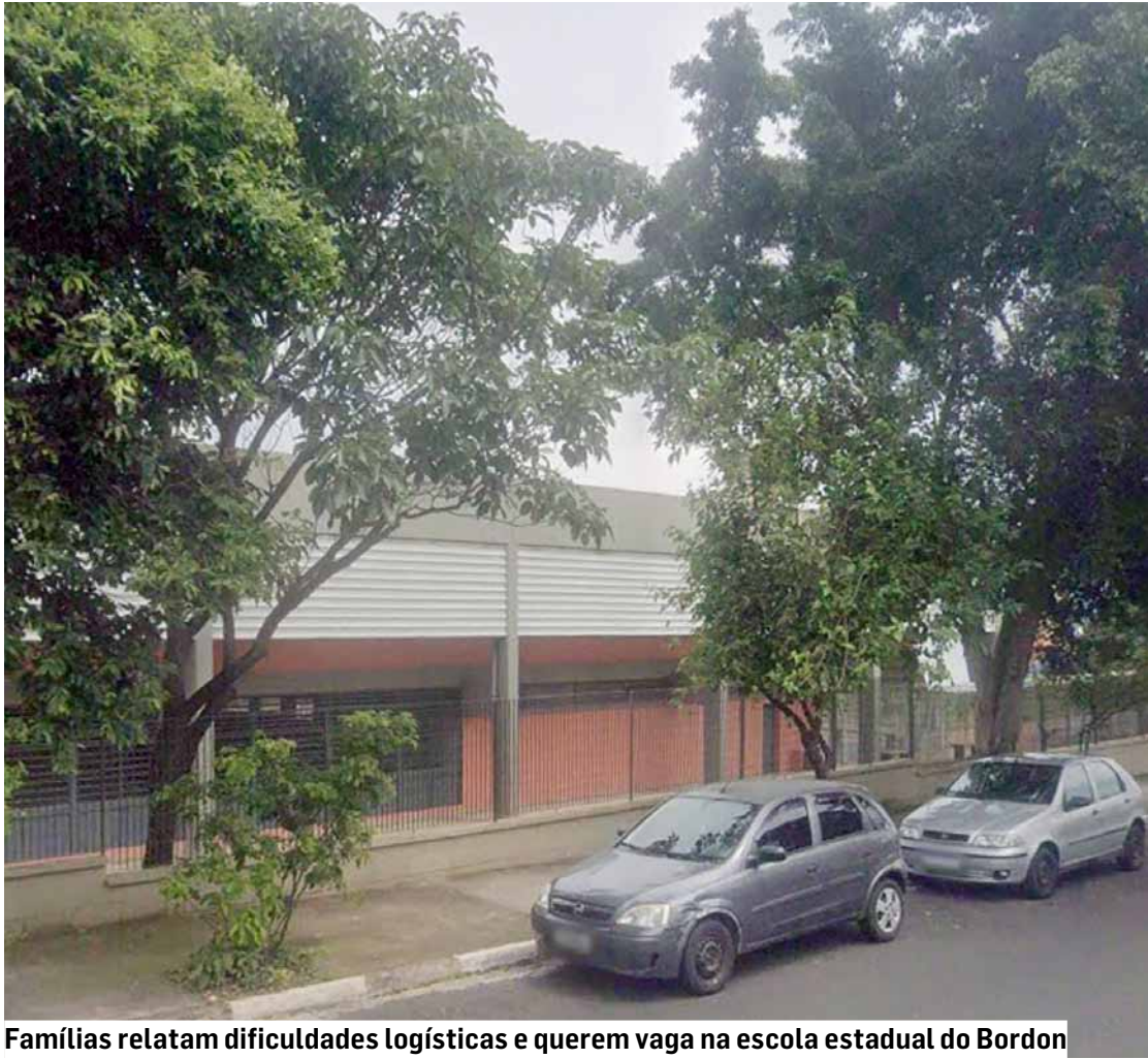
Famílias relatam dificuldades logísticas e querem vaga na escola estadual do Bordon