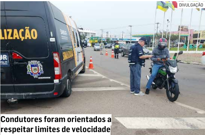
Condutores foram orientados a respeitar limites de velocidade