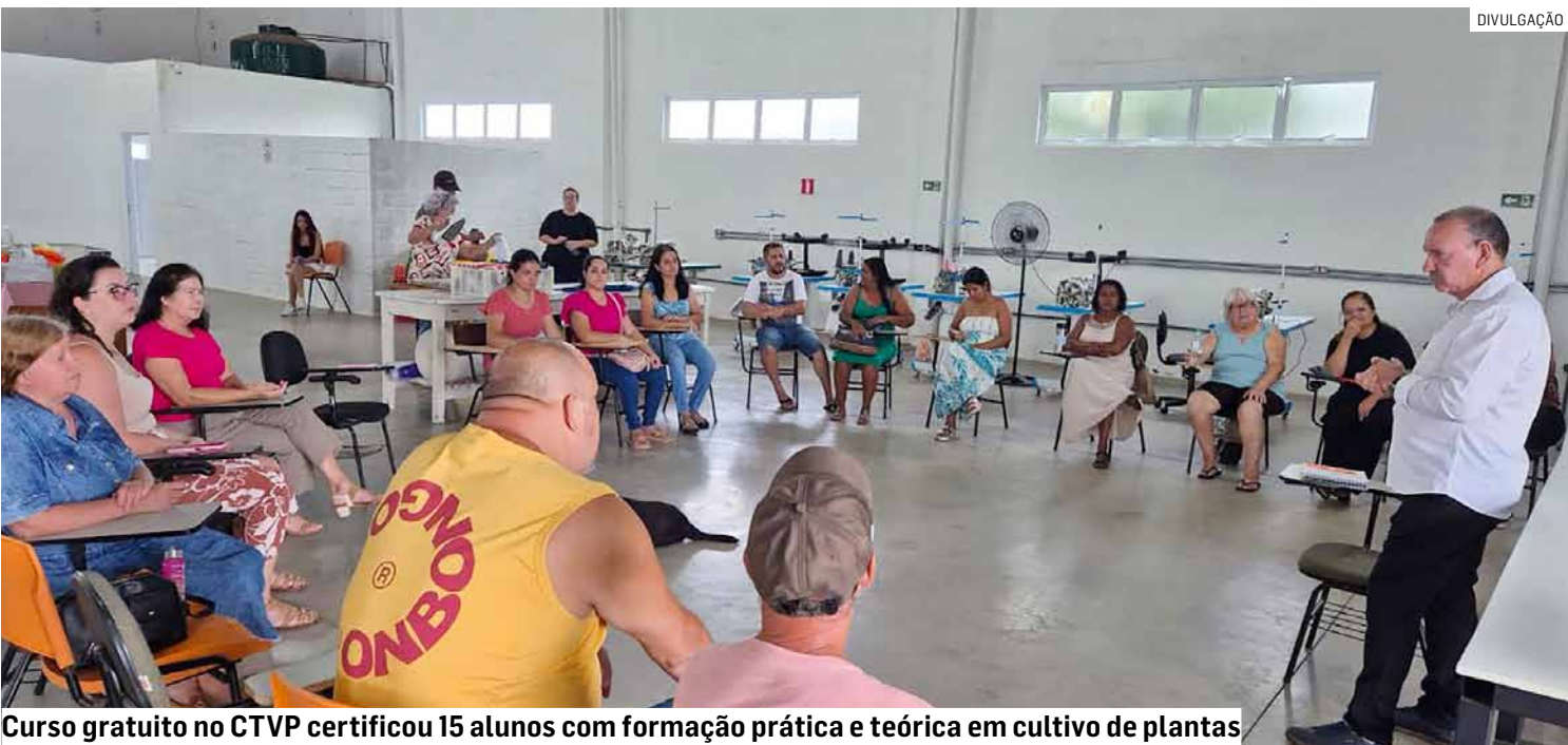
Curso gratuito no CTVP certificou 15 alunos com formação prática e teórica em cultivo de plantas

Da Redação • NOVA ODESSA tribunaliberal@tribunaliberal.com.br