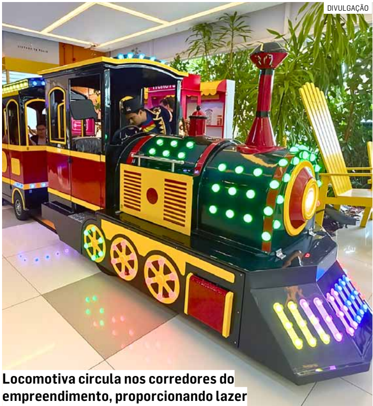
Locomotiva circula nos corredores do empreendimento, proporcionando lazer