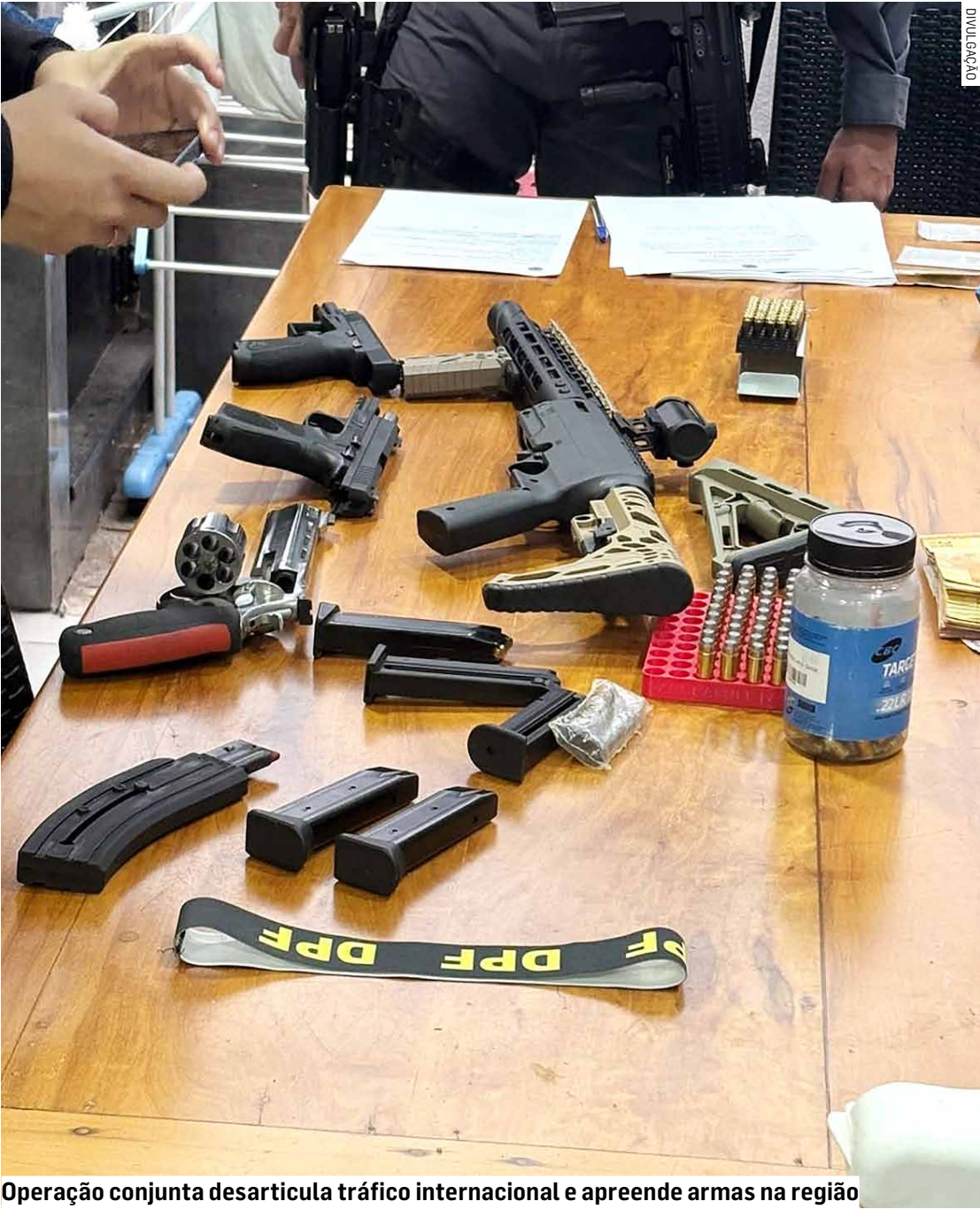
Operação conjunta desarticula tráfico internacional e apreende armas na região

Ação integrada das polícias Federal e Militar aconteceu nesta terça-feira (20) e diligências ocorreram em Americana, Piracicaba, Limeira e Santa Bárbara d'Oeste; suspeito morreu em confronto em meio ao cumprimento de mandado