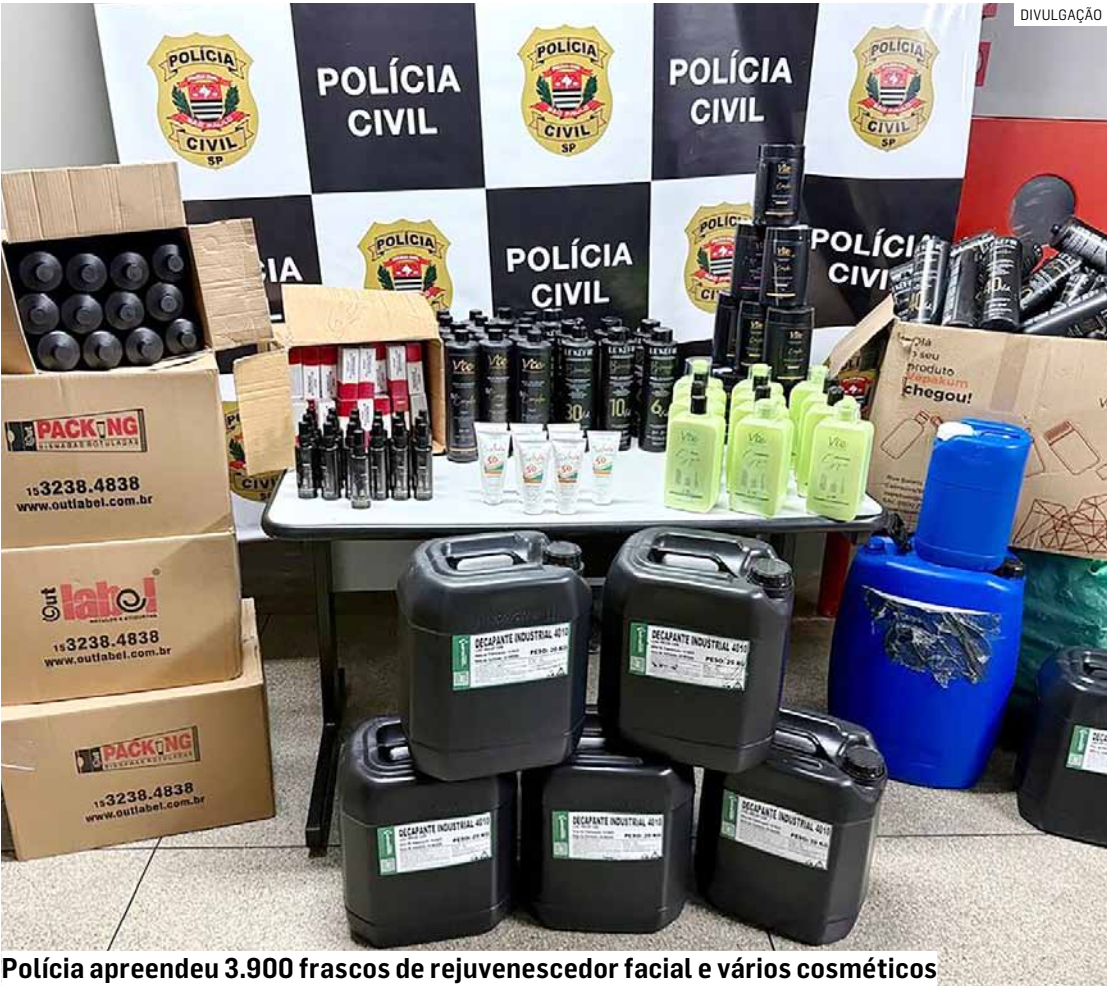
Polícia apreendeu 3.900 frascos de rejuvenescedor facial e vários cosméticos