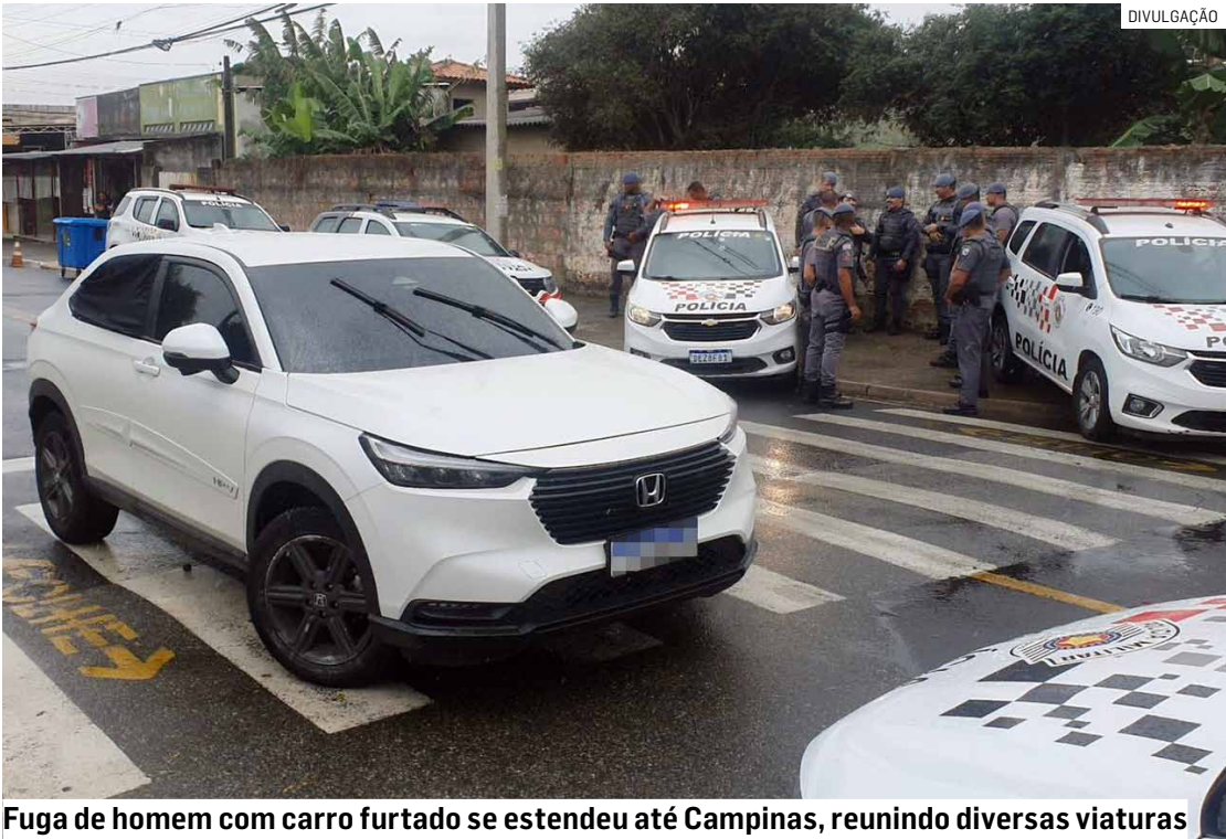
Fuga de homem com carro furtado se estendeu até Campinas, reunindo diversas viaturas

O suspeito foi encaminhado ao 2º Distrito Policial de Hortolândia, onde a ocorrência foi registrada. Ele permaneceu à disposição da Justiça.