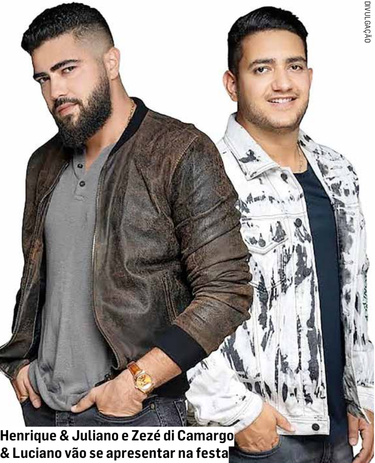
Henrique & Juliano e Zezé di Camargo & Luciano vão se apresentar na festa

Inaugurado em 2021, o Sleep Inn Paulínia está localizado em uma das cinco entradas da cidade, próximo à prefeitura, ao Theatro Municipal e ao Sambódromo. O hotel pode ser facilmente acessado pelas Rodovias Anhan-