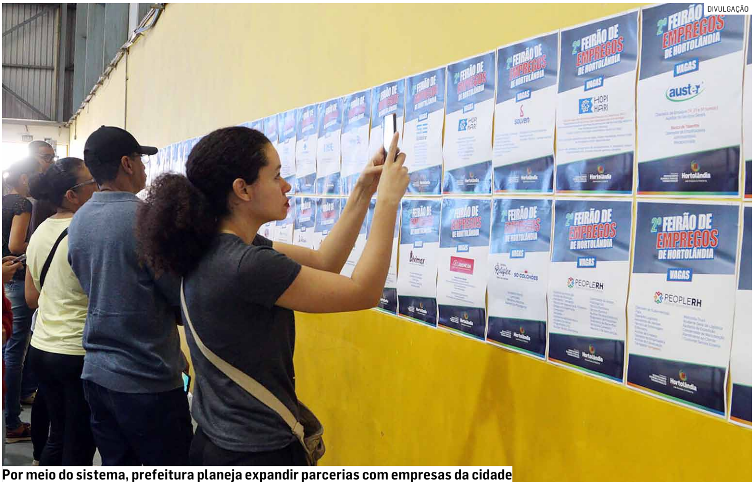
Por meio do sistema, prefeitura planeja expandir parcerias com empresas da cidade

A adesão ao SINE traz benefícios para a população, que passa a ter acesso local