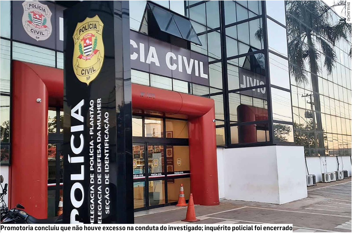
Promotoria concluiu que não houve excesso na conduta do investigado; inquérito policial foi encerrado