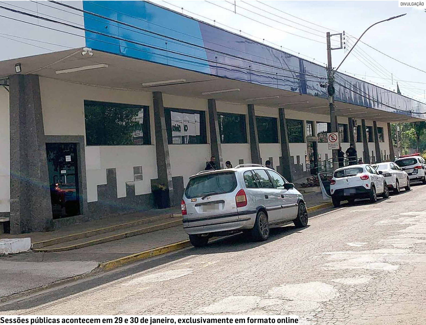
Sessões públicas acontecem em 29 e 30 de janeiro, exclusivamente em formato online

Segundo a publicação oficial, veículos conservados destinados à circulação serão leiloados no dia 29 de janeiro; já os lotes classificados como sucatas aproveitáveis e sucatas aproveitáveis com motor inservível terão sessão pública no dia 30