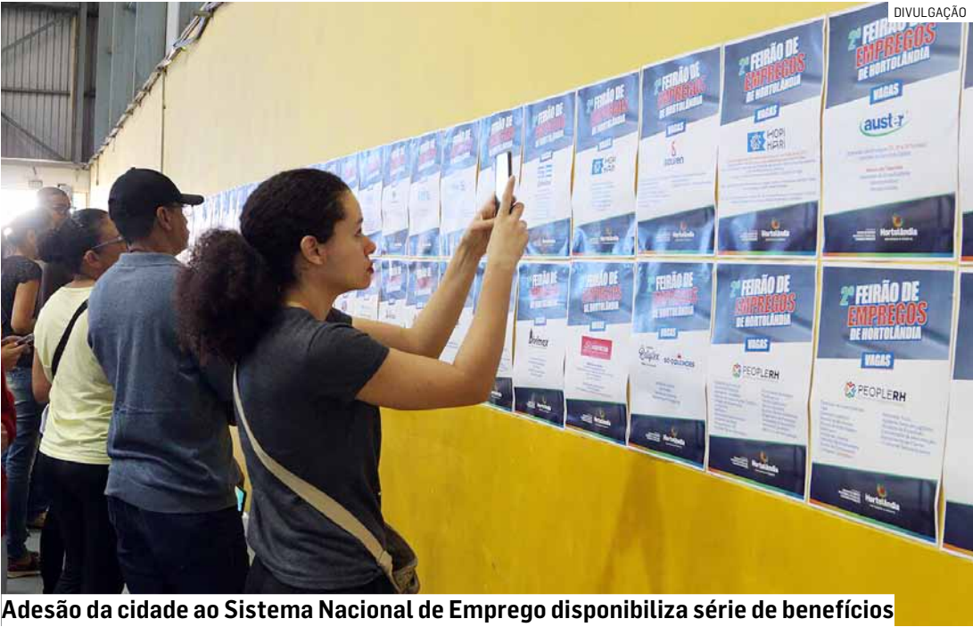
Adesão da cidade ao Sistema Nacional de Emprego disponibiliza série de benefícios

A medida fortalece as políticas públicas de emprego e renda e integra a cidade às ações federais voltadas ao mercado de trabalho. PÁGINA 08