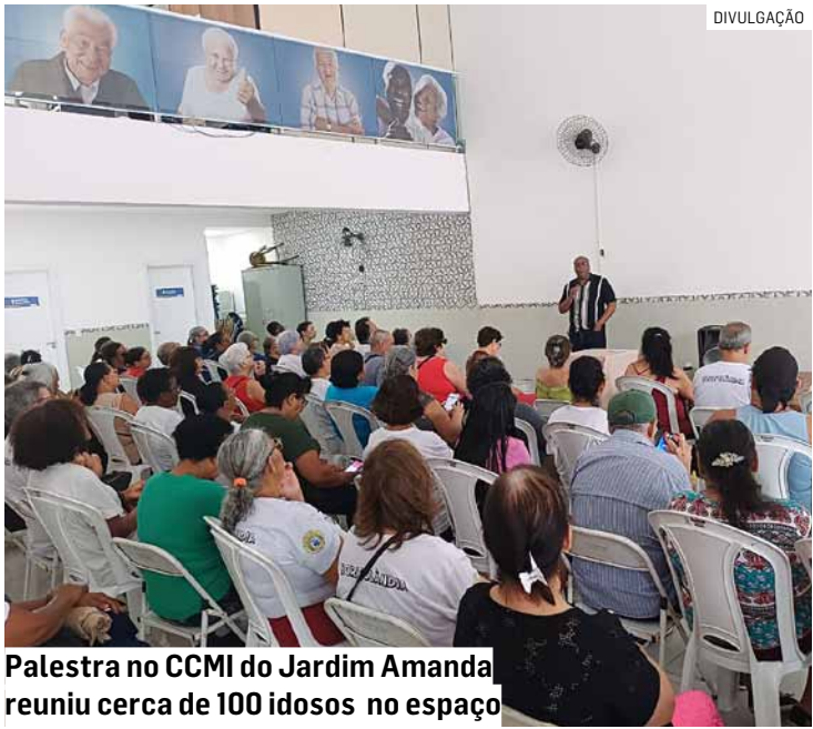
Palestra no CCMi do Jardim Amanda reuniu cerca de 100 idosos no espaço

No CRAS (Centro de Referência de Assistência Social) do Jardim Brasil, uma roda de conversa com servidores do Departamento de Direitos Humanos e Políticas Públicas da Administração Municipal alertou sobre a necessidade de um olhar cuidadoso para combater o racismo. Cerca de 40 pessoas estiveram presentes.