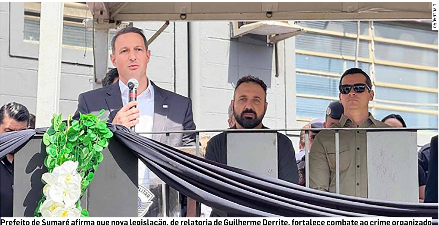
Prefeito de Sumaré afirma que nova legislação, de relatoria de Guilherme Derrite, fortalece combate ao crime organizado