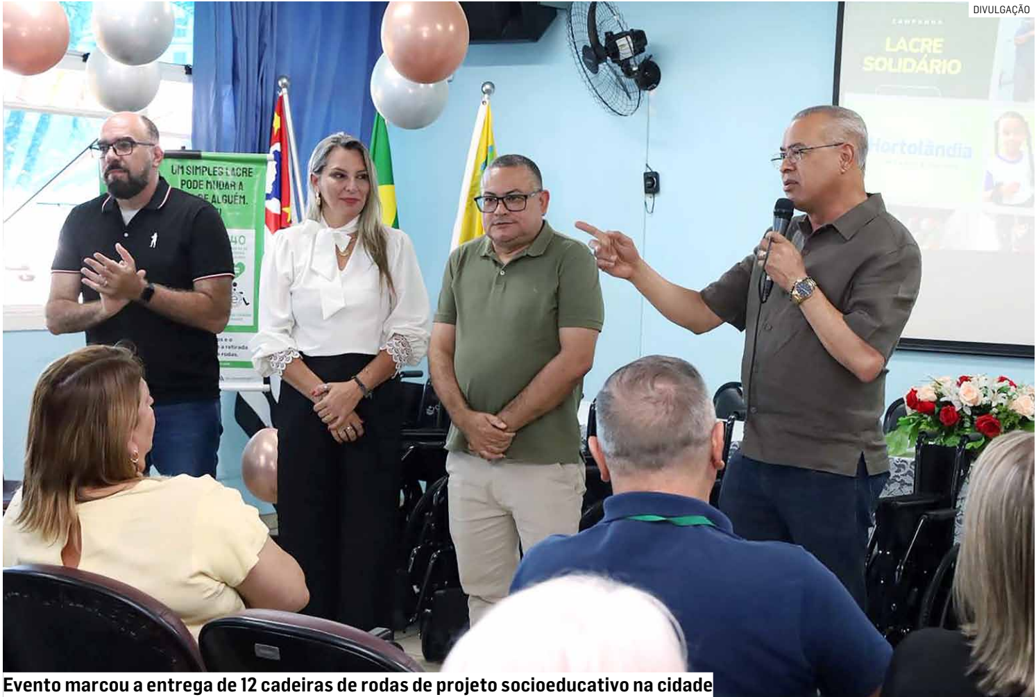
Evento marcou a entrega de 12 cadeiras de rodas de projeto socioeducativo na cidade