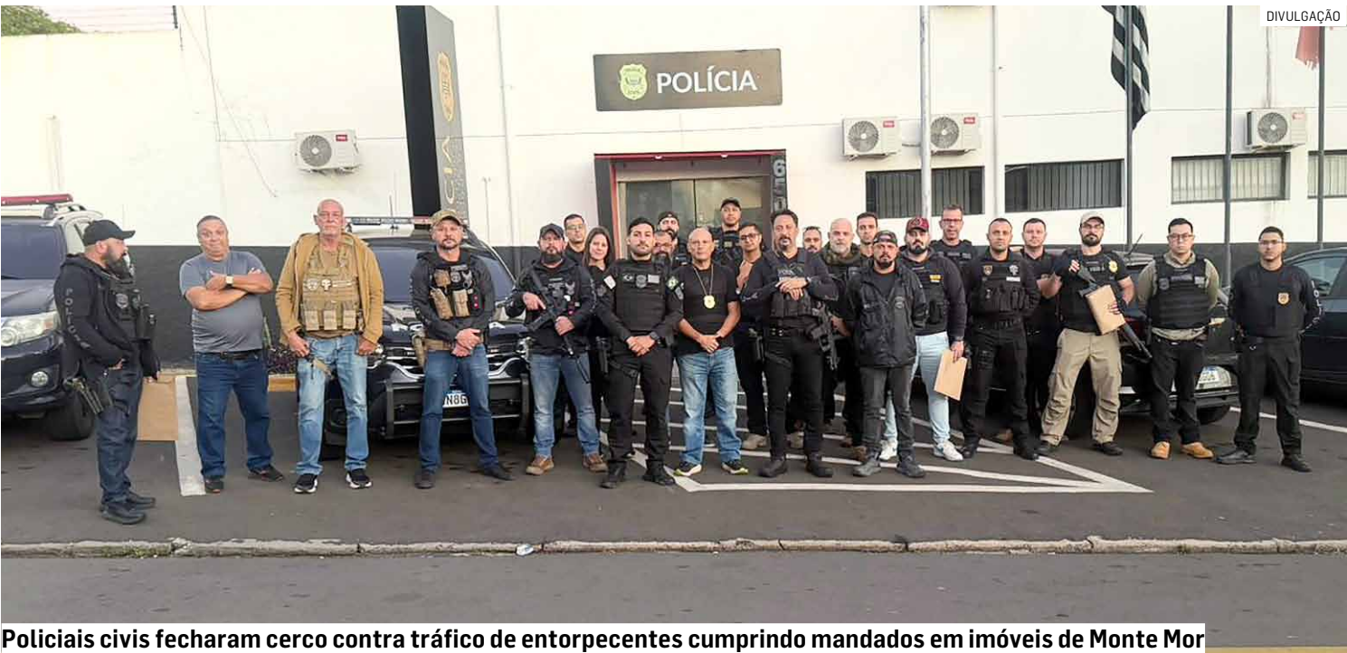
Policiais civis fecharam cerco contra tráfico de entorpecentes cumprindo mandados em imóveis de Monte Mor

Terceira fase da Operação Arranha-Céu deflagrada por policiais civis desmantelou organização criminosa que atuava no tráfico de drogas na região central da cidade; mais de 30 buscas domiciliares foram realizadas por cerca de 40 agentes e 20 viaturas