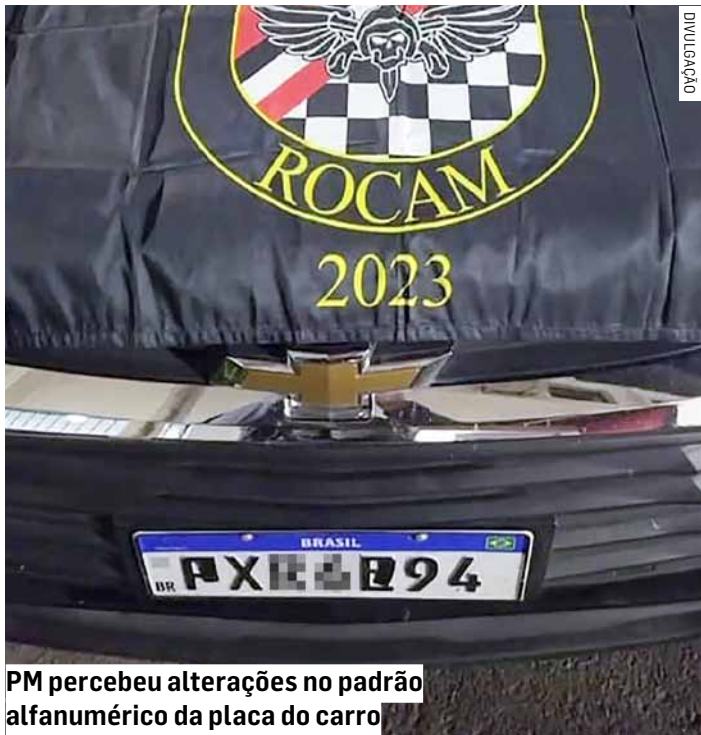
PM percebeu alterações no padrão alfanumérico da placa do carro

Após análise preliminar, foi lavrado o flagrante pelo crime de adulteração de sinal identificador de veículo automotor. O motorista permaneceu preso.