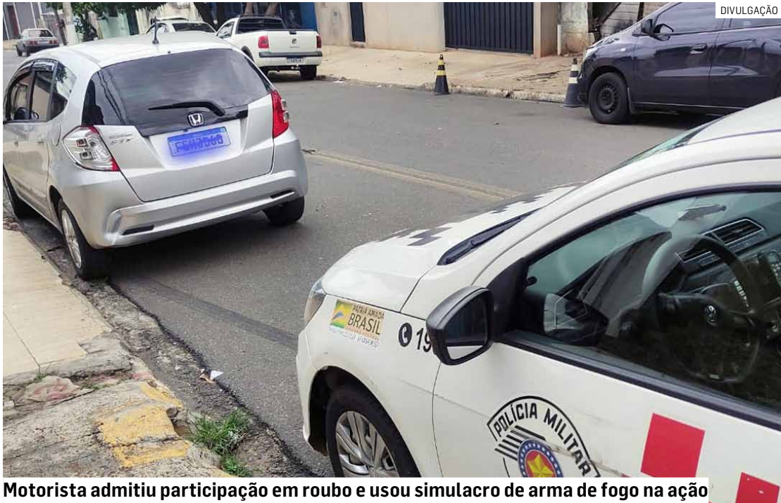
Motorista admitiu participação em roubo e usou simulacro de arma de fogo na ação

Nada de ilícito foi encontrado com os ocupantes, porém quatro porções de maconha foram localizadas no interior do veículo.