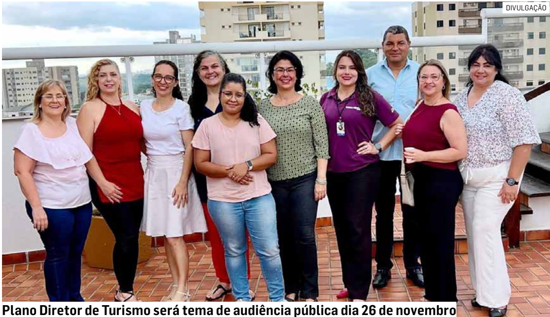
Plano Diretor de Turismo será tema de audiência pública dia 26 de novembro

O Plano Diretor de Turismo é o instrumento de gestão que guiará as ações da pasta nos próximos anos. Sua revisão e sub-