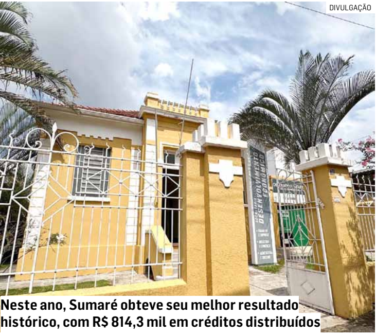
Neste ano, Sumaré obteve seu melhor resultado histórico, com R$ 814,3 mil em créditos distribuídos