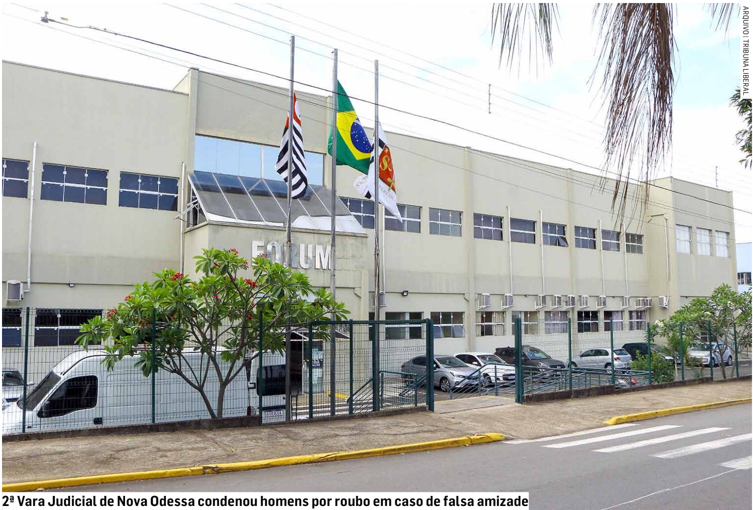
2ª Vara Judicial de Nova Odessa condenou homens por roubo em caso de falsa amizade

No dia do roubo, o réu teria insistido várias vezes por telefone para voltar à residência, dessa vez acompanhado de um “tio”. A insistência chamou atenção, mas a vítima acabou aceitando a visita, acreditando se tratar de um encontro amistoso.