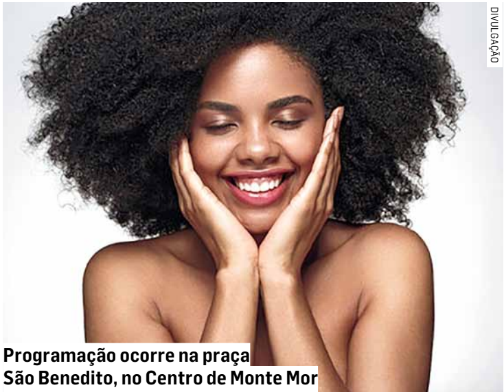
Programação ocorre na praça São Benedito, no Centro de Monte Mor

Da Redação • MONTE MOR tribunaliberal@tribunaliberal.com.br