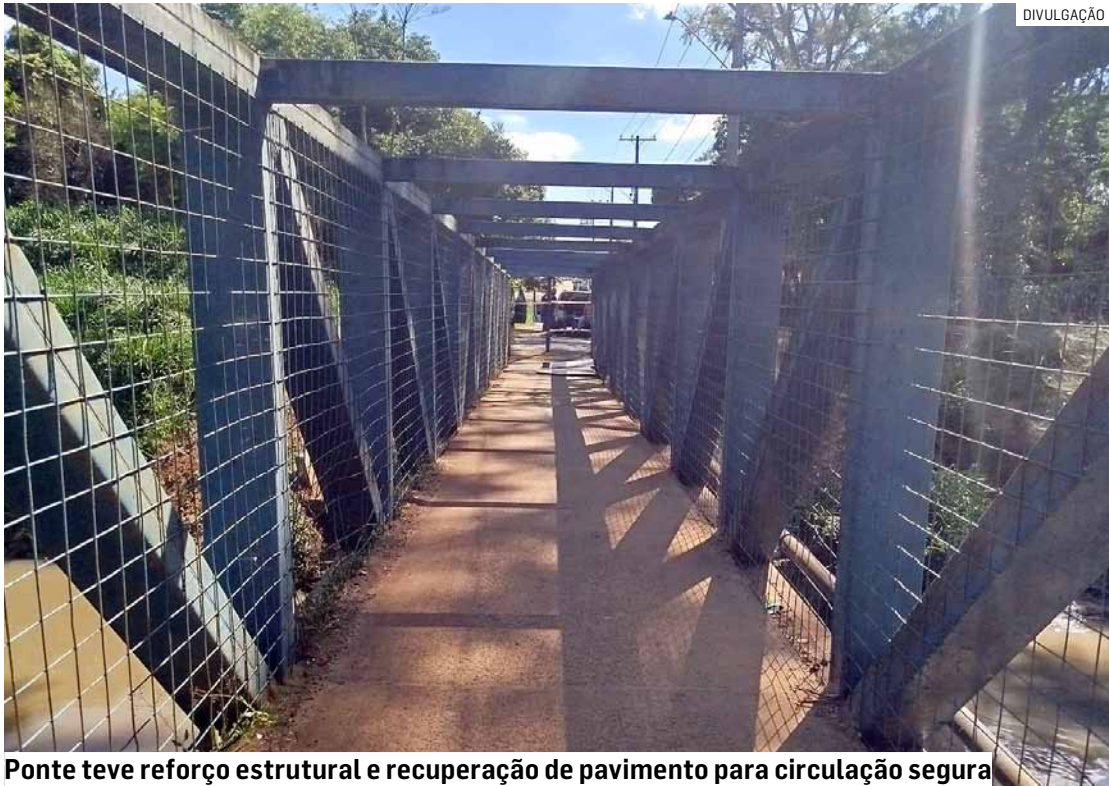
Ponte teve reforço estrutural e recuperação de pavimento para circulação segura

A intervenção teve como principal objetivo garantir mais segurança aos moradores que utilizam diariamente a passagem, especialmente pedestres e motociclistas. A ponte re-