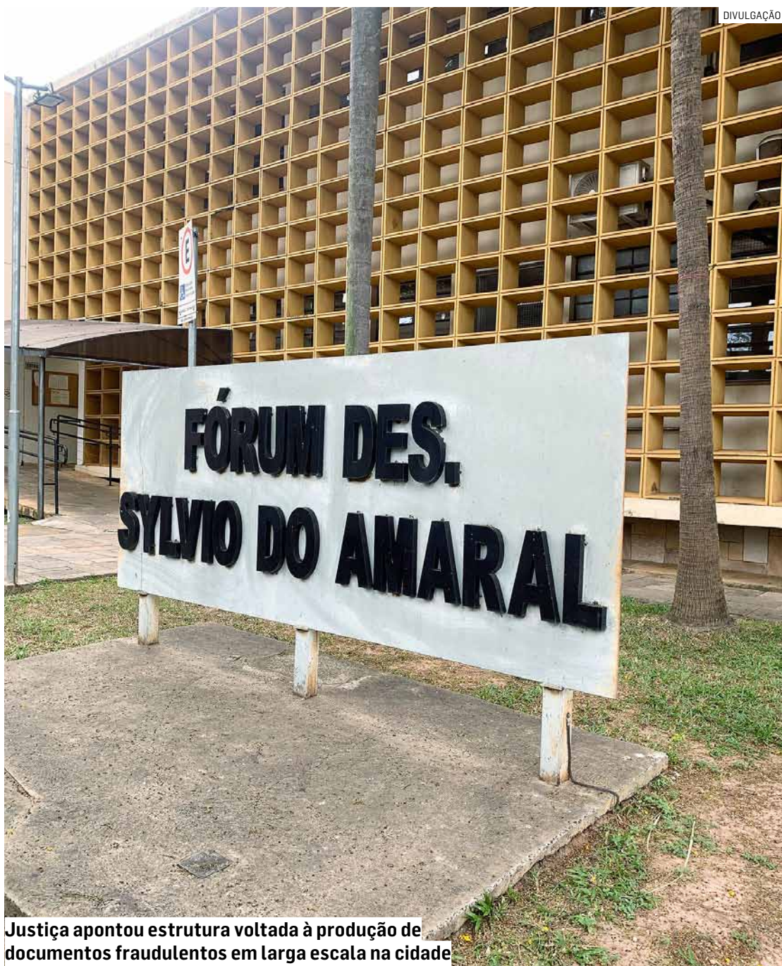
Justiça apontou estrutura voltada à produção de documentos fraudulentos em larga escala na cidade

De acordo com a sentença, foram apreendidos 42 históricos escolares e currículos falsificados atribuídos a escolas estaduais da região, incluindo unidades de Sumaré. Também foram localizadas duas declarações escolares falsas, uma carteira de vacinação adulterada e diversos documentos médicos atribuídos a