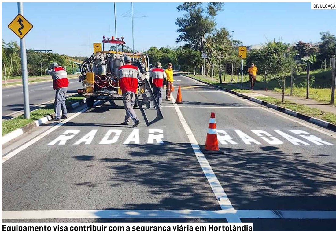
Equipamento visa contribuir com a segurança viária em Hortolândia