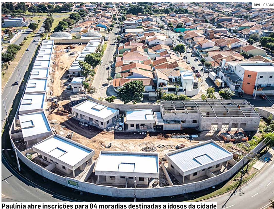
Paulínia abre inscrições para 84 moradias destinadas a idosos da cidade

Entre os documentos necessários estão RG ou CNH, certidão de nascimento ou casamento e, em caso de viuvez, certidão de óbito do cônjuge. Os interessados deverão apresentar ainda comprovantes de renda atualizados, como aposentadoria, pensão ou holerite, além de docu-