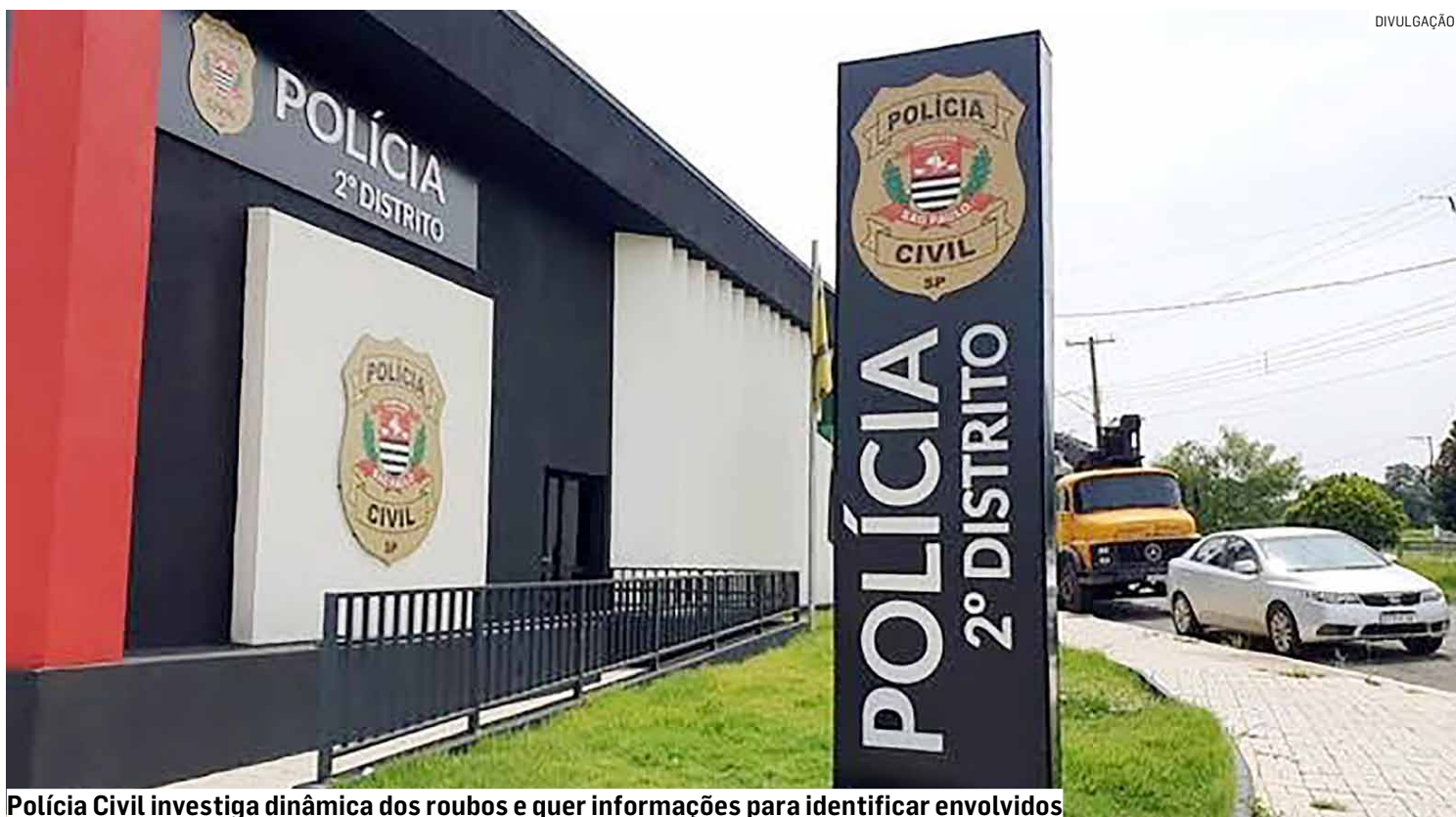
Polícia Civil investiga dinâmica dos roubos e quer informações para identificar envolvidos

Uma terceira ocorrência foi registrada em uma unidade da Drogal, na Avenida Luiz Camilo de Camargo. De acordo com o relato, um homem entrou no local,