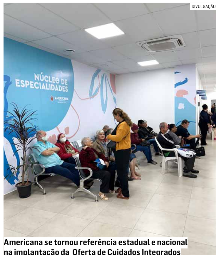
Americana se tornou referência estadual e nacional na implantação da Oferta de Cuidados Integrados

Para garantir que ninguém fique sem atendimento por falta de confirmação, a prefeitura reforça que os pacientes contatados pelo call center que não puderem comparecer devem informar a ausência no momento da ligação, permitindo que a vaga seja