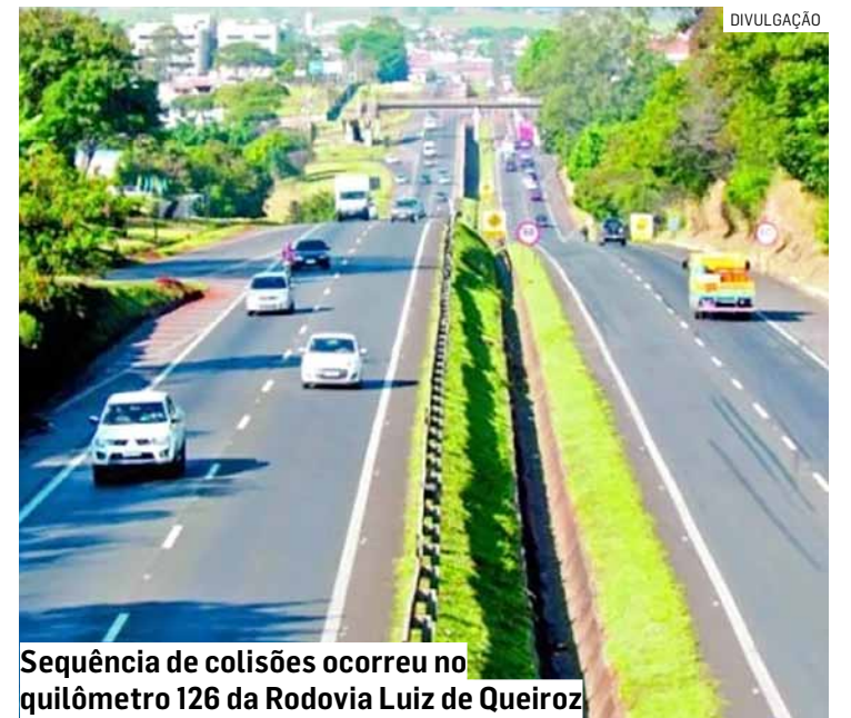
Seqüência de colisões ocorreu no quilômetro 126 da Rodovia Luiz de Queiroz

fluxos no trânsito da região durante a manhã. De acordo com a PM Rodoviária, a ocorrência causou cerca de três quilômetros de congestionamento no trecho afetado, exigindo atenção redobrada dos motoristas que trafegavam pela rodovia. As faixas foram liberadas após o atendimento às vítimas e a remoção dos veículos envolvidos.