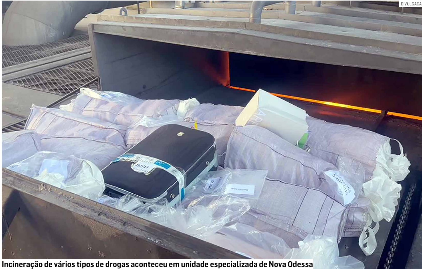
Incineração de vários tipos de drogas aconteceu em unidade especializada de Nova Odessa

Ação destruiu cocaína, maconha, haxixe, MDMA e medicamentos apreendidos em 240 ocorrências ligadas ao tráfico; parte dos casos foi registrada no Aeroporto Internacional de Viracopos, o maior da região e um dos principais do Brasil