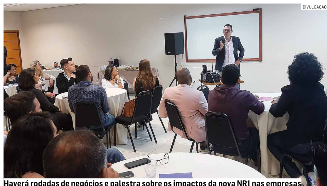
Haverá rodadas de negócios e palestra sobre os impactos da nova NRI nas empresas

Um dos destaques do encontro será a palestra “NRI Além da Norma: Como Proteger Pessoas e Re-