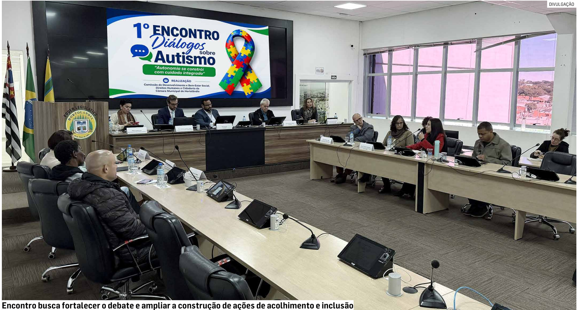
Encontro busca fortalecer o debate e ampliar a construção de ações de acolhimento e inclusão