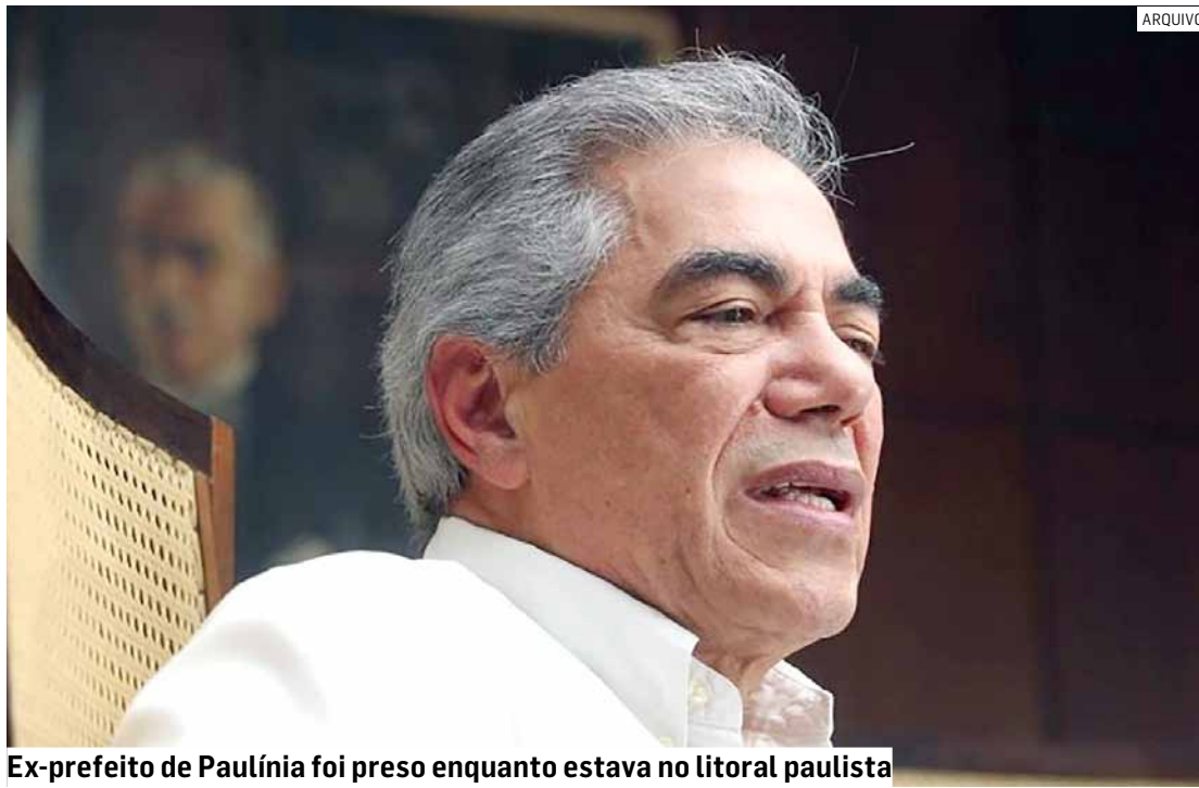
Ex-prefeito de Paulínia foi preso enquanto estava no litoral paulista

Mandado expedido pelo Departamento de Execuções Criminais foi cumprido no Guarujá após o trânsito em julgado da condenação por sonegação de contribuição previdenciária; ex-prefeito de Paulínia havia pedido a substituição da pena