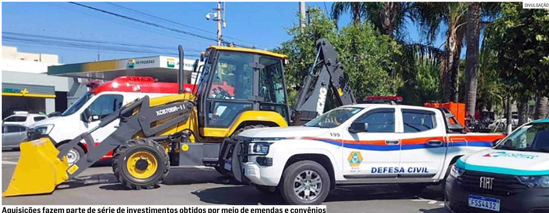
Aquisições fazem parte de série de investimentos obtidos por meio de emendas e convênios

Uma das principais aquisições é uma caminhonete Mitsubishi New Triton 4x4 movida a diesel, entregue à Defesa Civil. O veículo conta com um kit de combate a incêndios com capacidade para 600 litros de água e dois sopradores a combustão, equipamentos que serão utilizados principalmente durante o período de estiagem, quando aumentam os riscos de queimadas em áreas urbanas, rurais e de preservação ambiental.