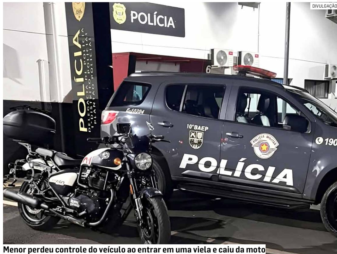
Menor perdeu controle do veículo ao entrar em uma via e caiu da moto

Os policiais conseguiram alcançar e abordar o