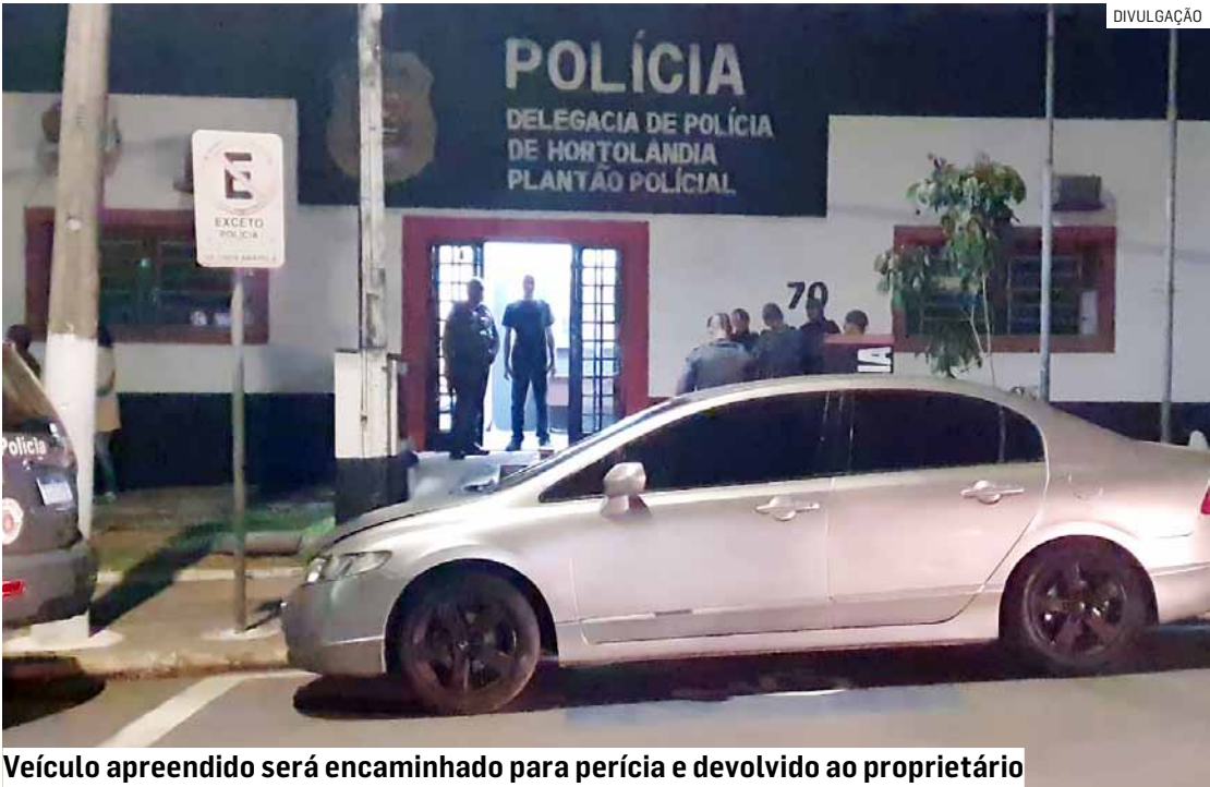
Veículo apreendido será encaminhado para perícia e devolvido ao proprietário

A mulher foi conduzida ao Plantão Policial de Hortolândia, onde a autoridade policial validou a prisão.