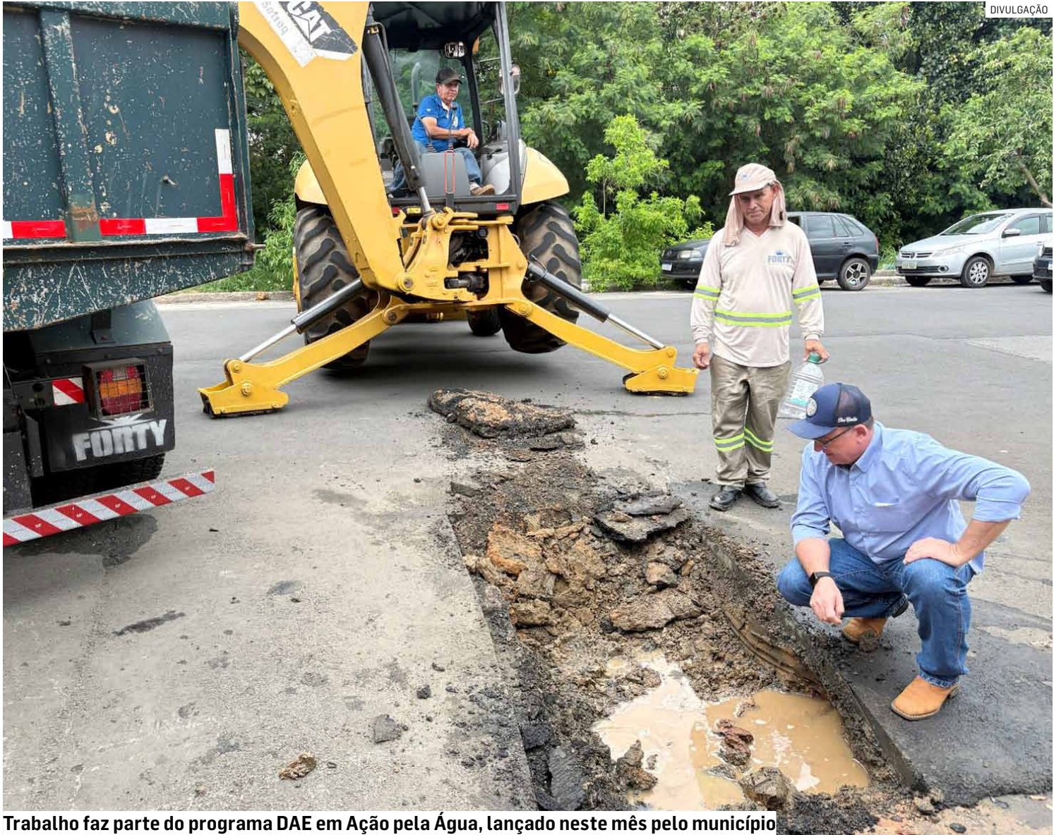
Trabalho faz parte do programa DAE em Ação pela Água, lançado neste mês pelo município

O objetivo é intensificar o combate às perdas de água e garantir mais agilidade na execução dos reparos, contribuindo para a eficiência do sistema de abastecimento e a redução do desperdício. Além dos reparos dos vazamentos já registrados no DAE, a autarquia con-