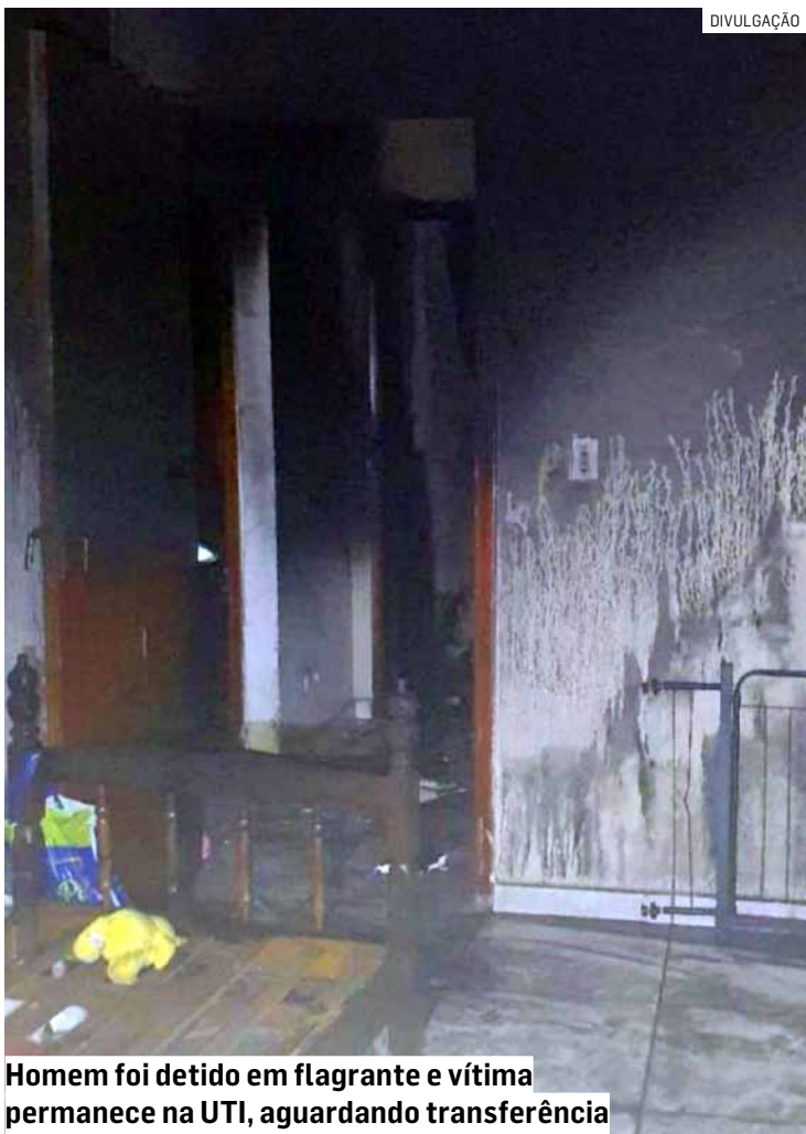
Homem foi detido em flagrante e vítima permanece na UTI, aguardando transferência