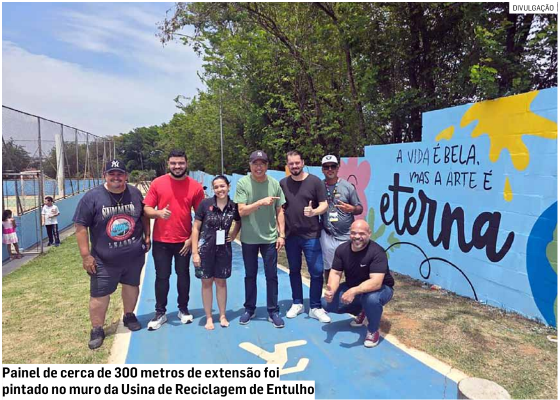
Painel de cerca de 300 metros de extensão foi pintado no muro da Usina de Reciclagem de Entulho

“Nossa cidade ganha ainda mais cor, vida e criatividade com o Galeria Urbana Festival. Estes 25 artistas incríveis se reuniram para transformar o espaço público e mostrar toda a potência da arte urbana de Hortolândia. O muro da Usina