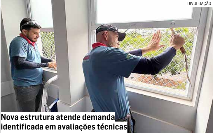
Nova estrutura atende demanda identificada em avaliações técnicas

As novas proteções são fabricadas em material de alta resistência e contam com sistema de fixação estruturalmente reforçado, assegurando maior estabilidade e mitigação de riscos de incidentes. O projeto preserva a ventilação adequada e o conforto térmico do ambiente, sem interferir nas condições assistenciais do setor. Adicionalmente, a iniciativa contribui também para o controle do fluxo de pessoas e para a redução de riscos