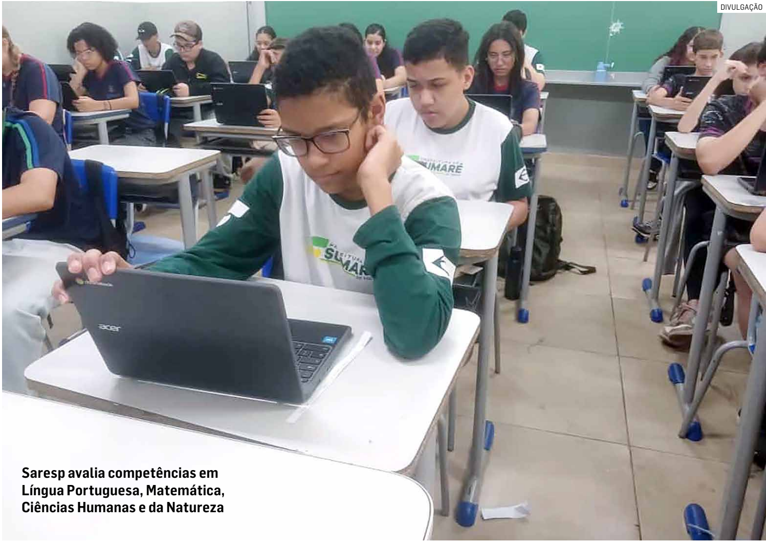
Saresp avalia competências em Língua Portuguesa, Matemática, Ciências Humanas e da Natureza