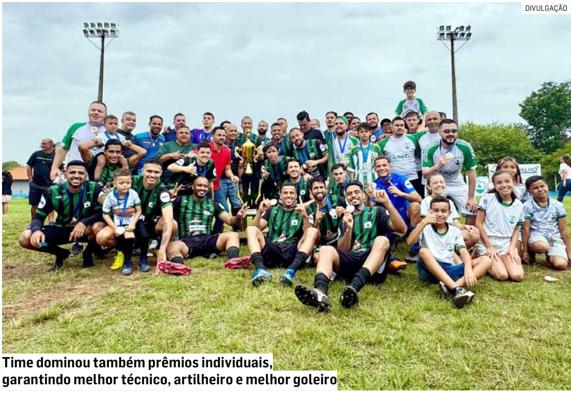
Time dominou também prêmios individuais, garantindo melhor técnico, artilheiro e melhor goleiro

“É gratificante ver o esporte tão forte em nossa cidade, reunindo famílias, incentivando nossos jovens e fortalecendo a comunidade.