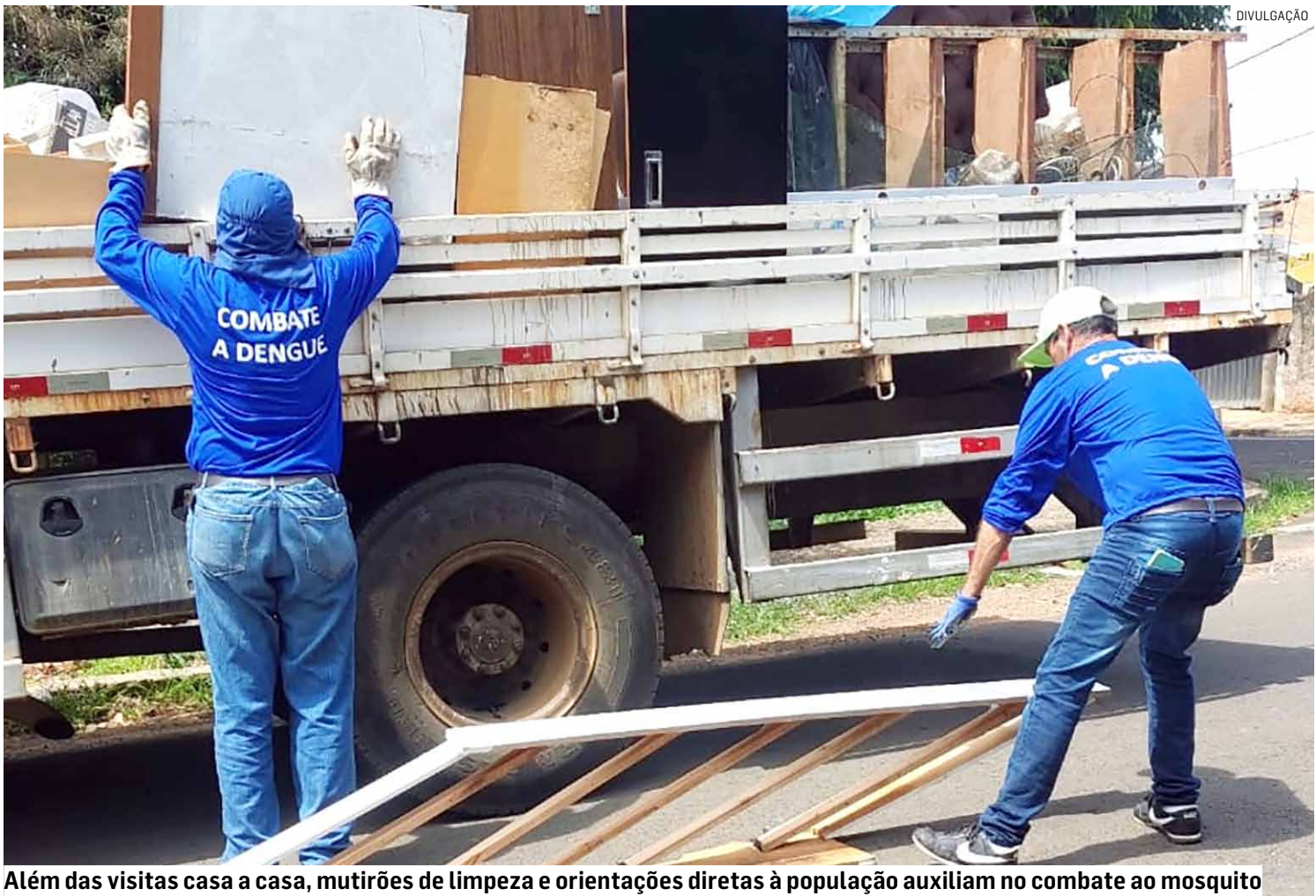
Além das visitas casa a casa, mutirões de limpeza e orientações diretas à população auxiliam no combate ao mosquito

No último sábado (15), a prefeitura realizou o “Arrastão da Dengue” no Jardim Santa Luíza. Pela manhã, a equipe de endemias percorreu o bairro recolhendo recipientes e materiais que poderiam servir de criadouro para o mosquito. As ações complementaram o trabalho feito entre os dias 10 e 14 de novembro, quando técnicos priorizaram medidas edu-