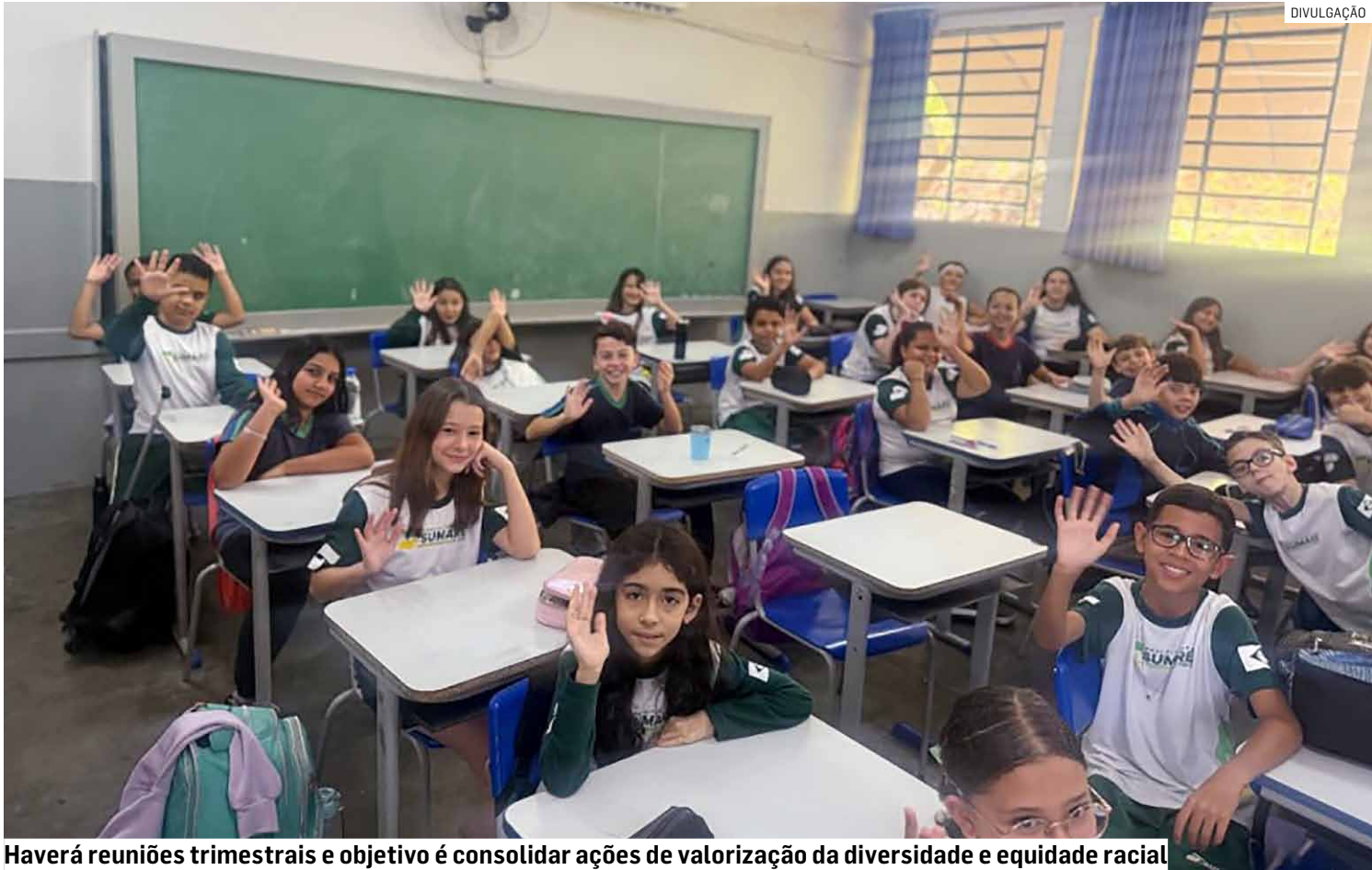
Haverá reuniões trimestrais e objetivo é consolidar ações de valorização da diversidade e equidade racial

A comissão considera marcos legais como a Constituição Federal, a Lei de Diretrizes e Bases (LDB) e leis que tornaram obrigatório o ensino da História e Cultura Afro-Brasileira, Africana e Indígena em toda a educação básica. Também se fundamenta nas Diretrizes Curriculares Nacionais para a Educação das Relações Étnico-Raciais e no Estatuto da Igualdade Racial.