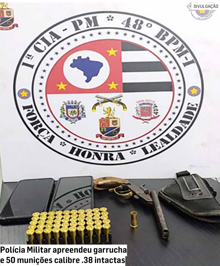
Polícia Militar apreendeu garrucha e 50 munições calibre .38 intactas

A Polícia Militar foi acionada na noite desta quarta-feira (17) para atender uma ocorrência de violência doméstica na Rua Siqueira Campos, no Bairro da Serra, em Monte Mor. Ao chegar ao local, os policiais encontraram a vítima, que relatou ter sido ameaçada de morte pelo companheiro. Segundo ela, o homem apresentava comportamento agressivo e não aceitava diálogo. Durante a tentativa de abordagem, o suspeito demonstrou forte resistência. Ele estava visivelmente alterado e, de acordo com os agentes, aparentava estar sob efeito de álcool ou entorpecentes.