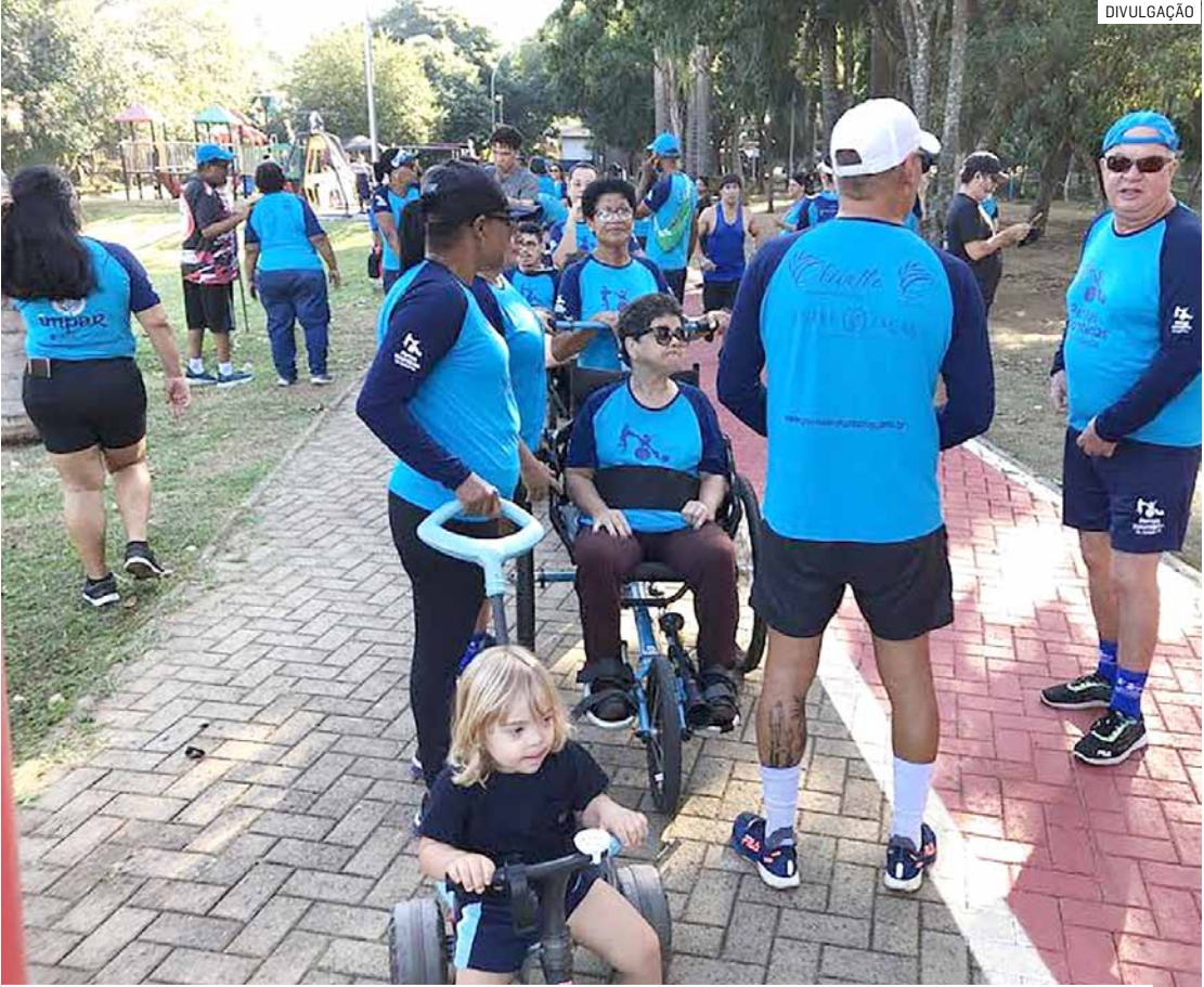
Evento organizado pela prefeitura será neste domingo (21), a partir das 8h, no Lago da Fé

A concentração será próxima à academia ao ar livre, localizada nas imediações do cruzamento da