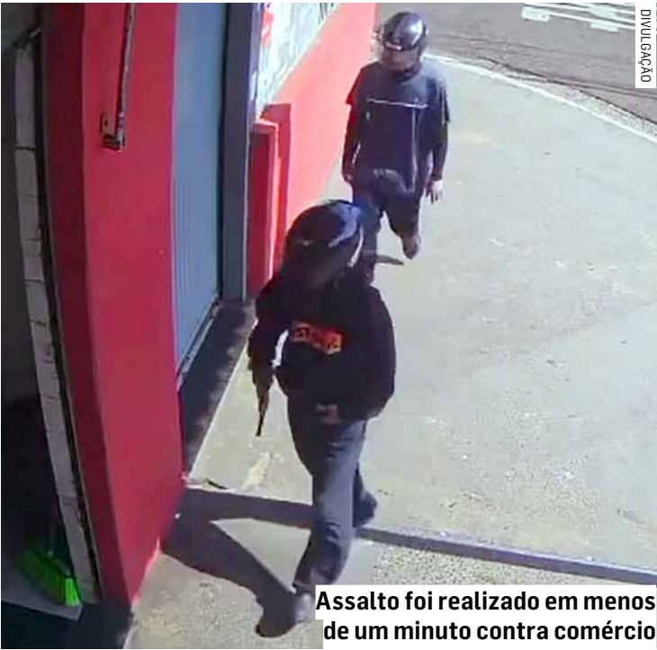
Assalto foi realizado em menos de um minuto contra comércio

A Polícia Civil foi acionada e analisa as imagens para identificar os suspeitos. Informações que possam ajudar nas investigações podem ser repassadas anonimamente pelo Disque-Denúncia.