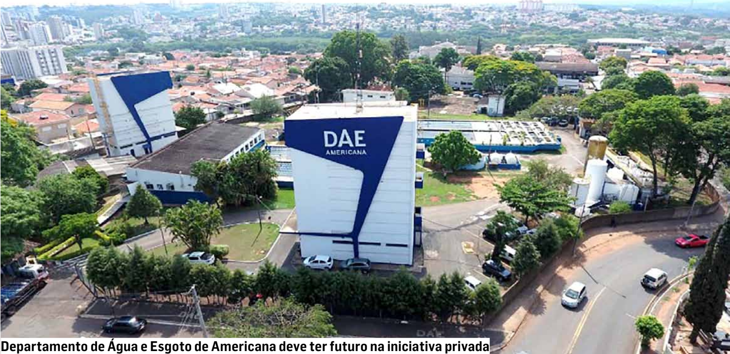
Departamento de Água e Esgoto de Americana deve ter futuro na iniciativa privada