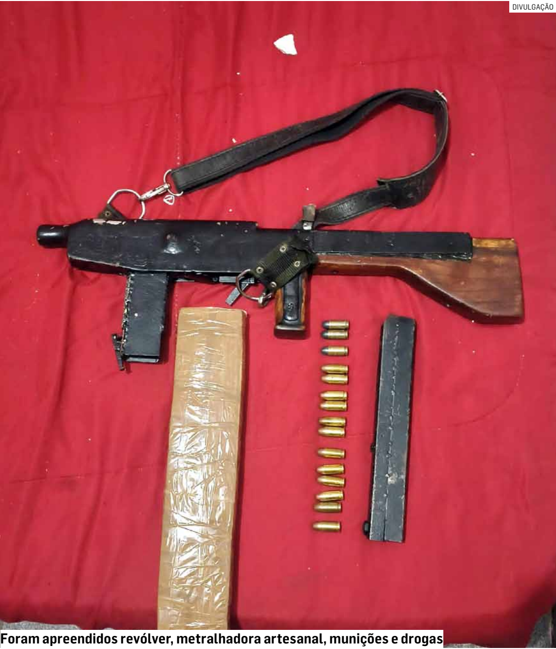
Foram apreendidos revólver, metralhadora artesanal, munições e drogas

Foragido de 25 anos morreu em troca de tiros no Jardim Denadai, em meio a cumprimento de mandado de prisão por policiais da elite da PM; suspeito estava armado e reagiu com disparos contra militares; metralhadora foi apreendida