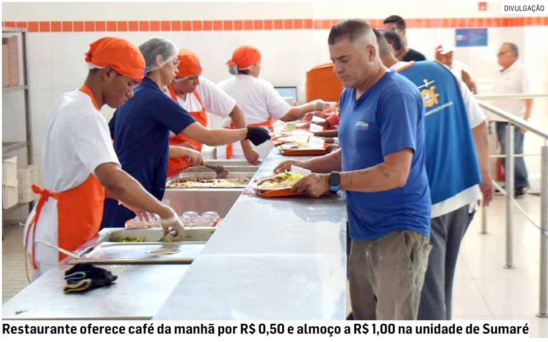
Restaurante oferece café da manhã por R$ 0,50 e almoço a R$ 1,00 na unidade de Sumaré

O restaurante popular Bom Prato de Sumaré celebrou nesta semana seus três anos de funcionamento, consolidando-se como uma das políticas públicas mais importantes de inclusão social e segurança alimentar no município. Desde sua inauguração, a unidade já serviu milhares de refeições nutritivas a preços acessíveis, reforçando o compromisso da gestão municipal com a qualidade de vida da população.