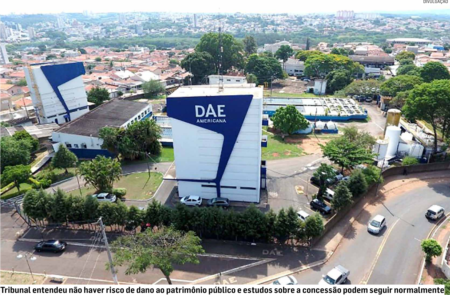
Tribunal entendeu não haver risco de dano ao patrimônio público e estudos sobre a concessão podem seguir normalmente

Outro ponto defendido foi que não houve favorecimento de empresas: 17 grupos manifestaram interesse no chamamento público, o que indica ampla concorrência.