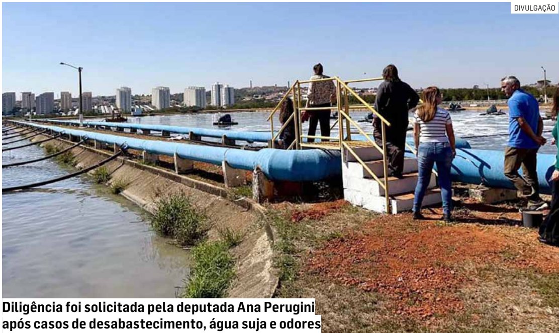
Diligência foi solicitada pela deputada Ana Perugini após casos de desabastecimento, água suja e odores

As falhas da Sabesp na prestação de serviços no município têm sido ques-