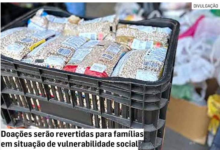
Doações serão revertidas para famílias em situação de vulnerabilidade social

va. Os produtos arrecadados irão compor as cestas montadas pelo Fundo Social, ajudando a colocar alimento na mesa de quem mais precisa, e contemplará ainda as entidades assistenciais da cidade”, afirmou.