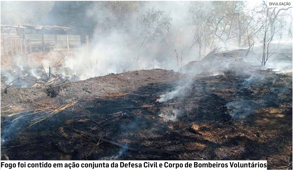
Fogo foi contido em ação conjunta da Defesa Civil e Corpo de Bombeiros Voluntários

Durante a ocorrência, a queda de um fio de energia elétrica em meio ao mato alto próximo a um poste provocou o rompimento da fiação. A Companhia Paulista de Força e Luz (CPFL) foi acionada e desligou a rede elétrica de forma preventiva.