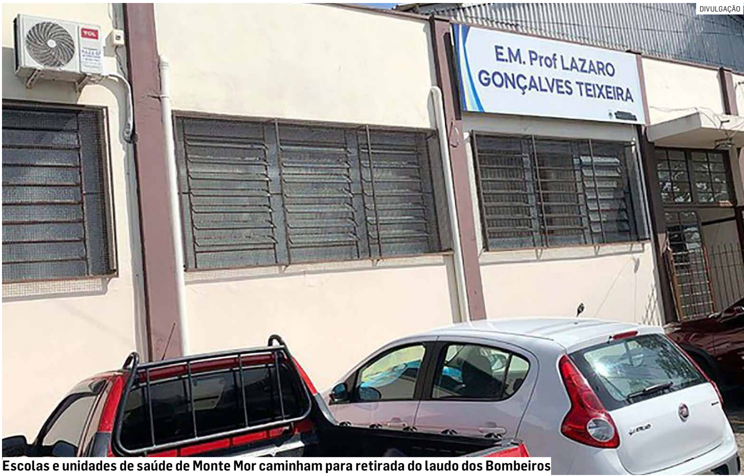
Escolas e unidades de saúde de Monte Mor caminham para retirada do laudo dos Bombeiros

Prefeito firma contrato para corrigir pendências históricas com regularização de prédios da saúde e da educação; valor total do acordo é de R$ 118.972,00, com validade de 12 meses; TCE-SP já criticou risco em escolas municipais