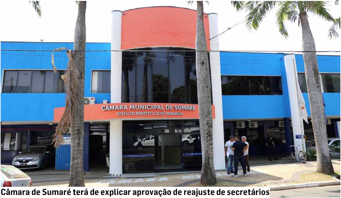
Câmara de Sumaré terá de explicar aprovação de reajuste de secretários

Agora, com a suspensão da lei, os secretários voltariam a receber o salário de R$ 10 mil. Já o cargo de secretário-adjunto fica sem referência legal, uma vez que sua criação ocorreu junto com a lei suspensa. Tanto o Executivo quanto o Legislativo devem prestar esclarecimentos à Justiça.