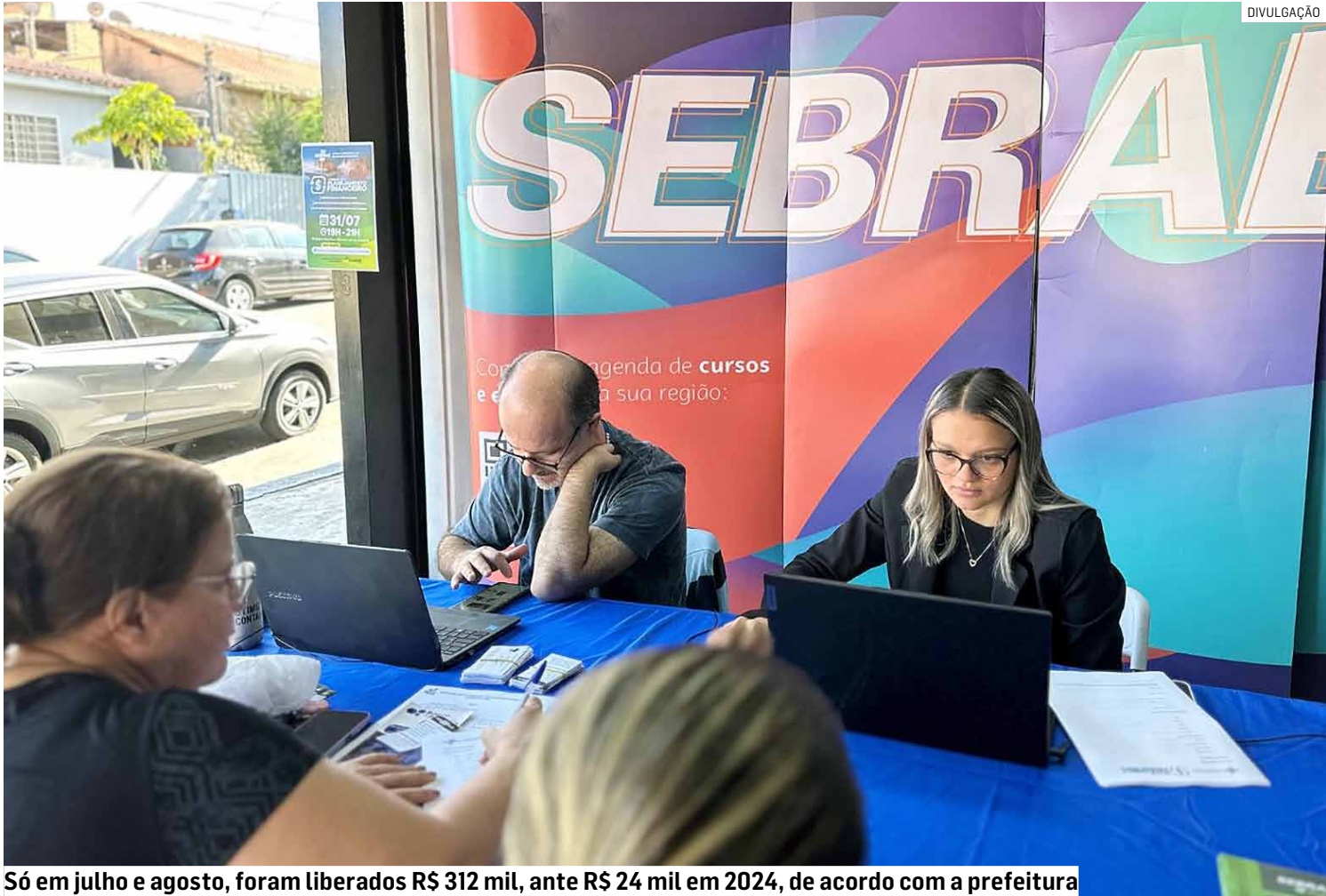
Só em julho e agosto, foram liberados R$ 312 mil, ante R$ 24 mil em 2024, de acordo com a prefeitura

As visitas técnicas intensificaram a proximidade com os empreendedores, com destaque para os crescimentos de 2.450% em fevereiro e 418,2% em julho.