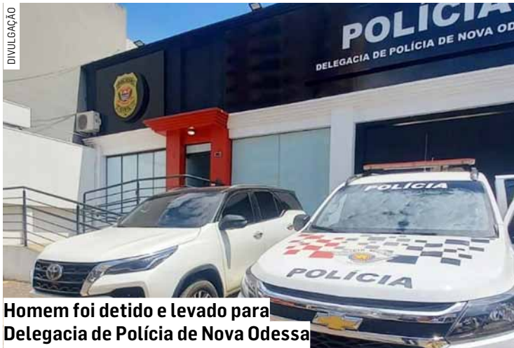
Homem foi detido e levado para Delegacia de Polícia de Nova Odessa

O suspeito foi conduzido ao Distrito Policial de Nova Odessa, onde permaneceu detido à disposição da Justiça. O caso foi registrado como furto, violência doméstica e descumprimento de medida protetiva.