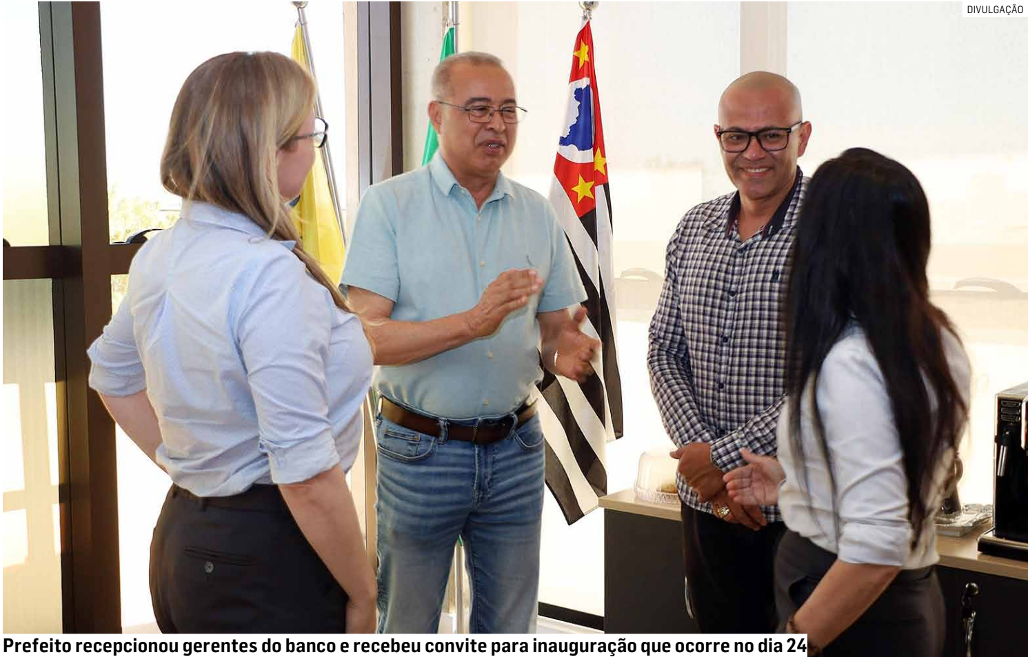
Prefeito recepcionou gerentes do banco e recebeu convite para inauguração que ocorre no dia 24