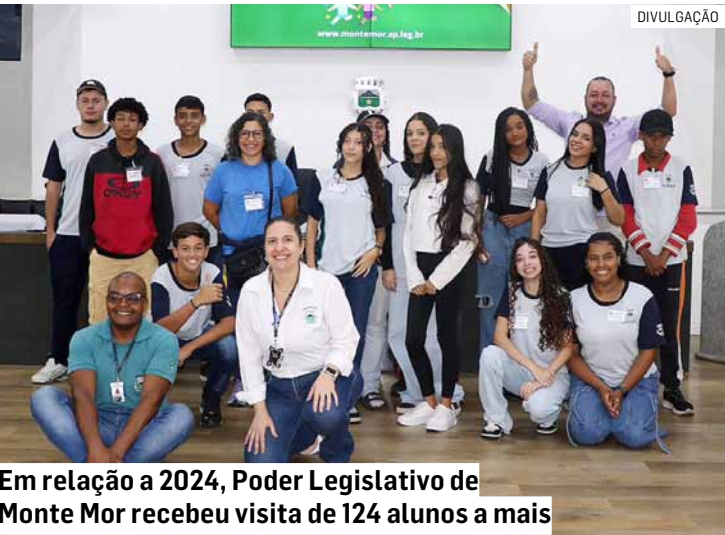
Em relação a 2024, Poder Legislativo de Monte Mor recebeu visita de 124 alunos a mais