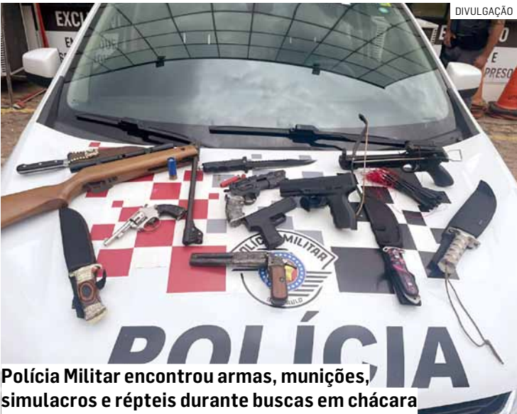
Polícia Militar encontrou armas, munições, simulacros e répteis durante buscas em chácara

Cézar Oliveira • AMERICANA tribunaliberal@tribunaliberal.com.br