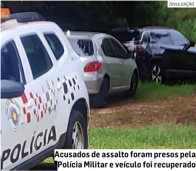
Acusados de assalto foram presos pela Polícia Militar e veículo foi recuperado

Após a prisão, os três indivíduos foram conduzidos à Delegacia de Polícia de Hortolândia, onde o caso foi registrado. Eles permaneceram à disposição da Justiça.