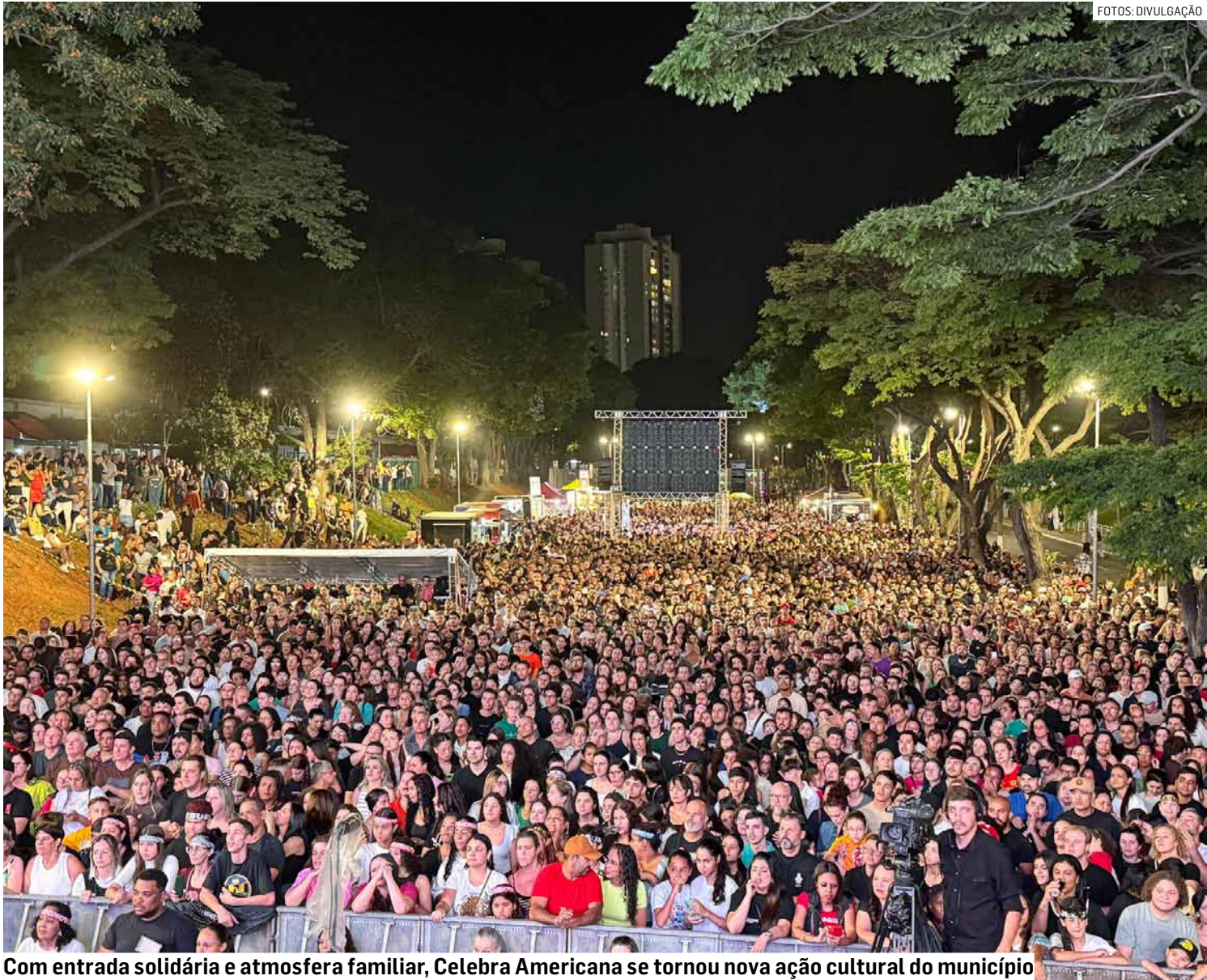
Com entrada solidária e atmosfera familiar, Celebra Americana se tornou nova ação cultural do município

O prefeito Chico Sardelli (PL) saudou o público, agradecendo a cada família pela presença. “As equipes da prefeitura trabalharam com dedicação e o resultado está aqui: é a presença de vocês, deixando o CCL mais bonito e cheio de vida. Vamos juntos celebrar este encontro”, falou.