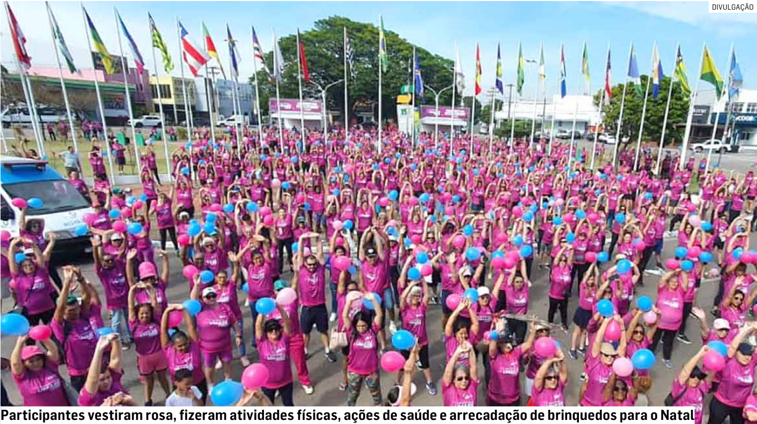
Participantes vestiram rosa, fizeram atividades físicas, ações de saúde e arrecadação de brinquedos para o Natal

No local, os participantes puderam aproveitar diver-