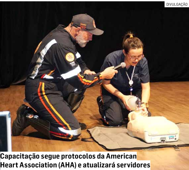
Capacitação segue protocolos da American Heart Association (AHA) e atualizará servidores

Da Redação • NOVA ODESSA tribunaliberal@tribunaliberal.com.br