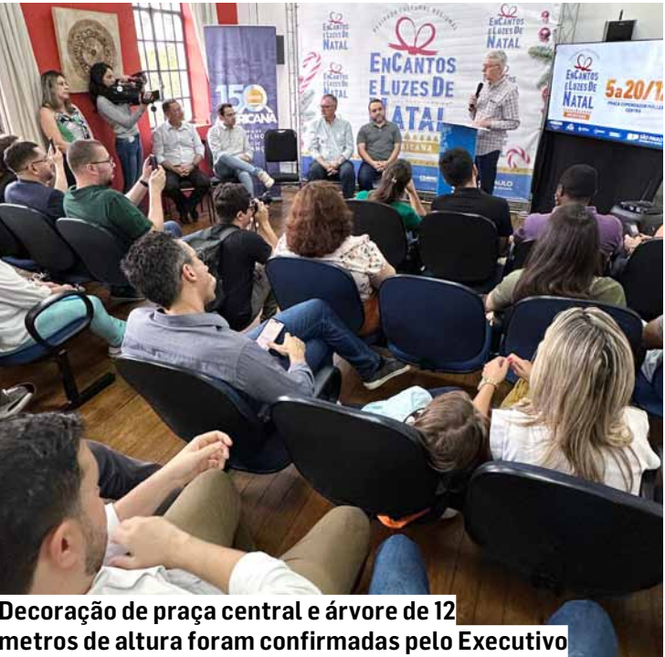
Decorado de praça central e árvore de 12 metros de altura foram confirmadas pelo Executivo