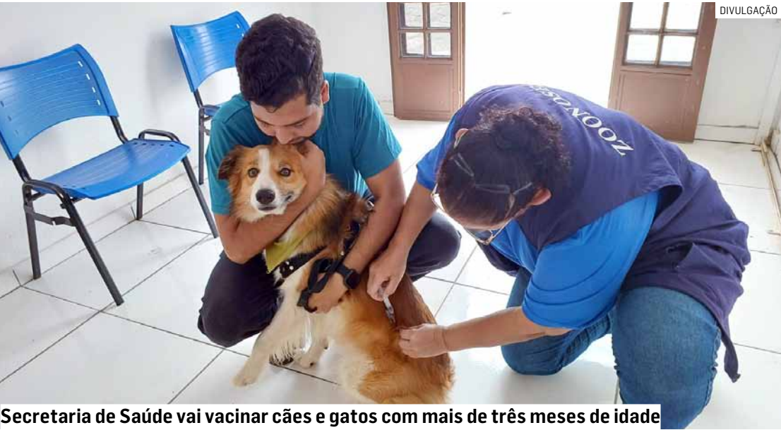
Secretaria de Saúde vai vacinar cães e gatos com mais de três meses de idade

se público e administrativo como motivo para a interrupção. Recentemente, o município oficializou, por meio de dispensa de licitação, o contrato 48/2025, destinado à contratação de veículos e equipamentos pesados com operador para atender ações emergenciais da Defesa Civil. O serviço tem como finalidade ampliar a capacidade operacional do município no combate a incêndios e na limpeza de áreas atingidas por queimadas, situações que vêm exigindo respostas rápidas por parte da Defesa Civil. O valor total do contrato é de R$ 1.688.400,00, montante destinado à locação de máquinas de grande porte e veículos especializados, todos com operadores qualificados. A vigência de seis meses prevê cobertura operacional contínua.