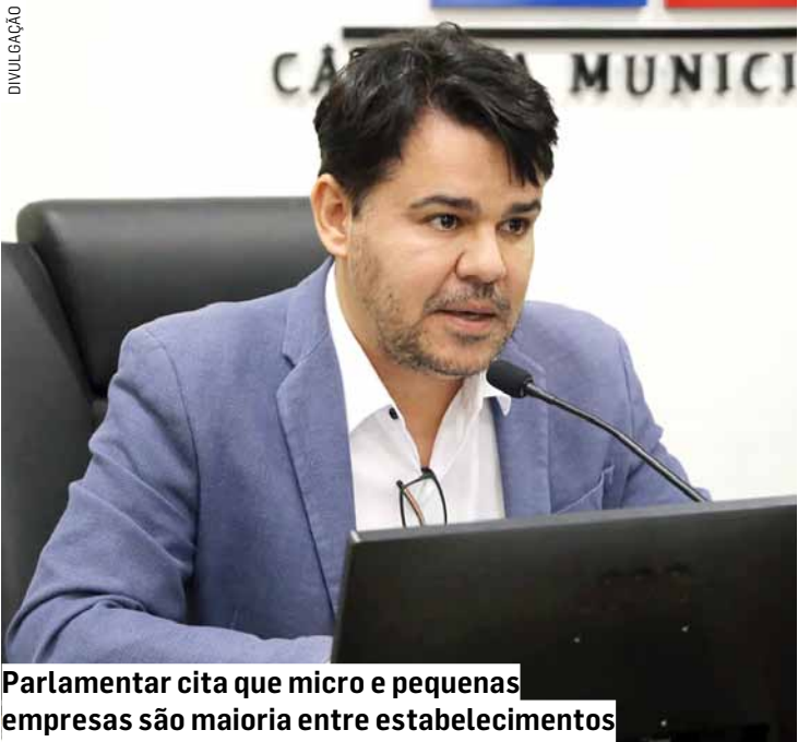
Parlamentar cita que micro e pequenas empresas são maioria entre estabelecimentos

Da Redação • SUMARÉ tribunaliberal@tribunaliberal.com.br