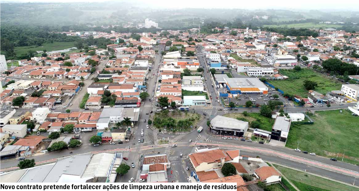
Novo contrato pretende fortalecer ações de limpeza urbana e manejo de resíduos

A Prefeitura de Monte Mor oficializou a contratação da empresa Transporte Ferreira Monte Mor Ltda. para a prestação de serviços de retirada de materiais volumosos domiciliares e resíduos provenientes de podas, capina e varrição. O contrato estabelece valor de R$ 100 mil para o serviço, que inclui caminhão, motorista e ajudante, com vigência de 12 meses. O novo contrato atende a uma demanda contínua do município em relação à limpeza urbana e manejo adequado de resíduos. Paralelamente à publicação do contrato, a administração municipal divulgou o aviso de suspensão de dois certames licitatórios. O pregão eletrônico 49/2025, que previa a “lo-