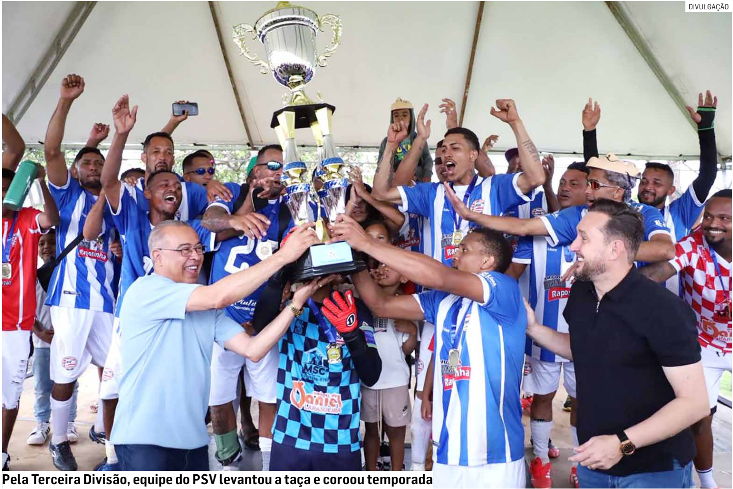
Pela Terceira Divisão, equipe do PSV levantou a taça e coroou temporada

Em 2024, o campeonato amador reafirmou sua posição entre os mais competitivos do interior paulista. Foram 72 equipes, 1.741 atletas e 281 membros de comissões técnicas, somando mais de 2 mil pessoas envolvidas diretamente. Mas esse número, por si só, não dá conta do que o futebol representa. Há ainda as milhares de pessoas que tomam as arquibancadas todos os fins de semana, pais, filhos, avós, moradores apaixonados que acompanham seu time com fervor — numa cena