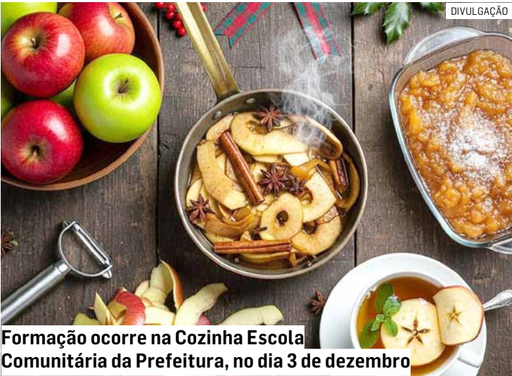
Formação ocorre na Cozinha Escola Comunitária da Prefeitura, no dia 3 de dezembro

O encerramento da temporada, marcado pela festa do PSV, não é apenas um ponto final. É uma vírgula, um convite para o que virá. O futebol amador de Hortolândia segue crescendo, movido por paixão, comunidade e pela certeza de que, dentro e fora de campo, sempre haverá novas histórias para contar.