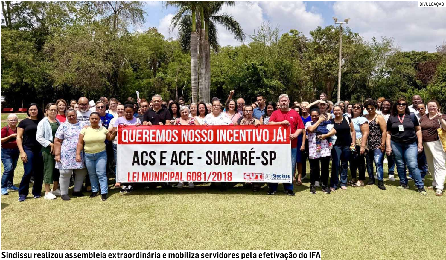
Sindissu realizou assembleia extraordinária e mobiliza servidores pela efetivação do IFA

Durante a reunião, a diretoria apresentou atualizações sobre as ações referentes ao FGTS, insalubridade, prêmio PSF e mudança de letra, todas em tramitação. O objetivo foi esclarecer dúvidas e reforçar que o sindicato segue acompanhando cada processo para garantir que os direitos dos servi-