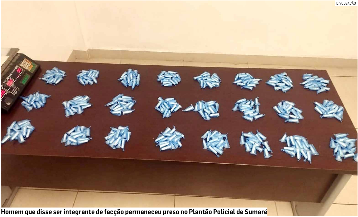
Homem que disse ser integrante de facção permaneceu preso no Plantão Policial de Sumaré

De acordo com a polícia, os agentes avistaram um Volkswagen Golf branco, e notaram que os dois ocupantes demonstraram nervosismo ao perceberem a aproximação da viatura, tentando se esconder e subindo rapidamente os vidros do carro. A atitude levantou suspeita e motivou a abordagem.