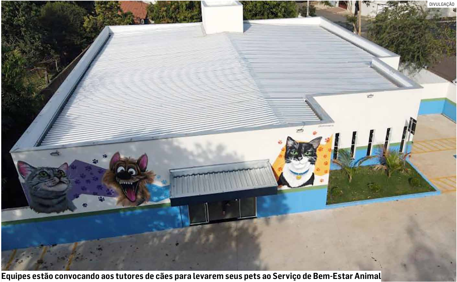
Equipes estão convocando aos tutores de cães para levarem seus pets ao Serviço de Bem-Estar Animal