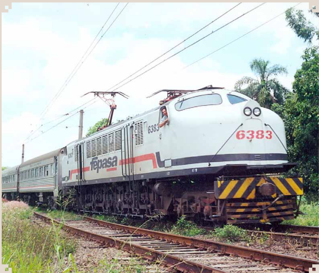
Foto da locomotiva V-8, pintada com o nome de FEPASA, sucessora da Cia. Paulista de Estradas de Ferro, puxando um trem de passageiros. Essa composição transitava diariamente pela nossa cidade.