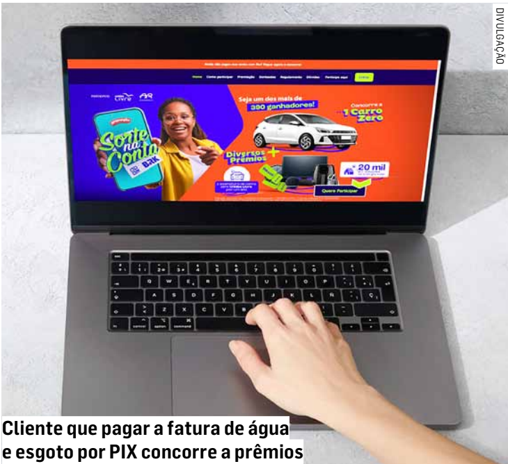
Cliente que pagar a fatura de água e esgoto por PIX concorre a prêmios

A BRK, concessionária responsável pelos serviços de água e esgoto em Sumaré, informou que o primeiro sorteio da promoção Sorte na Conta já foi realizado. Os ganhadores estão disponíveis para consulta no site da campanha (sortenacontabrck.com.br). Nesta edição, além dos sorteios mensais, a promoção oferece prêmios instantâneos por meio de uma roleta premiada. Para participar, o cliente titular da conta deve se cadastrar no site da promoção e aceitar os termos da campanha. Após o cadastro, o cliente passa a receber suas faturas por e-mail, possibilitando o pagamento das contas de água e esgoto via PIX. Cada pagamento mensal por PIX gera um número da sorte, que dá direito a concorrer à roleta premiada e aos seis sorteios vinculados à Loteria Federal. Durante todo o período da promoção, mais de 50 clientes de Sumaré se-