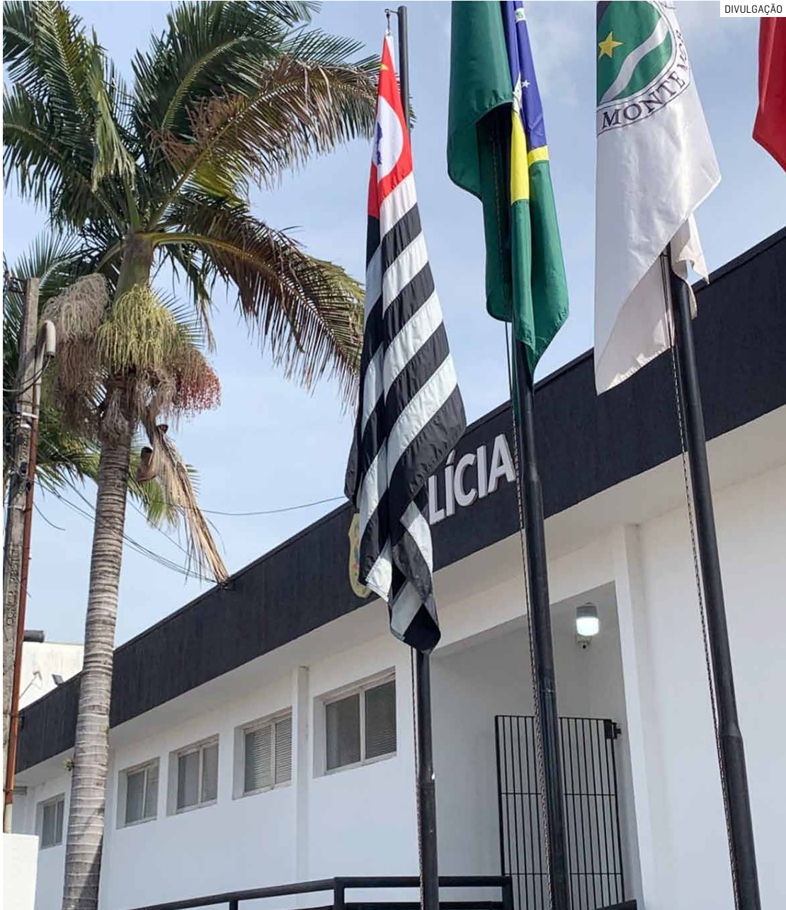
Avanço reflete ações integradas entre Guarda Civil Municipal, Polícia Civil e Polícia Militar

Entre janeiro e agosto, cidade registrou 76 ocorrências de tráfico de entorpecentes — número que já supera todas as 52 registradas em 2024; volume de flagrantes representa aumento de 100% na cidade, revela levantamento da SSP-SP