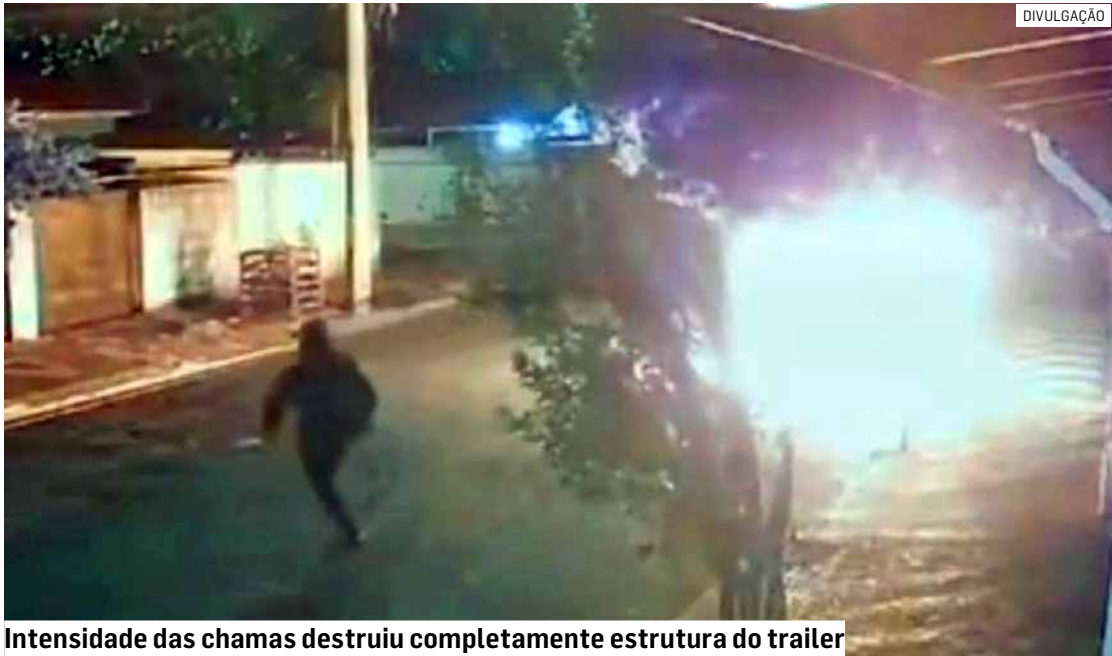
Intensidade das chamas destruiu completamente estrutura do trailer

De acordo com o Corpo de Bombeiros, o chamado foi registrado às 2h55. Três equipes foram enviadas para conter o incêndio, que destruiu completamente a estrutura. O trabalho de rescaldo durou cerca de uma hora.