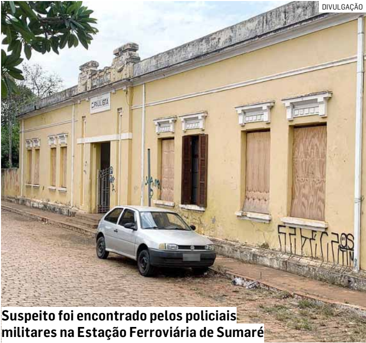
Suspeito foi encontrado pelos policiais militares na Estação Ferroviária de Sumaré

O suspeito permaneceu detido e ficou à disposição da Justiça para responder pelos crimes de roubo e resistência.