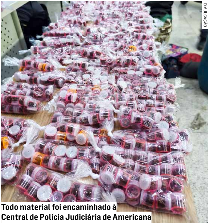
Todo material foi encaminhado à Central de Polícia Judiciária de Americana

Os suspeitos, ao perceberem a presença policial, fugiram em meio à mata fechada. Apesar das tentativas, não foi possível alcançá-los devido à complexidade do terreno. As buscas, no entanto, continuaram no entorno do local.