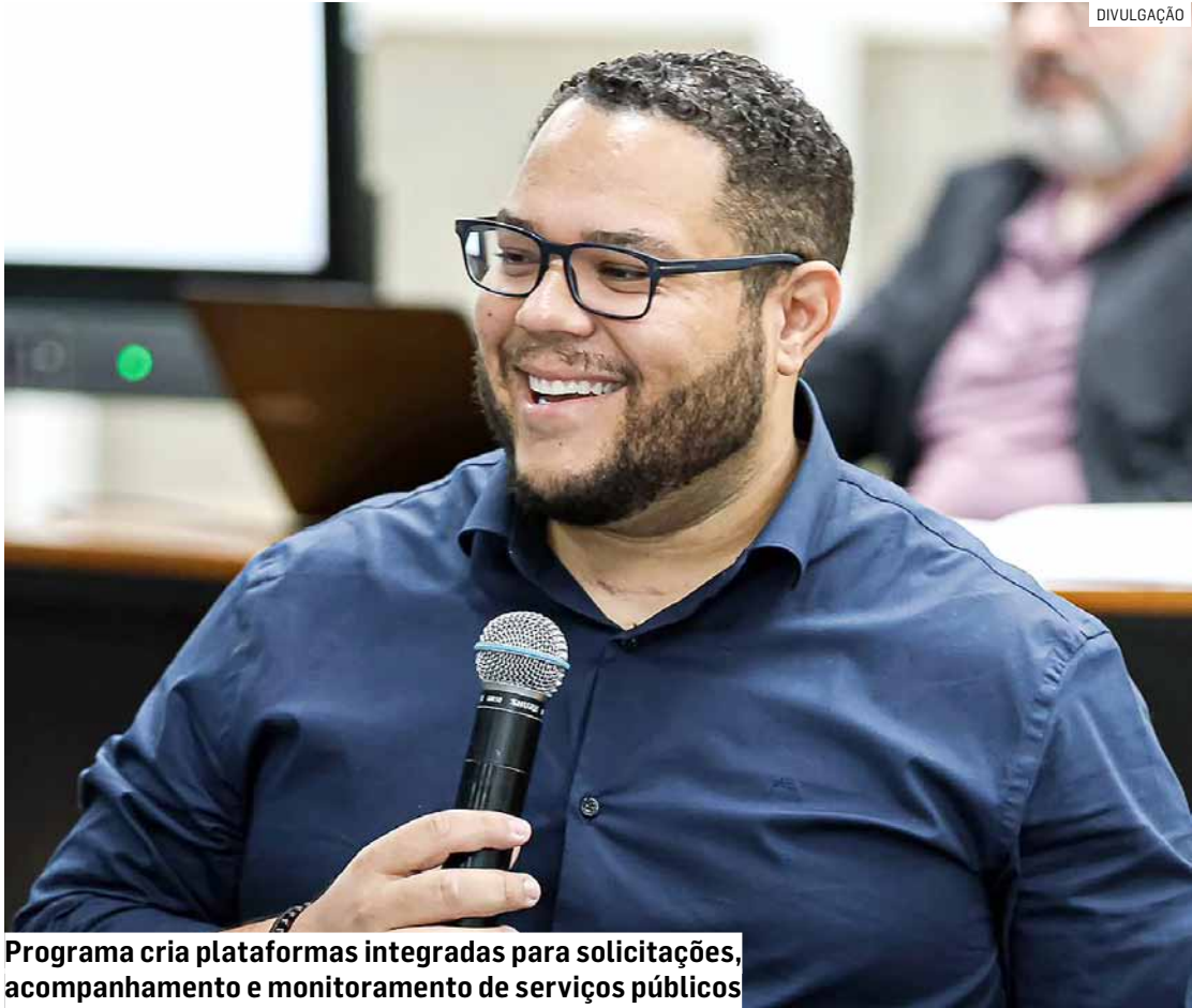
Programa cria plataformas integradas para solicitações, acompanhamento e monitoramento de serviços públicos

A Secretaria Municipal de Inovação, Tecnologia e Conectividade ficará responsável pela coordenação do programa, em parceria