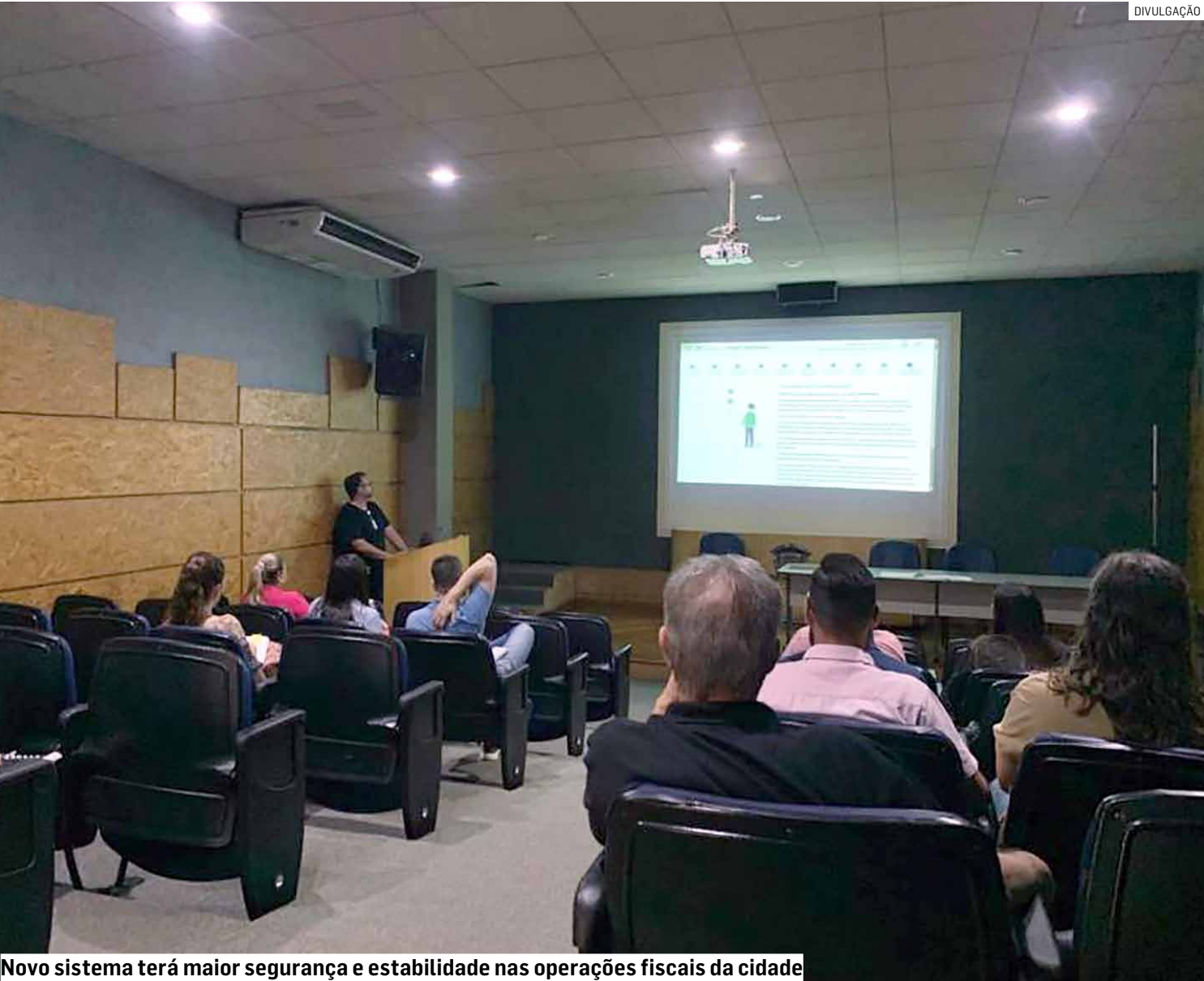
Novo sistema terá maior segurança e estabilidade nas operações fiscais da cidade

Mudanças que serão implementadas foram apresentadas a contadores do da cidade em encontro realizado no Paço Municipal, onde representantes da Secretaria de Finanças explicaram as vantagens da nova plataforma