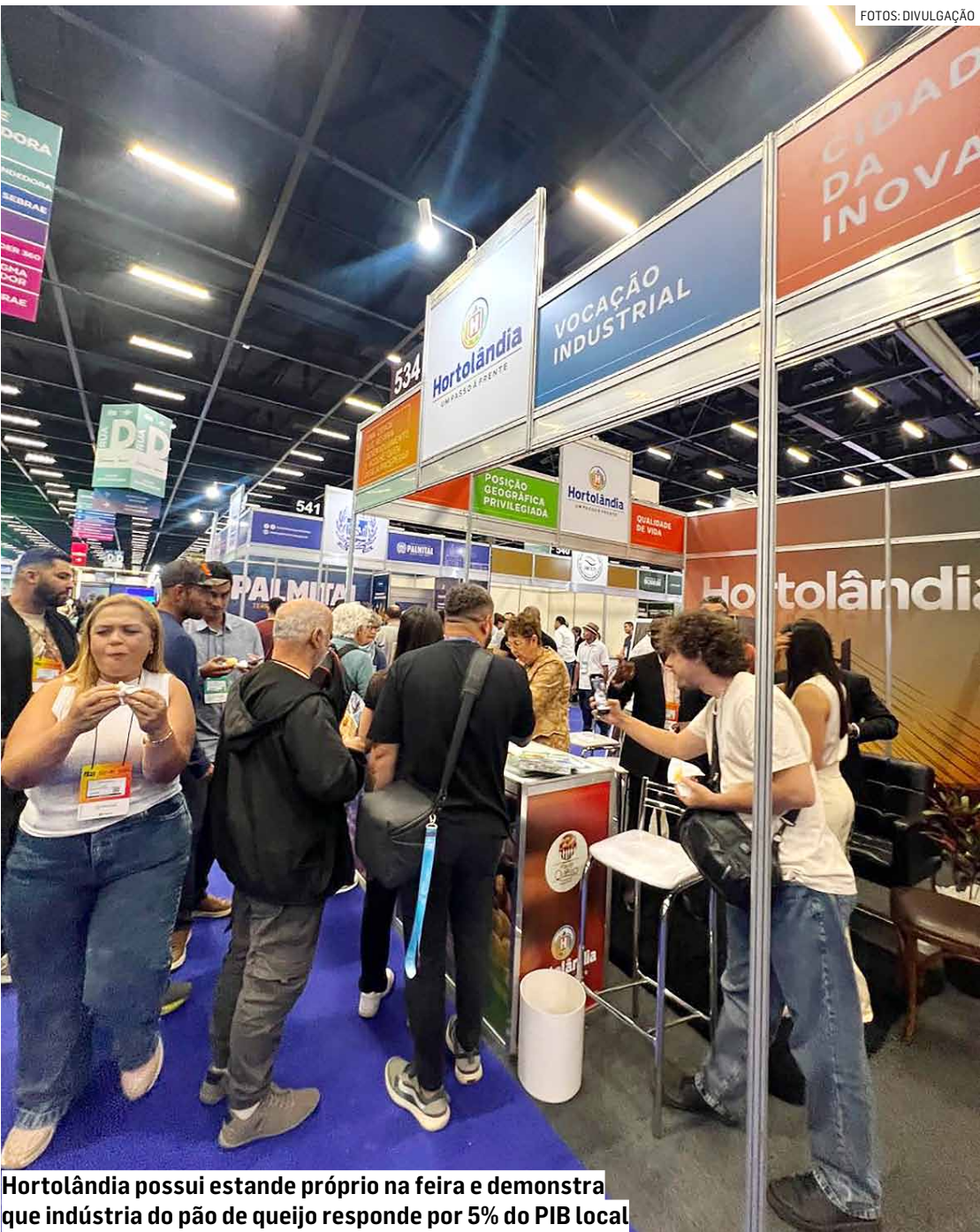
Hortolândia possui estande próprio na feira e demonstra que indústria do pão de queijo responde por 5% do PIB local

“A feira promovida pelo Sebrae contribui para colocar Hortolândia no mapa do empreendedorismo. Estamos participando com a Associação dos produtores de pão de queijo. A atividade é extremamente relevante no que se refere a em-