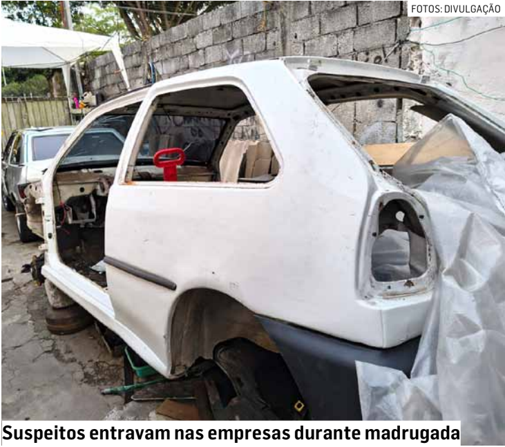
Suspeitos entravam nas empresas durante madrugada

Durante a ação, três dos quatro investigados foram capturados. Um quarto homem foi preso em flagrante em um dos ende-