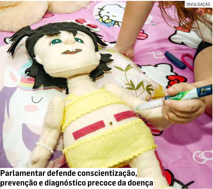
Parlamentar defende conscientização, prevenção e diagnóstico precoce da doença

Ele propõe também programa de educação e conscientização sobre a proteção animal no município, manutenção no velório municipal e pista de caminhada e corrida com iluminação pública na Avenida Luiz Batista de Souza, no bairro Bom Retiro.