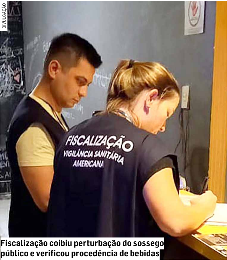
Fiscalização coibiu perturbação do sossego público e verificou procedência de bebidas

Da Redação • AMERICANA tribunaliberal@tribunaliberal.com.br