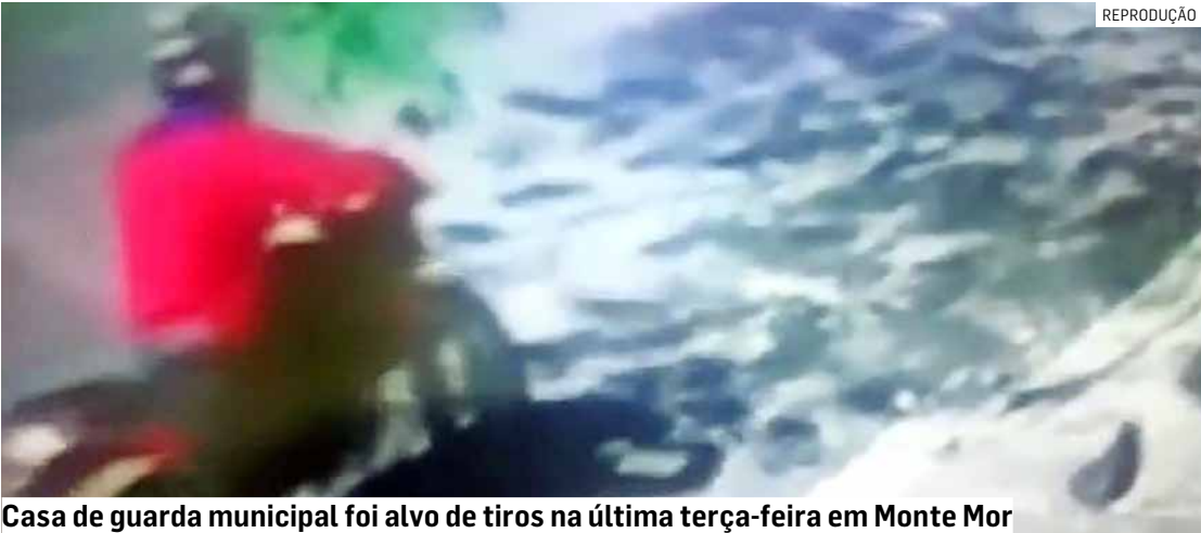
Casa de guarda municipal foi alvo de tiros na última terça-feira em Monte Mor

Secretaria Municipal de Segurança refutou ligação entre atentado contra casa de patrulheiro com possível retaliação do crime organizado; apuração segue várias linhas, como suposto crime passional