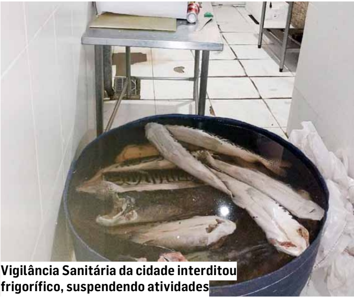
Vigilância Sanitária da cidade interditou frigorífico, suspendendo atividades

A Prisma Biodiesel afirmou colaborar integralmente com as autoridades e reforçou a importância da união entre o setor produtivo e os órgãos de fiscalização para fortalecer a cadeia de biocombustíveis e combater práticas ilícitas.