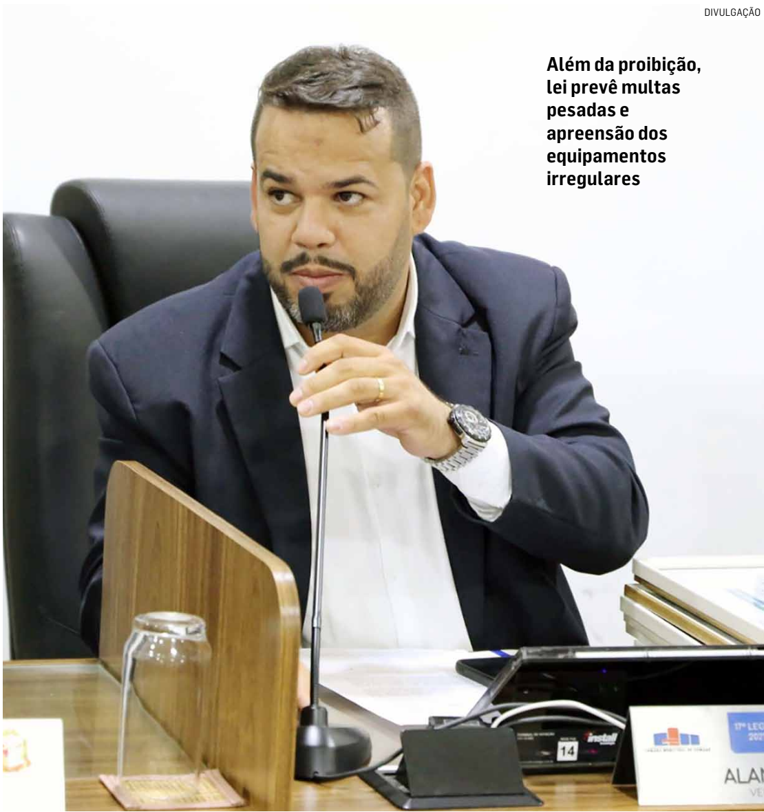
Além da proibição, lei prevê multas pesadas e apreensão dos equipamentos irregulares

Proposta, de autoria do vereador Alan Leal, foi aprovada pela Câmara Municipal e sancionada pelo prefeito Henrique do Paraíso; nova lei busca combater práticas de adestramento consideradas cruéis e prejudiciais aos animais domésticos