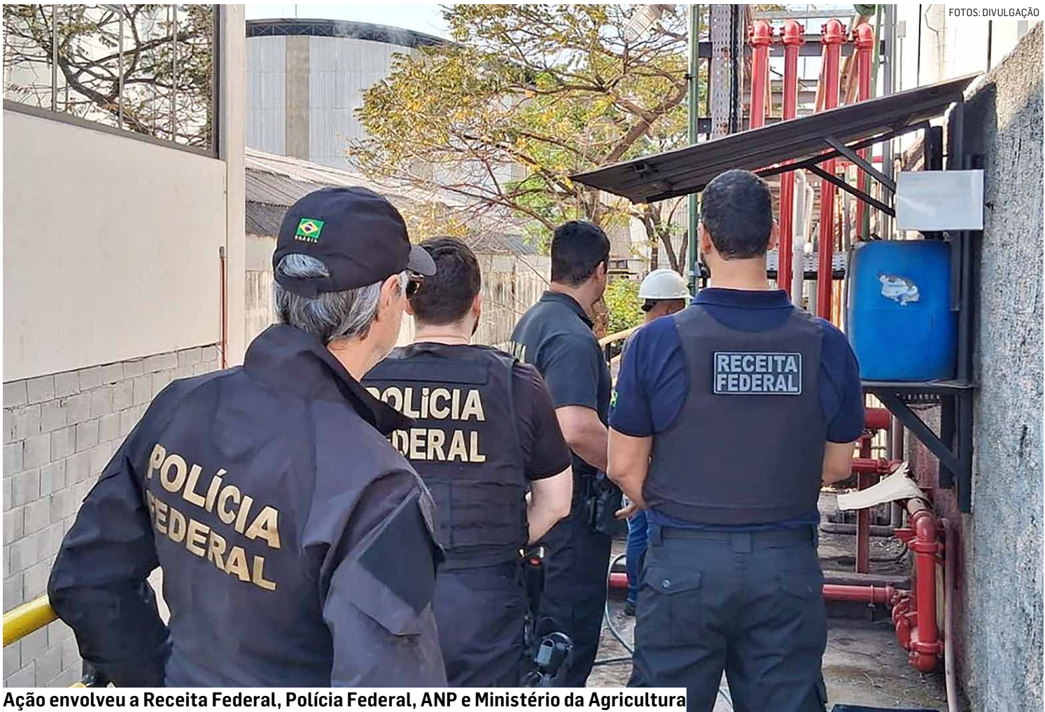
Ação envolveu a Receita Federal, Polícia Federal, ANP e Ministério da Agricultura

A ação mobilizou a Receita Federal, Polícia Federal, Agência Nacional do Petróleo, Gás Natural e Biocombustíveis (ANP) e o Ministério da Agricultura e Pecuária (Mapa). Em Sumaré, a coleta foi realizada na empresa Prisma Biodiesel, que, em nota, declarou manter “compromisso com a ética, a transparência e o pleno cumprimento da legislação que rege o setor de biocombustíveis no Brasil”.