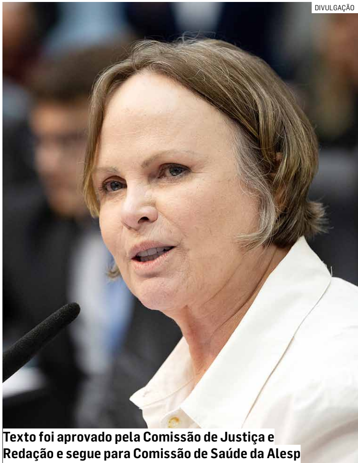
Texto foi aprovado pela Comissão de Justiça e Redação e segue para Comissão de Saúde da Alesp

O projeto atribui ao Tribunal de Contas do Estado (TCE) a fiscalização dos processos relacionados às listas prioritárias. Segundo o texto, o órgão deverá realizar auditorias, elaborar relatórios periódicos sobre o funcionamento do sistema e encaminhá-los à Comissão de Saúde da Alesp e aos órgãos de controle competentes, como Conselho de Saúde, a fim de garantir total transparência aos processos.