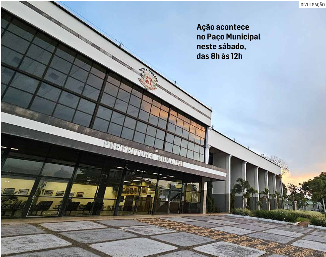
Ação acontece no Paço Municipal neste sábado, das 8h às 12h

Serão oferecidas vagas para profissionais com diversos níveis de experiência, em uma ampla variedade de funções, incluindo balconista de padaria, frios, rotisseria e hortifrúti; ajudante de cozinha; açougueiro; auxiliar de limpeza;