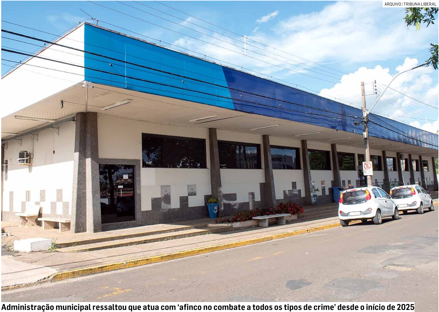
Administração municipal ressaltou que atua com ‘afinco no combate a todos os tipos de crime’ desde o início de 2025

A nota ainda afirma que “ao que tudo indica, não há envolvimento de nenhuma facção criminosa no ataque”. A Secretaria informou que o comando da Guarda Civil Municipal e a própria pasta estão colaborando diretamente com a Polícia Civil, garantindo que os fatos sejam esclare-