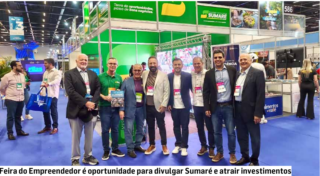
Feira do Empreendedor é oportunidade para divulgar Sumaré e atrair investimentos

Sumaré participa ativamente até este sábado (18) da Feira do Empreendedor 2025 promovida pelo Sebrae-SP, na capital paulista. O evento, já consolidado como principal palco do empreendedorismo na América Latina, reúne mais de 110 mil visitantes, centenas de expositores e movimentação esperada de R$ 45 milhões em negócios.