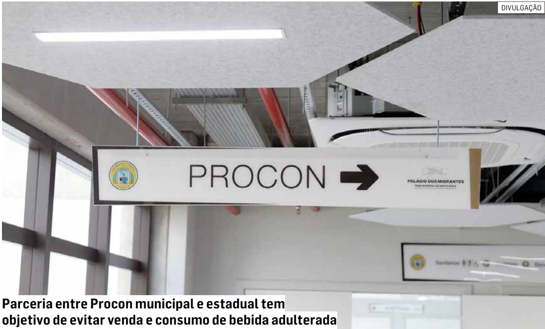
Parceria entre Procon municipal e estadual tem objetivo de evitar venda e consumo de bebida adulterada

Agentes do Procon de Hortolândia, órgão de defesa do consumidor vinculado à prefeitura, atuam para evitar a venda de bebida alcoólica adulterada nos estabelecimentos comerciais da cidade. Numa parceria com o Procon Estadual, os órgãos realizam a Operação De Olho No Copo, nesta sexta-feira (17), das 18h às 22h, com visitas a bares, restaurantes e adegas para orientação de proprietários, funcionários e consumidores sobre a necessidade dos cuidados na hora de comprar, vender e consumir bebidas alcoólicas.