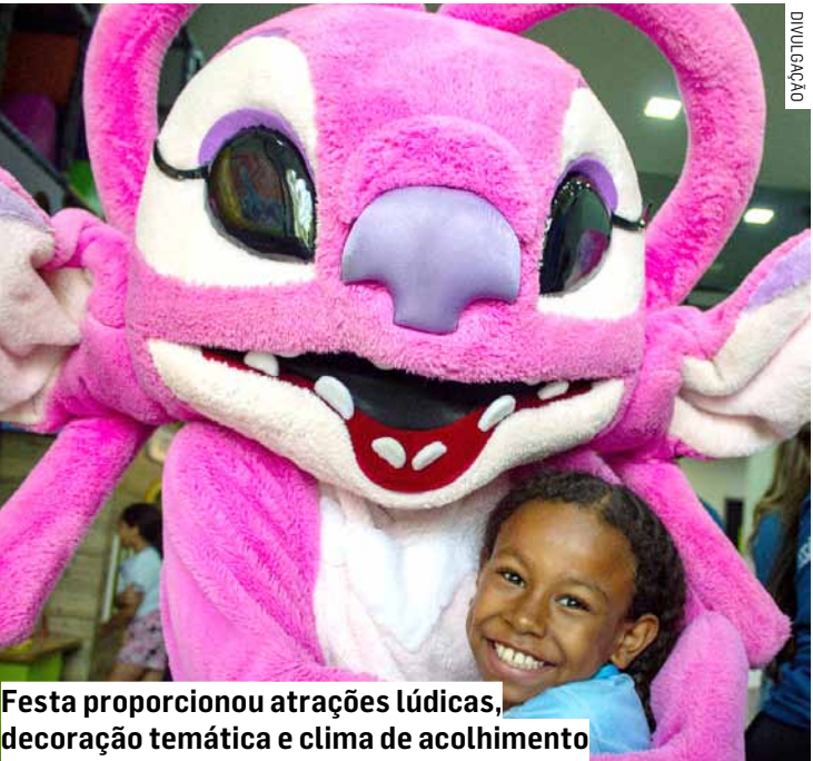
Festa proporcionou atrações lúdicas, decoração temática e clima de acolhimento

O SCFV tem como objetivo promover a integração entre crianças, adolescentes, famílias e a comunidade, fortalecendo laços afetivos e estimulando valores como solidariedade, respeito e cidadania.