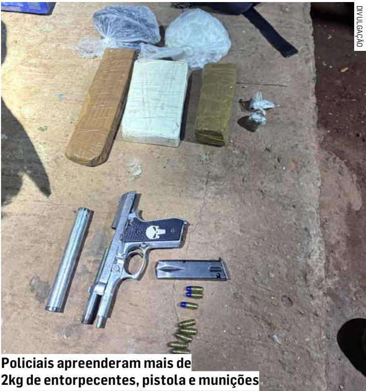
Policiais apreenderam mais de 2kg de entorpecentes, pistola e munições

Durante o confronto, o suspeito acabou sendo atingido. Após cessarem os disparos, os agentes desarmaram o homem e verificaram que ele portava uma pistola Taurus calibre 9 milímetros, sem nu-