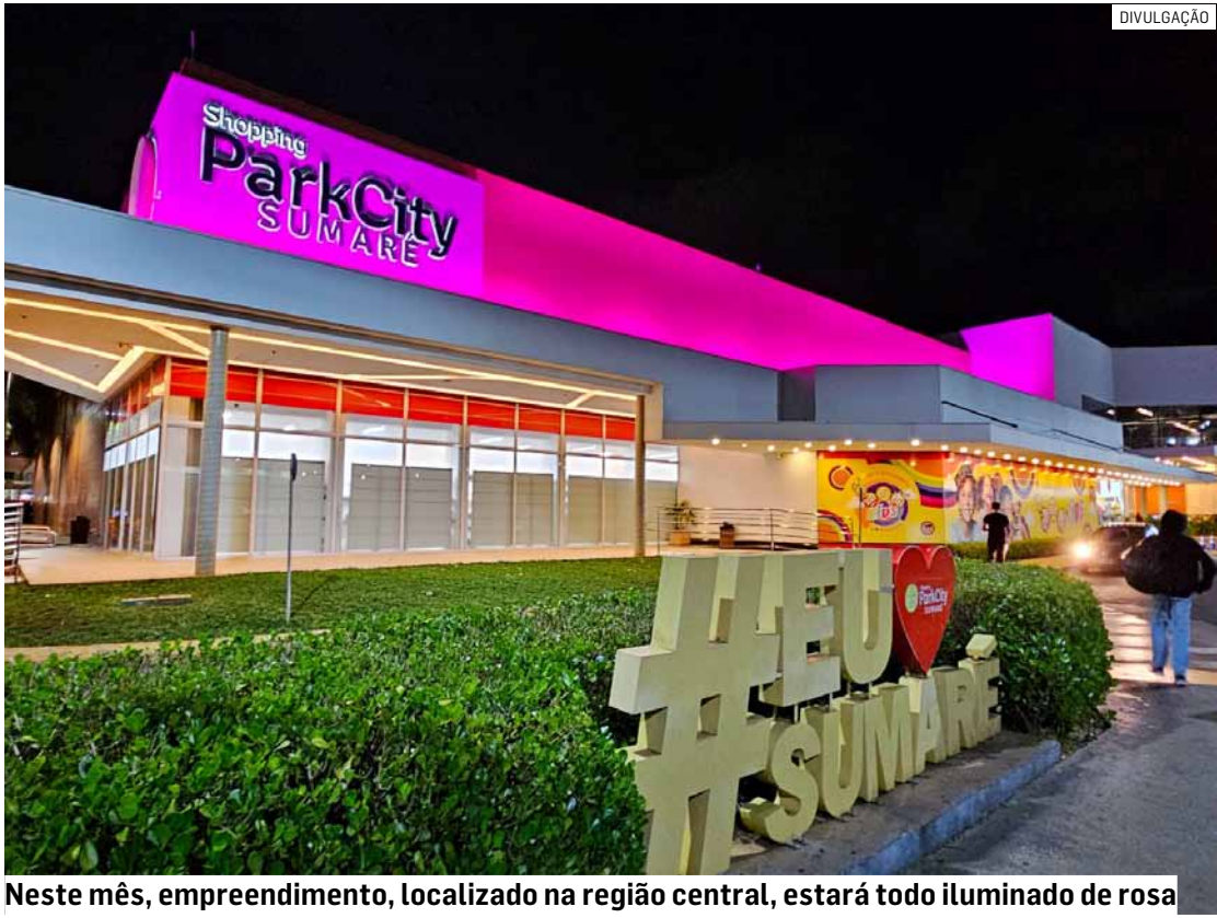
Neste mês, empreendimento, localizado na região central, estará todo iluminado de rosa

Durante todo o dia, o público poderá participar de palestras, bate-papos com histórias de superação e acolhimento, além de atendimentos e orientações voltadas à saúde da