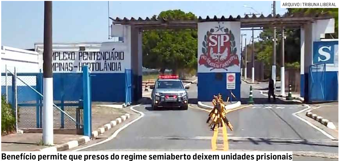
Benefício permite que presos do regime semiaberto deixem unidades prisionais

De acordo com o Sindpenal (Sindicato dos Policiais Penais do Estado de São Paulo), somente na região de Campinas e Hortolândia, cerca de 3,5 mil presos são contemplados. Já no total da região central