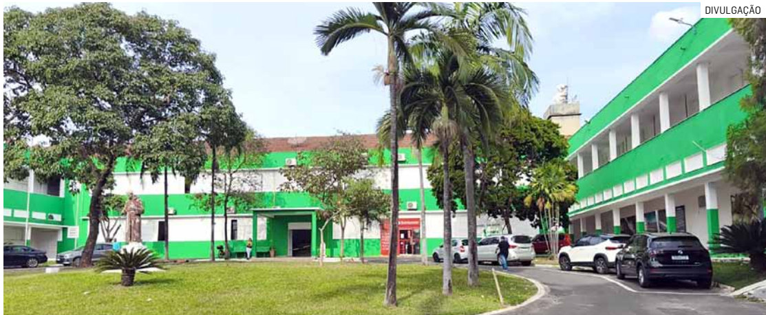
Evento abrirá espaço para debate e networking no Anfiteatro do Seminário de Nova Veneza

Além disso, o evento abrirá espaço para debate e networking entre diferentes setores, fornecendo subsídios para decisões estratégicas em investimentos, negócios e gestão pública.