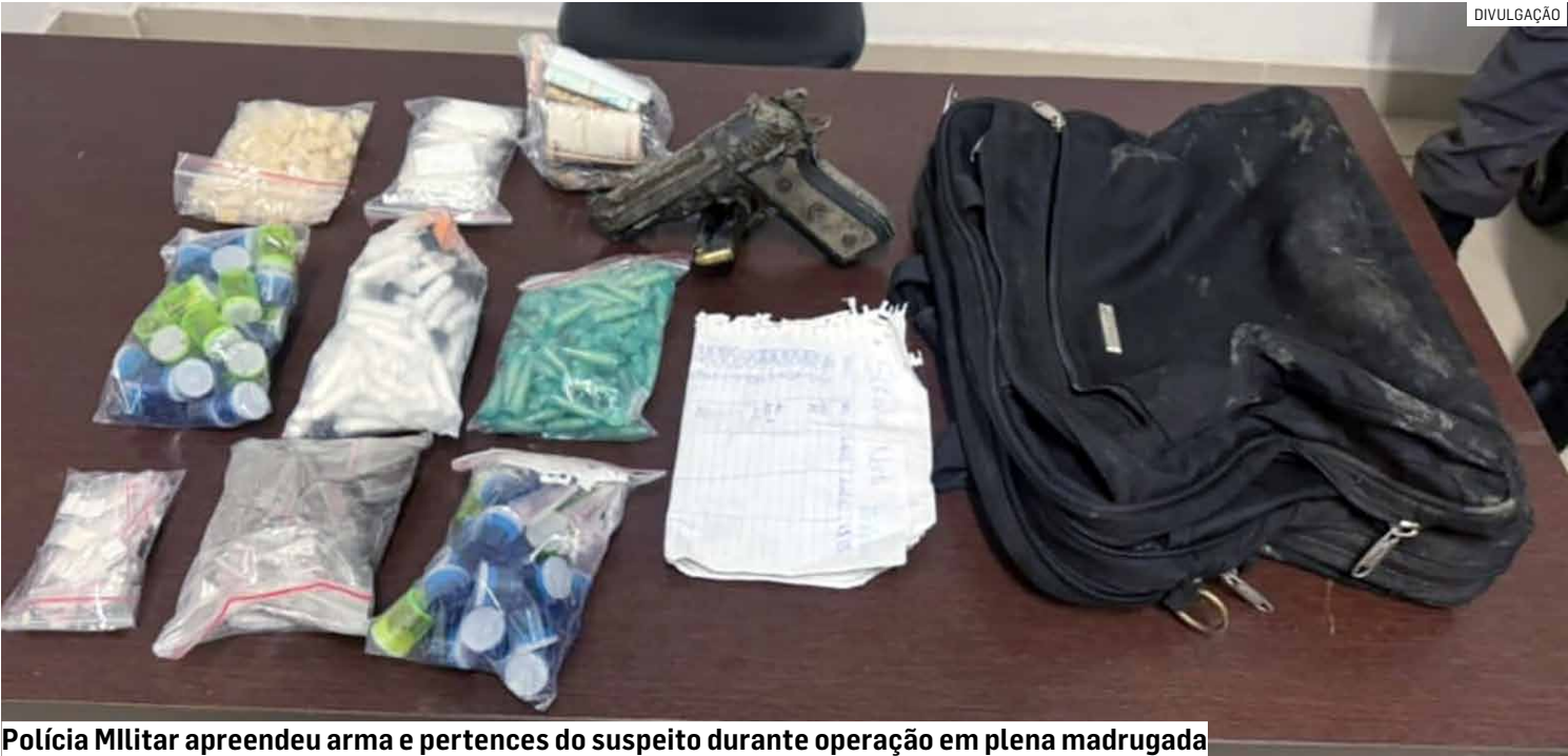
Polícia Militar apreendeu arma e pertences do suspeito durante operação em plena madrugada

Operação contra o tráfico de drogas foi deflagrada no Salerno e acusado de integrar facção criminosa reagiu à abordagem em mata e levou tiros