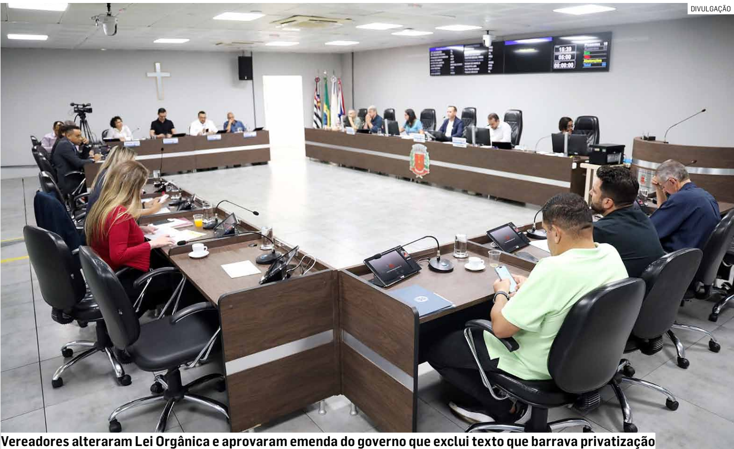
Vereadores alteraram Lei Orgânica e aprovaram emenda do governo que exclui texto que barrava privatização