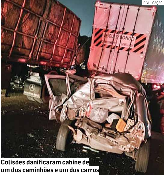
Colisões danificaram cabine de um dos caminhões e um dos carros

passeio. Apesar dos estragos, ninguém se feriu. O atendimento foi realizado por equipes de apoio, que também organizaram o tráfego no trecho. Duas faixas precisaram ser bloqueadas, causando aproximadamente dois quilômetros de congestionamento. A rodovia foi totalmente liberada por volta de 1h45 desta terça-feira (16). As circunstâncias que levaram ao engavetamento ainda não foram esclarecidas.