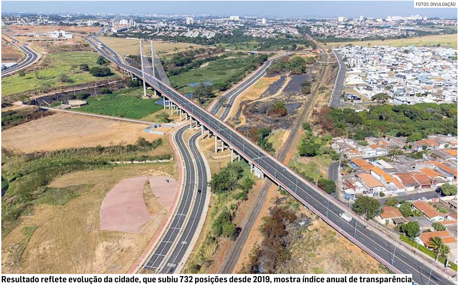
Resultado reflete evolução da cidade, que subiu 732 posições desde 2019, mostra índice anual de transparência

O ICF (Indicador da Qualidade Contábil e Fiscal) do Siconfi (Sistema de Informações Contábeis e Fiscais do Setor Público Brasileiro) leva em conta a qualidade das informações fiscais, assim como a consistência dos relatórios e demonstrativos contábeis, compartilhadas pelos municípios no exercício 2024. “Por meio dele, é possível verificar o desempenho das cidades brasileiras na aplicação dos conceitos contábeis e fiscais no envio de dados para o Tesouro Nacional, per-