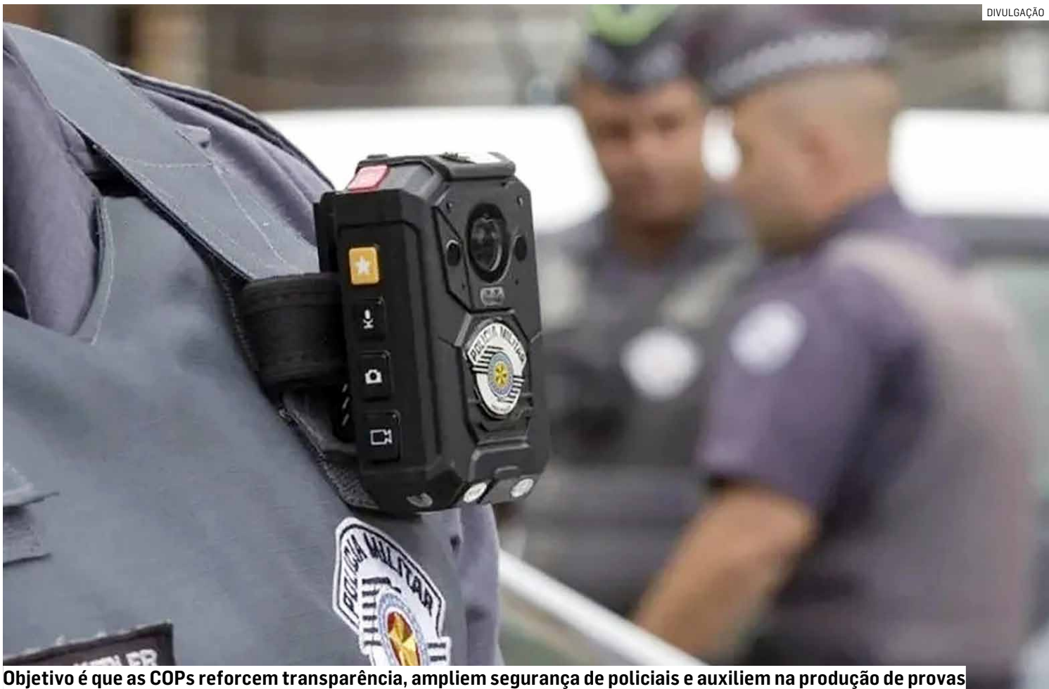
Objetivo é que as COPs reforcem transparência, ampliem segurança de policiais e auxiliem na produção de provas

As câmeras corporais, conhecidas como COPs, já são consideradas fundamentais no monitoramento da atividade policial, pois ampliam a transparência, fortalecem