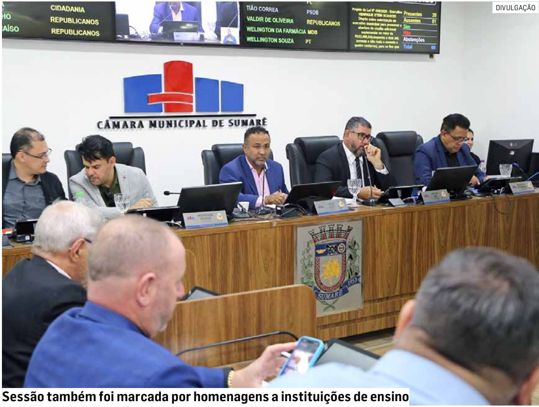
Sessão também foi marcada por homenagens a instituições de ensino