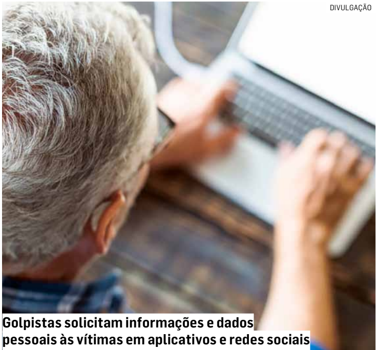
Golpistas solicitam informações e dados pessoais às vítimas em aplicativos e redes sociais