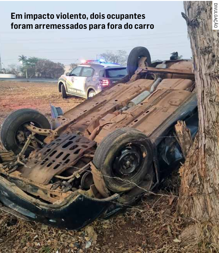
Em impacto violento, dois ocupantes foram arremessados para fora do carro

Paulo Medina • AMERICANA tribunaliberal@tribunaliberal.com.br