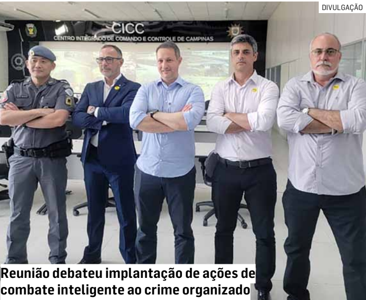
Reunião debateu implantação de ações de combate inteligente ao crime organizado