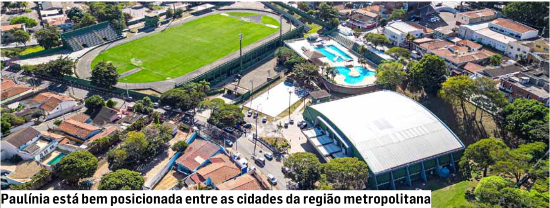
Paulínia está bem posicionada entre as cidades da região metropolitana

A nova edição do Ranking da Qualidade da Informação Contábil e Fiscal, elaborado pelo Tesouro Nacional, revelou diferentes desempenhos entre os municípios da RMC (Região Metropolitana de Campinas). Paulínia conquistou a “nota A”, assim como Sumaré e Hortolândia - as três estão no