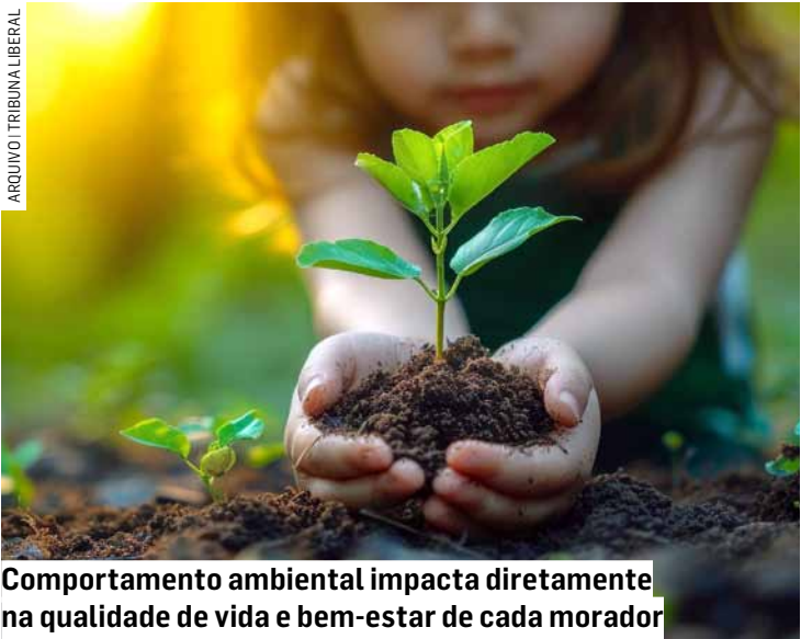
Comportamento ambiental impacta diretamente na qualidade de vida e bem-estar de cada morador

A empresa realiza rotineiramente a limpeza preventiva das redes de esgoto e encontra frequentemente nas tubulações de esgoto da cidade resíduos de construção civil e descartes de banheiro como papel higiênico, fio dental, preservativos, cabelo, cotonetes, teci-