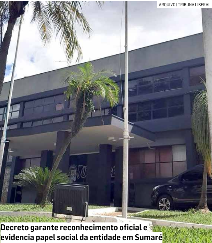
Decreto garante reconhecimento oficial e evidencia papel social da entidade em Sumaré