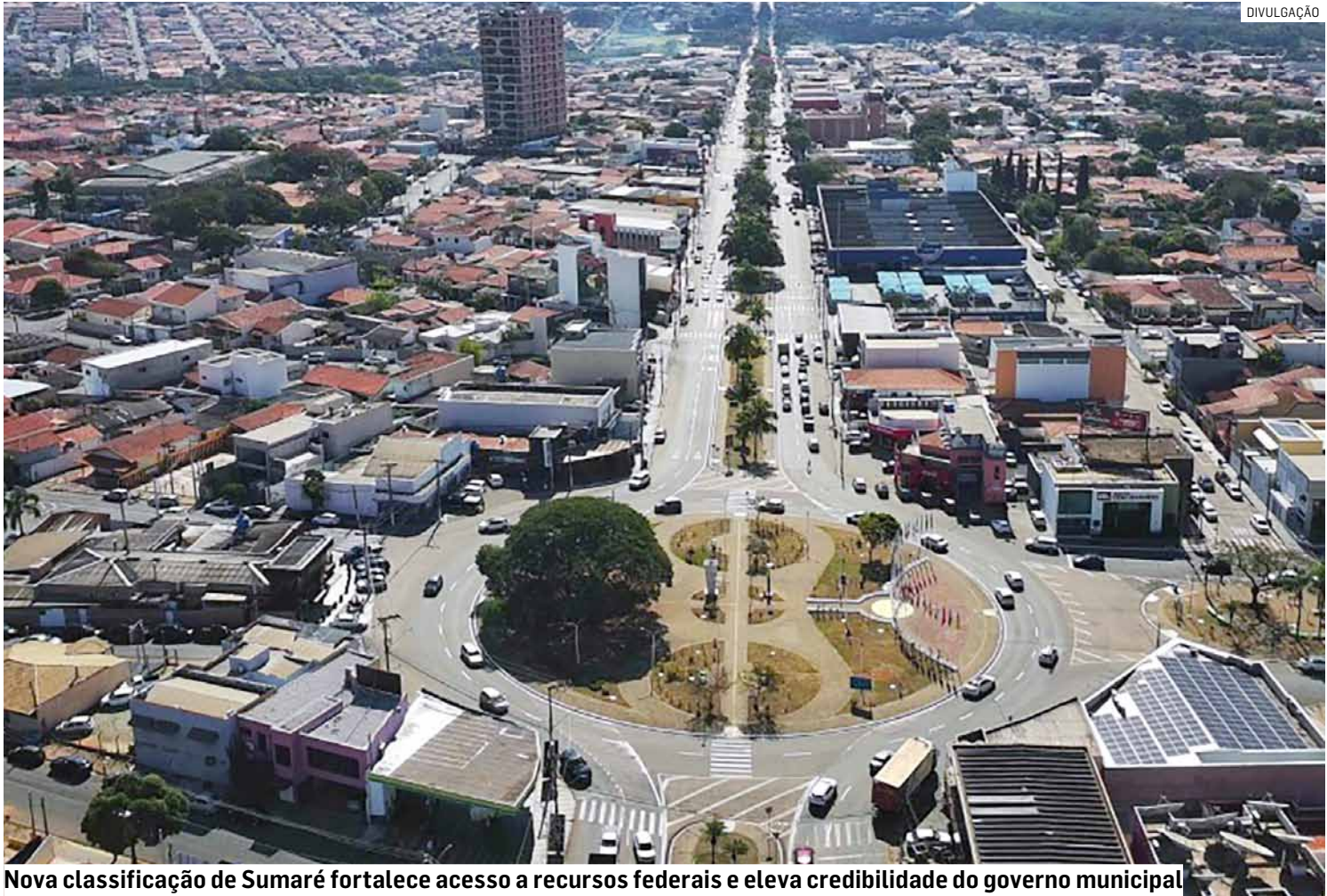
Nova classificação de Sumaré fortalece acesso a recursos federais e eleva credibilidade do governo municipal

rio municipal de Finanças, reforça o que significa a nova classificação para a gestão dos recursos. “Essa ele-