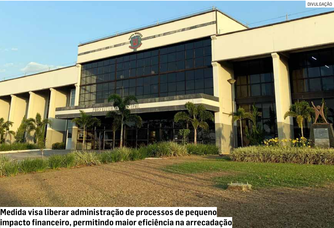
Medida visa liberar administração de processos de pequeno impacto financeiro, permitindo maior eficiência na arrecadação

Projeto eleva limite de execuções fiscais de R$ 444 para R$ 2 mil, corrigindo valor fixado em 2016; medida quer concentrar esforços na recuperação de débitos mais expressivos, diante do aumento de custos processuais