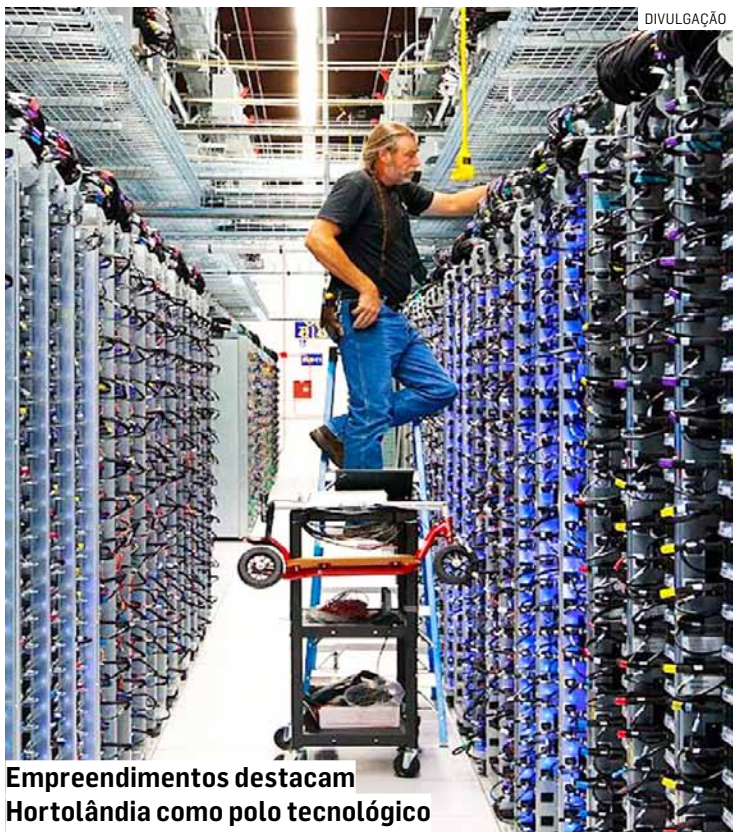
Empreendimentos destacam Hortolândia como polo tecnológico

Além disso, a Receita Federal do Brasil, em manifestações vinculantes desde 2014, também reconhece que as atividades desempenhadas por Data Centers possuem natureza de serviços e não de simples locação, sujeitando-se inclusive a tributos federais como IRRF, CIDE e PIS/Cofins-Importação. Esse posicionamento reforça a incidência do ISS na esfera municipal, de acordo com o parlamentar.