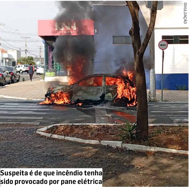
Suspeita é de que incêndio tenha sido provocado por pane elétrica

As autoridades registraram a ocorrência e reforçaram orientações sobre cuidados com veículos e prevenção de incêndios, principalmente em dias de calor intenso ou em veículos mais antigos, onde falhas elétricas podem se tornar mais frequentes.