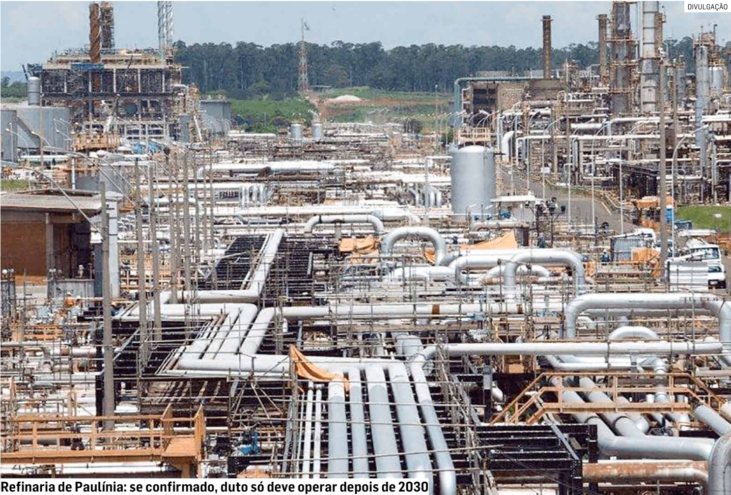
Refinaria de Paulínia: se confirmado, duto só deve operar depois de 2030