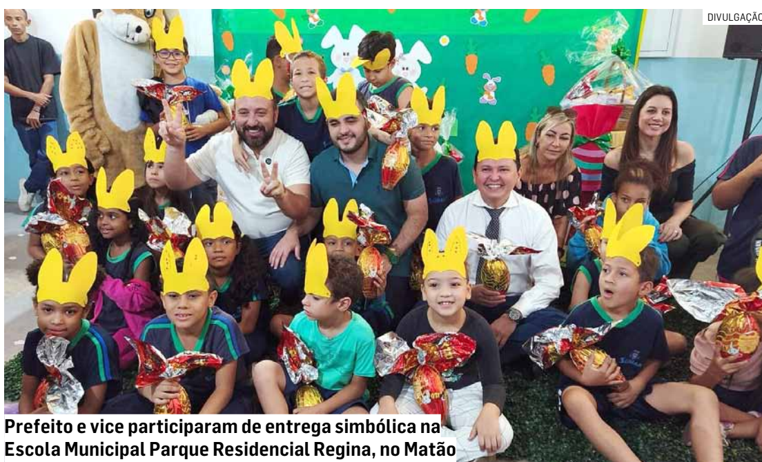
Prefeito e vice participaram de entrega simbólica na Escola Municipal Parque Residencial Regina, no Matão