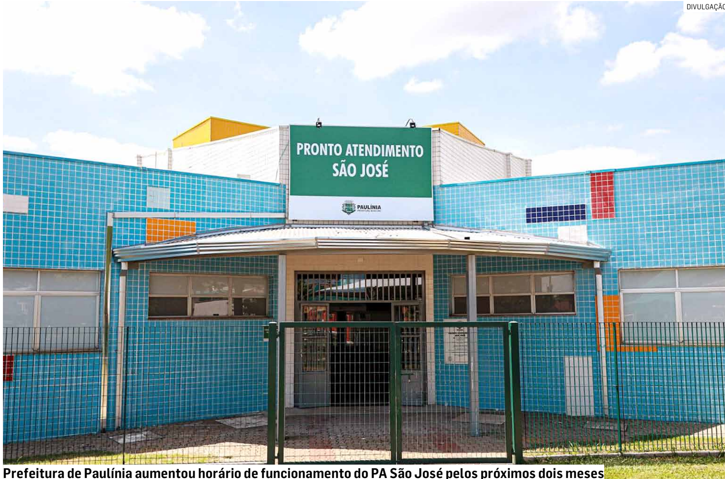
Prefeitura de Paulínia aumentou horário de funcionamento do PA São José pelos próximos dois meses

Em nota, a prefeitura manifestou solidariedade aos familiares e amigos da vítima e reafirmou o compromisso do poder público no enfrentamento à doença. A Secretaria de Saúde, por meio do Departamento de Vigilância em Saúde,