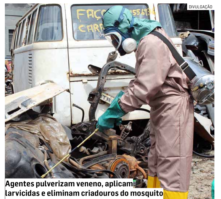
Agentes pulverizam veneno, aplicam larvicidas e eliminam criadouros do mosquito

agentes de endemias estiveram na segunda-feira (14) no Jardim Nova Terra fazendo os PE (Pontos Estratégicos), abrangendo locais propícios ao acúmulo de água, como borracharias, ferros velhos, terrenos baldios e comércios. Durante a visita, a equipe fez a pulverização de veneno e aplicação de larvicidas, bem como a destruição de criadouros do mosquito Aedes aegypti . Os proprietários receberam orientações sobre as medidas de controle do mosquito e sintomas da doença, comprometendo-se a manter o local livre de criadouros.