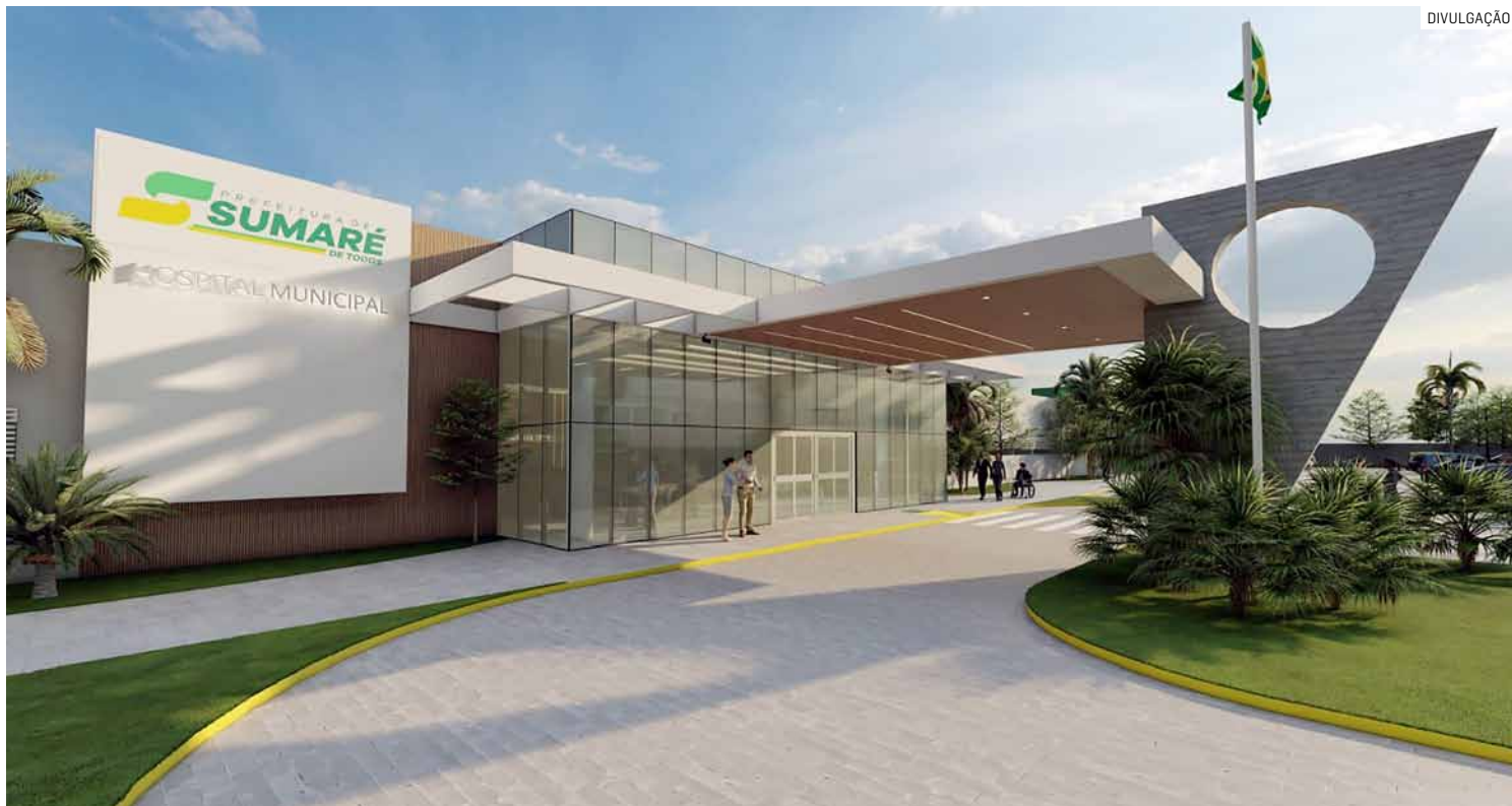
Unidade hospitalar será voltada para atendimentos de baixa e média complexidade, com estrutura moderna

A proposta é oferecer uma unidade hospitalar voltada a atendimentos de baixa e média complexidade, com estrutura moderna e funcional. Entre os principais serviços previstos estão centro cirúrgico de pequeno porte para realização de cirurgias de baixa complexidade; setor de diagnóstico por imagem e laboratório