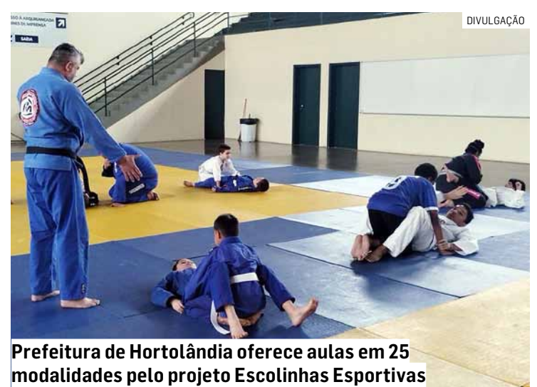
Prefeitura de Hortolândia oferece aulas em 25 modalidades pelo projeto Escolinhas Esportivas

Caso a criança ou o adolescente demonstre interesse em praticar alguma atividade física ou esportiva, a pediatra orienta fa-