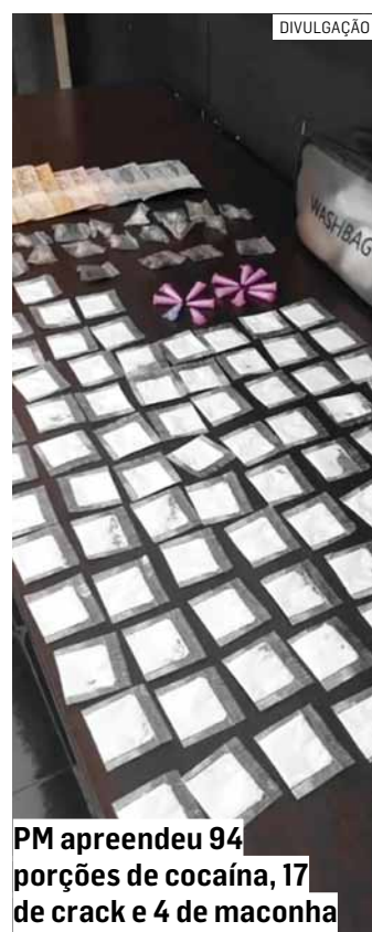
PM apreendeu 94 porções de cocaína, 17 de crack e 4 de maconha

Eles foram conduzidos à Delegacia de Polícia, onde o casal foi preso em flagrante por tráfico de drogas e associação para o tráfico. O homem que estava comprando entorpecente foi ouvido e liberado.