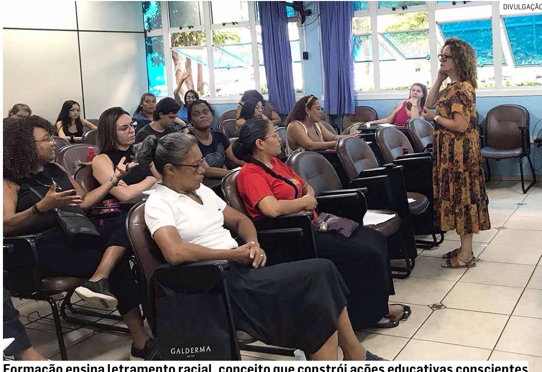
Formação ensina letramento racial, conceito que constrói ações educativas conscientes

A fim de fomentar uma educação pública mais inclusiva e comprometida com os direitos humanos e o enfrentamento ao racismo estrutural, a Prefeitura de Hortolândia promove, de abril a junho deste ano, a formação continuada “Letramento Racial – Desafios e Possibilidades na Formação e nas Práticas do Educador Antirracista”. O curso, iniciado neste mês, beneficia diretamente 60 profissionais da rede municipal de ensino – professores, educadores infantis e infantojuvenis, gestores escolares e integrantes da equipe pedagógica do CFPF (Centro de Formação dos Profissionais em Educação) “Paulo Freire”, além de convidados como membros do Instituto Federal São Paulo, do Conselho Municipal de Promoção da Igualdade Racial e de algumas escolas estaduais.