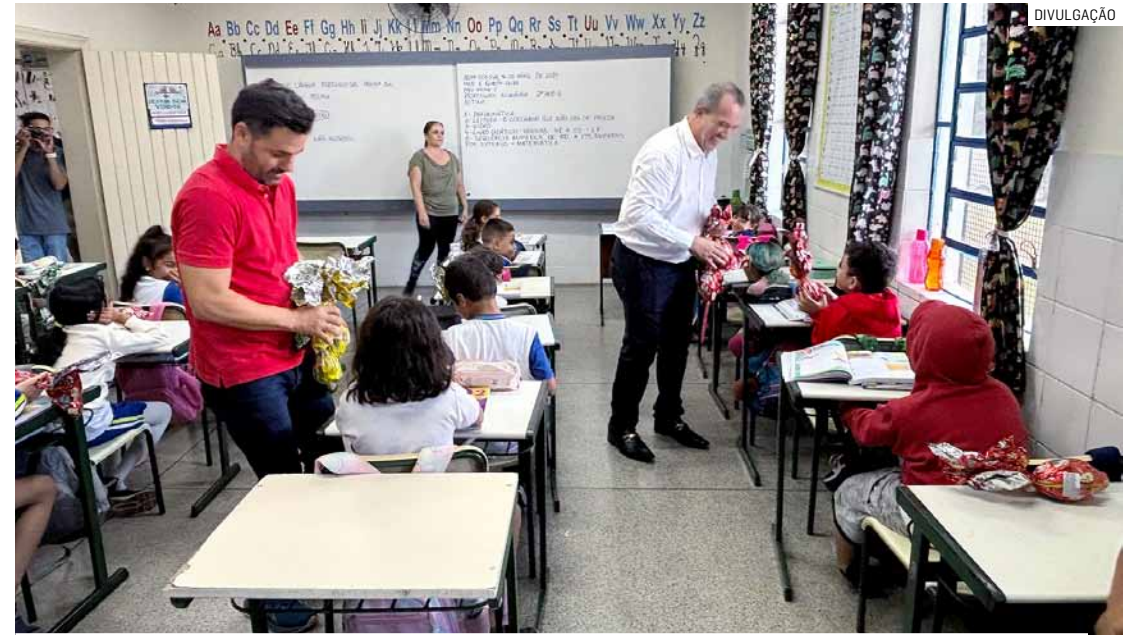
Iniciativa anual visa garantir que todas as crianças vivam experiência de celebrar Páscoa

"Ver o brilho nos olhos das nossas crianças quan-