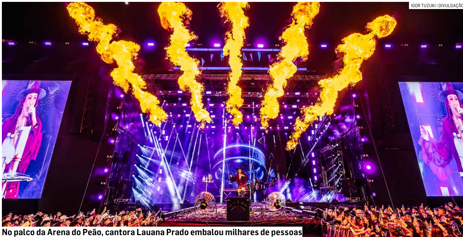
No palco da Arena do Peão, cantora Lauana Prado embalou milhares de pessoas

A presença e interesse da imprensa foi destaque na