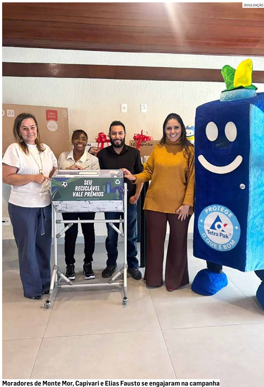
Moradores de Monte Mor, Capivari e Elias Fausto se engajaram na campanha

Ação do Programa Recicla Cidade Consimares, em parceria com a Associação Espaço Urbano e a Tetra Pak, premiou participantes da região e apresentou avanços na coleta seletiva, educação ambiental e em políticas de sustentabilidade