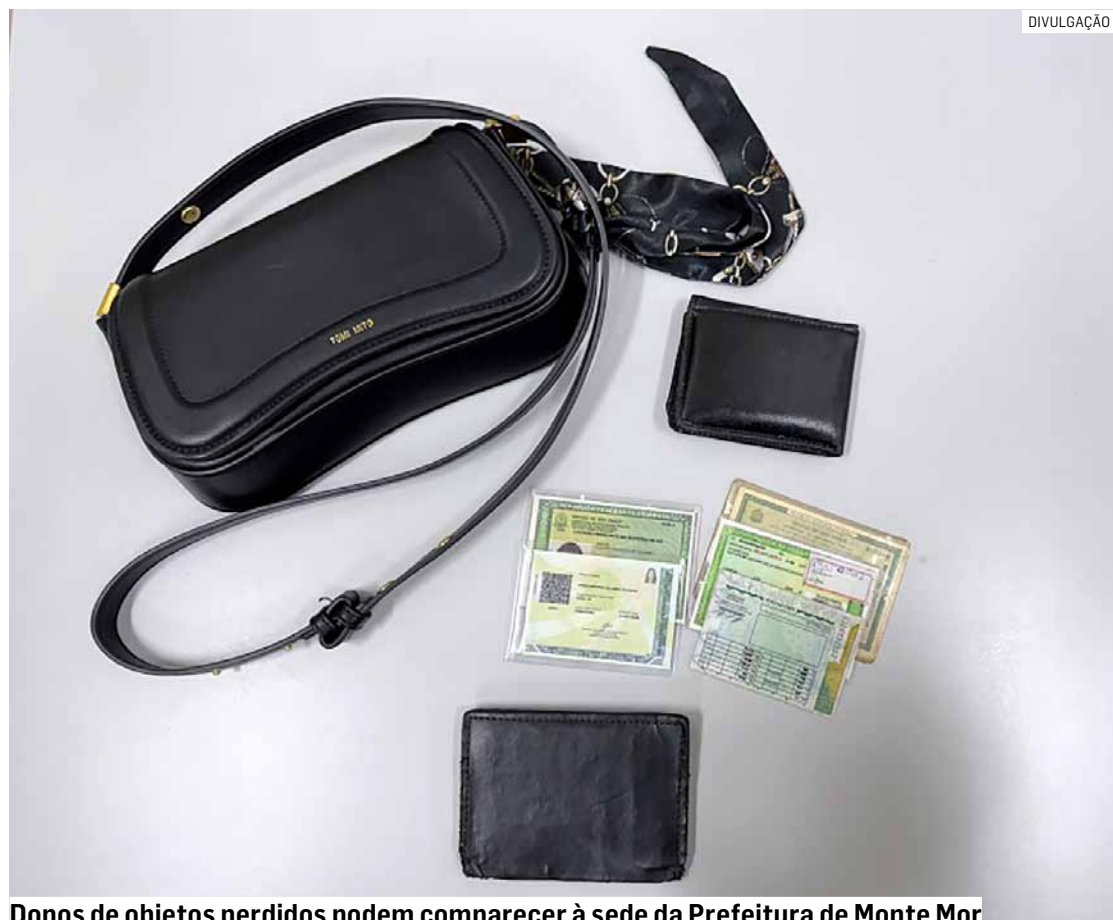
Donos de objetos perdidos podem comparecer à sede da Prefeitura de Monte Mor

A prefeitura reforça a importância de que os cidadãos que perderam pertences durante a Festa do Peão 2026 procurem o setor responsável para realizar a identificação e retirada dos objetos.