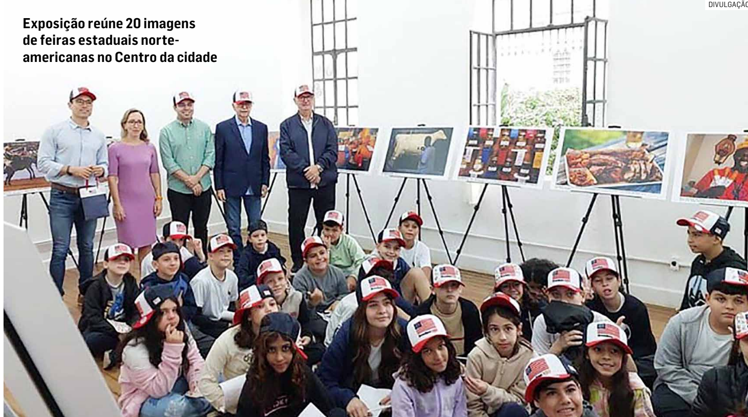
Exposição reúne 20 imagens de feiras estaduais norte-americanas no Centro da cidade

“É um prazer muito grande estar aqui com vocês, as crianças que aqui estão representam todos nossos estudantes e são motivo de muito orgulho para nós. Estou muito feliz com a parceria e pelo momento vivido. A história de Americana passa pe-