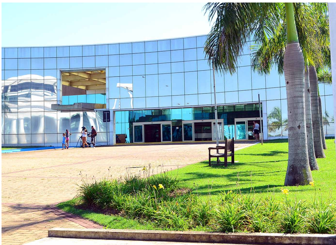
Medidas administrativas reforçam investimentos em áreas estratégicas como saúde, educação, esporte e infraestrutura

Os exames de imagem visam a identificação de