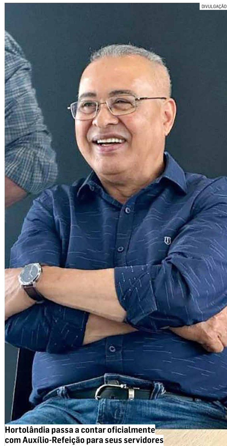
Hortolândia passa a contar oficialmente com Auxílio-Refeição para seus servidores

A lei também prevê que os valores do benefício poderão ser reajustados futuramente por meio de legislação específica, observando, no mínimo, a correção inflacionária aplicada aos vencimentos dos servidores. As despesas para implantação do programa correrão por conta de dotações orçamentárias próprias do município.