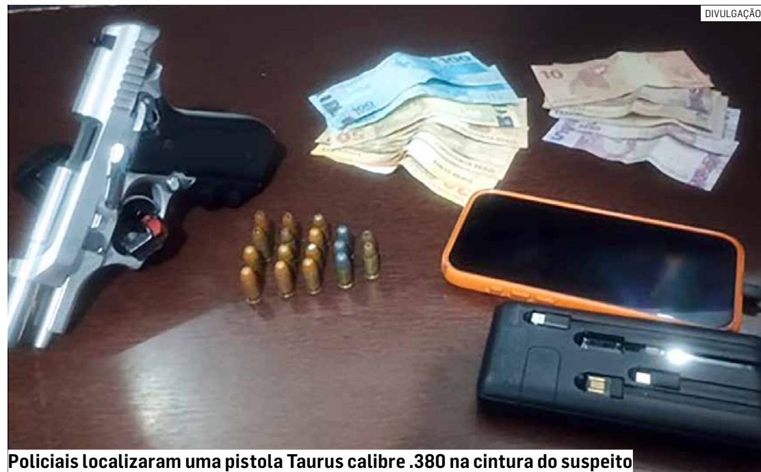
Policiais localizaram uma pistola Taurus calibre .380 na cintura do suspeito

César Oliveira • HORTOLÂNDIA tribunaliberal@tribunaliberal.com.br