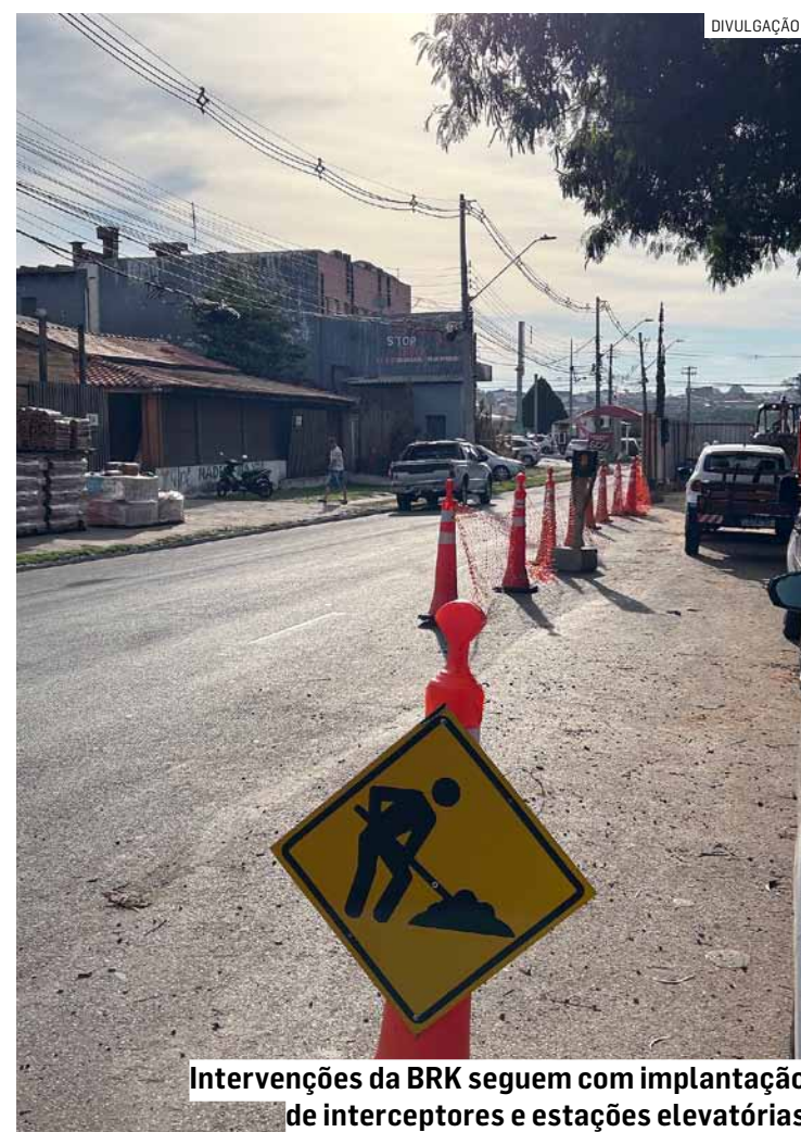
Intervenções da BRK seguem com implantação de interceptores e estações elevatórias

Em caso de dúvidas, os clientes podem entrar em contato com a concessionária pelo telefone 0800 771 0001, que funciona 24 horas por dia. Também é possível falar com a BRK pelo WhatsApp (11) 9 9988-0001, de segunda a sexta-feira, das 8h às 20h.