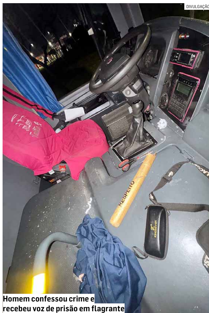
Homem confessou crime e recebeu voz de prisão em flagrante

A autoridade policial ratificou a prisão em flagrante pelo crime de furto de veículo. O suspeito permaneceu detido e ficou à disposição da Justiça.