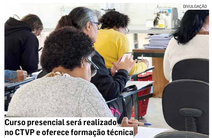
Curso presencial será realizado no CTVP e oferece formação técnica

A iniciativa integra as ações da prefeitura voltadas à qualificação profissional e à ampliação das oportunidades de inserção e permanência no mercado de trabalho, oferecendo formação gratuita e de qualidade para a população.