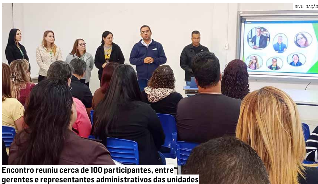
Encontro reuniu cerca de 100 participantes, entre gerentes e representantes administrativos das unidades

Durante a atividade, a equipe do RH da Saúde apresentou o conjunto de ações para aprimorar a organização do trabalho e garantir maior eficiência na gestão de pessoas. Entre os temas abordados estiveram o monitoramento sistemático dos saldos de férias, a comunicação ativa com servidores e chefias e o planejamento escalonado do período de férias, construído em conjunto com as unidades.