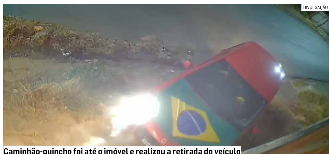
Caminhão-guincho foi até o imóvel e realizou a retirada do veículo

Apesar dos danos causados ao muro da residência, não houve informações sobre pessoas feridas. As circunstâncias da colisão deverão ser esclarecidas.