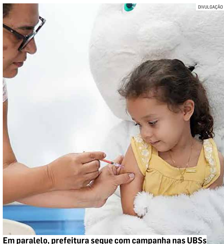
Em paralelo, prefeitura segue com campanha nas UBSS