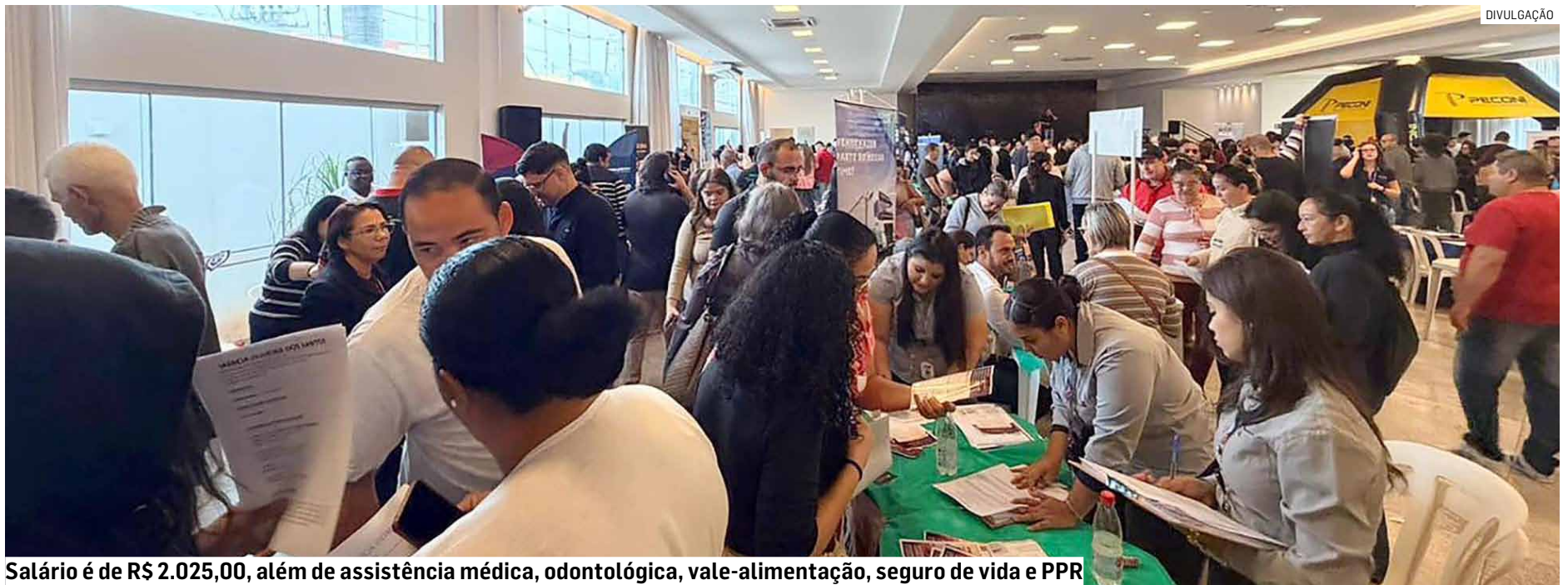
Salário é de R$ 2.025,00, além de assistência médica, odontológica, vale-alimentação, seguro de vida e PPR

O cargo oferece salário de R$ 2.025,00, além de um pacote de benefícios que inclui refeição no local, assistência médica e odontológica Bradesco, seguro de vida, vale-alimentação no valor de R$ 265,00, participação nos resultados (PPR) e auxílio-creche para filhos de até cinco anos.