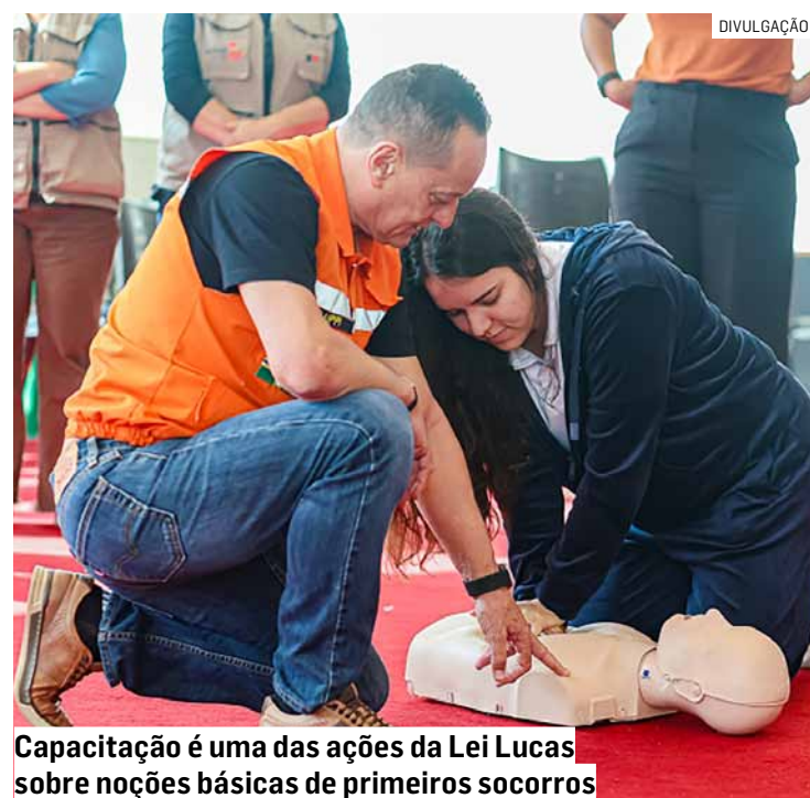
Capacitação é uma das ações da Lei Lucas sobre noções básicas de primeiros socorros