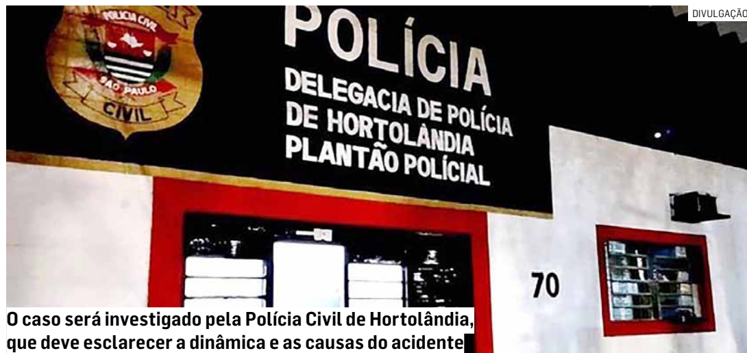
O caso será investigado pela Polícia Civil de Hortolândia, que deve esclarecer a dinâmica e as causas do acidente

César Oliveira • HORTOLÂNDIA tribunaliberal@tribunaliberal.com.br