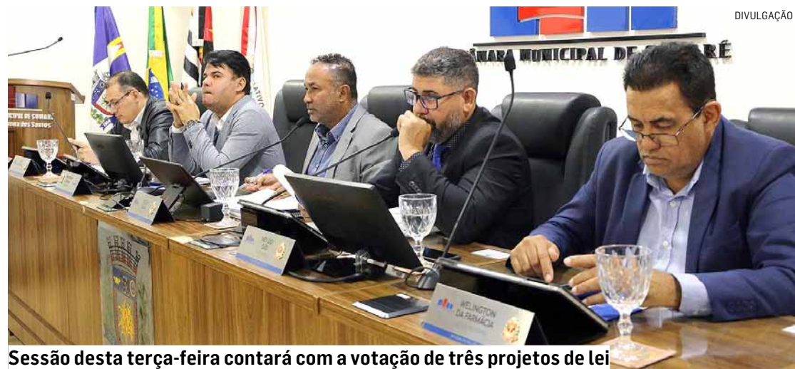
Sessão desta terça-feira contará com a votação de três projetos de lei

Os vereadores de Sumaré analisam e votam três projetos de lei durante a sessão ordinária desta terça-feira (16). A reunião está marcada para as 10h, no plenário José Maria Matosinho, e será transmitida ao vivo pelo canal da Câmara Municipal no YouTube.