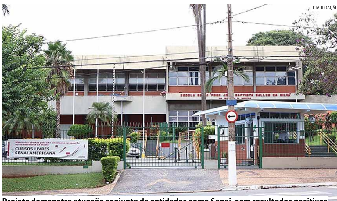
Projeto demonstra atuação conjunta de entidades como Senai, com resultados positivos

A Prefeitura de Americana, por meio da Secretaria de Desenvolvimento Econômico, apoia a realização da segunda edição do Inovatex, o Programa de Inovação e Tecnologia da Indústria Têxtil e Confeção de Americana e Região. O lançamento será na quinta-feira (18), às 18h, no Senai Americana (Avenida Brasil, nº 2.801, Parque Residencial Nardini). O evento tem realização do Sebrae-SP, Sindicato das Indústrias Têxteis de Americana e Região (Sinditec) e Senai, com apoios também do Ciesp Americana e da Acia.