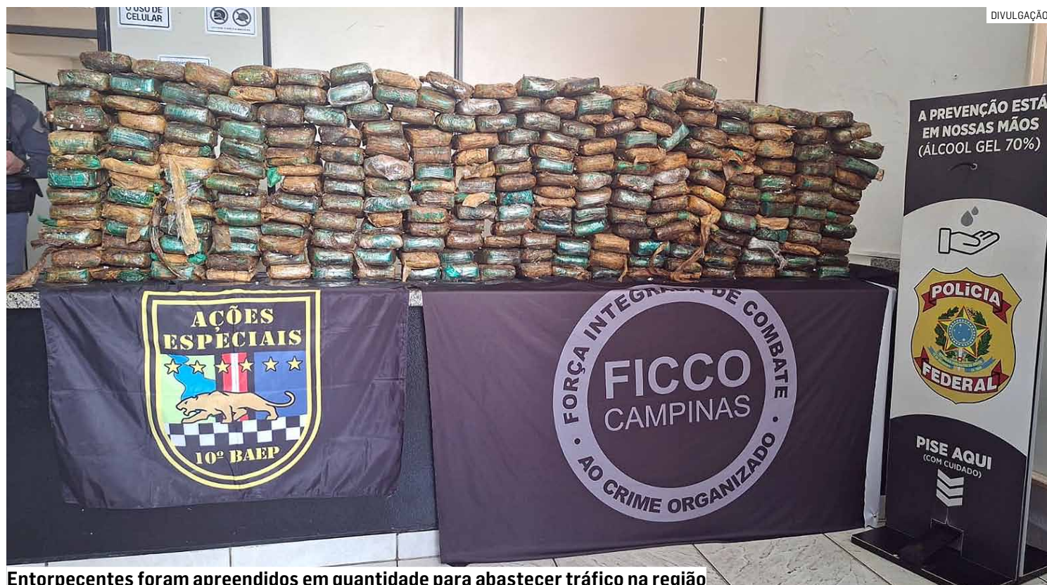
Entorpecentes foram apreendidos em quantidade para abastecer tráfico na região

Durante as buscas, os agentes encontraram 14 colchões. Dentro deles