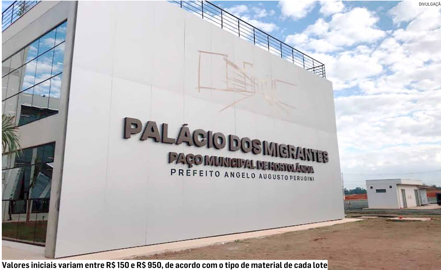
Valores iniciais variam entre R$ 150 e R$ 950, de acordo com o tipo de material de cada lote

Prefeitura promove no dia 11 de maio, às 13h, leilão para venda de bens móveis considerados inutilizados pela administração; ao todo, serão ofertados 10 lotes