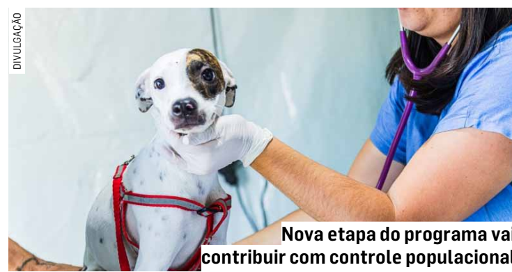
Nova etapa do programa vai contribuir com controle populacional

Segundo a prefeitura, apenas animais saudáveis, não obesos e com idade entre 4 meses e 7 anos poderão passar pelo procedimento. A medida busca garantir mais segurança durante as cirurgias e atender os critérios técnicos do programa.