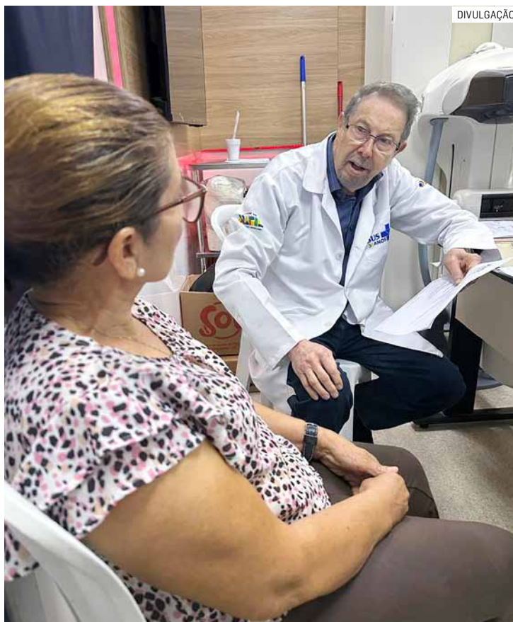
Carreta atenderá na Praça Comendador Müller até esta sexta

O sentimento foi compartilhado por outras duas