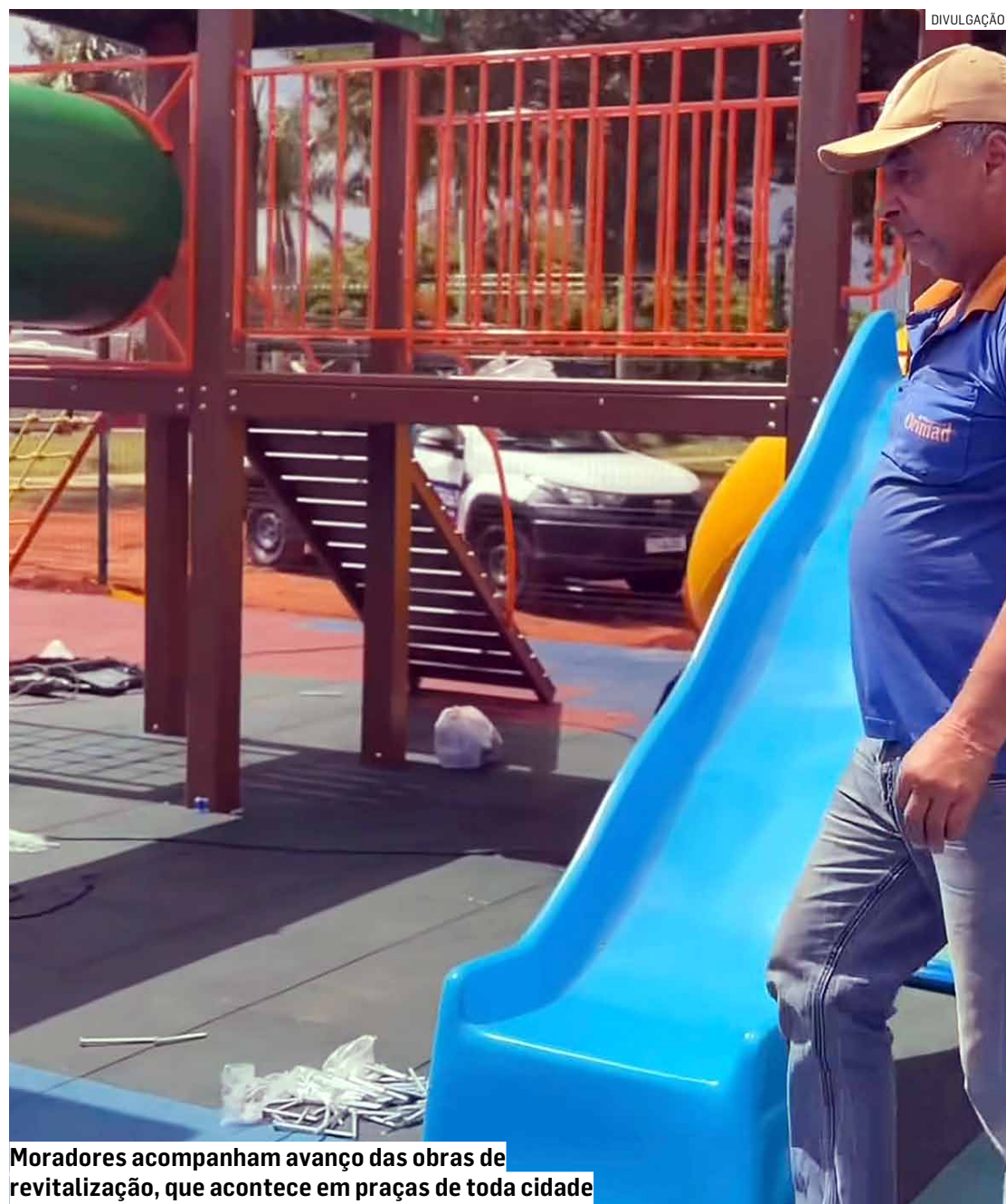
Moradores acompanham avanço das obras de revitalização, que acontece em praças de toda cidade

O portal de entrada de Sumaré também foi totalmente revitalizado. O espaço passou por serviços de pintura, limpeza, modernização da iluminação e ganhou um novo letreiro.