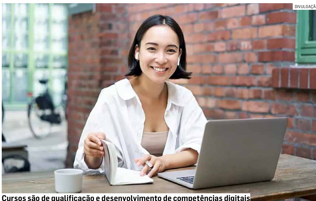
Cursos são de qualificação e desenvolvimento de competências digitais

Ao longo do último ano, a colaboração entre as duas instituições possibilitou a ampliação do acesso a conteúdos formativos inovadores, beneficiando centenas de moradores do município. Com a renovação do acordo, o Capacita-te Brasil se consolida como uma fer-