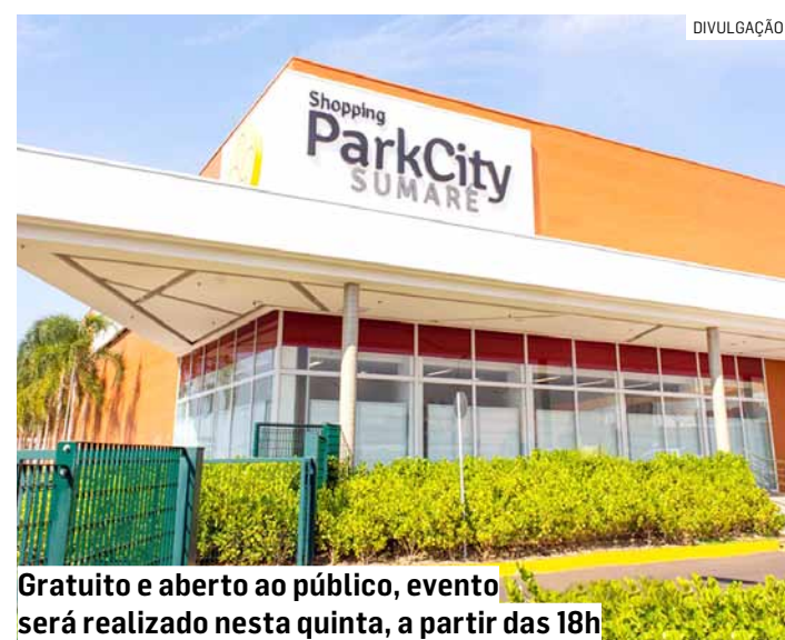
Gratuito e aberto ao público, evento será realizado nesta quinta, a partir das 18h