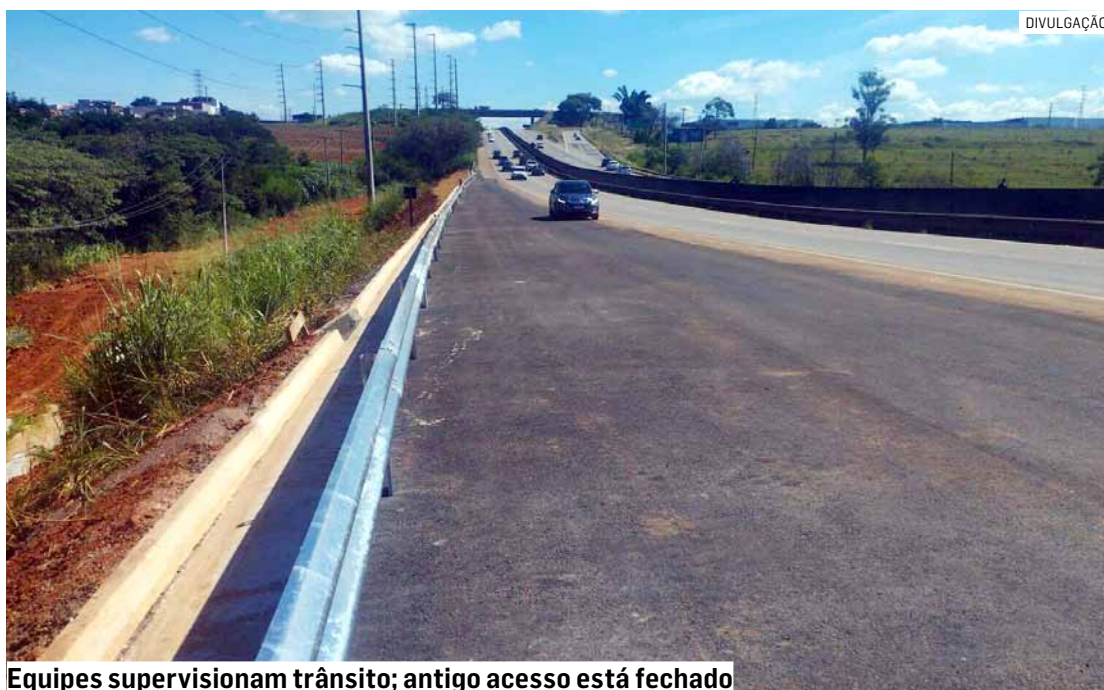
Equipes supervisionam trânsito; antigo acesso está fechado

“Esta nova entrada ao Jardim Rosolem garante maior segurança viária para os motoristas, aumentando a fluidez do tráfego, evitando pontos de congestionamentos no acesso ao bairro, principalmente em momentos de maior movimento. Pedimos atenção aos motoristas e a colaboração ao utilizar o dispositivo, conduzindo dentro do limite de velocidade permitido. O antigo acesso está permanentemente fechado”, explica o diretor