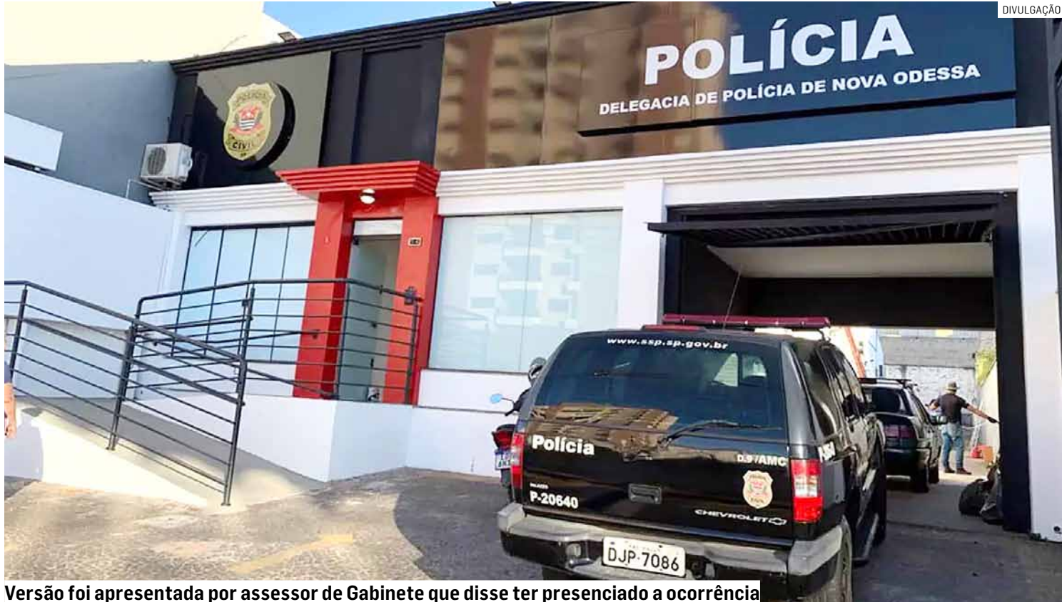
Versão foi apresentada por assessor de Gabinete que disse ter presenciado a ocorrência

Ainda segundo a versão apresentada à polícia,