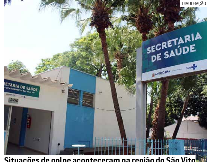
Situações de golpe aconteceram na região do São Vito

Diante da situação, a orientação é para que moradores não permitam a entrada de desconhecidos e, em caso de abordagem suspeita, entrem em contato com a unidade de saúde de referência ou com a Secretaria de Saúde pelo telefone (19) 3472-9350 e acionem as autoridades policiais.