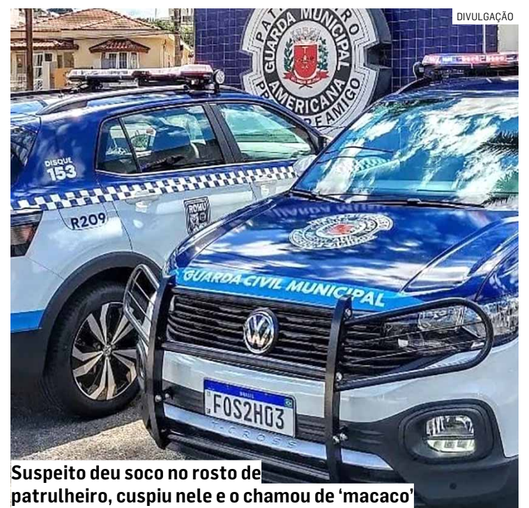
Suspeito deu soco no rosto de patrulheiro, cuspiu nele e o chamou de 'macaco'

O suspeito permaneceu preso e foi autuado pelos crimes de preconceito racial, desobediência, resistência, injúria e prática de ato obsceno.