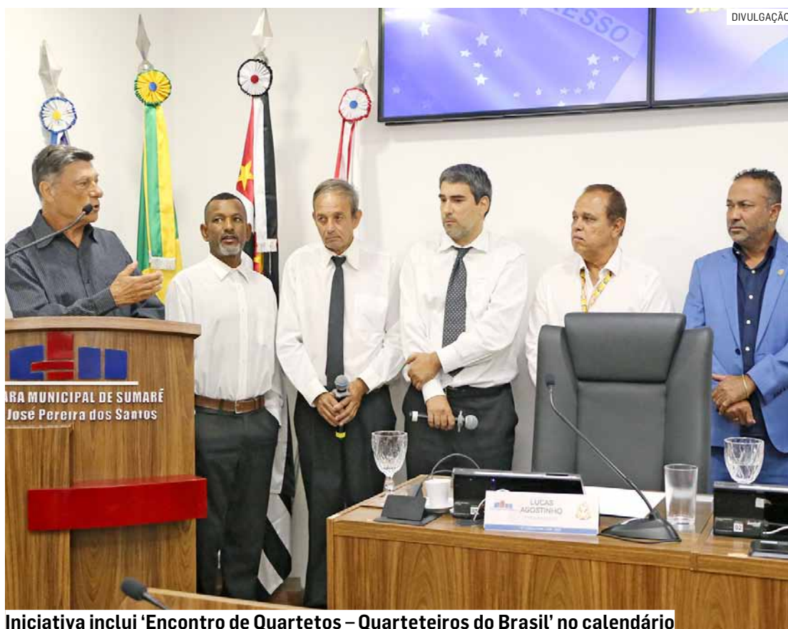
Iniciativa inclui 'Encontro de Quartetos - Quarteteiros do Brasil' no calendário