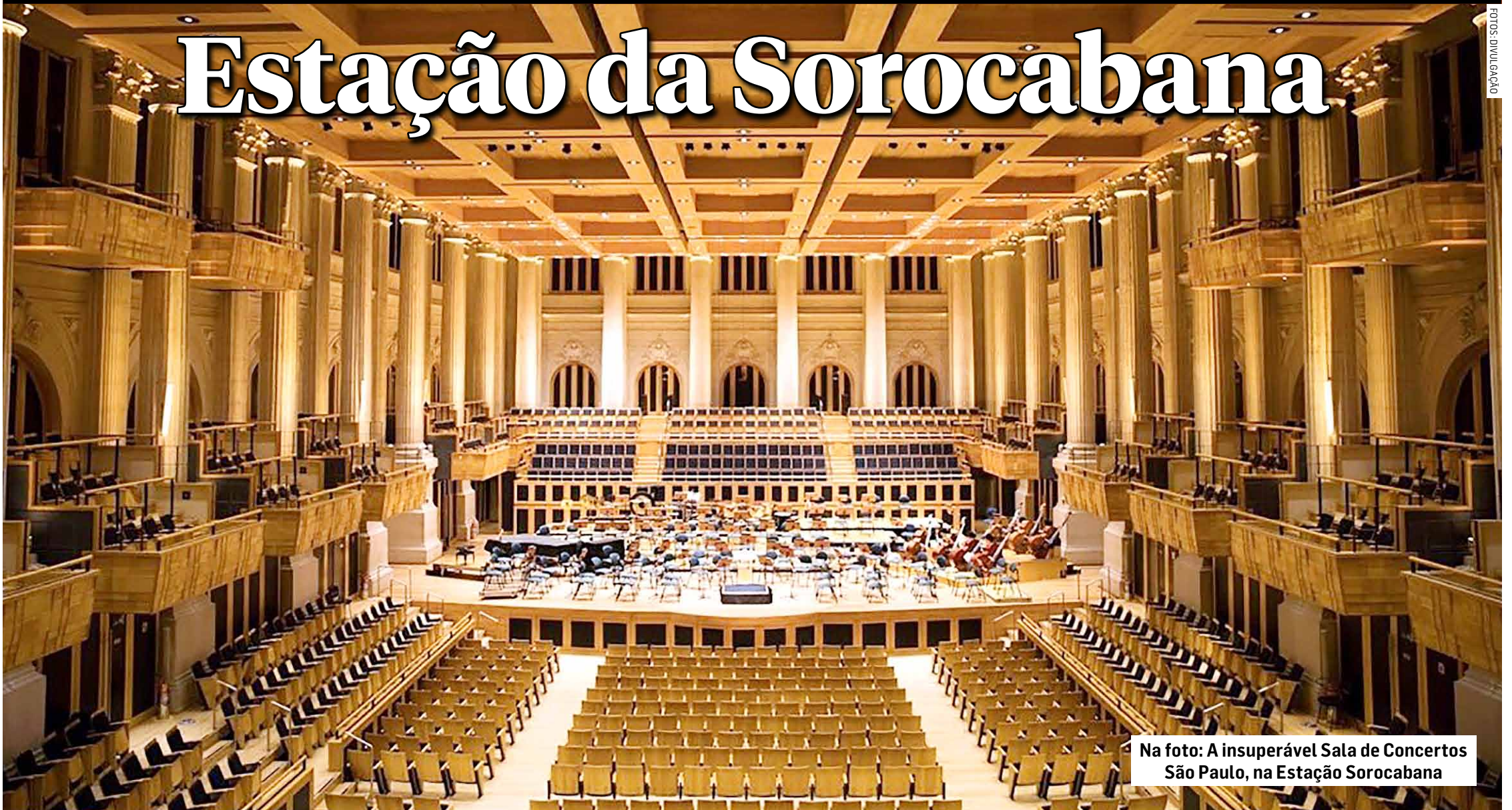
Na foto: A insuperável Sala de Concertos São Paulo, na Estação Sorocabana

Dessa forma sempre foi conhecida a antiga Estação Júlio Prestes, um edifício projetado pelo arquiteto Christiano Stockler das Neves e construído pela Estrada de Ferro Sorocabana entre 1925 e 1938. Hoje, a Estação Júlio Prestes faz parte de uma das linhas da Companhia Paulista de Trens Metropolitanos, e continua bonita e imponente nas proximidades da famosa Estação da Luz. A Secretaria de Cultura do Estado de São Paulo foi também instalada naquele edifício. Em 1999 ali foi inaugurada a chamada “Sala São Paulo” um local de concertos da Orquestra Sinfônica do Estado de São Paulo, a qual é considerada uma das melhores da América Latina. A “Sala São Paulo” é um dos cartões postais da capital paulistana.