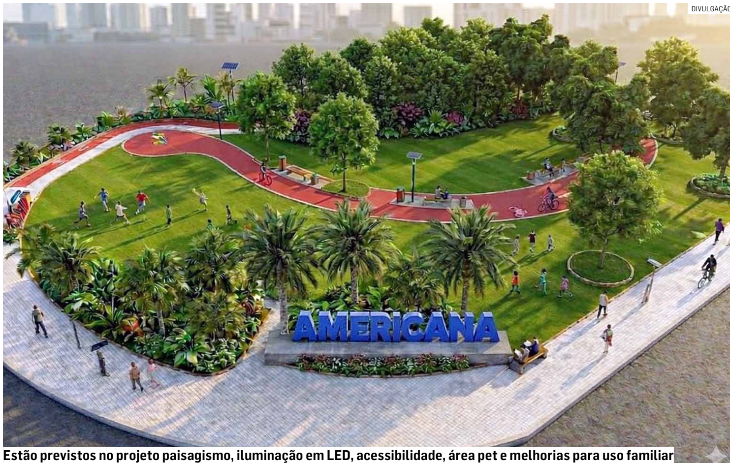
Estão previstos no projeto paisagismo, iluminação em LED, acessibilidade, área pet e melhorias para uso familiar

A nova praça será construída na área central da Avenida Chalil Miguel Onsi. O espaço receberá instalação de quadra poliesportiva, campo de futebol society, quadras de areia,