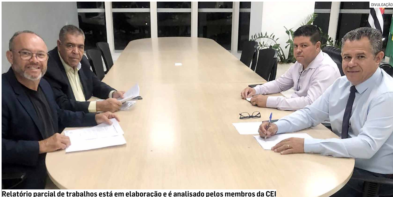
Relatório parcial de trabalhos está em elaboração e é analisado pelos membros da CEI

A comissão investiga possíveis irregularida-