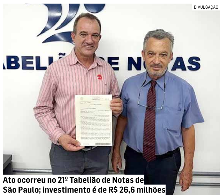
Ato ocorreu no 21º Tabelião de Notas de São Paulo; investimento é de R$ 26,6 milhões