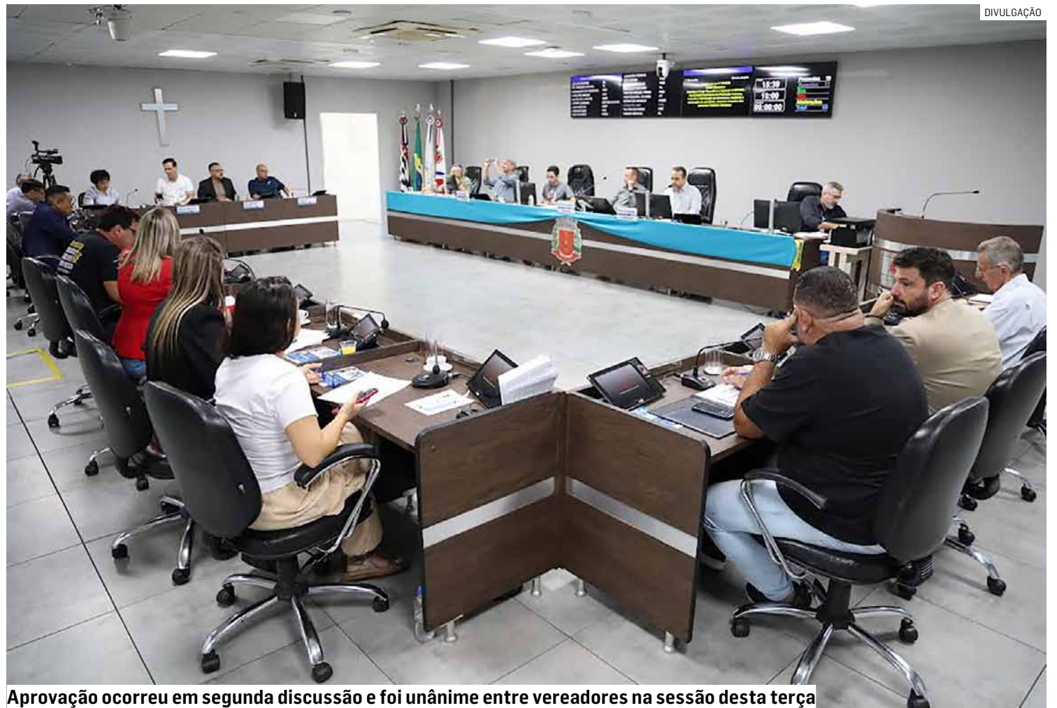
Aprovação ocorreu em segunda discussão e foi unânime entre vereadores na sessão desta terça

Além da confirmação do aumento, a sessão também foi marcada pela votação de diversos projetos. Os parlamentares aprovaram ações voltadas à inclusão de pessoas com Transtorno do Espectro Autista (TEA), como a dispensa do uso de uniforme escolar em casos de sensibilidade sensorial e a vacinação domiciliar para