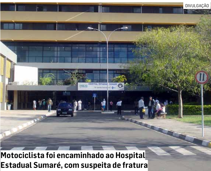
Motociclista foi encaminhado ao Hospital Estadual Sumaré, com suspeita de fratura

Enquanto o condutor do Fiesta tentava sinalizar o local, uma motocicleta que seguia no mesmo sentido colidiu na traseira do carro e o motociclista foi ar-