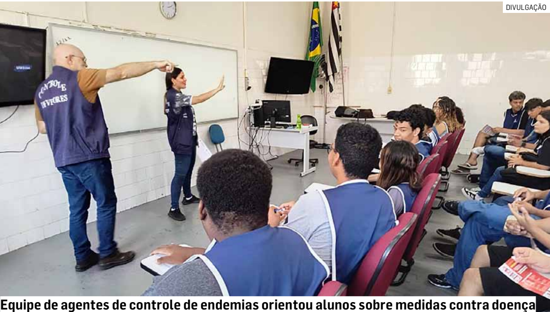
Equipe de agentes de controle de endemias orientou alunos sobre medidas contra doença

cola Municipal Professor Lázaro Gonçalves Teixeira. O Governo de São Paulo está promovendo até esta sexta-feira (14) uma semana de intensificação das ações, com mutirões de limpeza, visitas casa a casa e orientação à população nos 645 municípios paulistas. A Secretaria Estadual de Saúde alerta para o risco de expansão da doença em razão das mudanças climáticas, como aumento das temperaturas e das chuvas, que favorecem a reprodução do mosquito.