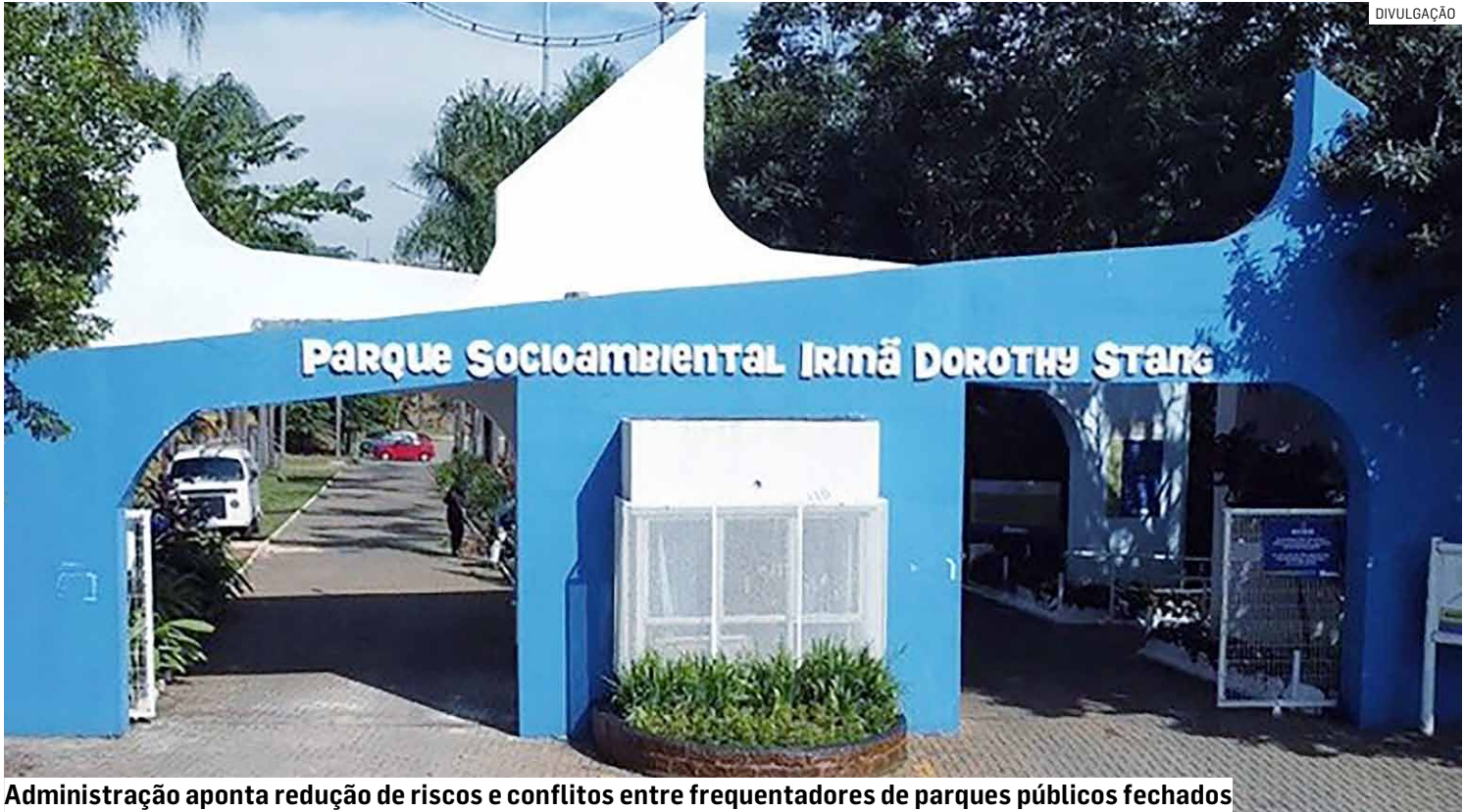
Administração aponta redução de riscos e conflitos entre frequentadores de parques públicos fechados

De acordo com o texto aprovado, ficam proibidos em parques públicos fechados bicicletas motorizadas, ciclomotores, patinetes elétricos e monociclos elétricos. O descumprimento da norma acarretará em multa de 50 Unidades Fiscais do Município de Hortolândia (R$ 237,50), valor que será dobrado em caso de reincidência. A fiscalização ficará a car-