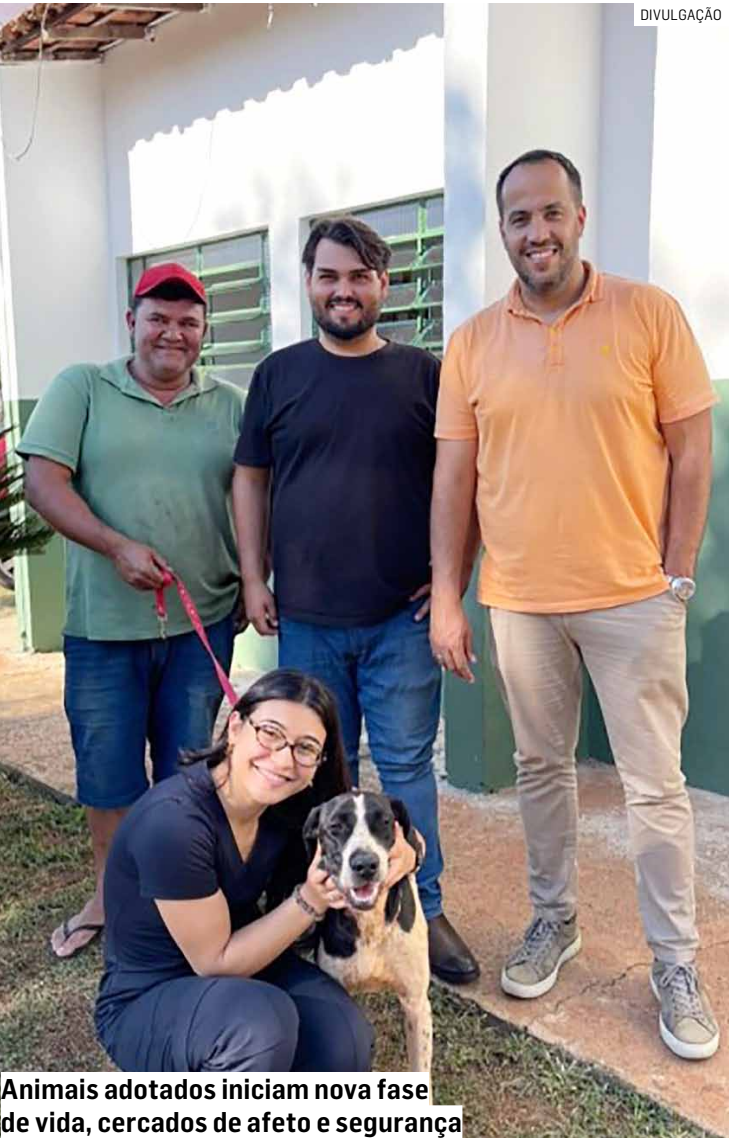
Animais adotados iniciam nova fase de vida, cercados de afeto e segurança