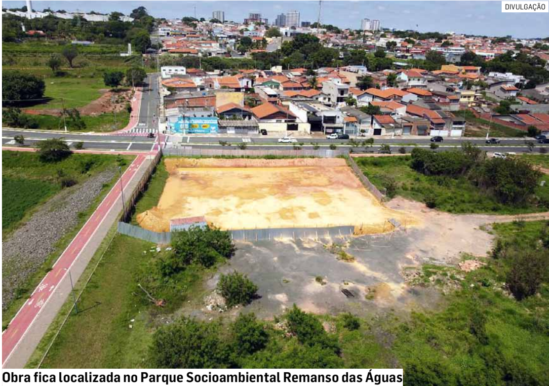
Obra fica localizada no Parque Socioambiental Remanso das Águas

O investimento é de aproximadamente R$ 640 mil, fruto de emenda parlamentar do deputado federal Nito Tatto. De acor-