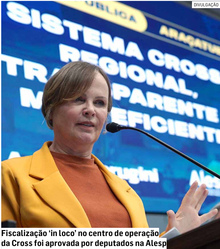
Fiscalização 'in loco' no centro de operação da Cross foi aprovada por deputados na Alesp