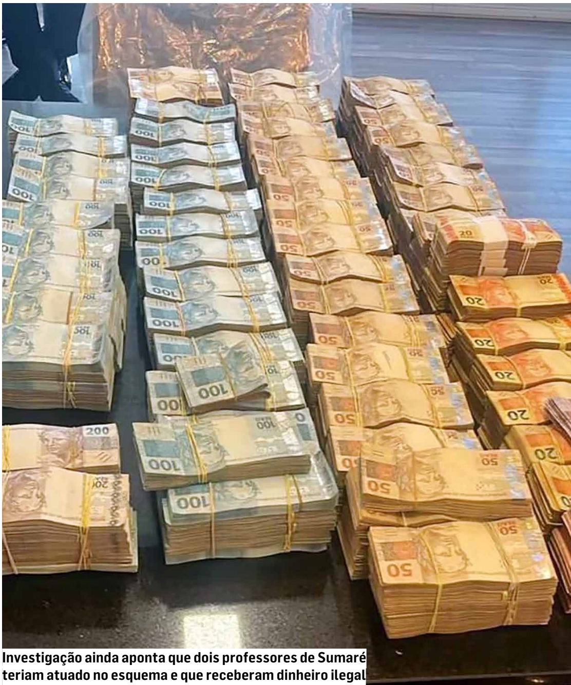
Investigação ainda aponta que dois professores de Sumaré teriam atuado no esquema e que receberam dinheiro ilegal

A investigação também identificou a participação de dois professores da rede municipal de Sumaré, que assinaram documentos desclassificando empresas concorrentes da Life. Um deles teria recebido R$ 24 mil; o outro, R$ 14 mil. Ambos foram alvos de mandados de busca e apreensão.