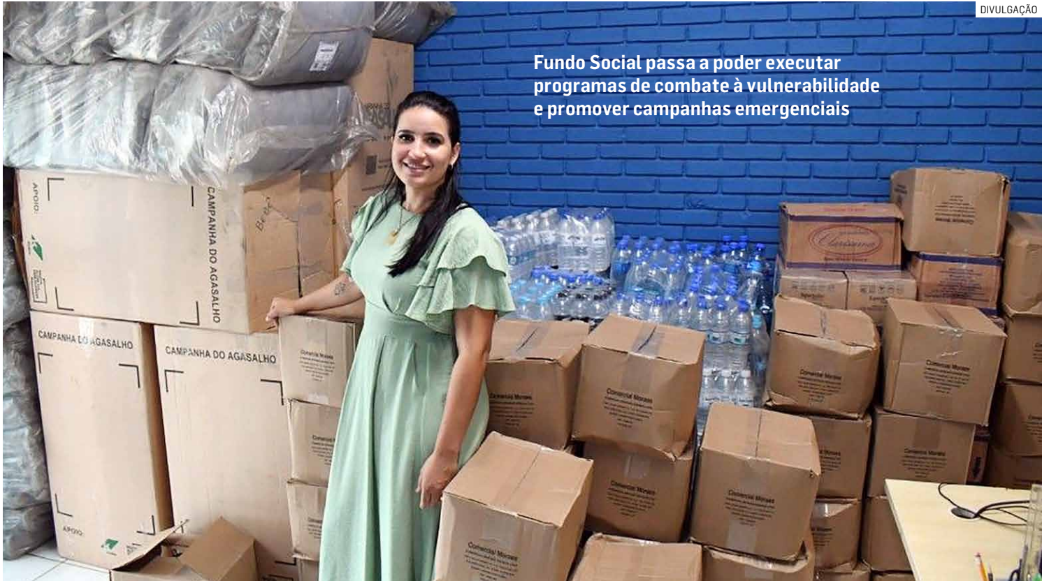
Fundo Social passa a poder executar programas de combate à vulnerabilidade e promover campanhas emergenciais