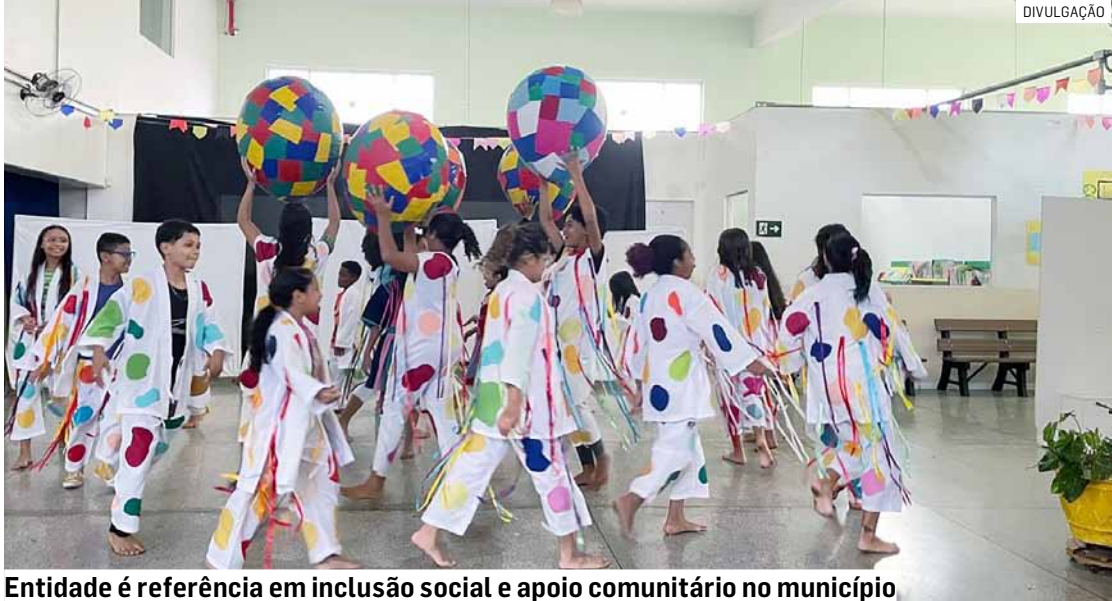
Entidade é referência em inclusão social e apoio comunitário no município

“A SHD representa o que há de mais bonito na solidariedade sumareense. São 30 anos dedicados a cuidar de pessoas e transformar vidas com amor e compromisso. A prefeitura tem orgulho em ser parceira dessa história de empatia e transformação social”, afirmou.