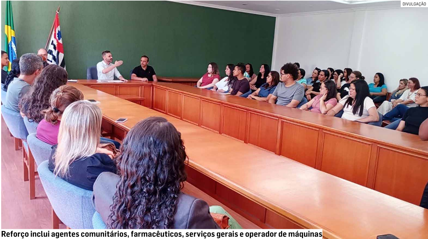
Reforço inclui agentes comunitários, farmacêuticos, serviços gerais e operador de máquinas

Com esse chamamento, a Secretaria de Saúde já contabiliza 56 novos profissionais na rede pública. Entre os 26 convocados anteriormente estão motoris-