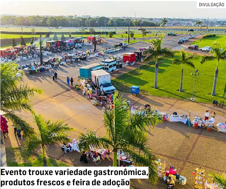
Evento trouxe variedade gastronômica, produtos frescos e feira de adoção