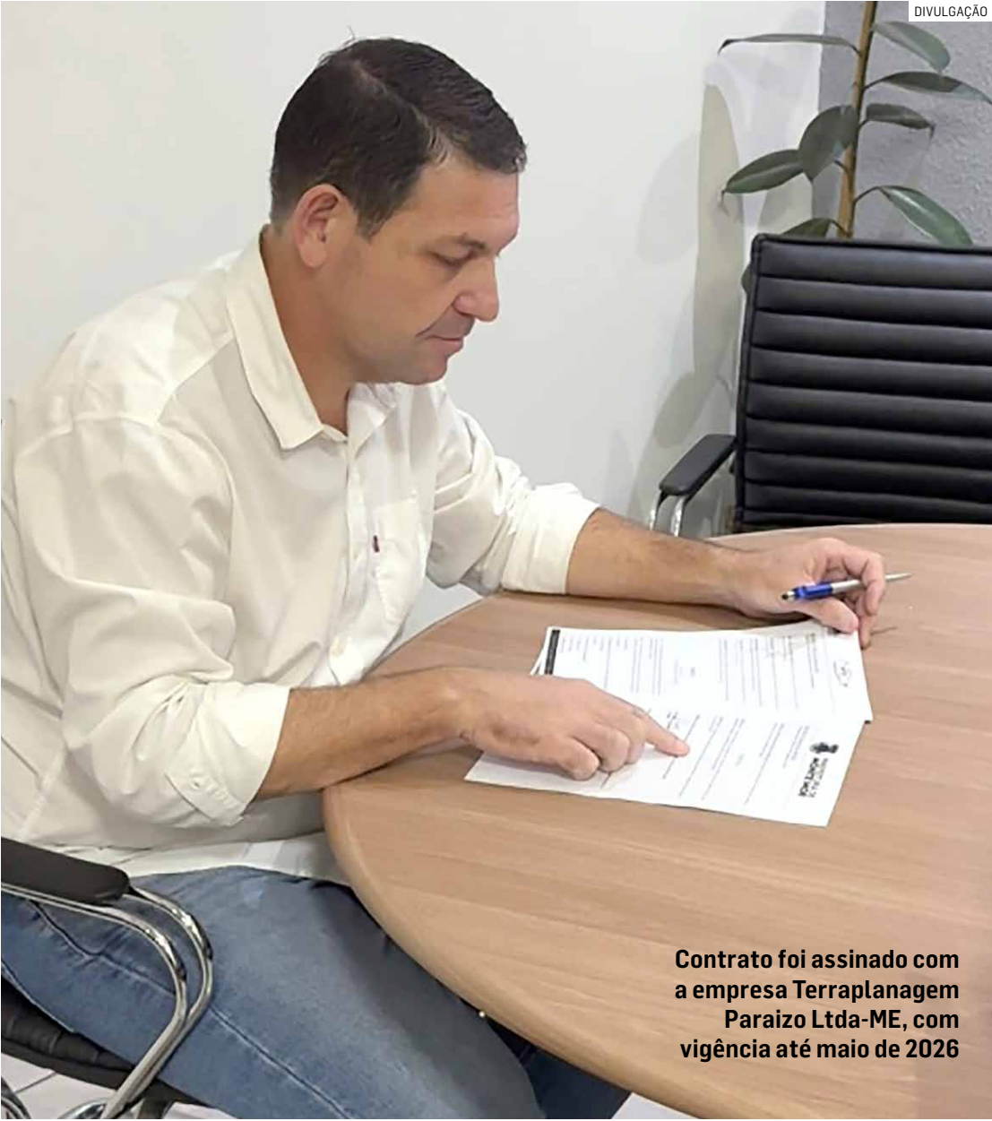
Contrato foi assinado com a empresa Terraplanagem Paraizo Ltda-ME, com vigência até maio de 2026

Dispensa de licitação prevê seis meses de serviços com equipamentos pesados e operadores; objetivo é reforçar ações da Defesa Civil em combate às queimadas, além de promover limpeza de áreas afetadas; contratação foi publicada no Diário Oficial do Município pelo Executivo