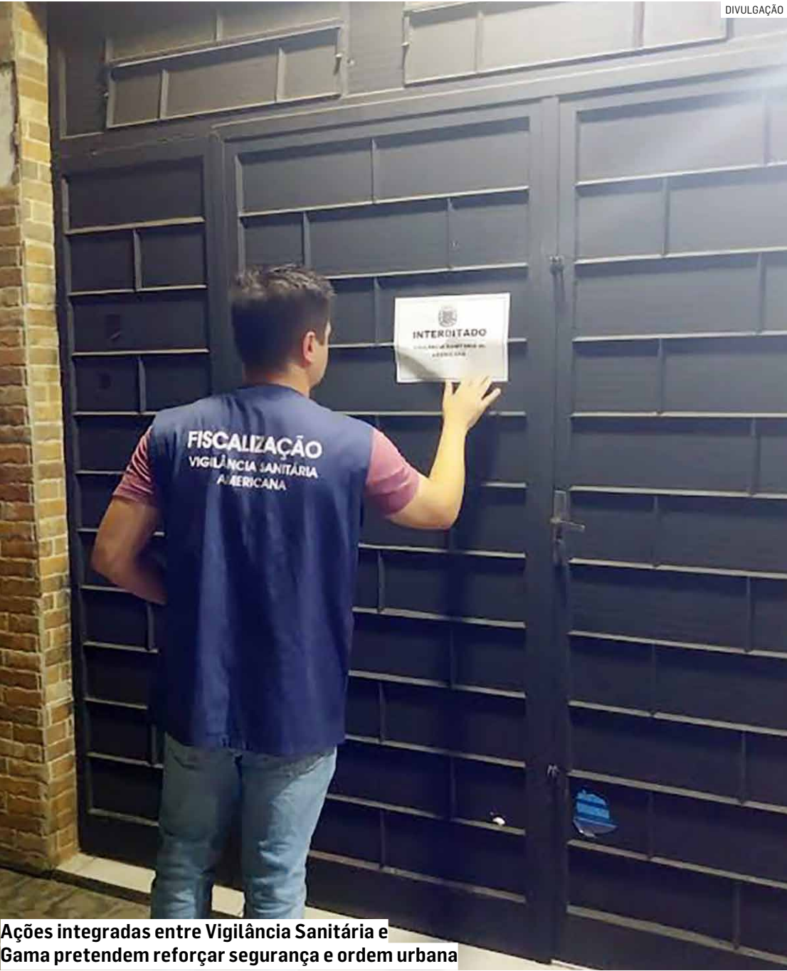
Ações integradas entre Vigilância Sanitária e Gama pretendem reforçar segurança e ordem urbana

Fiscalização conjunta combate som alto e estabelecimentos irregulares; adega no Jardim Lizandra acabou interditada por falta de licença e eventos sem autorização; posto de combustível na Avenida Brasil é vistoriado após denúncia