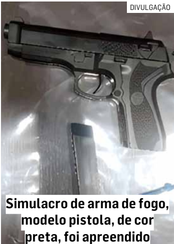
Simulacro de arma de fogo, modelo pistola, de cor preta, foi apreendido

Um homem foi abordado por uma equipe da Polícia Militar nesta quarta-feira (12), no Jardim Amanda II, em Hortolândia, após ser visto com um volume suspeito na cintura enquanto empurrava uma motocicleta com o pneu furado pela Rodovia Jornalista Francisco Aguirre Proença (SP-101). Durante a aproximação, os policiais perceberam o comportamento incomum do indivíduo e decidiram realizar a abordagem. No momento da busca pessoal, foi localizado um simulacro de arma de fogo, modelo pistola, de cor preta, preso à cintura do homem. De acordo com a equipe policial, o objeto apre-