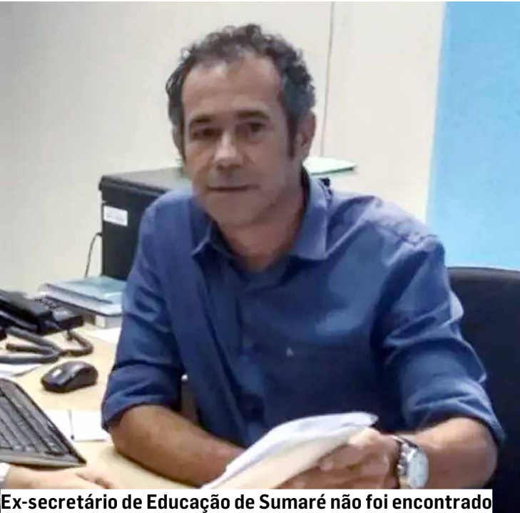
Ex-secretário de Educação de Sumaré não foi encontrado