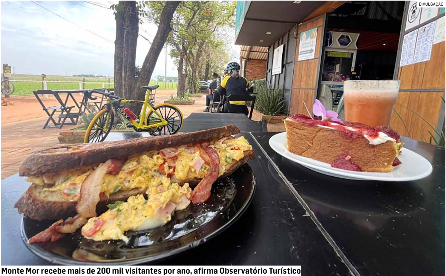
Monte Mor recebe mais de 200 mil visitantes por ano, afirma Observatório Turístico

Segundo dados do Observatório Turístico da Secretaria de Cultura e Turismo, Monte Mor recebe anualmente mais de 200