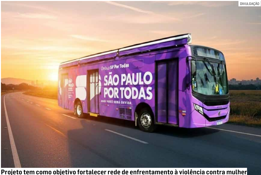
Projeto tem como objetivo fortalecer rede de enfrentamento à violência contra mulher

O projeto tem como objetivo fortalecer a rede de enfrentamento à violência contra a mulher, oferecen-