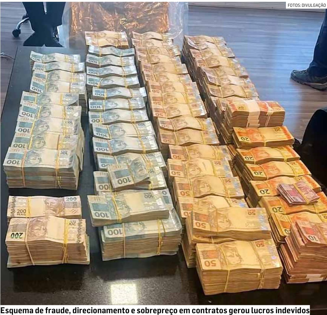
Esquema de fraude, direcionamento e sobrepreço em contratos gerou lucros indevidos