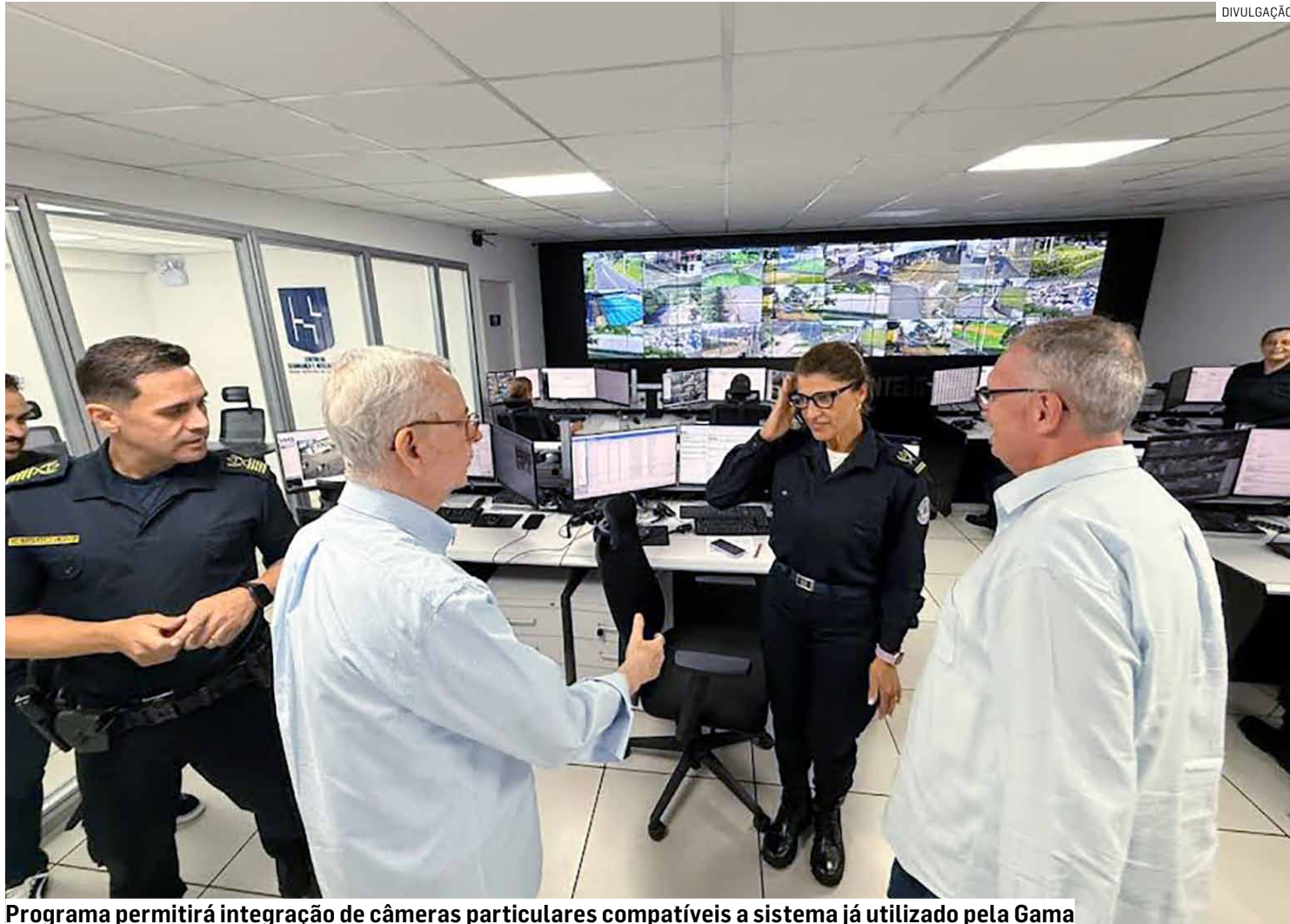
Programa permitirá integração de câmeras particulares compatíveis a sistema já utilizado pela Gama

O projeto detalha a forma como ocorrerá a integração de imagens captadas por sistemas instalados e direcionados para logradouros públicos para que sejam integradas ao sistema do CSI (Centro de Segurança e Inteligência), ampliando a cobertura do videomonitoramento feito atualmente pela corporação.