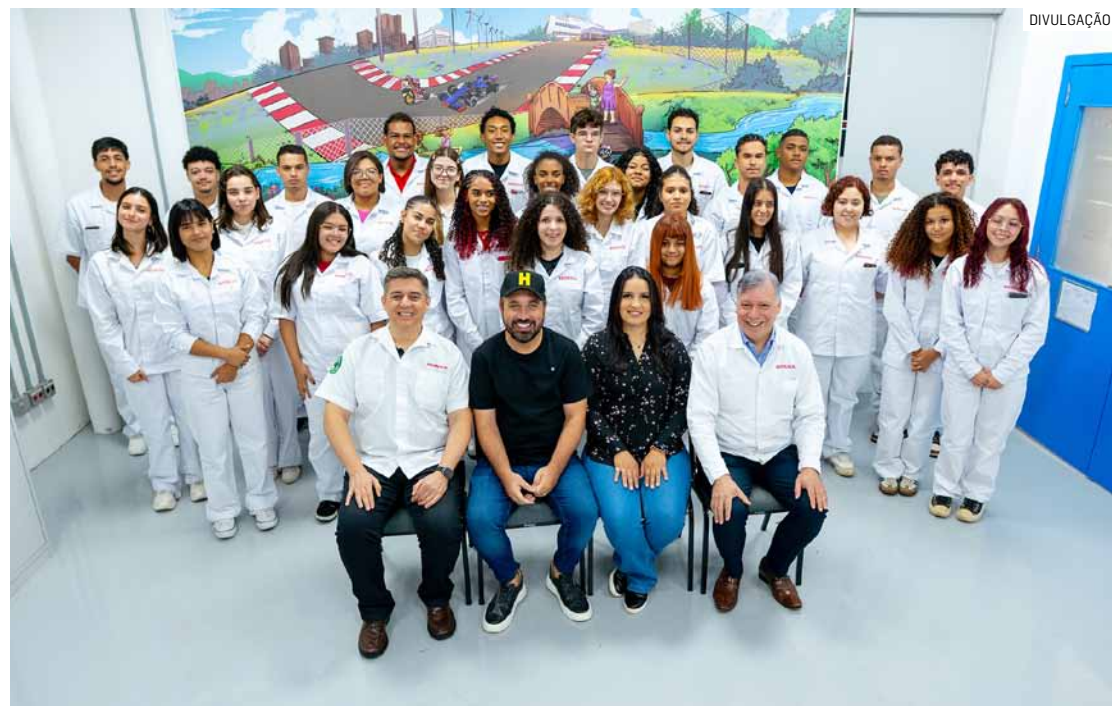
Com foco na formação individual de jovens da região, nova turma teve ampliação de dez vagas

Com carga horária total de 800 horas, o curso prepara os jovens para atuar em diferentes áreas do mercado de trabalho. A formação inclui módulos técnicos de mecânica de automóveis e motocicletas, conteúdos relacionados ao setor financeiro, por meio da Honda Serviços Financeiros, além de orientações sobre técnicas de vendas, bem como o desenvolvimento de habilidades profissionais, comportamentais e emocionais.