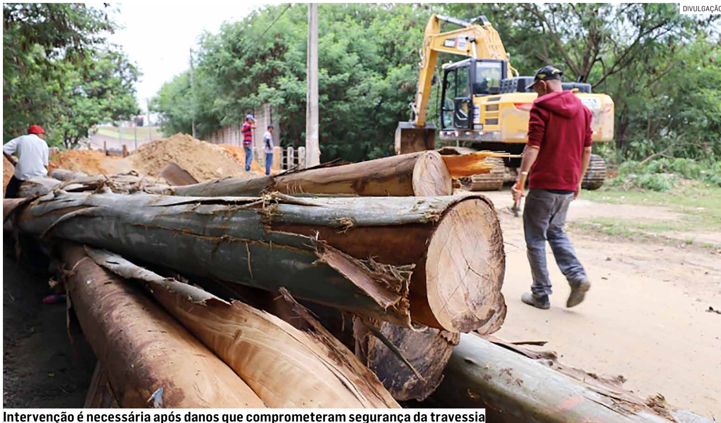
Intervenção é necessária após danos que comprometeram segurança da travessia

Por conta dos danos causados pelo volume intenso de água, a estrutura precisou ser interditada por questões de segurança, afetando diretamente a rotina dos moradores e a mobili-