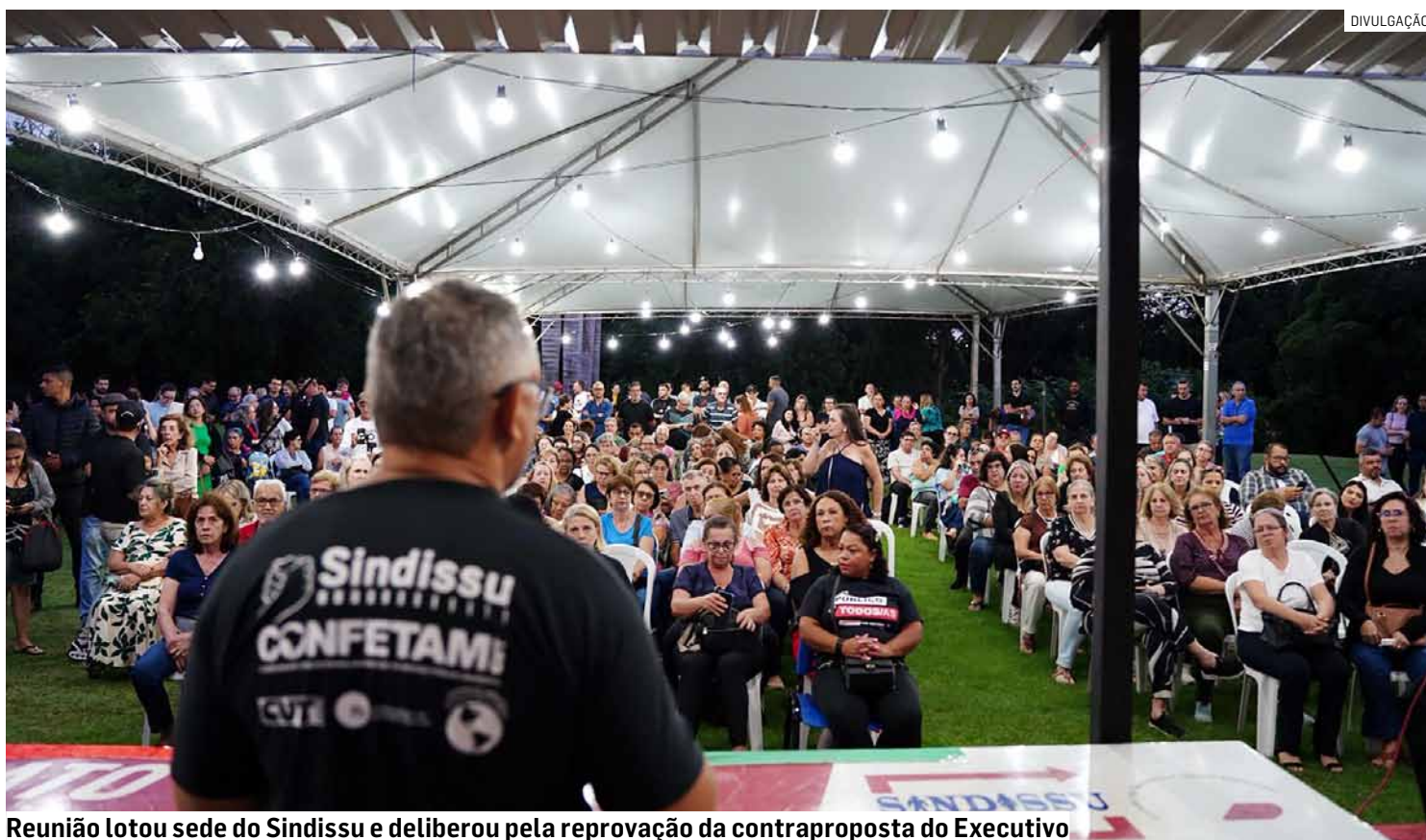
Reunião lotou sede do Sindissu e deliberou pela reprovação da contraproposta do Executivo

A participação expressiva reforça o compromisso