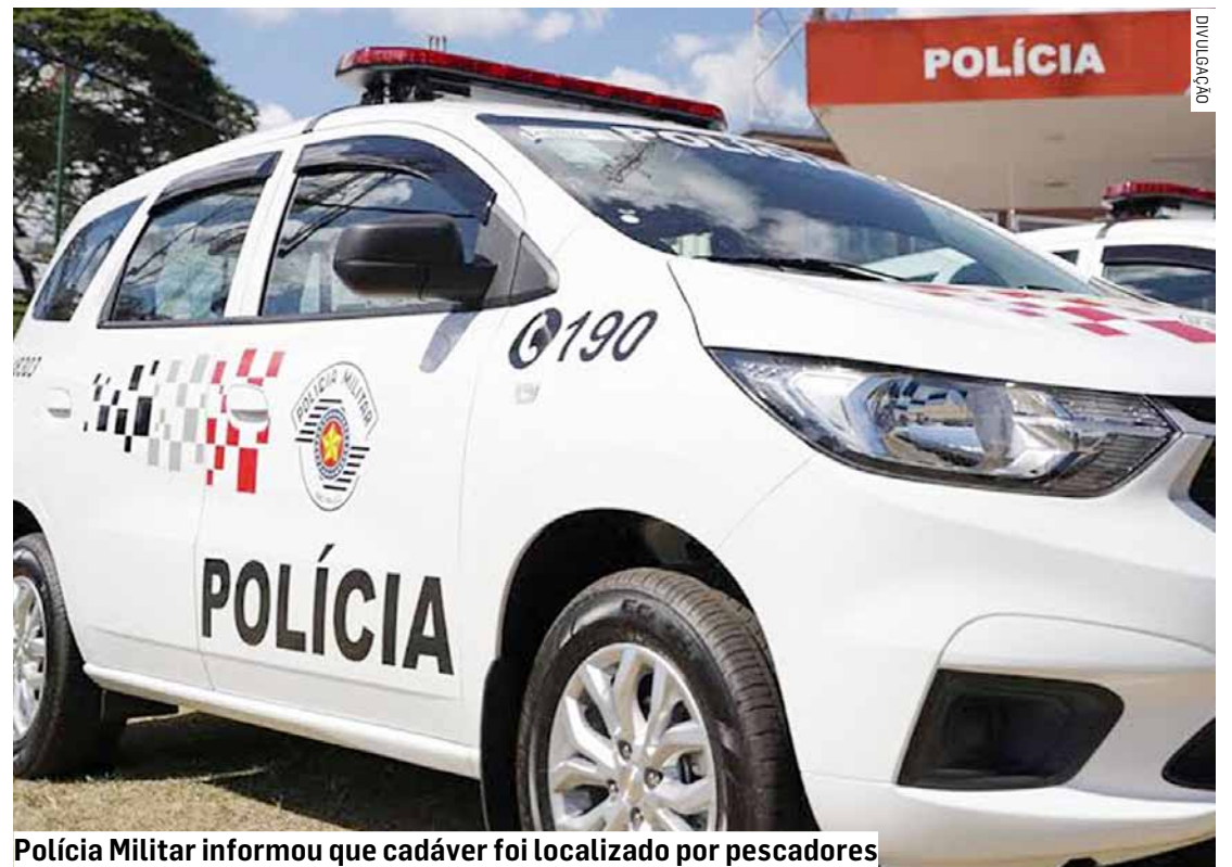
Polícia Militar informou que cadáver foi localizado por pescadores

O caso deverá ser investigado pela Polícia Civil.