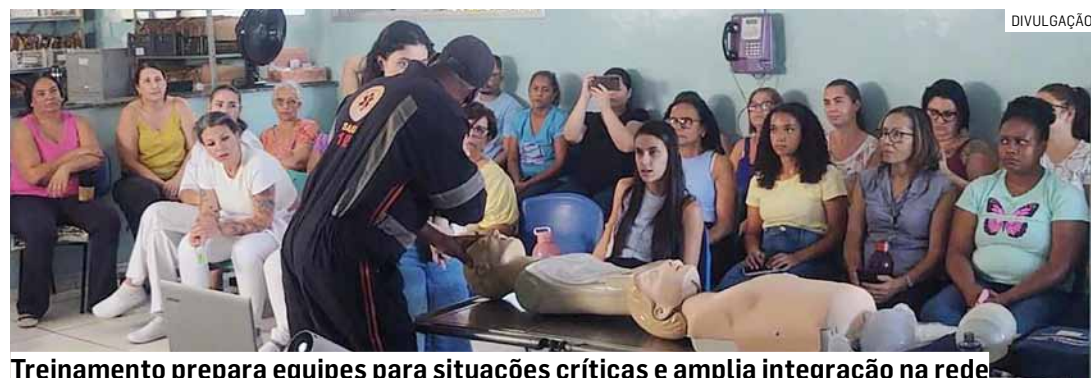
Treinamento prepara equipes para situações críticas e amplia integração na rede

A programação segue na próxima sexta-feira (17), com capacitação nas USFs Viel e Ypiranga.