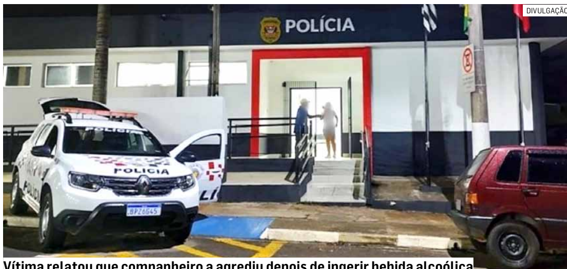
Vítima relatou que companheiro a agrediu depois de ingerir bebida alcoólica

durante a violência, a mulher foi empurrada e acabou caindo de uma altura aproximada de dois metros, o que resultou em lesões.