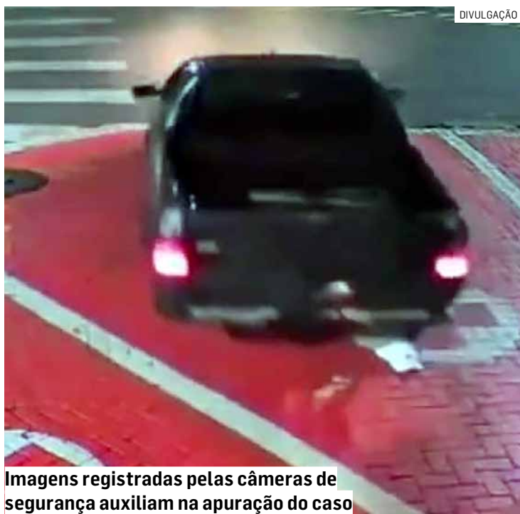
Imagens registradas pelas câmeras de segurança auxiliam na apuração do caso

César Oliveira • HORTOLÂNDIA tribunaliberal@tribunaliberal.com.br