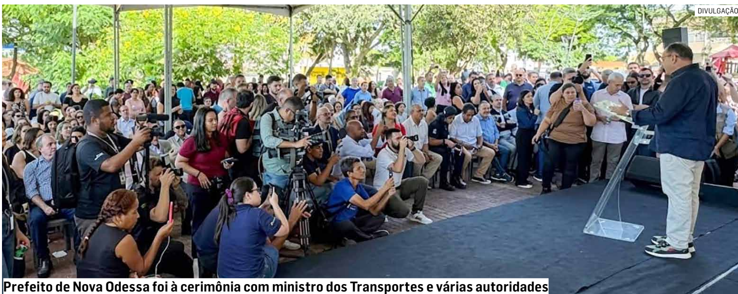
Prefeito de Nova Odessa foi à cerimônia com ministro dos Transportes e várias autoridades

Da Redação • REGIÃO tribunaliberal@tribunaliberal.com.br