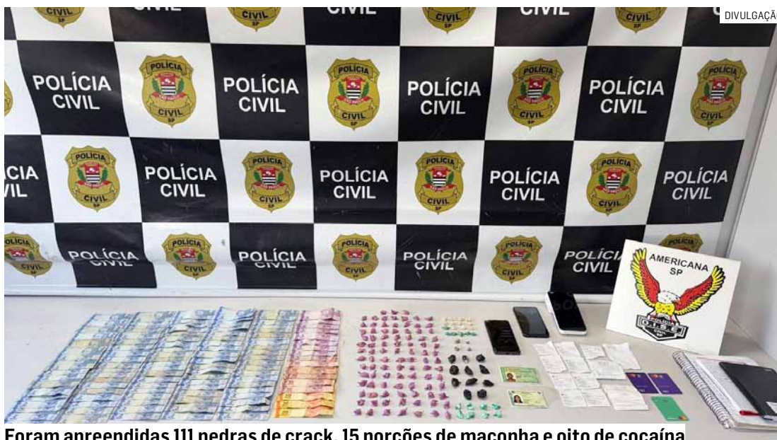
Foram apreendidas 111 pedras de crack, 15 porções de maconha e oito de cocaína

A operação foi realizada em um estabelecimento comercial localizado na Rua das Seriemas, no bair-