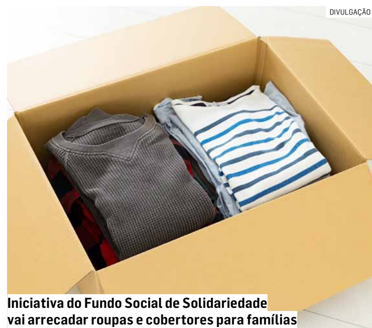
Iniciativa do Fundo Social de Solidariedade vai arrecadar roupas e cobertores para famílias