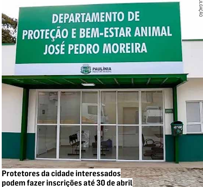
Protetores da cidade interessados podem fazer inscrições até 30 de abril

Entre os benefícios oferecidos estão vagas em campanhas de castração, acesso a doações (ração, medicamentos e insumos)