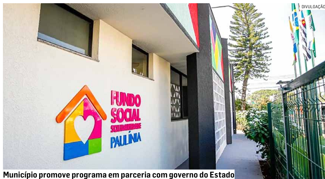
Município promove programa em parceria com governo do Estado

ciência, que tenham mais de 15 anos para iniciar o processo de inserção no mercado de trabalho, através da metodologia do Emprego Apoiado que tem como conceito-chave o pressuposto de que toda pessoa é capaz de ser empregada, desde que receba os apoios e adaptações necessários para suas especificidades.