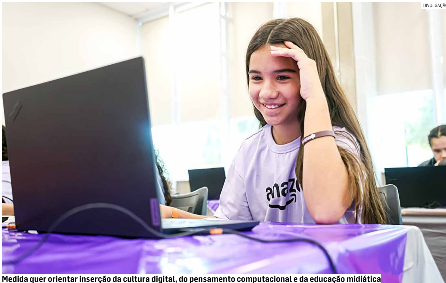
Medida quer orientar inserção da cultura digital, do pensamento computacional e da educação midiática

De acordo com a prefeitura, a medida pretende preparar os estudantes para os desafios do mundo contemporâneo, estimulando o uso crítico, ético e criativo das tecnolo-