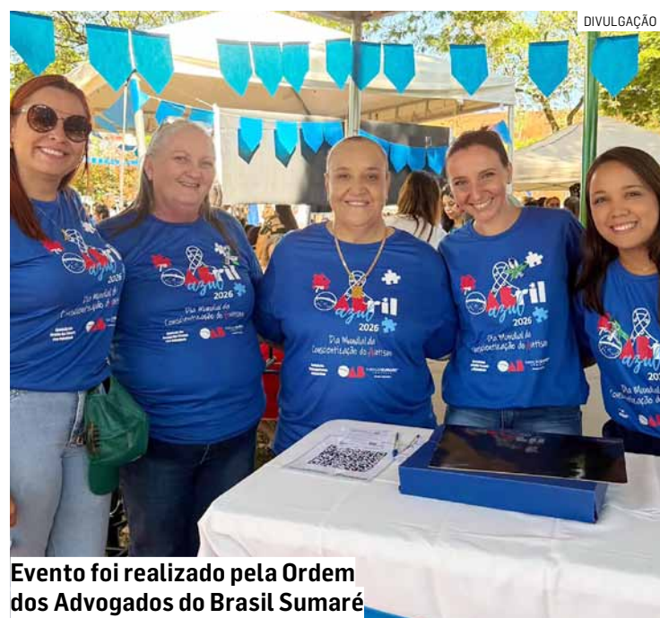
Evento foi realizado pela Ordem dos Advogados do Brasil Sumaré

Da Redação • SUMARÉ tribunaliberal@tribunaliberal.com.br