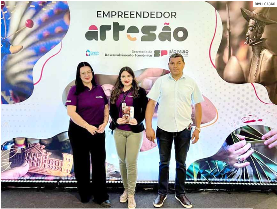
Evento destaca busca por novas políticas públicas e investimentos no setor criativo

A primeira-dama do Estado, idealizadora do programa, reforçou o trabalho e a dedicação investidos na