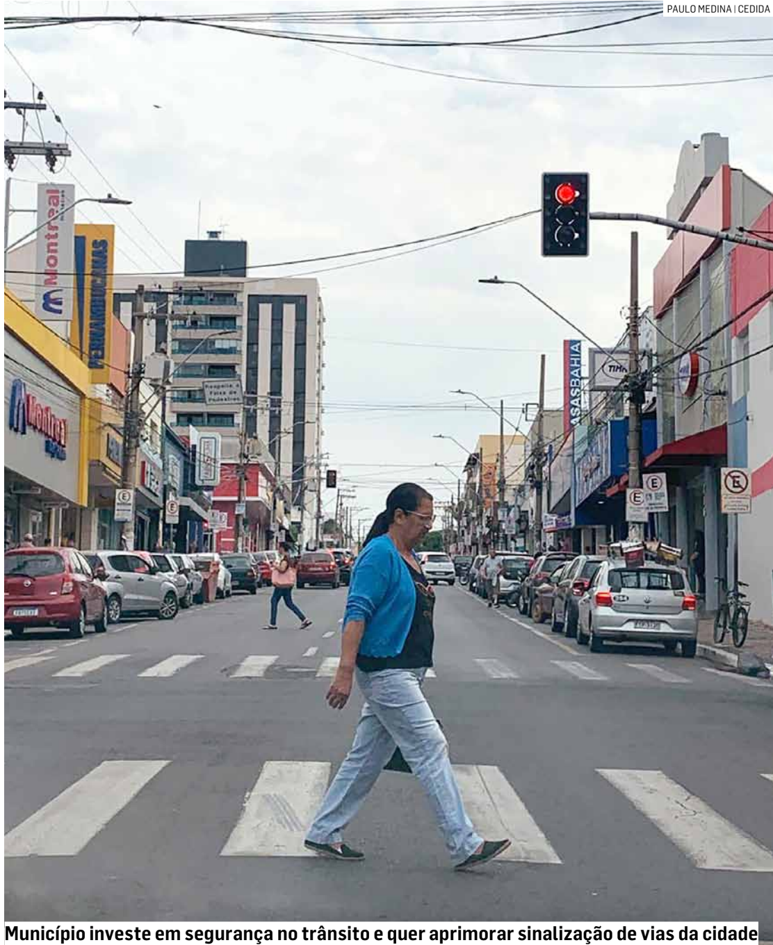
Município investe em segurança no trânsito e quer aprimorar sinalização de vias da cidade

Secretaria de Mobilidade Urbana e Rural formalizou contratação para implantação e manutenção da sinalização preventiva e corretiva em toda cidade; acordo feito com a R3 Comercial e Sistemas de Monitoramento Ltda visa serviços de sinalização vertical, horizontal e semafórica nas vias