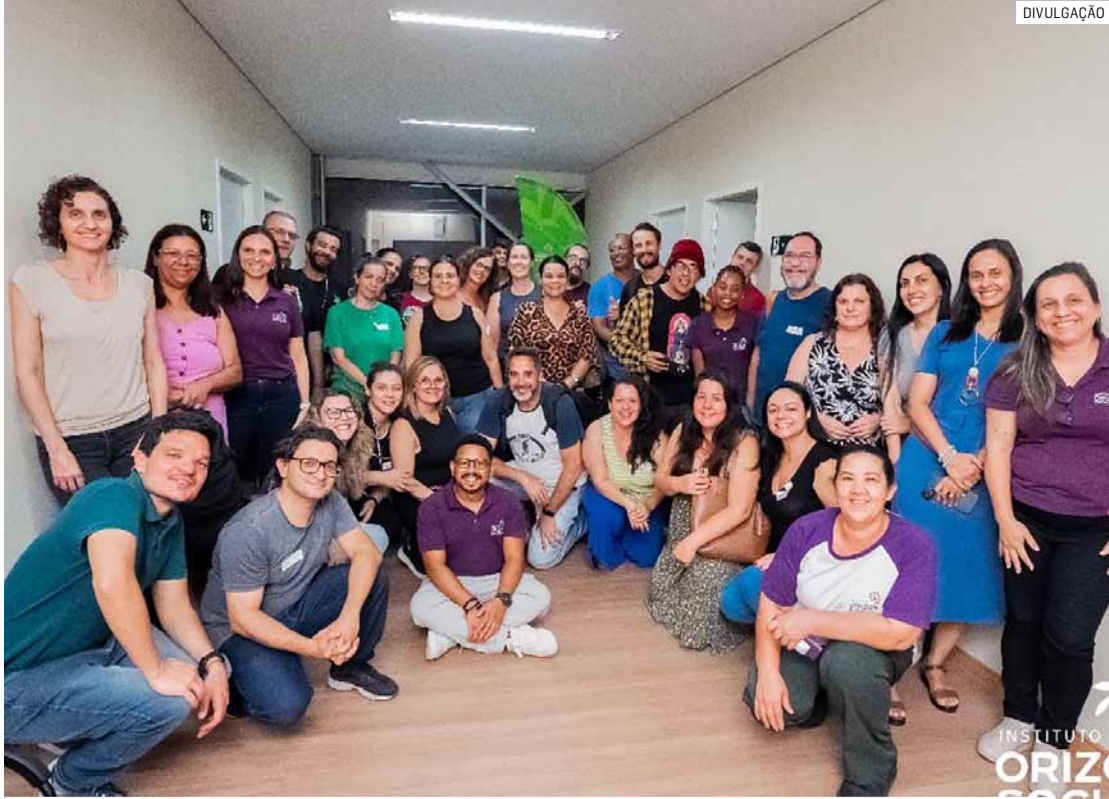
Projeto está na 2ª edição e promove diálogo entre educadores, especialistas e gestores

O encontro teve como tema “Transformação Climática nas Escolas: dos Conceitos e Instrumentos de Gestão aos Planos de Ação”