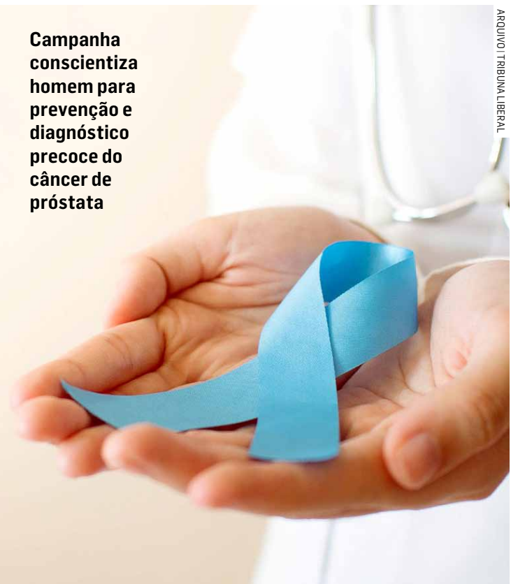
Campanha conscientiza homem para prevenção e diagnóstico precoce do câncer de próstata