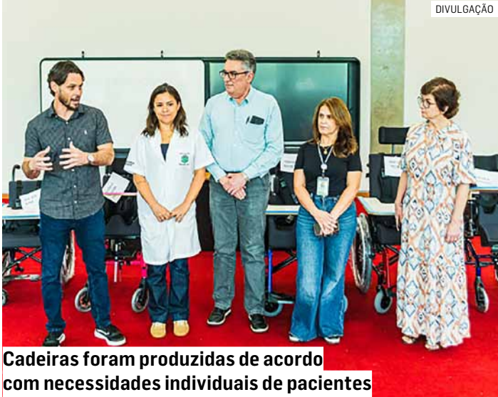
Cadeiras foram produzidas de acordo com necessidades individuais de pacientes