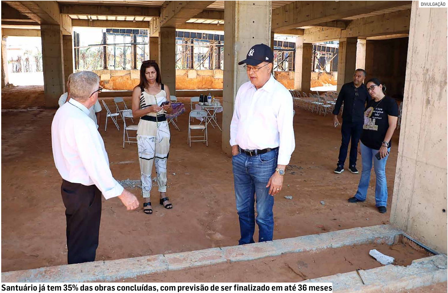
Santuário já tem 35% das obras concluídas, com previsão de ser finalizado em até 36 meses

Com arquitetura inspirada nos grandes templos cristãos, o Santuário de São João Paulo II apresenta uma planta em forma de cruz latina, com na-