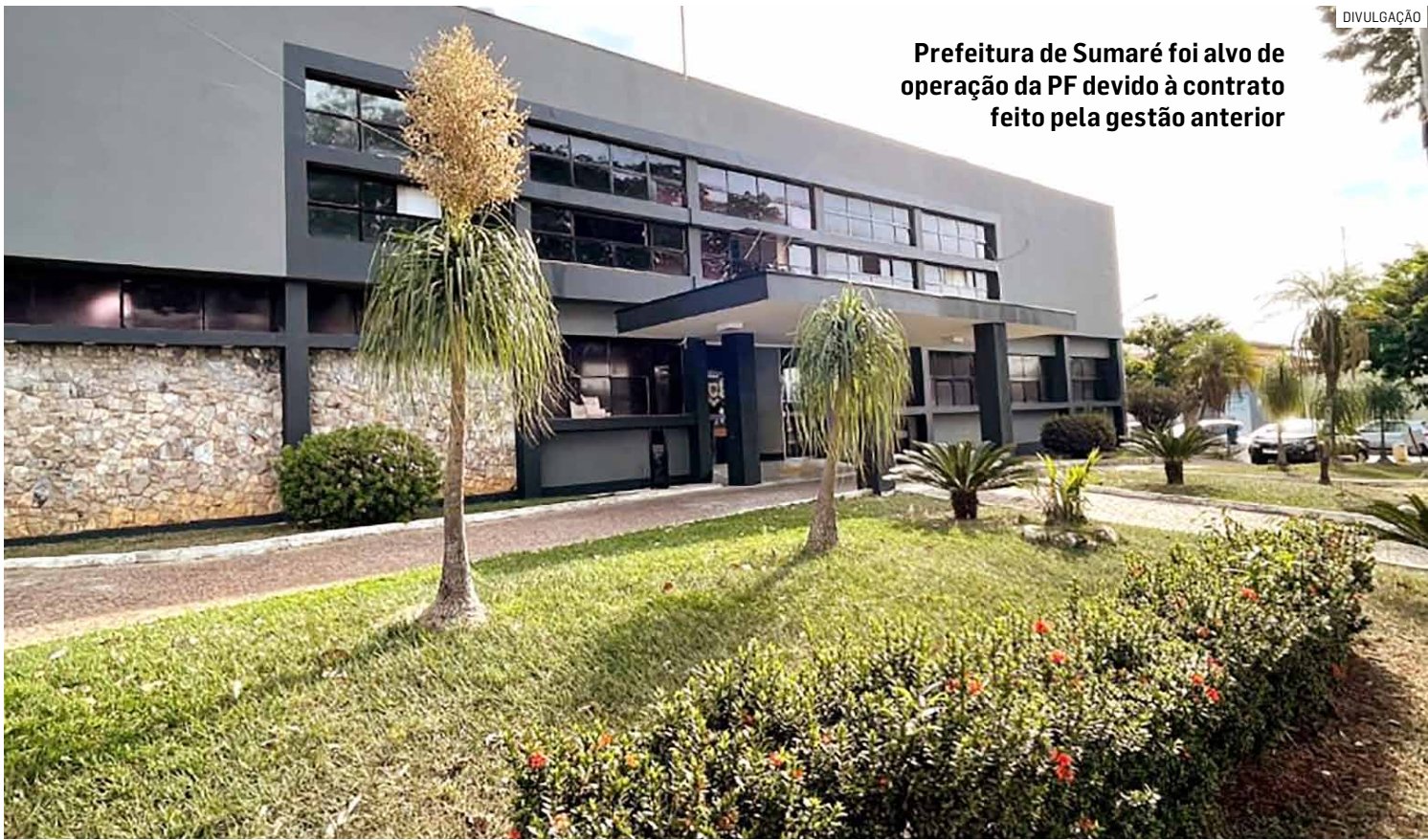
Prefeitura de Sumaré foi alvo de operação da PF devido à contrato feito pela gestão anterior

Busca e apreensão foram deflagradas na sede da Prefeitura de Sumaré com foco em documentos e registros ligados a processos licitatórios e contratos da empresa Life Tecnologia Educacional Ltda, firmados no ano de 2020