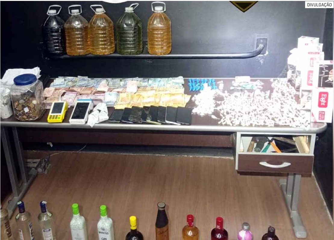
Grupo foi autuado por associação ao tráfico, tráfico de drogas e crime contra saúde pública

Uma operação da Polícia Militar resultou na prisão de sete pessoas envolvidas com o tráfico de drogas e crimes contra a saúde pública, nesta terça-feira (11), no bairro Vila Cordenonsi, em Americana. A ação terminou com a apreensão de grande quantidade de entorpecentes e produtos irregulares. Entre os detidos estão D.I.C., de 39 anos, costureira; I.R.C.S., de 27 anos, garçoneiro; B.E.M.O., de 25 anos, desempregado; A.L.R.C., de 28 anos, ajudante; L.F.D.S., de 34 anos, procurado pela Justiça; T.B., de 42 anos, desempregado; e M.S.S.S., de 41 anos, mecânico. Todos foram autuados por associação ao tráfico, tráfico de drogas e crime contra a saúde pública. Durante o patrulhamento, a equipe policial percebeu