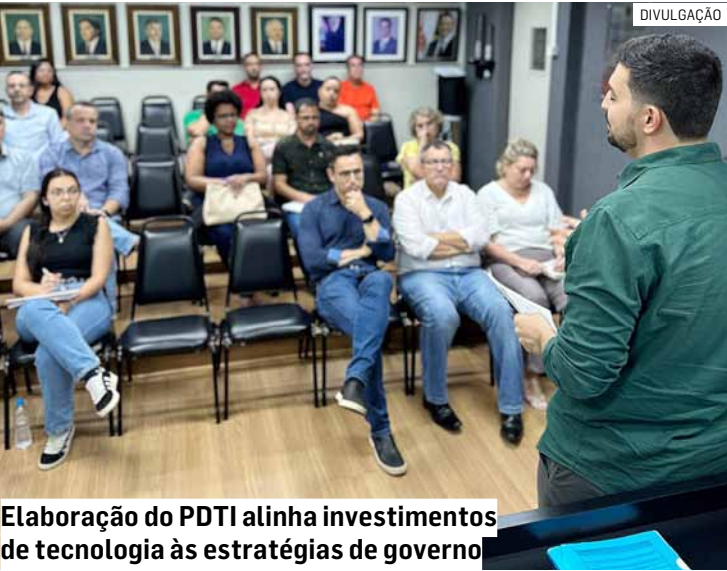
Elaboração do PDTI alinha investimentos de tecnologia às estratégias de governo

Da Redação • AMERICANA tribunaliberal@tribunaliberal.com.br