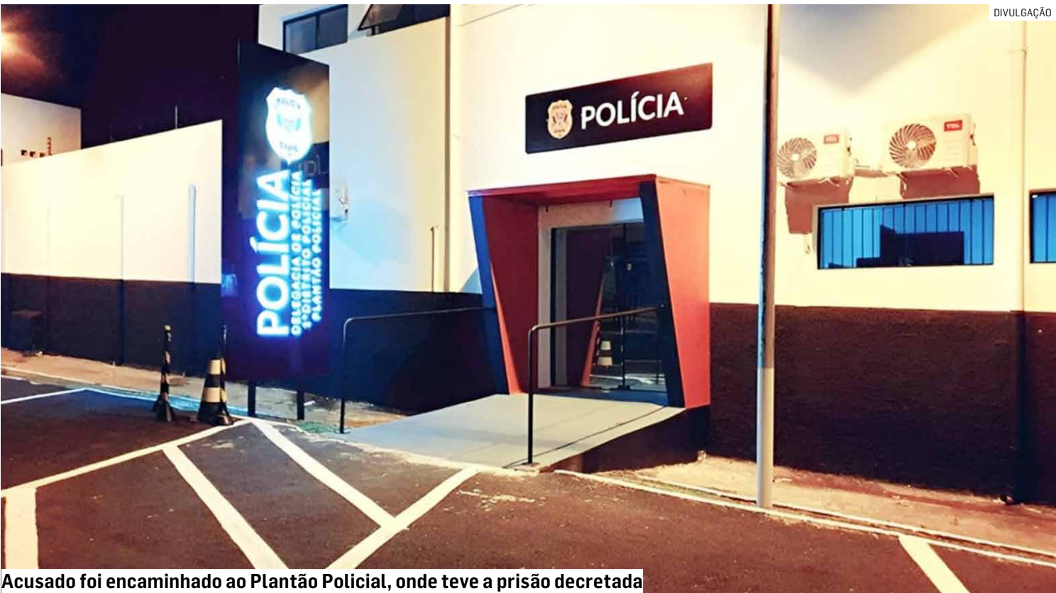
Acusado foi encaminhado ao Plantão Policial, onde teve a prisão decretada

presentes no local. Diante da situação, a vítima solicitou apoio da equipe policial para registrar o caso. Os policiais localizaram o suspeito, que já possuía antecedentes criminais por assédio sexual e ameaça. Ao ser questionado, ele negou a intenção de importunar e afirmou ter tocado na carteira da vítima “como uma brincadeira”. Ambas as partes foram conduzidas ao Plantão Policial de Sumaré, onde o caso foi formalizado. Após depoimento, a autoridade policial determinou a prisão do suspeito, que permaneceu à disposição da Justiça. A Polícia Civil deve dar