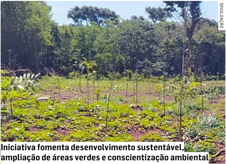
Iniciativa fomenta desenvolvimento sustentável, ampliação de áreas verdes e conscientização ambiental

tá alinhado aos compromissos globais de proteção ambiental e combate às mudanças climáticas. “Sumaré vem mostrando que desenvolvimento e sustentabilidade caminham juntos. Investimos em ações que cuidam da nossa cidade hoje, pensando no futuro. Esse plantio representa o compromisso de uma gestão que valoriza o meio ambiente e trabalha por um município mais verde, saudável e equilibrado”.