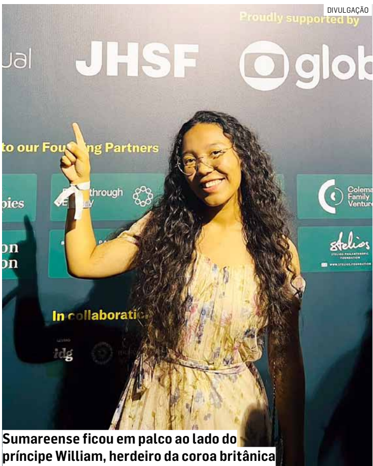
Sumareense ficou em palco ao lado do príncipe William, herdeiro da coroa britânica