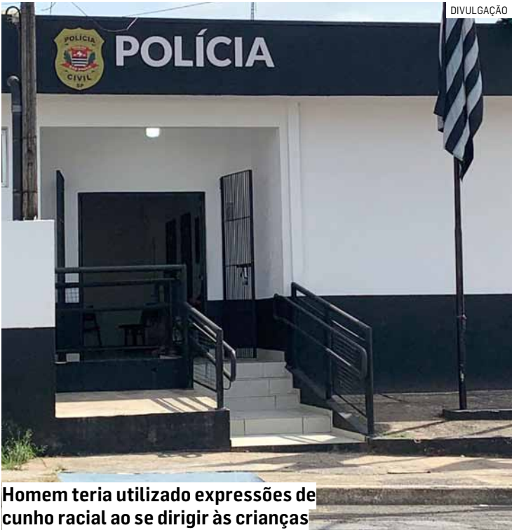
Homem teria utilizado expressões de cunho racial ao se dirigir às crianças

cal, confirmando as agressões verbais e as ameaças feitas pelo suspeito. O episódio causou indignação entre os moradores do condomínio, que relataram preocupação com a segurança das crianças. O caso foi apresentado no Plantão Policial de Monte Mor. O homem permaneceu à disposição da Justiça e poderá responder pelos crimes de injúria racial e ameaça.