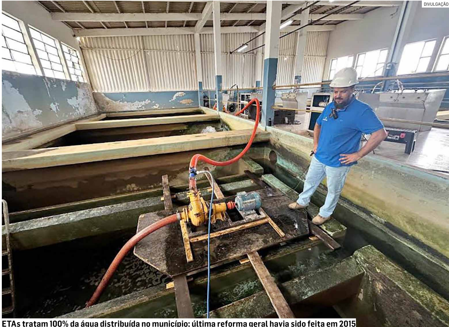
ETAs tratam 100% da água distribuída no município; última reforma geral havia sido feita em 2015

As intervenções fazem parte do conjunto de investimentos voltados à modernização do sistema de abastecimento. Os mesmos locais também receberão melhorias relacionadas à mo-