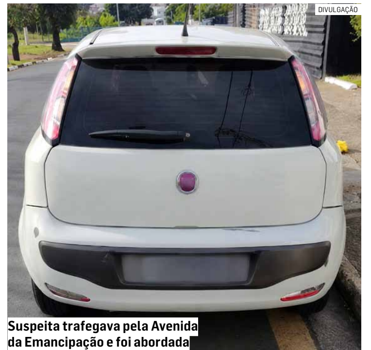
Suspeita trafegava pela Avenida da Emancipação e foi abordada

De acordo com a Polícia Militar, a mulher permaneceu à disposição das autoridades enquanto o caso era formalizado por meio da elaboração do boletim de ocorrência. Após análise dos fatos, a autoridade policial determinou a prisão da suspeita.