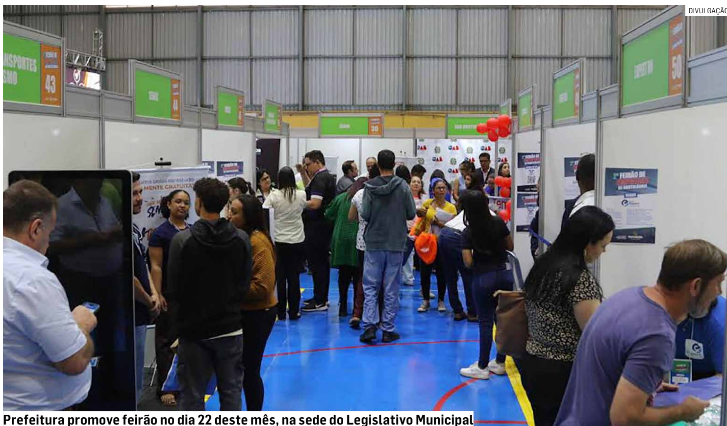
Prefeitura promove feirão no dia 22 deste mês, na sede do Legislativo Municipal

De acordo com a Secretaria de Desenvolvimento Econômico, Trabalho, Tu-