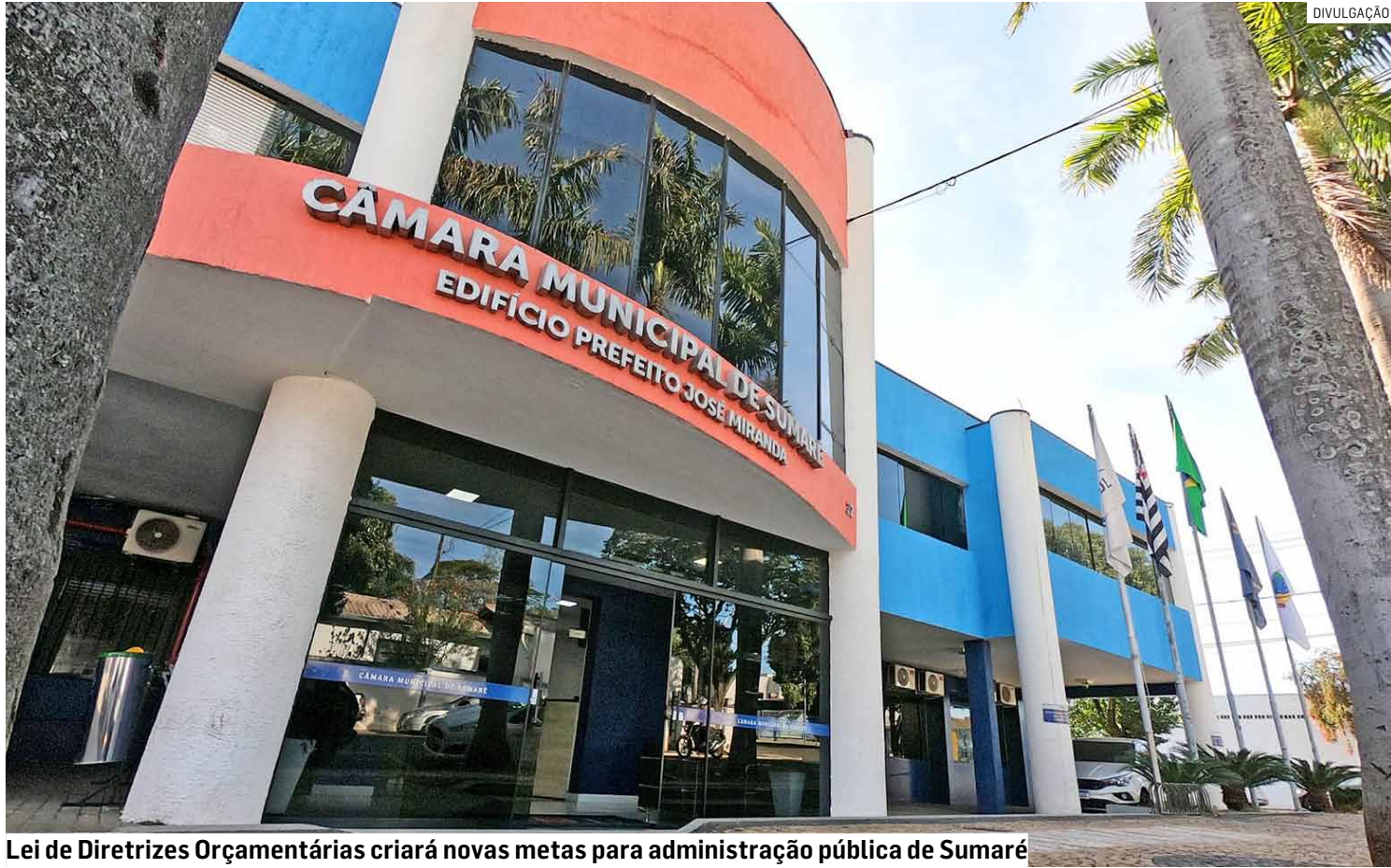
Lei de Diretrizes Orçamentárias criará novas metas para administração pública de Sumaré

A Lei de Diretrizes Orçamentárias (LDO) é o instrumento que estabelece as metas e prioridades da administração pública de Sumaré para o ano seguinte, servindo como uma ponte entre o Plano Plurianual (PPA) e a Lei Orçamentária Anual (LOA). Enquanto o PPA define os objetivos e programas do governo para um período de quatro anos, a LDO organiza quais dessas metas terão prioridade em determinado exercício financeiro. Já a LOA detalha, na prática, como os recursos públicos serão arrecadados e aplicados em áreas como saúde, educação, infraestrutura