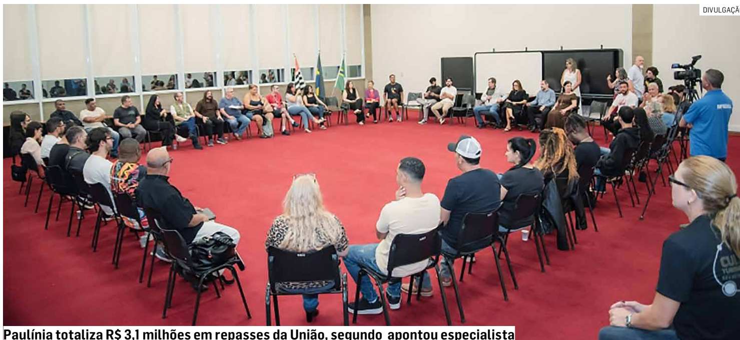
Paulínia totaliza R$ 3,1 milhões em repasses da União, segundo apontou especialista

Da Redação • PAULÍNIA tribunaliberal@tribunaliberal.com.br