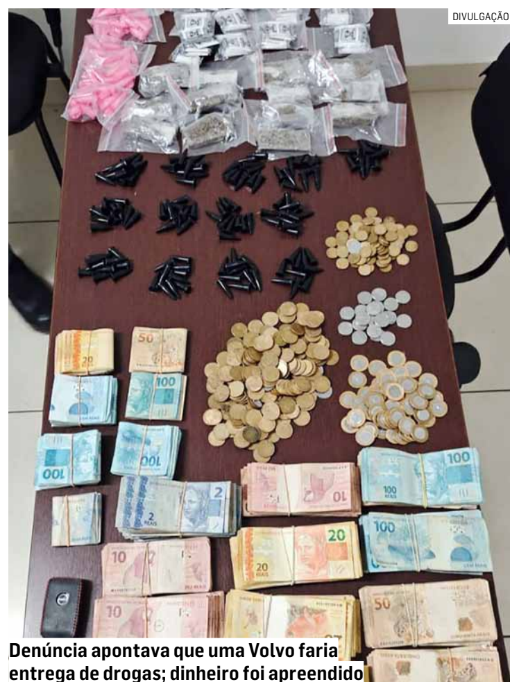
Denúncia apontava que uma Volvo faria entrega de drogas; dinheiro foi apreendido

Durante as buscas no interior da casa, os policiais apreenderam 305 papelotes de cocaína, 306 porções da mesma droga, 13 de maconha e mais R$ 18.018 em dinheiro. Nenhum morador foi localizado no imóvel.