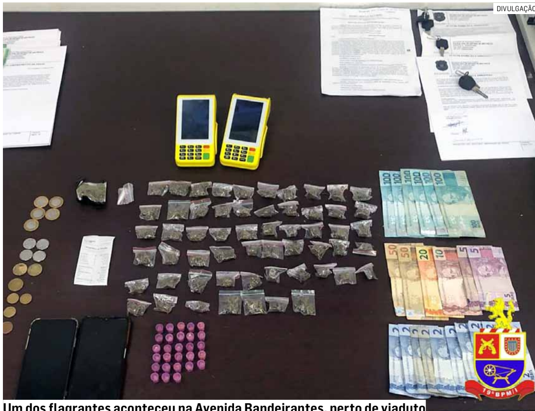
Um dos flagrantes aconteceu na Avenida Bandeirantes, perto de viaduto

A primeira ocorrência aconteceu por volta das 23h10 de segunda-feira, na Avenida Bandeirantes, na região abaixo do viaduto. Segundo a Polícia Militar, a equipe recebeu denúncia anônima informando que