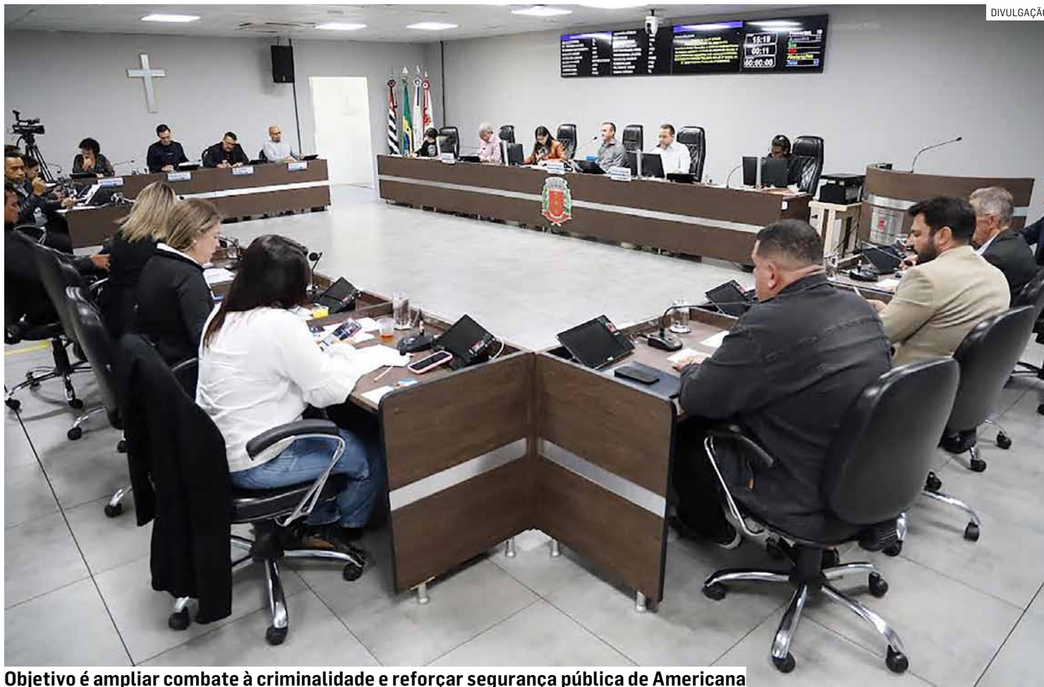
Objetivo é ampliar combate à criminalidade e reforçar segurança pública de Americana

O texto prevê a ampliação da vigilância eletrônica em espaços públicos por