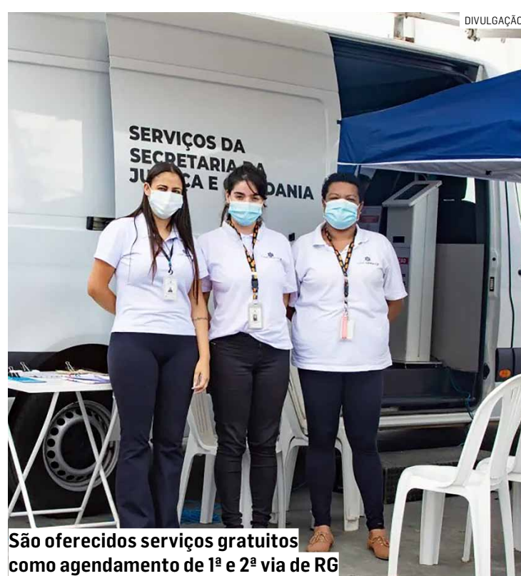
São oferecidos serviços gratuitos como agendamento de 1ª e 2ª via de RG

Entre os principais serviços gratuitos oferecidos à população estão agendamento de 1ª e 2ª via de RG, emissão de 2ª via de CPF, emissão de certidões de nascimento, casamento e óbito, atestado de antecedentes criminais, instalação e orientação sobre Carteira de Trabalho Digital, entrada e orientação sobre seguro-desemprego, consultas ao Serasa, elaboração de currículo, emissão de 2ª via de contas de água, luz e tele-