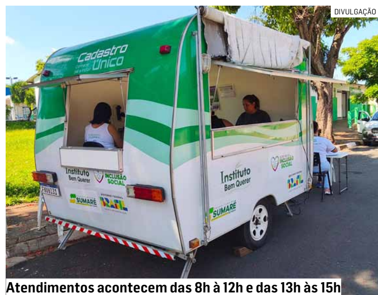
Atendimentos acontecem das 8h à 12h e das 13h às 15h

Da Redação • SUMARÉ tribunaliberal@tribunaliberal.com.br