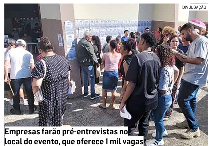
Empresas farão pré-entrevistas no local do evento, que oferece 1 mil vagas

A programação também contará com palestras sobre mercado de trabalho, realizadas no período da tarde, além de um espaço dedicado a instituições de ensino, que irão apresentar e ofertar cursos de formação técnica e profissionalizante. Outro destaque será a praça de alimentação, que contará com a participação de mulheres empreendedoras do município, integrantes do programa Todas por Elas.