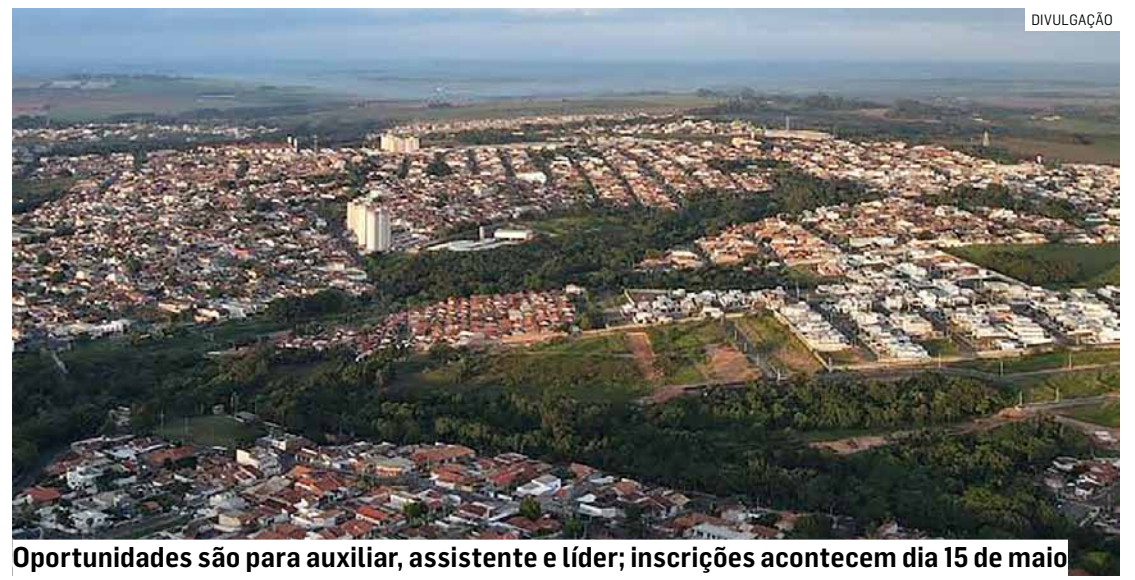
Oportunidades são para auxiliar, assistente e líder; inscrições acontecem dia 15 de maio