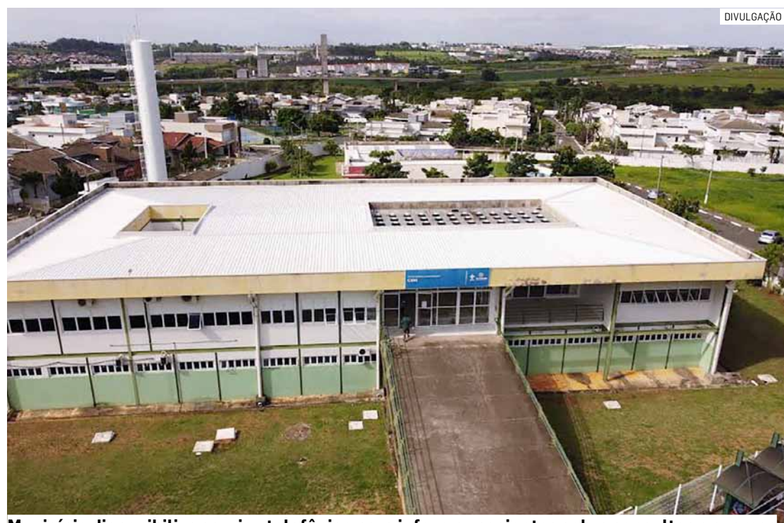
Município disponibiliza serviço telefônico para informar pacientes sobre consultas e exames

A Prefeitura de Hortolândia também disponibiliza outros canais de comunicação para o atendimento da população na Atenção Primária. A Secretaria de Saúde reforça que as Unidades Básicas de Saúde (UBSs) do município também têm linhas de telefone celular.