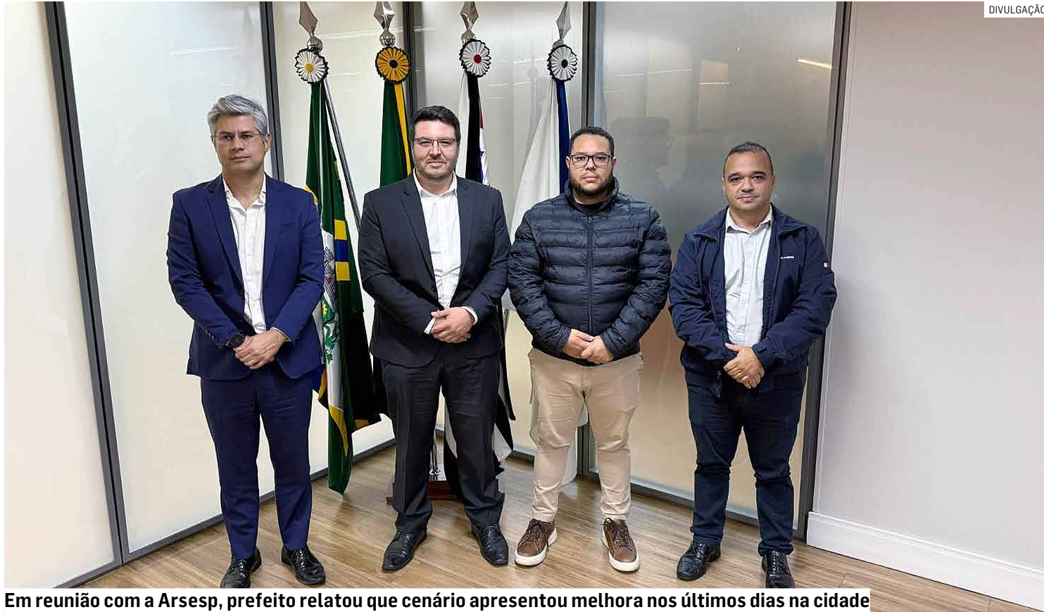
Em reunião com a Arsesp, prefeito relatou que cenário apresentou melhora nos últimos dias na cidade

Durante o encontro, foi reforçada a potabilidade da água distribuída à população e o compromisso com o monitoramento