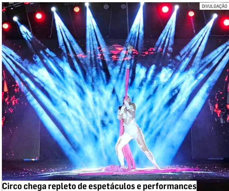
Circo chega repleto de espetáculos e performances

Da Redação • SUMARÉ tribunaliberal@tribunaliberal.com.br