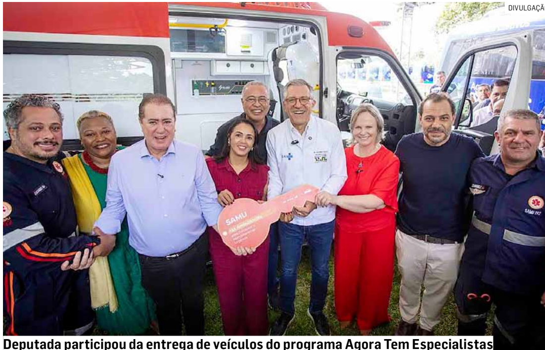
Deputada participou da entrega de veículos do programa Agora Tem Especialistas

Foram entregues 12 micro-ônibus para o transporte de pacientes em Tratamento Fora de Domicílio (TFD), 20 ambulân-