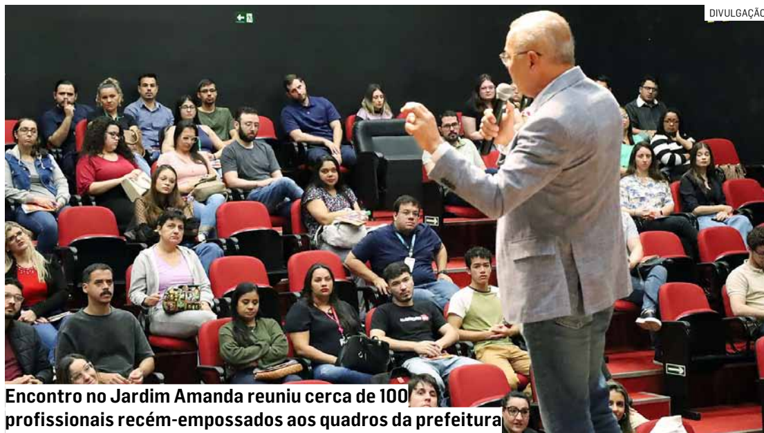
Encontro no Jardim Amanda reuniu cerca de 100 profissionais recém-empossados aos quadros da prefeitura

Foi com esse espírito que, nesta semana, a Escola de Gestão Pública, vinculada à Secretaria de Administração e Gestão de Pessoal, promoveu mais uma edição do Programa de Ambientação dos Novos Servidores Públicos Municipais. O encontro, realizado no Teatro Elizabeth Keller de Matos,