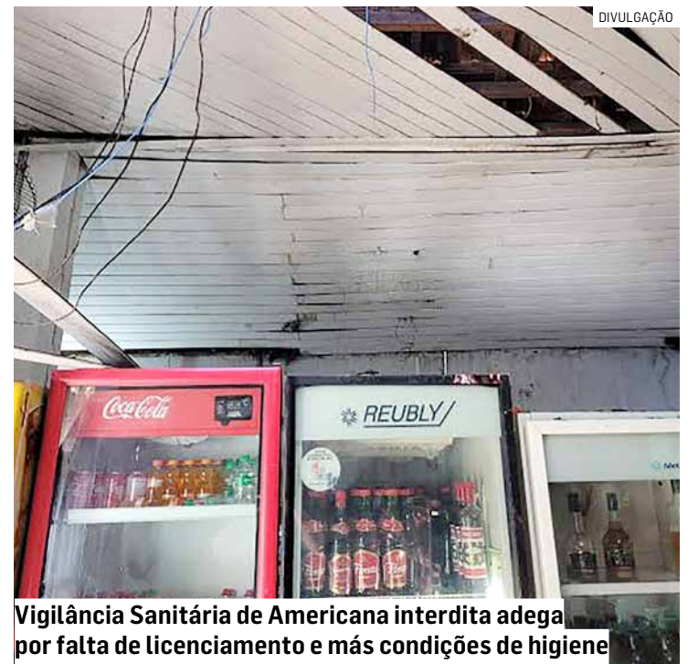
Vigilância Sanitária de Americana interdita adega por falta de licenciamento e más condições de higiene