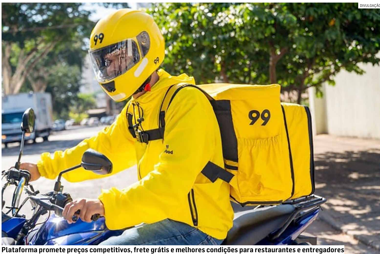
Plataforma promete preços competitivos, frete grátis e melhores condições para restaurantes e entregadores

O projeto aponta para o fortalecimento do ecossistema de mobilidade e conveniência no Brasil. Só no interior de São Paulo, a empresa destinará R$ 100 milhões para estruturar as operações do serviço de entrega de comida.