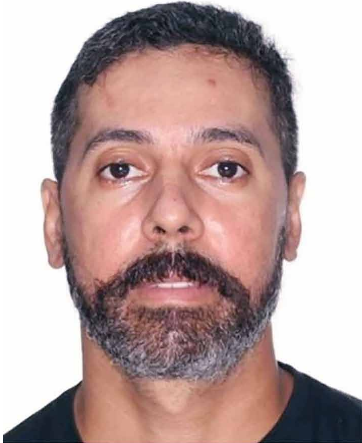
Suspeito de matar a ex a pauladas e tesouradas foi localizado com ferimentos de faca no abdômen

Existente a possibilidade de que o homem possa ter tentado tirar a própria vida. No entanto, outras hipóteses ainda não