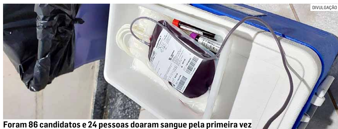
Foram 86 candidatos e 24 pessoas doaram sangue pela primeira vez

De acordo com a Secretária de Saúde de Monte Mor, todo o sangue coletado será enviado ao Banco de Sangue da Unicamp que abastece o banco regional.