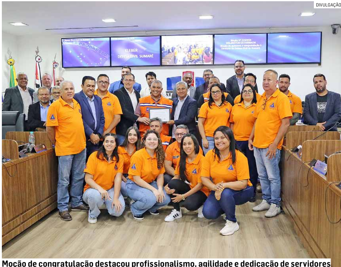
Moção de congratulação destacou profissionalismo, agilidade e dedicação de servidores

Conforme o vereador, durante o temporal que atingiu Sumaré no dia 3 de novembro, a Defesa Civil Municipal atuou de forma imediata, coordenada e incansável, realizando atendimentos emergenciais, orientando a população e promovendo ações de mitigação de riscos. A tempestade foi acompanhada de