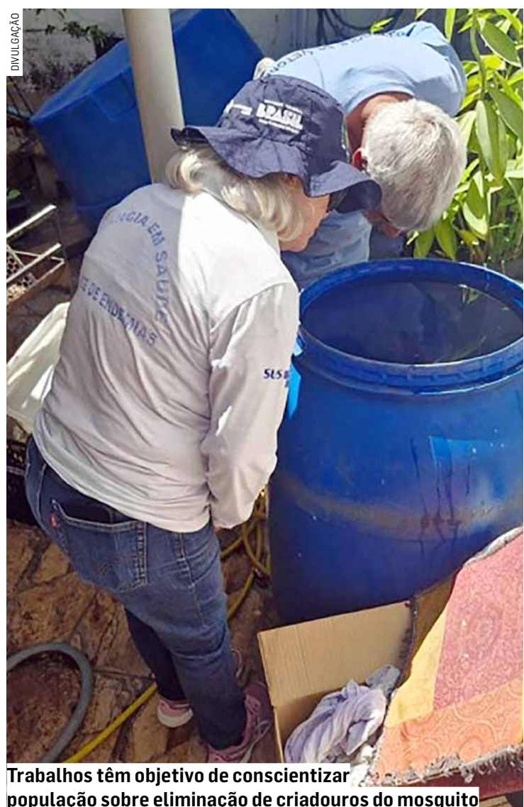
Trabalhos têm objetivo de conscientizar população sobre eliminação de criadouros do mosquito