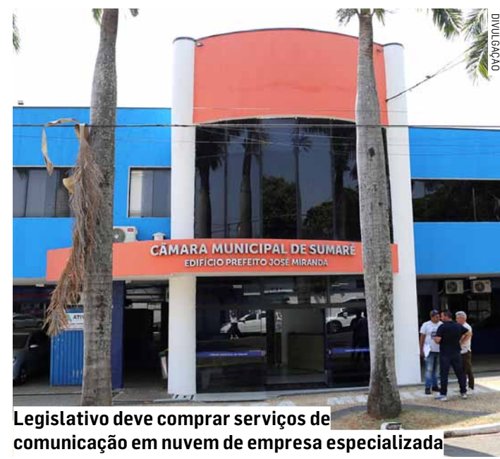
Legislativo deve comprar serviços de comunicação em nuvem de empresa especializada

O objeto do pregão é a contratação de empresa especializada em serviços de comunicação em nuvem, que deverá oferecer ramais físicos e virtuais (softphone), serviço de comunicação unificada, call center, serviços de operadora e equipamentos com sobrevivência. O processo visa ampliar a capacidade tecnológica da instituição.