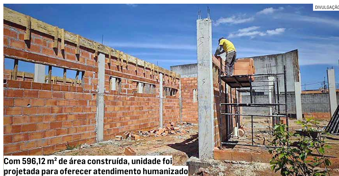
Com 596,12 m² de área construída, unidade foi projetada para oferecer atendimento humanizado