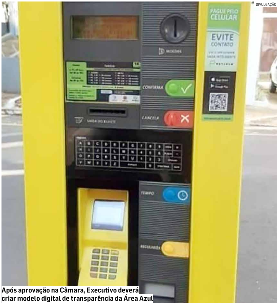
Após aprovação na Câmara, Executivo deverá criar modelo digital de transparência da Área Azul

Proposta obriga Prefeitura de Americana a divulgar, mensalmente, os relatórios com dados de receitas, autuações e a destinação de dinheiro obtido pelo sistema rotativo pago; comissão já recomendou rescisão de contrato com empresa