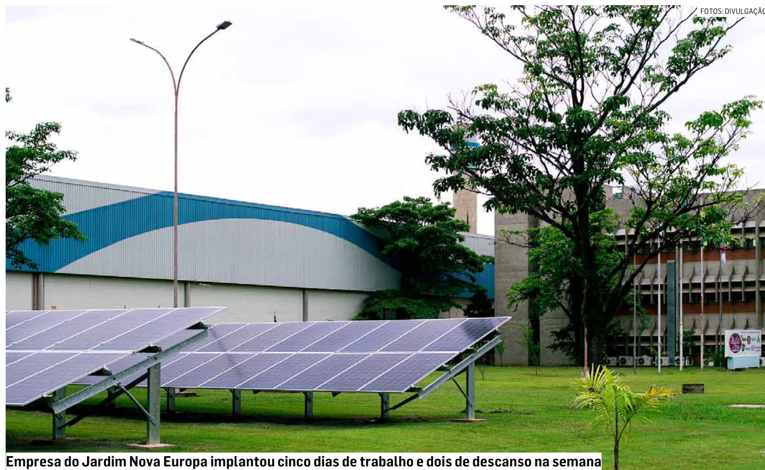
Empresa do Jardim Nova Europa implantou cinco dias de trabalho e dois de descanso na semana

Empresa do setor de embalagens plásticas passou a ter novo regime de jornada, que reduziu carga de 44 para 36 horas semanais sem alteração salarial, beneficiando mais de 300 colaboradores; companhia diz que pode inspirar indústrias