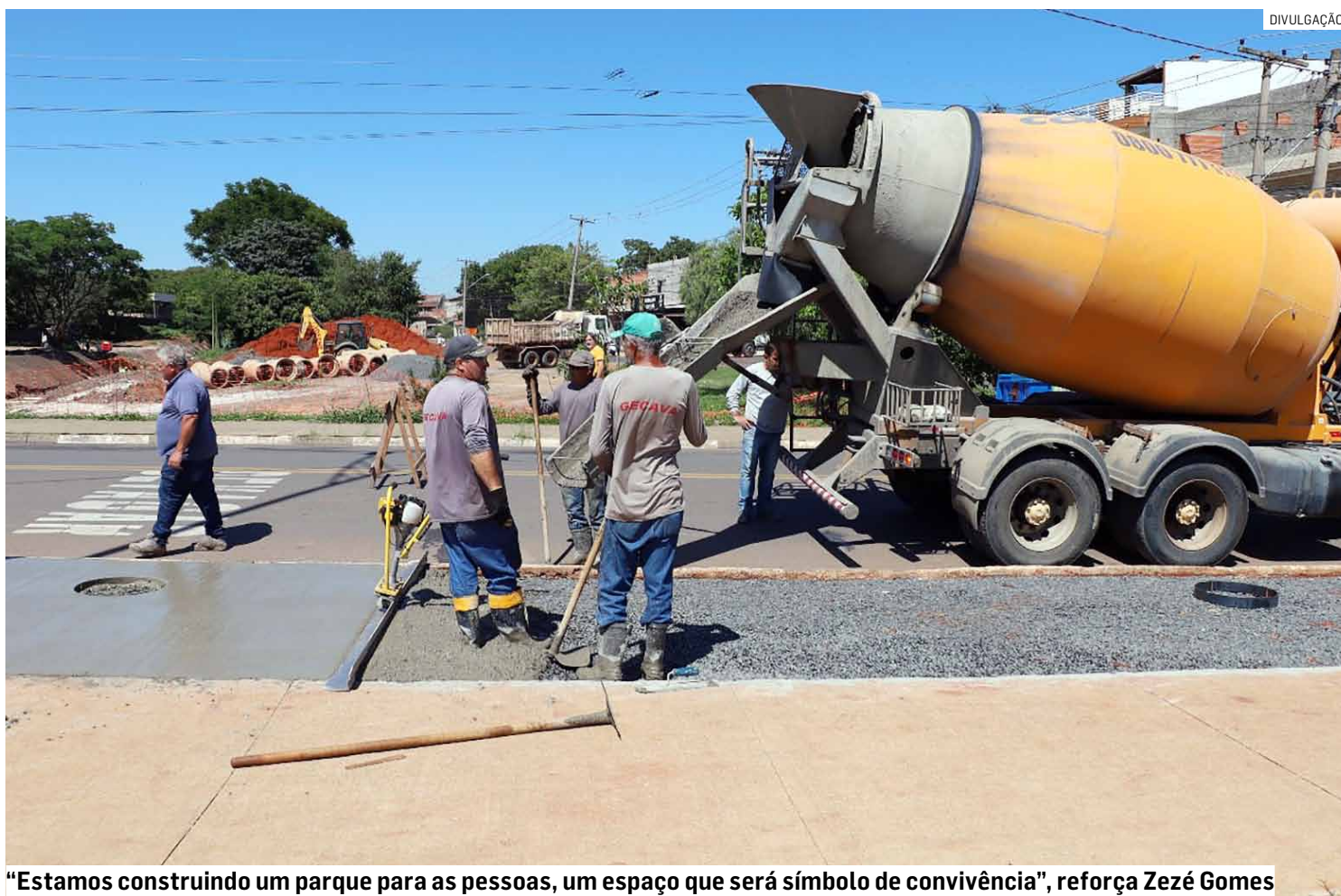
“Estamos construindo um parque para as pessoas, um espaço que será símbolo de convivência”, reforça Zezé Gomes

Idealizado pelo prefeito Zezé Gomes, o maior parque da cidade avança em ritmo acelerado com obras de calçamento, canalização e paisagismo, abrindo caminho para um novo espaço de lazer, esporte e convivência comunitária