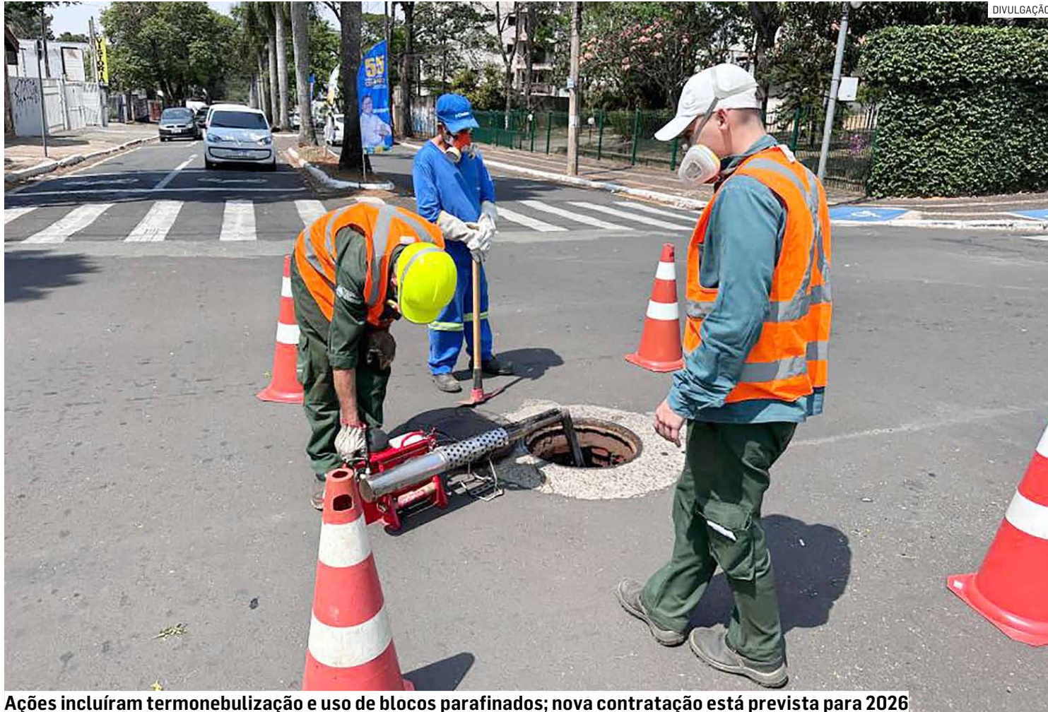
Ações incluíram termonebulização e uso de blocos parafinados; nova contratação está prevista para 2026

Segundo as informações prestadas, o município dispõe de um cronograma anual de desbaratização e desratização, elaborado pela Zoonoses e executado pela CODEN, por meio de empresa especializada contratada para esta finalidade.