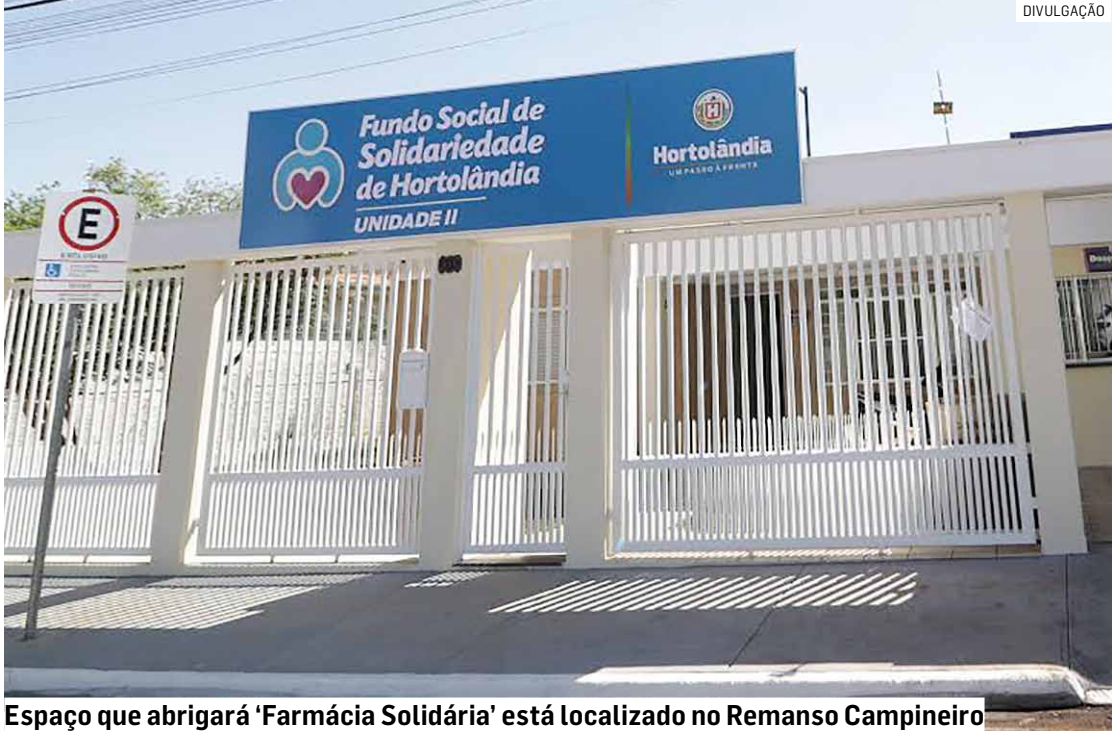
Espaço que abrigará ‘Farmácia Solidária’ está localizado no Remanso Campineiro

“O serviço do Fundo Social aumentou muito e a sede que temos hoje está pequena para todos os projetos. Sonhamos com algo mais: construir uma sede do Fundo Social. Até lá, a gente vai ficar com dois espaços: esse em que nós já estamos e esse outro que vamos inaugurar, on-