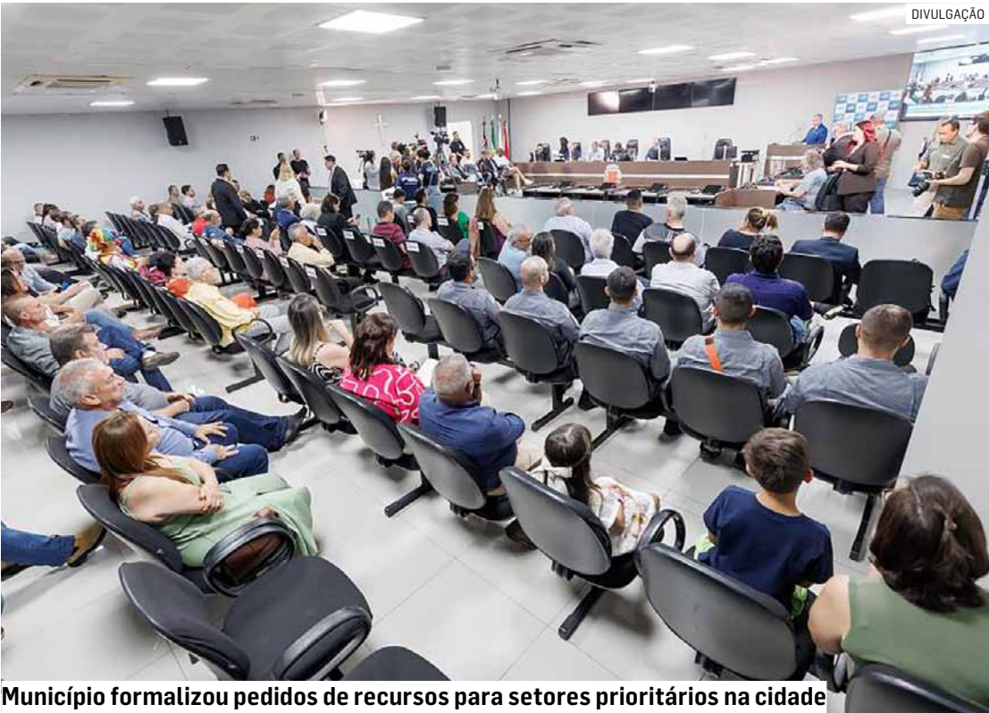
Município formalizou pedidos de recursos para setores prioritários na cidade

Da Redação • NOVA ODESSA tribunaliberal@tribunaliberal.com.br