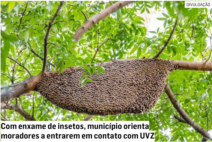
Com enxame de insetos, município orienta moradores a entrarem em contato com UVZ

O veterinário reforça que em imóveis particulares o órgão não faz a remoção ou a eliminação do enxame, e orienta o ocupante do imóvel sobre como proceder nessa situação. “Não se pode matar esses insetos, pois eles são considerados animais silvestres. Por