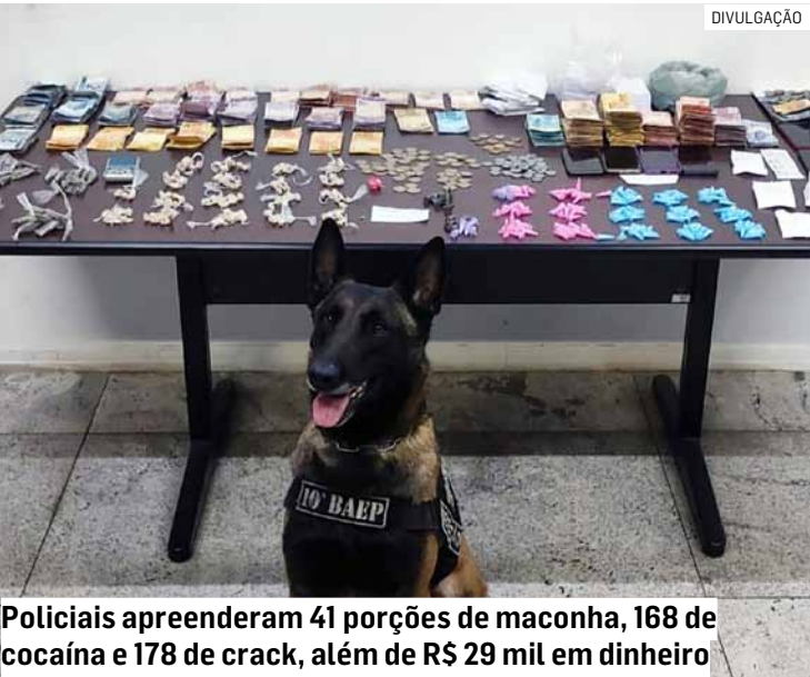
Policiais apreenderam 41 porções de maconha, 168 de cocaína e 178 de crack, além de R$ 29 mil em dinheiro

afirmaram que foram contratados para comercializar drogas no local. O homem flagrado comprando a droga também foi conduzido. Ao todo, foram apreendidas 41 porções de maconha, 168 pinos de cocaína, 178 papелotes de crack, uma balança de precisão, duas máquinas de cartão, seis celulares e R$ 29,4 mil em espécie. Os presos foram levados ao Centro de Polícia Judiciária de Americana, onde permaneceram à disposição da Justiça.