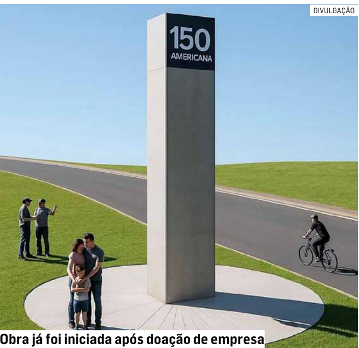
Obra já foi iniciada após doação de empresa

Em homenagem ao aniversário de 150 anos de sua fundação, Americana vai ganhar mais um presente: um monumento de 7 metros de altura está sendo construído em frente ao Portal Princesa Tecelã, na Avenida Antônio Pinto Duarte, próximo ao espaço onde foi instalada a Cápsula do Tempo. O objetivo é proporcionar à entrada da cidade um visual mais imponente, destacando Americana como uma cidade pujante. O monumento será feito em concreto pré-moldado.