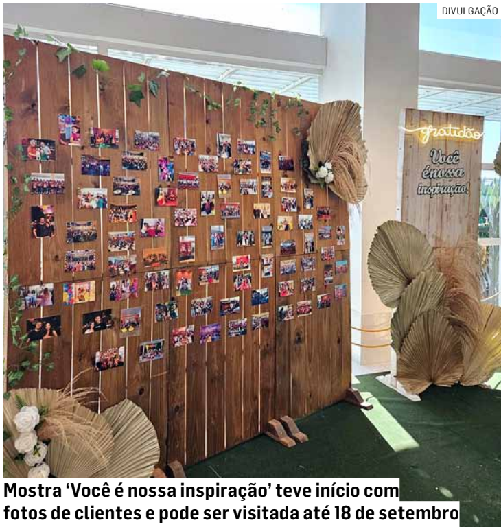
Mostra 'Você é nossa inspiração' teve início com fotos de clientes e pode ser visitada até 18 de setembro