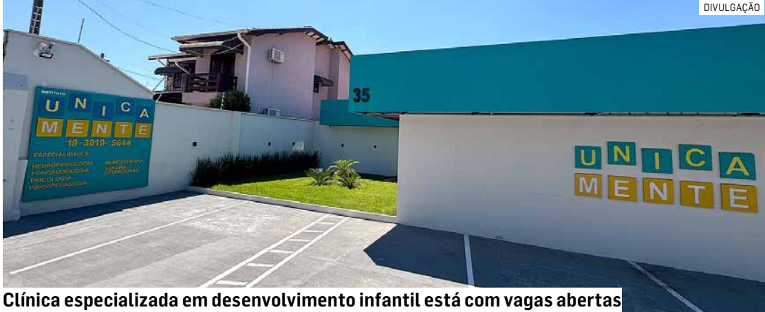
Clínica especializada em desenvolvimento infantil está com vagas abertas

O Instituto Unicamente, clínica especializada em desenvolvimento infantil, está com vagas de emprego abertas nas áreas de psicologia, fonoaudiologia, terapia ocupacional, coordenação ABA (Análise do Comportamento Aplicada), musicoterapia, recepcionista e auxiliar de limpeza. Os profissionais atuarão nas unidades de Hortolândia e Monte Mor. Para participar do processo seletivo, os interessados devem enviar currículo no e-mail: contato@institutounicamente.com.br. Informações sobre os cargos podem ser ob-