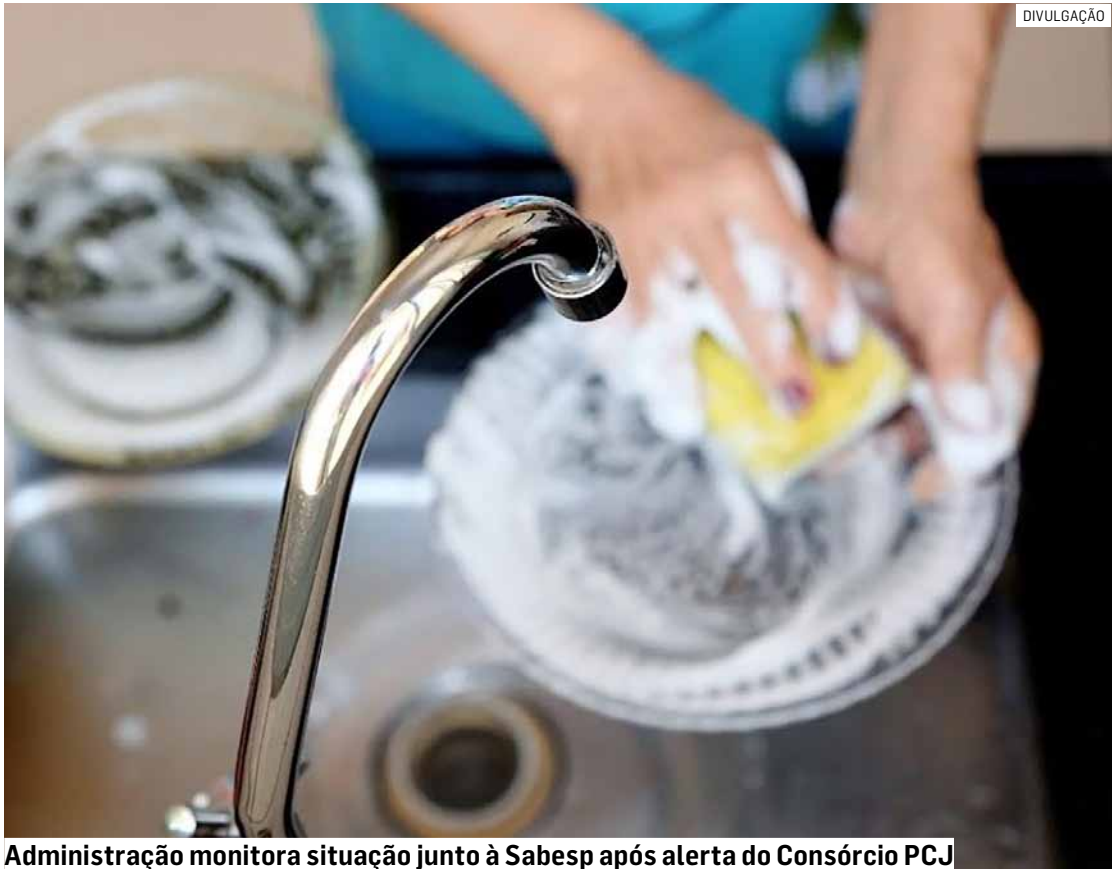
Administração monitora situação junto à Sabesp após alerta do Consórcio PCJ

Segundo o documento, o Sistema Cantareira registrou 34,6% de volume de água no final de agosto