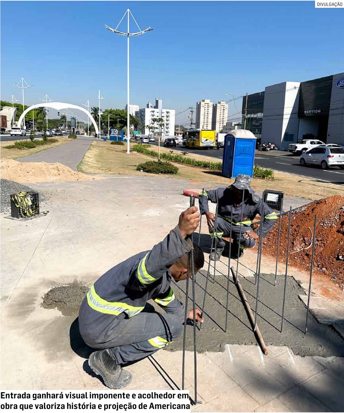
Entrada ganhará visual imponente e acolhedor em obra que valoriza história e projeção de Americana

Monumento de sete metros é levantado em frente ao Portal Princesa Tecelã, logo na entrada da cidade, após doação feita pela Sudeste Pré-Fabricados, simbolizando força, defesa e proteção; estrutura em pré-moldado terá quatro faces