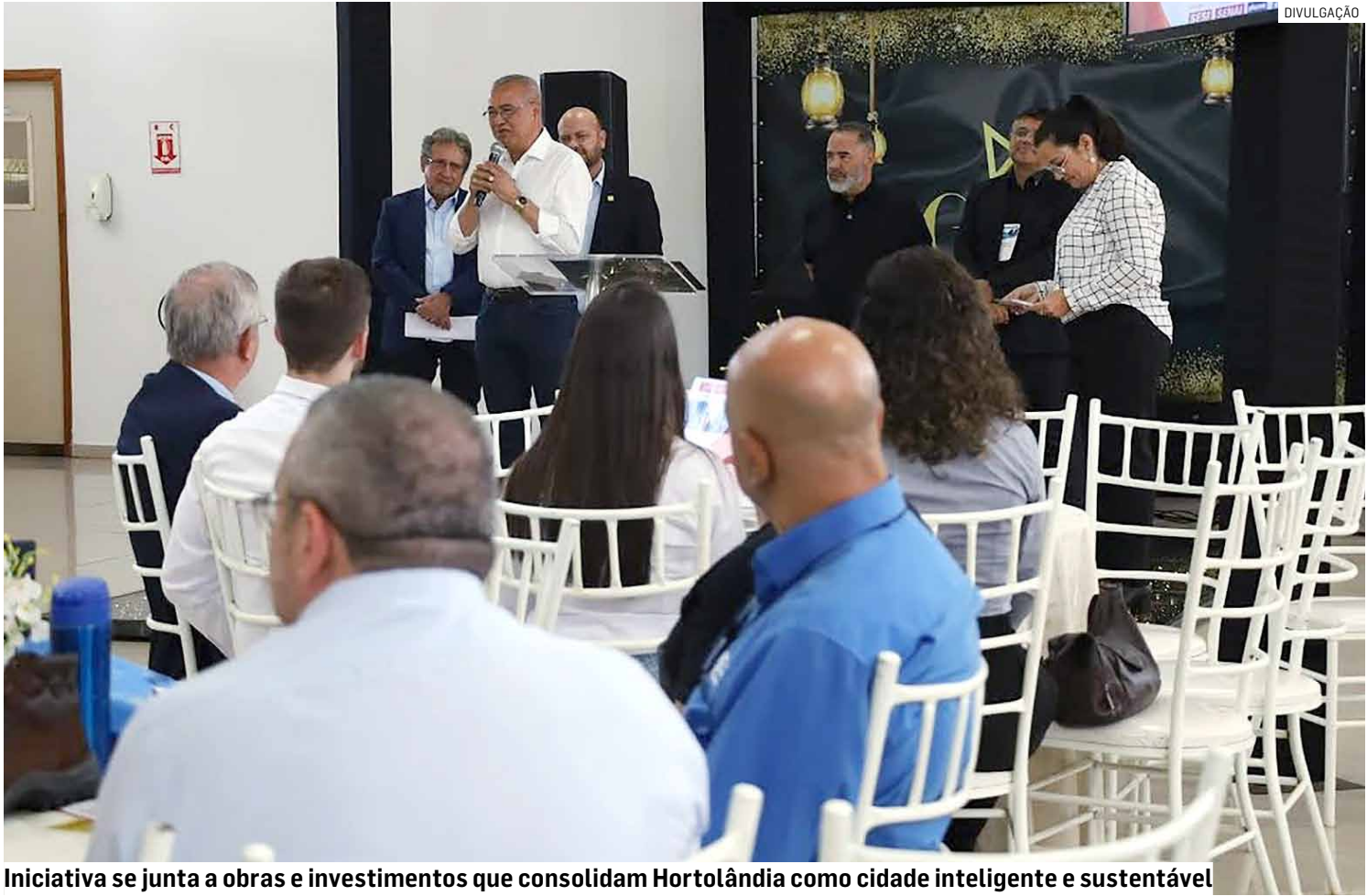
Iniciativa se junta a obras e investimentos que consolidam Hortolândia como cidade inteligente e sustentável

A proposta do evento foi proporcionar um ambiente para networking e fecha-