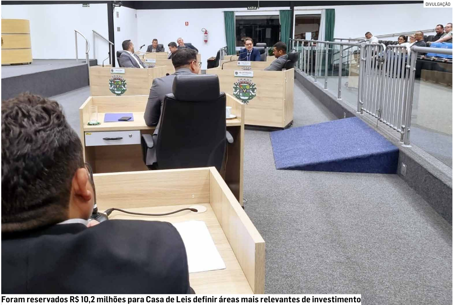
Foram reservados R$ 10,2 milhões para Casa de Leis definir áreas mais relevantes de investimento

A mudança é assinada por todos os vereadores e segue entendimento recente do Supremo Tribunal Federal (STF). A iniciativa busca garantir previsibilidade de recursos e fortalecer a rede de atendimento, especialmente para a população em situação