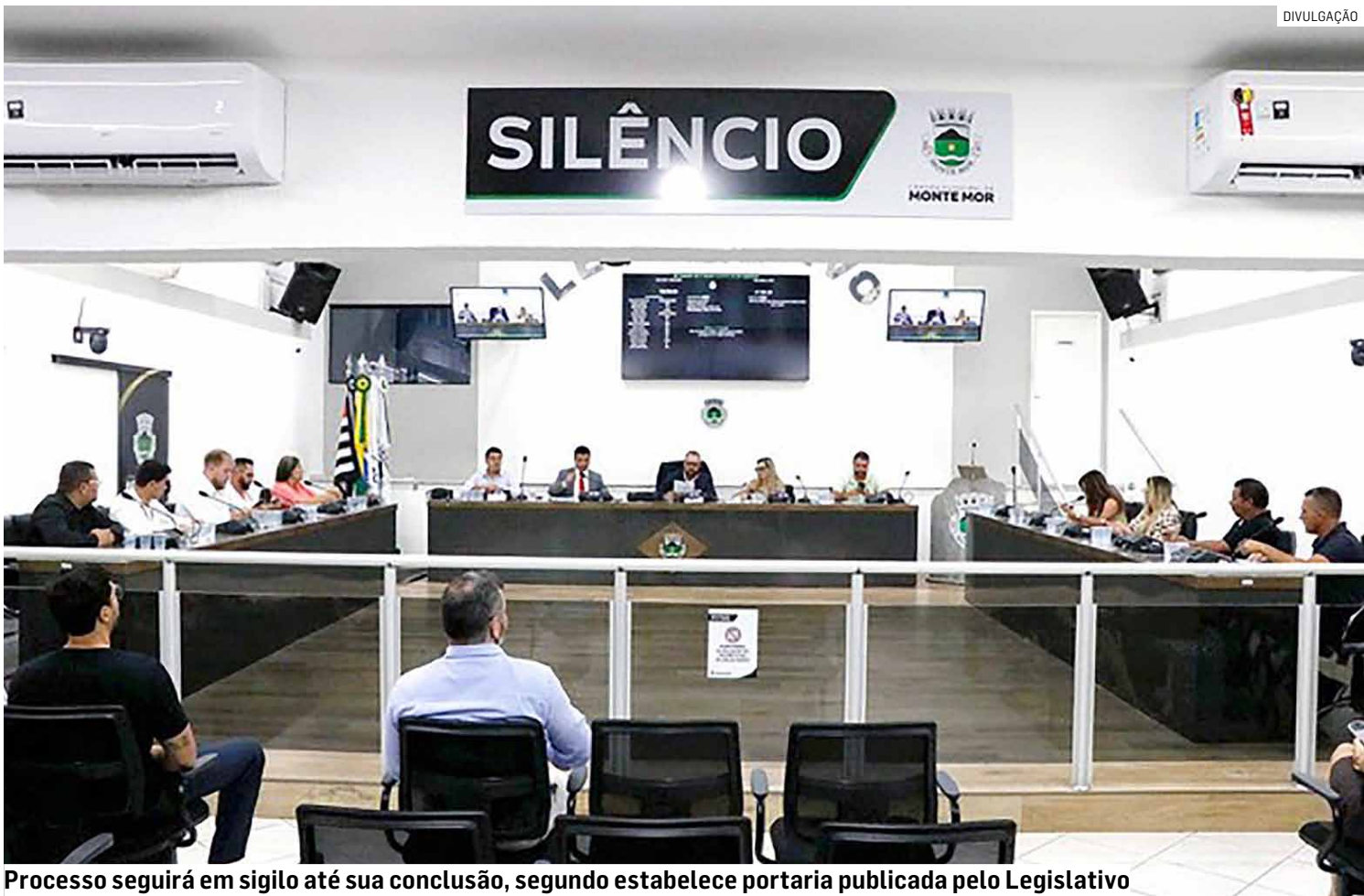
Processo seguirá em sigilo até sua conclusão, segundo estabelece portaria publicada pelo Legislativo