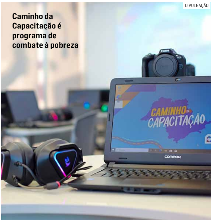
Caminho da Capacitação é programa de combate à pobreza