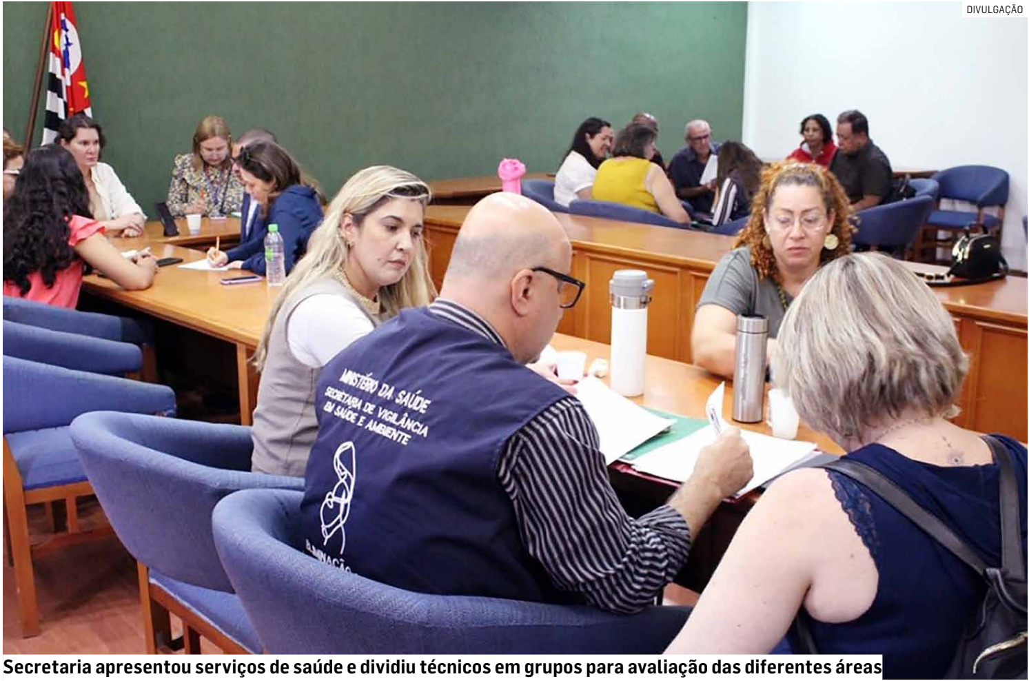
Secretaria apresentou serviços de saúde e dividiu técnicos em grupos para avaliação das diferentes áreas

Na abertura da programação, no Centro Administrativo de Nova Vene-