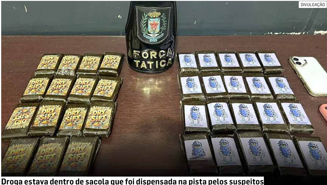
Droga estava dentro de sacola que foi dispensada na pista pelos suspeitos

Durante patrulhamento tático na noite desta quarta-feira (10), equipes do 8º Batalhão de Polícia Militar do Interior receberam informações sobre um veículo roubado em Campinas. O carro estava sendo acompanhado por outras viaturas quando entrou na área de Hortolândia. Na Rodovia Campinas-Monte Mor (SP-101), os policiais da Força Tática avisaram o automóvel em alta velocidade, realizando manobras perigosas em “zigue-zague”, o que motivou o início de um acompanhamento tático. Durante a perseguição,