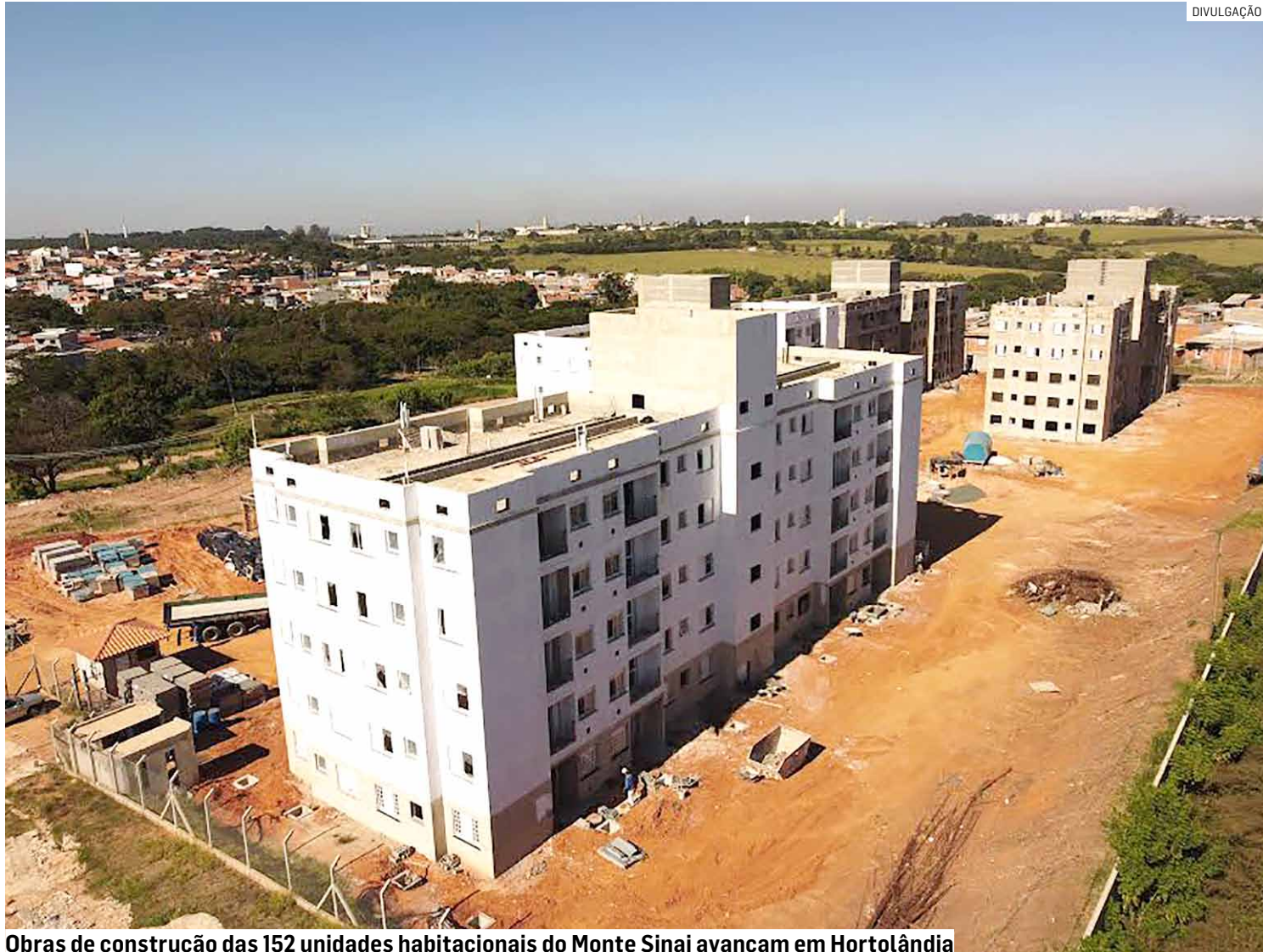
Obras de construção das 152 unidades habitacionais do Monte Sinai avançam em Hortolândia

Além da construção das habitações, são diversas frentes de trabalho inten-