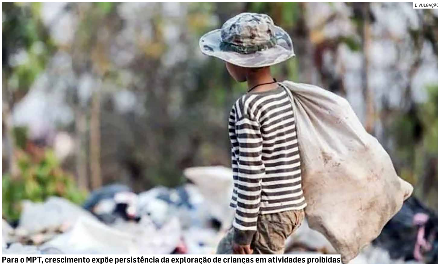
Para o MPT, crescimento expõe persistência da exploração de crianças em atividades proibidas

O avanço observado na região acompanha uma tendência registrada em toda a área de atuação do MPT, que engloba 599 municípios do interior paulista e do litoral norte. No acumulado dos cinco primeiros meses de 2026, foram registradas 448 denúncias de trabalho infantil nas regiões citadas, contra 221 no mesmo período do ano passado, uma alta de 102%.