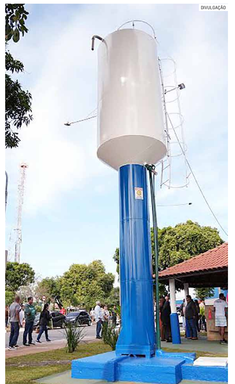
“A área está muito bonita, renovada e a qualidade da água que vai abastecer as pessoas está garantida”, destaca Zezé

A revitalização também contemplou melhorias no entorno. Equipes da Secretaria de Mobilidade Urbana reforçaram a sinalização viária nas ruas Osvaldo Ribeiro Carrilho, Ida Amáudio e José Pereira Lira, promovendo mais segurança para motoristas, pedestres e ciclistas. Foram revitalizadas faixas de pedestres, demarcadas vagas rápidas para estacionamento, reforçadas as sinalizações de transporte coletivo e implantadas marcações especiais para travessia de animais de estimação.