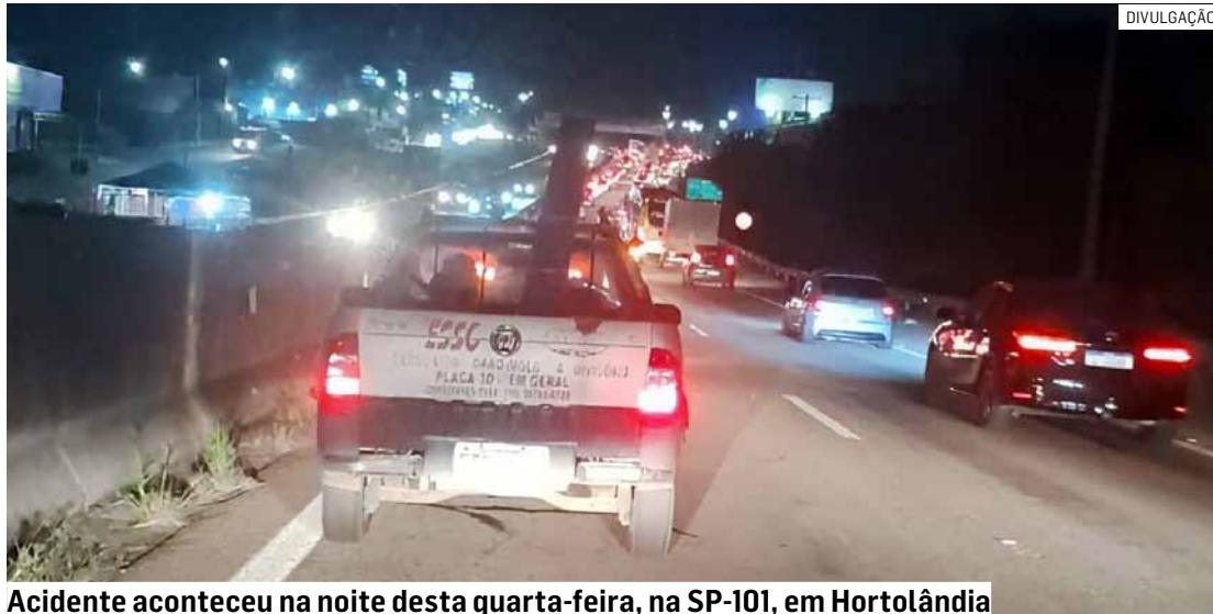
Acidente aconteceu na noite desta quarta-feira, na SP-101, em Hortolândia

Equipes de resgate da concessionária responsável