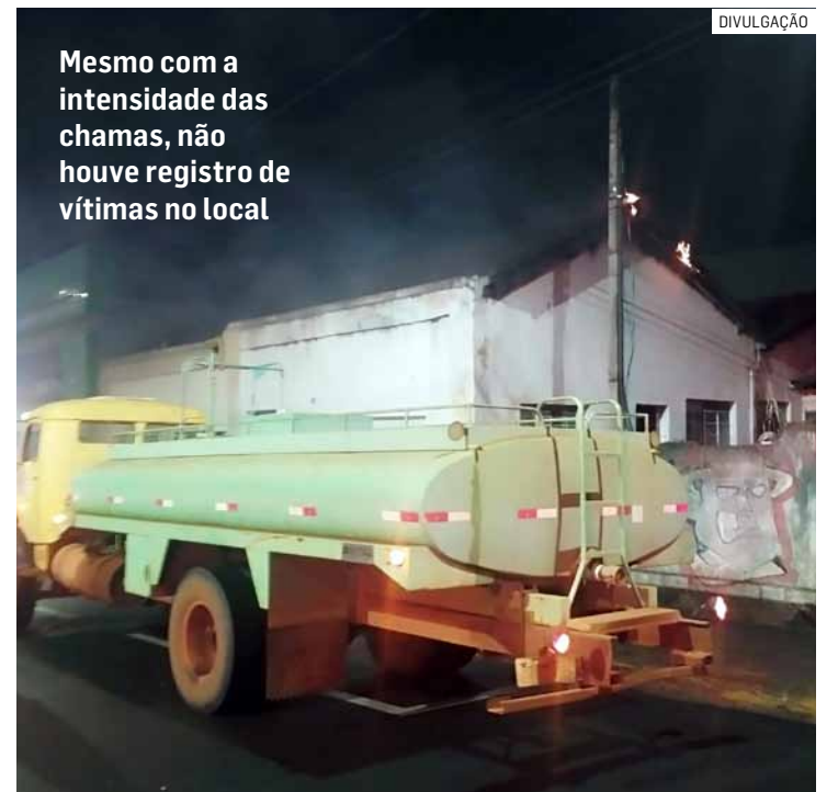
Mesmo com a intensidade das chamas, não houve registro de vítimas no local

Após o controle total das chamas, a área foi deixada em segurança para a realização dos trabalhos de perícia, caso sejam necessários. As causas do incêndio deverão ser apuradas pelas autoridades competentes. O caso foi registrado e será acompanhado pelos órgãos responsáveis.