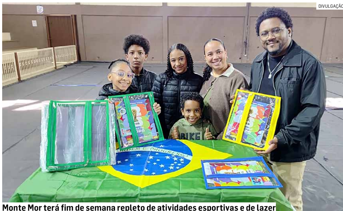
Monte Mor terá fim de semana repleto de atividades esportivas e de lazer

A programação começa nesta sexta-feira (12), com a equipe de futsal Sub-14 de Monte Mor enfrentando o Ajax, de Capivari, pela Liga Regional de Futsal. A partida será realizada às 19h, no Ginásio Ronaldão, em Capivari. No sábado (13), as equipes masculina e feminina de vôlei Sub-17 disputam amistosos contra Nova Odessa, na cidade adversária, dando sequência à preparação para as competições da temporada.