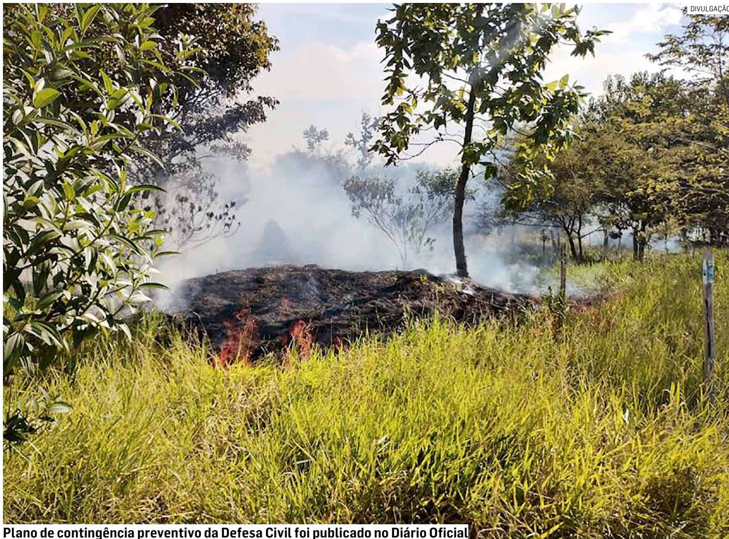
Plano de contingência preventivo da Defesa Civil foi publicado no Diário Oficial

Além de medidas de sensibilização e orientação à população, tendo em vista a prevenção a queimadas e focos de incêndio, o município realiza o acompanhamento da qualidade