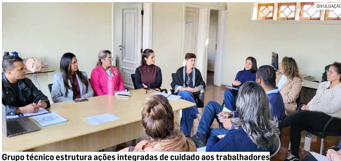
Grupo técnico estrutura ações integradas de cuidado aos trabalhadores

Participaram da reunião equipes técnicas da Atenção Primária à Saúde, Atenção Especializada, Urgência e Emergência, Serviço Especializado em Engenharia de Segurança e em Medicina do Trabalho (SESMT) e representantes da Comissão In-