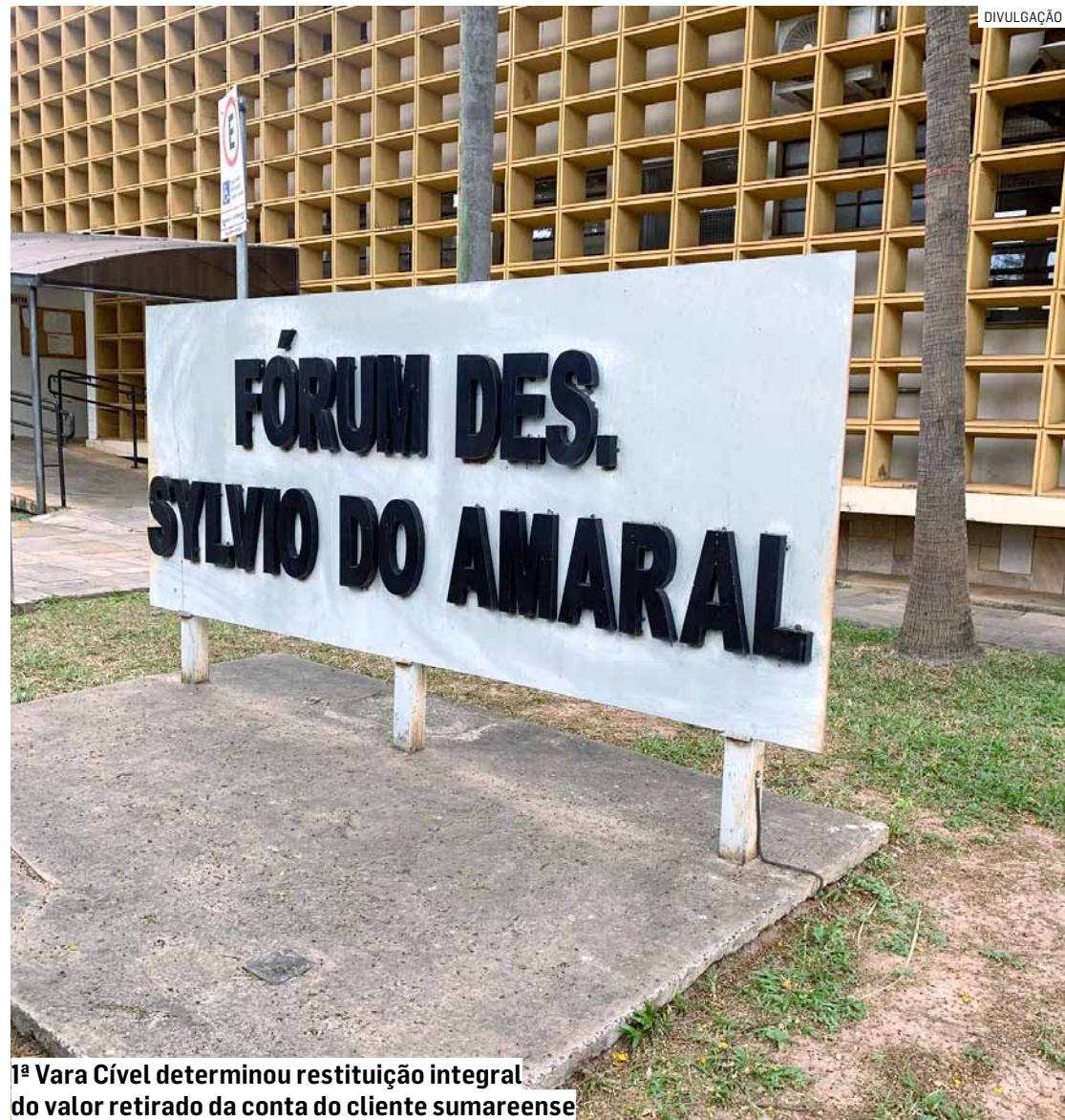
1ª Vara Cível determinou restituição integral do valor retirado da conta do cliente sumareense

1ª Vara Cível reconheceu falha na segurança bancária após cliente perder R$ 2,2 mil em fraude por meio de aplicativo de mensagens e entendeu que instituição financeira não comprovou regularidade de transação, gerando condenação