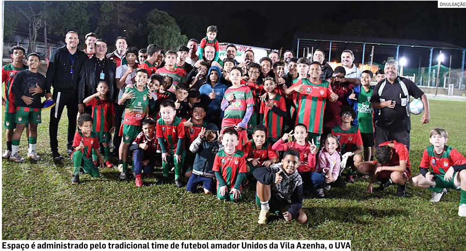
Espaço é administrado pelo tradicional time de futebol amador Unidos da Vila Azenha, o UVA

Com a nova iluminação, o espaço administrado pelo tradicional time de futebol amador Unidos da Vila Azenha (UVA), conhecido na cidade como uma das maiores forças do esporte e da comunidade, passará a ser utilizado também no período noturno. O projeto teve um custo de R$ 473.540,00 e foi viabilizado por um convênio com a Secretaria de Governo e Relações Insti-