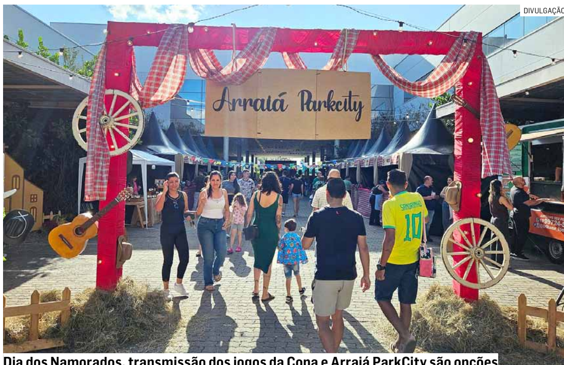
Dia dos Namorados, transmissão dos jogos da Copa e Arraiá ParkCity são opções

A campanha “Amor que Aproxima”, que comemora o Dia dos Namorados, segue oferecendo aos clien-