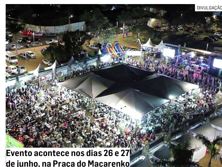
Evento acontece nos dias 26 e 27 de junho, na Praça do Macarenko

“Com a participação de 15 entidades assistenciais do município, o tradicional evento reverte 100% da energia festiva em apoio a quem mais precisa”, destacou a prefeitura.