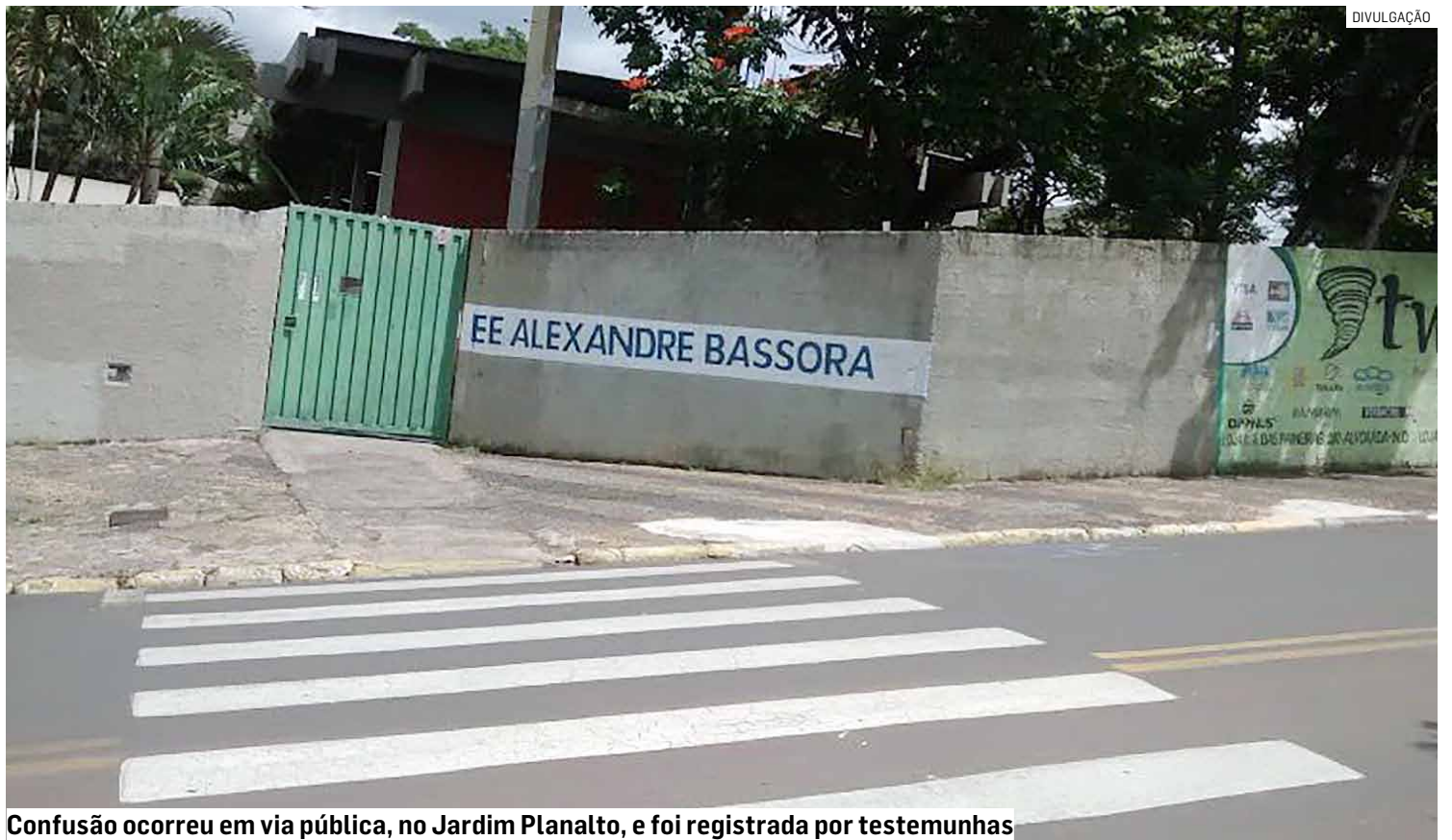
Confusão ocorreu em via pública, no Jardim Planalto, e foi registrada por testemunhas

O caso chamou a atenção de moradores e usuários das redes sociais, que passaram a compartilhar as