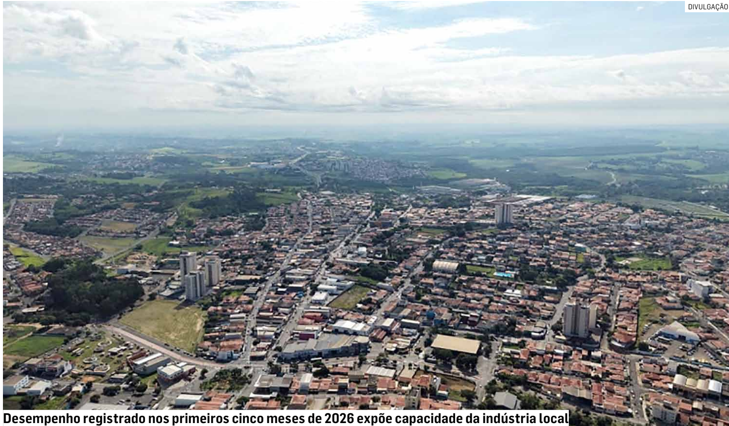
Desempenho registrado nos primeiros cinco meses de 2026 expõe capacidade da indústria local

Além disso, a cidade registrou US$ 17,81 milhões em exportações de papel e cartão revestidos, garantindo o primeiro lugar entre os municípios paulis-