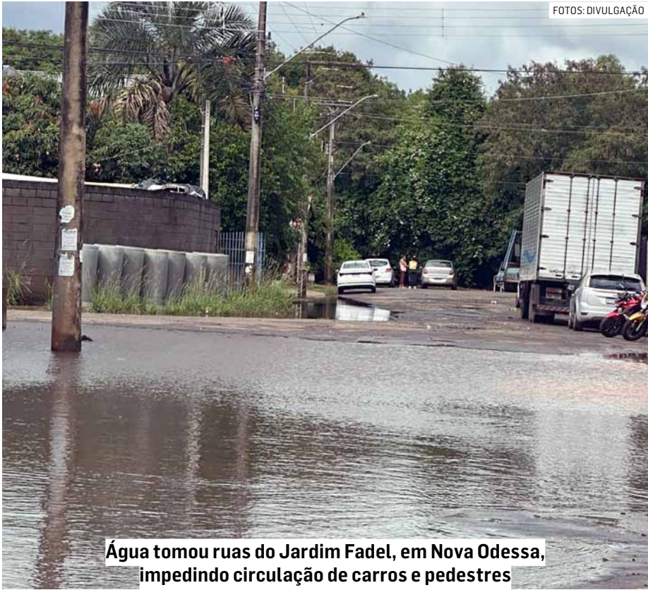
Água tomou ruas do Jardim Fadel, em Nova Odessa, impedindo circulação de carros e pedestres

uma das mais atingidas. As vias localizadas na parte final do bairro, como a Rua Bento Toledo Rodovallo e a Rua João Barbosa, ficaram parcialmente submersas. Trabalhadores relataram dificuldades para transitar durante a madrugada e início da manhã. A Rodovia Astrônomo Jean Nicolini, que liga Americana a Nova Odessa, também registrou acúmulo de água.