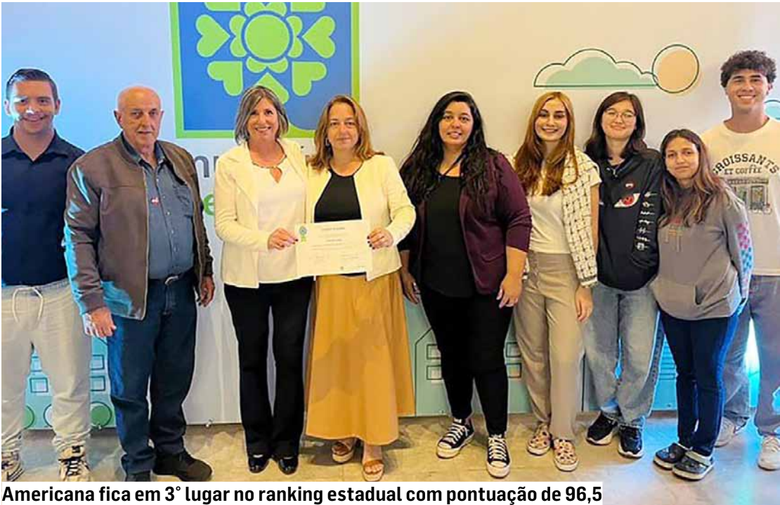
Americana fica em 3º lugar no ranking estadual com pontuação de 96,5