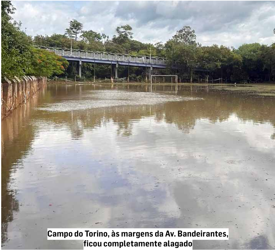
Campo do Torino, às margens da Av. Bandeirantes, ficou completamente alagado

Em Nova Odessa, a região do Jardim Fadel foi