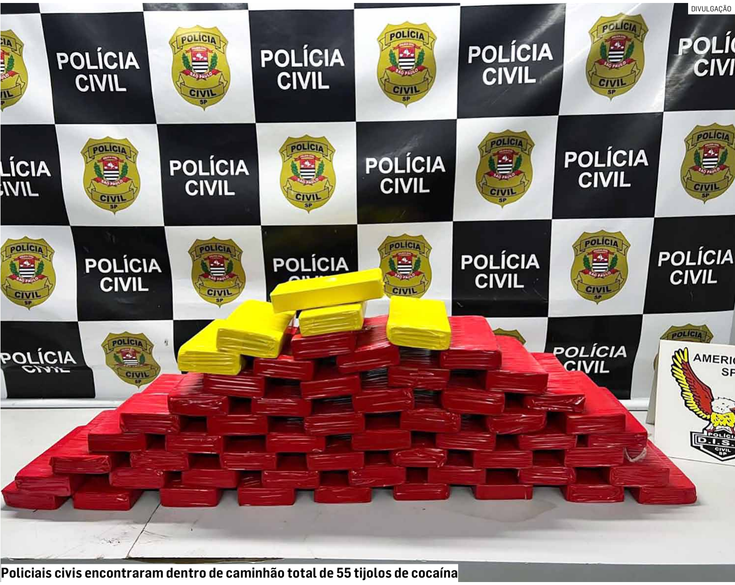
Policiais civis encontraram dentro de caminhão total de 55 tijolos de cocaína

Após os trâmites legais, o suspeito passou por exame cautelar e foi levado à Cadeia Pública de Sumaré, onde permanece detido à disposição da Justiça.