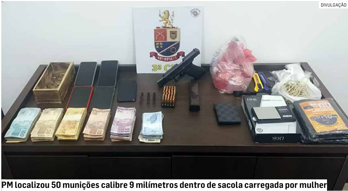
PM localizou 50 munições calibre 9 milímetros dentro de sacola carregada por mulher

Cézar Oliveira • HORTOLÂNDIA tribunaliberal@tribunaliberal.com.br