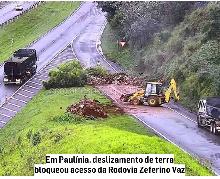
Em Paulínia, deslizamento de terra bloqueou acesso da Rodovia Zeferino Vaz

O alerta previa chuva forte, ventos intensos e chance de granizo, com rajadas de vento entre 60 e 100 km/h.