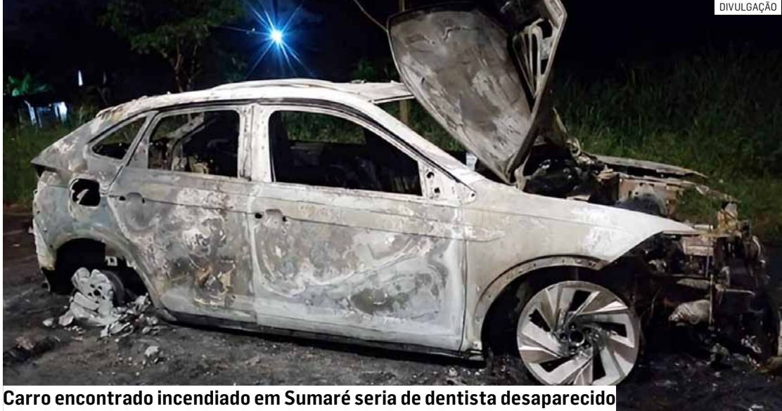
Carro encontrado incendiado em Sumaré seria de dentista desaparecido

O dentista seguiu para um motel localizado na