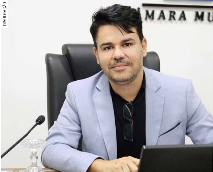
Projeto assegura atendimento especializado para crianças e jovens com TEA, paralisia cerebral e síndromes neurológicas

O projeto estabelece que o centro será responsável por serviços de fisioterapia neurofuncional baseados em protocolos cientificamente validados, com foco na recuperação, manutenção e otimização de funções motoras, sensorio-motoras e posturais. O atendimento ocorrerá exclusivamente mediante encaminhamento médico pela rede pública, garantin-