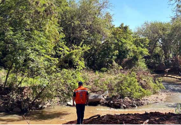
Município diz que continuará acompanhando cenário climático

A chuva que atingiu Sumaré na tarde desta terça-feira (9) apresentou impacto mínimo no município, de acordo com balanço divulgado pela Defesa Civil. Os tradicionais pontos com recorrência de alagamentos permaneceram estáveis e não houve registro de enchentes, reflexo das ações preventivas realizadas pela administração municipal. O único impacto significativo foi a queda de três árvores, todas atendidas pelas equi-