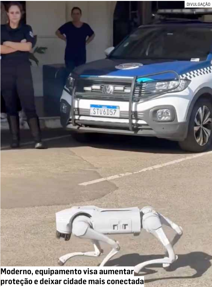
Moderno, equipamento visa aumentar proteção e deixar cidade mais conectada