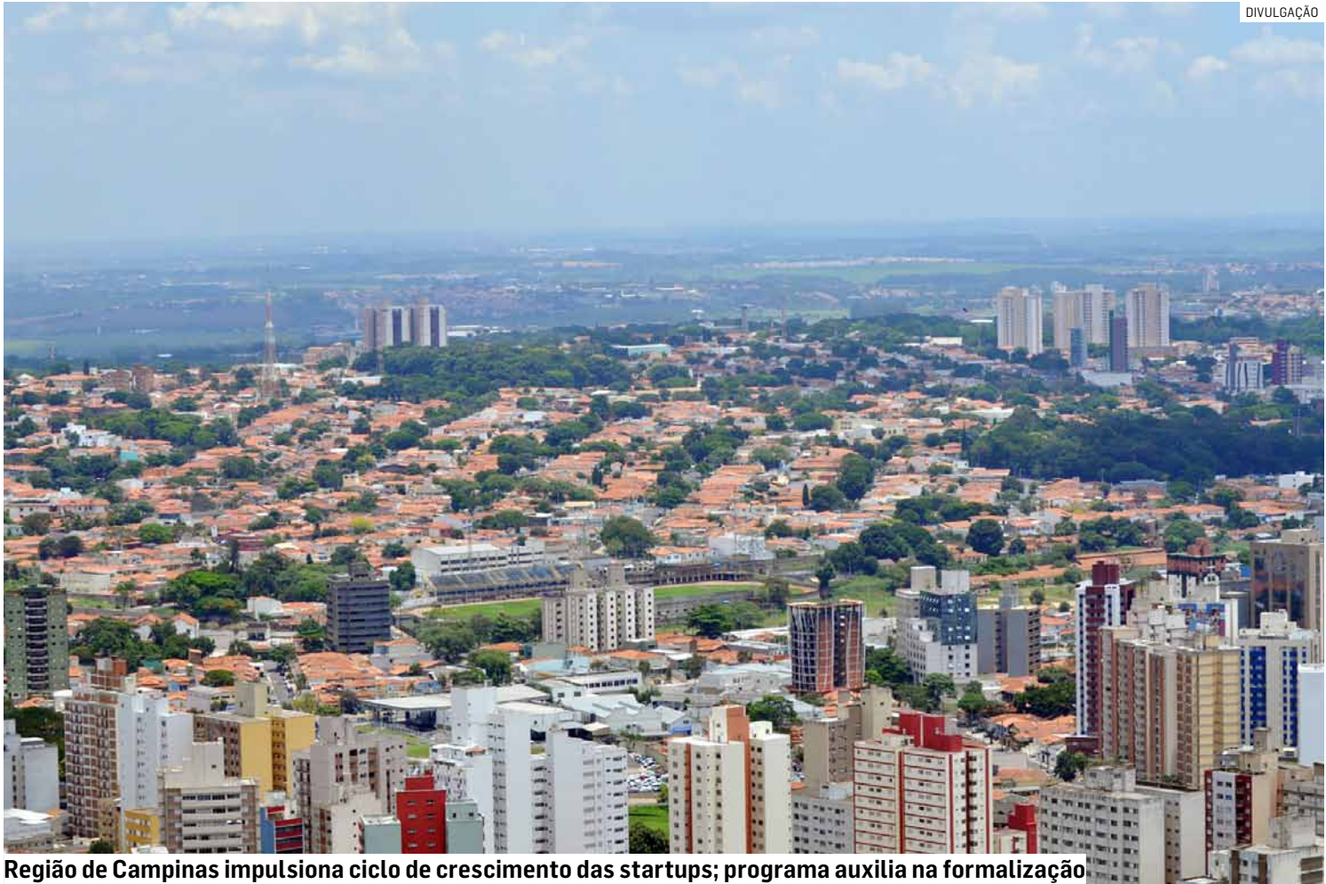
Região de Campinas impulsiona ciclo de crescimento das startups; programa auxilia na formalização.

O estudo também aponta que até maio de 2025