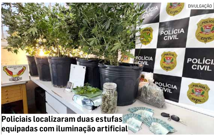
Policiais localizaram duas estufas equipadas com iluminação artificial

Segundo a polícia, durante as investigações, os agentes identificaram os moradores da residência, um vendedor de 41 anos, e uma padeira de 24 anos. Ambos eram monitorados. Com base nas infor-