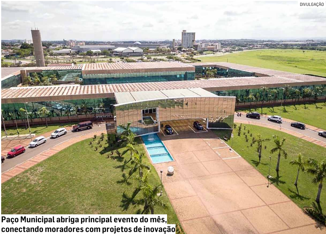
Paço Municipal abriga principal evento do mês, conectando moradores com projetos de inovação

O evento, que é totalmente gratuito, vai contar com uma dinâmica inovadora no setor público, já que reunirá seis ambientes diferentes com atividades simultâneas. Ao entrar no Paço Municipal, o público poderá ver de perto diversas ações tecnológicas das secretarias da cidade, que tornam a máquina pública mais eficiente. Em seguida, no hall de acesso aos auditórios, mais de 20 empresas vão expor suas práticas inovadoras, como por