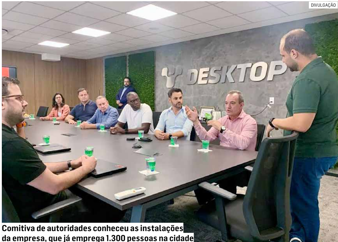
Comitiva de autoridades conheceu as instalações da empresa, que já emprega 1.300 pessoas na cidade

Fundada em 1997 em Sumaré, a Desktop está presente em 200 cidades do interior e litoral paulista oferecendo serviços de aces-