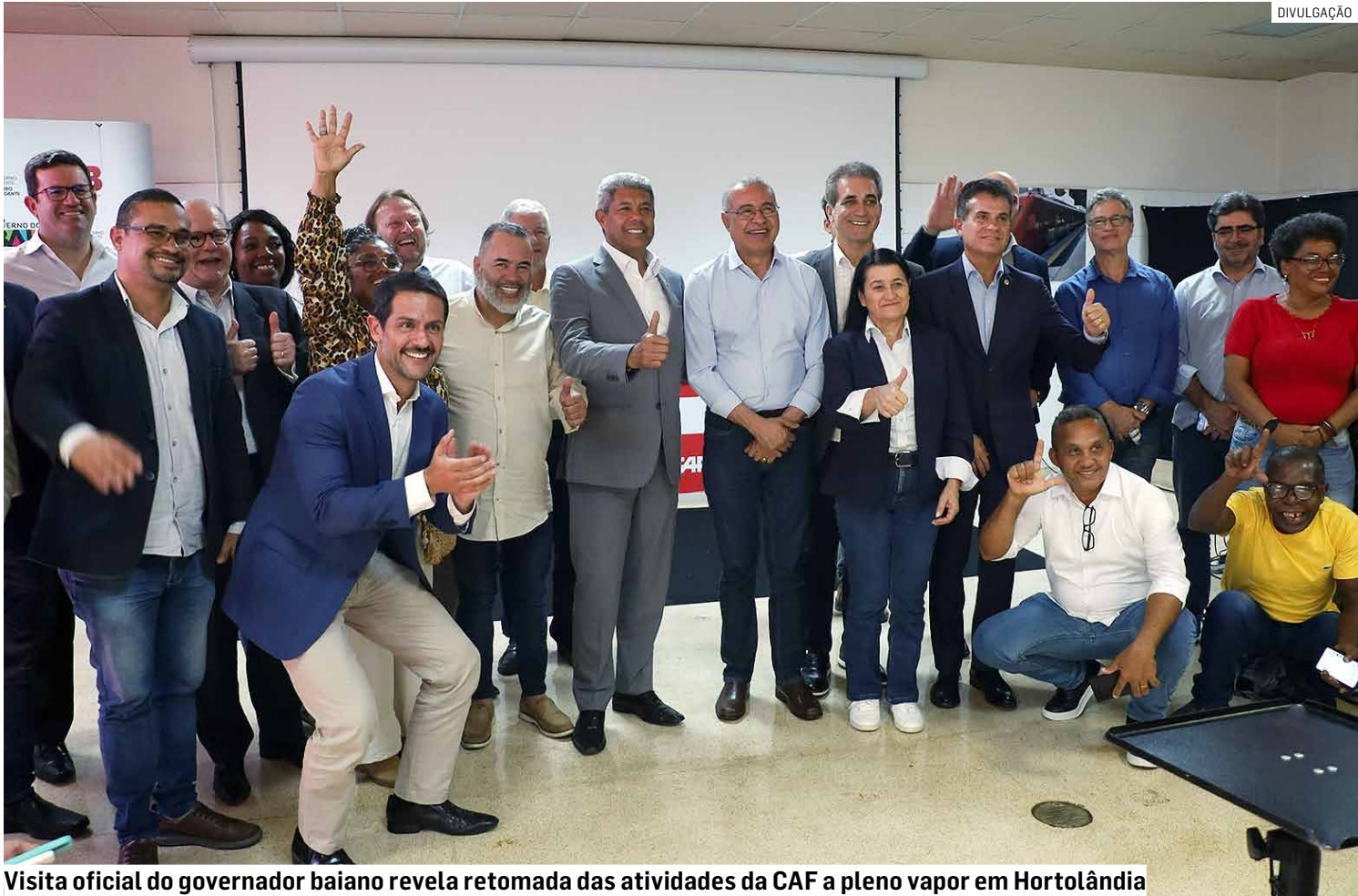
Visita oficial do governador baiano revela retomada das atividades da CAF a pleno vapor em Hortolândia

A visita destacou a importância da retomada das atividades da CAF em Hortolândia, empresa que, após um período de ociosidade, voltou a operar em plena capacidade graças ao contrato firmado com o Governo da Bahia. O acordo prevê a re-