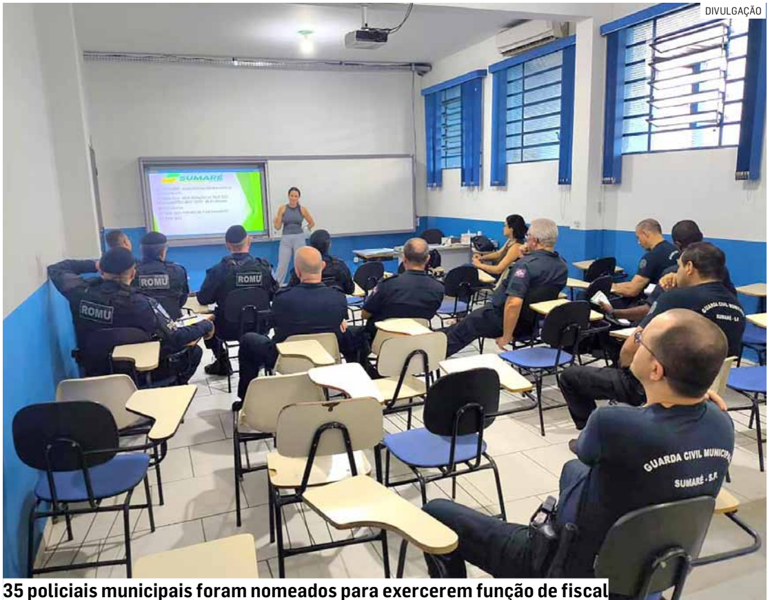
35 policiais municipais foram nomeados para exercerem função de fiscal

O treinamento aborda conteúdos fundamentais para a atuação dos novos fiscais, como legislação vigente, procedimentos de fiscalização, atendimento ao público e técnicas de mediação de conflitos. A proposta é oferecer