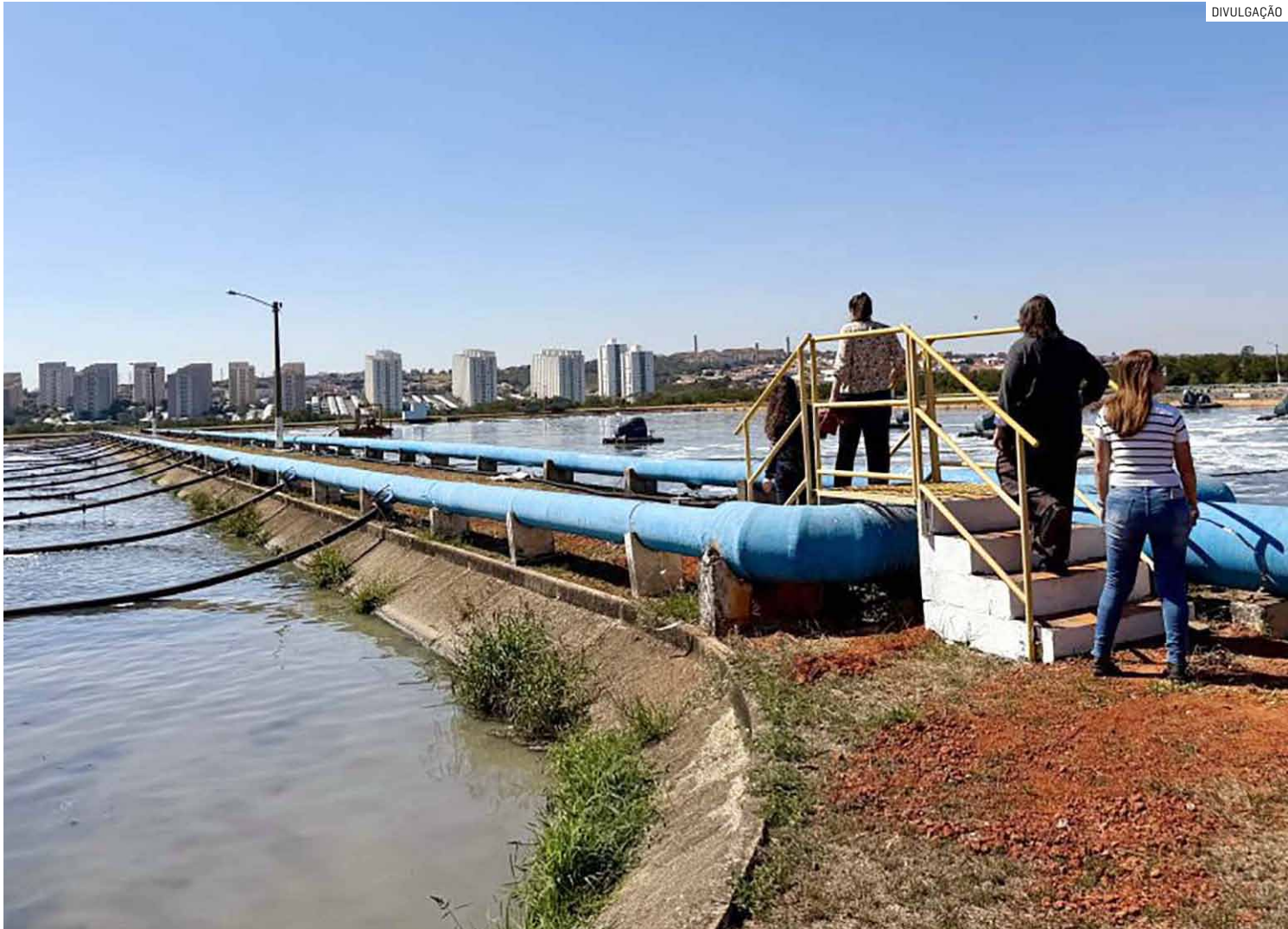
Secretaria de Estado afirma que medidas incluem controle de odor, modernização do sistema e remoção de lodo de lagoas

O problema com odores na ETE Hortolândia é antigo e tem sido alvo de ações de