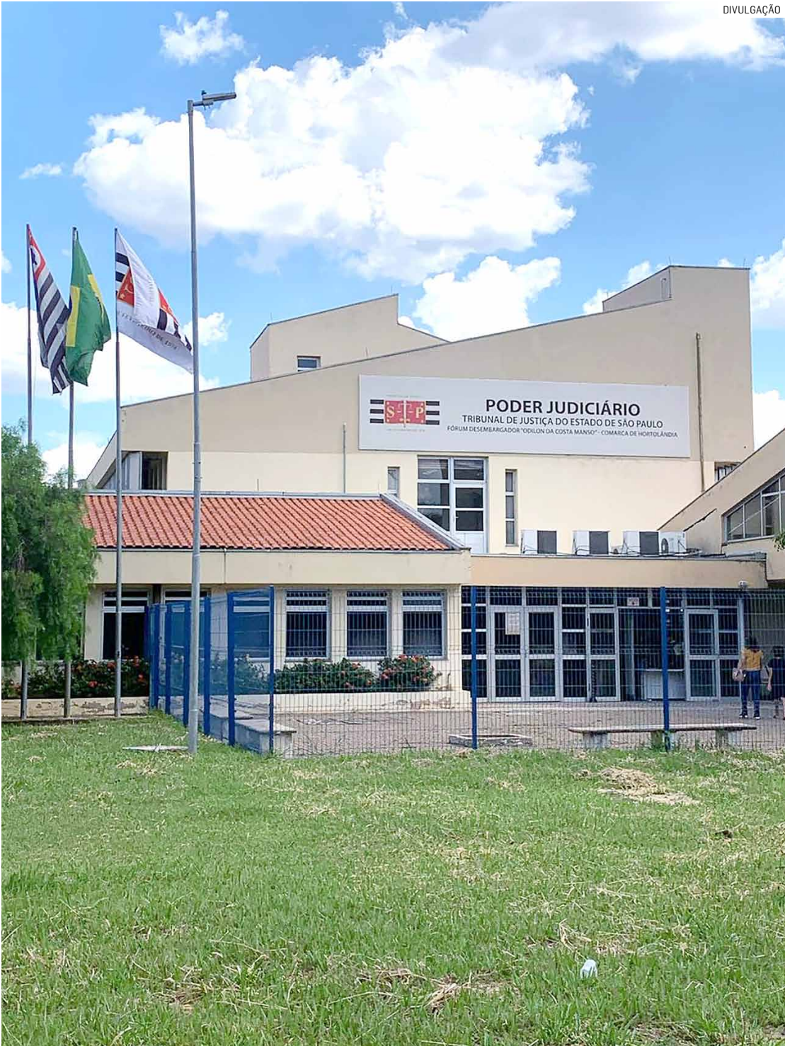
Decisão é do juiz Christiano Rodrigo Gomes de Freitas, da 2ª Vara Criminal de Hortolândia

A defesa dos réus recorreu da decisão e o caso tramita em instância superior.