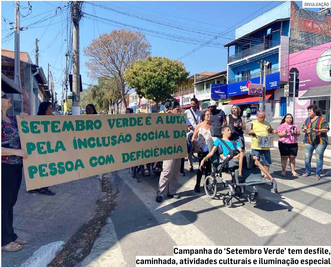
Campanha do 'Setembro Verde' tem desfile, caminhada, atividades culturais e iluminação especial

A fim de incluir e valorizar PCDs (Pessoas Com Deficiência) que vivem em Hortolândia, a prefeitura elaborou uma programação especial, com uma série de atividades gratuitas e abertas ao público, para o “Setembro Verde”, mês de inclusão da pessoa com deficiência. As atividades compiladas pela Secretaria de Inclusão e Desenvolvimento Social, por meio do DPP PCD (Departamento de Políticas Públicas para a Pessoa Com Deficiência), envolvem diversos órgãos municipais e entidades parceiras, como o IFSP (Instituto Federal de São Paulo), campus Hortolândia.