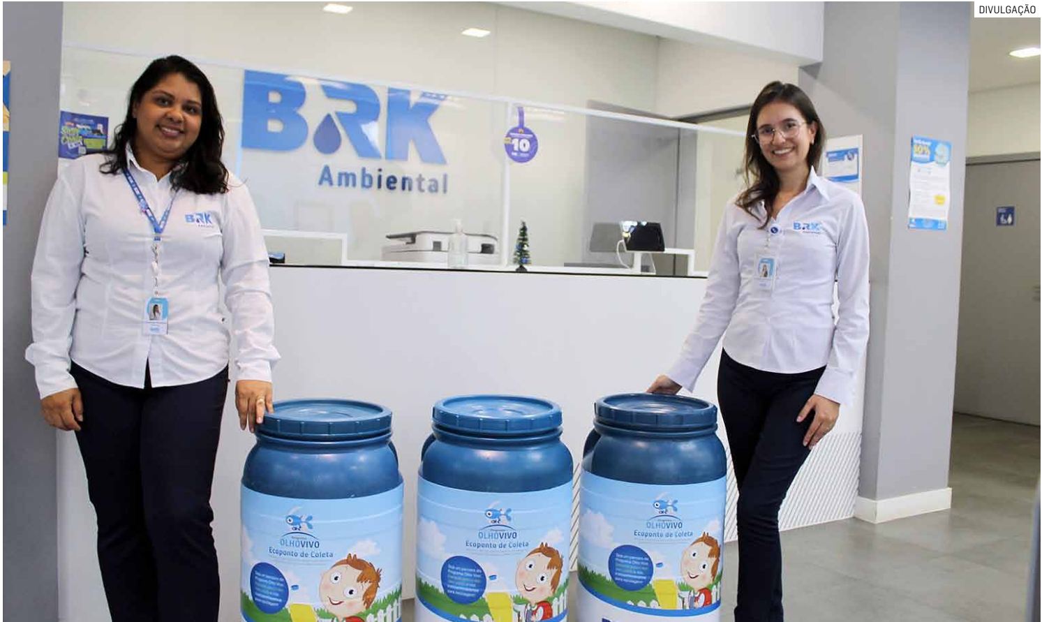
Com pontos de coleta gratuitos distribuídos em diversas regiões da cidade, ação requer participação da população

“É uma maneira de tornar o acesso aos pontos mais fácil e disseminar, por meio dos estudantes, a importância desse trabalho. As famílias podem armazenar o óleo usado em garrafas PET e pedir para o filho que estuda na escola que tem um ponto de coleta levar e descartar corre-