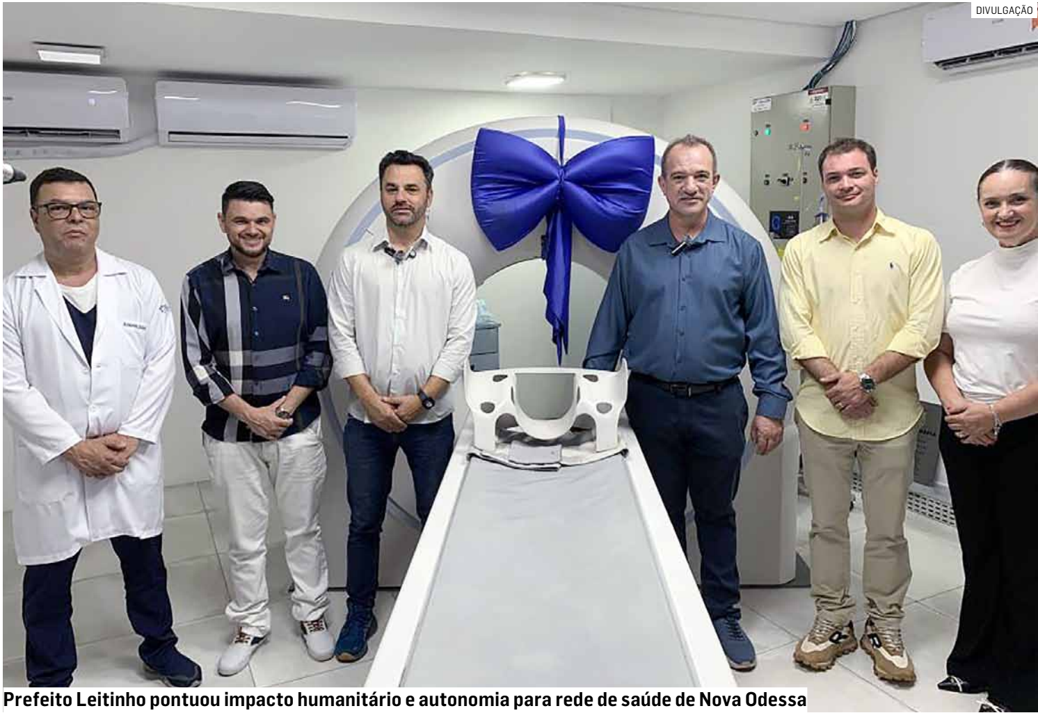
Prefeito Leitinho pontuou impacto humanitário e autonomia para rede de saúde de Nova Odessa

Equipamento elimina transferências para exames críticos e reduz tempo de diagnóstico em emergências; aparelho gera economia mensal aproximada de R$ 80 mil para a saúde e respostas imediatas em politraumas, AVCs e urgências neurológicas; médicos podem acompanhar procedimentos em tempo real