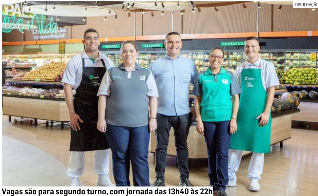
Vagas são para segundo turno, com jornada das 13h40 às 22h

As vagas são para o segundo turno, com jornada de segunda a sexta-feira, das 13h40 às 22h, além de trabalho aos domingos, em escala 2x1, das 10h20 às 18h, com folga aos sábados. A empresa oferece benefícios como convênio médico e odontológico,