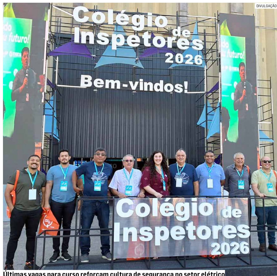
Últimas vagas para curso reforçam cultura de segurança no setor elétrico

Considerada uma das normas mais relevantes para a área, a NR-10 estabelece diretrizes essenciais para a segurança em instalações e serviços elétricos, com o objetivo de reduzir acidentes graves, como choques, queimaduras e ocorrências fatais, além de assegurar a conformidade das empresas com a legislação.