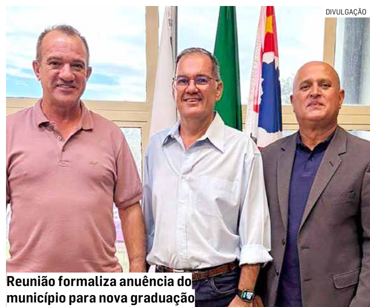
Reunião formaliza anuência do município para nova graduação