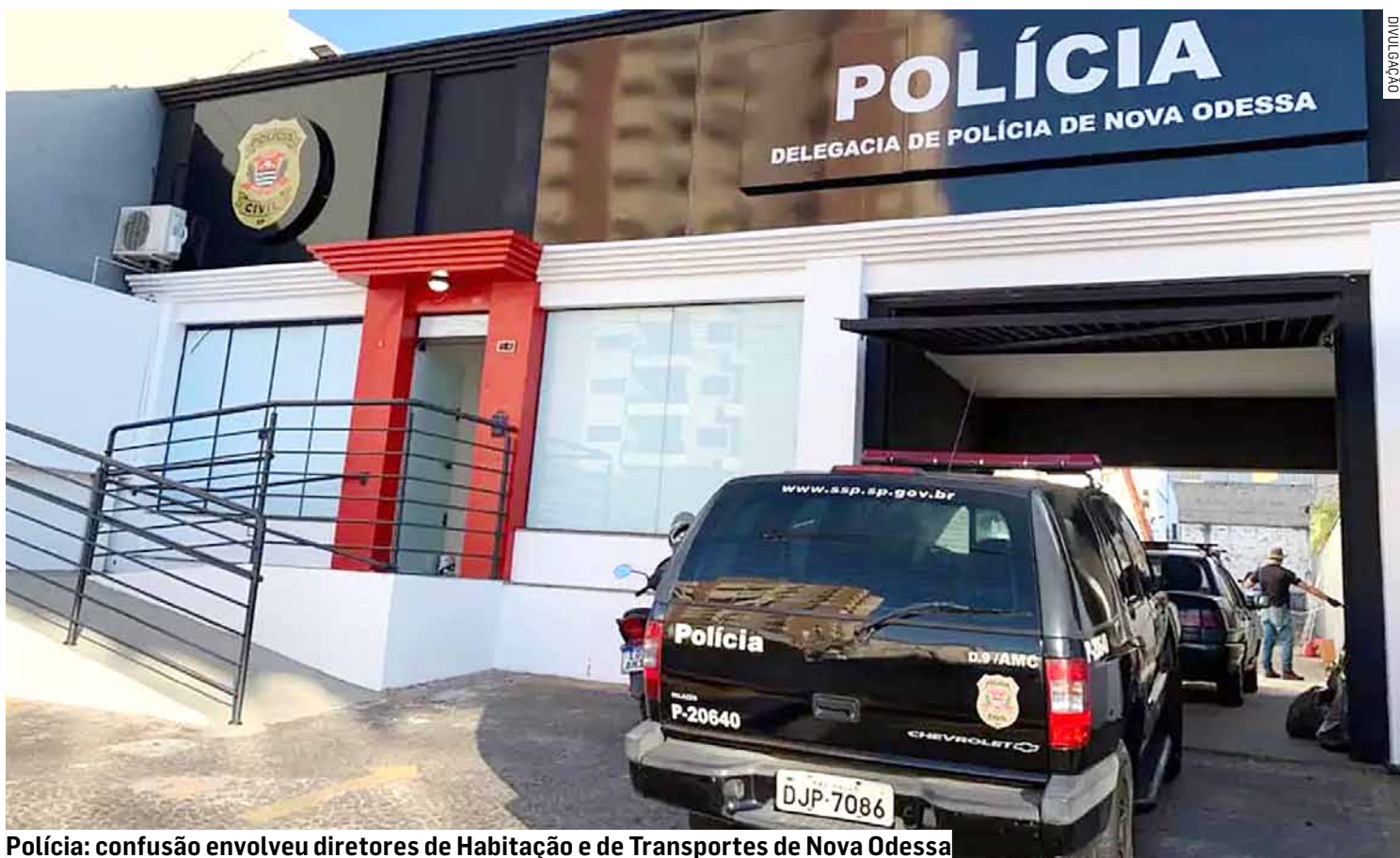
Polícia: confusão envolveu diretores de Habitação e de Transportes de Nova Odessa