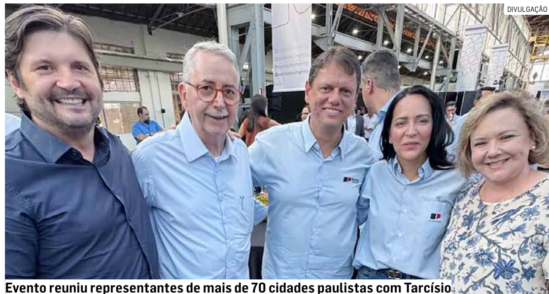
Evento reuniu representantes de mais de 70 cidades paulistas com Tarcísio

Para Lionela, a participação na Caravana 3D contribuiu para o aprimoramento dos trabalhos e ações sociais desenvolvidas no mu-