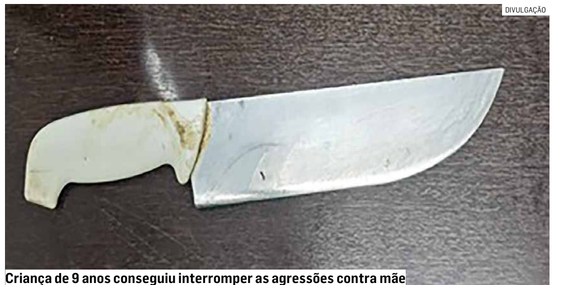
Criança de 9 anos conseguiu interromper as agressões contra mãe

Cézar Oliveira • SUMARÉ tribunaliberal@tribunaliberal.com.br