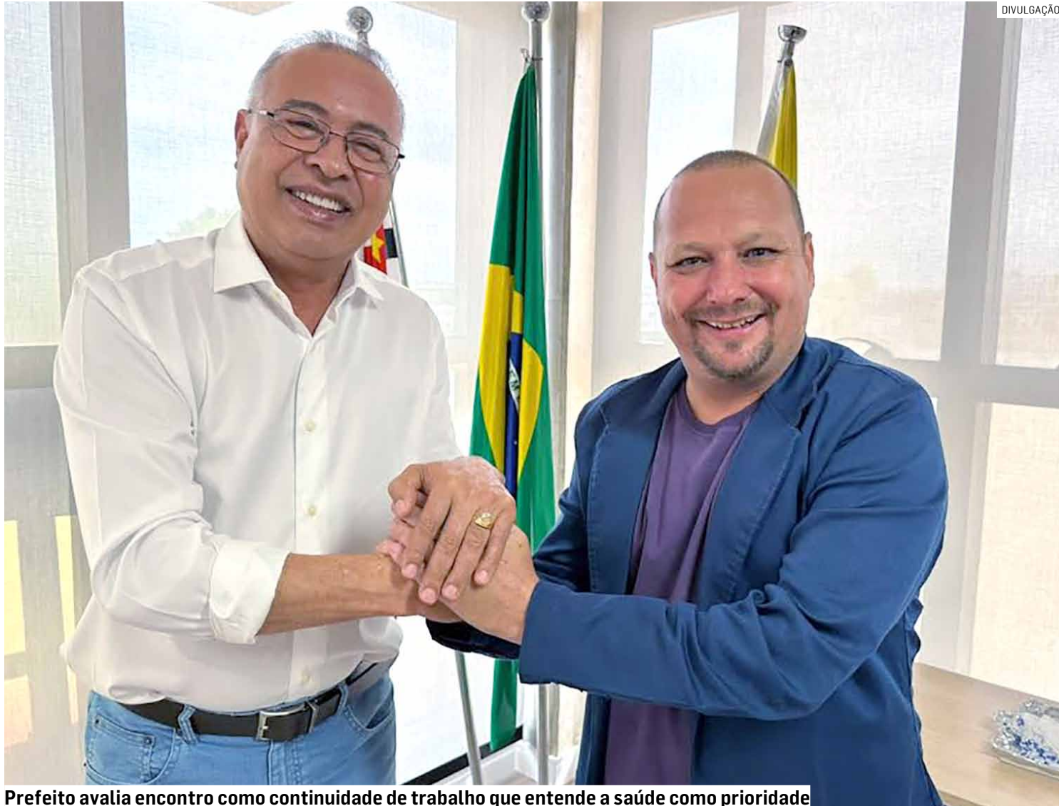
Prefeito avalia encontro como continuidade de trabalho que entende a saúde como prioridade

Durante a reunião, Tobé destacou o trabalho realizado pela atual gestão, evidenciando a transformação estrutural pela qual passa a saúde pública de Hortolândia. “É possível perceber o quanto a cidade evoluiu. A ampliação do Hospital e Maternidade Municipal Governador Mario Covas, com novos leitos de UTI, equipamentos moder-