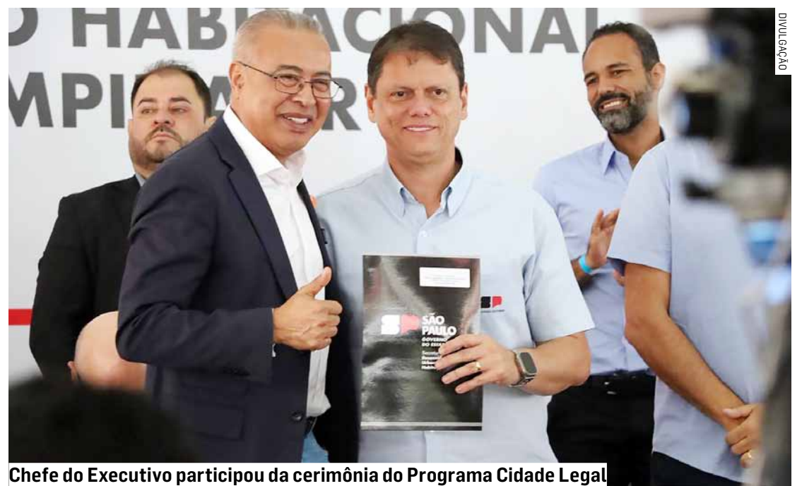
Chefe do Executivo participou da cerimônia do Programa Cidade Legal

Da Redação • HORTOLÂNDIA tribunaliberal@tribunaliberal.com.br