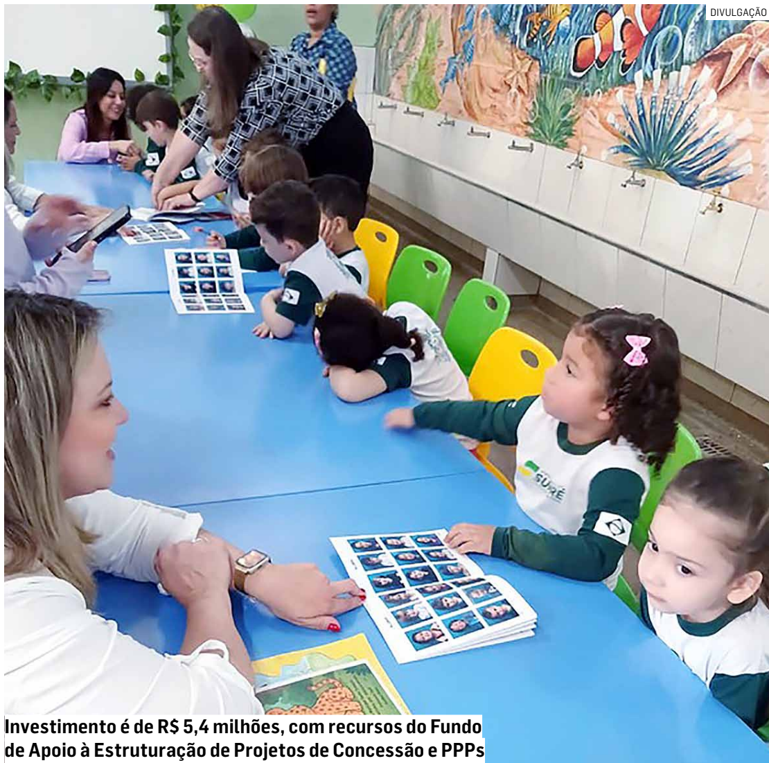
Investimento é de R$ 5,4 milhões, com recursos do Fundo de Apoio à Estruturação de Projetos de Concessão e PPPs

Acordo estabelecido pela administração pública tem como objetivo desenvolver estudos técnicos, jurídicos e econômicos que viabilizem futura parceria com iniciativa privada para melhorar serviços da educação infantil local