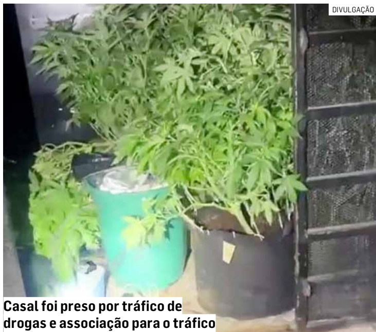
Casal foi preso por tráfico de drogas e associação para o tráfico

Cézar Oliveira • MONTE MOR tribunaliberal@tribunaliberal.com.br