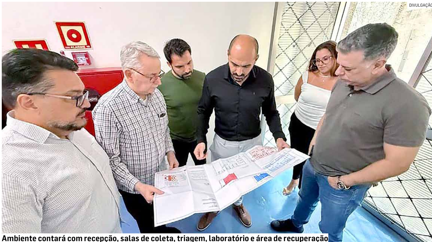
Ambiente contará com recepção, salas de coleta, triagem, laboratório e área de recuperação