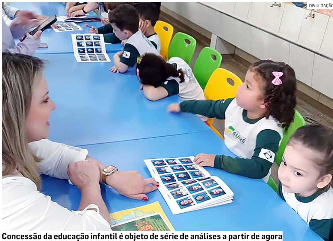
Concessão da educação infantil é objeto de série de análises a partir de agora

Uma discussão entre dois diretores da Prefeitura de Nova Odessa por vagas de estacionamento terminou em agressões físicas e ameaças na manhã desta sexta-feira (10), em um pátio de transporte na região central da cidade. PÁGINA 05