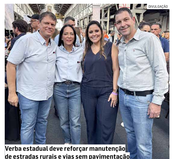
Verba estadual deve reforçar manutenção de estradas rurais e vias sem pavimentação

■ Docentes da unidade do Sesi em Americana entram em estado de greve após impasse nas negociações salariais com a instituição. A categoria não aceitou a proposta de reajuste de 3,86% e defende um aumento maior, além de avanços no plano de carreira. Entre as principais reclamações estão a sobrecarga de trabalho e a falta de melhores condições para o exercício da profissão. Os professores também pedem reforço no quadro de funcionários.