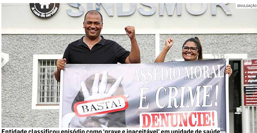
Entidade classificou episódio como 'grave e inaceitável' em unidade de saúde

No documento, o sindicato pede a implantação de medidas de segurança em todas as unidades de saúde do município.