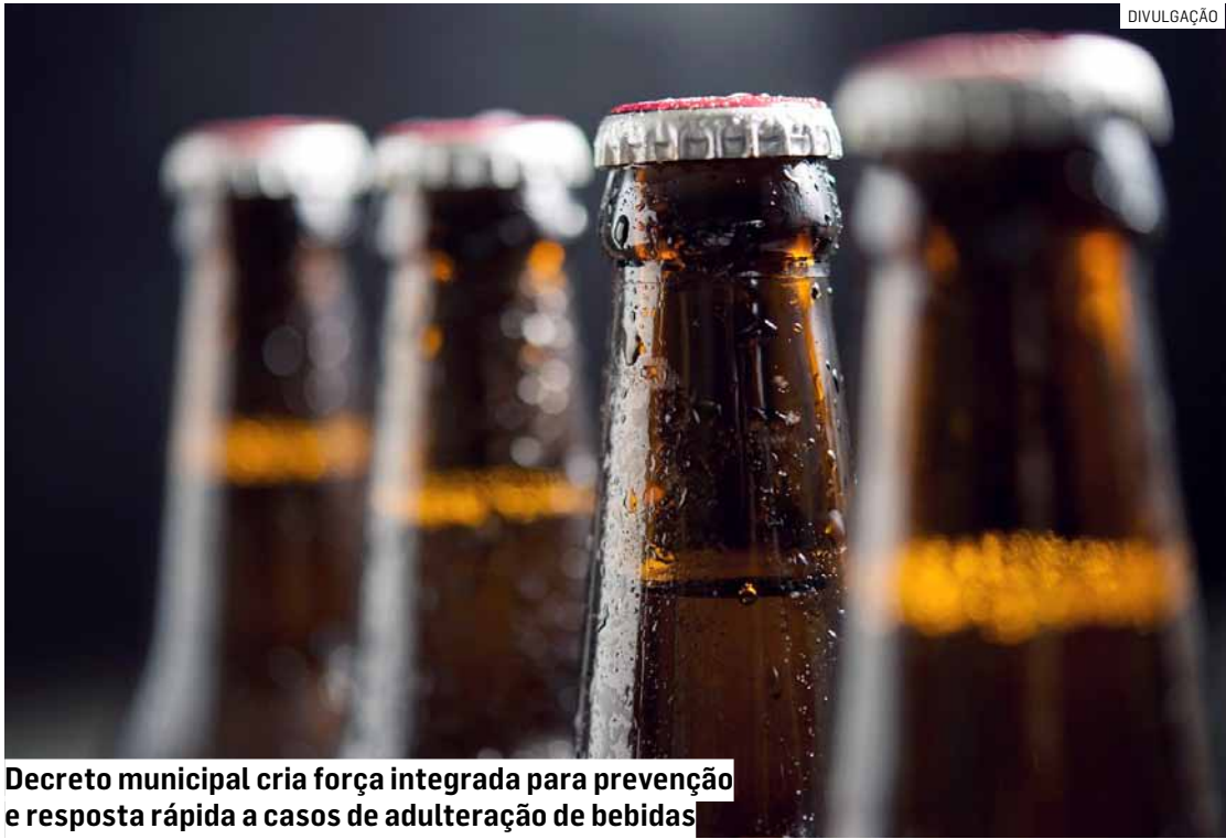
Decreto municipal cria força integrada para prevenção e resposta rápida a casos de adulteração de bebidas

O comitê reúne Chefia de Gabinete, Secretaria Municipal de Controle Interno e Transparência (com o PROCON Municipal), Secretaria de Saúde — por meio da Rede de Urgência e Emergência, Vigilância Sanitária e Vigilância Epidemiológica —, além do Departamento de Comunicação Social. De acordo com o decreto, Polícia Civil, Polícia Militar, Anvisa, CIATox e Procons estadual e federal podem ser convidados a integrar operações específicas, quando necessário.