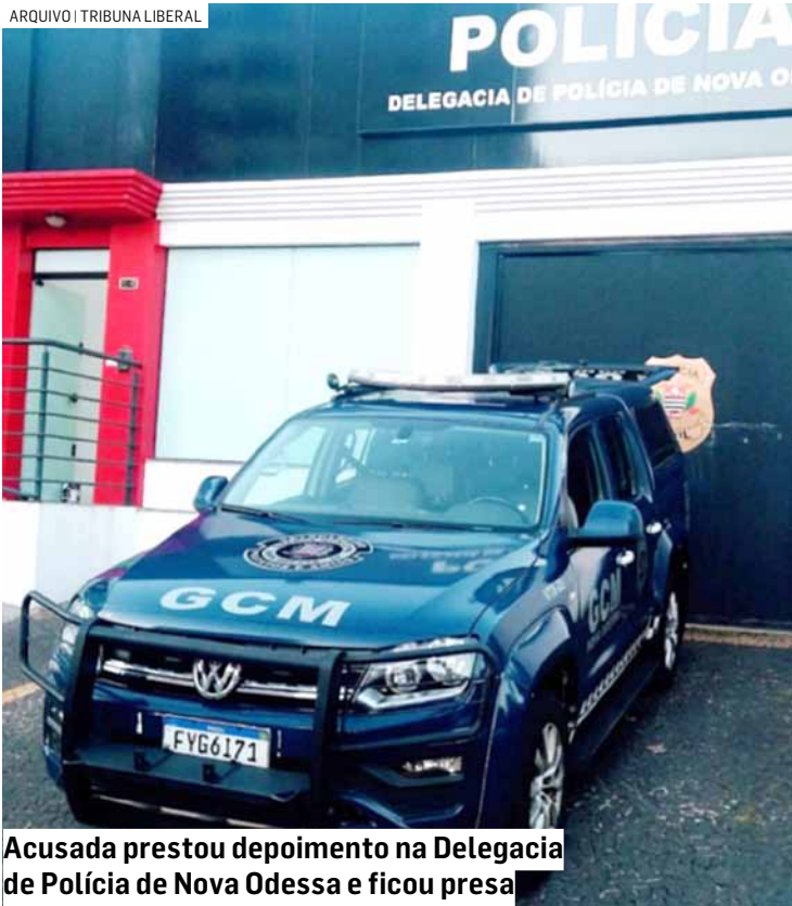
Acusada prestou depoimento na Delegacia de Polícia de Nova Odessa e ficou presa