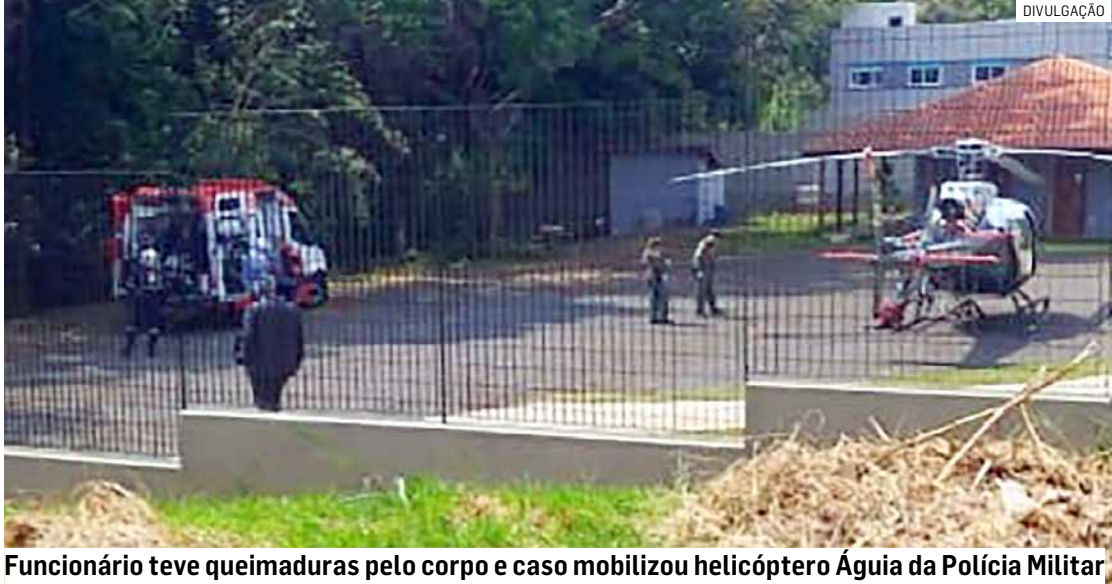
Funcionário teve queimaduras pelo corpo e caso mobilizou helicóptero Águia da Polícia Militar

O Serviço de Atendimento Móvel de Urgência (Samu) prestou os primeiros socorros à vítima ainda na igreja,