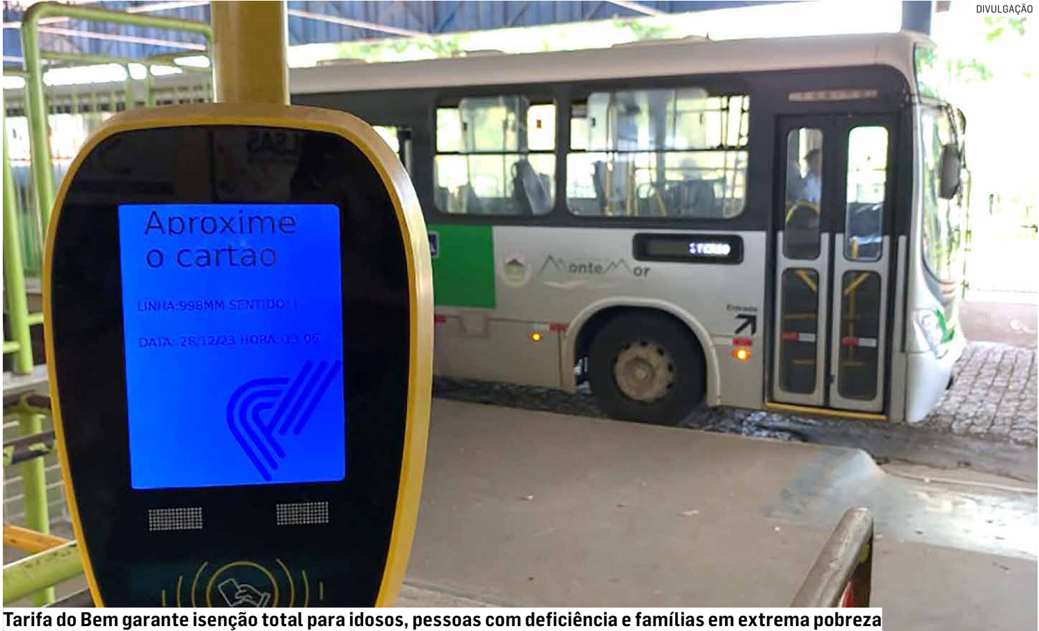
Tarifa do Bem garante isenção total para idosos, pessoas com deficiência e famílias em extrema pobreza

Segundo o texto do projeto, o direito à Tarifa do Bem e à Tarifa Social será definido conforme a situação de renda do usuário registrada no CadÚnico. A Tarifa do Bem consiste na isenção total do pagamento da