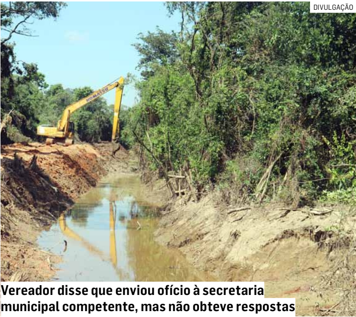
Vereador disse que enviou ofício à secretaria municipal competente, mas não obteve respostas

“O cerne desta proposição reside na implementação de um sistema de tarifas sociais que atenda de forma direcionada aos cidadãos de Monte Mor em situação de maior vulnerabilidade. A utilização do Cadastro Único (CadÚnico) como critério de elegibilidade garante que os benefícios cheguem a quem realmente necessita, assegurando a transparência e a eficiência na gestão dos recursos públicos”, finalizou.