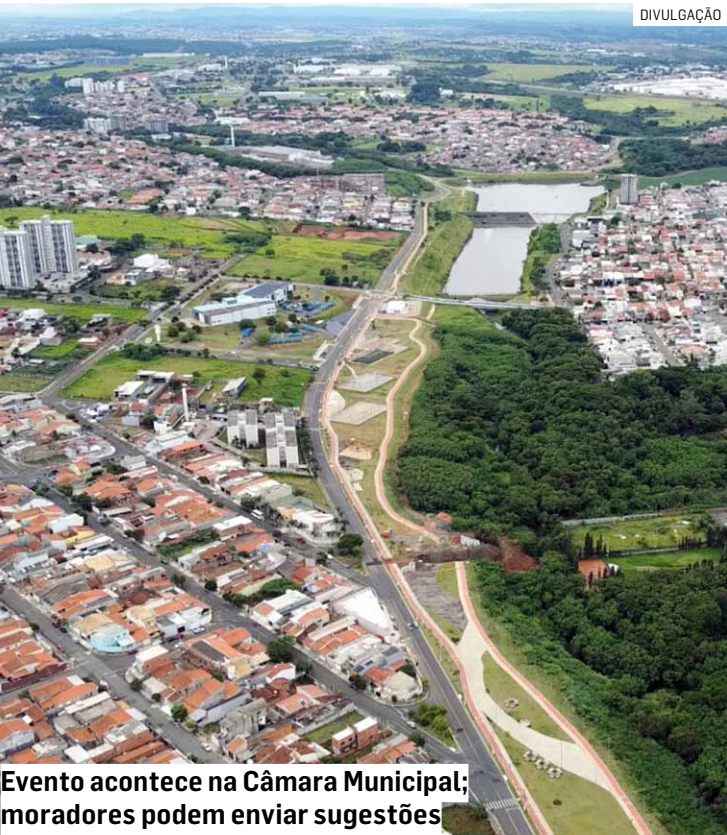
Evento acontece na Câmara Municipal; moradores podem enviar sugestões

Para aderir ao Refis 2025 e optar por uma destas modalidades de pagamento, é preciso agendar atendimento presencial, que será feito na Praça de Atendimento do Paço Municipal, localizada na Rua Professora Celina Franceschini Bueno, 100, no Jardim Metropolitano. O agendamento poderá ser feito de modo remoto, pela internet, por meio do Portal Hortolândia Fácil. Isso evitará filas e agilizará o atendimento.