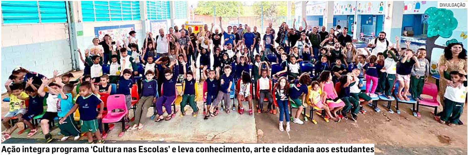
Ação integra programa 'Cultura nas Escolas' e leva conhecimento, arte e cidadania aos estudantes

Outubro, mês dedicado às crianças, começou de forma especial na EMEF Maria Aparecida de Jesus Segura, em Sumaré. A Secretaria Municipal de Cultura e Turismo se empenhou em levar conhecimento, arte e cidadania diretamente para os estudantes com o Concerto Didático da Banda Sinfônica Municipal Dorival Gomes Barroca. A iniciativa, que integra o programa “Cultura nas Escolas”, realizou uma apresentação vibrante para os alunos da escola que fica no bairro Assentamento, transformando a unidade em um palco de aprendizado e alegria.