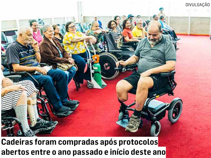
Cadeiras foram compradas após protocolos abertos entre o ano passado e início deste ano