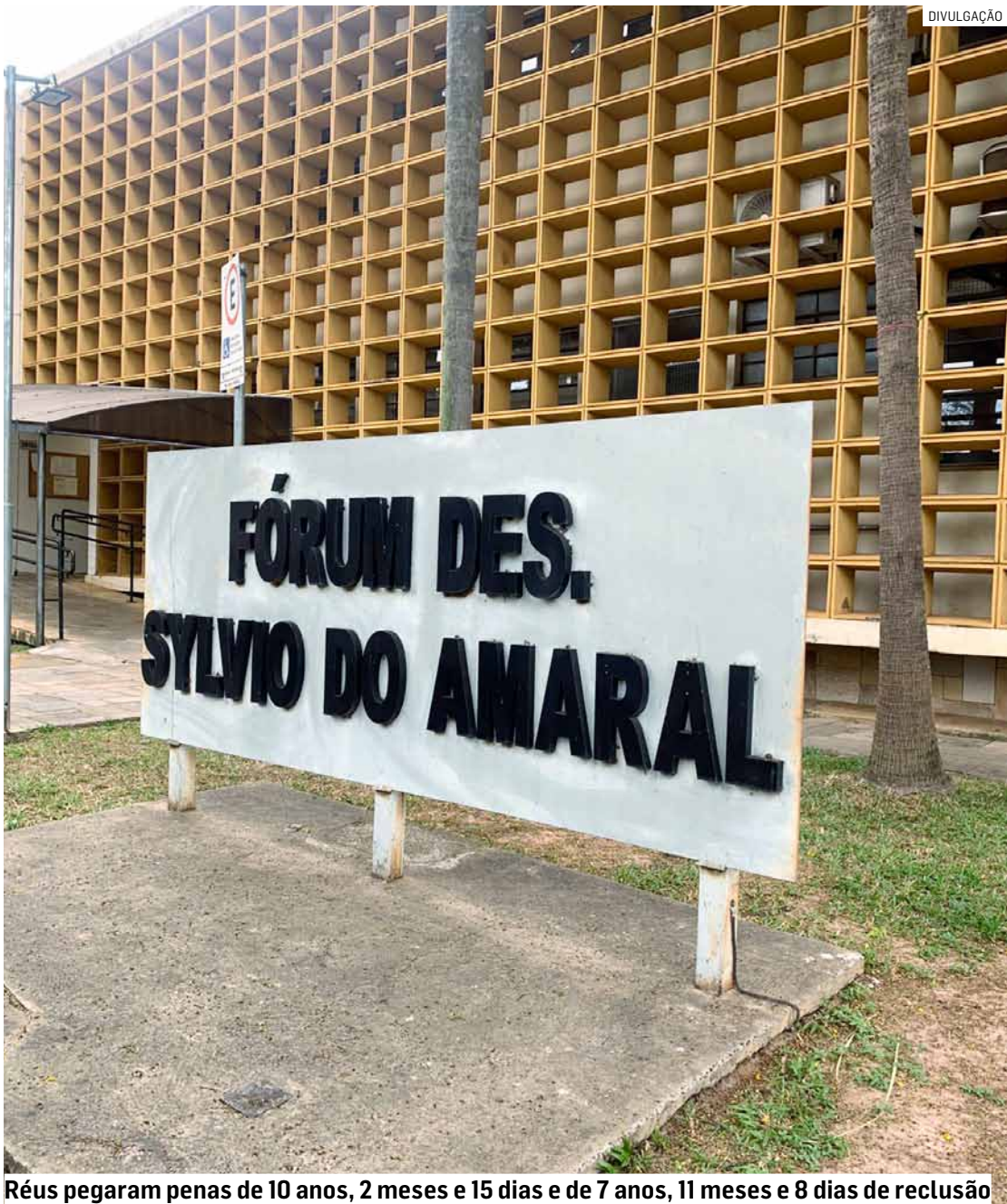
Réus pegaram penas de 10 anos, 2 meses e 15 dias e de 7 anos, 11 meses e 8 dias de reclusão

Dupla atuava com menor que fazia a função de ‘olheiro’ e na ocorrência foram apreendidas maconha, skunk, cocaína, crack e ‘dry’; defesas alegaram flagrante ilegal, agressões e falta de câmeras; magistrado considerou provas ‘robustas’