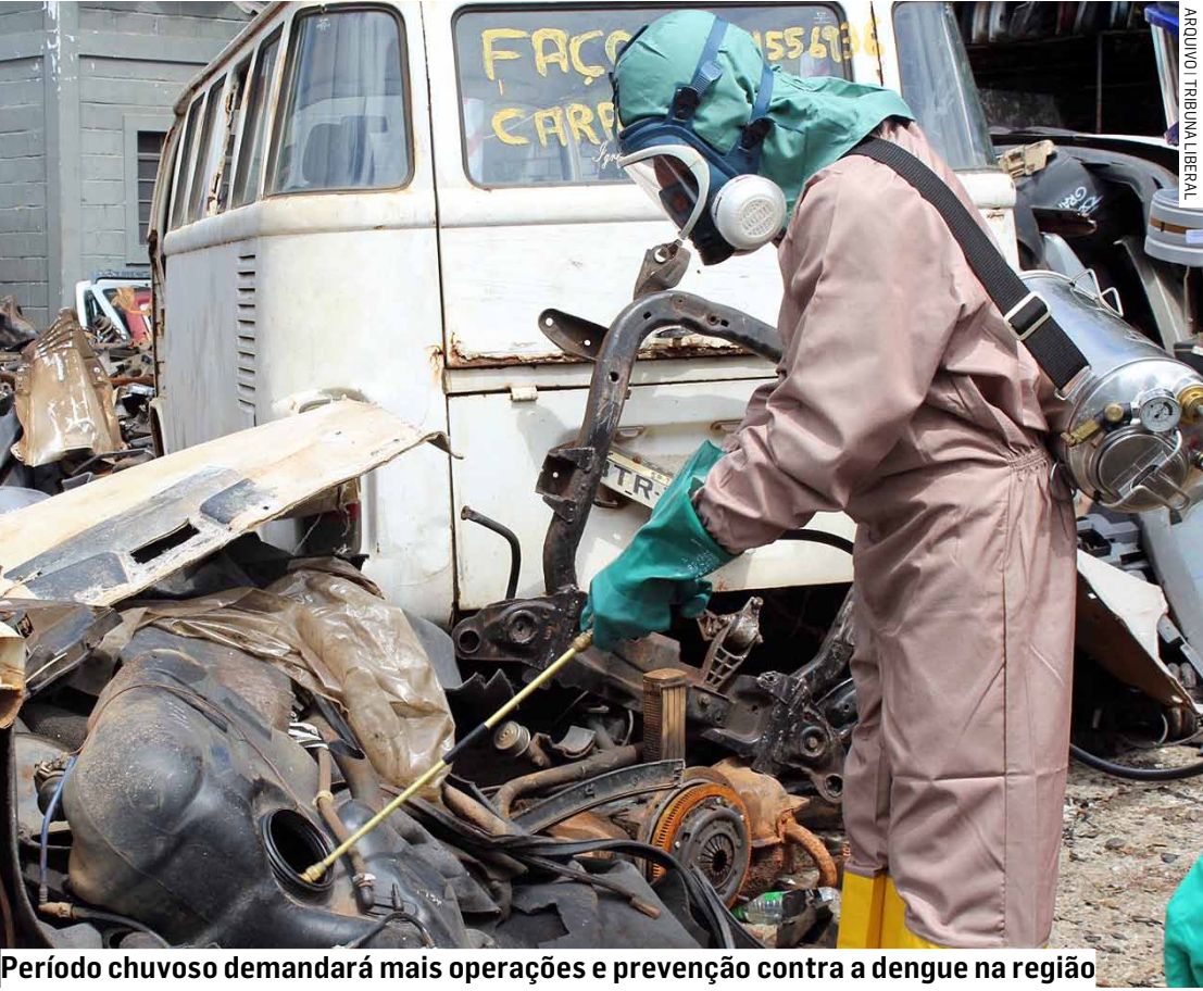
Período chuvoso demandará mais operações e prevenção contra a dengue na região

A epidemia de dengue segue em alta na região, que já soma 59 mortes e 27.252 casos confirmados neste ano. Americana é o município com mais registros, seguida por Sumaré e Hortolândia. O aumento de casos coincide com a volta das chuvas, que favorecem os criadouros do Aedes aegypti. Diante do cenário, prefeituras intensificam as ações de combate e monitoramento, como a nova Análise de Densidade Larvária iniciada em Hortolândia. PÁGINA 04