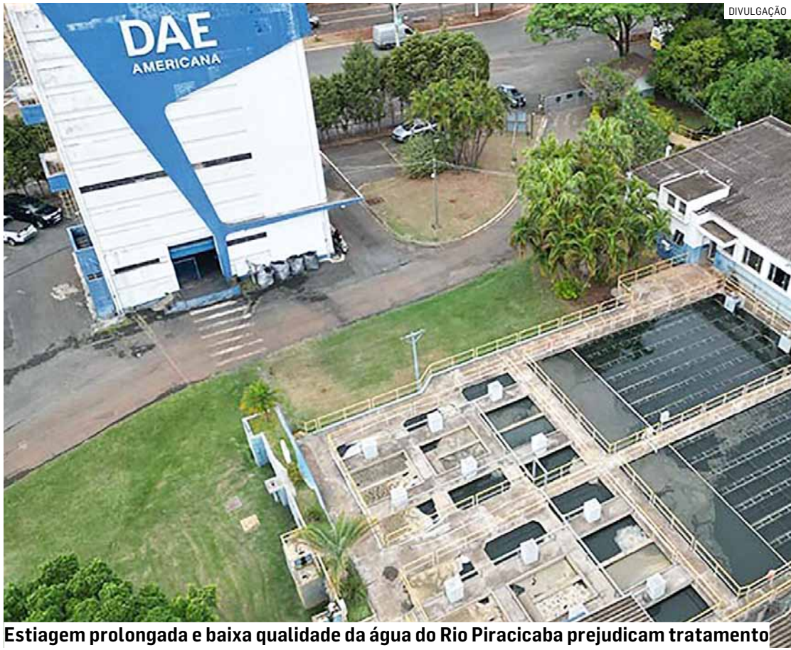
Estiagem prolongada e baixa qualidade da água do Rio Piracicaba prejudicam tratamento

gência hídrica, medida que permite a adoção de ações emergenciais como reforço no combate a vazamentos, contratação de caminhões-pipa para atendimento em áreas específicas e intensificação das campanhas de conscientização sobre o uso racional da água. A autarquia pede a colaboração da população para que adote práticas de economia e conservação da água, utilizando o recurso de maneira consciente até que a situação se normalize com a retomada das chuvas.