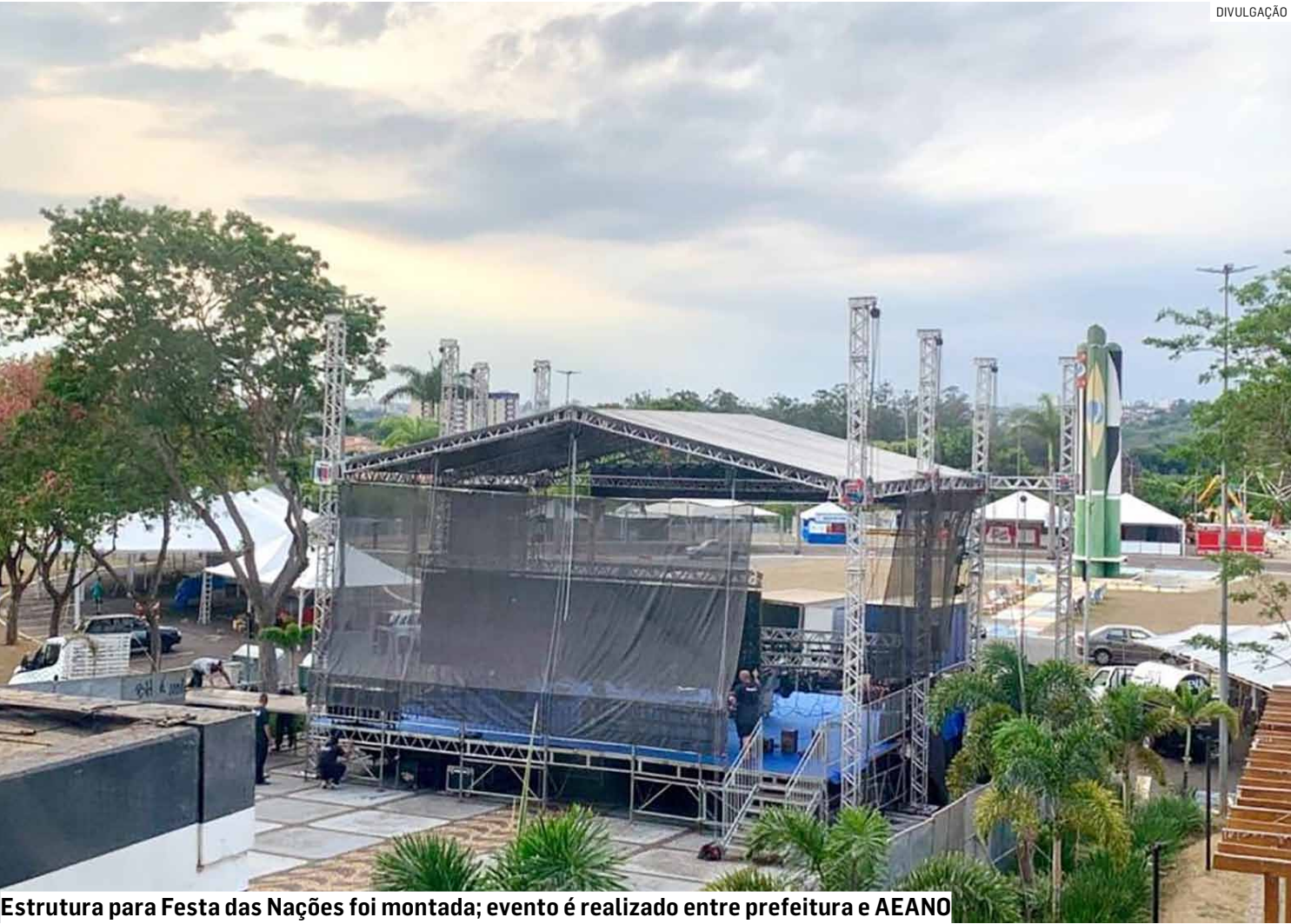
Estrutura para Festa das Nações foi montada; evento é realizado entre prefeitura e AEANO

Integrando a Re-Virada Cultural, evento reúne apresentações musicais, culinária internacional e atrações para todas as idades, em frente ao Paço Municipal; abertura oficial ocorre às 19h com a Banda Sinfônica, seguida de vários shows