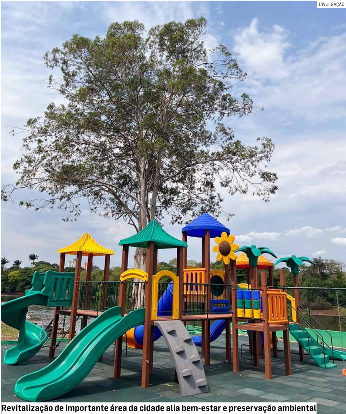
Revitalização de importante área da cidade alia bem-estar e preservação ambiental

Investimento de mais de R$ 1,3 milhão vai garantir áreas de convivência, playground, ciclovia e novas estruturas para visitantes; obras estão em fase final, com a maioria das novidades concluídas, segundo a concessionária