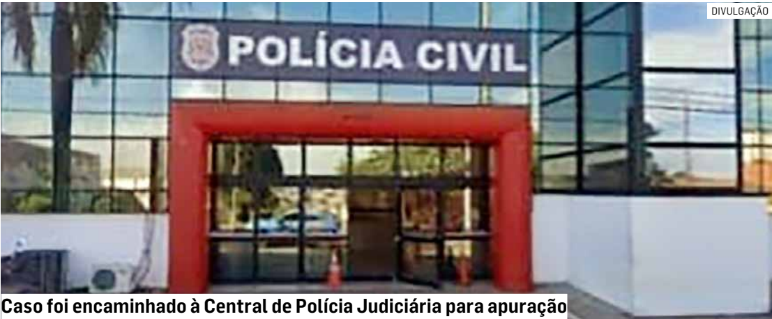
Caso foi encaminhado à Central de Polícia Judiciária para apuração