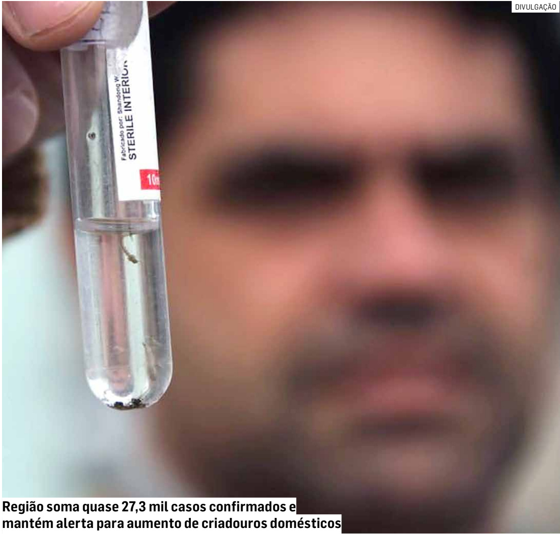
Região soma quase 27,3 mil casos confirmados e mantém alerta para aumento de criadouros domésticos

Nos casos confirmados, Americana também apresenta o maior volume de infecções, com 8.963 casos, seguida por Hortolândia