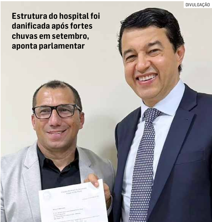
Estrutura do hospital foi danificada após fortes chuvas em setembro, aponta parlamentar

Durante o encontro, o parlamentar relatou sobre a estrutura do hospital, que foi danificada após fortes chuvas ocorridas no mês de setembro, comprometendo o funcionamento de diversos serviços essenciais. Pastor Miguel solici-