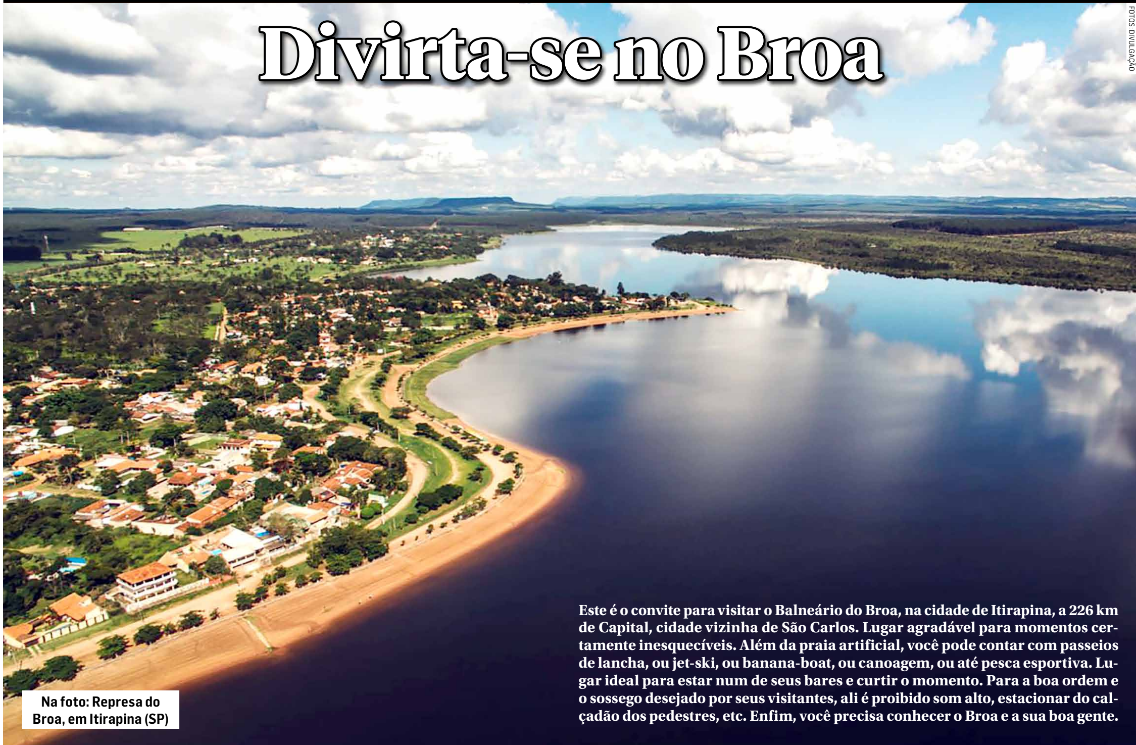
Na foto: Represa do Broa, em Itirapina (SP)

Este é o convite para visitar o Balneário do Broa, na cidade de Itirapina, a 226 km de Capital, cidade vizinha de São Carlos. Lugar agradável para momentos certamente inesquecíveis. Além da praia artificial, você pode contar com passeios de lancha, ou jet-ski, ou banana-boat, ou canoagem, ou até pesca esportiva. Lugar ideal para estar num de seus bares e curtir o momento. Para a boa ordem e o sossego desejado por seus visitantes, ali é proibido som alto, estacionar do calçadão dos pedestres, etc. Enfim, você precisa conhecer o Broa e a sua boa gente.