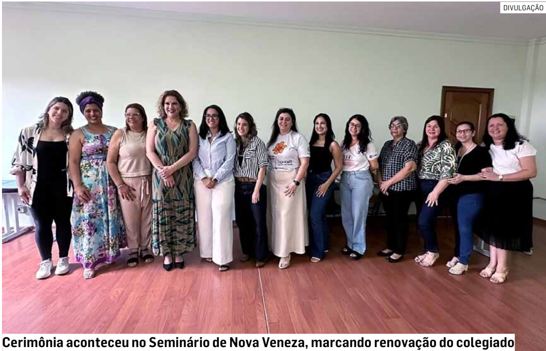
Cerimônia aconteceu no Seminário de Nova Veneza, marcando renovação do colegiado

Da Redação • SUMARÉ tribunaliberal@tribunaliberal.com.br