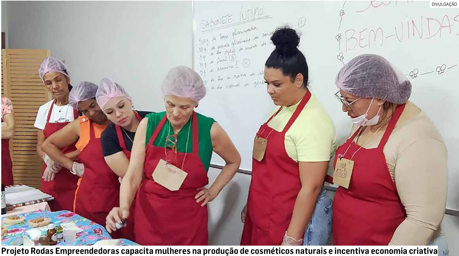
Projeto Rodas Empreendedoras capacita mulheres na produção de cosméticos naturais e incentiva economia criativa

OFICINA DE GRAFITE O muro cinza da Esco-