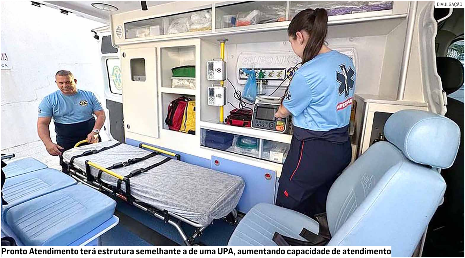
Pronto Atendimento terá estrutura semelhante a de uma UPA, aumentando capacidade de atendimento

O Pronto Atendimento (PA) do bairro Antônio Zanaga, em Americana, recebe a partir deste mês uma série de melhorias para ampliar e agilizar o atendimento à população da região. A unidade passou a ser administrada por gestão compartilhada entre a Prefeitura de Americana, por meio da Secretaria de Saúde, e o Instituto Nacional de Desenvolvimento Social e Humano (INDSH). As novidades incluem atendimento pediátrico 24 horas por dia, disponibilização de ambulância com UTI, mais rapidez em resultados de exames, investimentos em tecnologia, aquisição de novos aparelhos e obras estruturais, a fim de ampliar a capacidade de atendimento da unidade.