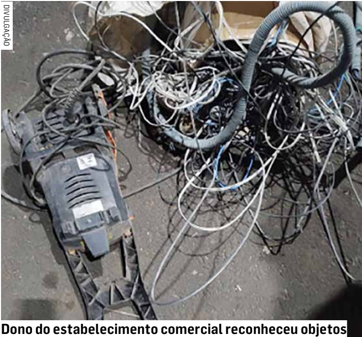
Dono do estabelecimento comercial reconheceu objetos

Com as informações repassadas pelo Centro de Operações da Polícia Militar e pelo vigilante, as equipes policiais iniciaram patrulhamento e localizaram o indivíduo no bairro Rosa e Silva, em Sumaré. Durante a abordagem, ele carregava um saco de nylon contendo diversos ob-