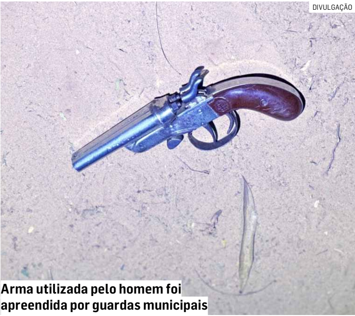
Arma utilizada pelo homem foi apreendida por guardas municipais