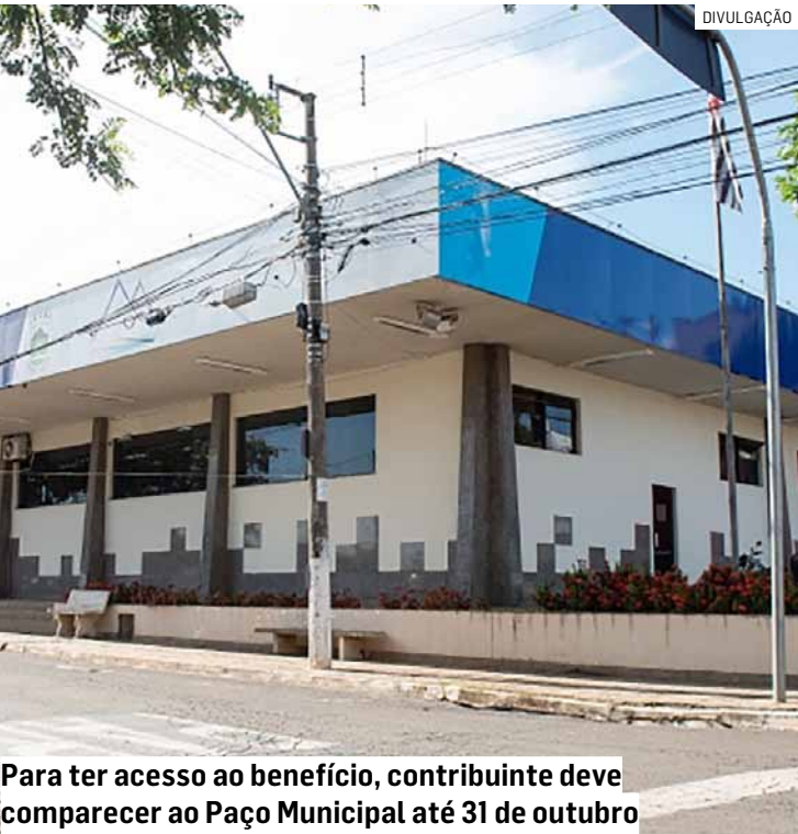
Para ter acesso ao benefício, contribuinte deve comparecer ao Paço Municipal até 31 de outubro