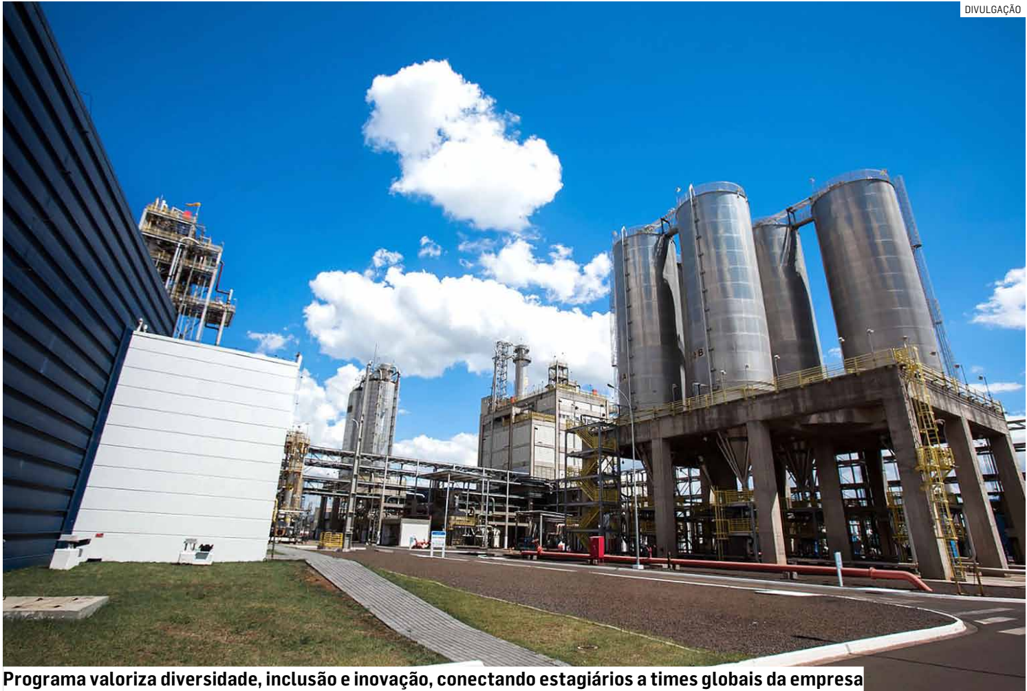
Programa valoriza diversidade, inclusão e inovação, conectando estagiários a times globais da empresa

A Braskem é uma das maiores produtoras de resinas termoplásticas das Américas e líder mundial na produção de biopolíme-