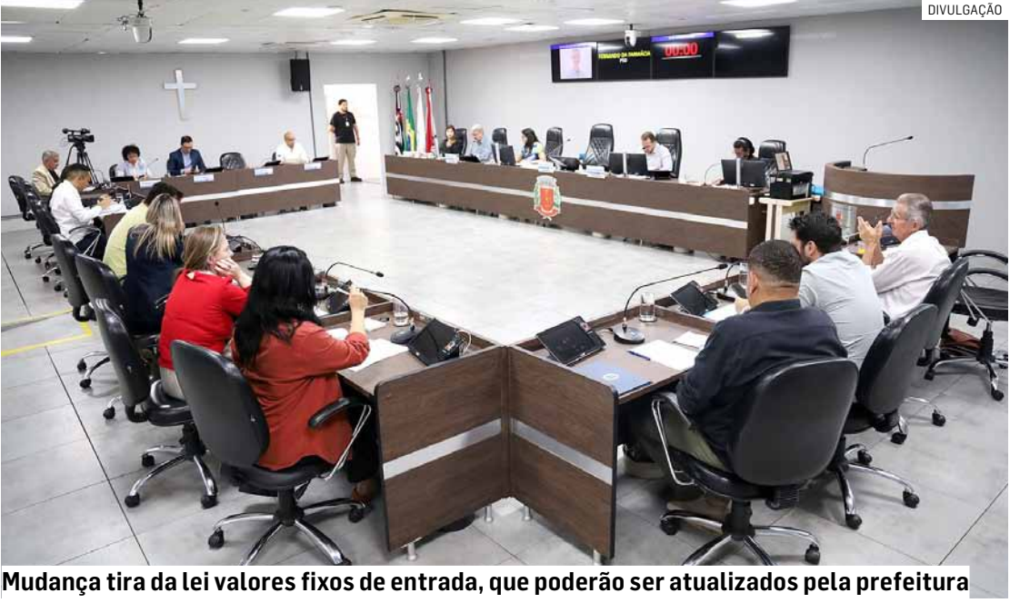
Mudança tira da lei valores fixos de entrada, que poderão ser atualizados pela prefeitura