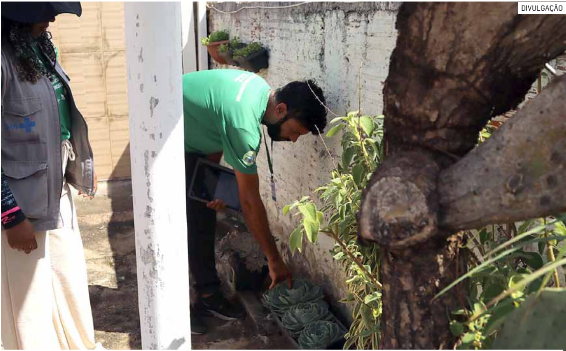
Agentes estão identificados com crachás e uniformes e prefeitura divulga bairros visitados

Em paralelo à busca ativa, a prefeitura relembra que o Jardim São Sebastião participa do projeto federal de armadilhas contra o Aedes aegypti, que têm se mostrado eficientes na redução do número de mosquitos na região. No mês passado, a UVZ fez mais uma vistoria às armadilhas em residências.