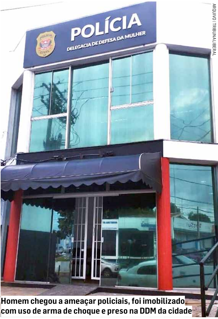
Homem chegou a ameaçar policiais, foi imobilizado com uso de arma de choque e preso na DDM da cidade

choque, conseguindo imobilizar e algemar o suspeito. Ele foi encaminhado à UPA (Unidade de Pronto Atendimento) do bairro Matão, onde passou por avaliação médica e, em seguida, liberado. O caso foi registrado na Delegacia de Defesa da Mulher (DDM) de Sumaré, onde o agressor permaneceu à disposição da Justiça.