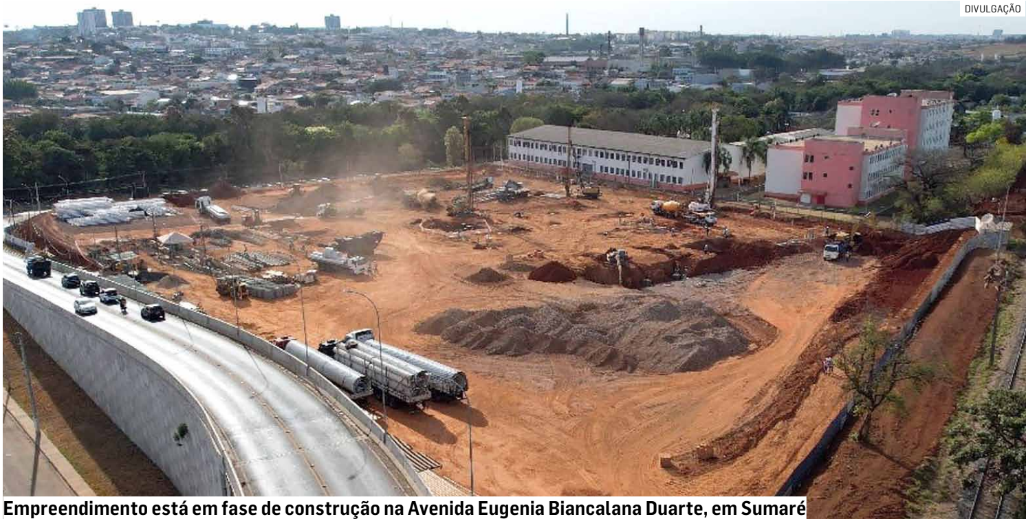
Empreendimento está em fase de construção na Avenida Eugenia Biancalana Duarte, em Sumaré

Chefe do Executivo anunciou valor do aporte do grupo atacadista na nova unidade em construção no Jardim Primavera; são 600 empregos e PAT local vai intermediar contratações; inauguração é prevista até dezembro