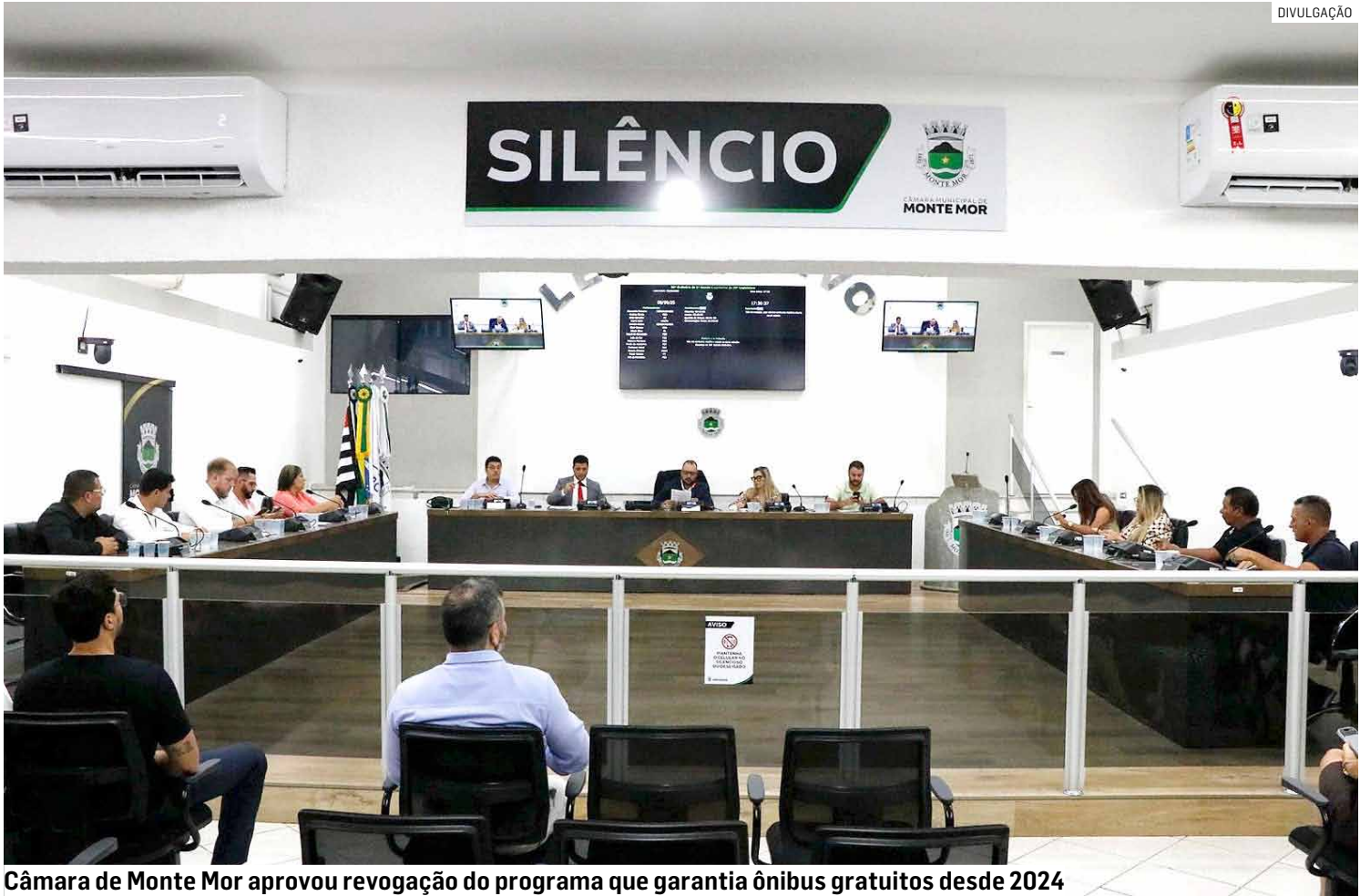
Câmara de Monte Mor aprovou revogação do programa que garantia ônibus gratuitos desde 2024

“É muito triste ver uma Câmara vendida, um puxadinho da prefeitura. O Tarifa Zero quem vai perder é a população. Não esqueçam o nome desses vereadores que estão votan-